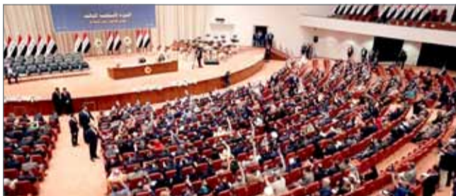
• برلمان العراق يطلب من الحكومة وضع جدول زمني لانسحاب القوات الأجنبية

صوّت البرلمان العراقي بأغلبية الأصوات، أمس الأربعاء، على إلزام مفوضية الانتخابات بإعادة العد والفرز اليدوي لنتائج الانتخابات في عموم البلاد.