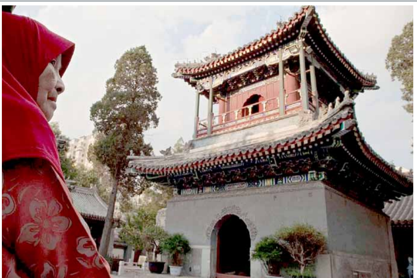
عجوز صينية في طريقها إلى المسجد لأداء الصلاة، حيث يبلغ عدد المسلمين في الصين وفق إحصاءات غير رسمية نحو 100 مليون نسمة

أظهر تسجيل مصور مطاردة رجال الشرطة رجلا سرق حاملة جنود مدرعة وسار بها في شوارع مدينة ريتشموند بولاية فيرجينيا في الولايات المتحدة أمس الأول. وذكرت وسائل إعلام أميركية أن الرجل، الذي قاد المدرعة استسلم للشرطة بعد مطاردة أثار دهشة الكثيرين عبر مواقع التواصل الاجتماعي في البلاد. وأوضح السلطات أن الرجل تمكن من سرعة المدرعة من قاعدة "فورث بيكيت" العسكرية في مقاطعة نوتواي بولاية فيرجينيا، ولم تعرف بالتحديد دوافعه من وراء ذلك. وأظهرت تسجيلات مصورة لقطات لعملية المطاردة السيارة في شارع "برود ستريت" في الولاية.