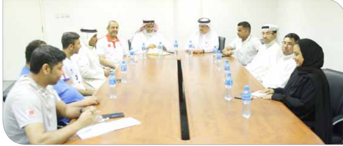
جانب من الاجتماع مع ذوي العزيمة

وكانت قرعة دوري خالد بن حمد لذوي العزيمة أسفرت عن التالي: المجموعة الأولى الأولمبياد الخاص، الصداقة للمكفوفين، لجنة الصم، تحدي الإعاقة، المجموعة الثانية الإعاقة الحركية، المحفزين، الشلل الدماغي، الصم.