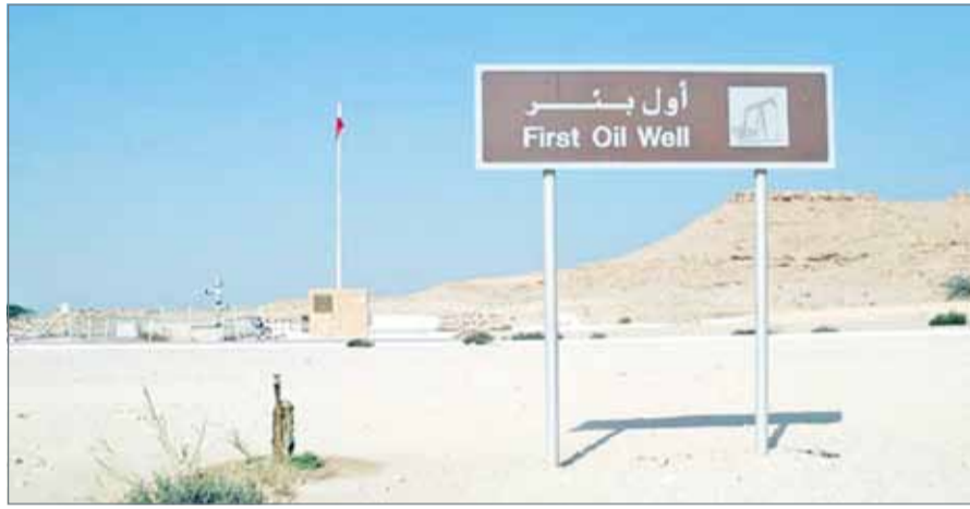
• أول بئر نفط في البحرين (أرشيفية)

ويقع الاكتشاف النفطي الجديد الذي أعلن عنه قبل شهرين، في منطقة خليج البحرين الواقعة بالمنطقة الغربية من حدود المملكة، بمساحة تقدر بـ 2000 كيلومتر مربع. وكانت الهيئة قد وقّعت مذكرة تفاهم مع شركة هيلبير ترورن الأميركية للتحضير لعمليات حفر آبار إنتاجية في الحقل الجديد. ومع ارتفاع أسعار النفط التي لامست الـ 70 دولاراً للبرميل أصبح إنتاج الصخر الزيتي مشجعاً رغم ارتفاع كلفته.