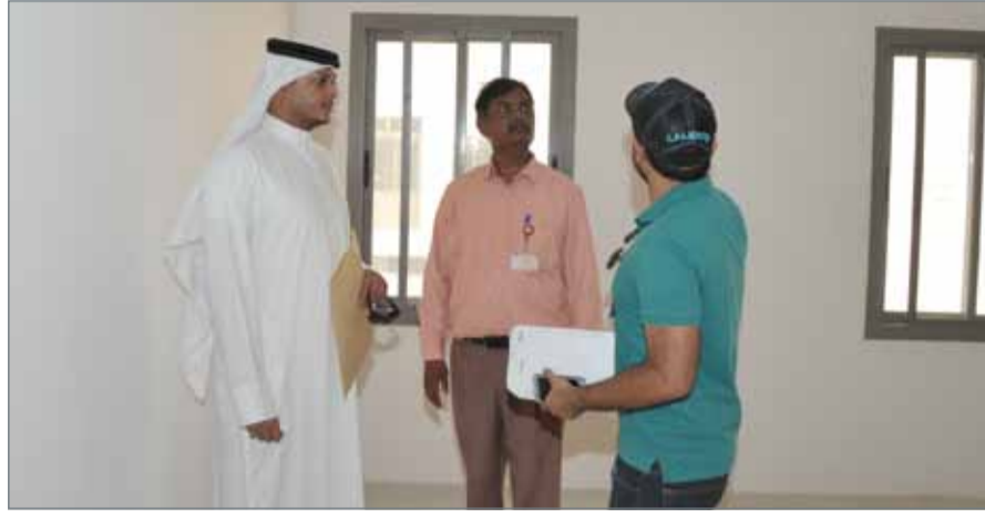
• جانب من تسليم الوحدات للمستفيدين

المشاريع التي شملها أمر صاحب السمو الملكي ولي العهد نائب القائد الأعلى النائب الأول لرئيس مجلس الوزراء، بترجم الرعاية الكبيرة التي يوليها صاحب الجلالة الملك للخدمات الإسكانية وحرص جلالتة على سرعة وصول الخدمات الإسكانية لمستحقيها، مشيراً إلى أن توجيهات صاحب السمو الملكي رئيس الوزراء، كان لها بالغ الأثر في تحقيق المكتسبات الإسكانية التي تشهدها المملكة حالياً، سواء على صعيد نمو وتوسع وتيرة تنفيذ المشاريع في المجمعات والمدن الإسكانية، أو سرعة توزيع الوحدات على المستفيدين.