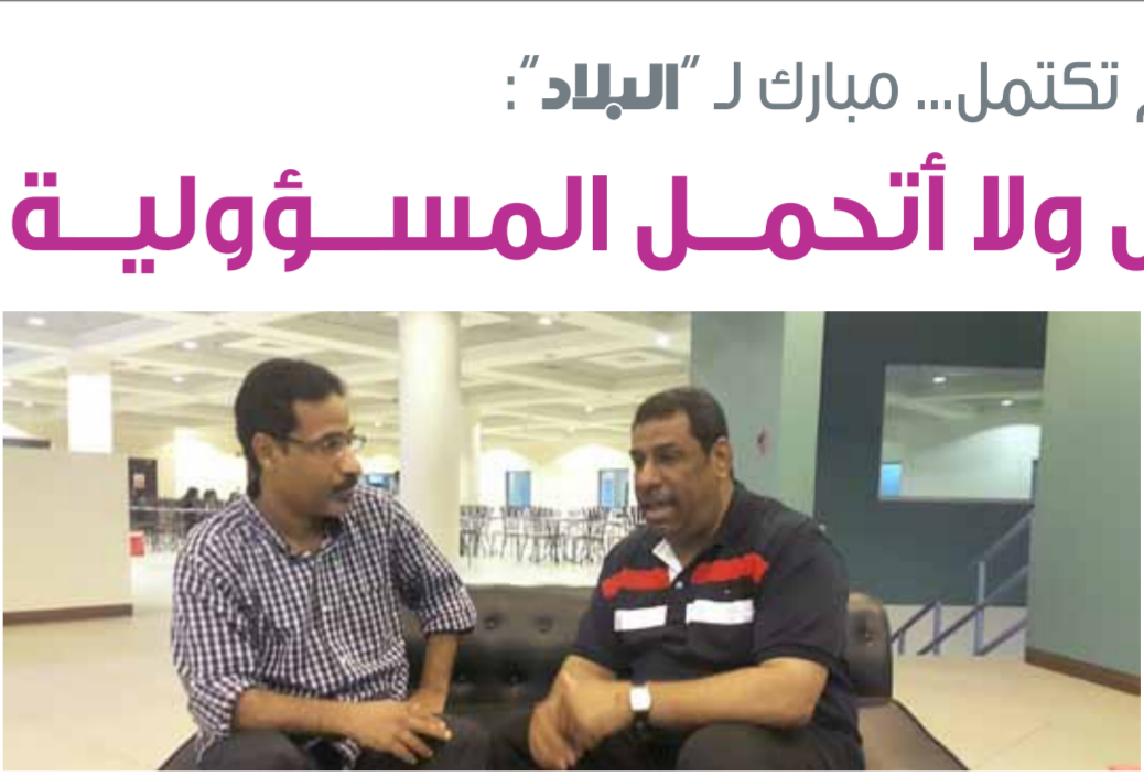
• مسافات البلاد تتأخر مبارك