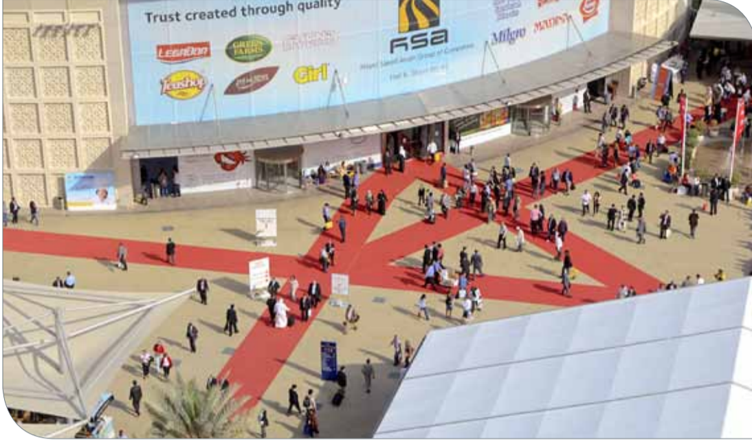
بطولة هذا العام تشهد مشاركة ٤ فرق عربية للمرة الأولى

سيكون عشاق كرة القدم في دبي على موعد مع المهرجان الرياضي الأبرز في العالم ومشاهدة مباريات البطولة عبر الشاشات العملاقة، وتشجيع فرقهم في أجواء حماسية غير مسبوقه ستشاهدها مناطق المشجعين والخيمات الخاصة بكأس العالم في جميع أنحاء مدينة دبي.