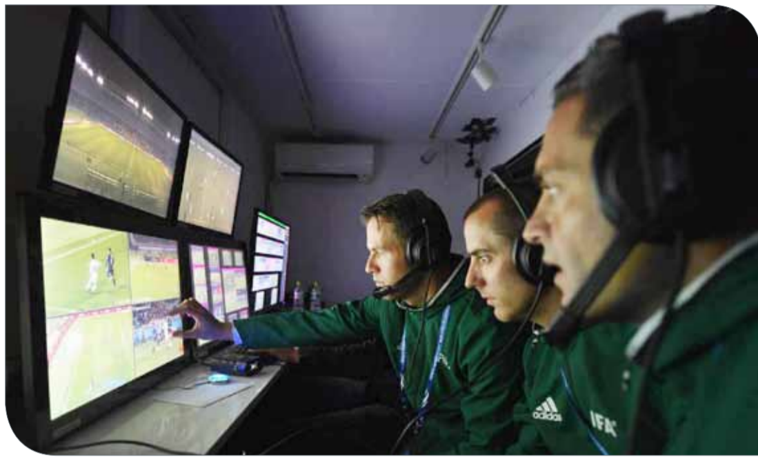
تقنية المساعدة بالفيديو

وذكر رئيس لجنة الحكام في الفيفا، الإيطالي بيارلويجي كولينا، في إبريل خلال دورة لحكام الموندiales في