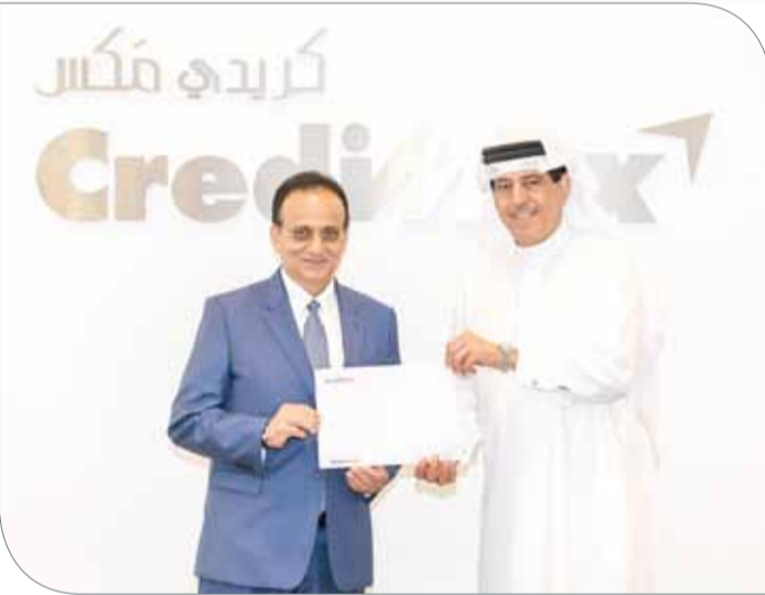
من تقديم الرعاية

وأشار ميرزا "بلغت شركة كردي ماكس مراحل متقدمة في مجالات عملها ولكنها في ذات الوقت تسعى إلى الاستثمار في الشباب البحريني باعتباره الثروة الحقيقية لهذا البلد كما أننا نسعى إلى ترك بصمات واضحة في دورة ناصر بن حمد للألعاب الرياضية لذا دخلنا في شراكة حقيقية لدعم الدورة التي باتت سمعتها تتخطى الحدود الإقليمية لتصل إلى العالمية".