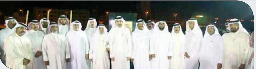
الجودر منوسطا الحضور

المملك والحكومة وهو ما اتضح من خلال توفير العديد من مشروعات البنية التحتية اللازمة لرعاية الشباب في مختلف المحافظات، مشيراً إلى أن الملعب الجديد بنادي أم الحصم يعبث على التفاؤل بتطوير المستوى الرياضي والإداري للنادي ويهدد الطريق أمام مجلس الإدارة لتنفيذ خطته وبرامجه للاقتراف، بكرة القدم وتطوير الفرق الرياضية، مشيداً في ذات الوقت