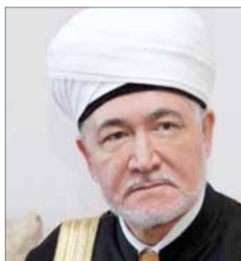
• الشيخ راوي عين الدين

مشيداً بالدور الذي اضطلع به رحمه الله من خلال توليه مهامه ومسؤولياته الوطنية طوال عقود من الزمن في تجسيد سياسة مملكة البحرين الداعية إلى السلام والعدل والمساواة والتسامح ونشر قيم الدين الإسلامي الحنيف وتقوية علاقات الأخوة بين شعب مملكة البحرين والشعوب الإسلامية في العالم، داعياً المولى - عز وجل - أن يتغمد الفقيد بواسع رحمته، ويسكنه فسيح جناته، وأن يلهم العائلة المالكة وشعب مملكة البحرين الكريم الصبر والسلوان.