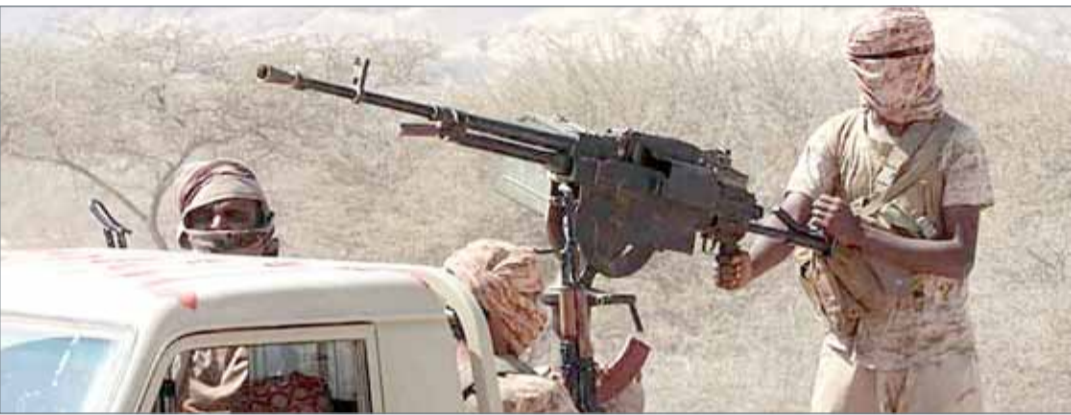
• قوات موالية للشرعية في اليمن

وتواجه ميليشيات الحوثي مأزقا في حشد المقاتلين إلى جبهات القتال وتعويض خسائرها المتلاحقة، خصوصا في الساحل الغربي، حيث سقط المئات من القتلى في صفوفها. ولجأت ميليشيات الحوثي إلى عقاب المناطق، التي رفضت إرسال أبنائها إلى جبهات القتال، بمنع المواد الإغاثية من الوصول إليها.