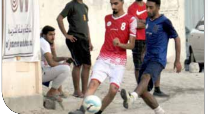
من مباريات دورة السقية