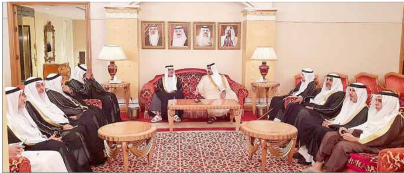
• الشيخ خليفة بن راشد مستقبلاً الشيخ نهيان بن مبارك

المنامة - بنا: بتكليف من رئيس الوزراء صاحب السمو الملكي الأمير خليفة بن سلمان آل خليفة، استقبل الشيخ خليفة بن راشد آل خليفة، وزير التسامح بدولة الإمارات العربية المتحدة الشقيقة الشيخ نهيان بن مبارك آل نهيان والوفد المرافق، لدى وصوله إلى مطار البحرين الدولي أمس في زيارة أخوية لتقديم واجب العزاء في وفاة المغفور له بإذن الله تعالى رئيس المجلس الأعلى للشؤون الإسلامية سمو الشيخ عبدالله بن خالد بن علي آل خليفة.