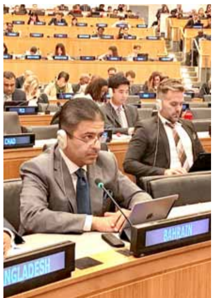
• البحرين تشارك في الاجتماع الأممي بنيويورك

الإقليمية والدولية والوطنية لوضع تصورات بشأن العهد الدولي الجديد وانطلقت في إعداده منذ فبراير 2018.