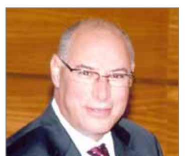
• سفير المملكة المغربية

المنامة - بنا: رفع سفير المملكة المغربية أحمد خطابي، أحر التعازي وخالص المواساة لعاهل البلاد صاحب الجلالة الملك حمد بن عيسى آل خليفة، ورئيس الوزراء صاحب السمو الملكي الأمير خليفة بن سلمان آل خليفة، وولي العهد نائب القائد الأعلى النائب الأول لرئيس مجلس الوزراء صاحب السمو الملكي الأمير سلمان بن حمد آل خليفة، والعائلة المالكة الكريمة، في وفاة رئيس المجلس الأعلى للشؤون الإسلامية سمو