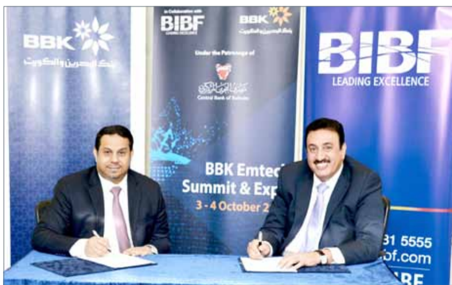
• أثناء توقيع الاتفاقية

الجديد إلى الأمام. في طور التغيرات السريعة في التكنولوجيا والخدمات في جميع أنحاء العالم، تحتل البحرين اليوم موقعا متميزا لتكون الرائدة في مجال التكنولوجيا الحديثة في المنطقة، وتشمل تجربة المستخدم، الذكاء الاصطناعي، الحوسبة السحابية، التكنولوجيا المالية، وأخرى غيرها. بإمكاني القول إن مؤتمر ”EmTech“ هو المكان الذي تتلاقى فيه التكنولوجيا والأعمال والثقافة لتوفير حلول مبتكرة“.