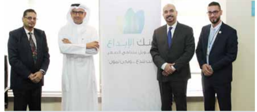
• عقب توقيع الاتفاقية بين الجانبين

من دون ضمانات لذوي الدخل المحدود من البحرينيين، حيث إن القروض الممنوحة تتراوح بين 200 و5 آلاف دينار، بينما يبلغ متوسط القرض الواحد القائم مبلغ 893 ديناراً فقط. لذلك يمكن لهذا التمويل من مجموعة القصبي إحداث تطوير كبير في عملنا، خصوصاً وأننا نرصد نسب عالية من الاستدامة والتوسع في المشروعات المقترضة“.