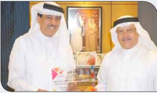
عسكر يقدم درع يوم البحرين الرياضي للصالحي

أشاد الأمين العام المساعد للمجلس الأعلى للشباب والرياضة، الأمين العام للجنة الأولمبية البحرينية عبدالرحمن عسكر بالمشاركة الفاعلة للمكتب الإعلامي ومركز المعلومات لممثل جلالة الملك للأعمال الخيرية وشؤون الشباب، رئيس المجلس الأعلى للشباب والرياضة، رئيس اللجنة الأولمبية البحرينية سمو الشيخ ناصر بن حمد آل خليفة في يوم البحرين