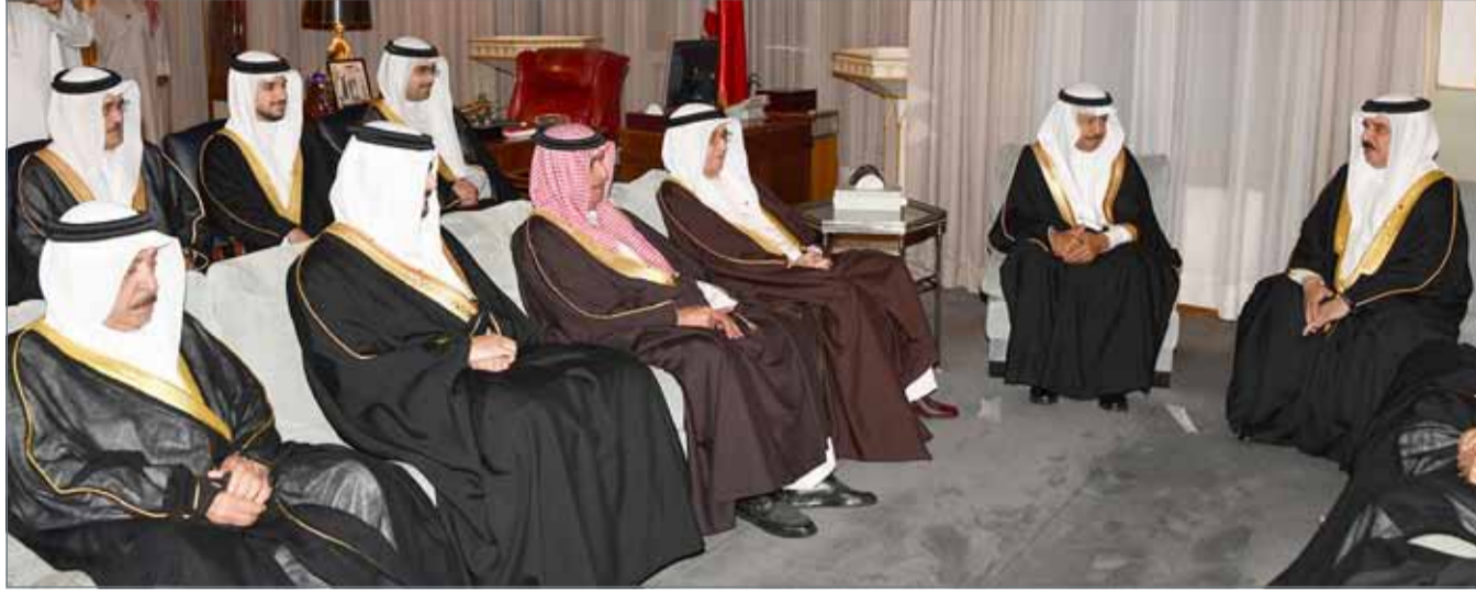
• جلالة الملك يتقبل التعازي من سمو رئيس الوزراء وسمو ولي العهد بوفاة سمو الشيخة هالة بنت دعيج

لخدمة المجتمع البحريني، وبإدلهم جلالته التعازي سائلاً المولى عز وجل أن يتغمد الفقيدة بواسع رحمته ورضوانه ويسكنها فسيح جناته. ورفع صاحب السمو الملكي ولي العهد نائب القائد الأعلى النائب الأول لرئيس مجلس الوزراء وأنجاله وأشقاء الفقيدة أسمى آيات الشكر وعظيم الامتنان والتقدير إلى المقام السامي لصاحب الجلالة على تعازي ومواساة جلالته في وفاة الفقيدة رحمها الله، ضارعين إلى الله سبحانه وتعالى أن يحفظ جلالة الملك ويرعاه ويديم على جلالته وافر الصحة والسعادة.