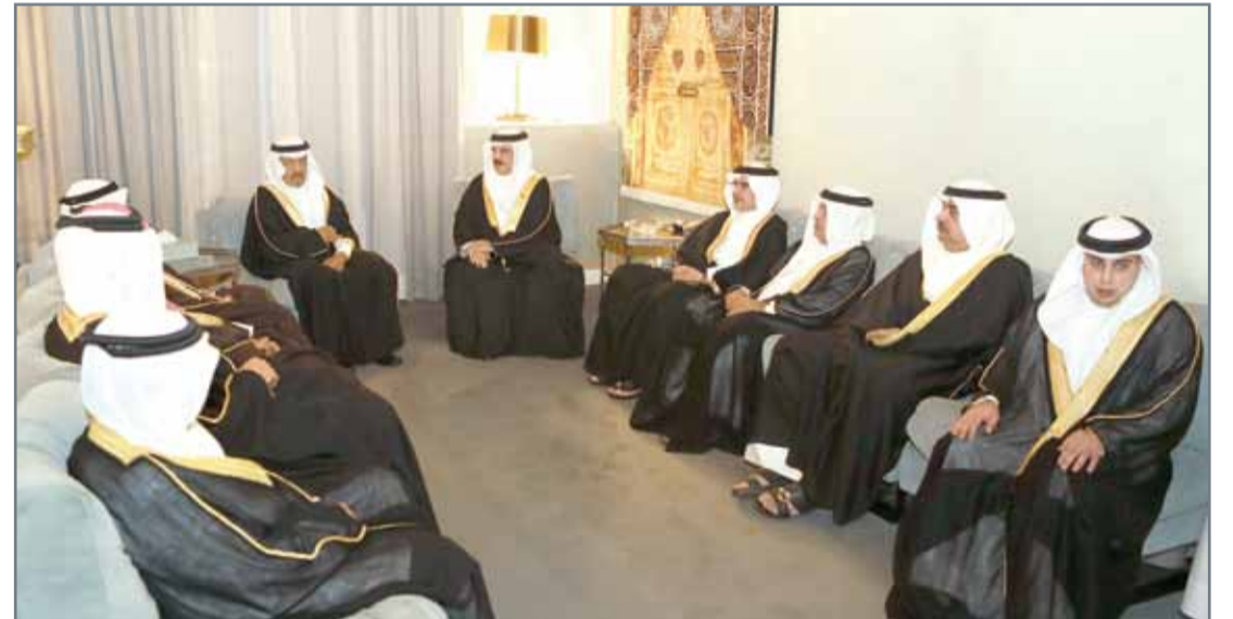
2 • جلالة الملك يتقبل التعازي من سمو رئيس الوزراء وسمو ولي العهد بوفاة سمو الشيخة هالة بنت دعيج

تقبل التعازي من سمو رئيس الوزراء وسمو ولي العهد بوفاة سمو الشيخة هالة... جلالة الملك؛ إسهامات طيبة للفقيدة في المجالات الإنسانية