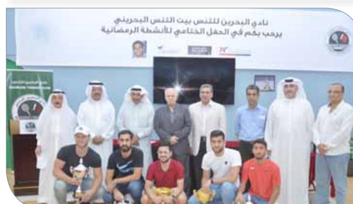
الفائزون مع كبار الحضور

بن هندي كلمة بهذه المناسبة، نقل فيها تحيات عاهل البلاد صاحب الجلالة الملك حمد بن عيسى آل خليفة لإدارة وأعضاء نادي البحرين للتنس وخالص التهاني بشهر رمضان المبارك وعيد الفطر الذي يهل علينا بعد أيام قليلة، مشيراً إلى أن جلالة الملك يعتبر