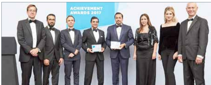
• أثناء الاحتفال بالجوائز في لندن

الأوسط وإفريقيا، والذي يضاف إلى الجهود الدعوية والمهارات العالية والتفاني الذي يبديه موظفوننا. وفي الوقت الذي يأتي فيه توفير أفضل الخدمات إلى عملائنا في مقدمة أولوياتنا، فإننا سرورون بحصول البنك على هذا التكريم المتميز بوصفه أحد أهم اللاعبين في القطاع“.