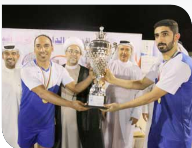
جانب من التتويج