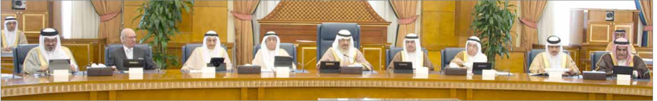
• سمو رئيس الوزراء مترئسا جلسة مجلس الوزراء أمس

• سمو الشيخ عبدالله بن خالد قدم إسهامات جلييلة في خدمة وطنه