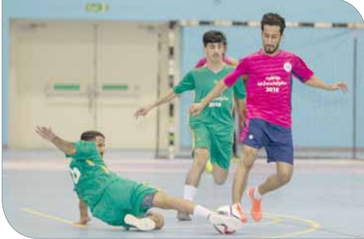
جانب من المنافسات

وأوضح صديق زويد أن بطولة المغفور له بإذن الله سمو الشيخ فيصل بن حمد آل خليفة تشهد نجاحاً عاماً بعد الآخر، وهي إحدى المحطات المهمة التي تستخرج النجوم وساهمت بشكل كبير باكتشاف العديد من المواهب الذين شاركوا مع المنتخب الوطني في الفترة الماضية.