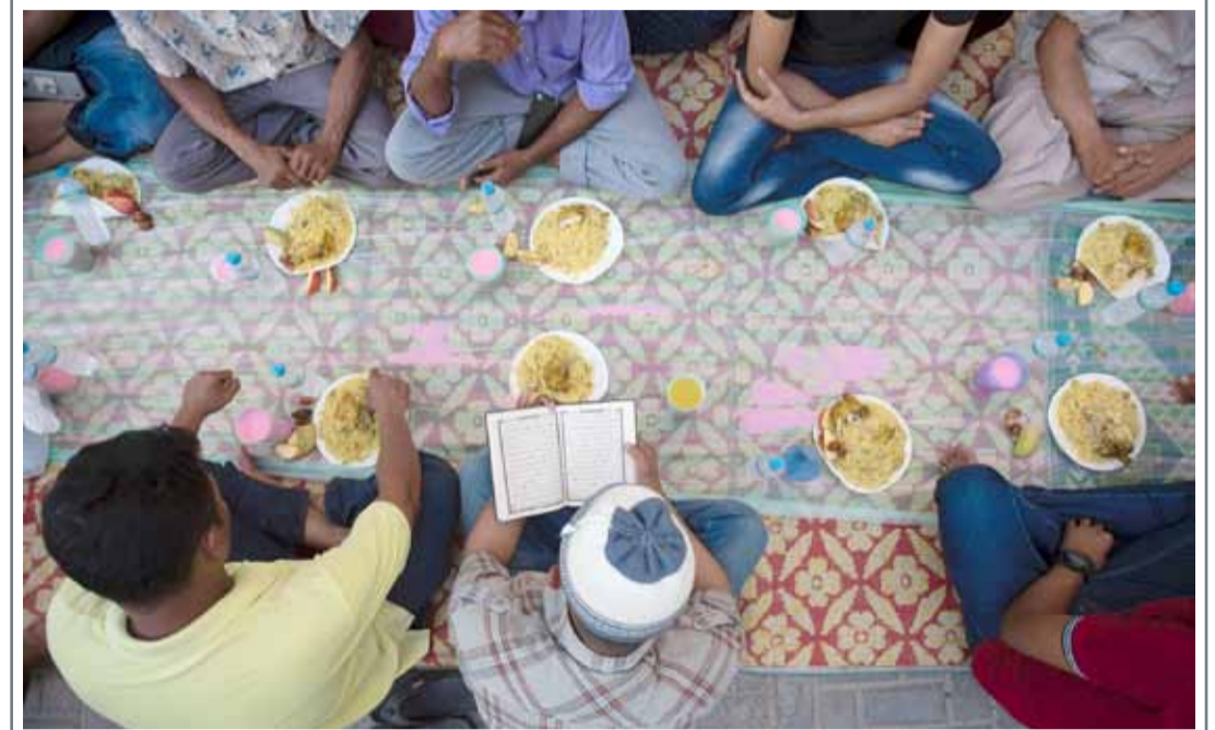
مشروع إفطار صائم في أحد مساجد العاصمة المنامة

الطقس حسن بوجه عام ولكنه حار مع تصاعد الاتربة في بعض المناطق. الرياح شمالية غربية من 8 إلى 13 عقدة وتزداد سرعتها من 13 إلى 18 عقدة، وتصل من 18 إلى 23 عقدة أحيانا. درجة الحرارة العظمى: 43 م والصرى: 31 م، الرطوبة النسبية العظمى: 65% والصرى: 10%.