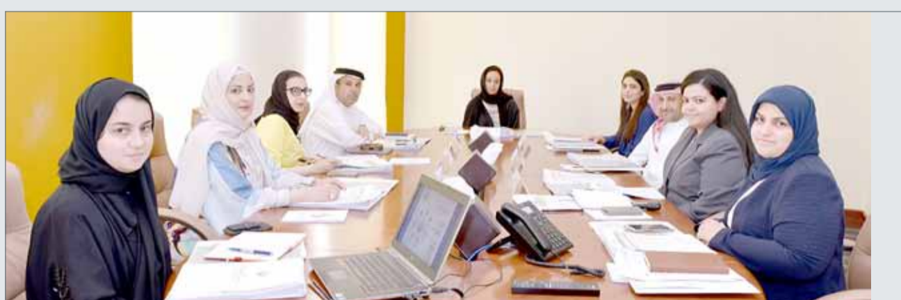
• جانب من اجتماع لجنة المبادرة

وتعد مبادرة امتياز الشرف لرائدات الأعمال البحرينية الشابة إحدى الآليات الداعمة والمحفزة لزيادة مشاركة المرأة الشابة في مجال ريادة الأعمال، إلى جانب وجود العديد من الخدمات والبرامج التي تسهل أمام المرأة دخولها وإقبالها على ريادة الأعمال، وتقديم بالتعاون مع شركاء المجلس الأعلى للمرأة كبنك البحرين للتنمية وتمكين.