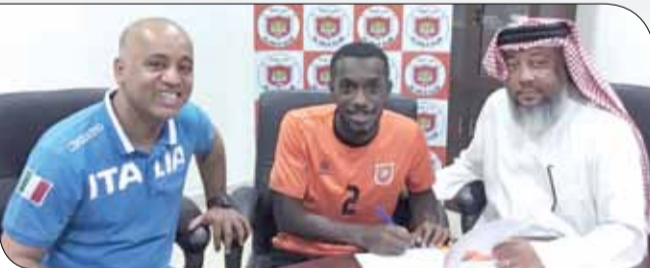
المرزوقي يوقع على العقد مع الحالة