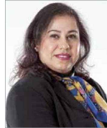
• أعلام جناحي

وقالت الجمعية إنها أكدت التزامها بقرار وزارة العمل والشؤون الاجتماعية رقم (7) لسنة 2000 بشأن الترخيص بتسجيل جمعية سيدات الأعمال البحرينية، والذي نص على أنه "لا يجوز للجمعية الاشتغال بالسياسة أو الدخول في مضاربات مالية، كما لا يجوز لها أن تنتسب أو تتشارك أو تنضم إلى جمعية أو هيئة أو ناد أو اتحاد مقره خارج دولة البحرين من دون إذن مسبق من وزارة العمل والشؤون الاجتماعية