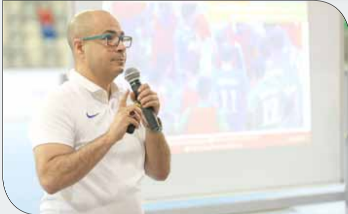
جانب من اجتماع لجنة الحكام مع الفرق المشاركة في الدوري