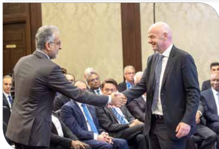
...ويصافح رئيس الاتحاد الدولي إنفانتينو

مكتب رئيس الاتحاد الآسيوي لكرة القدم | موسكو