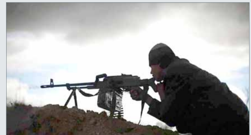
• عودة المقاتلين الأجانب في صفوف داعش يشكل هاجساً لأوروبا.

ومضى يقول: "هناك أيضاً احتمال أن تشمل الهجمات تلك المستخدمة بشكل روتيني في العراق وسوريا، مثل الأجهزة المتفجرة والسيارات المفخخة الانتحارية". وأكد أن "استخدام السيارات المفخخة في أوروبا من قبل المتشددين سيزيد بشكل كبير من الوفيات المحتملة للهجمات، ويعطي المسلحين المزيد من القدرة على التدمير من خلال استهداف الأماكن الحيوية". وذكر التحليل أن هناك مؤشرات على أن بعض الخلايا قد حاولت بالفعل اعتماد هذه الطريقة، فعلى سبيل المثال، كانت الخلية التي نفذت هجمات 17 سبتمبر 2017 في برشلونة تعكف على إعداد كمية كبيرة من المتفجرات. ووفقاً للشرطة الكatalونية، فإن المواد، التي تم اكتشافها تضم مواد كيميائية تستخدم في صناعة المتفجرات، وتشبه تلك المستخدمة في هجمات باريس وبروكسل.