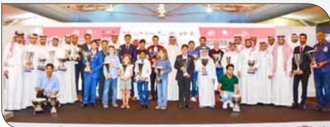
جانب من حفل التكريم

الصخر - حلبة البحرين الدولية: توجت حلبة البحرين الدولية، أبطال الموسم الرياضي المنصرم بعد انتهاء جميع المنافسات، في حفل أقيم بمقر الحلبة بالصخر مساء السبت الماضي. وشهد الحفل تتويج الفائزين في الموسم الرياضي 2017/2018 سي منافسات تحدي الحلبة 2000 سي، وبطولة البحرين للكارتينج. وحضر التتويج الرئيس التنفيذي للحلبة الشيخ سلمان بن عيسى آل خليفة الذي تقدم بدوره بالشكر لجميع المشاركين في منافسات بطولتي تحدي الحلبة 2000 سي وبطولة البحرين للكارتينج عن الموسم المنصرم، لاسيما أبطال المراكز الأولى وأصحاب الإنجازات، كما عبّر الرئيس التنفيذي للحلبة عن امتنانه لجميع من ساهم في نجاح الموسم. ويتطلع الشيخ سلمان لمزيد من الإنارة والتشويق في النسخ القادمة من المنافسات التي تنطلق فعاليتها