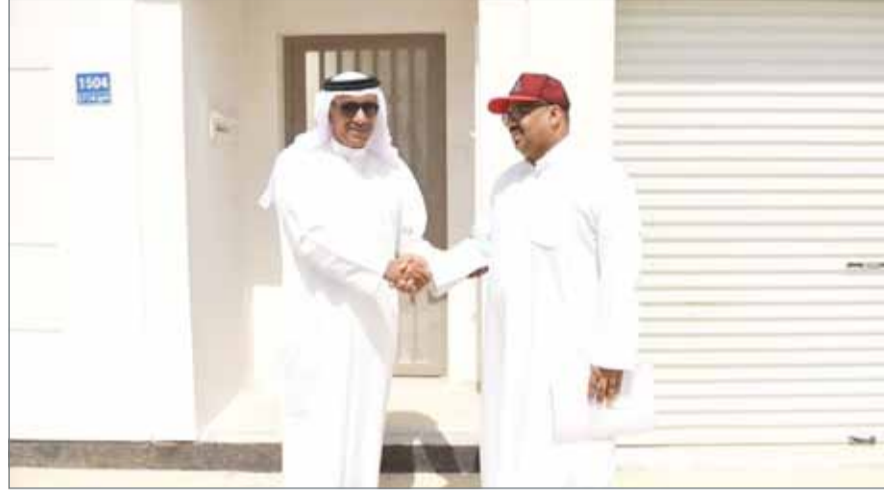
• وزير الإسكان يتفقد نسب الإنجاز بالمرحلة الأولى لمدينة خليفة

المنامة - وزارة الإسكان: قام وزير الإسكان باسم الحرر بزيارة تفقدية صباح أمس إلى مدينة خليفة، تفقد خلالها نسب الإنجاز بالمرحلة الأولى من المشروع، والتي تتكون من 1560 وحدة سكنية، يتم تمويلها من خلال برنامج التنمية الخليجي.