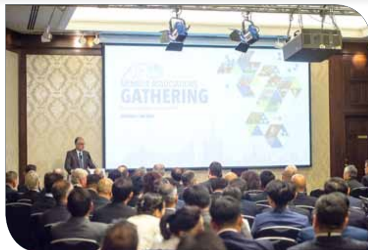
سلمان بن إبراهيم يتحدث خلال اللقاء العام للاتحاد الآسيوي في موسكو

شهد رئيس الاتحاد الآسيوي لكرة القدم الشيخ سلمان بن إبراهيم آل خليفة، ورئيس الاتحاد الدولي لكرة القدم جياني إنفانتينو، اللقاء العام الذي أقامه الاتحاد القاري على هامش نهائيات كأس العالم لكرة القدم، أمس في العاصمة الروسية موسكو، بحضور رؤساء وأعضاء الاتحادات الوطنية الآسيوية المشاركة في اجتماع كونغرس الاتحاد الدولي المقرر عقده يوم الأربعاء المقبل.