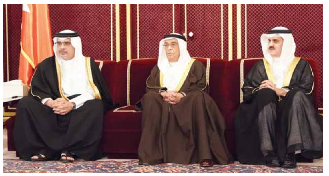
• سمو ولي العهد وبحضور سمو الشيخ عيسى بن سلمان وسمو الشيخ محمد بن سلمان يستقبل المعزين بوفاة صاحبة السمو الشيخة هالة بنت دعيج

السعودية الشقيقة صاحب السمو الملكي الأمير محمد بن سلمان بن عبدالعزيز آل سعود في وفاة صاحبة السمو الشيخة هالة بنت دعيج آل خليفة، أعرب فيها عن أحر تعازيه وصادق مواساته لسمو ولي العهد ولاسرة الفقيدة، سائلاً الله جل شأنه أن يشملها بواسع رحمته ورضوانه ويسكنها فسيح جناته.