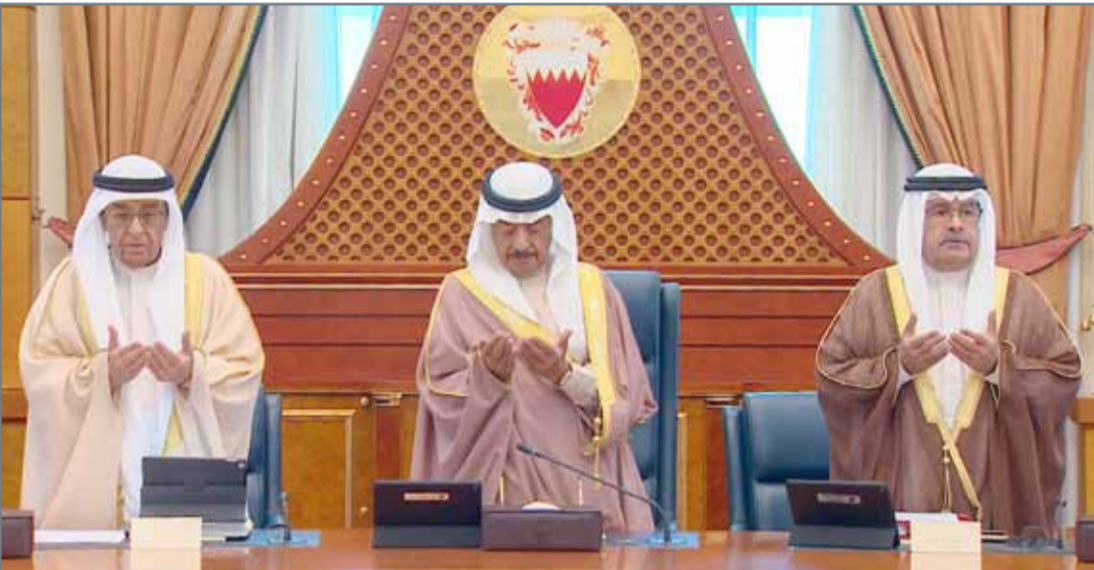
4 • سمو رئيس الوزراء في وقفة دعاء للفقيد سمو الشيخ عبدالله بن خالد أثناء ترؤسه جلسة مجلس الوزراء

سمو الشيخ عبدالله بن خالد قدم إسهامات جليلة في خدمة وطنه... سمو رئيس الوزراء؛ دراسة إنشاء مشروع إسكاني في سار