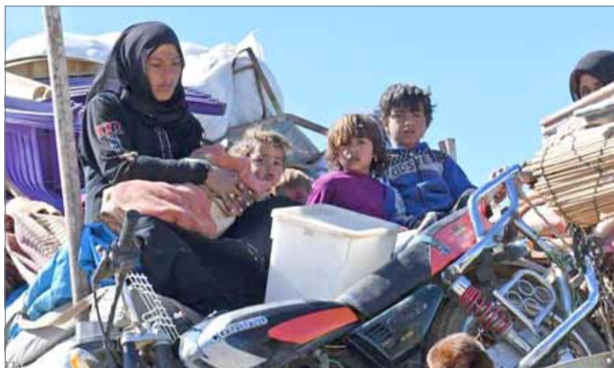
• عائلات سورية نازحة

ويرفع النزوح الأخير عدد الأشخاص، الذين نزحوا في داخل سوريا إلى 6.2 مليون، في حين يعيش حوالي 5.6 مليون لاجئ سوري في الدول المجاورة، بحسب أرقام الأمم المتحدة.