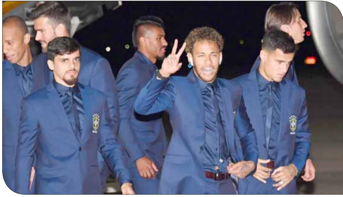
نيمار لحظة وصول بعثة البرازيل لروسيا

يحتشد عليه، إذ فشل في تحقيق أي فوز في مبارياته السبع الأخيرة، ما دفع الرئيس فلاديمير بوتين الذي أنفق المليارات لاستضافة بلاده أهم حدث على أرضها منذ الأولمبياد الصيفي عام 1980، إلى مطالبة اللاعبين بالارتقاء بمستواهم. وقال بوتين الأسبوع الماضي "يجب الاعتراف لسوء الحظ بأن فريقنا لم يحقق نتائج مهمة في الآونة الأخيرة". وقبل الافتتاح الخميس، توجه أنظار العالم الأربعة إلى اجتماع الجمعية العمومية للاتحاد الدولي "فيفا"، حيث سيتخذ القرار بشأن الملف الفائز بحق استضافة نهائيات 2026 التي يتنافس عليها المغرب مع الملف الأمريكي-المكسيكي- الكندي المشترك.