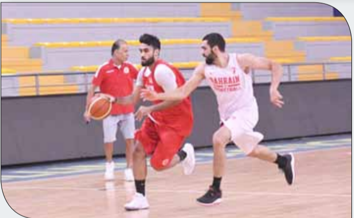
جانب من تحضيرات منتخبنا الوطني

يشار إلى أن منتخبنا يحتل المركز الثاني في التصفيات برصيد 5 نقاط عقب الدورة الجمعية الأولى "الذهاب" التي أقيمت في البحرين خلال الفترة من 23 وحتى 26 من فبراير الماضي، خلفاً للمنتخبين الإماراتي والسعودي، فيما احتل المنتخب العماني المركز الرابع.