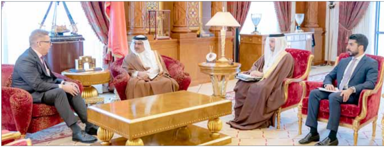
• سمو ولي العهد مستقبلاً السفير الألماني

أسهم في تسهيل مهامه الدبلوماسية، متمنياً لمملكة البحرين المزيد من التطور والازدهار.