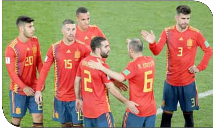
لاعبو المنتخب الإسباني

قاسية في مباراتها الأخيرة في الدور الأول على يد الأوروغواي صفر-3. وأصبحت إسبانيا أبرز مرشحة للفوز باللقب استناداً إلى مكاتب المراهبات، لكن ذلك لا يعني أنها مأمّن من أي مفاجأة روسية، لاسيما إذا لم تعالج مشاكلها الدفاعية التي تحدث عنها قائدها سيرخيو راموس بالقول "يجب أن نكون واضحين وصرحين. هذه ليست الطريقة المثلى للمضي قدماً". ورأى أن "دور المجموعات يسمح لك دوماً بهامش للخطأ، لكن هذه الأخطاء من الآن وصاعداً ستسلك إلى منزلك".