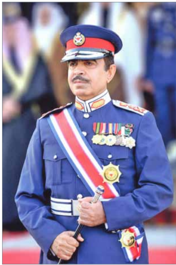
• وزير الداخلية

برعاية وزير الداخلية وبحضور 300 خبير ومختص