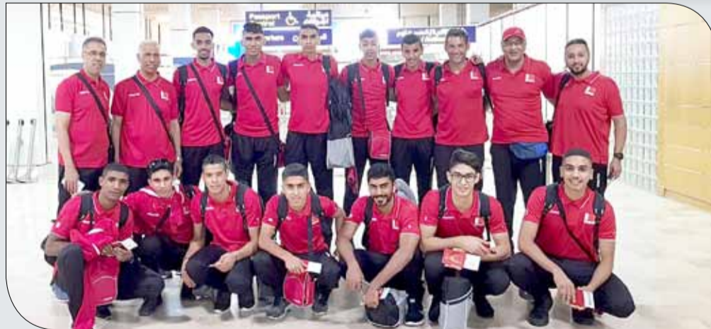
منتخب الشباب لدم المغادرة بمطار البحرين الدولي

أعلى مراحل الجاهزية الفنية والبدنية استعداداً للحدث الآسيوي حيث تعتبر العناصر الحالية هي "منتخب المستقبل" الذي تتمحور حوله استراتيجية تحقيق التميز للكرة الطائرة البحرينية حتى 2020 الذي سبق له خوض منافسات بطولة العالم للناشئين تحت 19 عاماً التي أقيمت في المملكة العام الماضي.