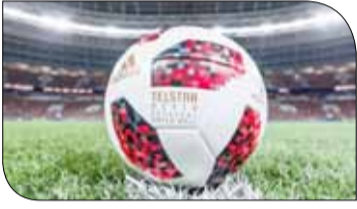
كرة تيليسنار ميسنار الجديدة

وكالات: في سابقة لم تحدث بتاريخ المونديال منذ انطلاقه العام 1930، كشف الاتحاد الدولي لكرة القدم "فيفا" عن كرة القدم الجديدة التي ستستخدم في الأدوار الإقصائية بمونديال روسيا، ابتداء من دور الـ 16 الذي يطلق السبت المقبل. وأطلقت شركة "أديداس" المصنعة للكرة اسم "تيليسنار ميسنار" على الكرة الجديدة، وكلمة "ميسنار" تعني "الطموح والأحلام" باللغة الروسية. وستحمل الكرة نفس تصميم كرة البطولة "تيليسنار 18"، مع إضافة اللون الأحمر ممزوجا بالأسود، في دلالة على "الحماس والإثارة التي يحملها الدور الإقصائي"، وفقا لموقع فيفا الرسمي. وتعد هذه المرة الأولى التي يغير فيها الفيفا شكل الكرة في المونديال، بعد الدور الأول من البطولة. ولا يزال غير معلوما إذا ما ستستخدم كرة "تيليسنار ميسنار" في المباراة النهائية بموسكو، أم أن الفيفا سيكشف عن كرة "خاصة" للمباراة النهائية، مثل ما فعل في بطولات سابقة.