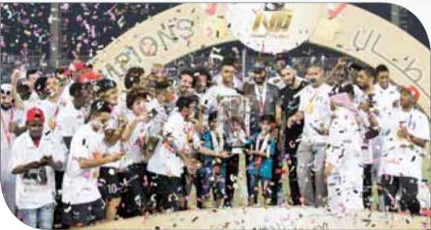
"طوموح" متوجاً بلقب بطولة ناصر بن حمد

◆ أكد مصدر رسمي لـ "البلاد سبورت" أن جميع لاعبي فريق "طوموح" لكرة القدم سيتم توزيعهم على أندية دوري الدرجة الأولى لكرة القدم بحسب احتياجات كل نادي في المراكز، على أن يتم بيع معظم اللاعبين على الأندية وليس للعب لصالحها من دون مقابل مادي، بدلاً من استقطاب لاعبين محترفين من الخارج دون معرفة كيفية تسجيلهم في الكشف لغاية الآن.