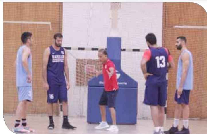
جانب من تدريبات منتخبنا يوم أمس