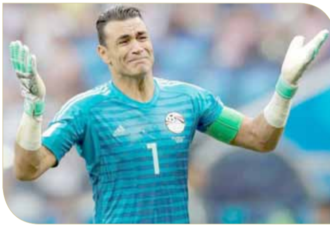
حارس مرمى منتخب مصر عصام الحضري

دخول مرمى فريقه في تاريخ كأس العالم. كذلك أصبح الحضري أكبر قائد لمنتخب في تاريخ كأس العالم