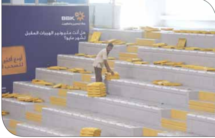
من عمليات الصيانة

وبدأت الوزارة في عمليات صيانة بصالة زين والتي تشمل العديد من المرافق، حيث يأتي من مقدمة هذه العمليات استبدال كراسي المدرجات الحالية بكراسي جديدة والتي جاءت بفضل توجيهات من سمو رئيس الاتحاد.