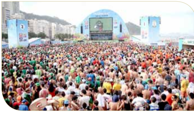
الاجواء الجماهيرية في موندبال