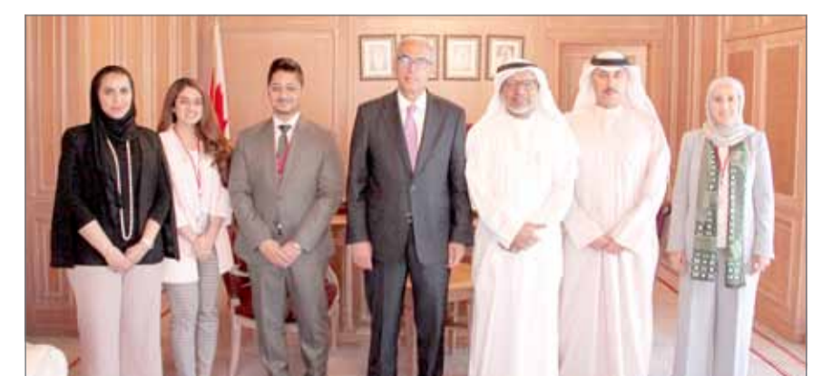
• المعراج مستقبلاً المشاركين في "البرنامج"

المنامة - المصرف المركزي: أشاد محافظ مصرف البحرين المركزي رشيد المعراج ببرنامج ولي العهد النائب الأول لمجلس الوزراء صاحب السمو الملكي الأمير سلمان بن حمد آل خليفة، لتنمية الكوادر الوطنية والذي يوفر فرصة ثمينة للمشاركين فيه لتطوير مهاراتهم القيادية وتعزيز ثقافة العمل المؤسسية والاستفادة من تواجدهم من موظفي الدولة من مختلف القطاعات في هذا البرنامج. وأضاف أن هذا البرنامج يتيح فرصة أيضاً للمشاركين للاطلاع عن كثب على صناعة القرار الاقتصادي والمالي والتواصل مع القيادات الحكومية في مختلف المستويات. جاء ذلك لدى