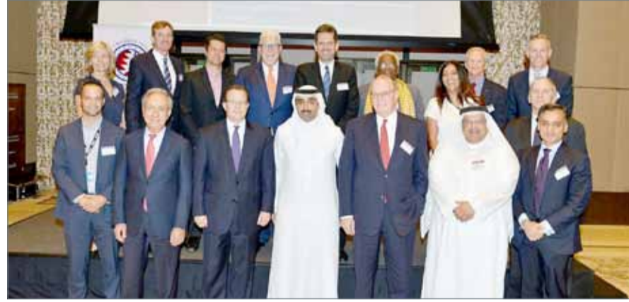
● مشاركون في الفعالية

● محمد بن خليفة: نسعى لزيادة الإنتاج من مكامن النفط الجديد