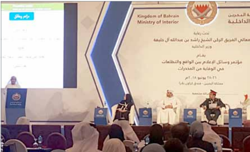
• الجلسة الأولى