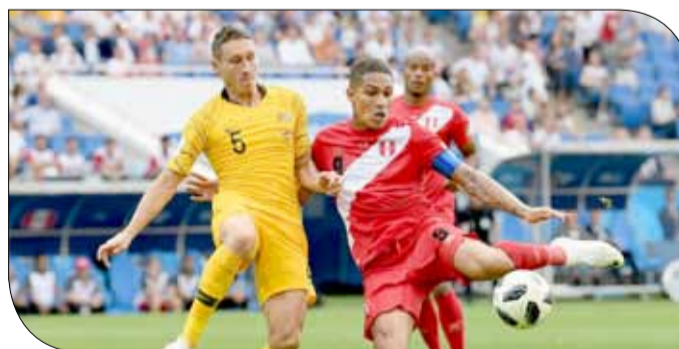
من لقاء بيرو وأستراليا

♦ وكالات: لم تكن بيرو قد سجّلت أي هدف حتى الآن في نهائيات كأس العالم، ونجحت في هزّ الشباك في المباراة التي كانت فيها بحاجة أقل لذلك، في آخر مبارياتها في المجموعة الثالثة ضد أستراليا. استهلّت كتيبة الإنكا، التي لم تكن تملك أي حظوظ للتأهل، اللقاء بهدوء وصبر قبل أن تزور مرمى الأستراليين في محاولتها الأولى، بعد عرضية إلى الورا وتسديدة على الطائر من أندريه كاريو في الزاوية