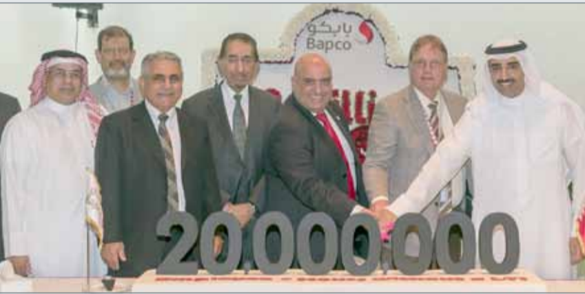
● وزير النفط يرعى احتفالية بابكو بتحقيق 20 مليون ساعة عمل دون وقوع أية إصابة مضيعة للوقت

عمل من دون أية إصابات مضيعة للوقت". يذكر أنها المرة الأولى التي تحقق فيها شركة "بابكو" الإنجاز الفريد في مضمار السلامة الشخصية منذ تأسيس الشركة. ويعادل هذا الإنجاز 618 يوم عمل آمناً دون وقوع أية إصابات مضيعة للوقت من قبل موظفي بابكو والمقاولين.