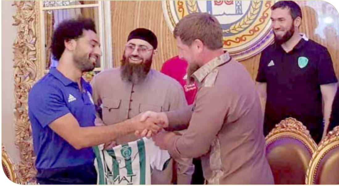
صلاح مع الرئيس الشيشاني

تعرض لاعب منتخب السويد ميمي دورماز إلى إساءة عنصرية، عبر شبكات التواصل الاجتماعي، عقب هزيمة السويد أمام ألمانيا. وكان دورماز قد تدخل لصد هجمة ألمانية من تيمو فيرنر لكن الحكم احتسبها ركلة حرة أحرز منها توني كروس هدف الفوز. ومنذ هذه الركلة يتعرض دورماز، الذي ولد في السويد لوالدين قادمين من تركيا، إلى إساءة عنصرية، بلغت في تطرفها حد التهديد بإيذاء عائلته. وقال دورماز: “عندما تهددني وتصنفي بالألقاب مشينة مثل (الشیطان) و(الإرهابي) و(طالبان)، فإنك بذلك تكون قد تجاوزت حدودك على نحو كبير”.