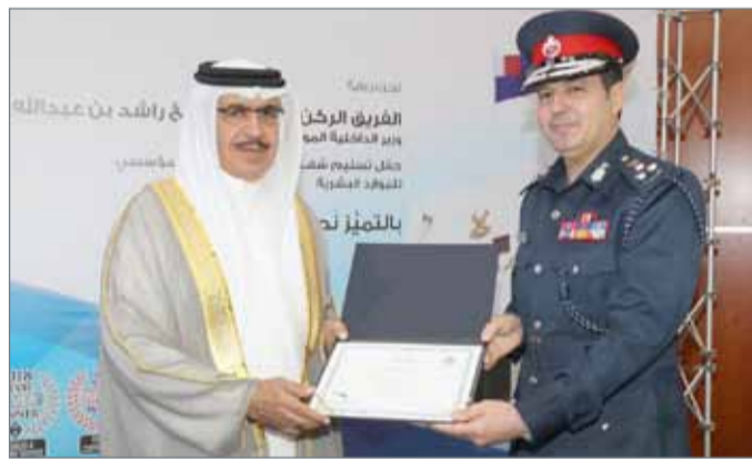
• وزير الداخلية يشهد حفل تسليم الموارد البشرية شهادة التميز المؤسسي

المنامة - وزارة الداخلية: أكد وزير الداخلية الفريق الركن الشيخ راشد بن عبدالله آل خليفة أن الوزارة ماضية قدماً في دعم وتطوير العنصر البشري، من خلال تبني معايير عالمية في مختلف مجالات العمل. وشهد الوزير، أمس، حفل تسليم الموارد البشرية، شهادة التميز المؤسسي، بعد حصولهم على النجمة الرابعة، وهو ما يعد الأول من نوعه على مستوى مملكة البحرين.