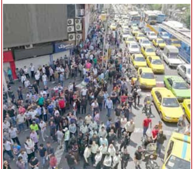
• جانب من مظاهرة التجار في طهران احتجاجاً على ارتفاع الأسعار وانخفاض قيمة الريال