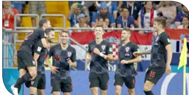
فرحة كرواتية بالانتصار

♦ وكالات: ودع منتخب آيسلندا نهائيات كأس العالم 2018 من دور المجموعات بعد الضسارة بهدفين مقابل هدف من منتخب كرواتيا في المباراة التي جمعتهم على ملعب روستوف أرينا ضمن الجولة الثالثة والأخيرة من المجموعة الرابعة. وتأهل عن المجموعة الرابعة كل من منتخب كرواتيا في الصدارة وفي رصيدها 9 نقاط، والأرجنتين في المركز الثاني برصيد 4 نقاط، بينما ودعت نيجيريا وآيسلندا البطولة برصيد 3 نقاط لكل منهما وعلى التوالي. المنتخب الكرواتي افتتح التسجيل خلال المباراة عن طريق ميلان بادليج لاعب فريق فيورنتينا الإيطالي بعد مرور 53 دقيقة على انطلاقها. وعادت آيسلندا إلى أجواء اللقاء بحثا عن قلب النتيجة ومحاوله التأهل بتسجيل هدف