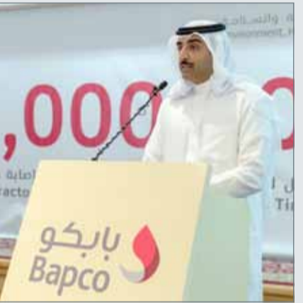
● وزير النفط يلقي كلمته

لجنة البيئة والصحة والسلامة إبراهيم طالب في "بابكو" قائلاً "تحقق بالفعل أحد أهم إنجازات شركة بابكو باستكمال 20 مليون ساعة عمل من قبل موظفي بابكو والمقاولين دون وقوع إصابة مضيعة للوقت، وأصبح هذا الإنجاز أمراً واقعاً بفضل من الله سبحانه وتعالى، ثم بفضل