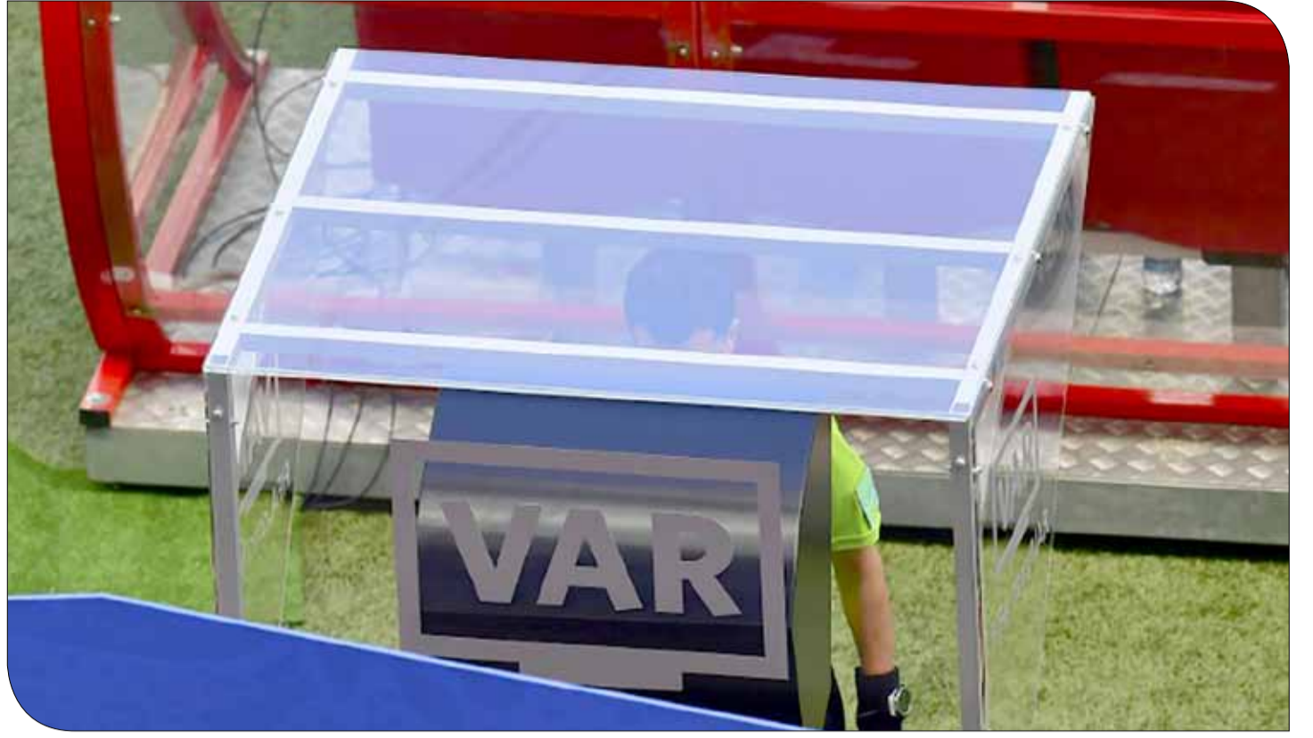
تقنية الفيديو المساعد

وقال كيروش الذي قاد منتخب بلاده في نهائيات جنوب إفريقيا العام 2010 بعد المباراة "لا أريد التحدث عن هذا الأمر بإسهاب، الأمر يتعلق بلاعب من بلدي. أدرك تماماً بأنهم سيعلنون الحرب ضدي". وأضاف "لا مشكلة لدي، فأنا تعودت أن أكون شخصاً في مواجهة دولة، ودولة في مواجهة شخص منذ جنوب إفريقيا. لا مشكلة لدي على الإطلاق مع هذا الأمر". وأوضح "لكن الواقع هو أنه إذا أوقفت المباراة من أجل الاستعانة بتقنية الفيديو لمراجعة حادثة تتعلق بتوجيه كوع، فإن تلك الضربة بحسب القوانين تستدعي رفع البطاقة الحمراء. القوانين لا تقول إذا كان الأمر يتعلق برونالدو أو ميسي...". وتابع "إنها بطاقة حمراء، الأمر لا يتعلق بالحكم بل بالسلوك، الشجاعة والشخصية، ويجب أن تكون القرارات واضحة للجميع، وبالتالي، وبرأيي الشخصي فإن انفانتينو والفيفا والجميع يوافقون بأن تقنية الفيديو لا تسير كما يجب. هذه هي الحقيقة، ثمة الكثير من الاحتجاجات".