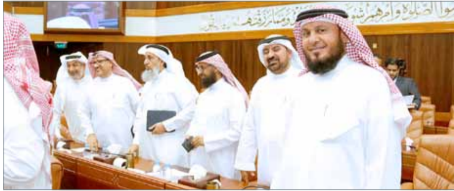
• ابتسامه عريضة