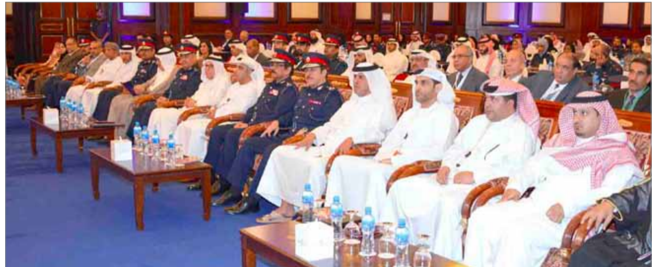
• رئيس الأمن العام يشهد افتتاح المؤتمر

والخليج، والتي سيكون للتكنولوجيا دور كبير في مكافحة الجريمة والمخدرات. وأعرب رئيس الأمن العام عن جل شكره وتقديره لوزير الداخلية الفريق الركن الشيخ راشد بن عبدالله آل خليفة على دعمه وتوجيهاته القيمة ونظرته الثاقبة من خلال تبني إستراتيجية متقدمة لتطوير المنظومة الأمنية والعناية والرعاية الدائمة التي يوليها للأجهزة الأمنية ومنسوبيها، مؤكداً أن هذا كان له الأثر الأكبر في النهوض بمسيرة العمل الأمني والنقلة النوعية التي يشهدها، وسعي الوزارة الدائم لتوفير التدريب المناسب لكل منتسبها.