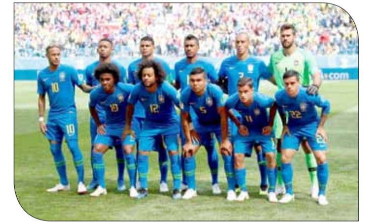
الخطأ ممنوع أمام البرازيل اليوم

المنافس. وتعرض المنتخب الفائز بلقب كأس العالم خمس مرات لانتقادات كثيرة في البرازيل في حين تلقى نيمار القسم الأكبر منها. ولم يرق أعلى لاعب في العالم وصاحب الوجود الدائم في إعلانات التلفزيون ووسائل التواصل الاجتماعي إلى مستوى الحدث وأجهش بالبكاء عقب الفوز الأخير على كوستاريكا. ورفض فاجنر ما قاله صحفيون من أن الضغط كان له تأثير إيجابي على فريق المدرب تيتي. وأضاف "التوقعات الكبيرة أدت لخلق هذه الضغوط. يدرك اللاعبون أن بإمكانهم تقديم أداء أفضل والحصول على نتائج أحسن وهذا ما يمنحنا الحساس لأننا نعرف أننا سنستحسن مع توالي مباريات البطولة".