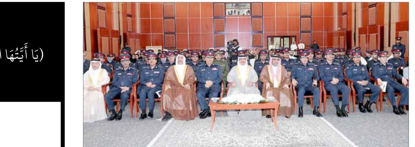
• وزير الداخلية يشهد حفل تسليم الموارد البشرية شهادة التميز المؤسسي

الجودة في الموارد طبقاً للمعايير العالمية. وأضاف أنه تماشياً مع رؤية البحرين الاقتصادية 2030، طبقت الموارد البشرية نظام إدارة البيئة، كما حصلت على شهادة الأيزو 14001 كأول جهة حكومية تحصل على هذه الشهادة. وخلال الحفل، تم عرض فيلم قصير حول رحلة التميز في الموارد البشرية، أشار إلى أن تنويع الموارد البشرية بجائزة التميز الخاص بالمؤسسة الأوروبية لإدارة الجودة، استند إلى تاريخ من مشاريع التطوير، التي تتماشى مع إستراتيجية وزارة الداخلية ورؤيتها وقيمتها وبما يدعم تنفيذ أهداف الموارد البشرية، ويساعد في الحفاظ على مكتسبات الأداء ويعتمد على المعايير العالمية، مؤكداً أن الإنجاز والتميز، فكر ومنهج، هدفه خدمة العملاء، وهي منظومة متكاملة تنتقل لتحقيق أهداف نبيلة محوراً من سلامة الوطن.