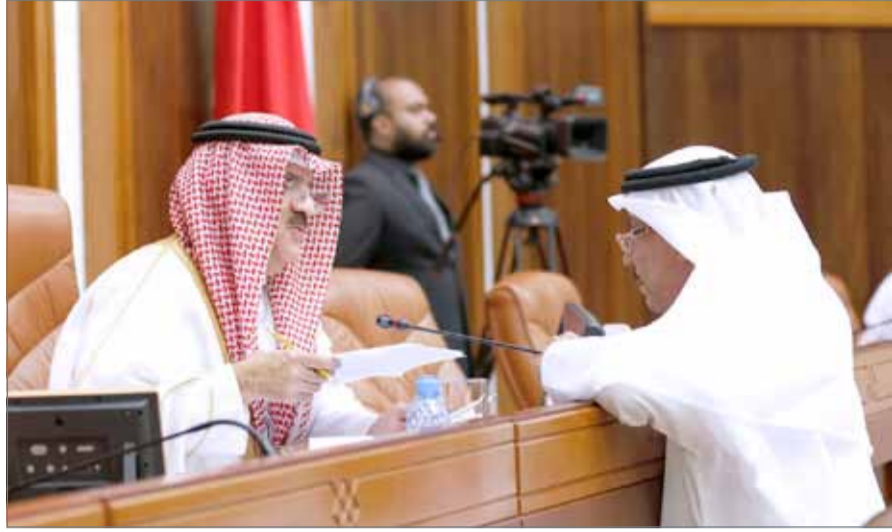
• ختامها مسك

البلاد سيد علي المحافظة قرر مجلس النواب الموافقة على مقترح برغبة بصفة الاستعجال؛ لإصدار قرار ينظم منح ساعتى الرعاية لمن لديهم أبناء من ذوي الإعاقة من المواطنين وأبناء المرأة البحرينية المتزوجة من أجنبي. ووافق المجلس على طلب إصدار بيان بخصوص الإشادة بدور المملكة العربية السعودية ومبادرتها بدعم المملكة الأردنية الهاشمية في مواجهة أزمة الاقتصاد، والتي عقدت يوم الأحد الماضي. كما وافق المجلس كذلك على طلب إصدار بيان دعم وتأييد لجهود التحالف العربي في إعادة الشرعية في اليمن وما قامت به من تحرير مطار الحديدة، وقرر تخويل مكتب المجلس بإعداده وإصداره.