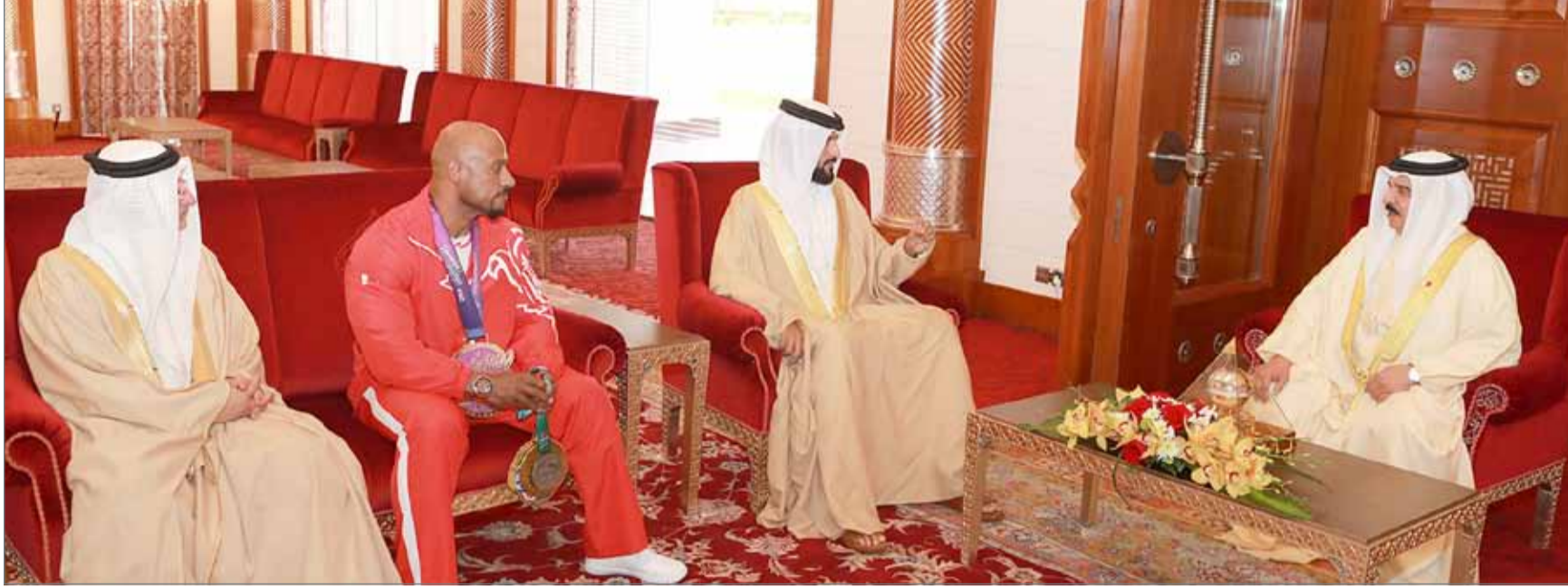
• جلالة الملك مستقبلاً سمو الشيخ ناصر بن حمد الذي قدم إلى جلالتهم بطل رياضة كمال الأجسام العالمي المحترف سامي الحداد

الإنجازات المهمة والنتائج المثمرة والمتواصلة على المستويات الإقليمية والقارية والدولية، منوهاً بجلالته بالخطط والبرامج التي ينفذها الاتحاد البحريني لرفع الأثقال، والتي تهدف لإعداد وتهيئة اللاعبين لحصد الذهب والمراكز المتقدمة في البطولات العالمية.