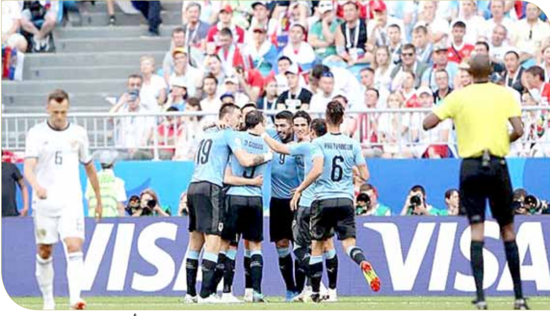
أوروغواي تفوقت على روسيا

الأول في المجموعة الثانية، في دور الـ 16 يوم الأحد المقبل بالعاصمة الروسية موسكو.