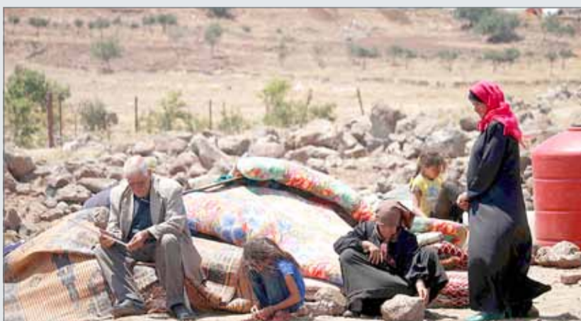
• قوات النظام السوري تكثف قصفها درعا منذ أسبوع بدعم روسي

وكانت الأمم المتحدة أعلنت في وقت سابق، أمس الثلاثاء، نزوح 45 ألف شخص جراء التصعيد العسكري المستمر منذ أسبوع في محافظة درعا في جنوب سوريا. وقالت متحدثاً باسم مكتب تنسيق