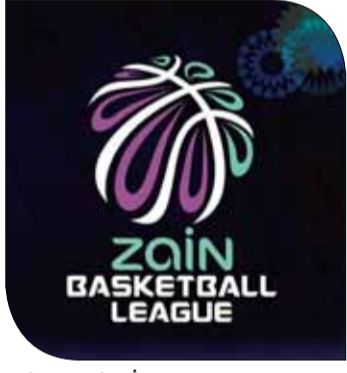
شعار دوري زين

وأكد أن الاتحاد يدرس فكرة السماح بتسجيل لاعبين أجنيين في مباريات المربع الذهبي ونهائيات دوري زين لكرة السلة، موضحاً أن قرار تسجيل اللاعبين الأجنيين سيضمن أيضاً دور النصف النهائي والنهائي لمسابقة كأس خليفة بن سلمان في حال إقراره بصفة رسمية.