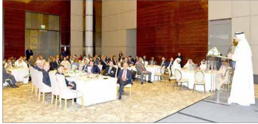
● وزير النفط متحدثاً في اللقاء

الشيخ محمد بن خليفة آل خليفة بفندق الفور سيزون في خليج البحرين، وتحدث فيها عن أحد اكتشافات النفط والغاز في المملكة. وعلى هامش اللقاء، أكد سفير الولايات المتحدة الأميركية جاستين سيبيريل أن العلاقة بين البلدين في نمو متواصل مما ينعكس على العلاقات الاقتصادية والتجارية بين البحرين وأميركا، والشراكة الإستراتيجية قوية كما كانت عليه في السابق. وبخصوص الاكتشافات النفطية الأخيرة ووجود تعاون في هذا الجانب بين البلدين، أوضح السفير أن هذه تعتبر فرصة لزيادة العلاقات الاقتصادية