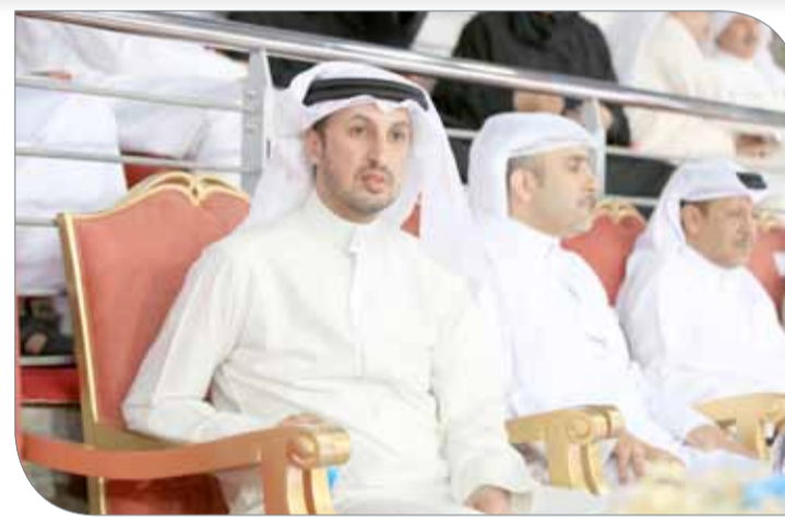
زيد بن فيصل خلال حضوره الافتتاح

وأضاف النائب علي بوفرسن أن الدوري يعبر بجلاء عن رعاية واحتضان سمو الشيخ خالد بن حمد آل خليفة للشباب البحريني من خلال تقديم المباريات وتنظيم مختلف الأنشطة والبرامج والفعاليات التي تساهم في تطوير مسيرة العمل الشبابي والرياضي في مملكة البحرين، متمنياً أن يشهد الدوري مستوى فنياً رفيعاً وحضوراً جماهيرياً كبيراً،