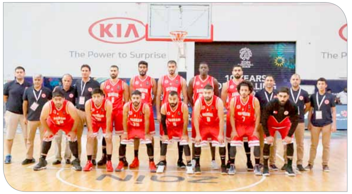
منتخبنا الوطني لكرة السلة للرجال