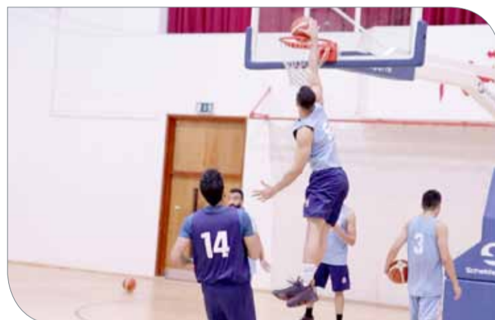
لقطة من التدريبات

للمنتخب في جميع مراحل الاعداد، وأضاف: نبحث عن العلامة الكاملة ونثق بإمكانات لاعبيننا وقدرتهم على مجاراة المنتخبات المنافسة وتحقيق الفوز عليهم والتأهل إلى المرحلة الثانية من التصفيات، وتابع: الجهاز الفني والإداري قاما بواجبهما على أكل وجه والدور الباقي على اللاعبين المطالبين بالتركيز العال وبذل قصارى جهدهم في المباريات.