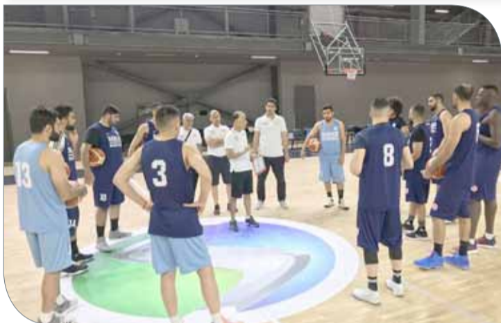
جانب من تدريبات منتخبنا في معسكر تركيا

حصلت قناة البحرين الرياضية على حقوق نقل مباريات مرحلة الإياب من التصفيات الآسيوية المؤهلة إلى كأس آسيا 2021 والتي تقام في مدينة دبي خلال الفترة ما بين 27 وحتى 30 يونيو الحالي بمشاركة منتخبات البحرين والإمارات والسعودية وعمان.