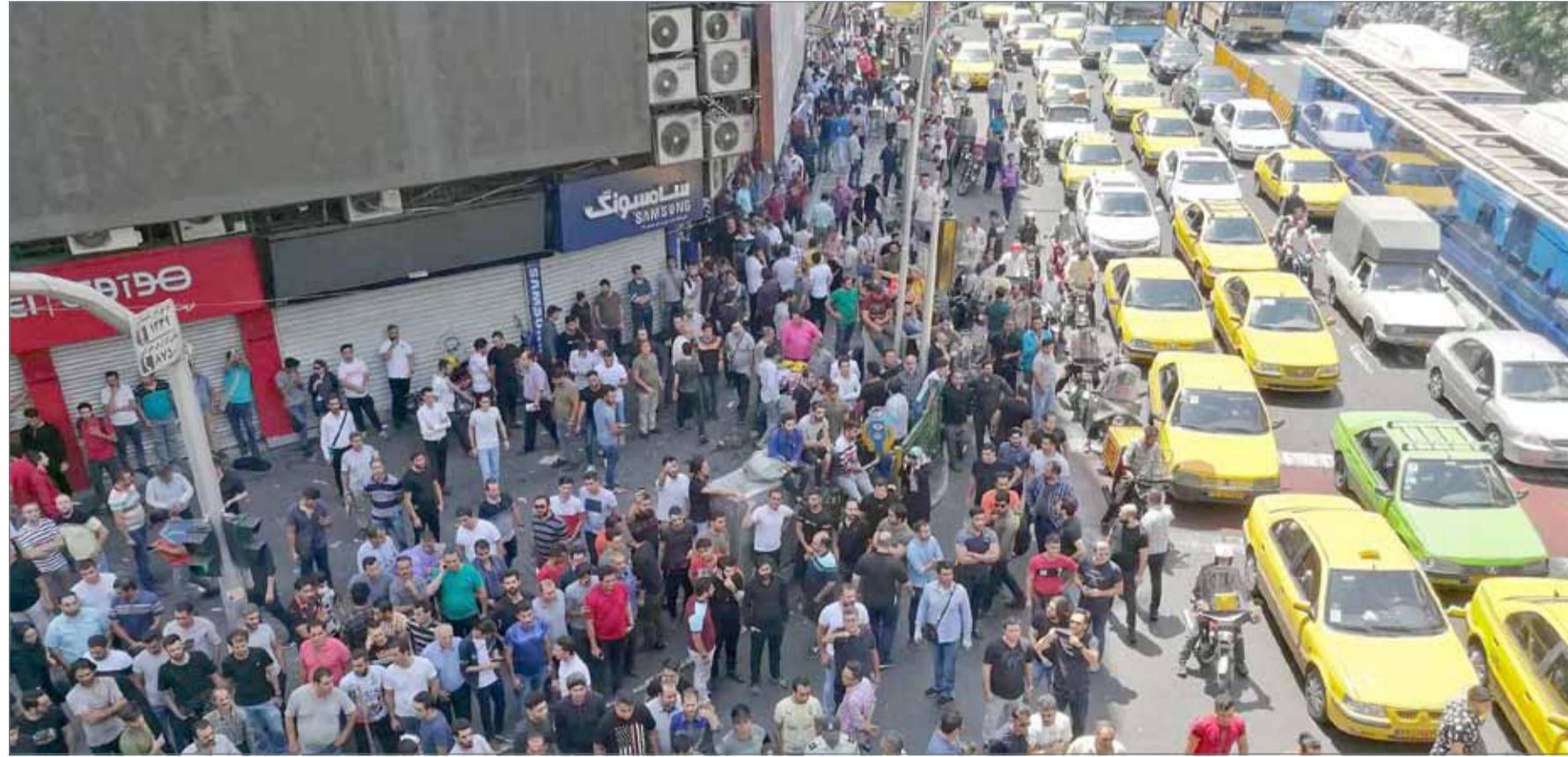
• جانب من مظاهرة التجار في طهران احتجاجاً على ارتفاع الأسعار وانخفاض قيمة الريال

يستمر تدفق المواد الإغاثية والأولية والطبية على المناطق اليمنية، في إطار الجسر الجوي والبحري والبحري للتحالف العربي الداعم للثورة في اليمن. وأقام التحالف، الذي تقوده السعودية، هذا الجسر ضمن عملية إنسانية طارئة تزامنت مع العمليات العسكرية الرامية لدرء ميليشيات الحوثي الانقلابية على الساحل الغربي. وتستمر دول التحالف في دعم سكان مناطق الساحل الغربي الأكثر احتياجاً في اليمن، وذلك من خلال تقديم مساعدات إنسانية وإغاثية. وتسعى هذه الإجراءات للتخفيف من معاناة أهالي المناطق التي كانت تسيطر عليها ميليشيات الحوثي، ونجحت في تحريرها القوات اليمنية المشتركة بدعم من التحالف. ورصدت كاميرا "سكاى نيوز عربية" استمرار وصول شحنات الإغاثية إلى المناطق الأكثر تضرراً من جراء ممارسات ميليشيات إيران باليمن. وينتظر آلاف اليمنيين الدعم الإغاثي ليخفف، ولو قليلاً، من معاناتهم، من انتهاكات الحوثيين الذين نقلوا الخراب ولا شيء غير ه إلى مناطقهم.