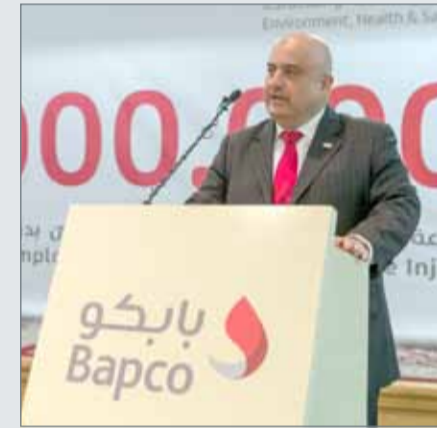
● الرئيس التنفيذي يلقي كلمته

الالتزام المتواصل من قبل جميع العاملين بتطبيق إجراءات وسياسات وأنظمة السلامة المعمول بها في الشركة، لقد بذل كل فرد منكم قصارى جهده في إطار الالتزام بالعمل الجماعي من أجل تحقيق هذا الإنجاز الذي نتفعل به معكم اليوم. ولنتابع جهودنا لتحقيق هدفنا التالي وهو 25 مليون ساعة