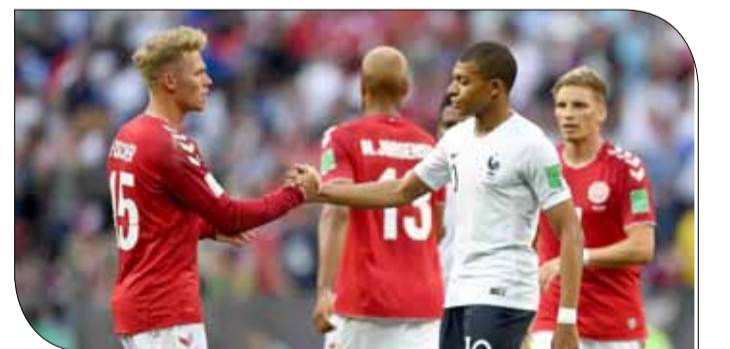
الدمارك تراقق فرنسا لدور ال 16

♦ وكالات: بفضل أول تعادل سلبي في منافسات كأس العالم روسيا 2018، نجح المنتخب الدنماركي بالتأهل إلى دور الستة عشر؛ لينضم إلى خصمه المنتخب الفرنسي متصدر المجموعة الثالثة، بينما اكتفى ممثلو اسكندنافيا بمركز الوصيف. بالنظر إلى أن تشكيلة الفريقين الأساسية شهدت 10 تغييرات، فقد بدا واضحا عدم الانسجام في أداء طرفي اللقاء. كان كريستيان اريكسن هو الأقرب لهزّ شبك المنتخب الفرنسي في الشوط الأول ومثله في الثاني. وقد تصدّى له في الفرصة أكبر لاعب فرنسي يخوض مباراته الأولى في المنتخب الفرنسي (33 عاما) - ولو كاس هيرنانديز. وبعد الإستراحة، سنحت مجددا فرصة ذهبية أمام صاحب القميص رقم 10 من هجمة مبنية بشكل ممتاز. أما المنتخب الفرنسي، فقدّم أداءً باهتا إجمالا، رغم مشاركة أنطوان جريزمان في التشكيلة الرئيسية.