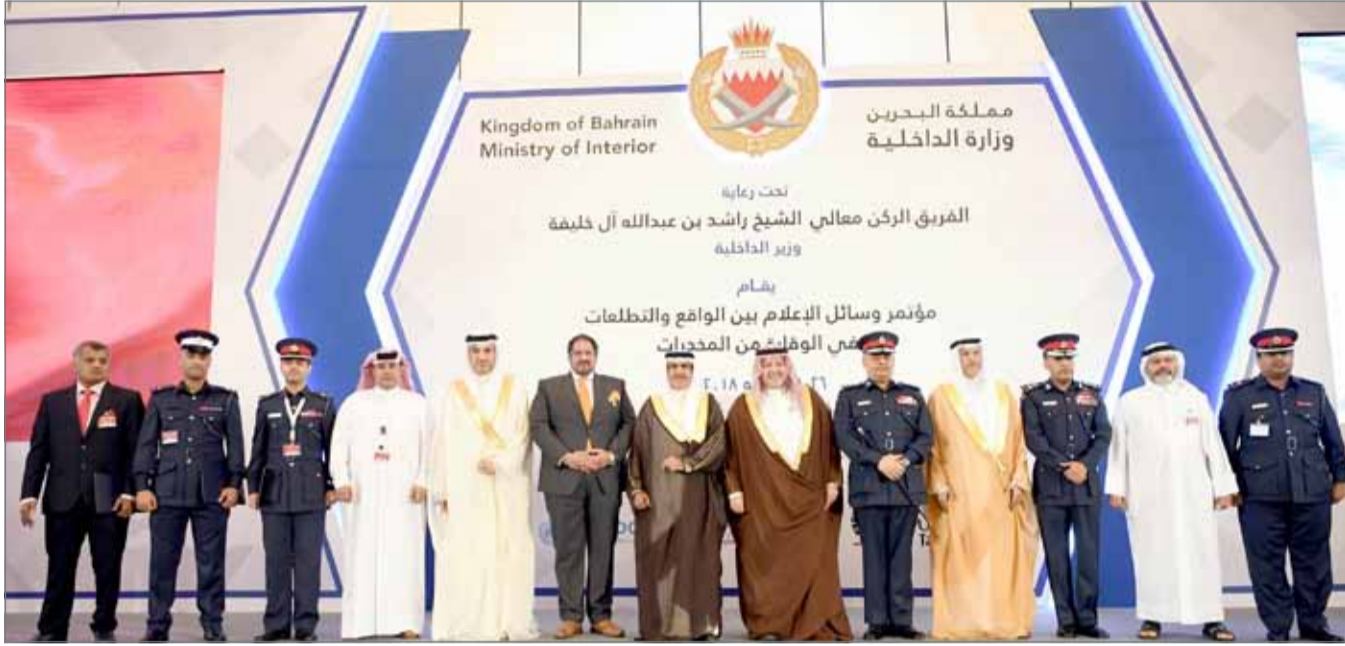
وزير الداخلية يحضر فعاليات اليوم الأخير من المؤتمر

وأكد الرميحي أن البحرين تحرص على احتضان وتنظيم والمشاركة في مثل تلك المؤتمرات المهمة، فضلاً عن مشاركتها في عضوية المنظمات الدولية المعنية بمشكلة المخدرات، فليس ذلك إلا ترجمة واضحة عن استشارتها بخبرة تلك المشكلة وإيمانها العميق بأن مشكلة المخدرات ليست مشكلة محلية فحسب، بل هي مشكلة عالمية الأبعاد والأثار، وأن خطرها يهدد المجتمع الإنساني كله، وكذلك إيمانها الصادق بأن خطر المخدرات يتجاوز الحدود الإقليمية لأي دولة ليهدم المجتمع الإنساني بأكمله، لذلك كان تعاون الشعوب والأمم والدول لمجابهة تلك الآفة هو بمثابة صمام الأمن والاستقرار لتلك الدول، معرباً عن جل شكره وتقديره لوزير الداخلية لرعايته المؤتمر.