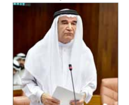
• منصور سرحان

وأضاف: تصل سفينتنا اليوم إلى مرساها الأخير بعد تلك الرحلة المباركة التي قطعناها، محملة بثمار جهد استمر زهاء أربع سنوات غطى العديد من المراسيم بقوانين، ومشروعات القوانين، والاقتراحات بقوانين وما كان لنا أن نصل إلى محطاتنا الأخيرة محافظين على ما جنيناه طوال تلك الفترة بالذم مما واجه سفينتنا من أمواج ترتفع حدها حيناً وتخفض حيناً آخر، لولا حكمة رمان سفينتنا علي الصالح الذي كان يدير دفتها بجدارة تامة، منطلقاً من خبرة طويلة في مجال العمل التشريعي، وكان كما عهدناه يتنعم بالحكمة، وبالصبر وسعة الصدر، فهو الحليم في تصرفاته والمتسامح في ردود أفعاله، وقد زان تواضعه الجم على الرغم من علو شأنه وسمو مكانته، فكان لنا أذاً وصديقاً قبل أن يكون لنا رئيساً، فاليك يا صاحب المعالي كل شكرنا وتقديرنا وعظيم امتناننا.