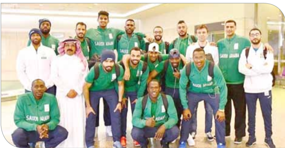
منتخب السعودية لكرة السلة