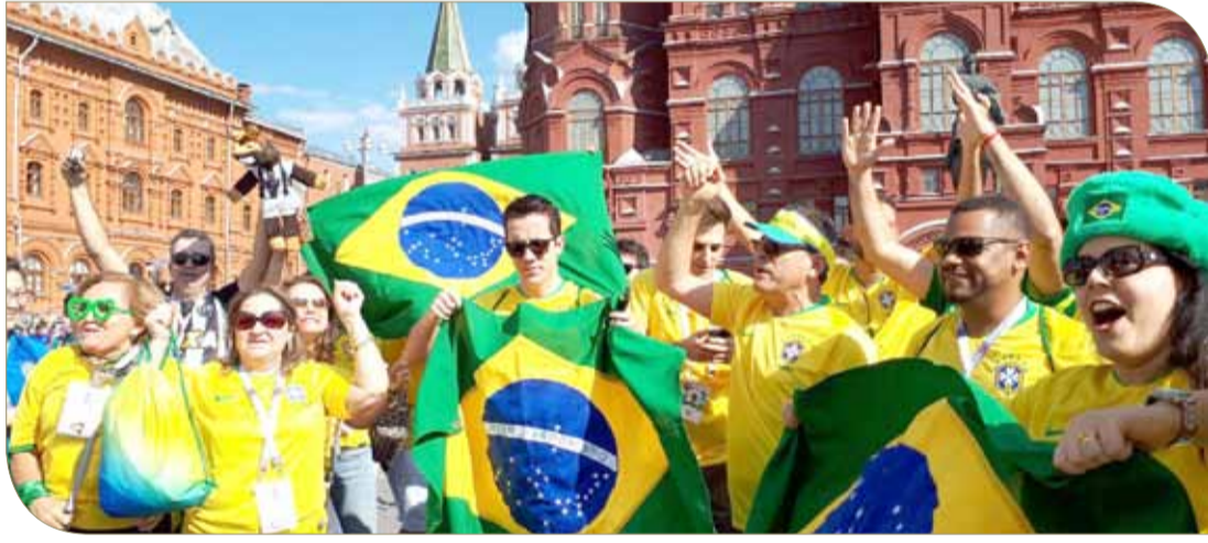
من الاحتفالات البرازيلية

وفي المقابل، بدأ خروج المانشافت مبكرا أمرا سيئا لعدد من مشجعي السامبا الذين كانوا يريدون مواجهة المنتخب الألماني في الموندريال الحالي للثأر منه.