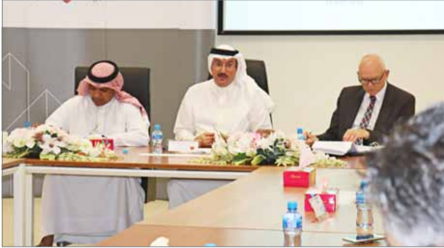
• الشيخ محمد بن خليفة بن عبدالله يجتمع بأعضاء جمعية التطوير العقاري البحرينية برئاسة عارف هجرس

47 مطوراً عقارياً، و 12 رخصة للبحث الميداني، ومثل هذه البيانات متاحة اليوم للجمع عبر الموقع الإلكتروني الخاص بمؤسسة التنظيم العقاري.