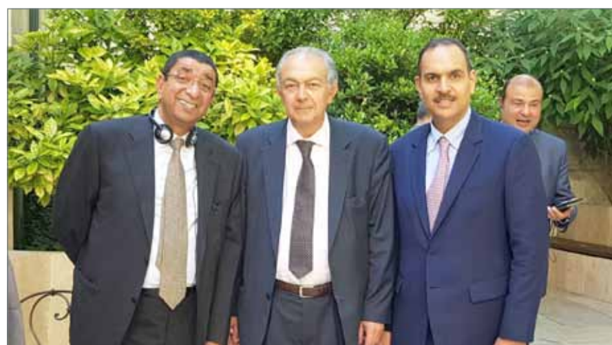
● ناس لدى مشاركته في الاجتماع

وإقرار النتائج، كما تم انتخاب جزئي لأعضاء جدد في مجلس الإدارة. إلى جانب ذلك تم التطرق إلى استراتيجية وخطة العمل للغرفة التجارية العربية الفرنسية في الفترة المقبلة، واستعراض أبرز أنشطة العام الجاري 2018، مع التأكيد على أهمية تضافر الجهود المشتركة؛ لتعزيز وزيادة حجم التبادلات التجارية بين الدول العربية وفرنسا.