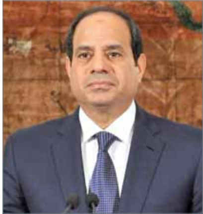
• رئيس جمهورية مصر العربية