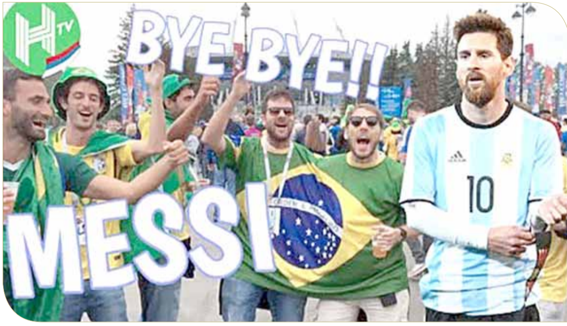
جمهور البرازيل تتفنه في ميسي

البرازيلي، الذي التقى نظيره البرازيلي على استاد أكرت أمس، بدأوا في استغلال نفس الأغنية في تشجيعهم ضد السامبا، حيث استبدلوا اسم ميسي باللاعب نيمار، وهكذا مع باقي الأسماء في الأغنية. وفي داخل محطات مترو الأنفاق بموسكو، تحولت الأغنية إلى احتفال هائل من أنصار السامبا الذين حمل عدد كبير منهم، نسخ مقلدة من كأس العالم، ليؤكدوا أنهم لن يعودوا إلى بلادهم إلا بالنسخة الأصلية بعد التخلص من منافسيهم تباعاً.