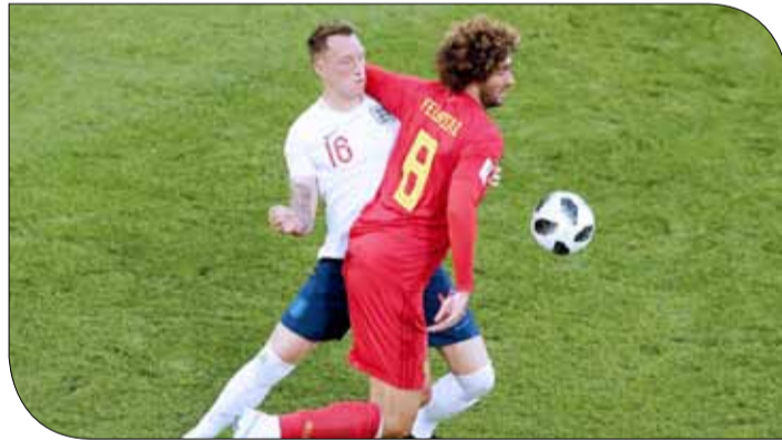
من لقاء بلجيكا وإنجلترا

♦ وكالات: يعد النجم البرتغالي رونالدو من أكثر نجوم كرة القدم "اكتمالا" من الناحية الفنية والجسدية، ويرجع خبراء اللعبة الأمر لانضباطه التام في التدريب والغذاء خارج الملعب. إذ نشر موقع "بزنس إنسايدر" تقاليد قائد البرتغال، والنظام الذي يتبعه أيام المباريات المهمة. ويقول الموقع: "بعد النوم لمدة 8 ساعات، يحرص رونالدو على شرب كميات كبيرة من الماء خلال يوم المباراة؛ للحفاظ على ترطيب الجسم". ويتناول وجبات خفيفة أساسها البروتين والقمح يوم المباراة، كما يستمع للموسيقى قبل دخول الملعب. كما أنه "ينظر لنفسه في المرآة ويبدأ بتحفيز نفسه بعد ارتداء قميص وحذاء اللعب". أما بعد المباراة، فيفضل تناول وجبة في الملعب قبل المغادرة، عادة ما تتكون من البيتزا والفواكه، قبل أن يأخذ حماماً بارداً وآخر ساخناً، ثم يسبح لمدة 20 دقيقة.