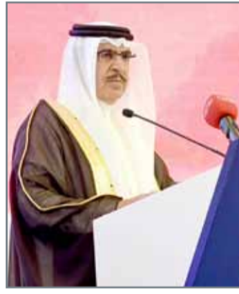
• وزير الداخلية يلقي كلمته

أوصى مؤتمر وسائل الإعلام بين الواقع والتطلعات في الوقاية من المخدرات بضرورة "بناء استراتيجية إعلامية جديدة تواكب المتغيرات المتسارعة في وسائل الإعلام التقليدية والحديثة لاسيما وسائل التواصل الاجتماعي". وقال وزير الداخلية الفريق الركن الشيخ راشد بن عبدالله آل خليفة في كلمة أمام المشاركين في المؤتمر أمس "نرى اليوم أشكالا مختلفة من المخدرات تصل إلى البلدان وعبر الحدود بأساليب مختلفة (...). وتستهدف فئة الشباب تحديداً".