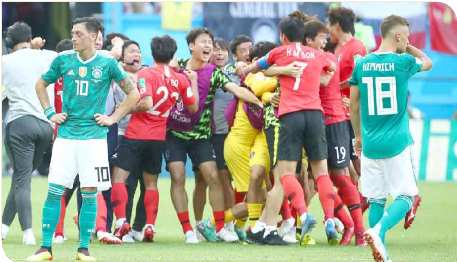
فرحة كورية وحسرة ألمانية

وكانت كوريا الجنوبية بحاجة للفوز بفارق هدفين على الأقل للحفاظ على آمالها في التأهل من المجموعة السادسة، لكن الفوز المفاجئ للسويد 3 - 0 على المكسيك أنهى مشاركة كوريا وألمانيا في البطولة.