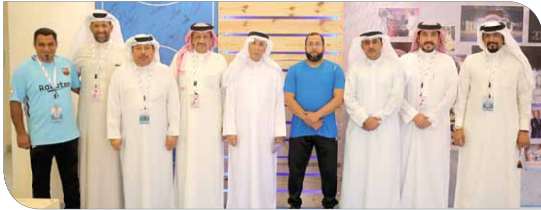
كبار الضيوف مع اللجنة المنظمة

للشباب والرياضة رئيس الاتحاد البحريني لألعاب القوى كما اشتمل الكتيب على كلمة لسمو الشيخ خالد بن حمد آل خليفة حملت عنوان "ملتقى رياضي يرتقي بالشباب" حيث اشاد سموه فيها بالمشاركة الكبيرة والواسعة في الدوري وحرص كافة الجهات على العمل بروح الفريق الواحد من أجل الوصول الى رسالة وقيم واهداف الدوري بالإضافة الى مبادرات سمو الشيخ خالد بن حمد.