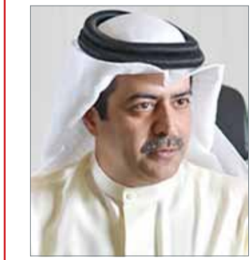
• أسامة العيسى

المنامة - بنا: حققت مملكة البحرين إنجازاً نوعياً غير مسبوق في مكافحة الاتجار بالأشخاص لتحل في الفئة الأولى (TIER 1) ضمن فئات تصنيف الدول الخاص بمكافحة الاتجار بالأشخاص الذي تعلنه سنوياً وزارة الخارجية الأميركية. وأثبتت الخارجية الأميركية التي أصدرت تقريرها مساء أمس على جهود المملكة في وضع الأطر القانونية لمكافحة الاتجار بالأشخاص ووضع الآليات المناسبة للتعامل مع أي حالات مشتبه بها. وأكد التقرير أن حكومة البحرين حققت الالتزام