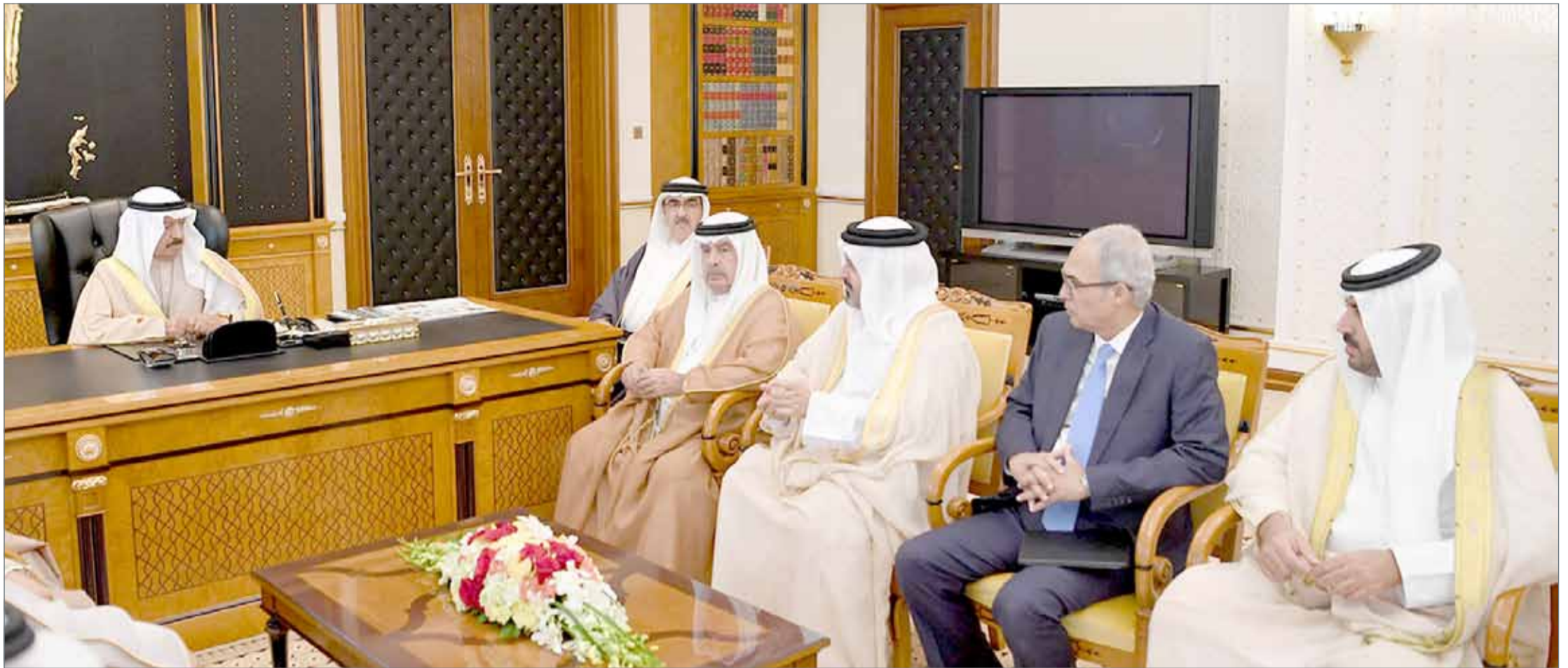
• سمو رئيس الوزراء يترأس اجتماع عمل لبحث الشأن الاقتصادي

• سموه اطلع على عرض من وزير المالية ومحافظ "المركزي" بشأن المستجدات