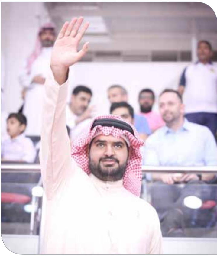
سمو الشيخ عيسى بن علي