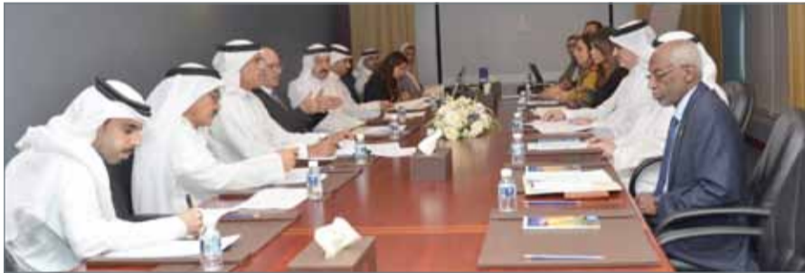
• وزير شؤون مجلس الوزراء يترأس الاجتماع

واسعة من المؤشرات والأهداف التنموية الوطنية التي حققتها مملكة البحرين، مؤكداً أن أهمية مشاركة البحرين في هذا الحدث الدولي المهم تأتي لكونه يوفر منبراً دولياً لإبراز جهود المملكة ومساهماتها في مجال التنمية المستدامة، كما أن تقديم التقرير سيكون إضافة جديدة لما حققته البحرين من إنجازات تنموية نالت تقدير المنظمات الدولية. ونوه إلى أنه تم تدشين موقع إلكتروني لتوثيق هذه الإنجاز سوف يتم تزويده بكل مؤشرات التنمية المستدامة في مملكة البحرين التي تتواءم مع أجندة وأهداف الأمم المتحدة للتنمية المستدامة 2030. كما تم خلال الاجتماع استعراض محتويات التقرير الطوعي ووضع الإطار العام للوقوف على ما يتضمنه من معلومات ومؤشرات، والاستماع إلى ملاحظات وملاحظات الجهات ذات العلاقة.