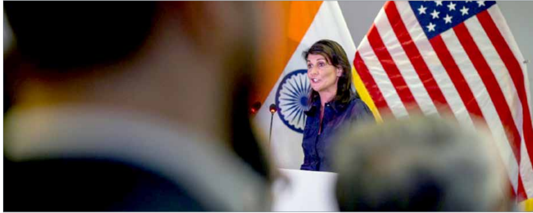
• سفيرة الولايات المتحدة في الأمم المتحدة نيكي هايلى

وأضاف: "المساعدات الإنسانية في الخطة العملية لتحرير الحديدة ومينائها من أولويات التحالف، الجانب الإنساني وكذلك حماية المدنيين". وتابع المسؤول العسكري: "الميليشيات عليها مسؤولية قانونية في تعطيل العمليات الإنسانية". وشدد المالكي على أن التحالف "لا يريد أن تستمر المدينة تحت سيطرة الحوثيين لعقد من الزمان". وختم: "إن لم تكن هناك حلول سياسية لا بد من عمل عسكري يتوافق مع القانون الدولي والإنساني، لتحرير المدينة وإعادتها لأحضان الشرعية".