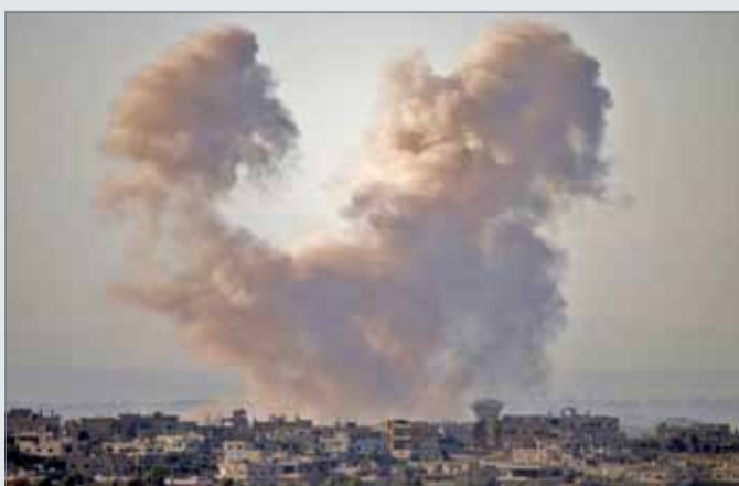
• دخان يتصاعد فوق درعا خلال غارات نفذتها القوات السورية أمس الأول

وحضت الأمم المتحدة بدورها، أمس، عمان على فتح الحدود. وقال رئيس مجموعة الأمم المتحدة للعمل