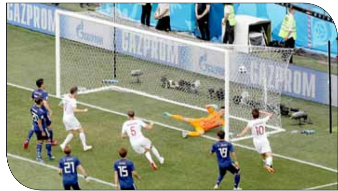
هدف بولندا في مرمى اليابان

♦ وكالات: ضمن المنتخب الياباني التأهل إلى دور الـ 16 بمونديال روسيا، رغم الخسارة بهدف دون رد أمام نظيره البولندي، في المباراة التي جمعتها أمس الخميس على ملعب "فولجوجراد أرينا"، ضمن منافسات الجولة الختامية بدور المجموعات. وجاء هدف منتخب بولندا عن طريق يان بيدناريك