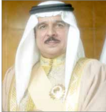
• جلالة الملك

مصر العربية تجاه مملكة البحرين وقضايا الأمة العربية، منوها بجلالته إلى أن مصر الشقيقة تمثل عمقا استراتيجيا للأمة العربية. وأعرب جلالتة عن إعجابها بما تشهده جمهورية مصر العربية من تقدم وتطور بفضل قيادة الرئيس السيسي الحكيمة، ومرعبا بجلالته عن أصدق تمنياته لمصر قيادة وشعبا بمزيد من التقدم والازدهار ومواصلة دورها الاستراتيجي والريادي في المنطقة نصرًا لقضايا أمتينا العربية والإسلامية.