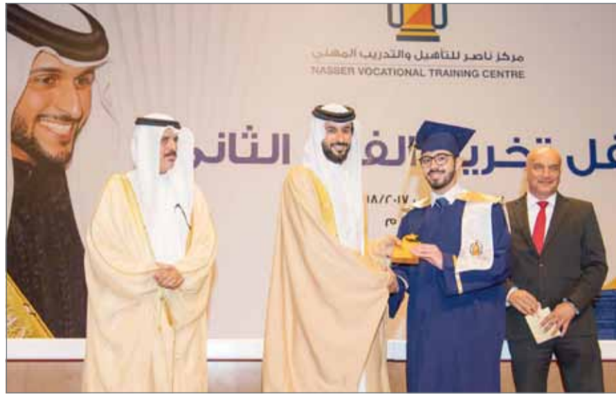
• سمو الشيخ ناصر بن حمد يكرم الفوج الثاني من طلبة المركز

والمهنية، من خلال توفير مسار تعليم مهني بديل للشباب البحريني وتطوير شخصية الطالب؛ تمهيدا لاستكمال دراستهم أو الانخراط في سوق العمل، مشيراً سموه إلى أن مركز ناصر تمكن من تعزيز مفهوم قطاع التعليم المهني والفني وتمكن من استقطاب عدد كبير من الشباب لتدريبهم وتأهيلهم. وهنا سمو الشيخ ناصر بن حمد آل خليفة الطلاب الخريجين وأولياء أمورهم بهذا النجاح الذي حققوه، متمنياً لهم التوفيق والنجاح في المرحلة المقبلة ومشيداً في ذات الوقت بجهود وزارة التربية والتعليم. ولائحة الشرف وخلال حفل التخرج ألقى وزير التربية والتعليم كلمة رحب فيها بسمو الشيخ ناصر بن حمد آل خليفة في هذا الاحتفال، الذي يأتي تأكيداً على نجاح المركز في تحقيق الأهداف التي أنشئ من أجلها، ضمن الرؤى السامية لجلالة الملك، إذ يؤكد جلالته دائماً ضرورة العناية بالشباب البحريني، والإحاطة بهم في مختلف جوانب الحياة، بما يؤهلهم ليكونوا مساهمين بشكل فعال في المسيرة التنموية