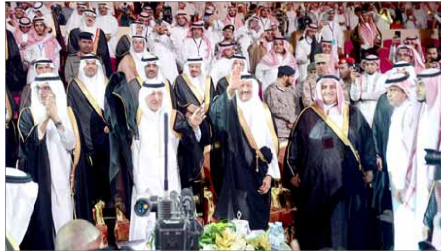
• وزير الخارجية مشاركاً في الافتتاح

العربية السعودية مثل: معرض القطع الفائزة بجوائز ومسابقات سوق عكاظ، ومعرض الخط العربي، ومعرض الفنون التشكيلية، عروض مسابقات سوق عكاظ المسرحية، معرض ألوان عكاظ والتصوير الضوئي، وغيرها من البرامج والعروض.