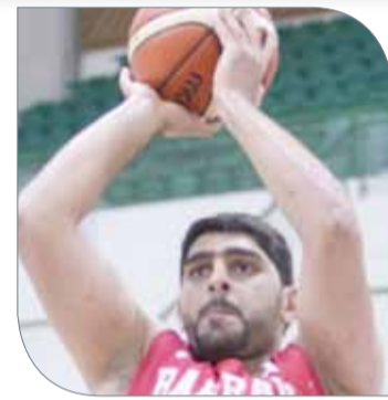
عليه شكر الله