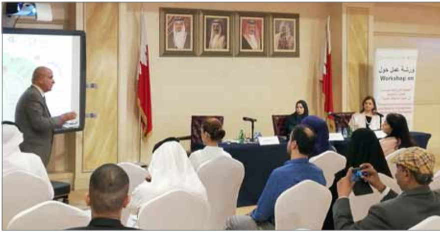
● جانب من ورشة العمل أمس

أو الاستدامة أو المسؤولية المجتمعية وغيرها. وأبلفت العلوي الصحافيين أن دول الخليج عازمة على التوسع في إطلاق المواصفات الموحدة الخليجية وذلك تنفيذاً للقرار الذي صدر قبل نحو 14 عاماً في هذا التوجه، والذي جعل التعامل مع مسألة المواصفات يتم عبر بوابة واحدة أو نقطة الدخول الواحدة من أي دول الخليج، إذ تم إصدار عدد من اللوائح للسيارات والإطارات والأجهزة الكهربائية والألعاب إذ سيتم زيادة هذه المنتجات عبر تبنى لوائح فنية موحدة. وأضافت أنه بنهاية العام الجاري سيكون هناك تفعيل أكبر في مسألة نقطة العبور الواحدة للمنتجات الحاصلة على شهادة المواصفات الخليجية الموحدة. وتابعت “أن هناك دراسة تجري عبر هيئة التقييس الخليجية إذ تم انتداب خبير من اليونيدو لمعرفة سبب عدم استفادة الشركات من الحصول على شهادات المواصفات الدولية والتي تعتبر شهادة عبور للمنتجات الوطنية للعالم”.