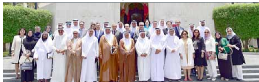
• صورة جماعية للشوريين بعد الجلسة الأخيرة

مستقبل أبنائنا". واختتم الصالح كلمته بشكر الصحافة ومندوبيها الذين تولوا تغطية أعمال المجلس ولجانه، والطاقت التلفزيوني والإذاعي الذي تولى تغطية وقائع اجتماعات المجلس طوال فترة دور الانعقاد، ولرجال أمن المجلس على جهودهم الكبيرة في حماية هذا الصرح الديمقراطي.