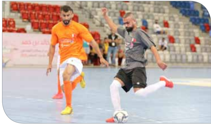
من لقاء رأس الرمان والرفاع الشرقي