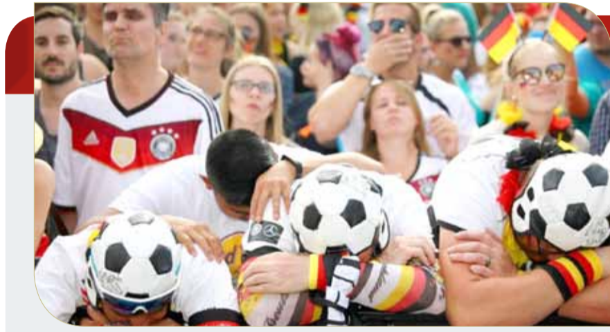
الحزن يخيم على الجماهير الألمانية

مع إيطاليا وفرنسا والبرتغال وهولندا وبولندا والدنمرك والسويد وكرواتيا وإسبانيا وسنكون بطل العالم بعد ذلك إلى الأبد".