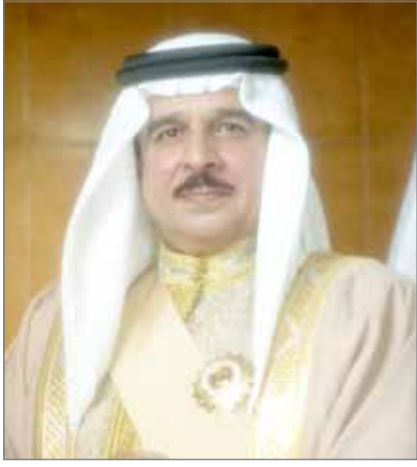
• جلالة الملك

دولية نفتخر اليوم بتحقيقها متقدمين بها على الكثير من الدول التي سبقت تجربتها وهو إنجاز يسجل اليوم بتظافر جهات كثيرة أكدت عطائها السخي من أجل مملكة البحرين ورفعة شأنها. وبهذه المناسبة العزيزة يثرفني أن أعبر لجلالتكم عن أخلص آيات الشكر و العرفان على الثقة الغالية التي شرفتموني بها، معاهداً لجلالتكم على مواصلة العطاء والجهد في خدمة رؤى وتوجيهات جلالتكم نحو كل ما فيه ازدهار ونماء هذا الوطن العزيز ضارعاً إلى المولى العزيز القدير أن يمد لجلالتكم بموفور الصحة والعافية والعمر المديد لمواصلة المسيرة المباركة.