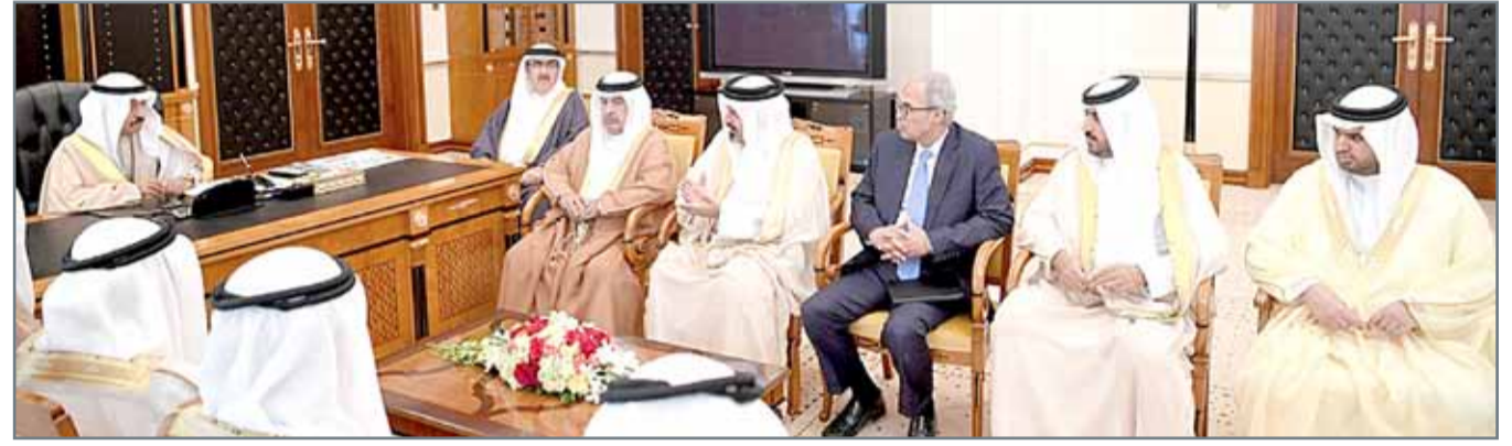
• سمو رئيس الوزراء يترأس اجتماع عمل لبحث الشأن الاقتصادي

وجه سموه لجنة مختصة بوضع تصورات تكفل تحقيق التوازن المالي على المدى القصير والمتوسط والبعيد مع الحرص بعدم إثقال كاهل المواطنين وحفظ ما تحقق لهم من تنمية ومكتسبات، وتكون برئاسة نائب رئيس مجلس الوزراء رئيس اللجنة الوزارية للشؤون المالية وضبط الإنفاق وعضوية وزير المالية ومحافظ مصرف البحرين المركزي.