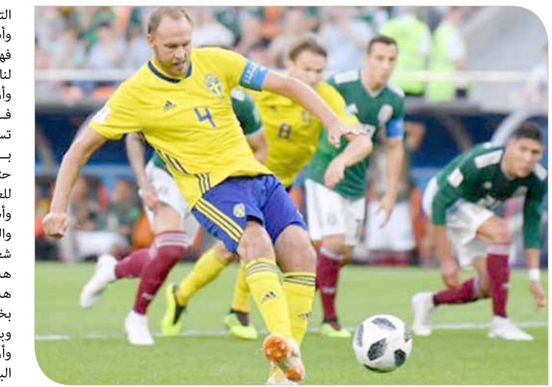
جرانكفيسست خلال مباراة المكسيك

التي نفذها". وأضاف "لهذا السبب هو قائدنا. فهو قادر على فعل هذه الأشياء لنا. إنه مهم للغاية للفريق". وأوضح الظهير الأيسر للفريق فيردير برينز الألماني عقب تسجيله هدفه الأول لمنتخب بلاده في أكبر مباراة بمسيرته حتى الآن "أعذر، أنا فقط للغاية". وأضاف "لطالما حلمت بهذا الشيء الغريب هو وجود شعور راودني بأنني سأسجل في هذا المونديال. ولكن فوق كل هذا، فخور للفريق. لقد التزمتنا بخطة اللعب بنسبة 100%، وبالفعل نستحق التأهل". وأردف "نعمل بكد لبعضنا البعض، وليس فقط من أجل ال11 لاعباً المتواجدين بالملاعب. كل لاعب يجلس على مقاعد البدلاء جاهز للقيام بالجزء الخاص به".