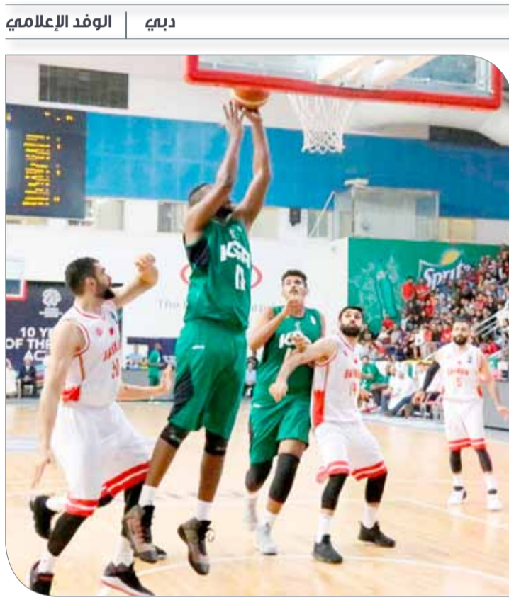
من لقاء الذهاب بين البحرين والسعودية