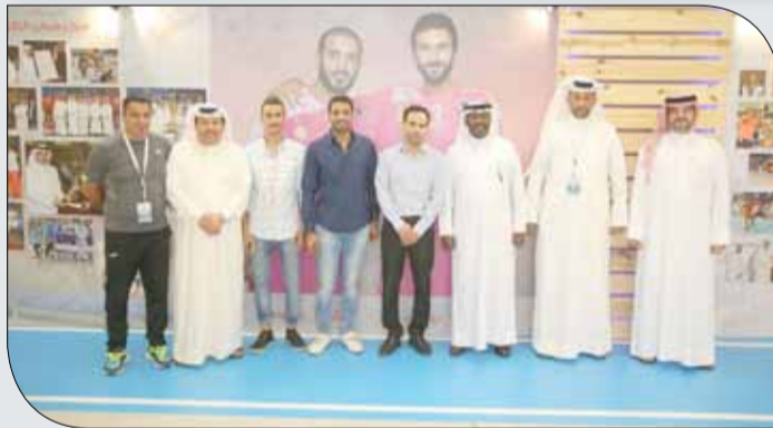
كبار الضيوف مع اللجنة المنظمة

لجنة الإعلام والاتصال | دوري خالد بن حمد