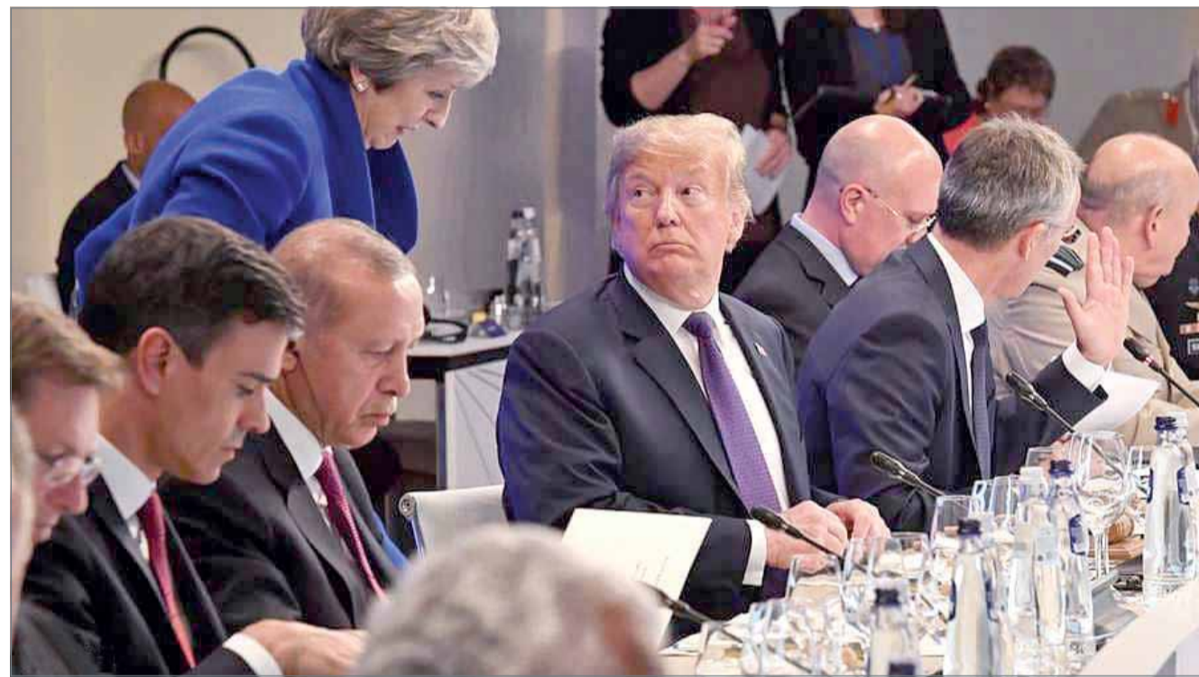
ترامب لا يريد إعفاء شركات حلفائه من العقوبات في إيران

أعلن رئيس منظمة الطاقة الذرية الإيرانية علي أكبر صالح، أمس الأربعاء، أن إيران بنت مصنعا لإنتاج أجزاء الدوران اللازمة لتشغيل ما يصل إلى 60 وحدة طرد مركزي يومية، في تصعيد لمواجهة مع واشنطن بشأن نشاطها النووي. وجاء الإعلان بعد