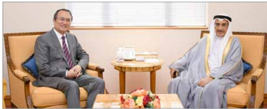
• الشيخ خالد بن عبد الله مستقبلاً سفير جمهورية الصين الشعبية

العربي الصيني التي أقيمت مؤخراً في بكين، التي تزامنت مع توقيع الطرفين على اتفاقيات للإعفاء المتبادل من التأشيرة لحملة الجوازات الدبلوماسية والخدمة والخاصة، والتوقيع على مذكرة تفاهم بشأن التعاون في إطار الحزام الاقتصادي لطريق الحرير ومبادرة طريق الحرير البحري في القرن الحادي والعشرين.