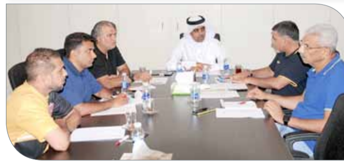
جانبا من الاجتماع

للمعمل وبشكل دوري، موضحاً أن التركيز سيكون بشكل كبير على فئات الأكاديمية والشباب والناشئين، وذكر أن البرنامج يتضمن أبرز الأهداف التي وضعت من أجلها المنهجية وتمثل في وصول لاعبي الفئات إلى مستويات فنية مرتفعة تمكن من استقطاب لاعبين على مستوى عالٍ للمنتخبات الوطنية والأندية، بالإضافة إلى العمل على إبراز أجيال مميزة للاعبين الكرة البحرينية وتطوير المدرب الوطني. وبين أن اللجنة ستحرص من خلال هذه الأهداف إلى بيان أهمية تواجد المدير الفني للفئات العمرية ودوره في التطوير وعملية الارتقاء بالعمل الفني بما يعكس إيجاباً على كرة القدم البحرينية.