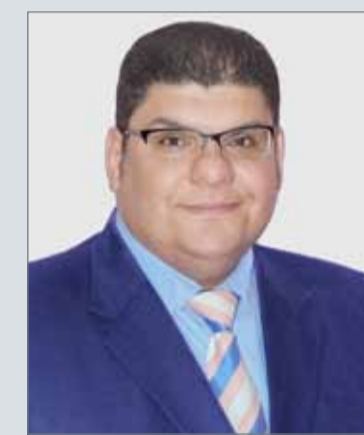
• علي الحجري

أعلن الباحث الفلكي علي الحجري أن سماء البحرين سوف تشهد ظاهرة أطول خسوف كلي للقمر لهذا القرن أي من العام 2001 إلى 2100 ميلادي ابتداء من مساء يوم الجمعة، وأول ساعات صباح يوم السبت الموافق 27 و28 يوليو الجاري، والفترة الإجمالية لطول الخسوف بمختلف مراحله المنظورة وغير المنظورة 6 ساعات و17 دقيقة، ومنها 3 ساعات و55 دقيقة للخسوف المنظور في البحرين.