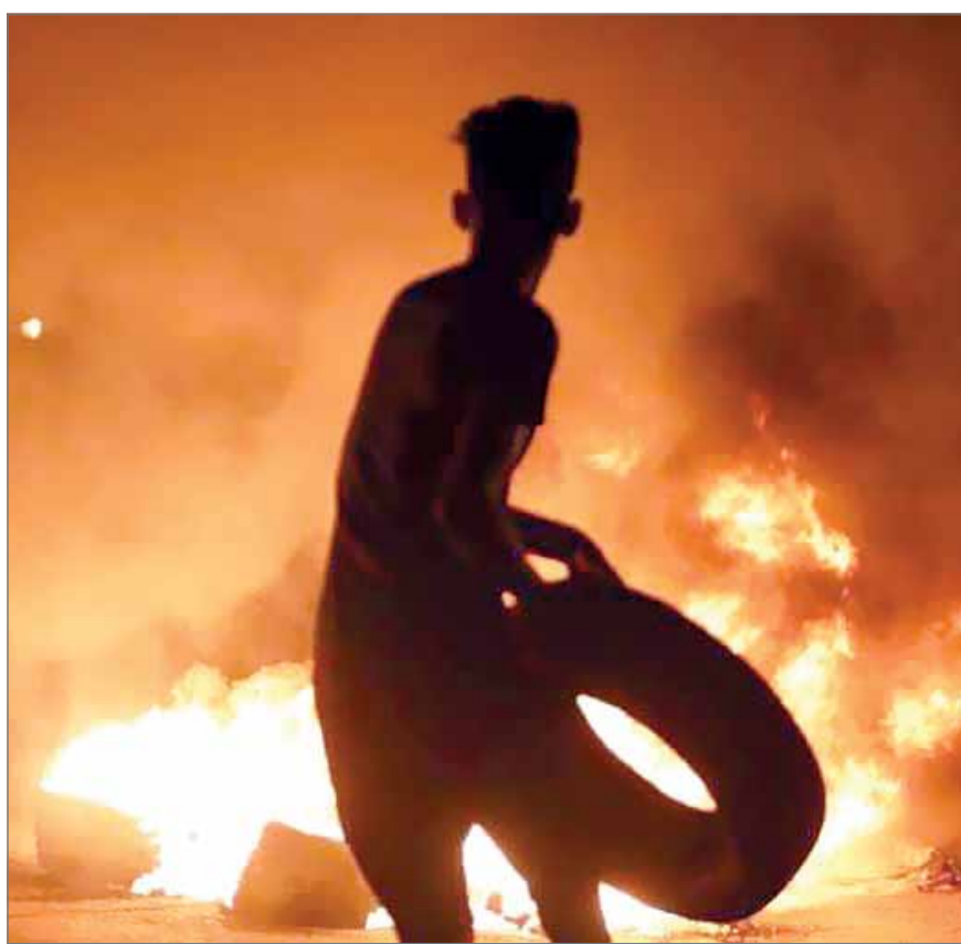
جانب من الاحتجاجات على قطع إيران الكهرباء عن البصرة