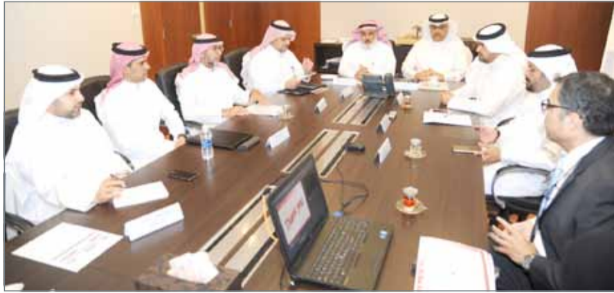
• وكيل شؤون الأشغال لدى لقائه وفد الصندوق السعودي للتنمية

تصاميم تطوير شبكة الطرق الخارجية من وإلى مدينة الملك عبدالله الطبية. وخلال الاجتماع تباحث الطرفان البحريني والسعودي في الجوانب المرتبطة بتطوير تقاطع شارع الزلاق وشارع خليج البحرين، تطوير شبكة الطرق الخارجية وشبكة تصريف مياه الأمطار، كما تمت مناقشة المخطط العام ومكونات المدينة الرياضية التي ستشمل المسرح المفتوح، مجمع المسابح وصالات الألعاب الفردية، الصالة متعددة الاستخدامات، الملاعب الخارجية ومضمار ألعاب القوى، الاستاد الرياضي، فندق شقق فندقية (خارج نطاق المشروع)، مركز المعارض والمؤتمرات (خارج نطاق المشروع)، مجمع تجاري (خارج نطاق المشروع).