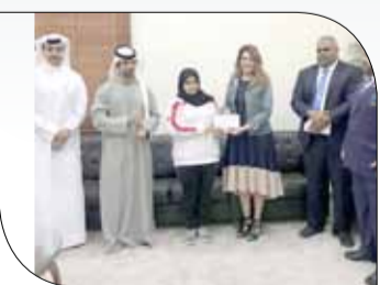
جانبا من التكريم

◆ حرص الاتحاد البحريني لرفع الأثقال بتكريم اللاعبين المتفوقين والحاصلين على نتائج دراسية عالية للسنة الدراسية الماضية بحضور أولياء أمورهم، وذلك مساء يوم الثلاثاء الماضي الموافق 17 من شهر يوليو الجاري