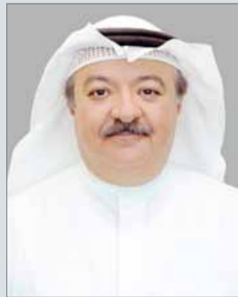
• الشيخ بدر بن خليفة

ثمارها خلال الفترة التجريبية التي قد بدأت لشهري (يونيو - يوليو) حسب المدة التجريبية المتفق عليها، التي كان من المتوقع الحصول على ما يقارب من 150 معاملة يومية في مكاتب بريد البحرين المنتشرة في أنحاء المملكة بالمقابل حصلنا على 180 معاملة يومية أي نتيجة مبدئية محفزة فاقت معدل توقعاتنا، ومن جانب آخر فقد أثرت هذه الاتفاقية على الحركة البريدية اليومية.