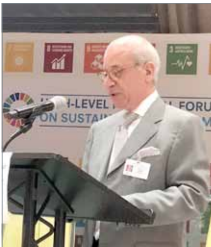
• محمد المطوع

وأعرب وزير شؤون مجلس الوزراء في ختام كلمته عن تطمح مملكة البحرين إلى مواصلة المشاركة في أعماله المنتدى مستقبلا، لما يمثله من مبادرة ناجحة في حشد جهود المجتمع الدولي نحو تحقيق أهداف التنمية المستدامة.