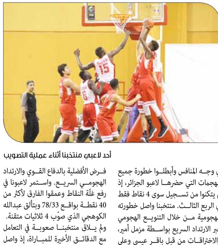
أحد لاعبي منتخبنا أثناء عملية التصويب