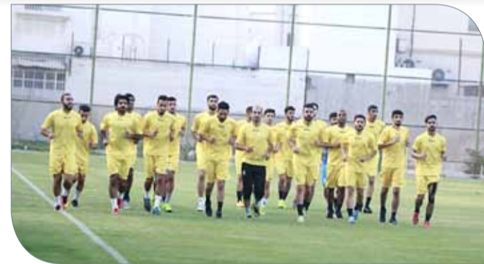
من تدريبات الأهلي

المملكة العربية السعودية منتصف أغسطس، تهيئاً لخوض مبارتيين وديتين، وذلك أمام فريقي الاتفاق والنهضة السعوديين يوم 14 و19، معتبراً أنهما فرصة جيدة للاحتكاك ومتابعة مستوى اللاعبين عن كثب،