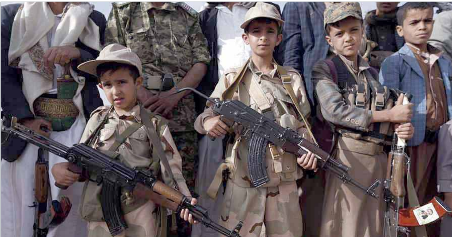
• أطفال مسلحون في صفوف ميليشيات الحوثي

وقعت السعودية والكويت، أمس الأربعاء، على محضر إنشاء مجلس تنسيقي كإطار عام يندرج تحت مظلة جميع مجالات التعاون والعمل المشترك بين البلدين، خلال جلسة مباحثات رسمية عقدت في الكويت. ووقع الاتفاقية عن الجانب الكويتي رئيس مجلس الوزراء بالإبارة ووزير الخارجية صباح خالد الصباح، ونظيره السعودي عادل الجبير في العاصمة الكويتية. وقال بيان صادر عن الخارجية الكويتية إن هذه الخطوة تأتي تنفيذاً لتوجيهات سمو أمير البلاد الشيخ صباح الأحمد الجابر الصباح وأخيه خادم الحرمين الشريفين عاهل المملكة العربية السعودية الشقيقة الملك سلمان بن عبدالعزيز آل سعود وحرصهما على مواصلة مسيرة الإخاء وتعزيز وشائج العلاقات التاريخية الوثيقة التي تربط بين البلدين. ونكر أن الوزيرين عقدا قبل التوقيع جلسة مباحثات رسمية تناولت سبل تعزيز وتوطيد العلاقات التاريخية المتينة التي تربط السعودية بالكويت في المجالات كافة وبحث آخر المستجدات على الساحتين الإقليمية والدولية والتطورات التي تشهدها المنطقة.