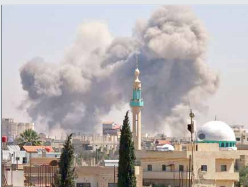
• أرشييفية لقصف على مدينة نوى السورية

قتل 12 مدنيا على الأقل في قصف ليبي استهدف مدينة نوى في ريف درعا الغربي، آخر المناطق التي لا تزال تحت سيطرة الفصائل المعارضة في المحافظة الجنوبية، بحسب ما أعلن المرصد السوري لحقوق الإنسان. وأوضح المرصد السوري أن "قصفاً جويًا وصاروخياً عنيفاً استهدف مدينة نوى في ريف درعا الغربي"، دون تحديد ما إذا كان مصدر القصف النظام السوري أم القوات الروسية. وإثر عملية عسكرية بدأتها في 19 يونيو ثم اتفاق تسوية أزمته روسيا مع فصائل معارضة، تمكنت قوات النظام من استعادة نحو 90% من محافظة درعا، ولا تزال بعض الفصائل تتواجد بشكل أساسي في ريفها الغربي. وتتضم بلدات الريف الغربي تباعا إلى الاتفاق، الذي ينص على دخول مؤسسات الدولة وتسليم المقاتلين أسلحتهم الثقيلة والمتوسطة. كما خرج بموجبها، الأحد، مئات المقاتلين والمدنيين من مدينة درعا، مركز المحافظة ومهد