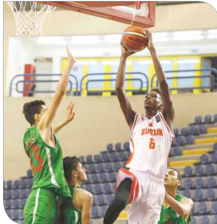
من لقاء منتخبنا أمس أمام الجزائر