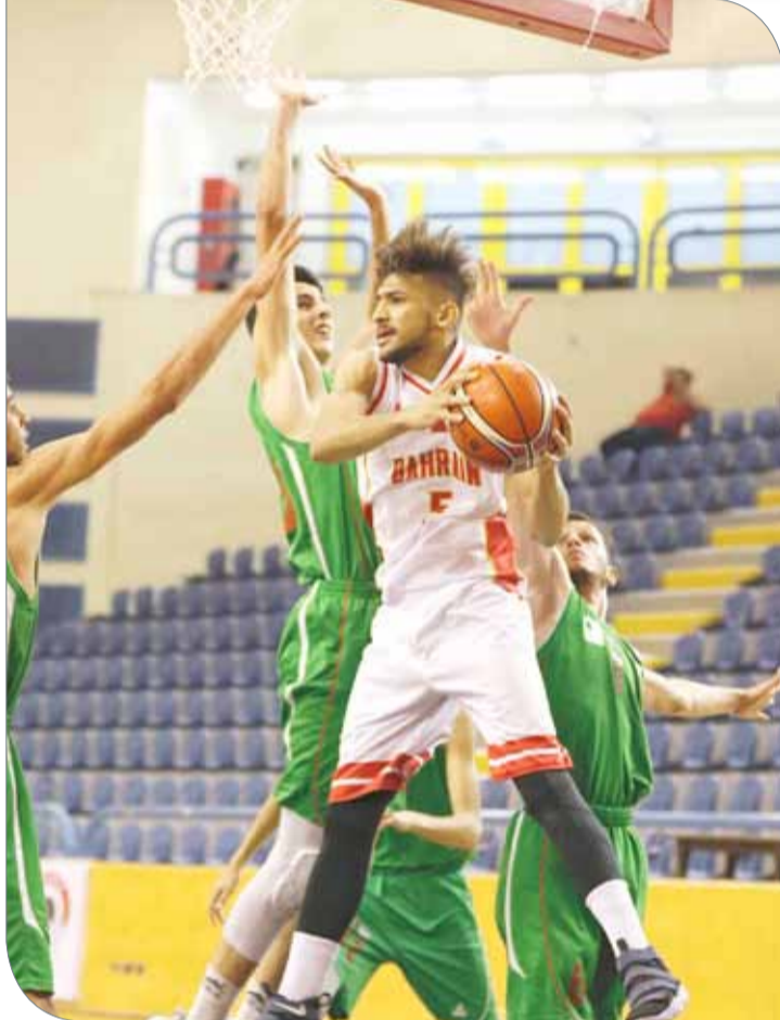
من لقاء منتخبنا أمس أمام الجزائر

ويتصدر منتخبنا قائمة أفضل قاطعي الكرات "ستيل" بواقع 18.67 للمباراة الواحدة. وبلغ معدل متابعات لاعبي منتخبنا للكرات المساقطة من الحلق 40.7%، فيما وصل معدل الارتداد الهجومي السريع "فاست بريك" بـ 26.7%، والنقاط المسجلة من الكرات المقطوعة بـ 26.3%، كما بلغت الأخطاء الشخصية على لاعبينا 60 خطأً.