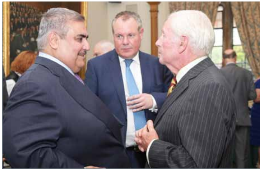
• وزير الخارجية لدى مشاركته في حفل الاستقبال السنوي لجمعية الصداقة البحرينية البريطانية

البريانية البريطانية تحظى بكل الدعم والتقدير من لدن جلالة الملك، إذ يولي جلالتة أولوية شديدة لعلاقات الصداقة مع المملكة المتحدة، ولدور جمعية الصداقة البحرينية البريطانية في دعم هذه العلاقات. من جهتهم، أعرب أعضاء جمعية الصداقة البحرينية البريطانية عن خالص شكرهم وتقديرهم لوزير الخارجية ودعمه مختلف أعمال ومبادرات الجمعية، مبددين اعتزازهم بما يقومون به من دور من أجل تعزيز العلاقات بين مملكة البحرين والمملكة المتحدة في شتى المجالات، مؤكداً حرصهم على مواصلة تطوير هذا الدور بما يعود بالنفع على البلدين الصديقين.