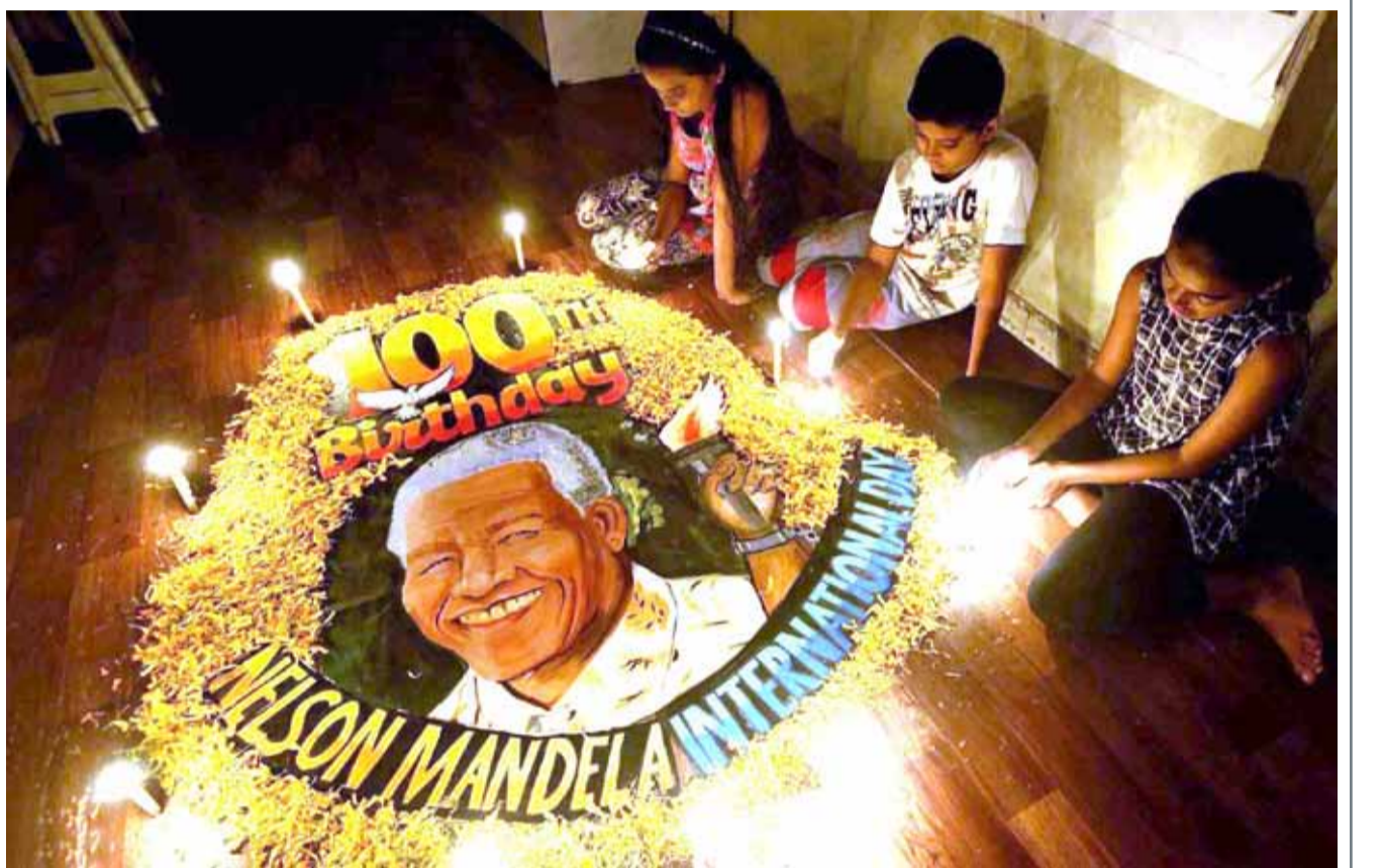
• احتفلت جنوب إفريقيا بالذكرى المئوية لميلاد الرئيس المناضل السابق نيلسون مانديلا بحضور لفي من الشخصيات العالمية وسط أجواء احتفالية بالمناسل الإفريقي الذي ولد في 18 يوليو 1918

حالة الطقس الطقس صيفي عادي. الرياح شمالية غربية عموماً من 13 إلى 18 عقدة، ولكنها متقلبة الاتجاه من 5 إلى 10 عقد خلال الليل.