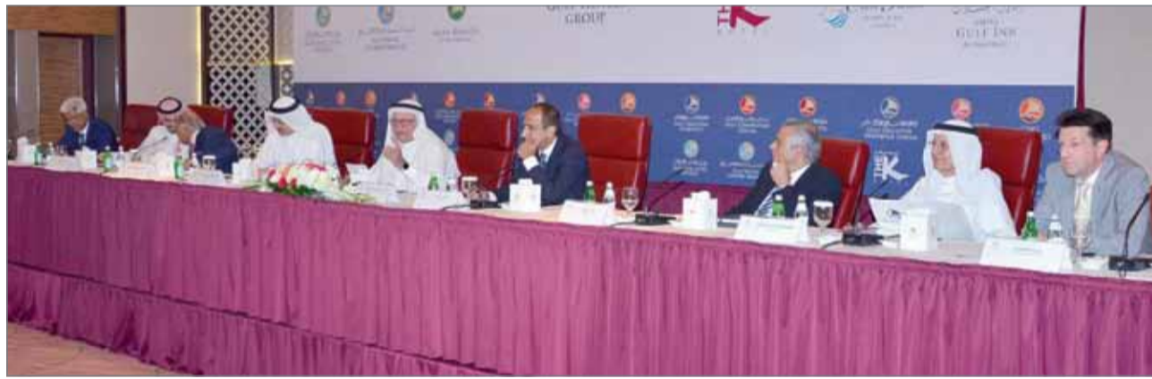
• جانب من الجمعية العمومية

الذكر وإنشاء الضمانات والرهون اللازمة. كما وافقت الجمعية على ما أجراه مجلس الإدارة من عقود واتفاقيات سابقة متعلقة بما حصلت عليه الشركة من تمويلات وما قدم في سبيل الحصول عليها من ضمانات وكفالات ورهون من البنوك المحلية. وأيضاً تمت الموافقة على إجراء التعديلات اللازمة على عقد التأسيس والنظام الأساسي للشركة وفقاً للتعديلات التي أجريت على بعض أحكام قانون الشركات التجارية رقم 21 لعام 2001 بموجب قانون رقم (50) لسنة 2014