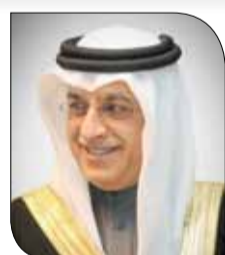
سلمان بن إبراهيم

وأعرب الشيخ سلمان بن إبراهيم في برقية التهنية عن سروره وفائق تهابه لشكرالله بمناسبة نجاحه في المشاركة بإدارة بعض مباريات كأس العالم 2018، وتقديم