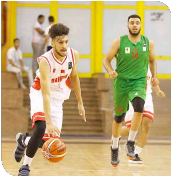
من لقاء منتخبنا أمس أمام الجزائر