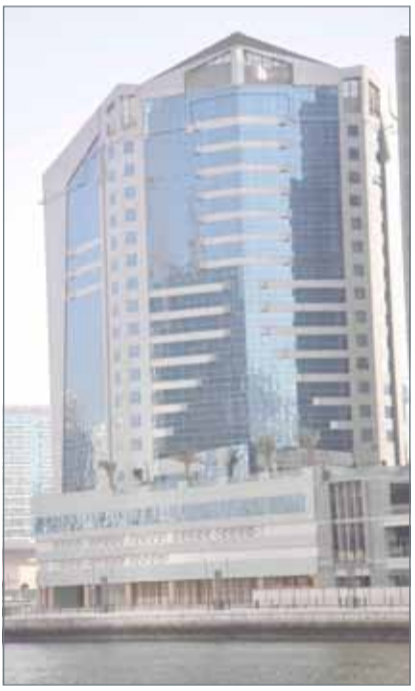
• الفندق الجديد في دبي