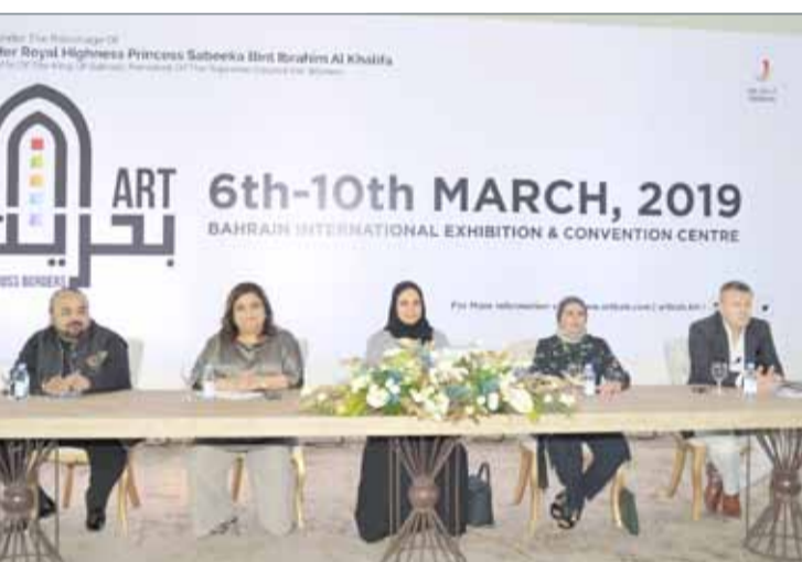
• مبادرة فن البحرين عبر الحدود تدعم تطوير الصناعات الحرفية ومنتجات الأسر البحرينية

وأوضحت أن هذه المبادرة تأتي كثمرة للتعاون والشراكة بين ”تمكين“