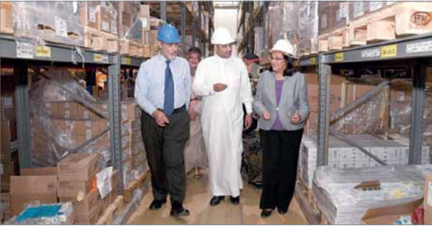
• وزيرة الصحة خلال الزيارة التفقدية

المنامة - وزارة الصحة: تفقدت وزيرة الصحة فائقة الصالح صباح أمس إدارة التجهيزات والمواد بمنطقة السلمانية، إذ اطّاعت على مستوى توفير الأدوية في المستودعات وأطلعت على عملية إفراغ وتسليم الأدوية بالمخازن الرئيسية لعدد من شحنات الأدوية المختلفة قدرت بـ 430 نوعاً، بحضور وكيل وزارة الصحة وليد المانع، والوكيل المساعد للموارد البشرية والخدمات فاطمة الاحمد، إلى جانب كبار المسؤولين بإدارة التجهيزات والمواد.