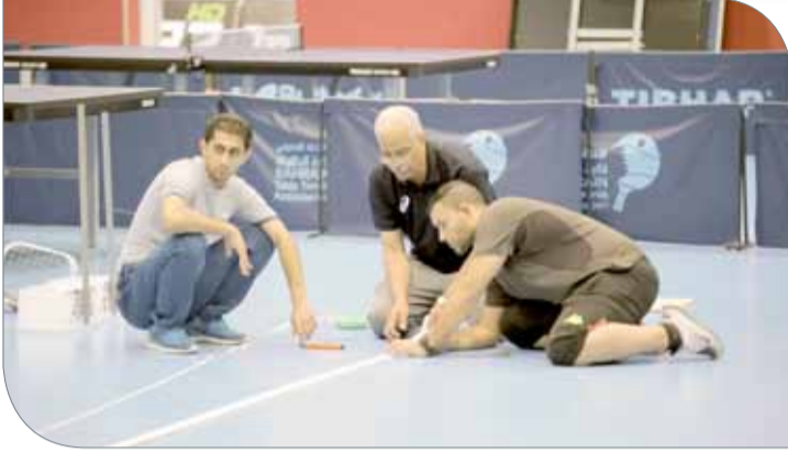
لجنة الملاعب تستكمل تجهيز صالة اتحاد الطاولة