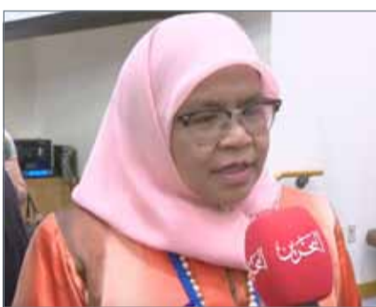
• وكيل الأمين العام والمديرة التنفيذية للموئل

للحجرة، فأكدت أن البحرين كانت وما تزال متميزة للغاية في تعاملها مع ملف الاتجار في البشر، لكونها تميزت بالشفافية والوضوح والإخلاص، لافتة في هذا الصدد إلى قيام البحرين بتخصيص خط ساخن متاح على مدار الساعة لتلقي ضحايا الاتجار في البشر.