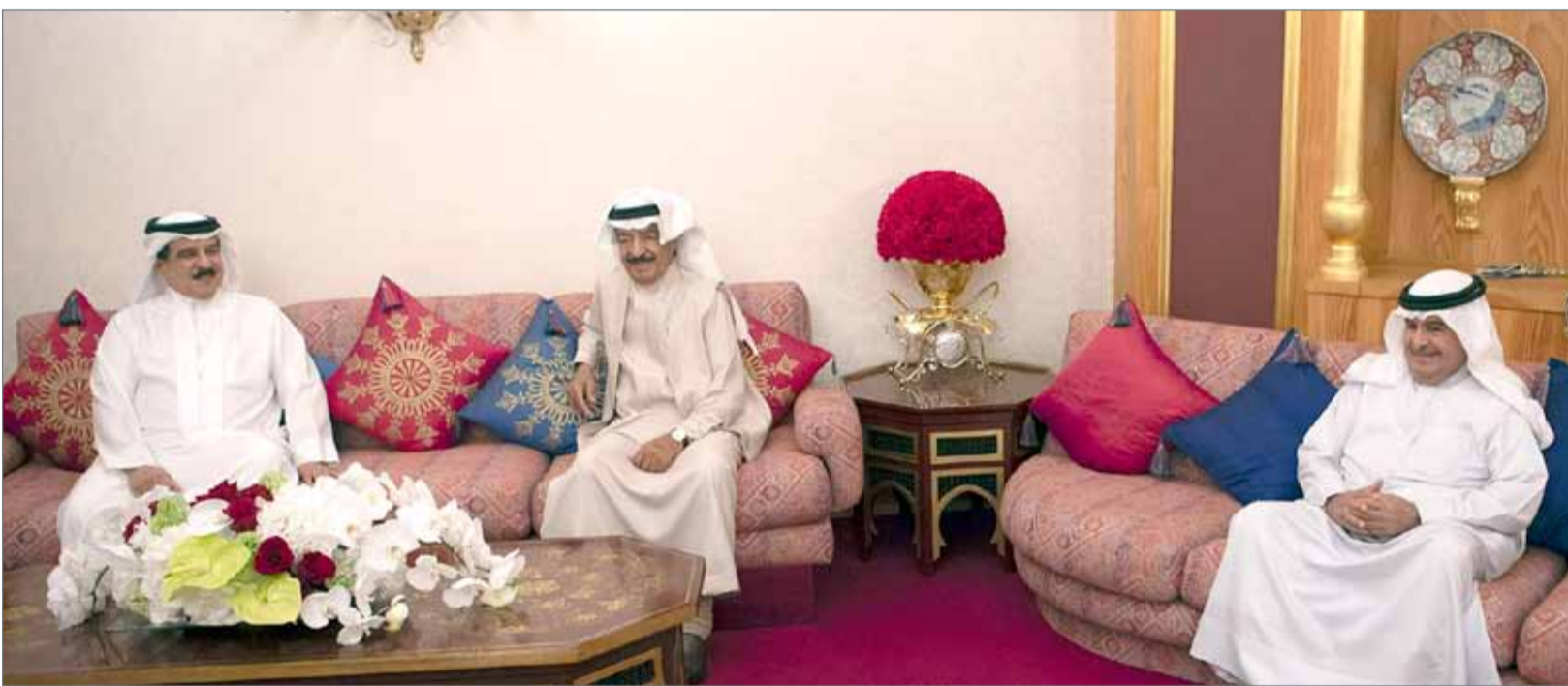
• جلالة الملك يقوم بزيارة لسمو رئيس الوزراء

• سموه يؤكد استمرار العمل لتطوير الأداء وجعل مخرجاته بمستوى التطورات