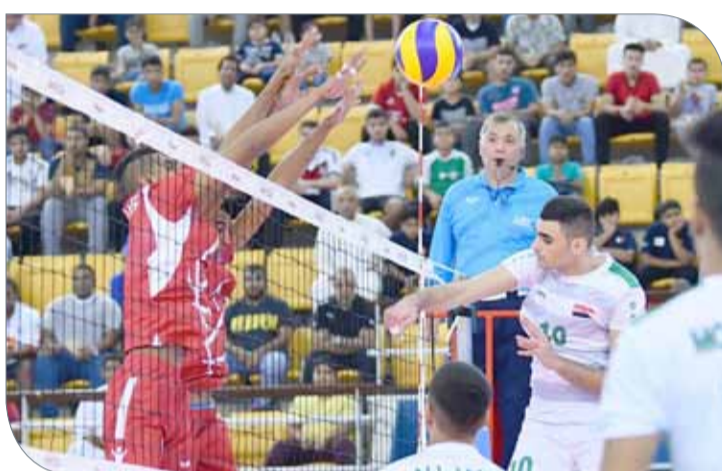
من لقاء منتخبنا والعراق

وأضاف أن أعداد المنتخب كان جيداً، وقد أجرى معسكر تدريباً ببلغاريا، وسيسعى لإظهار كل ما بقوته في المباريات القادمة للظهور المشرف.