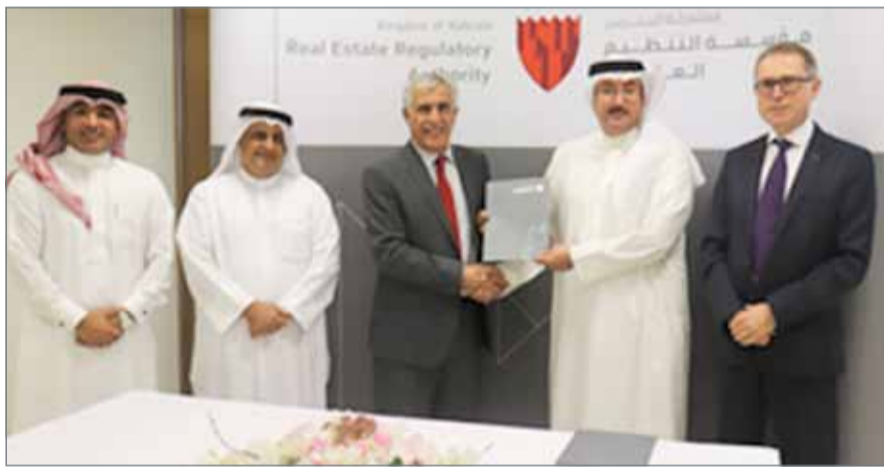
• عقب توقيع الاتفاقية

النمامة - بنا: أعلنت مؤسسة التنظيم العقاري وجمعية البحرين للتأمين أمس اتفاق شراكة مع شركات إعادة التأمين العالمية من أجل تطوير سندات التأمين العقارية، والتي تعنى بحساب الضمان الخاصة بمشاريع البيع على الخريطة بشكل مبتكر بحيث تكون البحرين أول دولة في منطقة الخليج تقدم هذا النوع من سندات التأمين التي ستوفر مزيداً من الحماية للمشتريين.