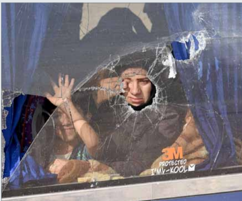
• حافلات تنقل سوريين من بلدي الفوعة وكفريا تصل إلى جنوب حلب (أ ف ب)

وذكر مراسل لـ "فرانس برس" في معبر مورك أنه شاهد وصول حوالي 50 حافلة تنقل مقاتلين وعائلاتهم. وأوضح أيضا أن المقاتلين كانوا يحملون رشاشات فردية وتناولوا طعاما قدم إليهم، قبل أن يستقل الجميع مع النساء والأطفال حافلات