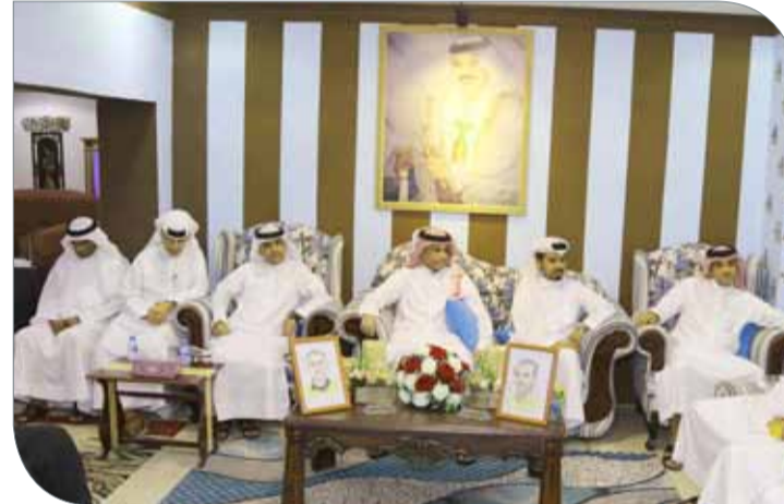
الحضور في الندوة