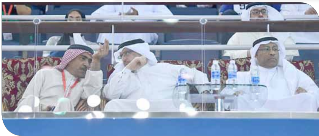
جانب من كبار الحضور