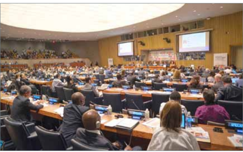
• وزير شؤون مجلس الوزراء يستعرض التقرير الوطني الطوعي

نيويورك - بنا: جسد تقديم البحرين لتقريرها الطوعي الأول بشأن تنفيذ أهداف التنمية المستدامة 2030، أمام المنتدى السياسي رفيع المستوى بالتنمية المستدامة والتابع للمجلس الاقتصادي والاجتماعي للأمم المتحدة، إنجازاً دولياً جديداً يضاف إلى ما حققته المملكة من نجاحات على صعيد دعم الجهود الأمامية في مجال التنمية المستدامة. واستعرضت البحرين تجاربها الناجحة في مضمات التنمية المستدامة أمام دول العالم للاستفادة منها في إحراز التقدم المأمول في تنفيذ أجندة أهداف التنمية المستدامة.