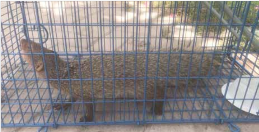
• "ابن عرس" بعد صيده بأحد منازل الرفاع

أبو شؤون البلديات بالعمل سريعا لإنهاء معاناتهم؛ إذ تم صيد حيوان واحد وتبقت 3 في