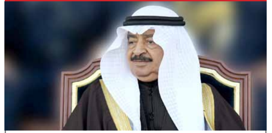
بقلم: الدكتور عبدالله الحواج