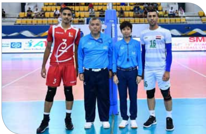
قادة الفريقين قبل انطلاق المباراة