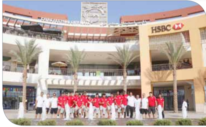
منتخبنا في الجولة الترفيهية

ولم تقدم المنتخبات التي ودعت المنافسة المستوى المأمول منها، ولا سيما المنتخب الإماراتي الذي فاجأ الجميع بمستواه الفني المتواضع، خصوصاً أنه ينتظر استحقاقاً آسيوياً مهماً يتمثل في البطولة الآسيوية المؤهلة لكأس العالم مطلع شهر أغسطس المقبل.