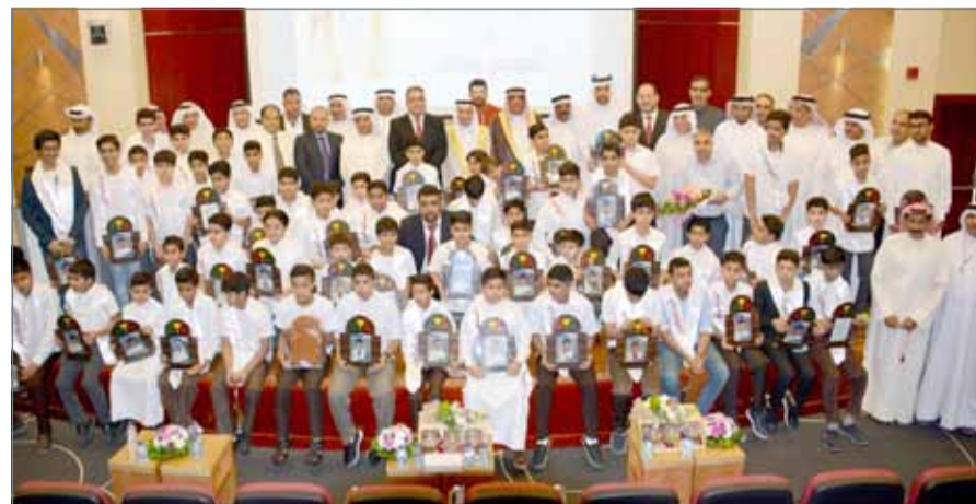
• جانب من حفل التكريم