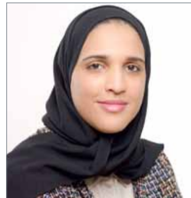
• الشيخة منيرة بنت محمد

المتنوعة، والتي توفر لها الفرص المتنوعة لتسهم بفاعلية في تقوية الاقتصاد الوطني ودعم التنمية المستدامة". وأشارت مدير إدارة الأنشطة الشبابية إلى أن الشراكة الاستراتيجية بين وزارة شؤون الشباب والرياضة وتمكين توفر سويًا بيئة خصبة للإبداع متمثلة في مدينة شباب 2030، عبر منظومة شاملة من البرامج والفرص التدريبية الاحترافية التي تهدف لخلق أجيال شبابية تمتلك مقومات الريادة والتميز، وتضع بصمة على طريق تطوير مستقبل المملكة ورفعتها.