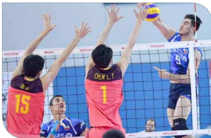
من لقاء إيران والصين

"الدوري والكأس القطرية" في المنطقة بيع الحقوق لتلفزيون البحرين في ظل الاتفاق المبرم بينها وبين الاتحاد الآسيوي للكرة الطائرة.