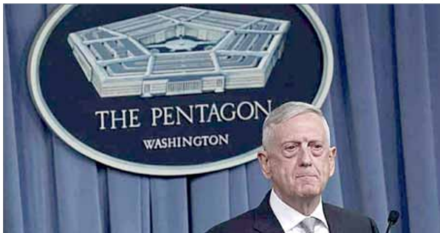
• وزير الدفاع الأميركي

وما زال القانون يثير جدلاً في الولايات المتحدة إذ يخشى البعض أن تلحق عقوبات على طفاء استراتيجيين للولايات المتحدة مثل المهند، ضرراً