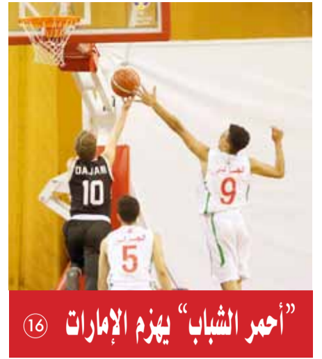
أحمر الشباب يهزم الإمارات 16