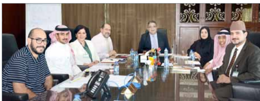
• جامعة العلوم التطبيقية تعقد اجتماعاً لبحث شروط دعم الطلبة المتفوقين

الذين لا يقل معدلهم التراكمي عن 70 %، أما بالنسبة للطلبة المستجدين أن لا يقل معدل الطالب في شهادة الثانوية العامة عن 75 %، وأن يكون الطالب مسجلاً رسمياً بالجامعة وحاصل على رقم جامعي قبل التقديم.