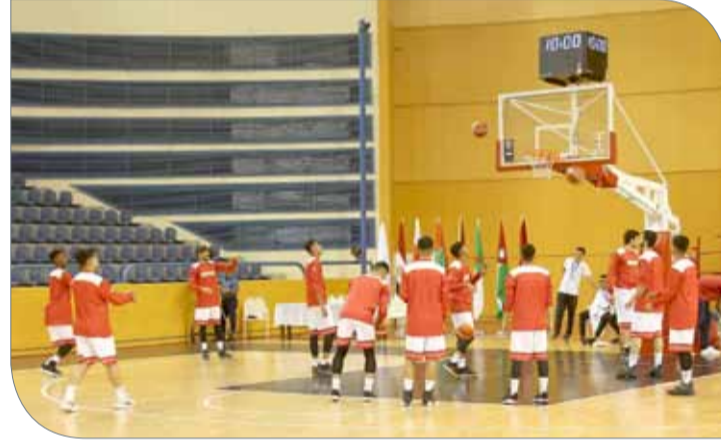
من تدريبات منتخبنا