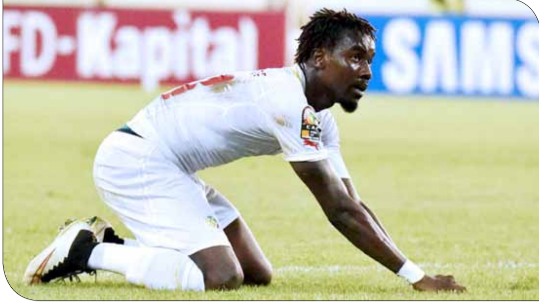
منتخبات إفريقيا خرجت من المونديال بفشل جماعي

المؤسسة لأنها قضية تدعو للقلق، وخلال تاريخ كأس العالم كان أكبر إنجاز أفريقي هو وصول 3 فرق فقط لدور الثمانية وهي الكاميرون في 1990 والسنغال في 2002 وغانا في 2010.