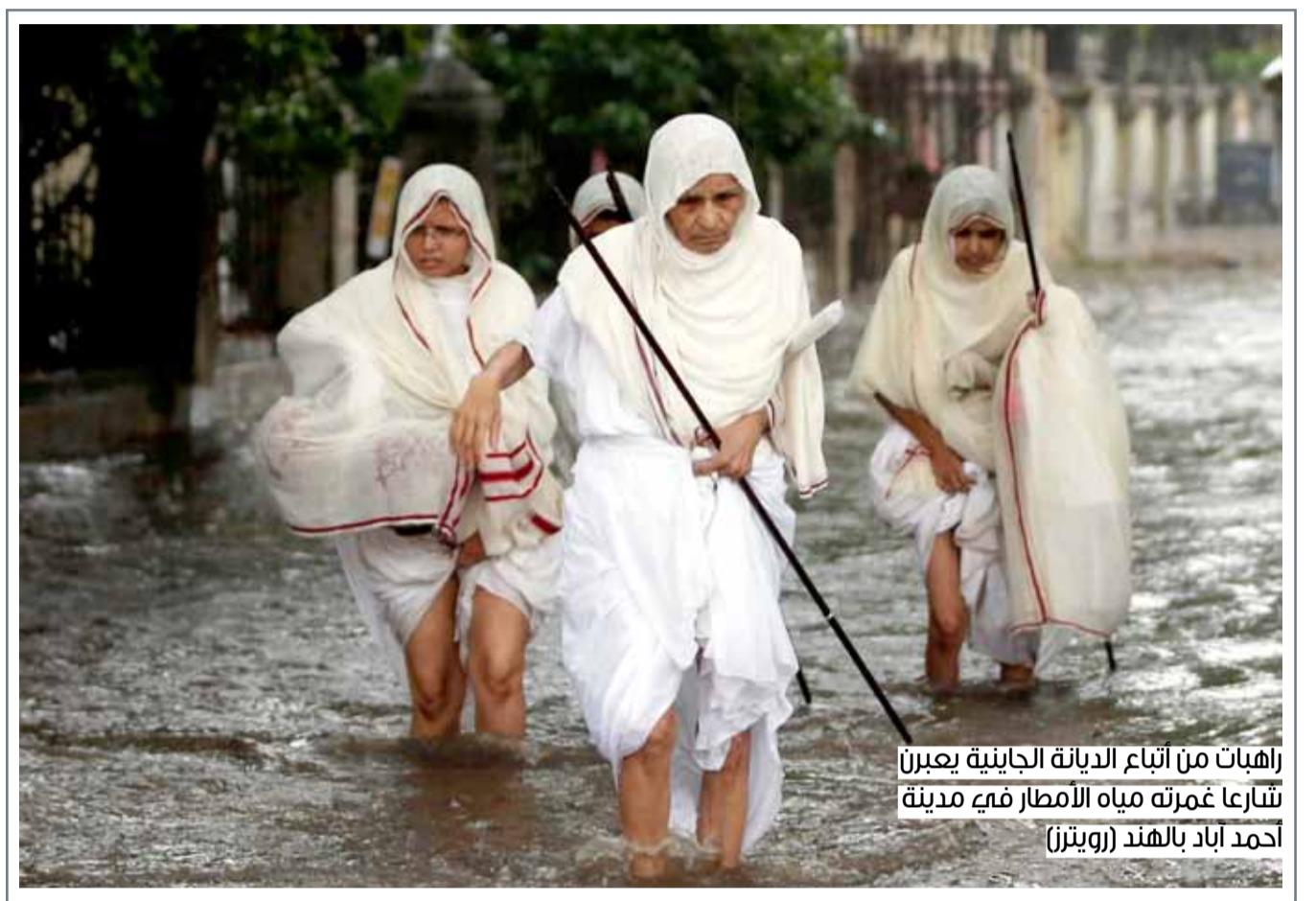
راهبات من أتباع الديانة الجاينية يعبرن شوارعاً غمرته مياه الأمطار في مدينة أحمد آباد بالهند

حالة الطقس الطقس حسن مع بعض السحب، ولكنه مفر في وقت لاحق، وحرار مع تصاعد الأتربة في بعض المناطق خلال النهار. الرياح شمالية غربية من 10 إلى 15 عقدة وترداد من 15 إلى 20 عقدة في وقت لاحق اليوم، وتصل من 23 إلى 28 عقدة أحياناً. ارتفاع الموج من قدم إلى 3 أقدام عند السواحل، ومن 3 إلى 6 أقدام في عرض البحر. درجة الحرارة العظمى 42 والصغرى 33 درجة مئوية.