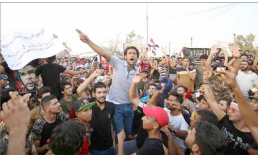
• محتجون خلال مظاهرة في البصرة يوم الجمعة

بغداد - العربية: ارتفعت أعداد ضحايا الاحتجاجات في العراق، حيث وصلت بحسب المصادر إلى أكثر من 11 قتيلاً منذ اندلاع التظاهرات في البصرة، وآخر قتيلين كانا في مظاهرات أمس الأول بمحافظة النجف والديوانية. وحاول بعض المتظاهرين اقتحام مكاتب أحزاب في مدن الجنوب، لكن حراس تلك المقرات قابلوهم بالرصاص الحي، وتم قتل عدد من المتظاهرين. وقال مصدر خاص طلب عدم الكشف عن اسمه، إن إيران تحاول أن تفشل موجة المظاهرات في العراق، من خلال إدخال الميليشيات في صفوف المتظاهرين بملابس مدنية، مبيهاً أن هناك دورات تدريبية تقيمها ميليشيات بدر في معسكراتها بمحافظة البصرة وكربلاء والنجف.