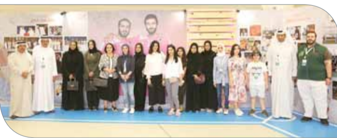
كبار الضيوف مع اللجنة المنظمة

من الإيجابيات يأتي في مقدمتها دعم وتشجيع الشباب على ممارسة الرياضة واعتبارها مطح حياة صحي، مشيرة إلى كلمة سموه وتأكيد على أهمية ممارسة الرياضة من أجل مجتمع صحي. وعبرت الجيب عن شكرها وتقديرها للجنة المنظمة العليا وجميع العاملين في الدوري على جهودهم الكبيرة في تنظيم هذا الملتقى الشبابي الذي يتواجد فيها مختلف أطراف المجتمع البحريني وفئاته، مؤكدة أن استمراره للعام السادس على التوالي دليل على الأهداف النبيلة التي