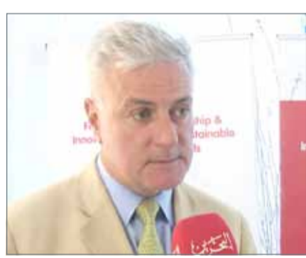
• رئيس شبكة المعارض العالمية