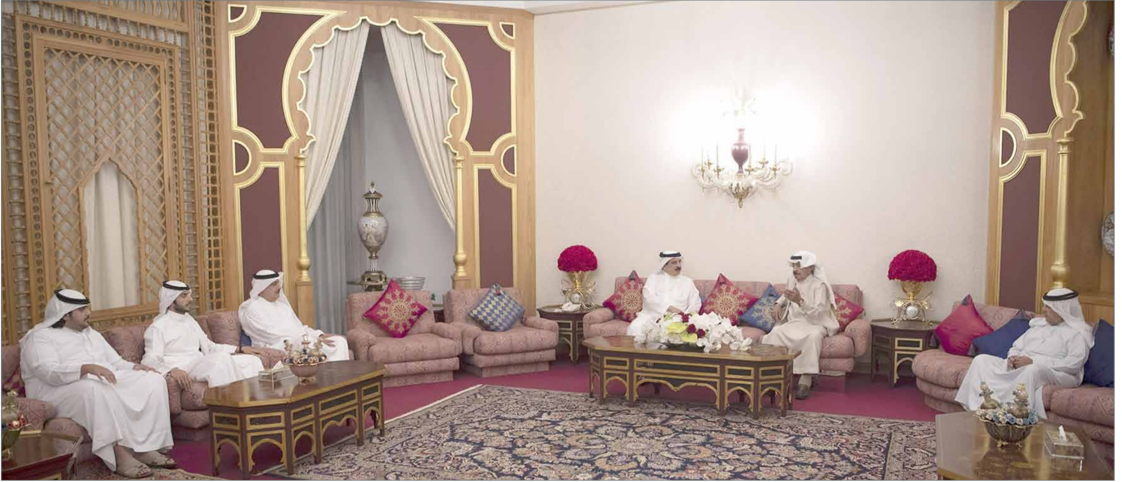
● جلالة الملك يقوم بزيارة لسمو رئيس الوزراء

● سمو رئيس الوزراء: زيارة جلالة الملك لها محلها الكبير ووقعها الطيب في النفس