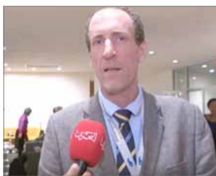
• مسؤول التنمية المستدامة بسكرتارية الأمم المتحدة