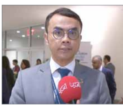
• مدير إدارة المنظمات الدولية بوزارة الخارجية

التي عقدتها هيئة تنظيم سوق العمل بعنوان "حكومة الهجرة في دول مجلس التعاون الخليجي"، نحو مجتمعات آمنة ومرتنة ومستدامة"، والتي نظمتها الهيئة بالشراكة مع حكومة الفلبين وبالتعاون مع المنظمة الدولية للهجرة ومنتدى المهاجرين في آسيا، وتم خلالها مناقشة الارتباطات بين العهد الدولي للهجرة وأهداف التنمية المستدامة، والتطرق إلى الإنجازات التي حققتها البحرين وكيف انعكس ذلك على أهداف التنمية المستدامة في إيجاد مجتمع موحد يحظى فيه المواطن والمقيم بالحرية الاقتصادية والأمان والقدرة على الحصول على الخدمات الحكومية بجودة عالية، فضلاً عن استعراض تجربة البحرين في تصميم وتنفيذ وتقييم إصلاحات سوق العمل للعمالة الوافدة.