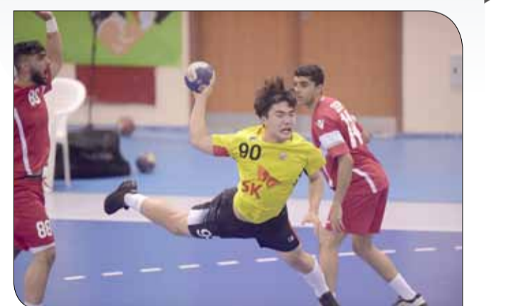
لقطة من المباراة