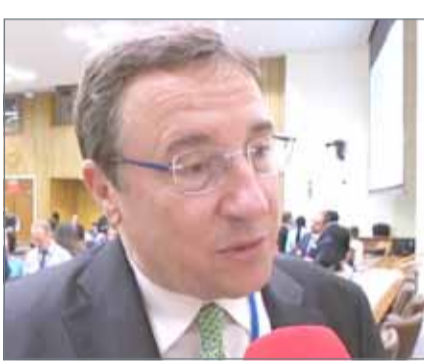
• مدير برنامج الأمم المتحدة الإنمائي