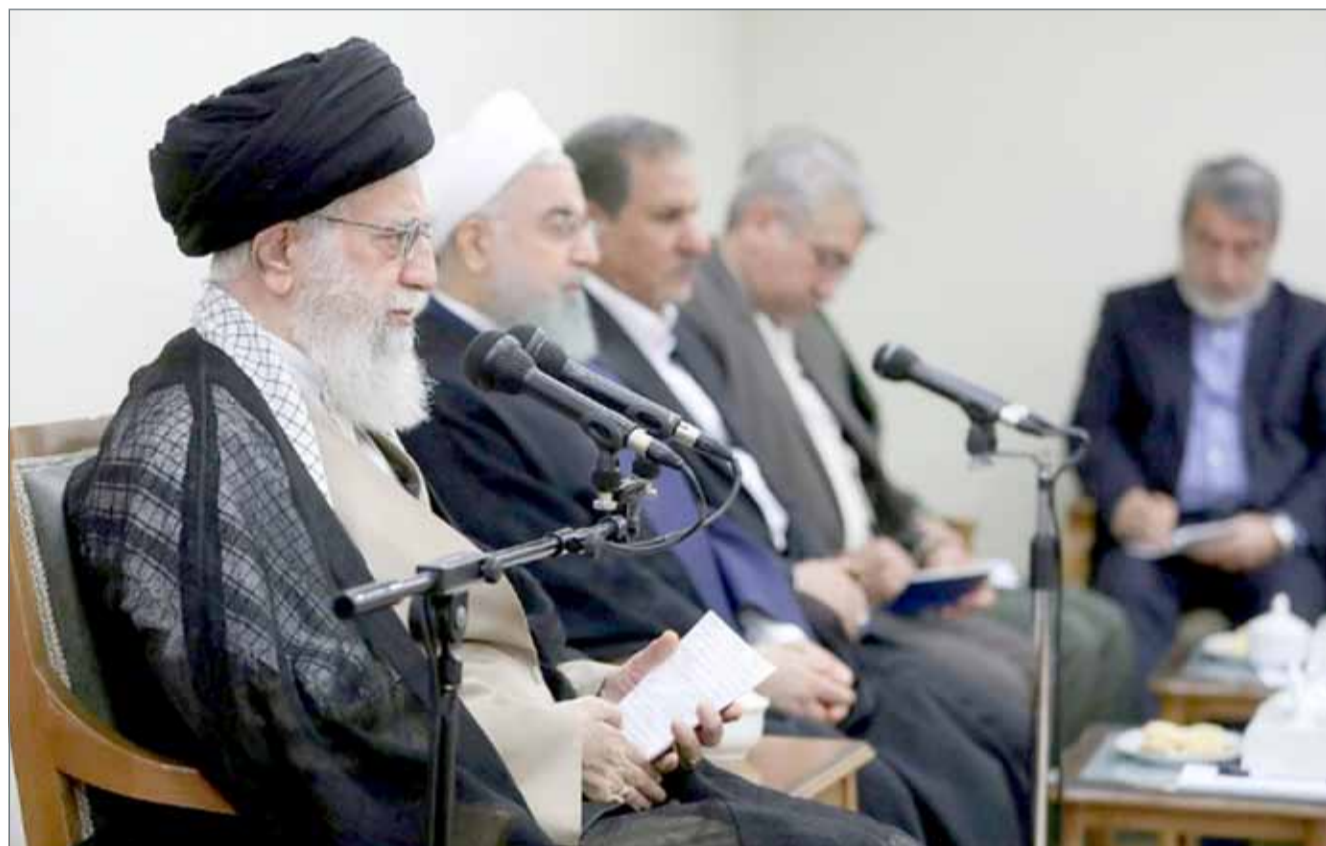
• صورة وزعها مكتب خامنئي خلال اجتماع للحكومة بطهران في 15 يوليو 2018 (أ ف ب)

وقال خامنئي: "لا يمكننا الوثوق بتصريحات الأميركيين أو حتى توقيعهم" مضيفاً أن، "تصريح الرئيس الإيراني بأنه إذا لم يتم تصدير نفطنا لن يتم تصدير نفط أي دولة في المنطقة موقف مهم ويوضح سياسة واستراتيجية النظام"، حسب تعبيره.