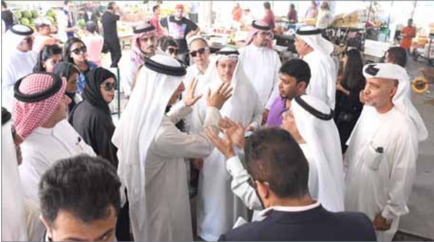
• جانب من الزيارة الميدانية للأسواق التجارية أمس

الكوهجي: معظم الملاحظات والمشكلات في الأسواق من اختصاص البلديات