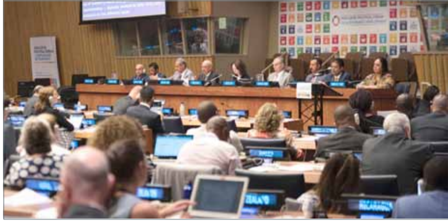
• المطوع يستعرض التقرير الوطني الطوعي

أما الفعالية الثانية التي أقامها الوفد البحريني، فتمثلت في الجلسة التعريفية التي نظمها نظم