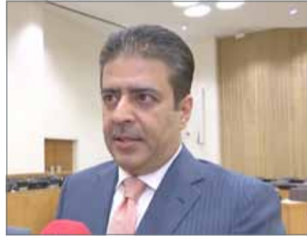
• الرئيس التنفيذي لهيئة تنظيم سوق العمل