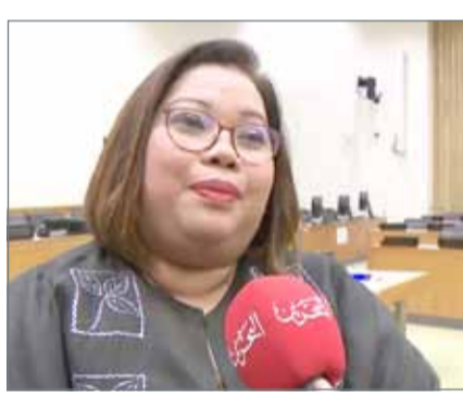
• وكيل وزارة الخارجية لشؤون العمالة المهاجرة بالفلبين