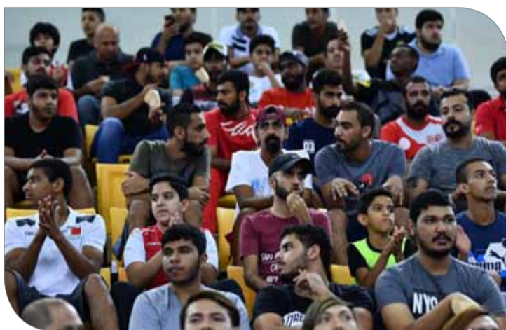
الجماهير أزرّت المنتخب بقوة