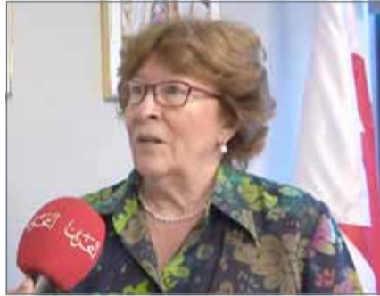
• ممثل الأمين العام للأمم المتحدة المعني بالهجرة الدولية