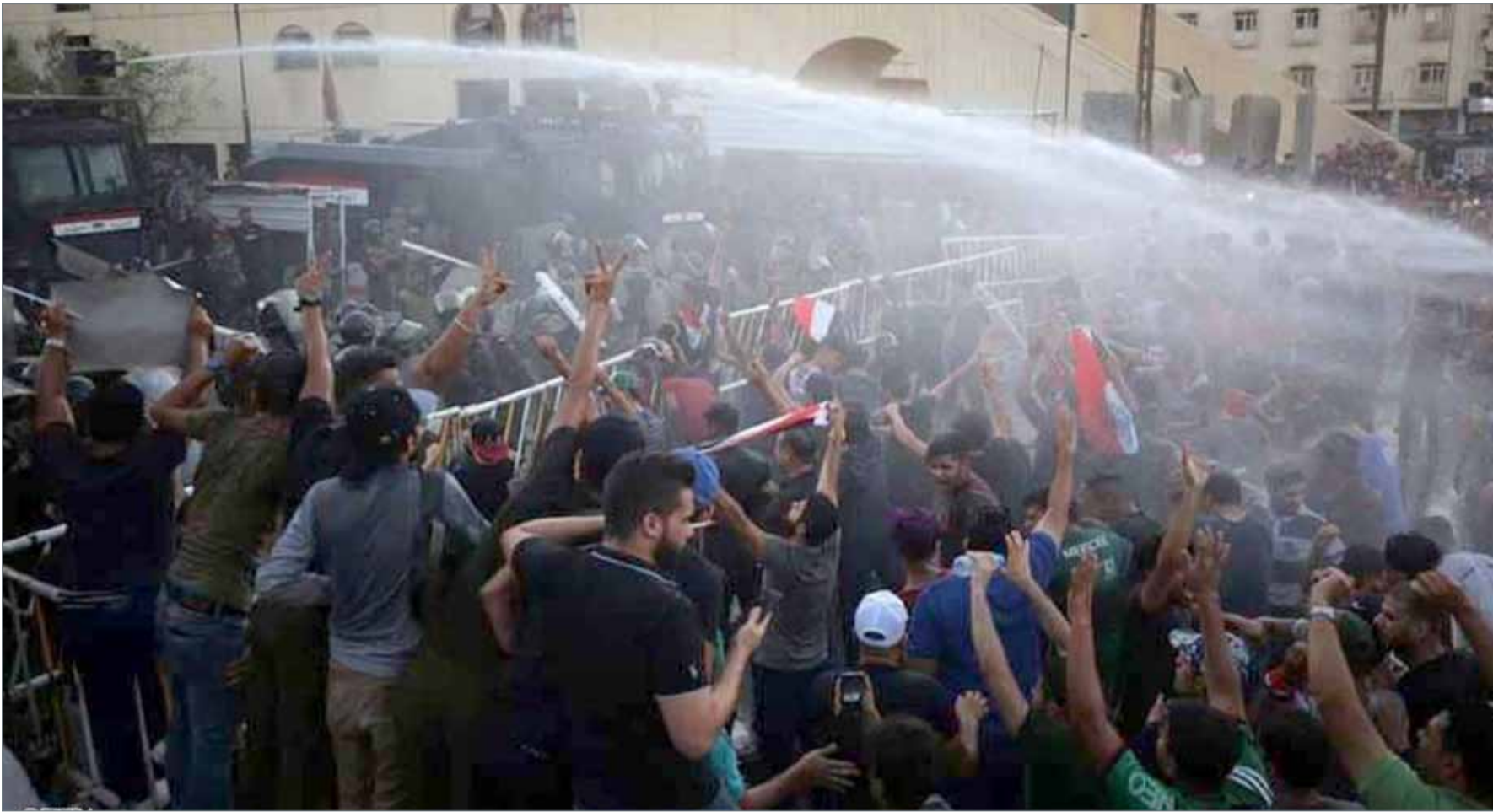
• محتجون خلال مظاهرة في البصرة يوم الجمعة

وأكد البلدان في بيان صدر بمناسبة زيارة الرئيس الصيني شي جين بينغ لدولة الإمارات عزمهما على زيادة التنسيق وحرصهما على تعميق التعاون ضمن مبادرة "الحزام والطريق" لإقامة علاقات الشراكة التجارية والاستثمارية المستدامة بما يحقق المصالح المشتركة للدولتين. واتفقت الدولتان على الارتقاء بالعلاقات الثنائية إلى مستويات أعلى وتأسيس علاقات الشراكة الإستراتيجية الشاملة والتي تشمل المجالات السياسية والاقتصادية والعسكرية والعلمية والتقنية وقطاع النفط والغاز وفي الميدان الثقافي والإنساني والمجال القنصلي وتسهيل انتقال المواطنين.