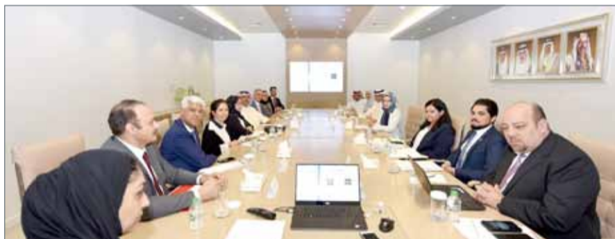
• الأنصاري مجتمعة مع خبراء برنامج الاستشارات الانتخابية للمرأة

وسيتولى خبراء البرنامج تقديم الاستشارات الفردية والجماعية للمرشحات و فرق حملتهن الانتخابية، وتصنيف المشكلات التي تواجهها المرشحة وإيجاد الحلول المناسبة لها، وتقديم التقارير الدورية بشأن سير عمل البرنامج. كما اتفق الخبراء في الاجتماع على أهم الوثائق المرجعية والادلة الاسترشادية والدراسات النوعية التي ستتاح من قبل البرنامج للمرشحات.