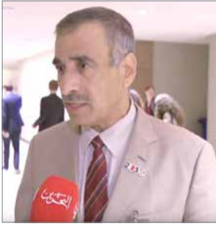
• وزير الإسكان

يذكر أن الجهود الكبيرة التي بذلتها اللجنة الوطنية للمعلومات التي تشكلت بناء على قرار من رئيس الوزراء صاحب السمو الملكي الأمير خليفة بن سلمان آل خليفة، في مارس 2015، وشؤون مجلس الوزراء محمد العطوف في إعداد التقرير وتضمينه بالمؤشرات والأرقام التي تعكس حجم الإنجاز الذي تحقق، أسهمت في النجاح الكبير الذي لاقاه استعراض التقرير أمام المنتدى السياسي رفيع المستوى المعني بالتنمية المستدامة.