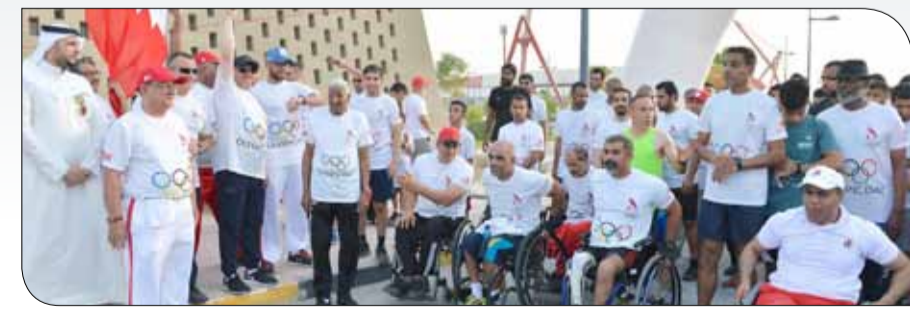
عسكر يطلق شارة انطلاق اليوم الأولمبي

الفعالية، كما وفرت المياه وحرصت على تسليم شهادات المشاركة إلى جميع المشاركين الذين تسلموا شهاداتهم بعد ختام الفعالية مباشرة وفي موقع الحدث مما بنم عن حسن التحضير والتنظيم. وفي هذا الصدد، أعرب الأمين العام المساعد للمجلس