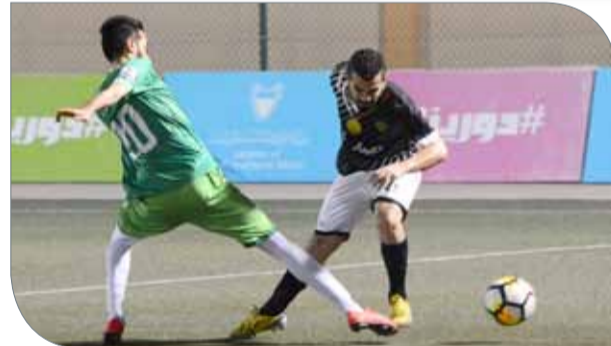
من لقاء السهلة الشمالية وصدد

المجموعة الثانية فريقاً مركز شباب الزلاق ومركز شباب السنابس في الساعة السادسة مساءً على استاد نادي اتحاد الريف، ويمتلك الزلاق تسع نقاط يتصدر بها المجموعة الثانية بفارق هدف واحد عن سلماباد صاحب المركز الثاني وبهمه تعزيز موقعه في الصدارة في مجموعة متميز بتقارب النقاط بين الفرق، بينما يمتلك مركز شباب