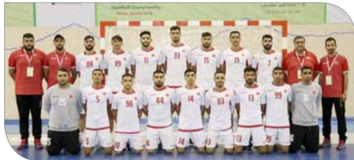
منتخبنا الوطني لكرة اليد للشباب

في المقابل، فإن المنتخب السعودي يعتبر من المنتخبات العنيدة في هذه البطولة، ويضم الفريق في صفوفه مجموعة من اللاعبين البارزين الذين يمتازون بالالتزام الفني والتركيز العالي داخل الملعب وترجمة أخطاء الخصم إلى صالحهم، وطوال مشوار هذا المنتخب تعرض إلى ثلاث هزائم كانت الأولى أمام منتخبنا في الدور التمهيدي وفي الدور الرئيسي خسر من اليابان فيما كانت آخر خسارته أمام كوريا الجنوبية في مباراة الدور قبل النهائي.