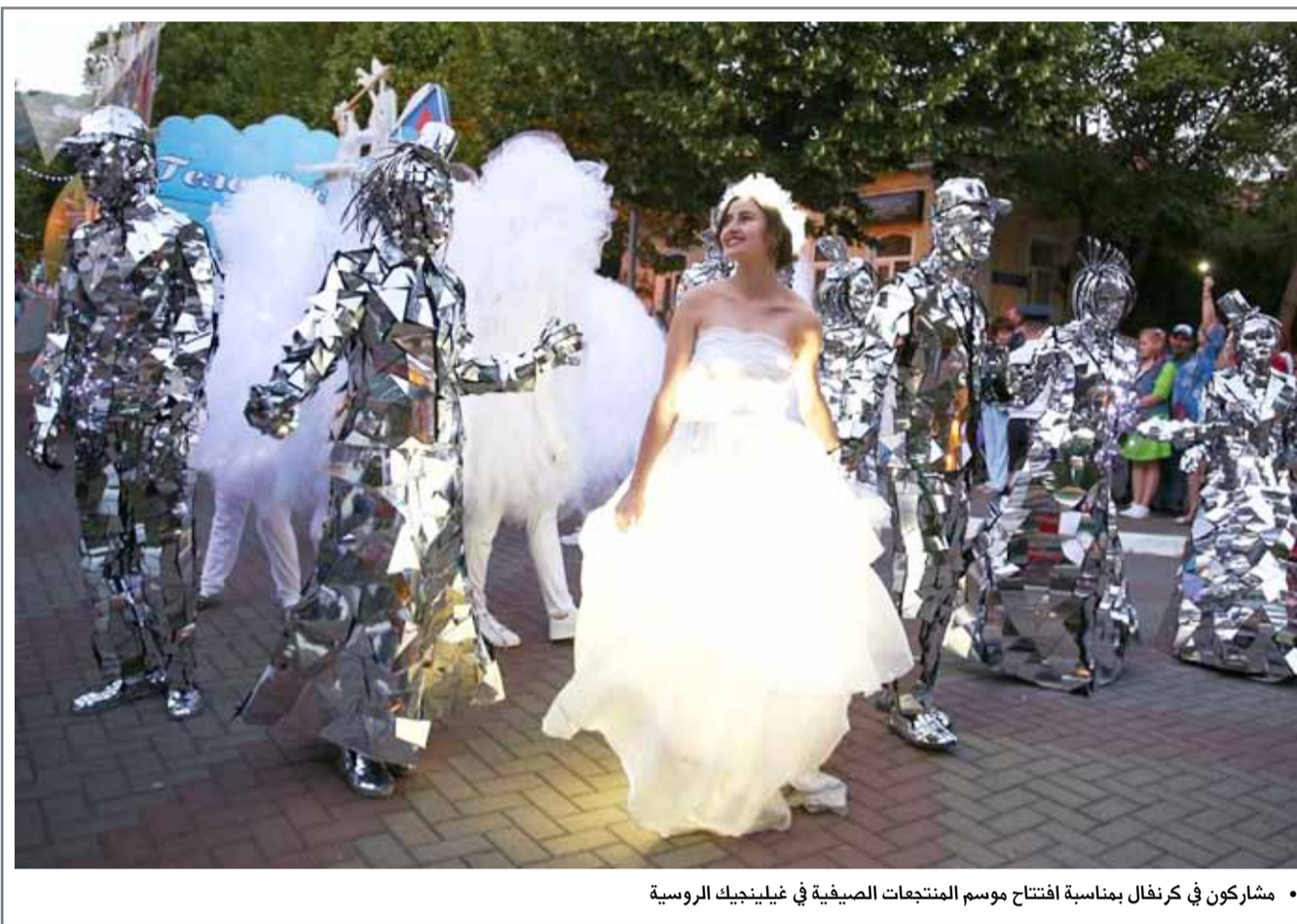
مشاركون في كرنفال بمناسبة افتتاح موسم المنتجعات الصيفية في غيلينجيك الروسية

قالت شبكة "سي.بي.إس" التلفزيونية الأميركية، إن وزراء الخارجية السابقين كولن باول وهيلاري كلينتون ومادلين أولبرايت، سيشاركون في أدوار شرفية بالمسلسل التلفزيوني السياسي "مدام سكريتي" خلال أكتوبر. وصور الثلاثة الحلقة التي تداع في الموسم الخامس الذي بدأ إذاعته في السابع من أكتوبر. وقالت المنتجة التنفيذية للمسلسل باربرا هال في بيان "يسعدنا أن نشهد أراءهم وتناوهر معهم أمام وخلف الكاميرات". ويقوم المسلسل حول شخصية وزيرة الخارجية إليزابيث مكورد وجهودها لتحقيق التوازن الصعب بين عملها الدبلوماسي وشؤونها الشخصية والعائلية.