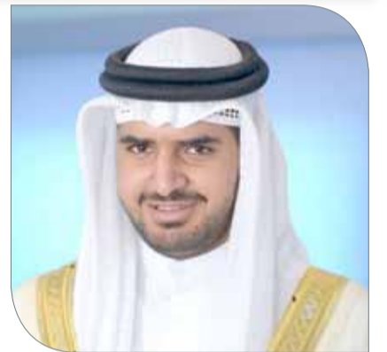
سمو الشيخ عيسى بن علي