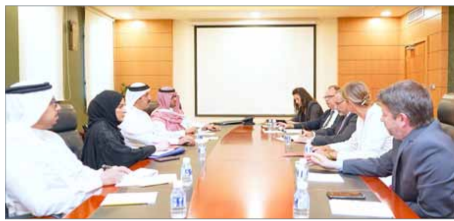
الشيخ عبدالله بن أحمد مجتمعاً مع وفد المنظمة

المنامة - بنا: اجتمع وكيل وزارة الخارجية للشؤون الدولية الشيخ عبدالله بن أحمد آل خليفة أمس، مع وفد من منظمة الأغذية والزراعة العالمية (فاو)، برئاسة المنسق شبه الإقليمي للمنظمة لدول مجلس التعاون الخليجي واليمن جيرولد بوديكر. وناقش الجانبان أطر التعاون وتطوير قطاعات الزراعة والإنتاج الحيواني والسمكي، تمهيداً لإطلاق مشروعين للصحة الحيوانية وسلامة البيئة البحرية بالمملكة، ضمن إطار الشراكة الاستراتيجية بين الحكومة ووكالات الأمم المتحدة المقيمة والإقليمية، للسنوات 2018 - 2022.