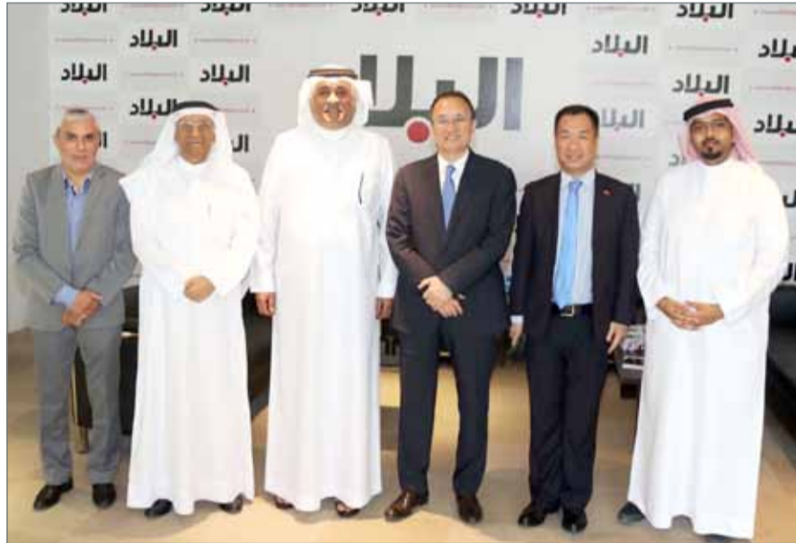
• السفير الصيني في زيارة لـ ”البلاد“

على تطوير العلاقات مع المملكة، تقديراً منها للدور المهم والمؤثر الذي تضطلع به البحرين على الساحتين الإقليمية والدولية.