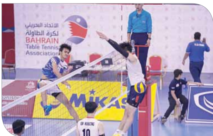
كوريا تجاوزت باكستان بصعوبة

في واحدة من أقوى مباريات البطولة أطاح منتخب تايبيه بنظيره الياباني بثلاثة أشواط مقابل شوطين (25/22، 18/25، 28/26، 10/15)، حيث