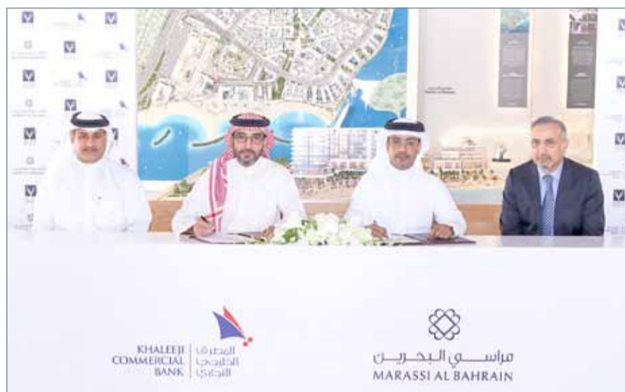
أثناء توقيع التعاون بين الجانبين

5 مشاريع سكنية للمشتريين في مشروع "مراسي البحرين"، وهي: "مراسي رزیدنسر" و "مراسي شورز" و "العنوان رزیدنسر" و "فيذا رزیدنسر" و "مراسي بوليفارد"، وشهدت جميعها اهتماماً كبيراً من المستثمرين المحليين والإقليميين والدوليين منذ طرحها في السوق.