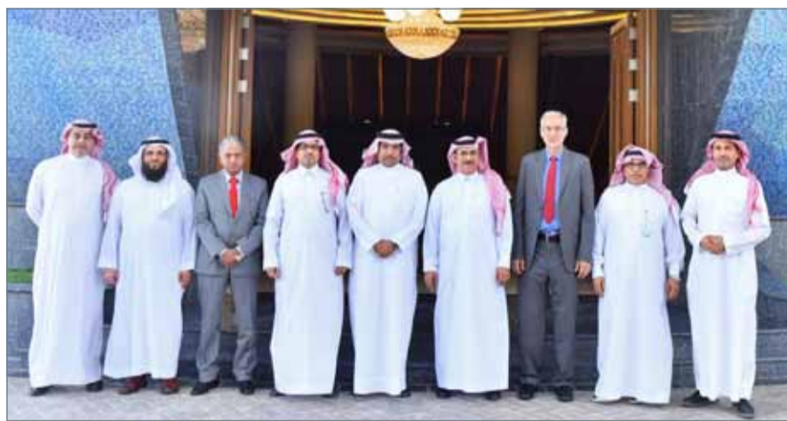
• من زيارة مدير عام وكالة الأنباء البحرين لمقر وكالة الأنباء السعودية (واس)

وتزويد وسائل الإعلام العالمية بالحقائق والمعلومات في مواجهة الحملات الإعلامية المضادة والمغرضة.