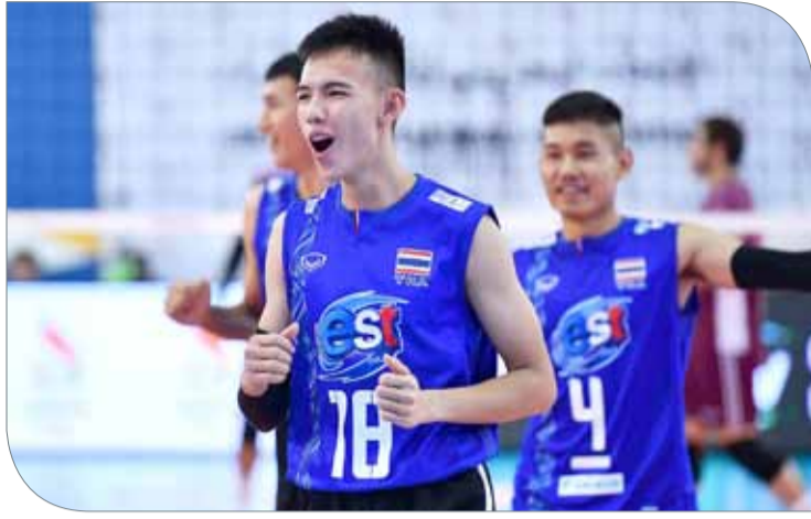
تايلند تسحق قطر