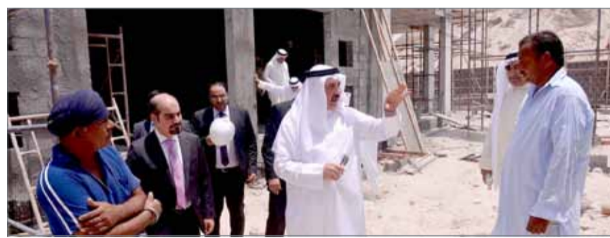
وزير العمل يتفقد عددا من مواقع العمل

مدينة عيسى - وزارة العمل والتنمية الاجتماعية: تفقد وزير العمل والتنمية الاجتماعية جميل حميدان بشكل مفاجئ عددا من مواقع العمل، واطلع على مدى الالتزام بتطبيق قرار حظر العمل وقت الظهيرة. ومنذ بدء تطبيق قرار حظر العمل وقت الظهيرة لهذا العام في الأول من يوليو حتى تاريخه، أجرت الوزارة 6325 زيارة تفتيشية لمواقع العمل، أسفرت عن رصد 123 مخالفة، بنسبة التزام تجاوزت الـ 98%.