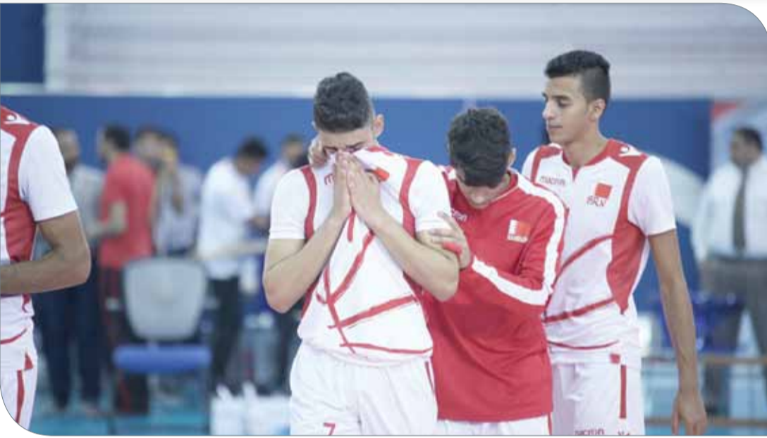
الحزن يخيم على اللاعبين بعد الخسارة

والتأهل لدور الثمانية سعيًا وراء المنافسة على اللقب.