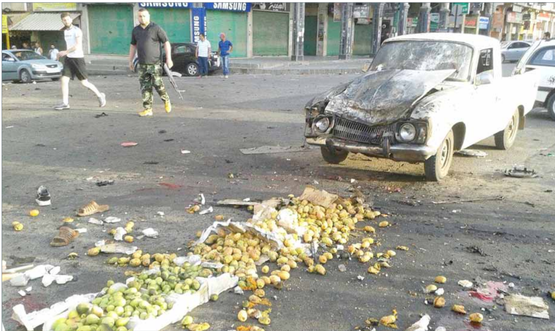
من هجمات "داعش" على السويداء

وشدد المالكي على أن "هذا الهجوم الإرهابي يشكل تهديداً خطيراً لحرية الملاحة البحرية والتجارة العالمية بمضيق باب المندب والبحر الأحمر مما قد يتسبب بأضرار بيئية واقتصادية..".