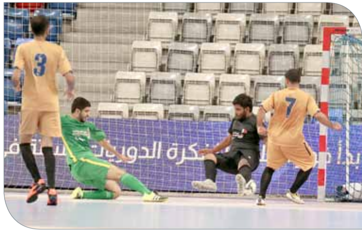
من لقاء الإعاقة الحركية والشلل الدماغي