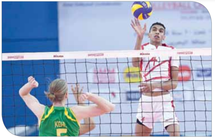
منتخبنا خسر بيده