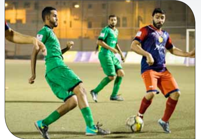
من لقاء المعامير واتحاد الريف

خطف فريق نادي اتحاد الريف تعادلاً ثميناً ومهماً أمام فريق نادي المعامير بهدفين للجانين، في اللقاء الذي جمع الطرفين مساء أمس الأول، على استاد نادي اتحاد الريف، ضمن منافسات الجولة الرابعة للمجموعة الثالثة لدوري المراكز الشبابية لكرة القدم #دورينا في نسخته الثانية. وكاد الجميع يظن أن المباراة ستعده لمصلحة نادي اتحاد المعامير الذي ظل متقدماً حتى الوقت المحتسب بدلاً للضائع من الشوط الثاني، إلا أن نادي اتحاد الريف عاد من بعيد وسجل هدف التعادل الذي أوصل الفريقين للنقطة الرابعة بعد تقاسمهما نقاط مواجهتهما.