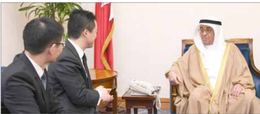
• سمو الشيخ محمد بن مبارك مستقبلاً الرئيس الإقليمي لشركة هواوي الصينية

الجلالة الملك حمد بن عيسى آل خليفة لجمهورية الصين العام 2013. من جانبه، شكر الرئيس التنفيذي سمو الشيخ محمد بن مبارك آل خليفة لاستقباله له، مؤكداً سعي الشركة لتعزيز نشاطها