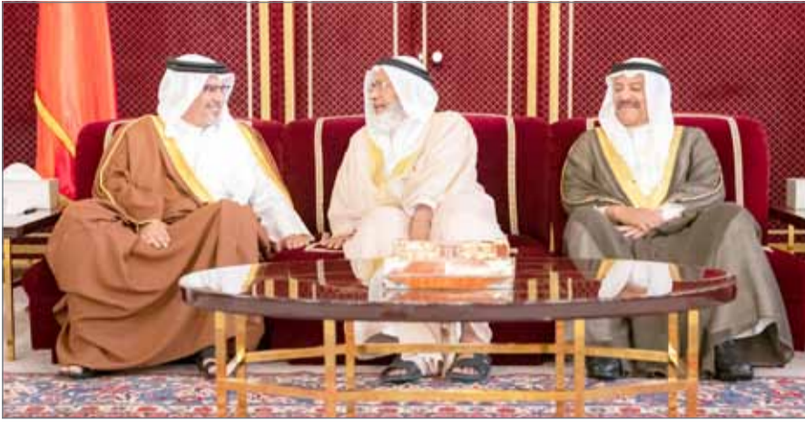
• سمو ولي العهد مستقبلاً أفراد العائلة المالكة والمسؤولين والمواطنين بمجلسه الأسبوعي

المنامة - بنا: في إطار الاهتمام الذي يولييه ولي العهد نائب القائد الأعلى النائب الأول لرئيس مجلس الوزراء صاحب السمو الملكي الأمير سلمان بن حمد آل خليفة بالتواصل مع كل أبناء البحرين، استقبل سموه في مجلسه الأسبوعي بقصر الرفاع مساء أمس، أفراد العائلة المالكة الكريمة والوزراء وأعضاء مجلسي الشورى والنواب والبلديات وعدداً من رجال الدين والفعاليات الاقتصادية والاجتماعية وأعضاء السلك الدبلوماسي في المملكة والشخصيات الأكاديمية والفكرية والإعلامية وعدداً من أفراد المجتمع. ورحب سموه برواد مجلسه الأسبوعي الذي يجسد صوراً من صور التواصل الذي يحرص عليه عاهل البلاد صاحب الجلالة الملك حمد بن عيسى آل خليفة تكريماً لنهج المجتمع وسنة الآباء والأجداد، وترجمةً للروح الأصيلة للمجتمع البحريني ونسجه وهويته الجامعة، وأثنى الحضور على حرص سموه بالالتقاء