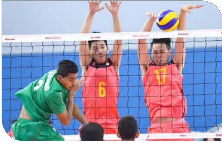
الصين تعبر حاجز السعودية