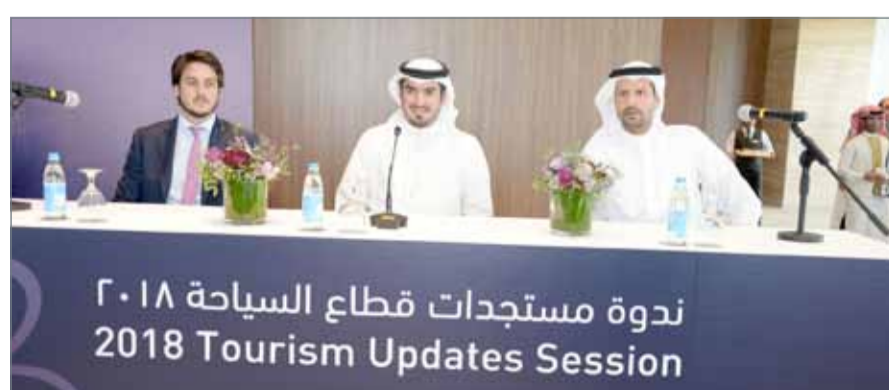
ندوة مستجدات قطاع السياحة 2018

المقومات السياحية بالمملكة بهدف دعم الجهود التي تعزز من إسهام القطاع بشكل إيجابي في الناتج المحلي".