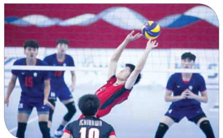
تايبيه أقصت اليابان