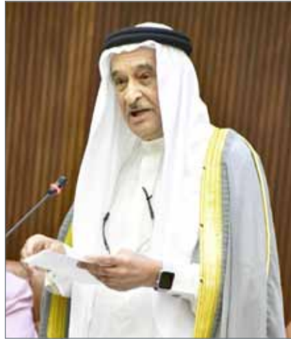
● رئيس المجلس الأعلى للصحة

– علاجهم سيكون عن طريق المستشفيات الخاصة، والتأمين عليهم مثل العمال المقيمين