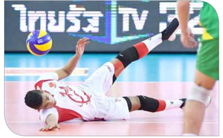
كازاخستان فاز على سيرلانكا

◆ أهدر الفوز بأخطائه وحرم نفسه من بلوغ دور الثمانية لآسيوية الطائرة