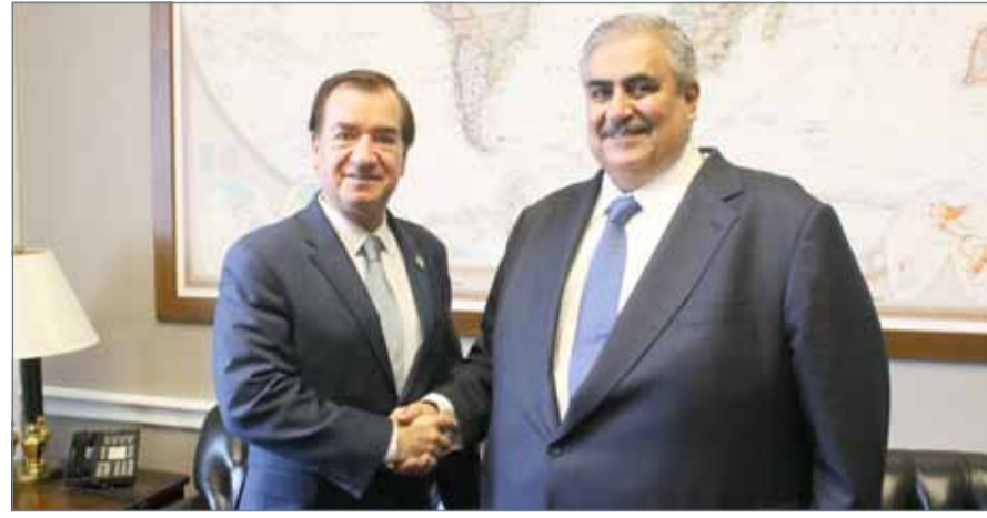
وزير الخارجية مجتمعاً مع رئيس لجنة الشؤون الخارجية في مجلس النواب الأمريكي

مواجهة الخطر الإيراني والتصدي له، الأمن والسلام في المنطقة، متمنياً للمملكة مزيداً من من جانبه، نوه رويس بجهود البحرين في تدعيم الرخاء والازدهار.