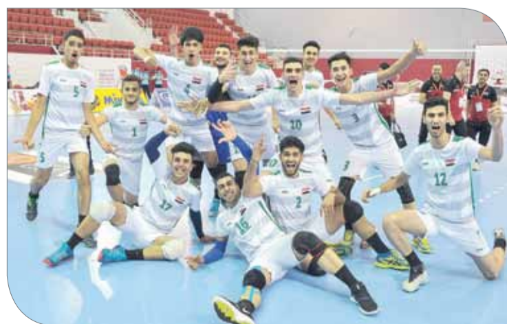
فرحة العراق بالتأهل