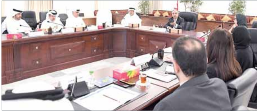
وزير الأشغال وشؤون البلديات يتأسس الاجتماع

النامية - وزارة الأشغال وشؤون البلديات والتخطيط العمراني: واصلت وزارة الأشغال وشؤون البلديات والتخطيط العمراني - شؤون البلديات - عملها على استكمال متطلبات مشروع الأداء المؤسسي في القطاع الحكومي "تكامل" بعد اجتماع جديد لعرض الأهداف الاستراتيجية الـ 22 للوزارة وكذلك المبادرات المتبعة لتحقيق الأهداف.