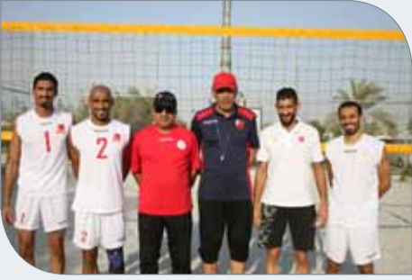
منتخب الطائرة الشاطئية

وفدنا سيقم بنفس الفندق. وعبر الفردان عن أملة في أن تتكلم جهود المنتخب في العودة بنتيجة إيجابية رغم قوة المنافسة في البطولة العربية، مشيداً بالدعم والمتابعة التي يحظى بها المنتخب من رئيس الاتحاد الشيخ علي بن محمد آل خليفة وكافة أعضاء مجلس الإدارة.