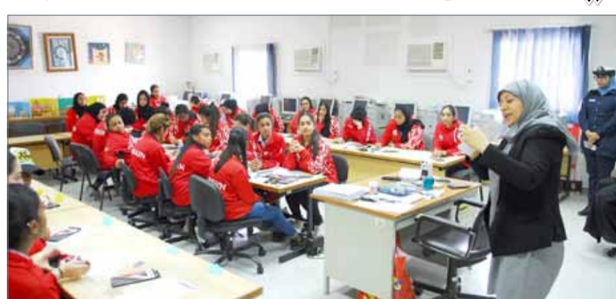
جانب من فعاليات المعسكر الصيفي

المنامة - وزارة الداخلية: قام طلبة المعسكر الصيفي العاشر الذي تنظمه الأكاديمية الملكية للشرطة بالتعاون مع صندوق العمل "تمكين" بزيارة لمجلس النواب والأكاديمية الملكية للشرطة، والمؤسسة الخيرية الملكية، بالإضافة إلى المشاركة في عدد من المحاضرات وورش العمل، في متابعة لبرامج الأسبوع الأول. فقد شارك الطلبة في دورة "الثقافة البرلمانية"، التي تهدف إلى تعميق الفهم والوعي بالمشروع الإصلاحى لصاحب الجلالة الملك، وتعزيز ثقافة المشاركة في الترشيح والانتخابات لدى الشباب.