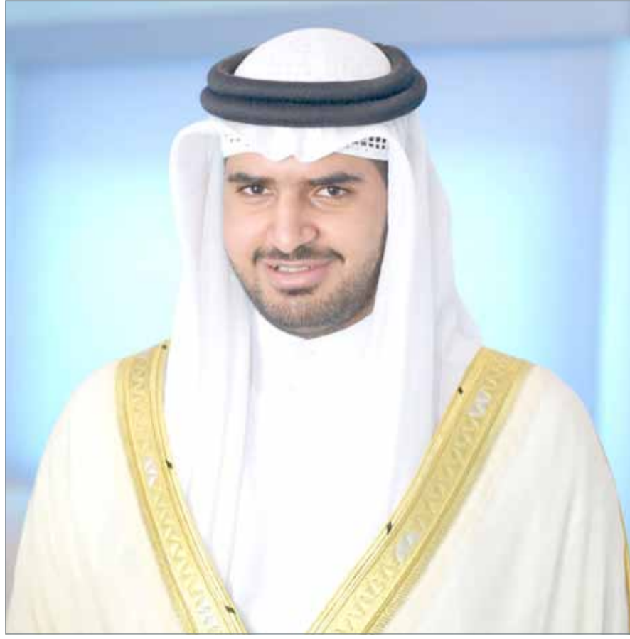
• سمو الشيخ عيسى بن علي