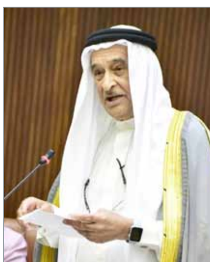
رئيس المجلس الأعلى للصحة

العلاج من دون أية حواجز أو قيود، كما سيسهم هذا الأمر في تحسين مستوى وجودة الخدمات الصحية في جميع المستشفيات. وذكر رئيس المجلس الأعلى للصحة أن وزارة الصحة ستقوم بدور المنظم، وستدرج دوائر "حكمة" - المعلومات الصحية، وضمان الجودة، وتقرير اقتصاديات الصحة والتخطيط، ضمن وزارة الصحة. وقال إن التطبيق سيخفف الضغط الموجود حالياً على المراكز الصحية، ولو نظر للواقع الحالي فإن معدل توزيع المرضى على الأطباء هو 3000 مريض لكل طبيب، ولكن بعد التغييرات وتحويل المقيمين للمراكز الصحية الخاصة، سيتغير المعدل إلى 2000 مريض لكل طبيب، وهذا الأمر سيوفر للمواطنين عناية ورعاية أكبر.