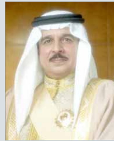
• جلالة الملك

المنامة - بنا: أشاد رئيس مجلس إدارة نادي المحرق الشيخ أحمد بن علي بن عبدالله آل خليفة بمباركة عاهل البلاد صاحب الجلالة الملك حمد بن عيسى آل خليفة على رعاية ممثل العاهل للأعمال الخيرية وشؤون الشباب رئيس المجلس الأعلى للشباب والرياضة رئيس الأولمبية البحرينية سمو الشيخ ناصر بن حمد آل خليفة لبطولة دوري الدرجة الأولى، والذي سيكون تحت مسمى دوري ناصر بن حمد الممتاز لكرة القدم. وأكد رئيس نادي المحرق أن اهتمام ورعاية جلالة الملك بالرياضة البحرينية كانت وما زالت فخر واعتزاز لجميع منتسبي القطاع الشبابي والرياضة.