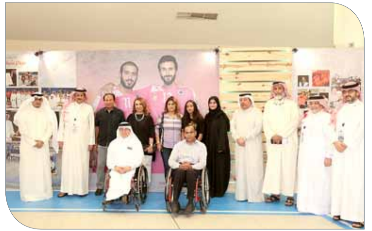
كبار الضيوف مع اللجنة المنظمة