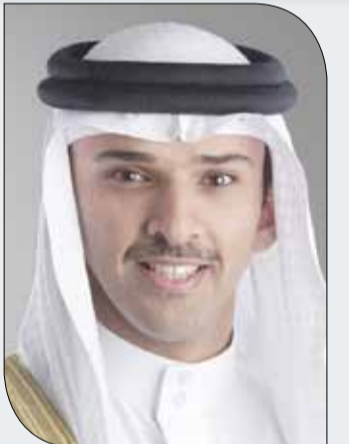
الشيخ علي بن خليفة

وهنا الشيخ علي بن خليفة بن أحمد آل خليفة، سمو الشيخ خالد بن حمد بن حمد آل خليفة، مؤكداً أن اللقب يأتي ثمرة لعودة سموه القوية