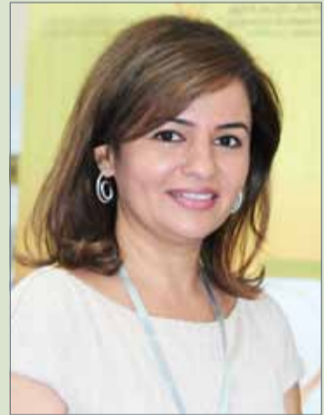
• لونا المعز

قالت وزارة التجارة والصناعة والسياحة إنها ضبطت 278 سلعة مقلدة في النصف الأول من العام، حيث قامت بحوّلها للنيابة العامة.