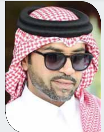
سمو الشيخ فيصل بن راشد

وأكد الشيخ علي بن خليفة أن إنجاز سمو الشيخ خالد بن حمد يأتي تأكيداً على الدعم الكبير الذي يوليه ممثل جلالة الملك للأعمال الخيرية وشؤون الشباب رئيس المجلس الأعلى للشباب والرياضة رئيس اللجنة الأولمبية البحرينية سمو الشيخ ناصر بن حمد آل خليفة لرياضة القدرة ومختلف الرياضات، مؤكداً أن جهود