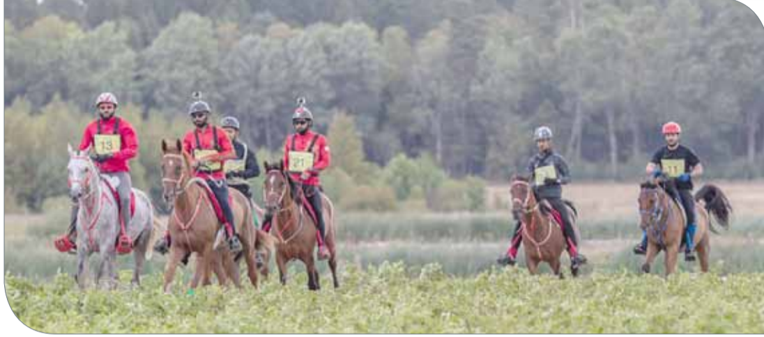
من منافسات سباق السويد للقدرة

وقدم خالد أحمد التهاني إلى سمو الشيخ خالد بن حمد آل خليفة بمناسبة حصوله على المركز الأول، مشيداً بالمستويات الرفيعة التي قدمها سموه طوال السباق والدعم الذي حظى به من سمو الشيخ ناصر بن حمد آل خليفة في الجولات الثلاثة والرابعة.