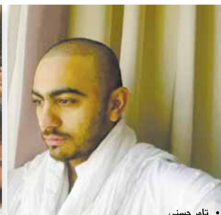
• تامر حسني