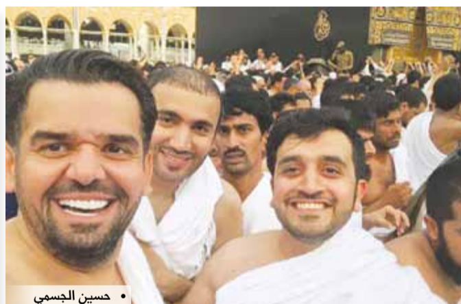
• حسين الجسمي