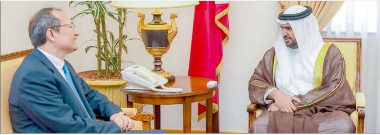
• سمو الشيخ عيسى بن علي مستقبلا السفير الصيني

لدى استقباله السفير الصيني... سمو الشيخ عيسى بن علي: