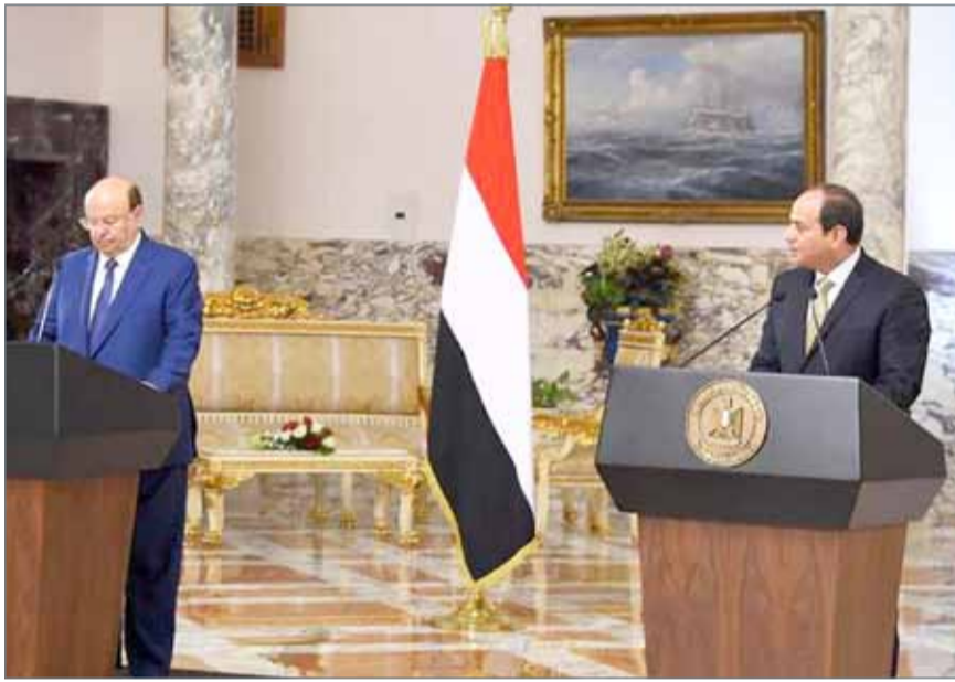
• الرئيس المصري، عبد الفتاح السيسي، في مؤتمر صحفي مع نظيره اليمني، عبدربه منصور هادي.

وبينما لا يفهم الجميع هذه العلاقة فنحن مصممون على ألا يحدث تحولاً استراتيجياً“. وأشار إلى أن التحالف العربي لن يقبل بأن تسيطر ميليشيات الحوثي الموالية لطهران على اليمن، لأن من شأن سيناريو كهذا أن يزيد صعوبة المهمة التي يقوم بها التحالف. وبين الوزير الإماراتي أن العائق الأساسي لإيجاد حل سياسي في اليمن هم الحوثيون الذين قوّضوا جميع المبادرات السابقة برفضهم سحب الميليشيات والأسلحة الثقيلة من المراكز الحضرية للسماح ببدء العملية السياسية.