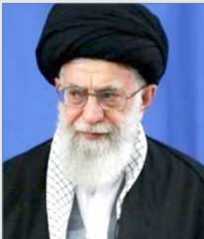
• علي خامنئي

ونقلت وكالة الأنباء الإيرانية ”إرنا“ عن الموقع الرسمي لخامنئي أمس، بأن المرشد أكد خلال كلمة له أن مشكلات بلاده الاقتصادية ناجمة عن سوء الإدارة داخلياً وليس فقط الضغوطات الأميركية. كما شدد على أن ”العقوبات الأميركية لن تؤثر كثيراً لو كان أداء المسؤولين أفضل وأكثر تدبيراً وقوة وفي التوقيت المناسب“. عازياً انهيار عملة الريال لأسباب داخلية تتعلق بسوء الإدارة وليس بفعل العقوبات.