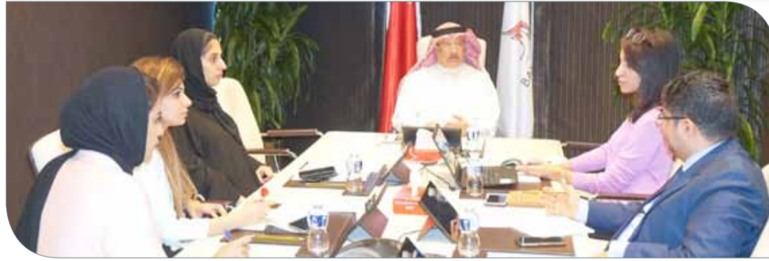
عسكر يرأس الاجتماع الأول للجنة السياسات الخضراء

بالإضافة للمشاريع سألقة الذكر هناك مشاريع أخرى منها ما تم تدشينها فعليا ومنها ما هو في مراحل الانشاء على امل ان تستكمل المنظومة الالكترونية التي تخدم الهدف الأساسي وهو استبدال التعاملات الورقية بالتعاملات الالكترونية اعتبارا من مطلع العام المقبل.