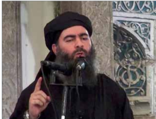
• أبو بكر البغدادي

مشيراً إلى أن ”الإصابة جعلته بحكم الميت سريريا حيث لا يستطيع ممارسة مهامه“. وكشف المصدر عن خلافات بين قادة التنظيم بسبب المنافسة على خلافة البغدادي، وقال: ”بعض قيادات داعش غير العراقيين رشحوا المدعو أبوعثمان التونسي لتولي قيادة التنظيم خلفاً للبغدادي“. وأوضح أن ”ذلك تسبب في خلافات حادة وانقسامات غير مسبوقة في صفوف التنظيم نتيجة لموقف قادته العراقيين الراضل لترشيح التونسي“.