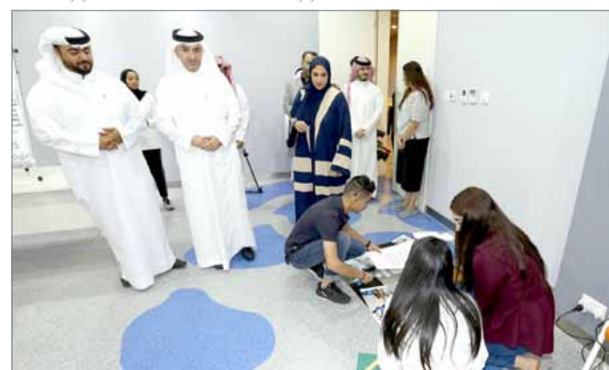
• الشباب يقدمون عروضاً بالهندسة المعمارية

للشباب، والذي ترجمناه على أرض الواقع من خلال المشاركة الواسعة في برامجنا وأنشطتنا التي تؤكد أن مؤسساتنا قادرة على احتضان الشباب وحثهم على الاستثمار الأمثل لطاقتهم وقدراتهم وتوظيفها على الشكل الذي يخدم تطوير مختلف المجالات.