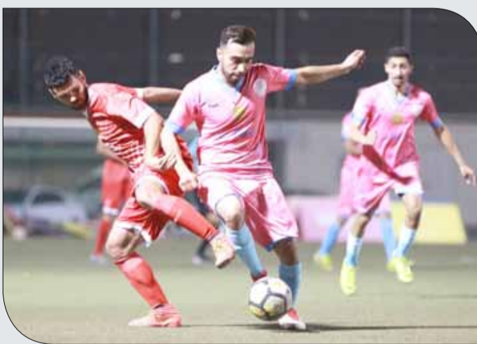
من لقاء الزلاق وكراباد