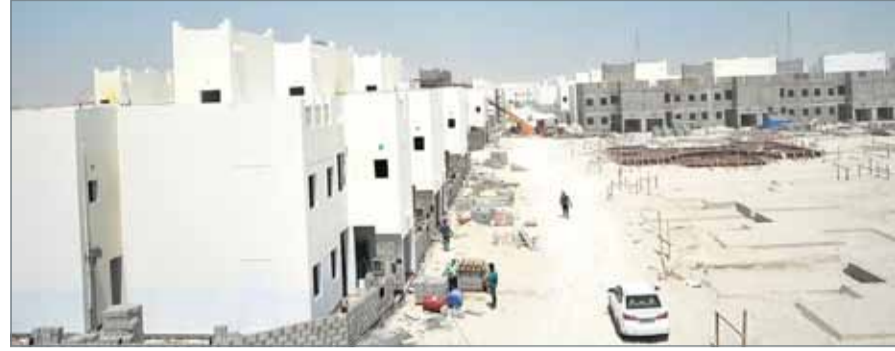
• مشروع البحير الإسكاني

الوزارة، فيما يتضمن المخطط العام للمنطقة أيضًا مسجدًا ومحلًا تجارية ومناطق مفتوحة، مشيرًا إلى أن المشروع يراعي متطلبات العزل الحراري للوحدات السكنية المعمول بها.