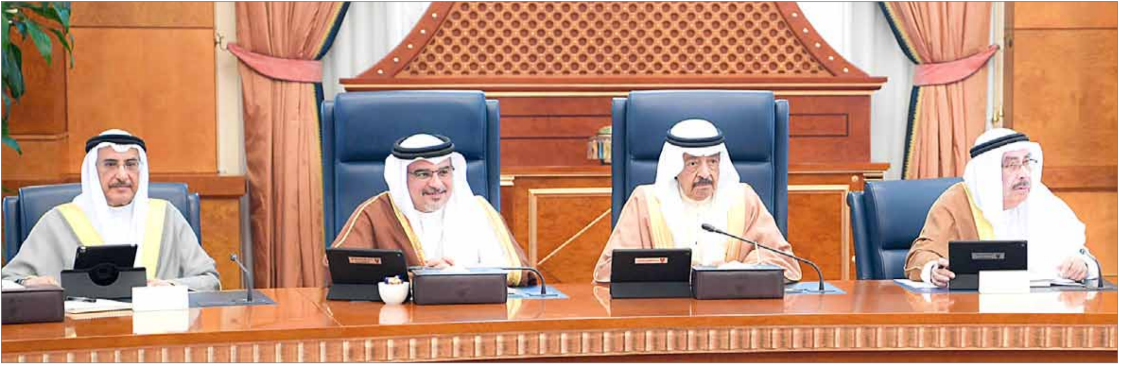
• سمو رئيس الوزراء مترثسا، بحضور سمو ولي العهد، جلسة مجلس الوزراء

دعم مشاركة الشباب الفاعلة في عمليات صنع القرار... سمو رئيس الوزراء يوجه: