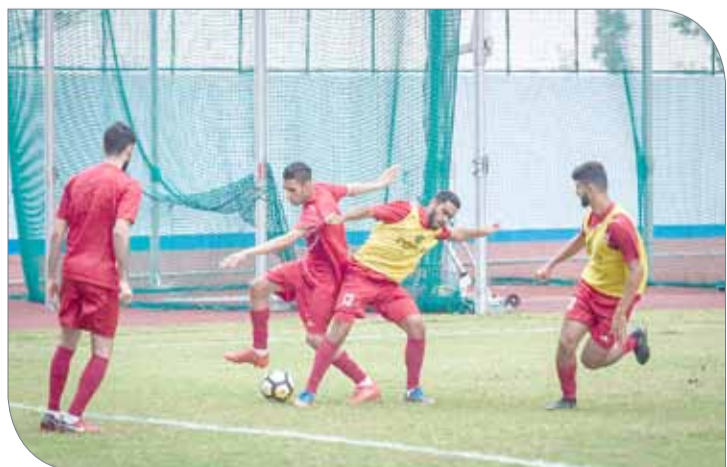
جانب من الحصص التدريبية للأولمبي بجاكرتا

لكرة البحرينية وبلوغ أولمبياد طوكيو 2020، متطلعاً لأن يكون اللاعبون عند حسن الظن في الدورة.