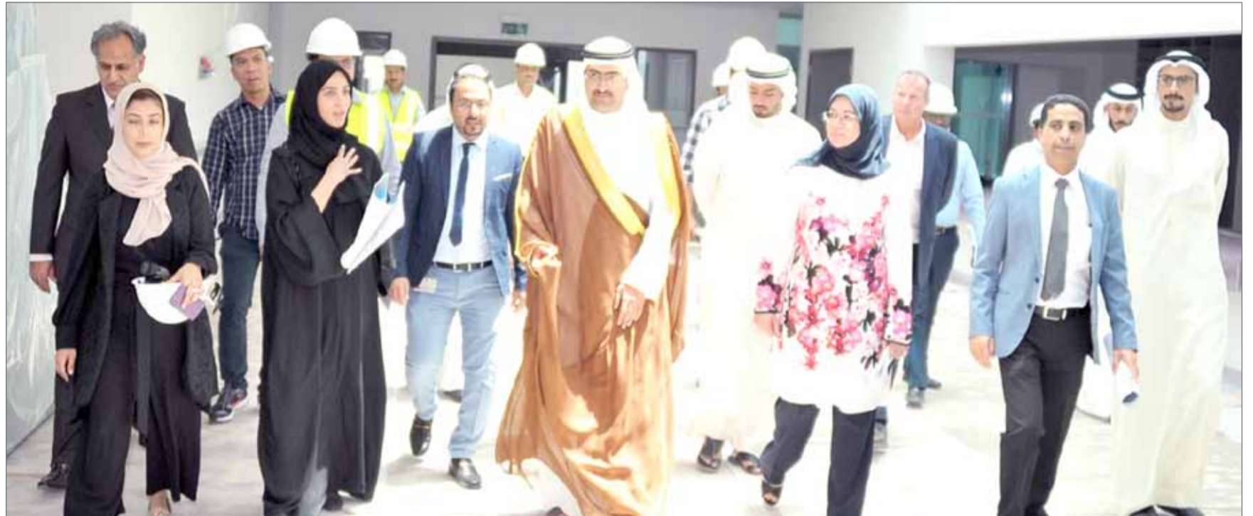
• سمو محافظ الجنوبية متفقدًا مركز غسيل الكلى في منطقة الحنيينة