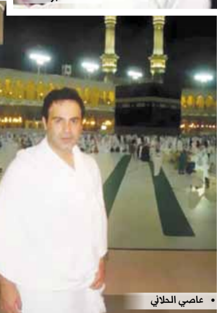
• عاصي الحلاني

صورهم في وسائل التواصل الاجتماعي ومن بين هؤلاء الفنان الكوميدي خليل الرميثي الذي يقول: ما أن أضع قدمي في ساحة الحرم حتى أنسى الدنيا ومن عليها.. أعيش في صفاء روعي لا بوصف. وحسب موقع "روتانا" فقد حققت الفنانة فيفي عبده رقماً قياسياً في أداء مناسك الحج والعمرة، ونقل عنها أنها حجت أكثر من 16 مرة إلى جانب الكثير من العمرة.. كما أنتمت بيرا مناسك الحج 7 مرات على الأقل، وكانت الفنانة إلهام شاهين قد صرحت بأنها نصحتها في أزمة تعرضت لها أن تذهب معها إلى الحج.