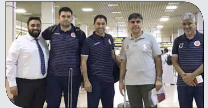
جانب من توديع منتخبنا الوطني أمس