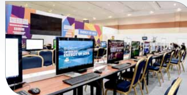
المركز الإعلامي الرئيس

◆ خصصت اللجنة المنظمة لدورة الألعاب الآسيوية مركز إعلامي ضخم يستوعب 400 إعلامي ويتضمن العديد من الخدمات المتميزة لتسهيل عمل الإعلاميين الذين يمثلون 46 دولة آسيوية بالإضافة إلى مختلف رجال الصحافة والتلفزيون من مختلف أنحاء العالم الراغبين في تغطية الدورة، خصوصاً وأن دورة الألعاب الآسيوية تعتبر ثاني أكبر حدث بعد دورة الألعاب الأولمبية من حيث عدد المشاركين. ويتضمن المركز الإعلامي الكائن في ستا " كيلورا بونج كارنو" غرف اجتماعات وقاعة للؤتمرات الصحفية وخدمات لصيانة