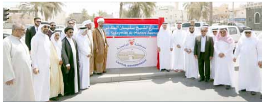
• صورة تذكارية بمناسبة تشييد نائب محافظ العاصمة اسم الشيخ سليمان المدني على شارع جدحفص

الملك حمد بن عيسى آل خليفة، بمناسبة صدور الأمر الملكي السامي بإطلاق اسم والدنا المرحوم الشيخ سليمان المدني على أحد شوارع عاصمة مملكتنا الغالية".