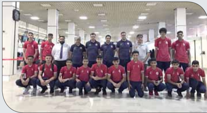
منتخبنا لكرة السلة لفته الناشئين