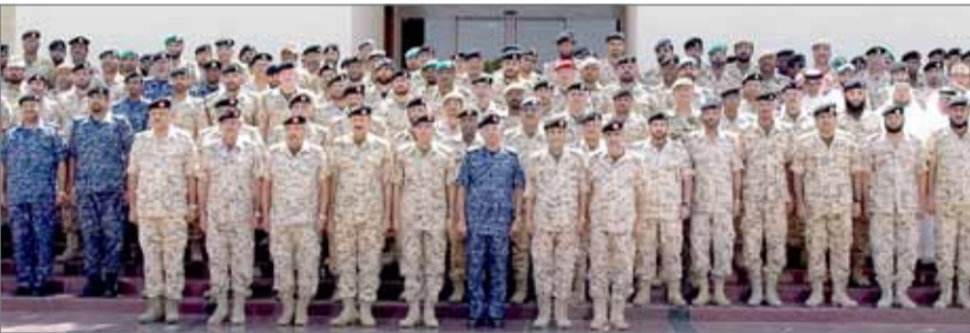
• رئيس الأركان مستقبلا بعثة الحج التابعة لقوة دفاع البحرين

الرفاع - قوة دفاع البحرين: أناب القائد العام لقوة دفاع البحرين المشير الركن الشيخ خليفة بن أحمد آل خليفة، رئيس هيئة الأركان الفريق الركن ذياب النعيمي لاستقبال بعثة الحج التابعة لقوة دفاع البحرين، بمناسبة مغادرتها إلى الأراضي المقدسة، أمس، بالقيادة العامة لقوة دفاع البحرين. ورحب رئيس هيئة الأركان بعثة الحج ونقل لهم تحيات عامل البلاد صاحب الجلالة الملك حمد بن عيسى آل خليفة، وولي العهد نائب القائد الأعلى النائب الأول لرئيس مجلس الوزراء صاحب السمو الملكي الأمير سلمان بن حمد آل خليفة، والقائد العام لقوة دفاع البحرين المشير الركن الشيخ خليفة بن أحمد