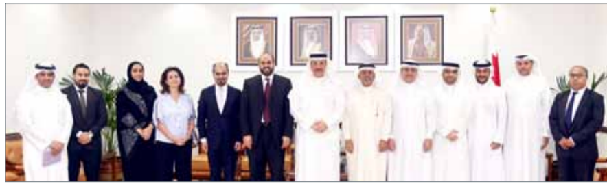
• وزير العمل ملتقياً عدداً من المؤسسات التدريبية الخاصة

العمل محمد الأنصاري. وأشاد بتوجهات نائب رئيس مجلس الوزراء، رئيس المجلس الأعلى لتطوير التعليم والتدريب، سمو الشيخ محمد بن مبارك آل خليفة؛ للارتقاء بمجالات التدريب بوصفه أهم ركائز التنمية الشاملة في البحرين.