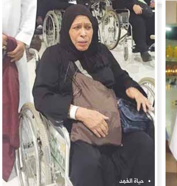
• حياة الفهد