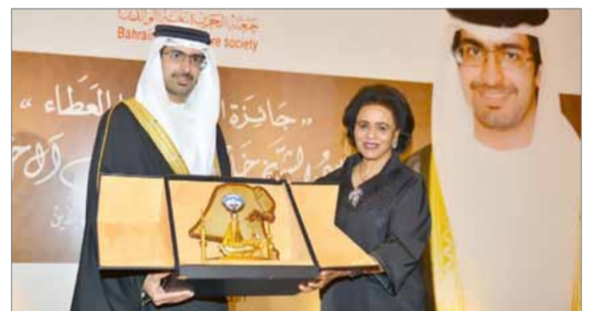
• الفقيدة لدى تسلمها جائزة سمو الشيخ خليفة بن علي للعمل الخيري 2014

نسختها الثانية العام 2014، حيث شرفت سموها الحفل بالحضور والمشاركة وكانت سموها رائدة في المجال الخيري والاجتماعي في داخل دولة الكويت الشقيقة وخارجها، وبوفاتها قد خسرت الأوساط الخيرية والاجتماعية أحد أبرز رموزها وشخصية اجتماعية فريدة.