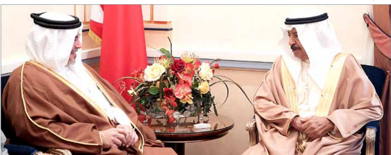
• سمو رئيس الوزراء مستقبلاً سمو ولي العهد

المنامة - بنا: استقبل رئيس الوزراء صاحب السمو الملكي الأمير خليفة بن سلمان آل خليفة ولي العهد نائب القائد الأعلى النائب الأول لرئيس مجلس الوزراء صاحب السمو الملكي الأمير سلمان بن حمد آل خليفة، بقصر القضيبي صباح أمس.