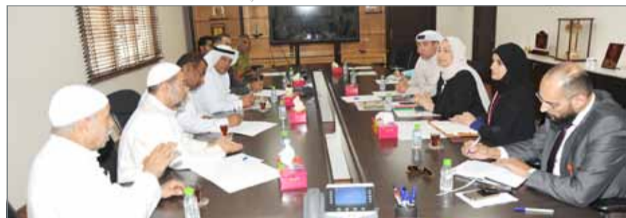
• مناقشة وضعية سوق جدحفص وبحث تحسين الخدمات البلدية واحتياجات التجار

سوق العمل من أجل ضبط العمالة السائبة التي يتسبب وجودها في عرقلة الحركة المرورية ويمتد تأثيرها إلى خلق المشاكل الاجتماعية والصحية والاقتصادية، واقتراحًا أن يتم تخصيص جزء من المساحة لاستخدامها من جانب بائعي المواد الموسمية نظير رسوم محددة، وتم الاتفاق على التزام الباعة بالخضوع الفاصلة لتقسيمات المحلات التجارية والفرشات التي يتم العمل عليها حالياً، والتي تنظم المساحة المخصصة للبيع.