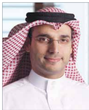
• هشام الرئيس

بما مقداره 1.14 مليار خلال الفترة نفسها من العام السابق. كما ارتفع إجمالي أصول المجموعة بنسبة 10.3%، إذ بلغت قيمته 4.3 مليار دولار خلال النصف الأول من العام 2018، مقارنة بما مقداره 3.9 مليار خلال الفترة نفسها من 2017. وقال رئيس مجلس الإدارة جاسم الصديقي "يعكس النمو في الربحية قوة ونجاح الإستراتيجية التي تنتهجها المجموعة، (...) لقد تمكنت المجموعة من تحقيق هذه النتائج بفضل المساهمات المتزايدة من نشاط الصيرفة الاستثمارية، والذي مازال قادراً على اقتناص الفرص المتاحة في السوق". من جانبه، قال الرئيس التنفيذي هشام الرئيس "مازال نشاط الصيرفة الاستثمارية يحقق نتائج متميزة وربحية عالية، ويتضح ذلك من التحسن الكبير الذي طرأ على الدخل المحقق للمجموعة خلال الفترة، والذي يرجع بالأساس إلى عدد من المعاملات الإستراتيجية، ومن بينها استثمارنا الهام في شركة "دي إنتر تينر" بالإمارات، والأصل العقاري الفاخر في شيكاغو".