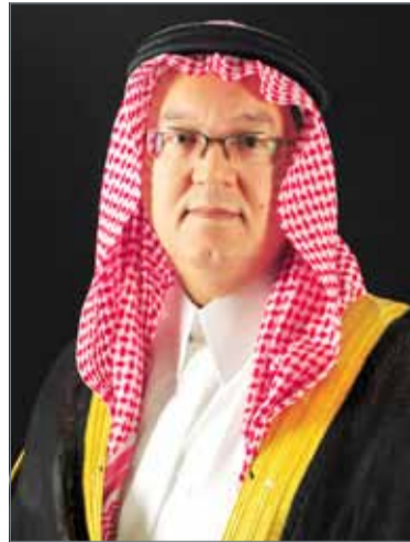
• الأمير عمرو الفيصل

تضمنت صافي ربح بلغ 1.58 مليون دينار لفترة الربع الثاني من 2018، أي زيادة بنسبة 22.0% مقارنة بصافي ربح بلغ 1.30 مليون دينار سجلت بالفترة نفسها من 2017. وكان صافي الربح الخاص بالمساهمين بالربع الثاني 2018 بلغ 0.54 مليون دينار، أي زيادة بنسبة 35.2% مقابل 0.40 مليون دينار، أرباح سجلت بالفترة نفسها من 2017. وعلى الرغم من استمرار نمو الدخل الأساس في هذه الفترة، والذي يتضح في الزيادة بنسبة 6.3% في المئة و2.5% بالدخل من محفظة المراجعة والتمويلات الأخرى وحصة الدخل من