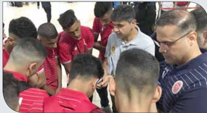
الأمين العام ينقل للوفد تحيات سمو الشيخ عيسى بن علي