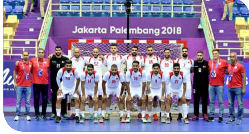
منتخبنا يطل مفاجأة العراق