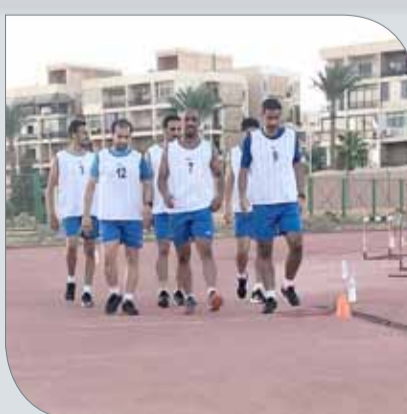
من الاختبارات البدنية للحكام

اختتم حكام الاتحاد البحريني لكرة القدم معسكر جمهورية مصر العربية، الذي أقيم في الأكاديمية العربية للعلوم والتكنولوجيا والنقل البحري بمدينة الإسكندرية، وذلك خلال الفترة 5 حتى 17 أغسطس الجاري، تحضيراً للموسم الرياضي الجديد 2018-2019.