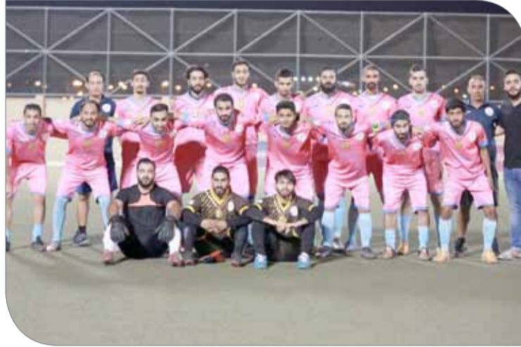
فريق مركز شباب سلماباد