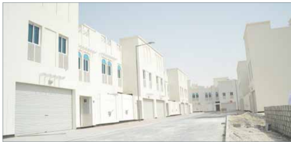
• مدينة خليفة