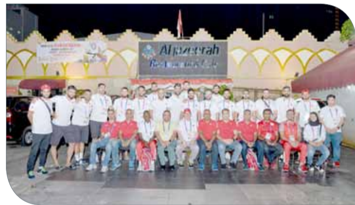
عسكر يتوسط منتخب اليد بعد حفل العشاء

الوطنية للمشاركة في الدورة". وأبدى طالب بعض المخاوف بشأن مشوار منتخبنا في الدورة، مضيفاً "هناك أمور تقلقني مثل عدم خوض أي مباراة تجريبية أو معسكر خارجي قبل الدورة، وقد حاول الاتحاد استضافة أندية ومنتخبات أوروبية ولكن لضيق الوقت وتزامن الفترة الماضية مع الراحة الإجبارية للمنتخب لم تتكامل المساعي بالنجاح، بالإضافة إلى أن