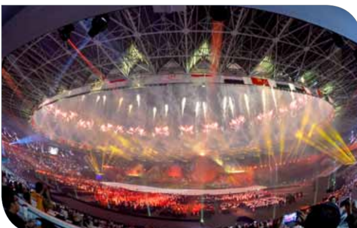
لوحات فنية رائعة شملها حفل افتتاح الدورة

وأضاف سموه أن آسياد جاكرتا 2018 يشكل محطة أخرى واختبار جديد أمام الرياضة البحرينية نأمل من خلالها أن يعزز أبطالنا سجل مملكة البحرين المشرف في الدورات الآسيوية ويكونوا شركاء حقيقيين في عام "الذهب فقط" ولقد وضعنا كل ثقتنا في أبطالنا وبطلاتنا من أجل مضاعفة حجم الإنجازات التي حققتها المملكة في مشاركتها الآسيوية المختلفة بعد أن حرصت اللجنة الأولمبية البحرينية على توفير مختلف أشكال الدعم والمساندة لهم وتهيئة الأجواء الفنية والإدارية أمامهم من أجل الوصول إلى الذهب