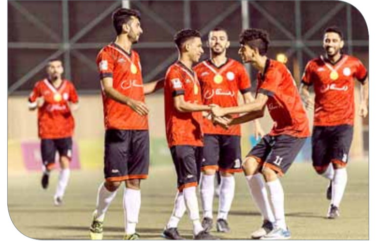
فرحة لاعبي دمستان تكررت 6 مرات

وأشار إلى أن فريقه ربّ صفوفه جيداً بعد استقبال الهدف الثاني والإحساس بخاطر التعادل، مشيداً بما أظهره زملاؤه اللاعبون من استفاقة سريعة في مجريات المباراة؛ الأمر الذي عزز من قوة الفريق وعودته لمستواه الطبيعي وتسجيل 3 أهداف خلال الدقائق الأخيرة، وهي الحاسمة للنقاط الثلاث.