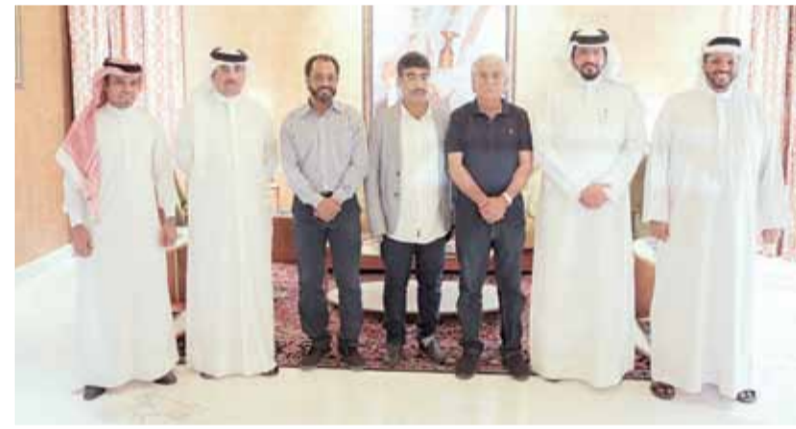
• لجنة قراءة النصوص والتقييم في المهرجان