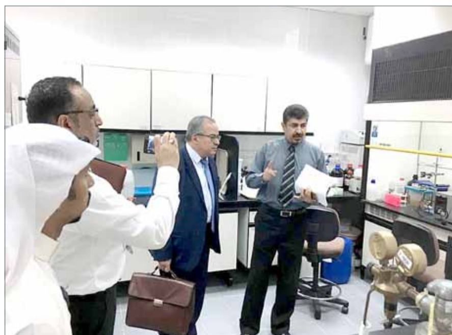
• خبير الوكالة الدولية للطاقة الذرية لدى زيارته مختبر الصحة العامة

الضارة، كما يجمع كوادر وطنية مؤهلة من المتخصصين والكيميائيين المؤهلة علمياً وعملياً للقيام بعمليات التحاليل اللازمة للمواد الغذائية مما يضاها مثيلاتها من المختبرات في الدول المتقدمة بمختلف المجالات العلمية.