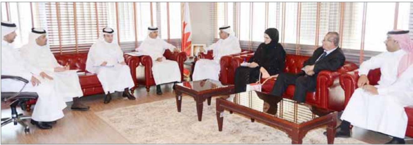
• اجتماع عمل بين وزارة العدل وجمعية مصارف البحرين

المنامة - جمعية مصارف البحرين: عقدت جمعية مصارف البحرين اجتماع عمل مع وزارة العدل والشؤون الإسلامية والأوقاف جرى خلالها استعراض آخر مستجدات مشروع الجمعية حول إنشاء محكمة مالية خاصة بالقطاع المصرفي، لما لذلك من أهمية في تريع الإجراءات وتعزيز مكانة البحرين كمركز مالي متطور في المنطقة إضافة إلى جذب استثمارات أجنبية في القطاعين المالي والمصرفي.