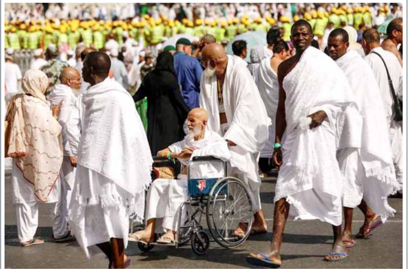
• ضيوف الرحمن يتدفقون على مكة المكرمة استعداداً لأداء مناسك الحج

أثبت علماء من جامعة واشنطن أن الرجال يفكرون بشكل أسرع، يتخذون القرارات الأكثر صواباً، ويتحملون الضغوط بشكل أفضل بكثير من النساء. وأجرى الباحثون تجربة فريدة تمت فيها دراسة ردود الفعل على المعلومات المرسدة بالرسم، وعلى الرغم من أن معالجة البيانات من الرسوم التوضيحية والمخططات تتم من قبل جهاز الرؤية لدى المرأة والرجل بنفس الطريقة والآلية، إلا أن الباحثين أشاروا إلى أن الرجال هم الذين يتخذون القرارات الأكثر منطقية وعقلانية استناداً إلى البيانات، بحسب صحيفة "Cell". ووفقاً للعلماء، فإن دماغ المرأة يعالج المعلومات الواردة أبطأ من الرجال بنسبة تتراوح ما بين 25-75%. وهذا ما لا يسمح عادة بالإجابة على الأسئلة المتعلقة بالتحكم العقلاني بشكل صحيح، ما يؤدي إلى عدم القدرة أيضاً على تقييم القدرات المعرفية للجنس اللطيف بشكل دقيق.