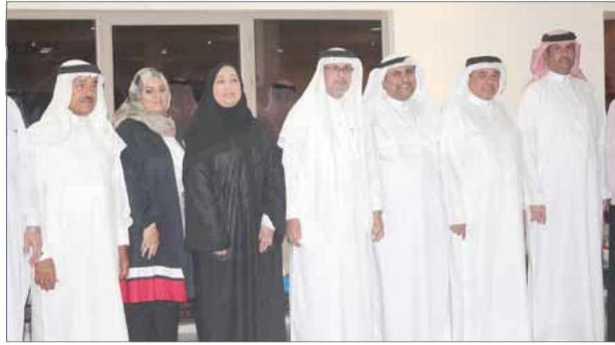
• تكريم الكوادر الوطنية بمجلس أمانة العاصمة والجماز التنفيذي بالأمانة