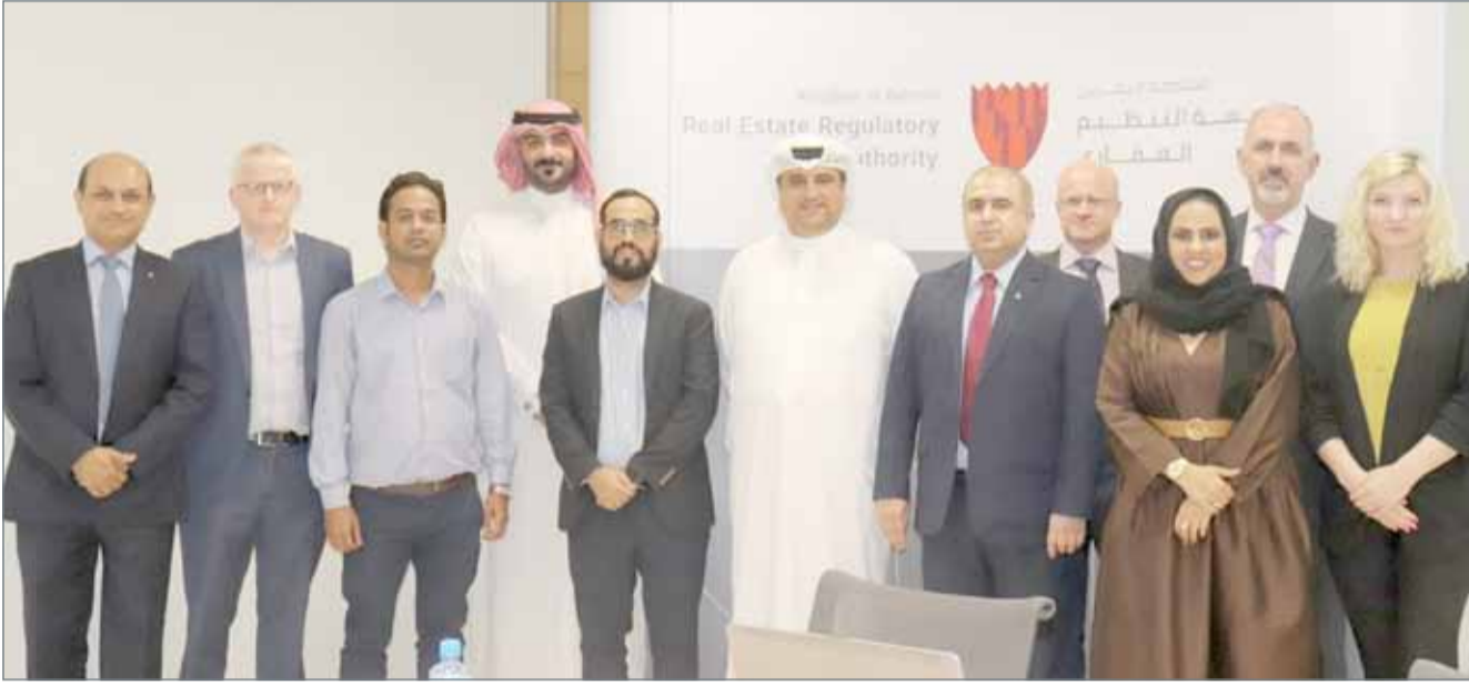
• من أهم أهداف مؤسسة التنظيم العقاري ضمان توفير خدمات فعّالة وشفافة من العاملين في القطاع

المستثمرين المحليين والدوليين تماشياً مع رؤية ملك البلاد صاحب الجلالة الملك حمد بن عيسى آل خليفة في زيادة مساهمة القطاعات غير النفطية في الاقتصاد الوطني، والذي يعد من الأولويات الرئيسية للحكومة تحت قيادة رئيس الوزراء صاحب السمو الملكي الأمير خليفة بن سلمان آل خليفة، ومن ضمن الخطط الاستراتيجية للجنة التنسيقية برئاسة ولي العهد نائب القائد الأعلى النائب الأول لرئيس مجلس الوزراء صاحب السمو الملكي الأمير سلمان بن حمد آل خليفة.