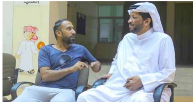
• جانب من زيارة لجنة النصوص والتقييم لبروفة مركز شباب المحرق

وفي الختام، ناقشت اللجنة التوصيات والقرارات التي تم اتخاذها خلال الاجتماعات السابقة للجنة ومتابعة سير العمل فيها، إلى جانب استعراض المشاريع والمشتريات التي تم تمريرها من قبل فريق مراجعة مشاريع تقنية المعلومات والاتصالات بهيئة المعلومات والحكومة الإلكترونية.