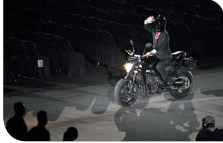
الرئيس الأندونيسي حضر إلى حفل الافتتاح بدراجة نارية