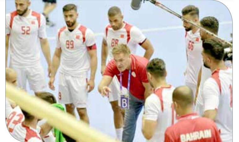
الجهاز الفني استفاد من الدور التمهيدي

الوطنية للمشاركة في الدورة". وأبدى طالب بعض المخاوف بشأن مشوار منتخبنا في الدورة، مضيفاً "هناك أمور تقلقني مثل عدم خوض أي مباراة تجريبية أو معسكر خارجي قبل الدورة، وقد حاول الاتحاد استضافة أندية ومنتخبات أوروبية ولكن لضيق الوقت وتزامن الفترة الماضية مع الراحة الإجبارية للمنتخب لم تتكامل المساعي بالنجاح، بالإضافة إلى أن