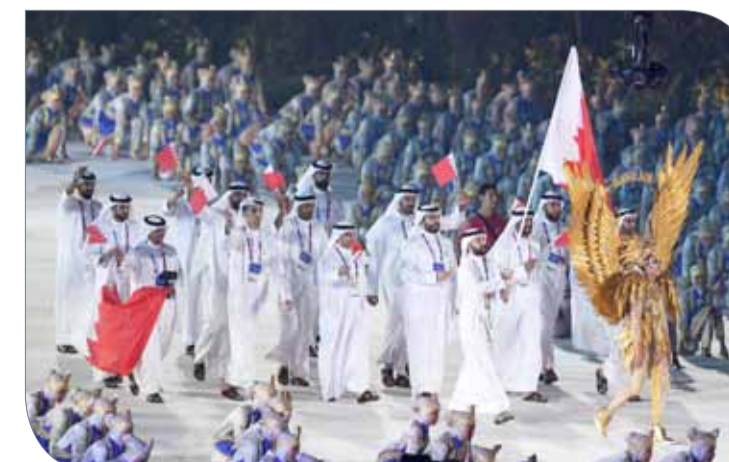
جانب من دخول الطابور البحريني لحفل الافتتاح