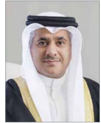
• وزير المواصلات والاتصالات

وقد تم التأكيد على استعراض طائرة التاييفون لمتحف المعرض الملكي للطيران الحربي في كل يوم من أيام المعرض. ومن جانبه، حرح وزير الاتصالات والمواصلات: ”تعتبر هذه الاتفاقية لمشاركة شركة بي أيه إي سيستمز في معرض البحرين الدولي للطيران 2018 من أهم الاتفاقيات.