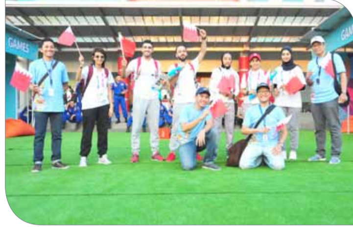
جانب من مشاركة الوفد البحريني في بالمبانغ لاحتفالية افتتاح الدورة

حرصت اللجنة المنظمة بمدينة بالمبانغ على إقامة احتفالات كبيرة ومتنوعة تزامناً مع حفل افتتاح الدورة الـ 18 للألعاب الآسيوية، حيث تم تخصيص المنطقة المقابل للملعب الرئيسي بالقرية الرياضية ببالمبانغ من أجل إقامة الاحتفالية الكبرى بانطلاق الدورة، ووضع