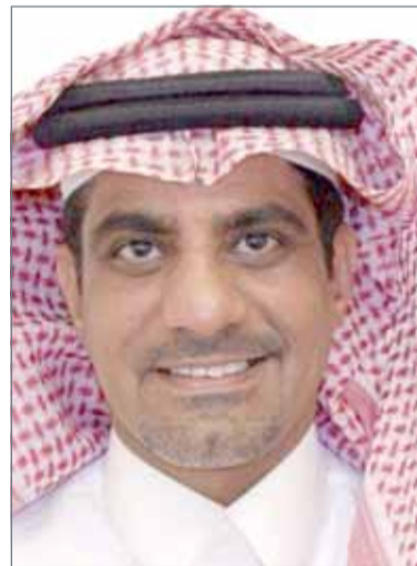
• فهد الداود

مسافرا في يوم واحد بمتوسط زمن عبور 30 دقيقة وهذه أقل فترة زمنية سجلت للعدد أنف الذكر بتاريخ 18 يونيو 2018. وأضاف: كما سجلت أعلى عدد للمركبات بواقع 43,334 مركبة في يوم واحد بتاريخ 12 أغسطس 2018، ويمثل الرقم الأعلى منذ افتتاح جسر الملك فهد العام 1986.