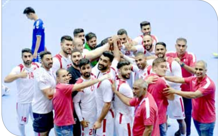
بالعزيمة والإصرار تصدر الأحمر مجموعته