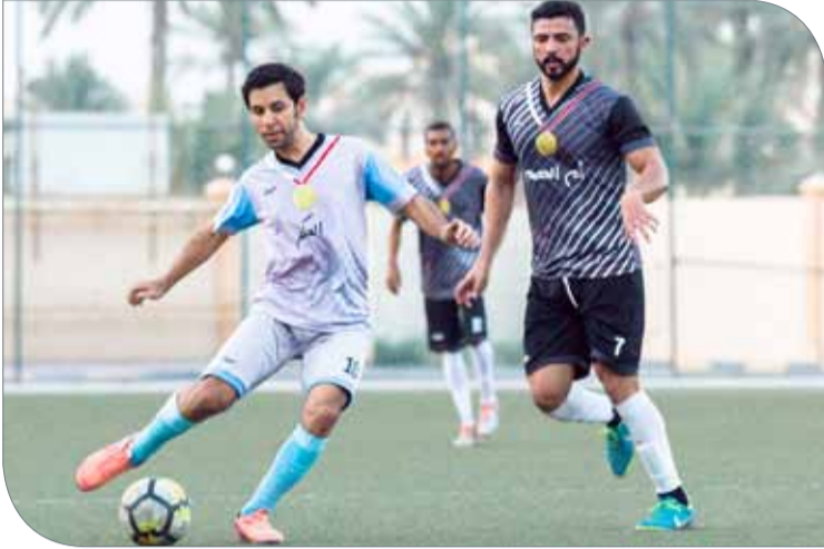
أم الحصم فاز على العكر بصعوبة