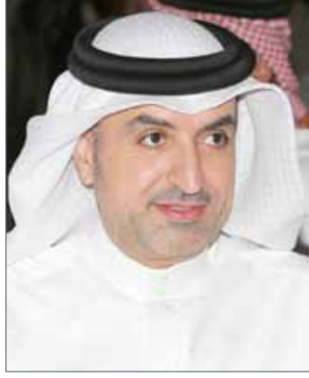
• وزير شؤون الشباب والرياضة

وفي هذا الإطار، أشادت الفرق المشاركة بالدور الذي تلعبه لجنة قراءة النصوص والتقييم في المساهمة والمساعدة مع أطقم العمل للعروض، للارتقاء بأعمالهم وإخراجهم بأفضل صورة. وتضمنوا هذه الخطوة المهمة التي استحدثتها اللجنة المنظمة العليا، وتهدف في المقام الأول لتحقيق أكبر استفادة ممكن من خبرات أعضاء اللجنة، الذين يتمتعون بخبرة طويلة وكفاءة عالية لها العديد من الانعكاسات الإيجابية على أطقم عمل العروض المشاركة لمختلف الفرق.