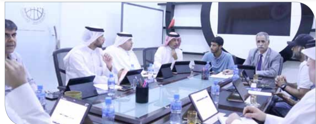
جانب من اجتماع اللجنة المنظمة العليا لتصفيات كأس آسيا

مع القناة الرياضية، وكذلك مناقشة كافة الأمور الأمنية مع ممثل وزارة الداخلية. واعتمدت اللجنة صالتي نادي المنامة ونادي المحرق كمقر لتدريبات المنتخب المشاركة، إذ قدمت اللجنة في هذا الصدد الشكر لإدارة الناديين على التعاون الإيجابي المتبادل.