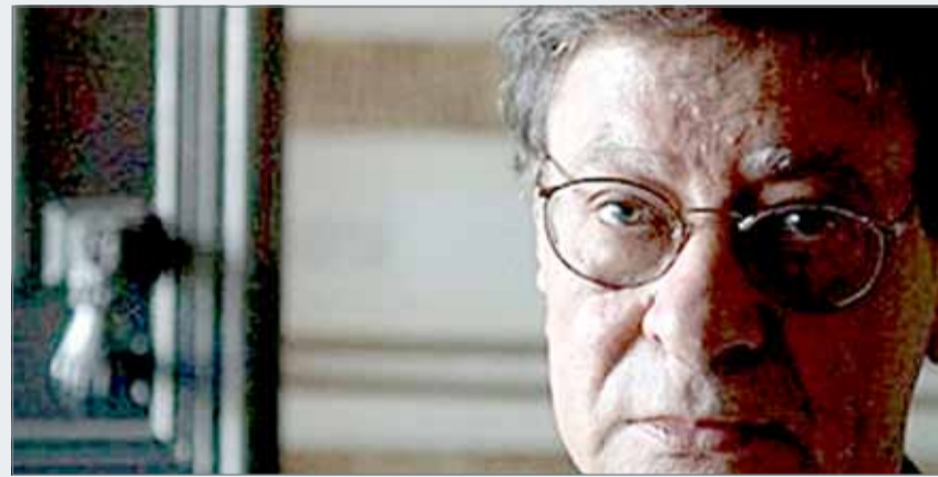
• الشاعر الفلسطيني محمود درويش

ومن الفردي إلى الإنساني لم تكن تعني إبطال البعد الأيديولوجي والفكري السياسي في خطاب درويش الشعري، بل تترجمه إبداعاً خطاب يحترم الشرط الفني والضرورة الجمالية، والوعي بمكوناتهما الأساسية التي أصبحت تشكل الاهتمام الأول في عملية القول الشعري، وظل الشاعر أميناً لرؤياه السياسية مع فارق تعبيرية بين قوله في طور البدايات: