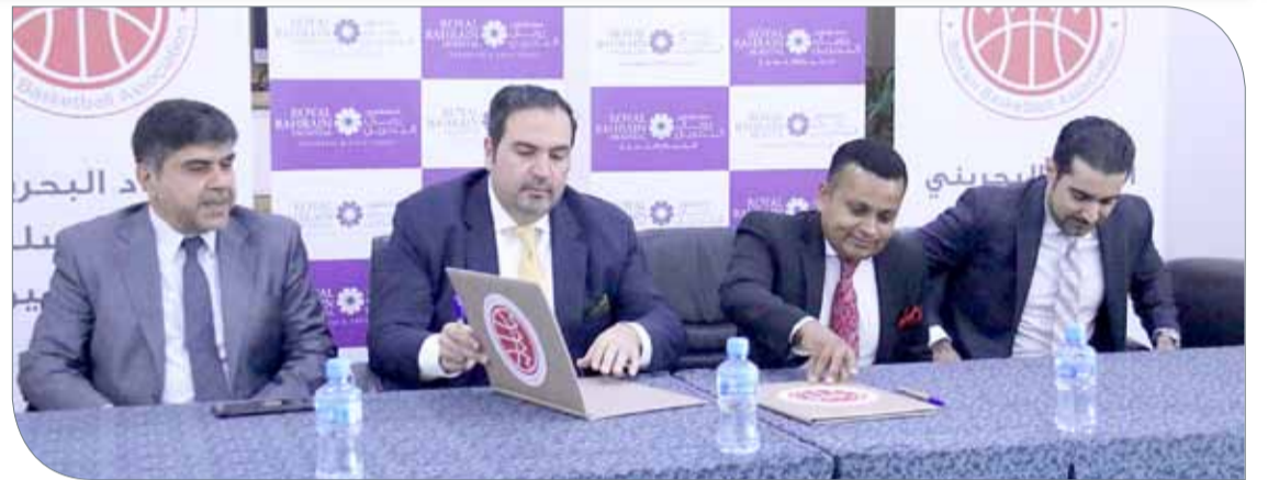
جانب من توقيع الاتفاقية بين الاتحاد البحريني لكرة السلة ومستشفى رويال

الرياضي البحريني سواء لاعبين أو إداريين وحتى الجماهير كذلك، وبالتالي فإن وجود اسم مستشفى رويال البحرين ضمن هذه الخطوات يكون في مستوى المسؤولية وأن تقدم عملاً مميّزاً يساهم في نجاح كافة البرامج والأنشطة الخاصة بالاتحاد. وتم في الاجتماع التأكيد على أنه بالإضافة لتواجد سيارات الإسعاف في جميع مباريات المسابقات المحلية للاتحاد للدرجة الأولى وكأس خليفة بن سلمان وتصفيات كأس آسيا، فسيتم تقديم بعض الخدمات الصحية المتميزة للاعبين منتخب كرة السلة، ومنها خدمات الفحص السنوي، بالإضافة لفحص الأشعة المغناطيسية عند الحاجة، بالإضافة لبعض الخدمات الطبية التي يتميز بها مستشفى رويال البحرين، وأيضاً تخفيض الرسوم على أمور صحية أخرى مهمة.