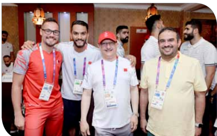
جانب من حفل العشاء