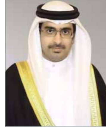
• سمو الشيخ خليفة بن علي بن خليفة

الاستثمار وازدياداً ملحوظاً في افتتاح المحلات التجارية والمشاريع الاستثمارية الرائدة. وأكد أن "أنظار المستثمرين وزوار المملكة اليوم مبصرة للمحافظة الجنوبية، لما فيها من مقومات فريدة وامتياز كالمساحة الشاسعة والبيئة الآمنة وتاريخ وحضارة وطبيعة لافتة وعزيمة وطموح محافظ الجنوبية كلها تهدفنا بالحصول على أعلى المستويات والمراتب". وأعلنت المحافظة الجنوبية أن المنتدى سيشهد إعلانات جديدة لتطوير بعض الأماكن السياحية والتراثية بالمحافظة وخطط ترويجية رائدة لدعم اسم المحافظة الجنوبية دولياً، كما سيشهد المنتدى فقرة لتكريم الأماكن التجارية والاستثمارية في بيئة تنافسية لتشجيع ودعم النشاط الاستثماري والسياحي والتجاري، حيث سيتم إعلان تفاصيل المسابقة لاحقاً.