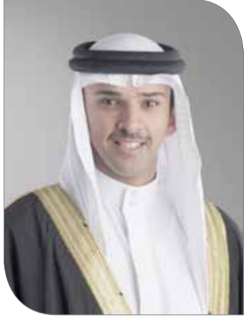
الشيخ علي بن خليفة