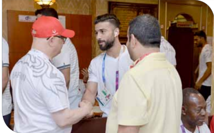
عسكر ملتقياً لاعبيه منتخب اليد