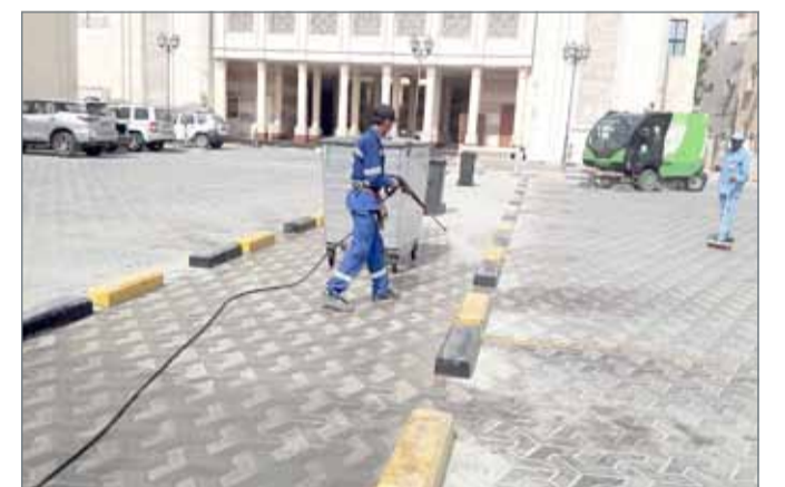
• جانب من تنظيف المساجد والجوامع

الرفاع - بلدية الجنوبية: بمناسبة قرب حلول عيد الأضحى المبارك وجرياً على عاداتها السنوية، قامت بلدية الجنوبية بترتيبها السنوية لتنظيف المساجد والجوامع ومصليات العيد بالتعاون مع الأوقاف السنية، وذلك من منطلق اهتمام البلدية وحرصها الكبير على توفير سبل الراحة للمصلين خاصة أوقات المناسبات الدينية.