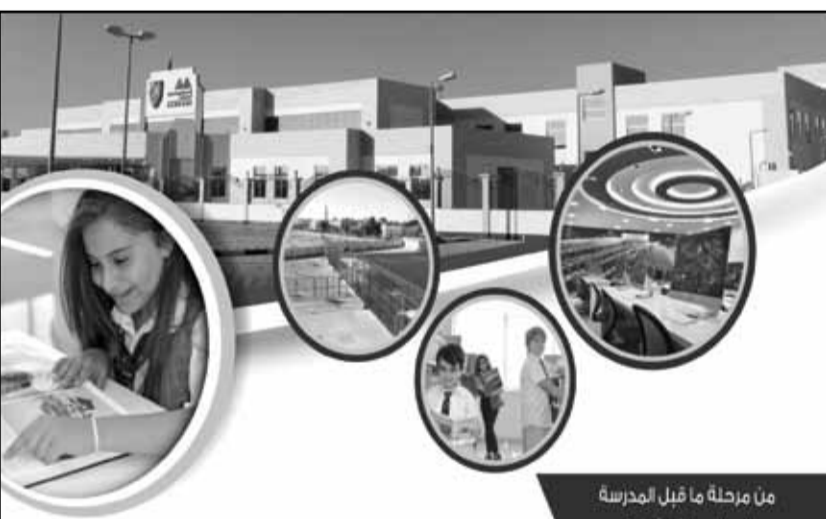
من مرحلة ما قبل المدرسة إلى المرحلة الثانوية

وأشاد الخبير خلال الزيارة بالمستوى الناجح الذي حققه المختبر خلال السنتين الماضيتين في إنجاز البرنامج المشترك وكذلك الاستعدادات الفنية والتقنية للمشروع القادم المتمثلة في الأجهزة الحديثة والمتطورة للكشف عن المعادن الثقيلة والتلوث الإشعاعي في عينات الأسماك والمنتجات البحرية المحلية والمستوردة.