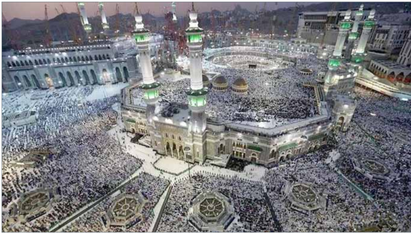
• وصول أكثر من مليوني حاج إلى مكة المكرمة

الإحرام البيضاء استعداداً لأداء فريضة الحج، التي تبدأ شعائرها اليوم الأحد 8 ذي الحجة.