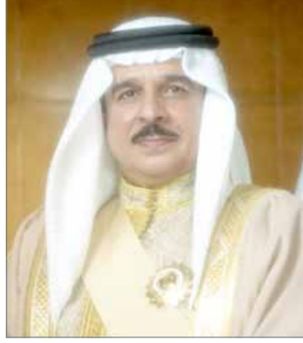
• جلالة الملك

الآليات المناسبة وأنواع المساعدات الطارئة المطلوبة بشكل عاجل في هذه الفترة الحرجة. بدوره، ثمن سفير جمهورية الهند هذه