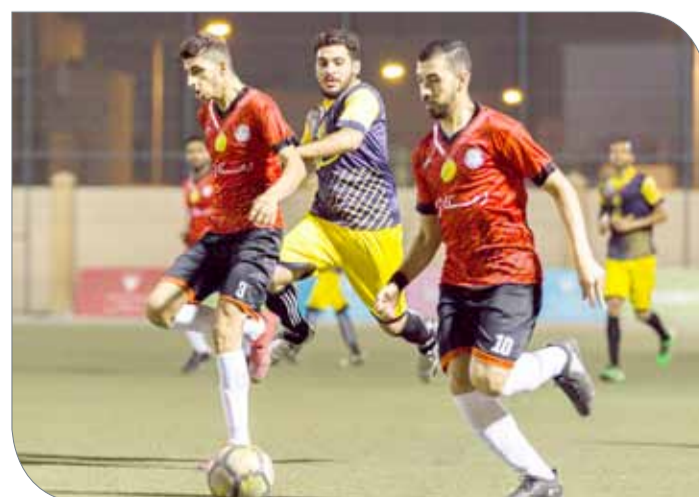
من لقاء دمستان وسند