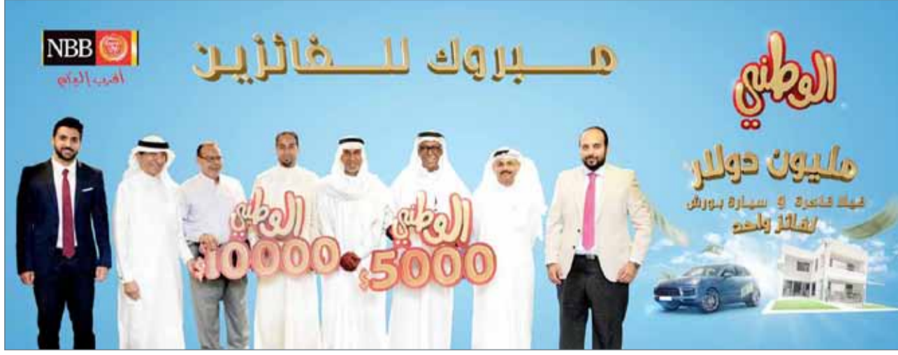
• تسليم الجوائز إلى الفائزين

بالجوائز وشكرهم على دعمهم المتواصل لبنك البحرين الوطني. وأضاف الأحمد ”نحن نعتز بولاء عملائنا الكرام، كما وسنواصل تركيزنا على تقديم أفضل الخدمات والمنتجات بالإضافة لترح أفضل وأكبر الجوائز. وضمن هذا السياق، قمنا بتعزيز جوائز برنامج ادخار الوطني لهذا العام وتدعيمها بأكثر جائزة تم طرحها على إطلاق على مستوى المملكة (مليون دولار وفيلا فاخرة في الرفاع فيوز وسيارة بورش) كما ونتطلع قدماً إلى الإعلان عن فائزين جدد لهذا البرنامج“. ويتأهل أصحاب حسابات التوفير في الدخول تلقائياً للسحب دون الحاجة لفتح حساب خاص أو شراء شهادات توفير، علاوة عن تأهل أصحاب حسابات موجة الادخار من الشباب لدخول السحوبات.