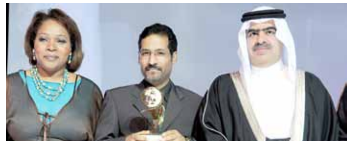
• مؤلف "أم سحنون" يتسلم الذهبية