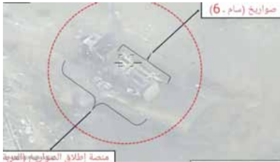
صور جوي (سام 6)