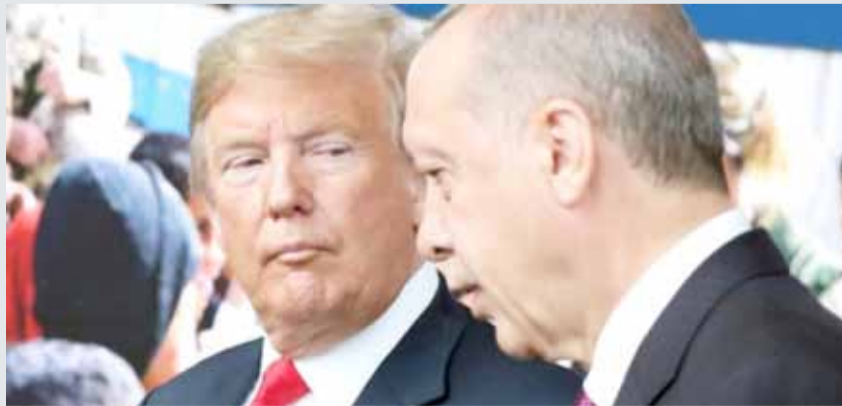
• الرئيسان الأميركي دونالد ترامب والتركي رجب طيب اردوغان (أرشيفية)

وتابع خلال هذا المؤتمر الذي يهدف إلى تجديد قيادة الحزب، "البعض يعتقد أن بإمكانه تهديدنا عبر الاقتصاد، العقوبات، أسعار الصرف، معدلات الفوائد والتضخم. لقد كشفنا خدعكم