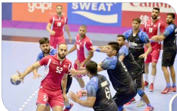
من لقاء منتخبنا والهند بالجولة الثانية