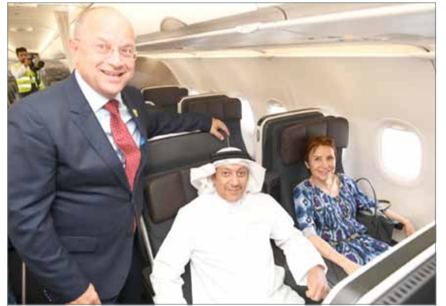
• ”طيران الخليج“ أول ناقلة وطنية في المنطقة تشغل طائرة من طراز إيرباص A320neo

A320neo حيث تواصل إيرباص استثمار ما يزيد عن 300 مليون يورو سنوياً في مجال الابتكار والتحديث لأسرة A320، وذلك للحفاظ على مكانتها كأحد أكثر طائرات الممر الواحد تطوراً وأكثرها تقدماً في استهلاك الوقود. تتميز هذه الطائرة الجديدة بأكثر مقصورة ممر فردي في السوق، وهي مجهزة بمحرك LEAP-1A من شركة CFMInternational، وتتميز بأجهزة الجناح الكبيرة المعروفة باسم Sharklets، حيث يوفر المحركان معاً ما نسبته 15% من استهلاك حرق الوقود لكل مقعد. كما أن طائرة A320neo صديقة للبيئة، حيث إنها تقلص انبعاث غاز ثاني أكسيد الكربون سنوياً عن كل طائرة بمقدار 5000 طن، وتقلص نسبة الضوضاء بنسبة 50% تقريباً مقارنة بطائرات الجيل السابق. وقد حصلت طيران الخليج في وقت سابق من هذا العام على 3 طائرات بوينغ 787-9-9 دريملاينر، حيث تواصل مشروعها لتطوير أسطول طائراتها الذي سيشهد بحلول نهاية العام 2023 ما مجموعه 39 طائرة جديدة: 10 طائرات بوينغ 787-9-9 دريملاينر، و12 طائرة من طراز إيرباص A320neo، و17 طائرة من طراز إيرباص A321neo.