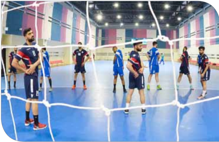
من تدريبات رجال اليد