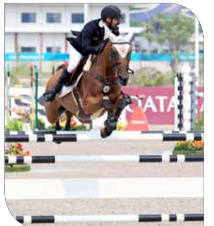
الفارس حسن بن راشد