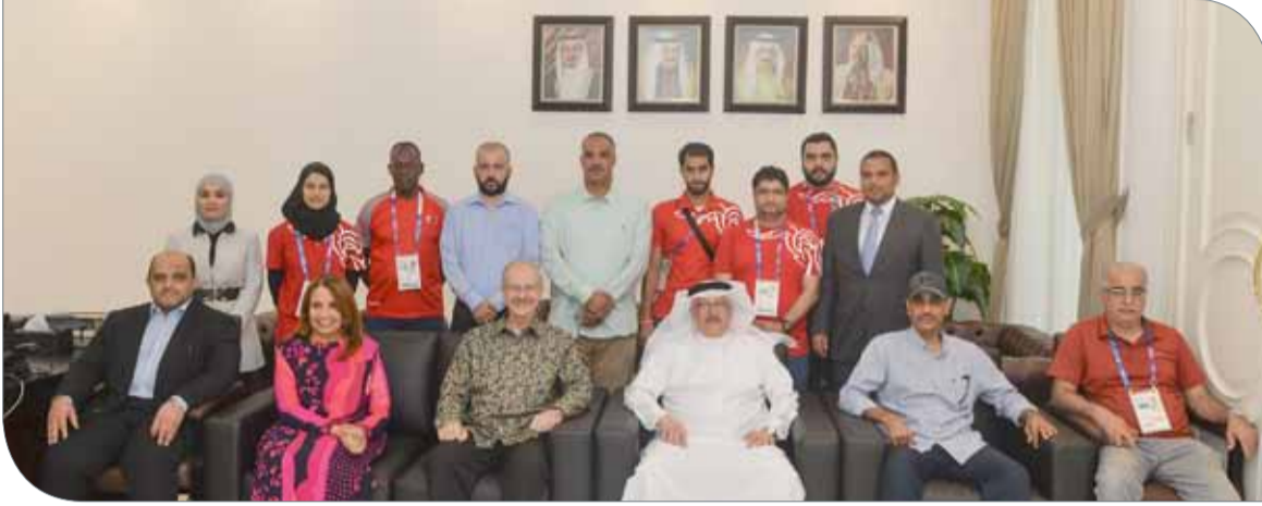
السفير مع وفد اللجنة الأولمبية البحرينية

إندونيسيا | حسن علي | عيسى عباس | (تصوير: علي الحلواجي)