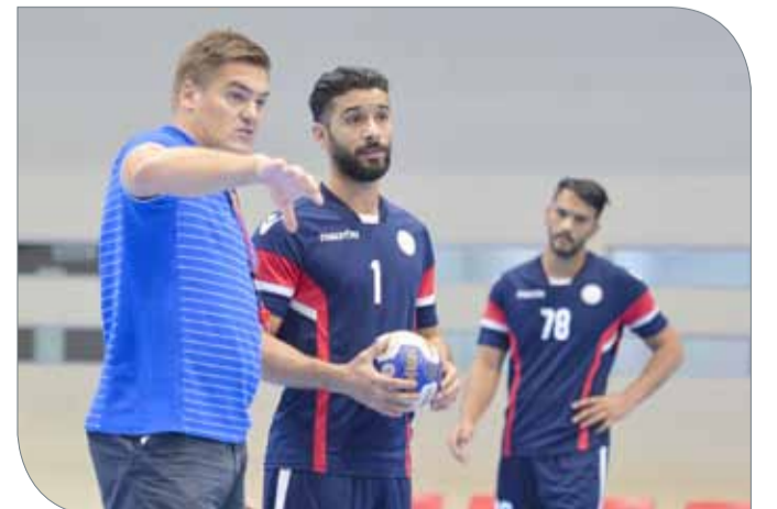
جانب من تدريبات المنتخب الوطني لكرة اليد