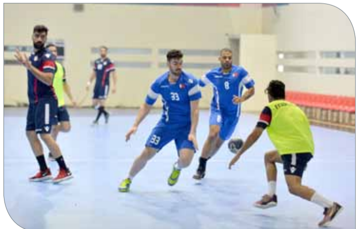
جانب من تدريبات المنتخب الوطني لكرة اليد

ويعتبر فرسان المملكة العربية السعودية ودورة الإمارات العربية المتحدة إضافة إلى الكويت واليابان من بين أقوى الفرسان على مستوى القارة، مع امتلاكهم لجياد قوية، إلا أن فرسان البحرين مقدورهم تعويض سوء الحظ الذي لازمه في منافسات الفرق والمنافسة على