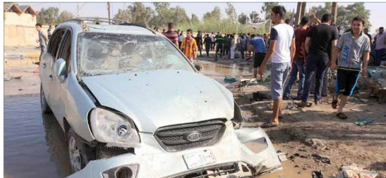
استهداف نقطة أمنية للجيش العراقي في القائم بمحافظة الأنبار

يرجف منها الفاسدون، هبوا لتقولوا قولتكم كلا للطائفية، وكلا للفساد وكلا للمحاصصة، وكلا للإرهاب وكلا للمحتل. ولفت الصدر إلى أن العراق بحاجة ماسة، لوقفة سلمية غاضبة تكون أول بوادر بناء عراق جديد، بعيد عن كل فاسد، وظالم وكل معتد ومحتل أقيم.