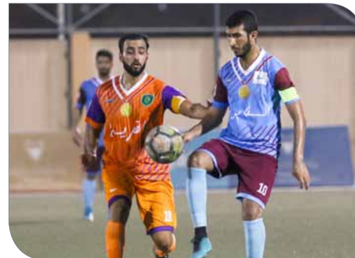
فوز كبير للسنابس على القرية

الثانية، تمكن فريق مركز شباب سلماباد من إقصاء فريق مركز شباب الهمة بعد فوزه المستحق عليه بهدفين دون مقابل. وكان سلماباد قد ضمن التأهل مسبقاً للدور الثاني من الدوري ومنافسات