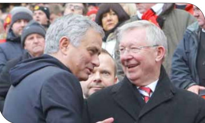
أليكس فيرجسون وجوزيه مورينيو

جال، ضمن مجموعة من اللاعبين، الذين تدربوا تحت قيادة فيرجسون، وكان من المتوقع حصولهم على أدوار، في الجهاز التدريبي للفريق، لفترة طويلة. وهذا ينطبق أيضاً على بول سكلوز وجاري فيل نيفيل، الذين ذهبوا إلى العمل في مجال التحليل التلفزيوني، بدلا من تطوير المواهب في يونايتد. ولا شيء من هذا كله، كان حدوثه لا مفر منه. وفي الماضي أظهرت أندية القمة، قدرتها على الحفاظ على ثقافتها الداخلية، رغم إجراء تغييرات في أفراد الجهاز الفني. وأشهر مثال هو ليفربول، وبعد تولى بيل شانكلي المسؤولية لمدة 15 عاما، حقق الريدز النجاح لسنوات، بالاعتماد على أشخاص من النادي.