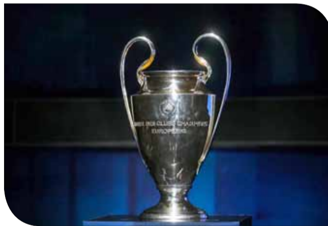
باريس سان جيرمان أو يوفنتوس أو مانشستر سيتي كبطل للمجموعة. التصنيف الأول: ريال مدريد،

التصنيف الرابع: كلوب بروج، جالاتا سراي، إنتر ميلان، هوفنهايم.