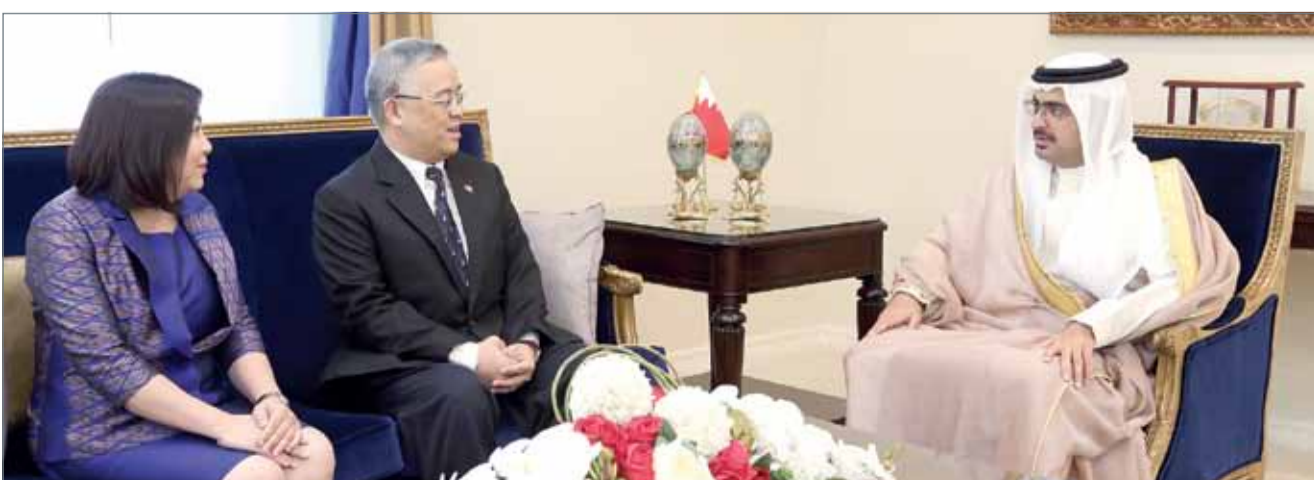
• خلال استقبال سمو الشيخ خليفة بن علي بن خليفة للسفير التايلندي

كما ناقش سمو محافظ الجنوبية مع سفير مملكة تايلند أوجه التعاون والتنسيق المشترك بين المحافظة والسفارة التايلندية من خلال دعم الأنشطة والبرامج الثقافية للسفارة التايلندية وكل ما من شأنه تعزيز العلاقات بين البلدين. من جانبه، أشاد سفير مملكة تايلند لدى مملكة البحرين بما تطرق إليه سمو محافظ الجنوبية من مواضيع تتعلق بالعلاقات المتميزة القائمة بين البلدين الصديقين وسبل تعزيز التعاون بينهما، مؤكدا تعاون سفارة مملكة تايلند مع المحافظة الجنوبية لكل ما من شأنه تعزيز العلاقات بين البلدين.