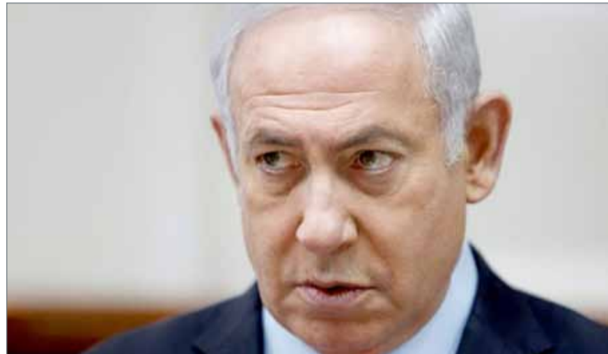
نتنياهو خلال اجتماع رئاسة الوزراء في مكتبه بالقدس المحتلة

وقال خلال حفل لإطلاق اسم الرئيس الإسرائيلي الراحل شعومون بيريس على المجمع الواقع بالقرب من بلدة ديمونة الصحراوية "هؤلاء الذين يهددون بمحونا يضعون أنفسهم في خطر مهائل، ولن يحققوا هدفهم بأي حال من الأحوال". وجاءت تصريحات نتنياهو، التي وزعها مكتبه مكتوبة، في وقت تضغط فيه إسرائيل على القوى العالمية لتحدو حذو الولايات المتحدة في الانسحاب من الاتفاق البرم مع إيران العام 2015 والذي حد من القدرات النووية لإيران. من جانب آخر، أقرت محكمة إسرائيلية بقانونية