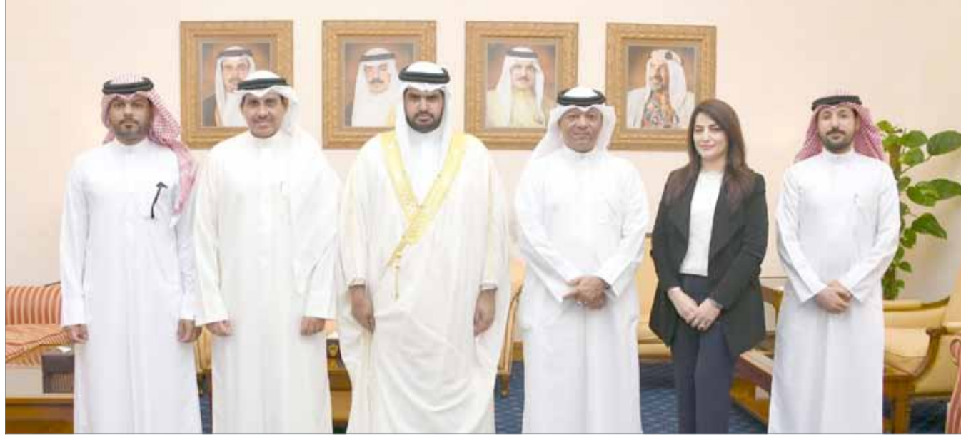
• سمو الشيخ عيسى بن علي لدى استقباله رئيس وأعضاء اللجنة المنظمة لجائزة سموه للعمل التطوعي