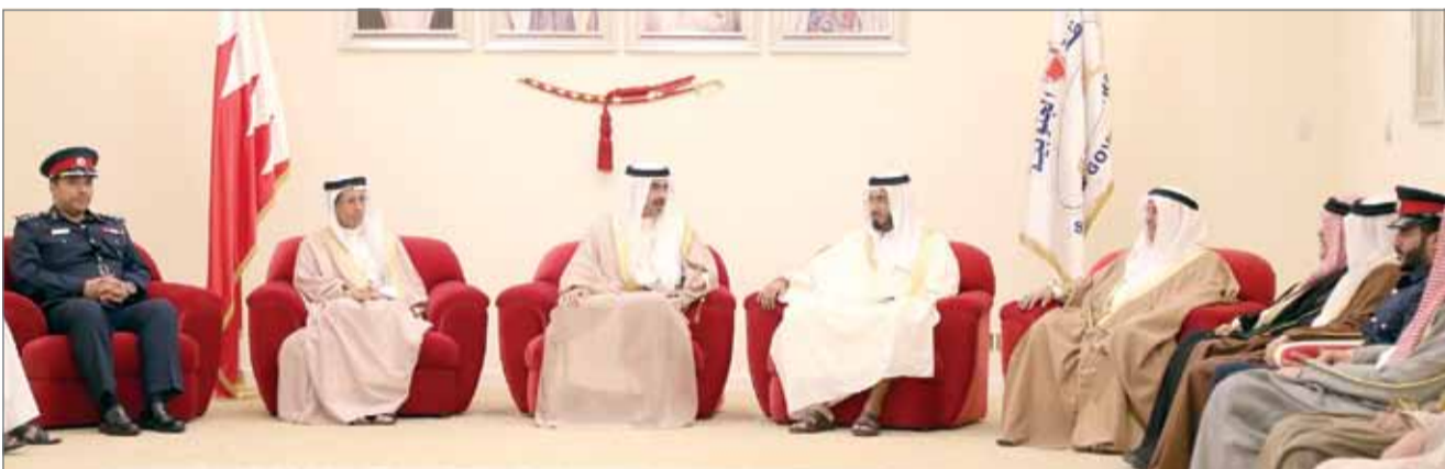
• سمو الشيخ خليفة بن علي لدى استقباله لعدد من الضباط وأعيان الجنوبية والمواطنين

كما شدد سمو محافظ الجنوبية على حرص المحافظة بالتواصل المستمر والمباشر بين المحافظة وكافة الأجهزة الأمنية؛ من أجل متابعة الأوضاع الأمنية وتوفير سبل السلامة والراحة للمواطنين. من جانبهم، عبر الحضور عن شكرهم وتقديرهم للتواصل الدائم الذي يحرص على تجسيده سمو الشيخ خليفة بن علي بن خليفة آل خليفة، وما تقوم به المحافظة الجنوبية من متابعة ورصد لاحتياجاتهم وتطلعاتهم.