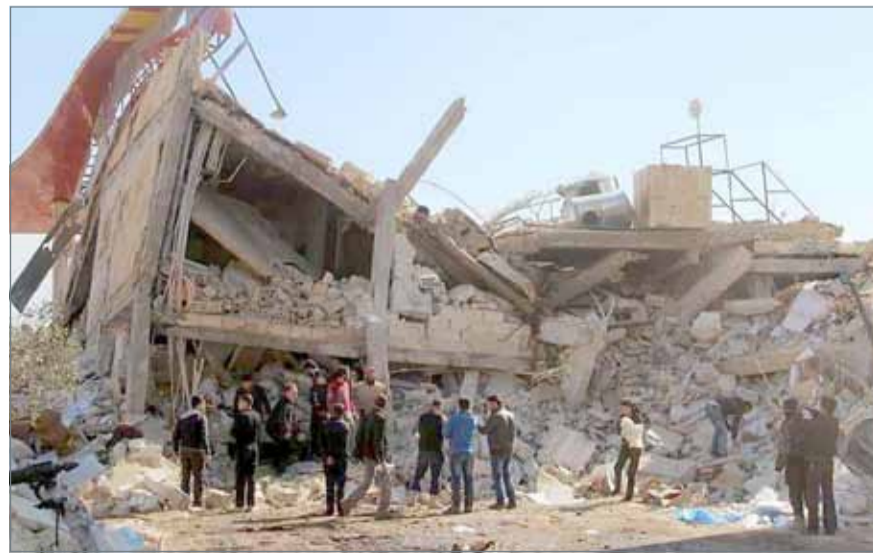
محافظة إدلب تعاني وضعا إنسانيا صعبا

وأوضحت إدلب، التي تقع في شمال غرب سوريا على طول الحدود مع تركيا، آخر معقل للفصائل المعارضة بعد طردها تدريجياً من مناطق عدة في البلاد. وأكدت دمشق في الآونة الأخيرة أن المحافظة على قائمة أولوياتها العسكرية. ويعيش في محافظة إدلب حالياً نحو 2.3 مليون