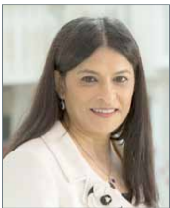
• رائدة العلوي

وتعد الجامعة الأهلية أول جامعة خاصة في مملكة البحرين، إذ ينتظم فيها اليوم نحو 2000 طالب وطالبة، فيما خرجت 12 فوجاً من طلبتها منضمين خريجين بدرجات البكالوريوس والماجستير والدكتوراه من ست كليات علمية، هي: كلية تكنولوجيا المعلومات، كلية العلوم الإدارية والمالية، كلية العلوم الطبية والصحية، وكلية الآداب والعلوم والتربية، وكلية الهندسة، وكلية الدراسات العليا والبحوث، إذ تهدف الجامعة منذ نشأتها إلى تقديم نموذج راق من التعليم ذي الجودة العالية في إطار تعزيز الدور الريادي لمملكة البحرين في مجال التعليم العالي.