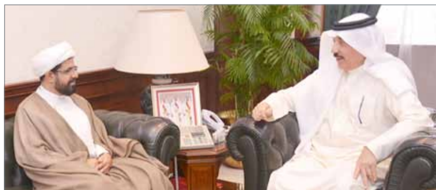
• وزير العمل مستقبلا النائب العصفور

وتوفير التأمين ضد التعطل، ومد شبكة الضمان الاجتماعي لتشمل جميع الشرائح المستهدفة.