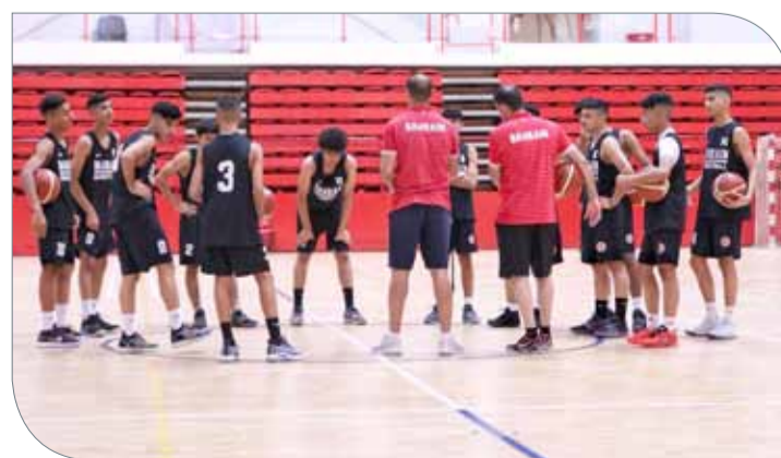
جانب من الحصة التدريبية