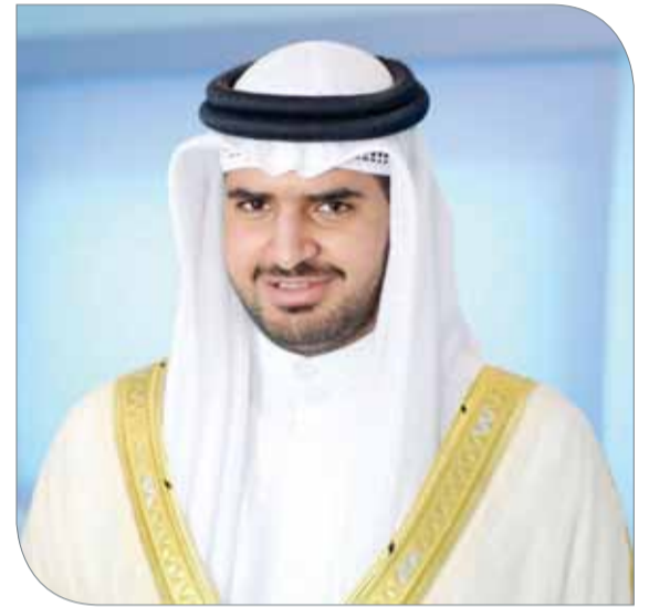
سمو الشيخ عيسى بن علي