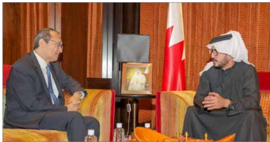
• سمو خالد بن حمد لدى استقباله السفير الصيني

الرفاع- المكتب الإعلامي لسمو الشيخ خالد بن حمد آل خليفة: أشاد النائب الأول لرئيس المجلس الأعلى للشباب والرياضة رئيس الاتحاد البحريني لألعاب القوى سمو الشيخ خالد بن حمد آل خليفة بما تشهده العلاقات بين مملكة البحرين وجمهورية الصين الشعبية من تطور كبير في شتى المجالات، مؤكدا سموه أن تنامي العلاقات الثنائية بين البلدين يشكل فرصة حقيقية للشراكة والتعاون الذي يساهم في تحقيق مزيد من المكتسبات والنمو الحضاري. جاء ذلك، لدى استقبال سمو الشيخ خالد بن حمد آل خليفة بمكتب سموه بقصر الوادي سفير جمهورية الصين الشعبية لدى مملكة البحرين أنور حبيب الله.