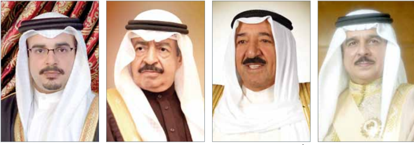
• جلالة الملك • سمو رئيس الوزراء • سمو ولي العهد • سمو وزير الدفاع