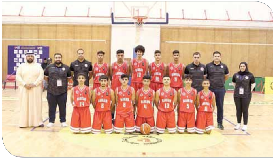
منتخب الناشئين لكرة السلة