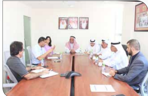
جانب من اجتماع اللجنة التحضيرية للمنتدى الرياضي

ضاحية السيف - اللجنة الأولمبية البحرينية: وضعت اللجنة الأولمبية البحرينية للمسات الأخيرة على برامج المنتدى الرياضي الذي سيقام يومي 9 و10 سبتمبر المقبل بقاعة المؤتمرات بفندق كروان بلازا، ويشتمل على 3 محاور رئيسية تتحدث عن محو الأمية البدنية ومكافحة المنشطات والاحتراف الرياضي.