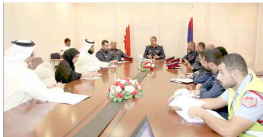
• مديرية شرطة المحرق تعقد اجتماعاً لتنسيقاً لتنظيم السير بمحيط المدارس

في العام الماضي، مضيافاً أن المديرية خصصت عدد 40 من ضباط وضباط صف لتنفيذ هذه المهمة على مدار العام الدراسي، إضافة إلى ما يقارب 62 من العلامات التنظيمية والإرشادية المتنقلة، كما تم التنسيق فيما يخص مساندة الشرطة من جانب المتطوعين بالتعاون مع مركز تنمية العمل التطوعي التابع لوزارة العمل والتنمية الاجتماعية لتنظيم حركة السير في محيط 6 مدارس.