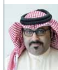
• محمد جمعة

مدينة عيسى - وزارة التربية والتعليم: صرح وكيل وزارة التربية والتعليم للموارد والخدمات محمد مبارك جمعة بأن قطاع الموارد البشرية في طور إنهاء إجراءات توظيف 797 من البحرينيين المؤهلين من أصحاب الكفاءات، من خريجي كلية البحرين للمعلمين والجامعات المحلية والخارجية، المستوفين لمتطلبات التوظيف للعمل كمعلمين. وأعرب وكيل التربية للموارد والخدمات عن شكره وتقديره "للدعم الذي تحظى به الوزارة من قيادة بلدنا العزيز بحفظها الله وبرعاها، بتوفير القوى البشرية اللازمة، لتشغيل العام الدراسي الجديد 2018 / 2019 بما يساعد على تنفيذ مشاريع الوزارة التطويرية بالصورة المطلوبة، مشيداً بالتعاون الكبير الذي يبديه ديوان الخدمة المدنية في هذا المجال". يذكر أن العودة المدرسية بالنسبة لأعضاء الهيئات الإدارية والتعليمية ستكون يوم الأحد الموافق 2 سبتمبر 2018.