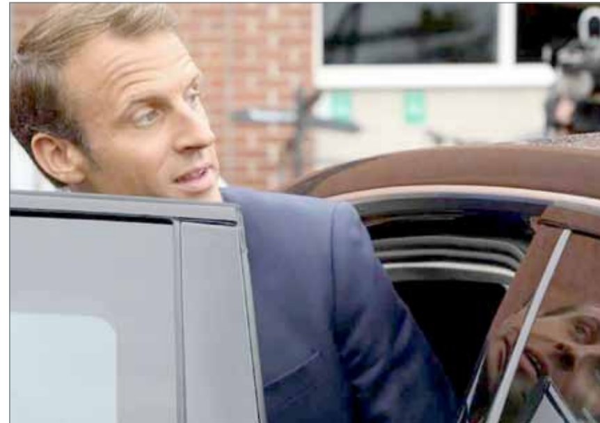
• الرئيس الفرنسي إيمانويل ماكرون

قال الرئيس الفرنسي إيمانويل ماكرون إن "قبائل بلاد الغال تقاوم التغيير" في تصريح جديد أثار أمس الخميس ردود فعل غاضبة إزاء هذا الوصف "الكاريكاتوري" للشعب الفرنسي من رئيسه الذي يعتبر نفسه "إصلاحياً". وكان ماكرون عبر في كوتنهاغن عن إعجاب بـ "المرونة"