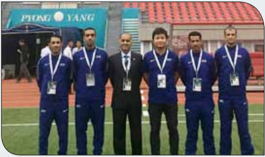
جاسم محمود مع طاقم التحكيم

بما يعكس مكانة التحكيم البحريني والثقة المحلية والقارية والدولية به. يشار إلى أن الاتحاد الآسيوي لكرة القدم اعتمد جاسم محمود مقيماً ومكتشفاً آسيوياً للحكام منذ العام 2010. وإلى جانب جاسم محمود، يتواجد عبدالرحمن عبدالخالق وخالد العلان ضمن الكوادر البحرينية المعتمدة كمقيمي حكام آسيويين، بالإضافة إلى المقيم الآسيوي لحكام كرة الصالات عبدالرحمن عبدالقادر.