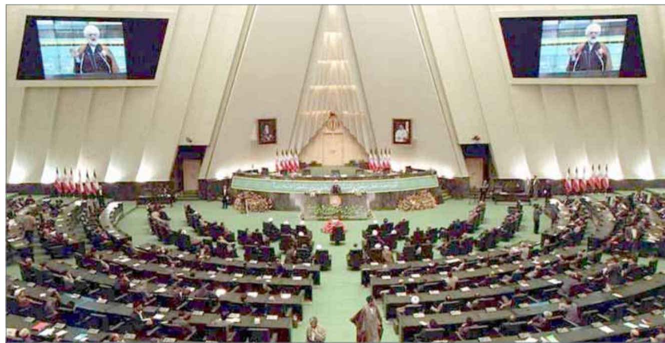
• مجلس النواب الإيراني

وكان مجلس الشورى الإيراني قد سحب الثقة الأحد من وزير الشؤون الاقتصادية والمالية مسعود كرباسيان ضمن تداعيات اقتصادية قاسية تواجها الحكومة الإيرانية مع عودة العقوبات الأميركية. وخسر كرباسيان تصويت الثقة بـ137 صوتاً مقابل 121، وامتنع نائبان عن التصويت، ما يجعله ثاني وزير في حكومة الرئيس حسن روحاني يتم عزله هذا الشهر.