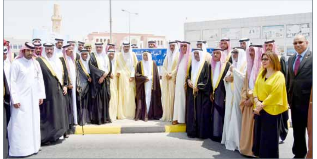
• سمو الشيخ خليفة بن علي متوسلا بحضور