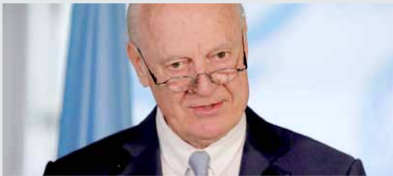
• ستافان دي ميستورا مبعوث الأمم المتحدة إلى سوريا يتحدث خلال مؤتمر صحفي في جنيف

وأضاف أنه "لا يمكن أن يكون هناك ما يبرر استخدام أسلحة ثقيلة ضدهم في مناطق ذات كثافة سكانية عالية، ويمكن أن تؤدي الأخطاء في الحسابات إلى عواقب غير مقصودة، بما في ذلك الاستخدام المحتمل للأسلحة الكيماوية". وقال دي ميستورا للصحافيين في جنيف: "تجنب الاستخدام المحتمل للأسلحة الكيماوية أمر جوهري بالتأكيد. ندرک جميعا أن لدى الحكومة (وجبهة) النصرة القدرة على إنتاج غاز الكلور في شكل سلاح". ومن جهة أخرى، قال وزير الخارجية السوري وليد المعلم خلال اجتماع مع نظيره الروسي سيرغي لافروف في موسكو،