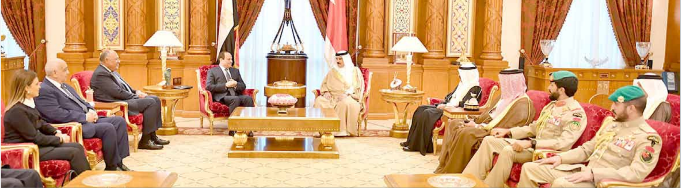
• جلالة الملك والرئيس المصري خلال جلسة المباحثات التي عقدت بحضور سمو رئيس الوزراء