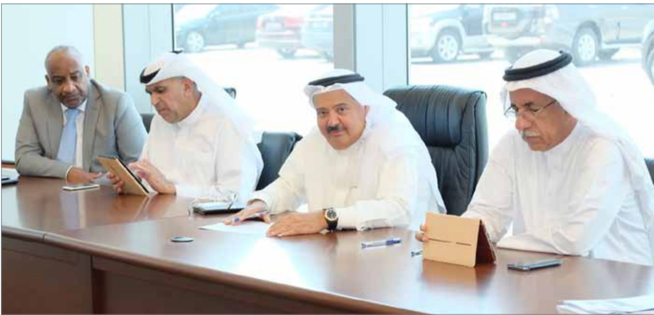
فتح المجلس أمس مناقصة مشروع إنشاء المرحلة الثانية من مجمع الدور لإنتاج الكهرباء والماء

علاوة على ذلك، فتح المجلس مناقصة لشركة تطوير للبتروكترول لتوريد نظام متكامل لحماية البريد الإلكتروني تقدم إليها عطاءان أقلهما بنحو 64.7 ألف دينار، ومناقصة لشركة طيران الخليج لتوريد عصير البرتقال الطازج وعصير الليمون مع النعناع للمسافرين على درجة الصقر الذهبي تقدم إليها 5 عطاءات، أقلها بنحو 59.9 ألف دينار، ومناقصة لشركة الجنوب للسياحة لمشروع مبنى ومكاتب في الدور، إذ يشمل القيام بإنشاء وصيانة مبنى ومكاتب في الدور إلى أن يتم الانتهاء من فترة التأكد من صلاحية المبنى من العيوب، ويشمل ذلك التشطيبات تقدم إليها 4 عطاءات أقلها بنحو 359.6 ألف دينار.