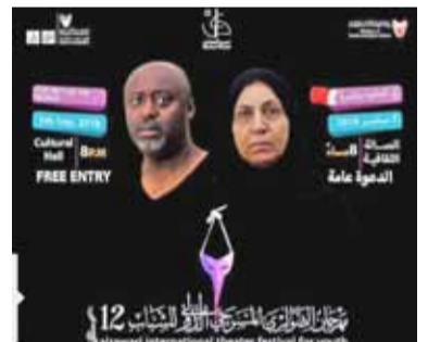
عرض في الحلوة والمرتة