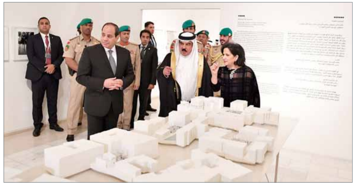
• جلالة الملك والرئيس المصري لدى زيارتهما لمتحف البحرين الوطني بحضور سمو رئيس الوزراء