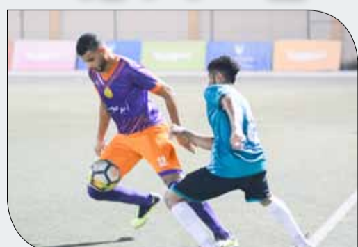
أبووصييع تأهل للكأس وخسر مشواره بالدور

الكأس التي يتأهل إليها الفرق الأربعة الأوائل في كل مجموعة. في المقابل فإن فريق مركز شباب كرانة يتصدر المجموعة برصيد أربعة عشرة نقطة، ولم يتعرض كرانة إلى الخسارة، لكنه فقد ست نقاط بالتعادل في مباراتين،