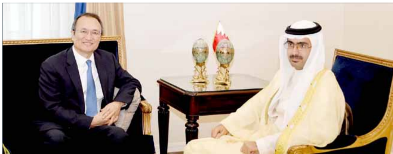
• سمو الشيخ خليفة بن علي مستقبلا السفير الصيني

السفير الصيني: الماضي قدما بتعزيز الشراكة بين بلدينا