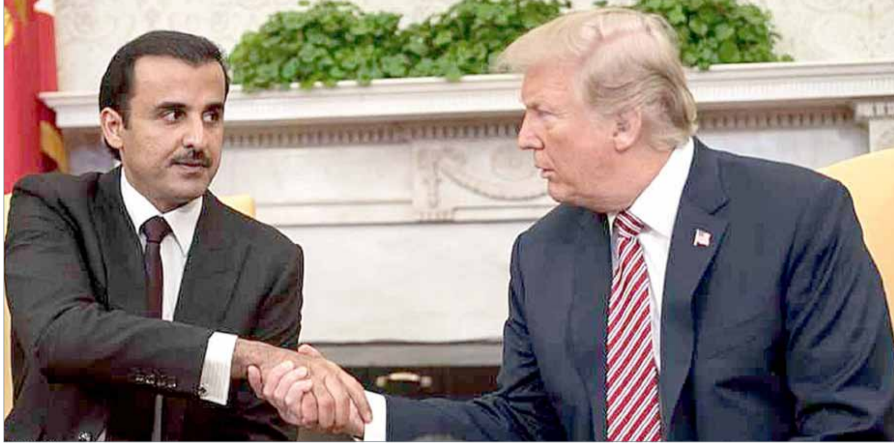
• أمير قطر تميم بن حمد مع الرئيس الأمريكي - (أرشيفية)

كما تم تعيين محافظ جديد للعاصمة المصرية، القاهرة، هو خالد عبد العال. ولأول مرة تعيين امرأة "قبطية" محافظة في مصر، هي منال عوض ميخائيل التي أسندت إليها محافظة دمياط شمالي البلاد. كما عين السيسي رئيسا جديدا لجهاز الرقابة الإدارية، المسؤول عن مراقبة الأجهزة الحكومية ومكافحة الفساد، هو اللواء شريف سيف الدين حسين خليل.