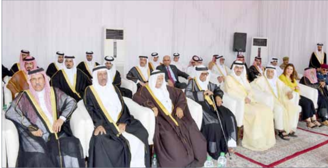
• سمو محافظ الجنوبية متوسلا بحضور

• البقاء عن قرب من المواطنين مسؤولية نعتبرها شرفا كبيرا