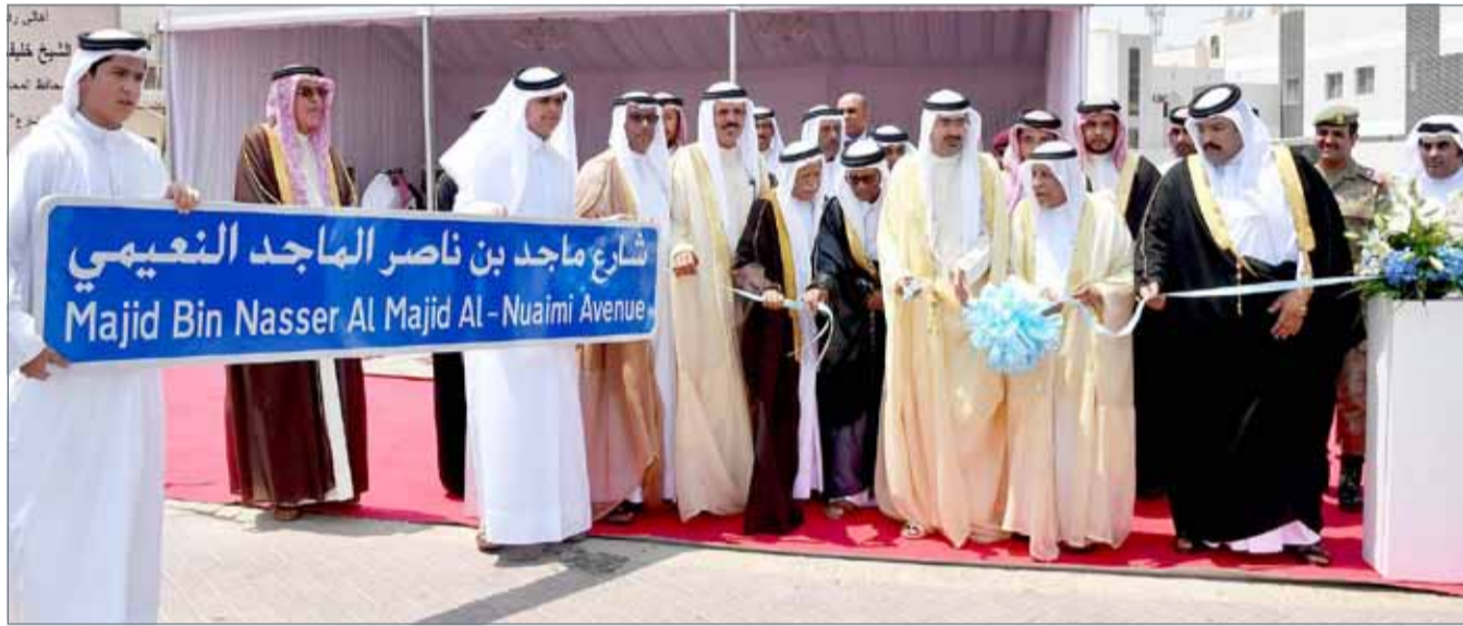
• سمو محافظ الجنوبية يقص شريط افتتاح شارع ماجد بن ناصر الماجد النعيمي بالرفاع الغربي

جلالته ويرعاه، كما قدموا شكرهم وتقديرهم لمحافظ الجنوبية سمو الشيخ خليفة بن علي آل خليفة على تفضله سموه بافتتاح شارع ماجد بن ناصر الماجد النعيمي (رحمه الله). ويعد طريق ماجد بن ناصر الماجد النعيمي أحد أهم الطرق التي لها ارتباط في تاريخ المنطقة والأهالي، كما يعتبر أكثر الطرق حيوية في منطقة الرفاع الغربي، حيث يمتد الطريق بمسافة 1500 متر ويصل بين المجمعات 902 و904 و908 و910 و912.