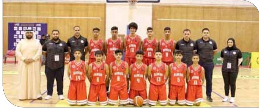
منتخب الناشئين لكرة السلة