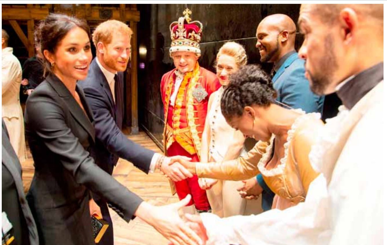
الأمير هاري وزوجته ميغان يحضرا عرضاً لمسرحية هاملتون الموسيقية؛ لجمع أموال لمؤسسة خيرية معنية بالأطفال المصابين بالفيرس المسبب لمرض نقص المناعة المكتسب (إتش.إي.في) في جنوب إفريقيا.

قالت دراسة يونانية أجريت على أكثر من 600 رجل إن تأثير زيت الزيتون على الرجال قد يكون أفضل من الفياغرا، مشيرة إلى أن أولئك الذين كانوا يتناولون الكثير منه كانوا أقل عرضة للمعاناة من العجز الجنسي، وقال باحثون إن اتباع نظام غذائي غني بزيت الزيتون يحافظ على سلامة الأوعية الدموية، مما يحافظ على الدورة الدموية في كل جزء من الجسم، حسب صحيفة "تليغراف" البريطانية. وأضافوا: "أولئك الذين تناولوا ما لا يقل عن 9 ملاعق من زيت الزيتون أسبوعياً، كانوا أقل عرضة للمعاناة من العجز الجنسي، وارتفعت لديهم معدلات هرمون التستوستيرون (هرمون الذكورة)". ووجدت الدراسة أن الالتزام القوي بنظام غذائي على الطراز المتوسطي (الدول الأوروبية المطلة على جنوب البحر المتوسط)، غني بالفواكه والخضراوات والبقوليات والأسماك والمكبرات وكذلك زيت الزيتون، يقلل خطر الإصابة بالضعف الجنسي بنسبة تصل إلى 40 في المئة، وقالت الباحثة اليونانية كريستينا خريسونو التي قادت الدراسة في جامعة أثينا: "الالتزام بالعادات الغذائية السليمة والتمارين الرياضية على المدى الطويل يؤثر كثيراً على جودة حياتنا، بما في ذلك القدرة الجنسية".