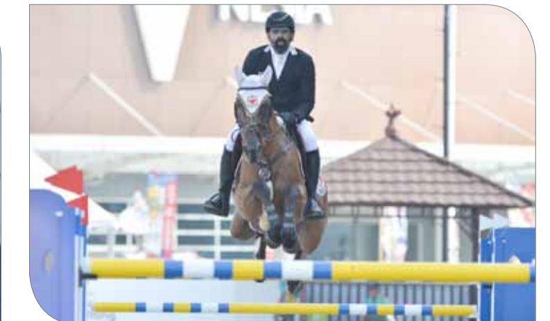
من منافسات قفز الحواجز