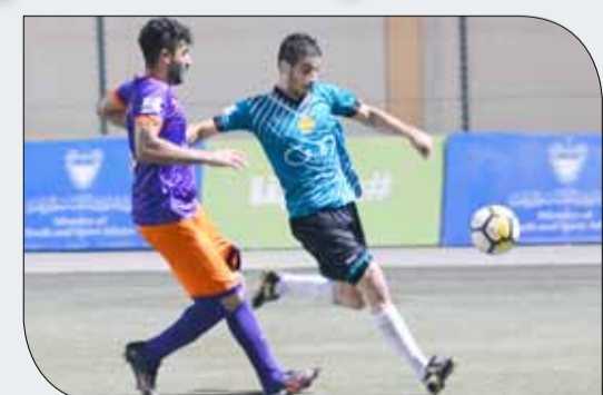
الزلاق أبعث أبووصييع عن ربع النهائي

في المقابل فإن فريق مركز شباب القادسية يتذلل الترتيب في المركز الثامن الأخير بعد خمس مباريات خسرهما كلها ويخلو رصيده من النقاط ولم يسجل سوى خمسة أهداف بمعدل هدف واحد في كل مباراة.