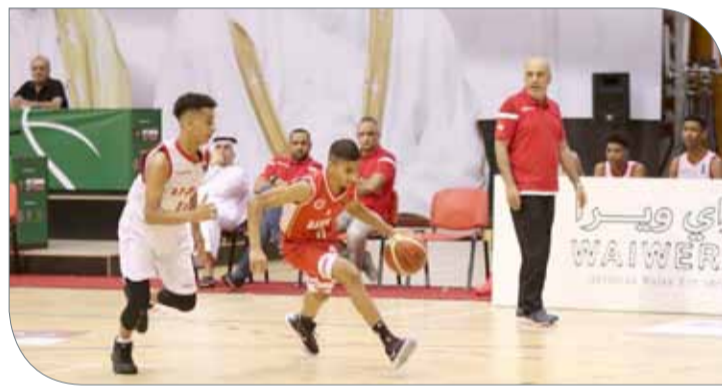
لقطات من لقاء منتخبنا أمام الامارات

الثاني والحصول على الميداليات الفضية، بينما سيكون الصراع مثيراً بين الإمارات وعمان للحصول على المركز الثالث، يذكر أن الأول والثاني يتأهلان إلى البطولة الآسيوية للناشئين تحت 17 سنة.