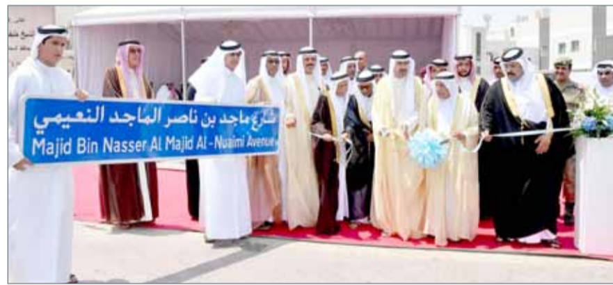
● سمو محافظ الجنوبية يقص شريط افتتاح شارع ماجد بن ناصر النعيمي بالرفاع الغربي

رجال قبيلة النعيمي؛ تخليداً لذكراهم، وهذه اللقطة الكريمة تجسد معاني الوفاء والتكريم والتقدير تجاه أبناء الوطن واقفهم المشرقة،