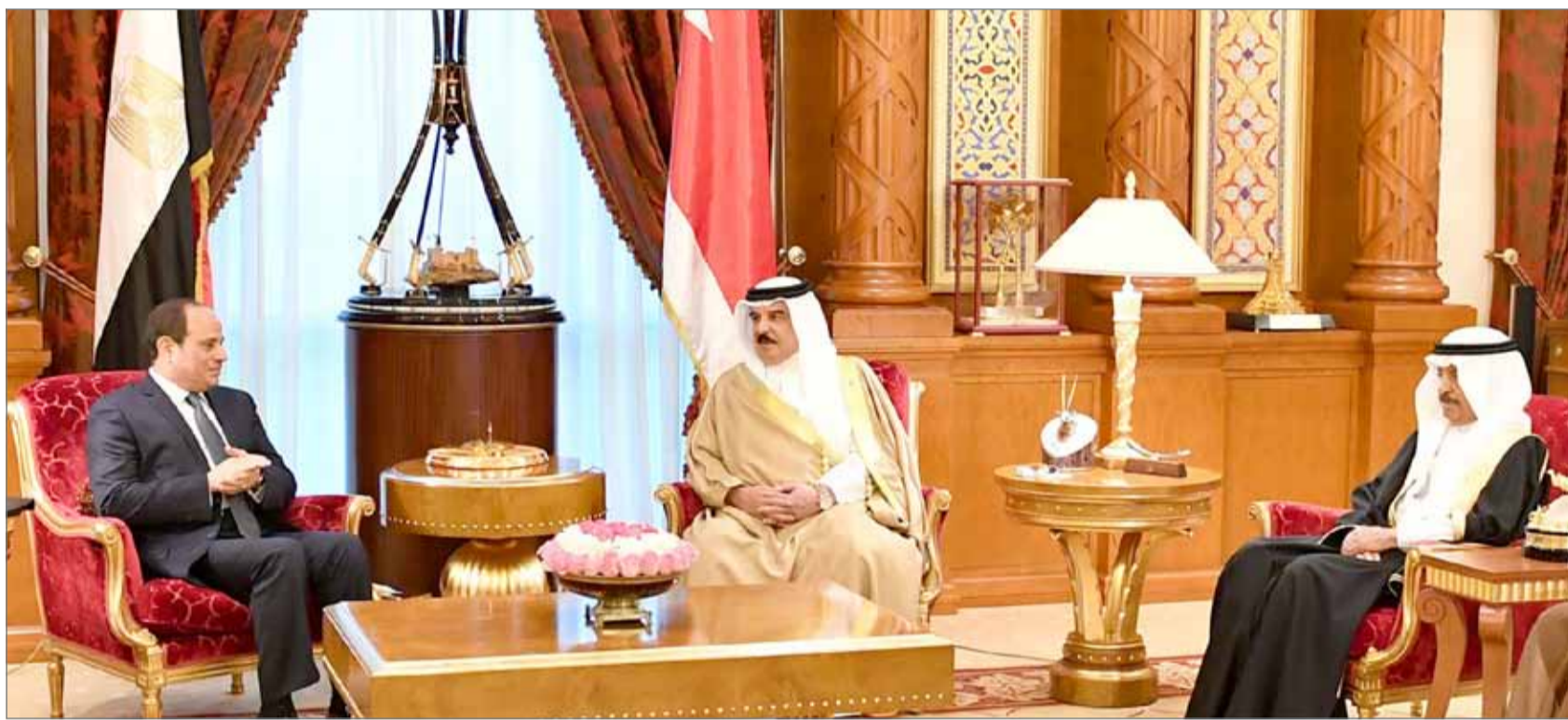
● جلالة الملك خلال جلسة المباحثات التي عقدها مع الرئيس المصري بحضور سمو رئيس الوزراء

● دور تاريخي لمصر في حماية الأمن القومي وحفظ المصالح العربية