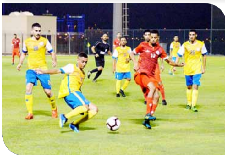
من لقاء سترة وقلاليه