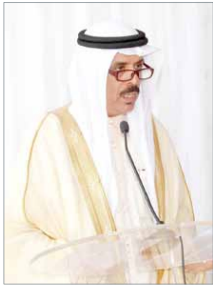
• وزير التربية يلقي كلمته