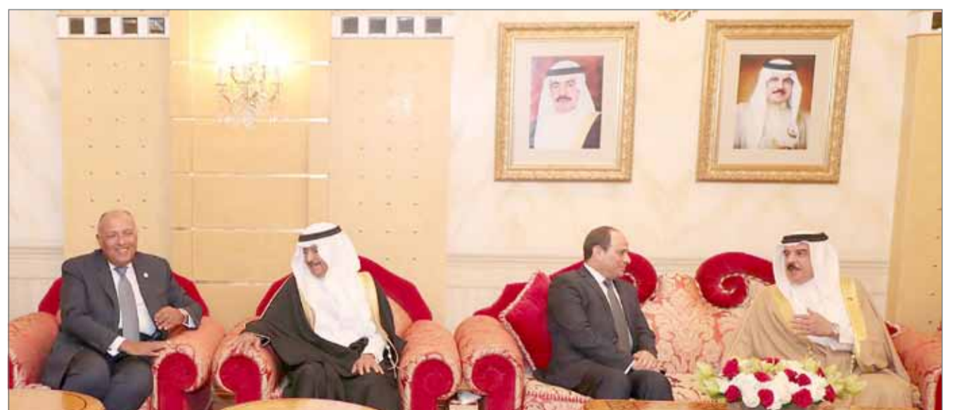
• جلالة الملك وسمو رئيس الوزراء في مقدمة مستقبلي الرئيس المصري لدى وصوله البلاد

والرئيس المصري حرس الشرف الذي اصطف لتحيتهما. هذا وتشكلت بعثة الشرف برئاسة وزير الخارجية الشيخ خالد بن أحمد بن محمد.