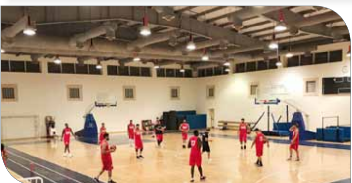
من تدريبات المنتخب في معسكر مصر

وكان المنتخب قد اجتاز بنجاح المرحلة الأولى التي أقيمت ذهاباً في البحرين وإياباً في الإمارات، إذ حل المنتخب في المركز الأول أمام منتخبات السعودية والإمارات وعمان. وتأهل المنتخب للمرحلة الثانية التي ستشهد مشاركة منتخبنا الوطني إلى جانب منتخب المملكة العربية السعودية ومنتخب فلسطين ومنتخب سيريلانكا ومنتخب بنغلاديش، وسيأهل من هذه المرحلة 4 منتخبات للانضمام إلى المرحلة الثالثة والأخيرة من التصفيات المؤهلة إلى نهائيات كأس آسيا.