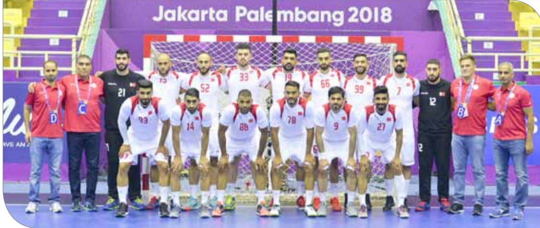
المنتخب الوطني الأول لكرة اليد