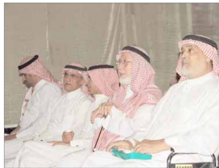
• فعالية للجمعية السعودية لمساندة كبار السن

• المسن هو كل شخص بلغ سن 60 أو ظهرت عليه علامات الشيخوخة المبكرة