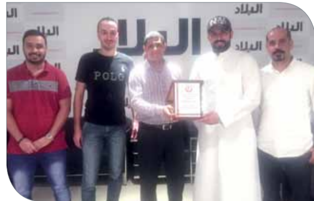
جانب من تكريم "البلاد"