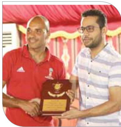
تكريم الحكم المونداليه نواف شكر الله