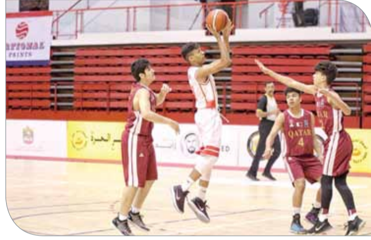
من لقاء منتخبنا وقطر