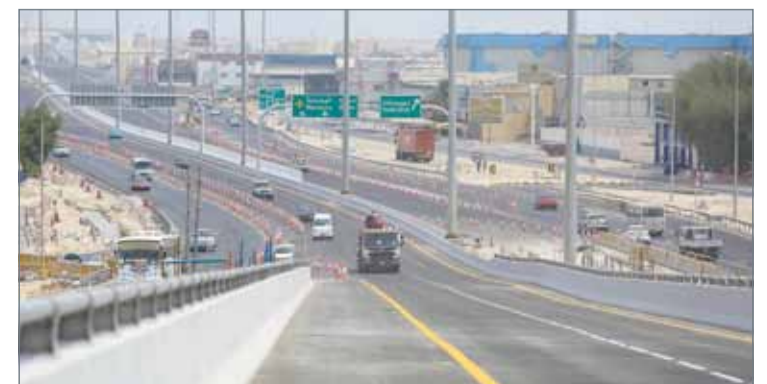
• اتجاه سترة والنماطة