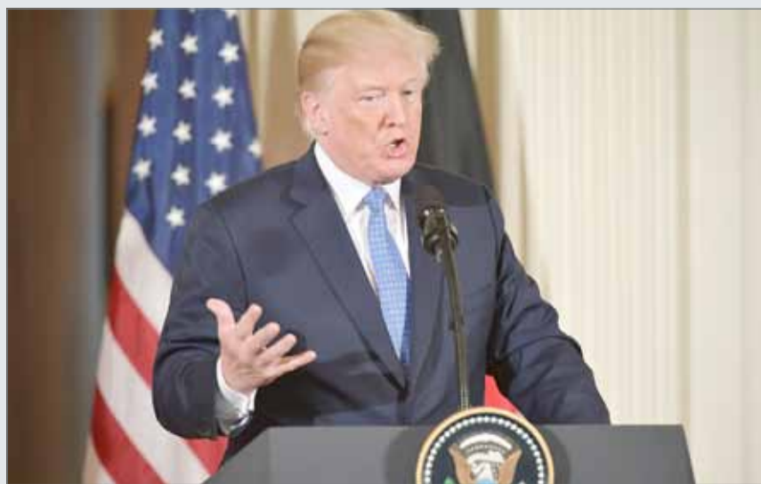
• دونالد ترامب

وكان الممثل التجاري الأميركي روبرت لايتايزر ذكر أن السماح للمصنعين بالدخول