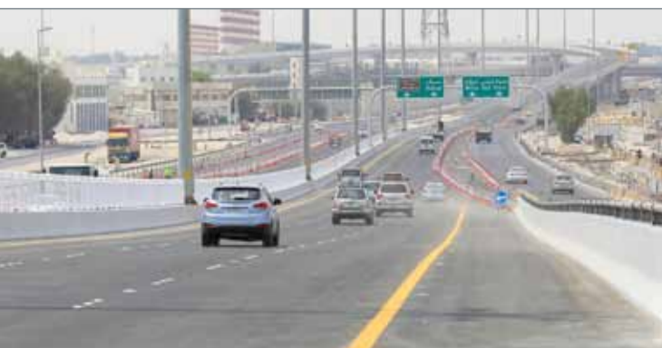
• اتجاه الرفاع وعسكر

افتتحت وزارة الأشغال وشؤون البلديات والتخطيط العمراني صباح أمس، الجسور العلوية في تقاطعي "النويدرات و أبا"، وهي المرحلة الأولى مشروع تطوير تقاطعي أبا والنويدرات. وبالتنسيق مع الإدارة العامة للمرور، افتتح الجسر الأول بتقاطع النويدرات على امتداد شارع الشيخ جابر الأحمد الصباح الذي ينقل الحركة المرورية من وإلى الرفاع وسترة، والجسر الثاني بتقاطع "أبا" الذي ينقل الحركة المرورية القادمة من سترة على شارع الشيخ جابر الأحمد الصباح إلى شارع الملك حمد "شارع أبا" باتجاه الجنوب. وقال وزير الأشغال عصام خلف الذي افتتح المشروع إن الأعمال تقع ضمن مشروع تطوير تقاطعي أبا والنويدرات الذي ينفذ بدعم من الصندوق الكويتي للتنمية الاقتصادية العربية، ضمن برنامج التنمية الخليجي.