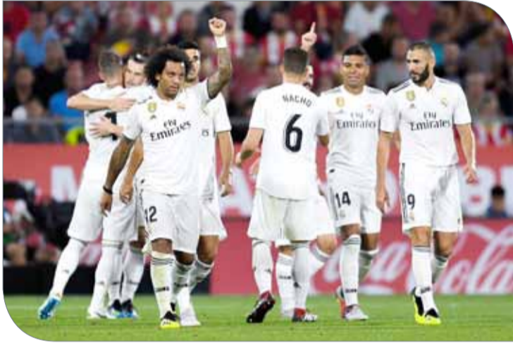
ريال مدريد يسعد من اللأثر من ليغانيس

وأضاف: "علينا الفوز، نعلم أهمية هذا للجماهير، سنقاتل حتى النهاية لحصد الثلاث نقاط، يجب أن نفوز بأي طريقة حتى تتمكن من الحصول على سبعة أشهر نستمتع خلالها بهذا الانتصار". وتأجلت مباراة رايبو فالكانو مع ضيفه أتلتيك بيلباو إلى أجل غير مسمى، حيث إن ملعب رايبو غير آمن للجماهير بينما تجرى فيه أعمال الترميم. أما في بقية مباريات هذه الجولة سيلتقي خيتافي مع بلد الوليد، وفياريال مع جيرونا، وإيبار مع ريال سوسيداد، وسيلتا فيجو مع أتلتيكو مدريد، ليفانتي مع فالنسيا، والأفييس مع إسبانيول.