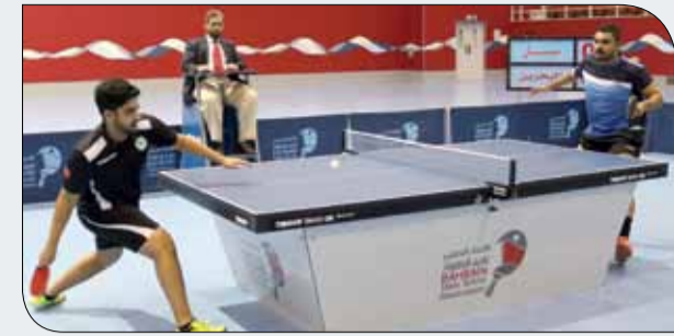
جانب من منافسات الطاولة