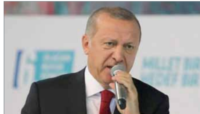
رجب طيب أردوغان

وقال أردوغان خلال حفل تخريج ضباط صف في أليكسير في غرب البلاد، إن "تركيا بحاجة إلى صواريخ إس 400-". الاتفاق بهذا الشأن تم وبمشيئة الله سنحصل عليها في القريب العاجل". وتؤكد تركيا وروسيا إبرام الاتفاق بشأن هذه الأسلحة وتقول أنقرة إنها ستحصل على المنظومة التي تضاهي صواريخ باتريوت الأميركية العام المقبل.