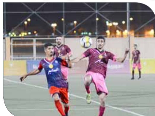
سار انتصر على المعامير

مدن إنه فخور بخوض التجربة بعد برونزه في دوري المراكز الشبابية مع فريق مركز شباب أبو صبيح. وأوضح مدن أنه تربطه علاقة ببعض الأصدقاء من عمان وعرضوا عليه اللعب هناك، وبعد إلحاح وافق على خوض التجربة.