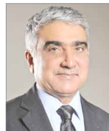
• أكبر جعفري

وتستورد البحرين من المملكة العربية السعودية 270 ألف برميل من النفط الخام، ويقدر إنتاج البحرين من حقل أبوسعفة نحو 150 ألف برميل يومياً، فيما تنتج 45 ألف برميل يومياً من حقل البحرين وبلغ متوسط إنتاج النفط في البحرين