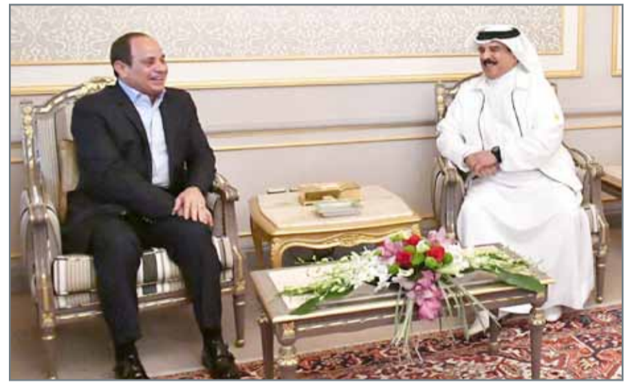
• جلالة الملك في زيارة للرئيس المصري بمقر إقامته

المنامة - بنا: أكد ملك البلاد صاحب الجلالة الملك حمد بن عيسى آل خليفة أن مصر كانت وستبقى ركيزة أساسية لمنظومة الأمن العربي والإقليمي، وأن قوتها من قوة العرب جميعاً. وكان جلالتة قد زار أمس أخاه رئيس جمهورية مصر العربية الشقيقة عبدالفتاح السيسي بمقر إقامته بقصر الشيخ حمد بالقضيبية، وجرى في اللقاء استعراض العلاقات الأخوية الوطيدة والخطوات التي تسهم في تطوير أطر التعاون المشترك، وتأكيد أهمية استمرار التشاور والتنسيق المستمر. وأشاد جلالة الملك بالزيارة المثمرة للرئيس المصري لبلده الثاني مملكة البحرين، والتي تصب في صالح البلدين وتعزز علاقاتهما الوثيقة.