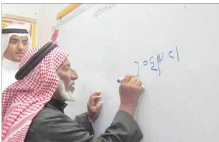
• مركز تعليم لكبار السن

• الاهتمام بقضايا كبار السن واحتياجاتهم وتوفير سبل الرعاية