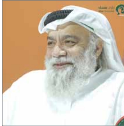
• عبدالله السعداوي

"جائزة عبدالله السعداوي" وهي جائزة لجنة التحكيم الخاصة، التي تحمل اسم عراب فرقة الصواري المسرحية وأحد أهم أعمدة المسرح في الوطن العربي، الحائز على جائزة الإخراج في مهرجان القاهرة التجريبي، وتقوم لجنة تحكيم كل نسخة من المهرجان بالاتفاق على من تجد فيه الاستحقاق ويقوم بتسليمها عبدالله السعداوي. وفي بادرة للاحتفاء أيضاً، ولدعم مساعي أحد أقدم مؤسسي الفرقة الممثل والمخرج المسرحي إبراهيم خلفان في إثراء المشهد المسرحي البحريني بالشباب المالك لجرأة التجريب، تم إطلاق "سندوق إبراهيم خلفان المسرحي لتمويل الشباب"، كوسيلة مساهمة لتقديم إنتاجاً يساعد المخرجين الهواة في تقديم مسرحياتهم.