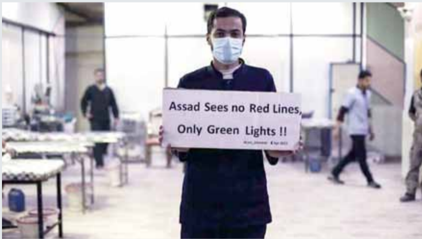
• واشنطن حذرت الأسد من استخدام أسلحة كيماوية

وتابع أن الهجمة تهدد بالتسبب في وقوع العديد من ضحايا المدنيين، وإثارة عملية نزوح جديدة ويمكن أيضاً أن تحبط اللاجئين من العودة". تخاطرون أيضا بإرسال رسالة للاجئين بأن الوضع غير آمن. سيراقب اللاجئون عن كثب ما يحدث في إدلب في الشهور القليلة المقبلة". ويوجد غراندي في لبنان بعد زيارة إلى سوريا والأردن.