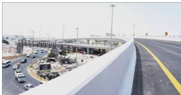
• جانب من الجسر الأحادي المؤدي من شارع جابر الأحمد إلى شارع الملك حمد