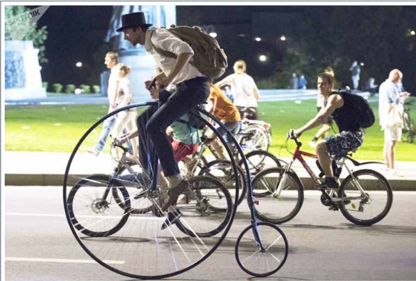
المشاركون في عرض الدراجات الهوائية في موسكو