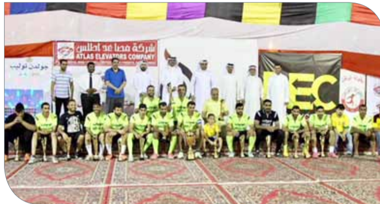
نيوسات بطل دورة الوطن