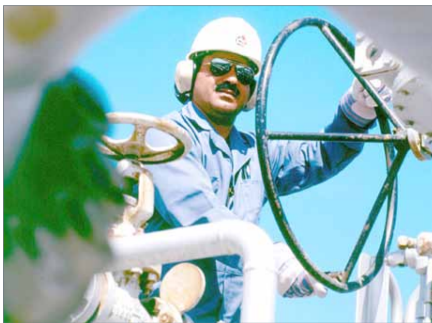
تعتمد البحرين على بيع المشتقات النفطية وليس على البترول الخام

وتستورد البحرين من المملكة العربية السعودية 270 ألف برميل من النفط الخام، ويقدر إنتاج البحرين من حقل أبوسعفة نحو 150 ألف برميل يومياً، فيما تنتج 45 ألف برميل يومياً.