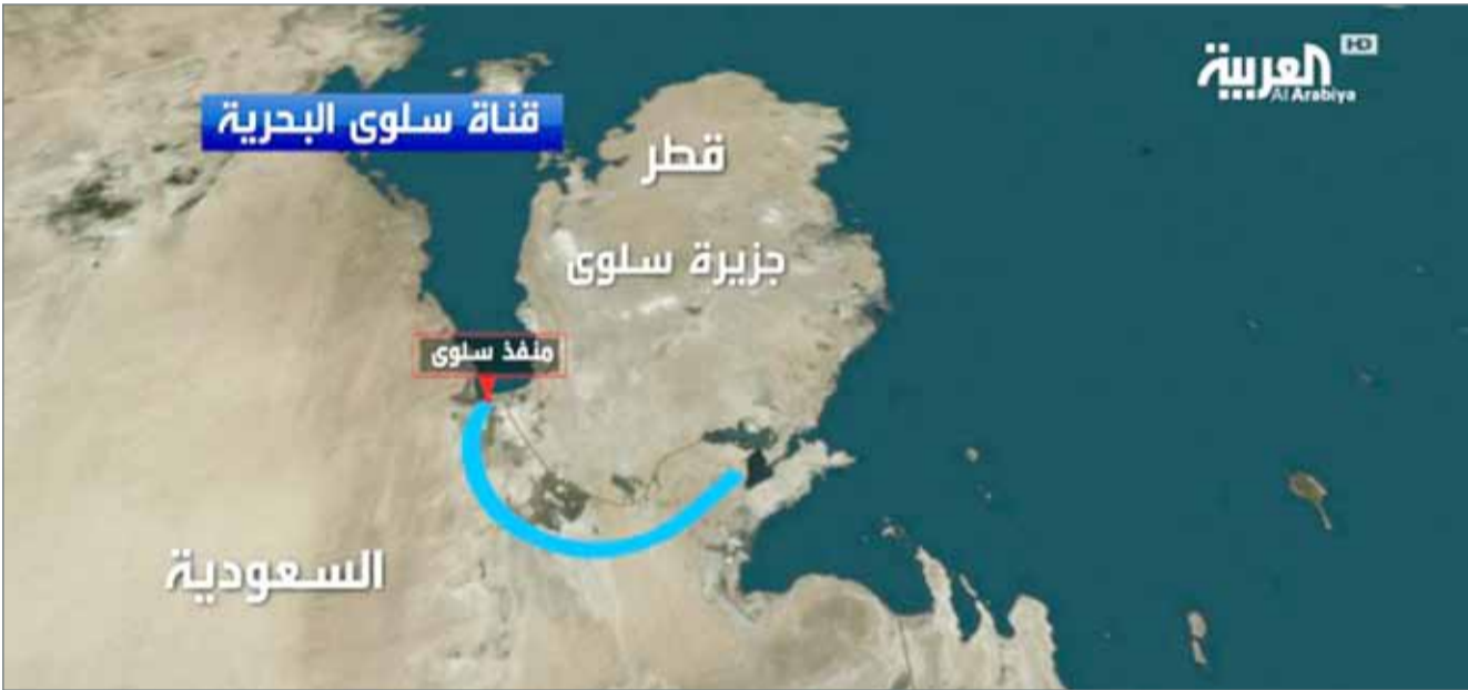
• قناة سلوى البحرية

اليابسة وتحويلها إلى جزيرة. وقال سعود القحطاني وهو مستشار كبير لولي العهد الأمير محمد بن سلمان في تغريدته على "تويتر" : كمواطن أنتظر بفارغ الصبر والشوق تفاصيل تطبيق مشروع قناة جزيرة شرق سلوى، هذا المشروع العظيم التاريخي الذي سيغير الجغرافيا في المنطقة".