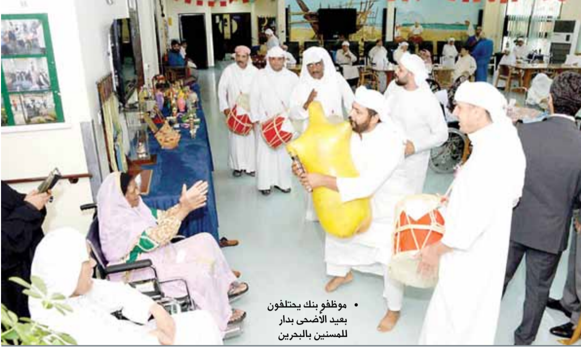
• موظفو بنك يحتفلون بعيد الأضحي بدار المسنين بالبحرين