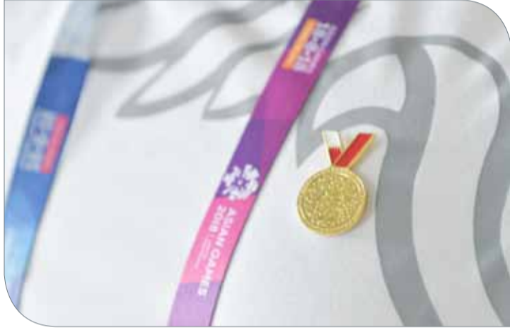
شعار الذهب فقط فوق أحد قمصان أفراد البعثة البحرينية

بما حققت مملكة البحرين من حصاد وفير من الميداليات لتتخطى ما حصده في النسخة الأخيرة بإثنين 2014 وهو ما يعكس التطور المتنامي للرياضة البحرينية.