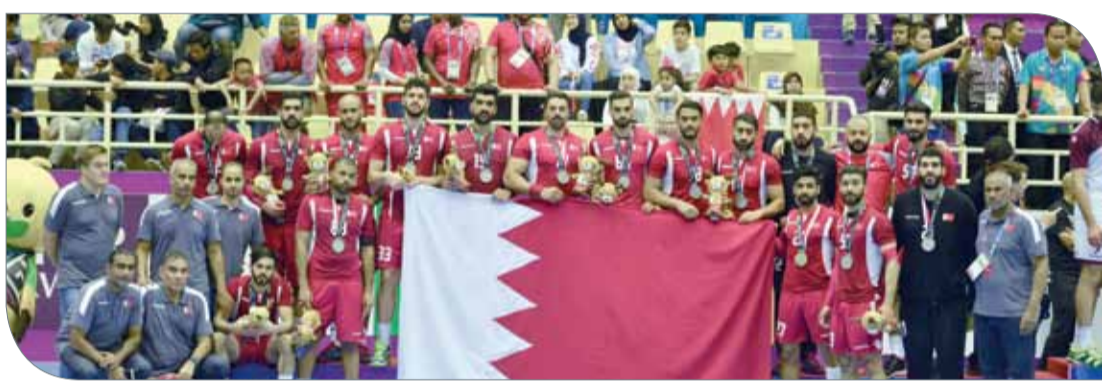
رجال اليد متوجين بفضية الآسياد