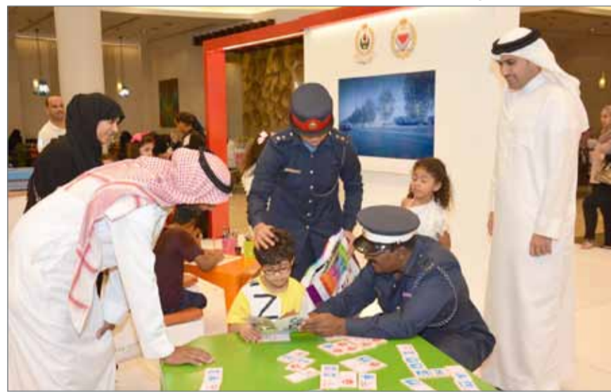
● جانب من الحملة التوعوية