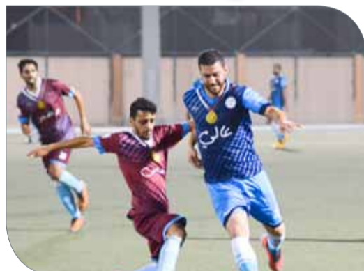
عاليه يحقق فوزا كبيرا على جدحفص