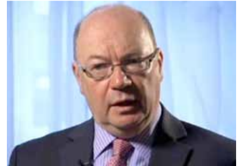
أليستر بيرت الوزير بوزارة الخارجية البريطانية

زار أليستر بيرت، الوزير بوزارة الخارجية البريطانية، طهران، أمس الجمعة، لبحث التدخلات الإيرانية المزعمة للاستقرار في سوريا واليمن، ومستقبل الاتفاق النووي الإيراني، في أول زيارة من نوعها منذ انسحاب الرئيس الأميركي، دونالد ترمب، من