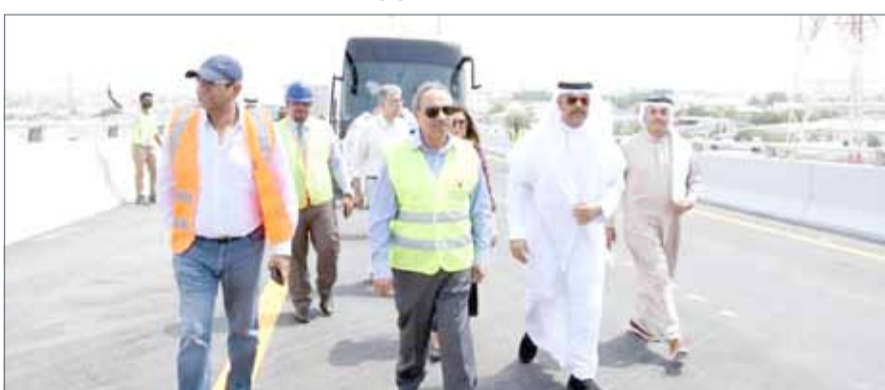
• جولة وزير الأشغال ومرافقيه على الجسر الأحادي

مقاولين شركة (كيه سي سي) الكويتية مع شركة (ناس) البحرينية بقيمة 46.8 مليون دينار. وأضاف خلف أن الوزارة انتهت من 78% من أعمال إنشاء شبكة تصريف مياه الأمطار، كما أن هذه الشبكة أخذت في الاعتبار بعض المناطق المحاذية للمشروع مثل المعامير والنويدرات وجزء من مجمعات منطقة الحجيات وشارع الرفاع. كما حث الوزير مقاول المشروع على مواصلة جهوده في سرعة إنجاز المشروع والانتهاه منه حسب البرنامج المتفق عليه. ويشير إلى أن أعمال المشروع تتضمن تحويل