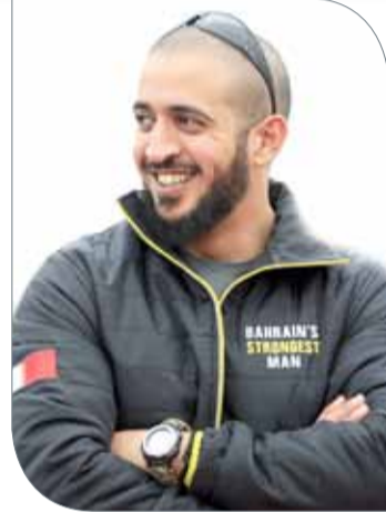
سمو الشيخ خالد بن حمد

وقال سموه: "لعلنا اخترنا أن تكون فكرة هذه البطولة في نسختها الثانية مغايرة عن النسخة الماضية، حيث وجهنا الدعوة لجميع الشباب البحريني بالتسجيل والمشاركة بمنافسات التصفيات التأهيلية للبطولة، التي ستمنح المشاركين فرصة المنافسة على حجز مقعد لها في المنافسات النهائية التي ستقام في فبراير 2019. فهذه الفكرة ستضفي مزيدا من التشويق والإثارة والتحدى وستخدم تحقيق مساحة أكبر لأهداف هذا الحدث بالمجتمع البحريني".