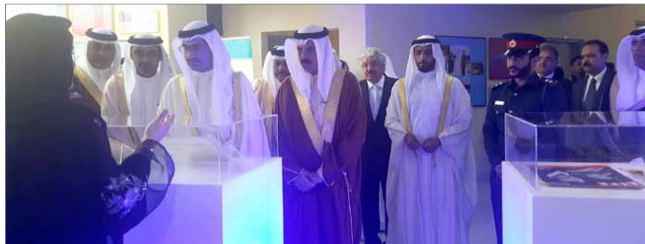
البلاد إبراهيم النعام

دشن محافظ الجنوبية سمو الشيخ خليفة بن علي آل خليفة صباح أمس بمركز زين للتعليم الإلكتروني في جامعة البحرين إطلاق صحيفة “الجنوبية تايمز”، والتي تعنى بتاريخ وتراث المحافظة الجنوبية، وكل ما يستجد بها من أخبار، وفعاليات متنوعة، والتي تصنف بالأولى من نوعها في مملكة البحرين، وحضر التدشين وزير التربية والتعليم ماجد النعيمي، ورئيس جامعة البحرين رياض حمزة، وعدد كبير من المسؤولين والأكاديميين، والمهتمين بالشأن المحلي بالمحافظة، والكتاب، وبعد آيات عطرة من القرآن الكريم، ألقاه على مسامع الحضور خالد أنس بوهندي، ألقى سمو الشيخ خليفة بن علي آل خليفة كلمة بمناسبة التدشين، قال فيها: “إنه يوم الأغر، نشهد فيه إطلاق أول صحيفة إلكترونية، خاصة في المحافظة الجنوبية، (الجنوبية تايمز) مبادرة إعلامية استثنائية على مستوى المحافظات، تصدر من المحافظة الجنوبية أسبوعياً، باللغتين العربية والإنجليزية، لتروي لمجتمعنا الكريم، وللعلماء أجمع، أبرز ما يحدث في محافظتنا العامرة والعز والخير، من تقدم ورقي ونماء بشتى المجالات”، وتابع سموه “إن المحافظة الجنوبية تحرص لتنفيذ توجيهات قيادتنا الحكيمة، فالتوجيهات السديدة وال مباركة لعاهل البلاد صاحب الجلالة الملك حمد بن عيسى آل خليفة، ورئيس الوزراء صاحب السمو الملكي الأمير خليفة بن سلمان آل خليفة، وولي العهد نائب القائد الأعلى النائب الأول لرئيس مجلس الوزراء صاحب السمو الملكي الأمير سلمان بن حمد آل خليفة، للتواصل مع المواطنين، وتقديم أفضل الخدمات لهم، تعد دافعا كبيرا لخدمة مجتمعنا على أكمل وجه”.