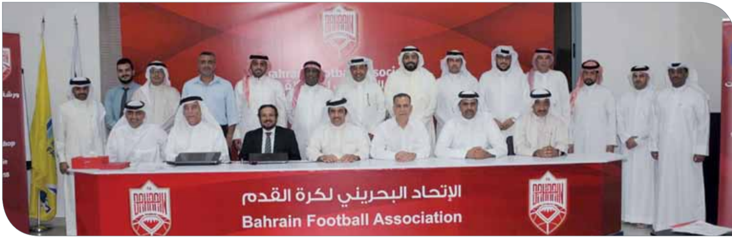
عليه البوعيين يتوسط المشاركين