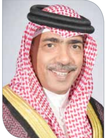
علي بن محمد

البحرينية عموماً، والألعاب الجماعية خصوصاً، منوهاً بما أظهره اللاعبون من مستوى رائع وعطاء مخلص على امتداد الدورة ليكسبوا احترام الجميع، متمنياً للاعبين حظاً أوفر في الاستحقاقات القادمة. وعبر الشيخ علي بن محمد آل خليفة عن أمله بأن يكون لعبة الكرة الطائرة شرفاً لتمثيل البحرين بالنسخة القادمة من دورة الألعاب الآسيوية 2022 لتواصل مسيرتها الوافقة، وتساهم في حصد الإنجازات المشرفة للوطن.