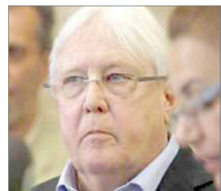
• المبعوث الدولي إلى اليمن مارتن غريفيث

قالت مصادر مطلعة على مباحثات جنيف، إن مليشيات الحوثي المدعومة من إيران، وضعت شروطاً جديدة قبل الحضور، لافتة إلى أن الانقلابيين، بتوجيه من مليشيات حزب الله، يسعون إلى إفشال المشاورات قبل أن تبدأ. ورجحت المصادر أن الحوثيين لن يصلوا في موعدهم المحدد إلى جنيف. ومن المقرر أن تجري محادثات جنيف تحت رعاية الأمم المتحدة، في السادس من سبتمبر