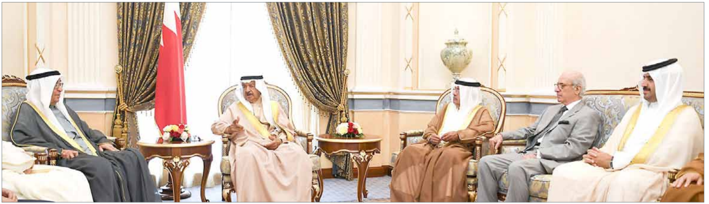
• سمو رئيس الوزراء يترأس اجتماعاً لمتابعة سير العمل في عدد من المشروعات الخدمية

غاية الحكومة ضمان سبل الرفاه للبحرينيين... سمو رئيس الوزراء يوجه: