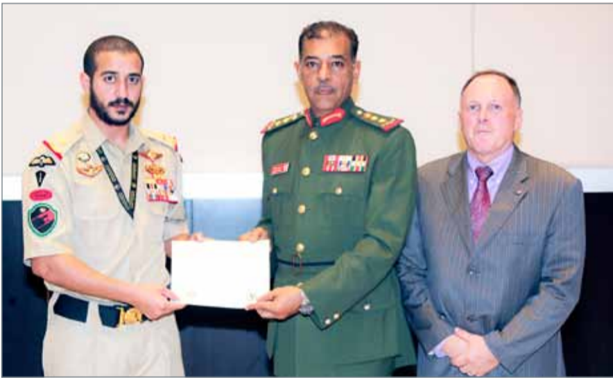
• سمو الشيخ خالد بن حمد يحضر ختام فعاليات ندوة إستراتيجيات مكافحة الإرهاب

القدرات عبر طرق وأساليب التعامل الحديثة لمكافحة الإرهاب، ولتضامير الجهود وزيادة التنسيق والتعاون بين كل الجهات المشاركة في الندوة؛ لمواجهة خطر التهديدات الإرهابية، والتي تشكل تهديدا للأمن الوطني لأي دولة.