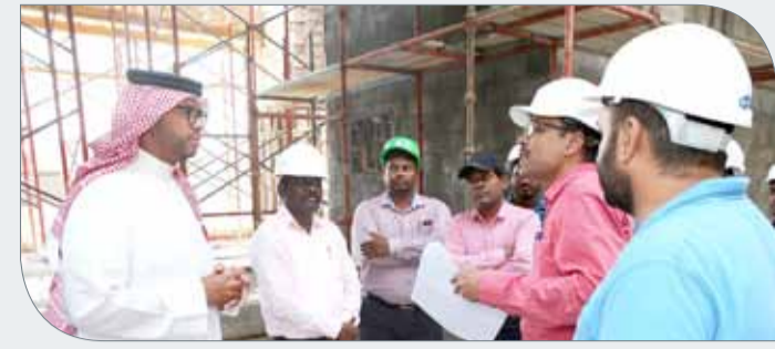
جانب من الجولة التفقدية