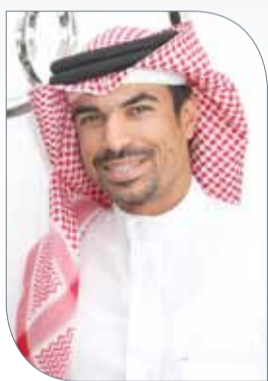
صقر بن سلمان