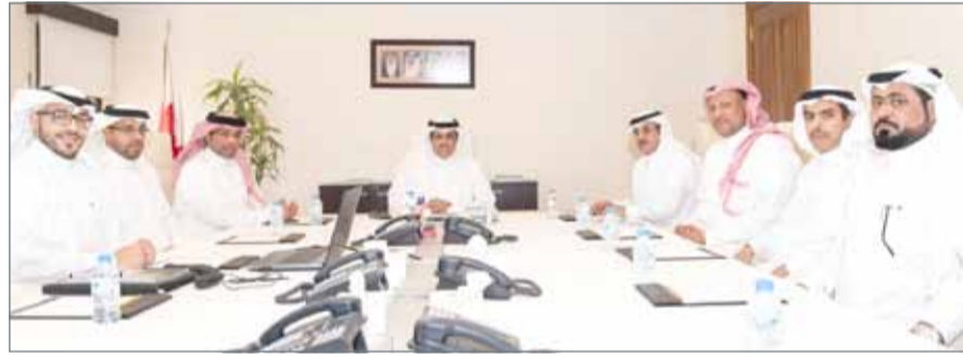
وزير شؤون الإعلام مستقبلاً المدير العام لجهاز إذاعة وتلفزيون الخليج

البحرين من تطورات إعلامية متميزة وإنجازات تنموية وحضارية رائدة في ظل المشروع الإصلاحي لعاهل البلاد صاحب الجلالة الملك حمد بن عيسى آل خليفة.