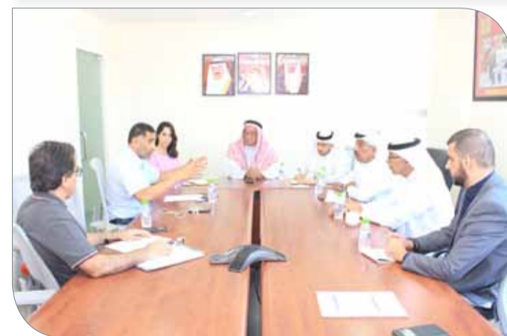
جانب من اجتماع اللجنة التحضيرية للمنتدى الرياضي

ضاحية السيف | اللجنة الأولمبية البحرينية