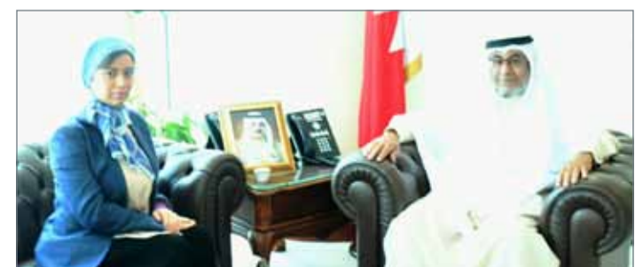
البوعيين مستقبلاً النائب رؤى الهايكى

استقبل وزير شؤون مجلسي الشورى والنواب غانم البوعيين في مكتبه عضو مجلس النواب النائب رؤى الهايكى. وفي اللقاء، استعرض وزير المجلسين الإنجازات المشتركة للسلطتين التشريعية والتنفيذية في الفصل التشريعي الرابع، مشيداً بالدور المهم للهايكى في دراسة مختلف الموضوعات المعروضة على مجلس النواب من خلال ترؤسها اللجنة البرلمانية النوعية الدائمة للمرأة والطفل وعضويتها في لجنة الخدمات. ومن جانبها، قدمت الهايكى شكرها وتقديرها على تعاون الحكومة وتجاوبها مع ما يطرح من موضوعات من قبل النواب.