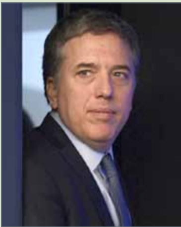
• وزير الاقتصاد الأرجنتيني

المالية والنقدية في البلاد ولعودة الاقتصاد إلى التوازن. وخسرت العملة الوطنية "البيزو" نحو نصف قيمتها إزاء الدولار هذا العام ما عرقل جهود الحكومة للسيطرة على التضخم. واستمكت البلاد شريحة أولى بـ 15 مليار دولار من القروض على ثلاث سنوات تم الاتفاق عليها في يونيو لدعم عملتها.