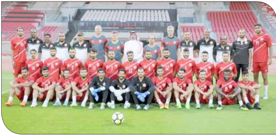
منتخبنا الوطني الأول لكرة القدم

ستقوم قناة البحرين الرياضية بنقل المباراة على الهواء مباشرة، كما ستقوم القناة أيضا بنقل مباراة منتخبنا مع الصين يوم الإثنين المقبل.