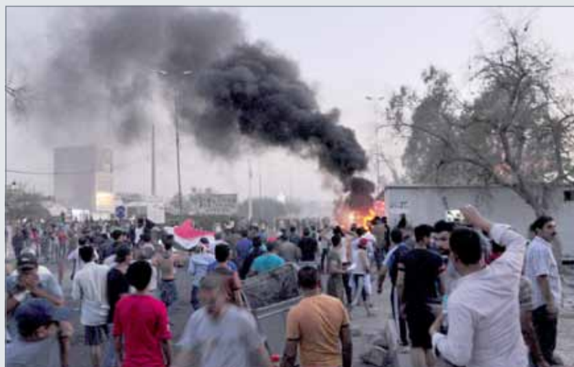
• تجدد المواجهات في البصرة غداة يوم دام

تجددت المواجهات أمس الأربعاء بين قوات الأمن العراقية، التي استخدمت الرصاص الحي ومتظاهرين في مدينة البصرة التي شهدت الثلاثاء مقتل 6 متظاهرين في مواجهات مماثلة. واحتشد آلاف المتظاهرين أمس أمام مقر المحافظة في وسط البصرة في جنوب العراق في مواجهة قوات الأمن التي أطلقت الرصاص الحي والقنابل المسيلة للدموع. بدوره، دعا ممثل الأمم المتحدة في العراق، إلى "تهدة" الأوضاع في البصرة بجنوب العراق غداة يوم من الاحتجاجات الأكثر دموية، قتل خلاله 6 أشخاص، بينما تؤكد السلطات اتخاذ إجراءات لمعالجة الأزمة الصحية الحادة التي تضرب هذه المحافظة الغنية بالنفط. واحتشد الآلاف حول مقر المحافظة، وسط مدينة البصرة، وقام بعضهم برشق العنبري بقنابل حارقة ومفرقات، وردت الشرطة بقنابل مسيلة للدموع وإطلاق نار. وصباح الأربعاء، بدت شوارع مدينة البصرة إحدى أكثر مدن العراق كثافة سكانية وحيث