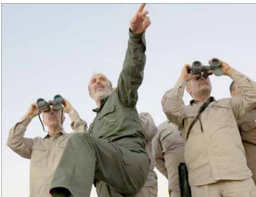
• رئيس أركان الجيش الإيراني اللواء محمد باقري على خطوط القتال في سوريا

وقالت منظمة العفو الدولية المعنية بحقوق الإنسان في بيان أمس إن حياة "ملايين الأشخاص في إدلب الآن في أيدي روسيا وتركيا وإيران" وحثت جميع الأطراف على عدم مهاجمة المدنيين. من جانبه، قال وزير الدفاع الأميركي جيم ماتيس إنه "لا توجد أي معلومات مخبرانية" عن امتلاك جماعات المعارضة في محافظة إدلب السورية لأي قدرات أسلحة كيميائية مضيئة أن الحقائق لا تدعم تأكيدات روسيا بهذا الخصوص. وعلى مدى الأيام القليلة الماضية نقلت