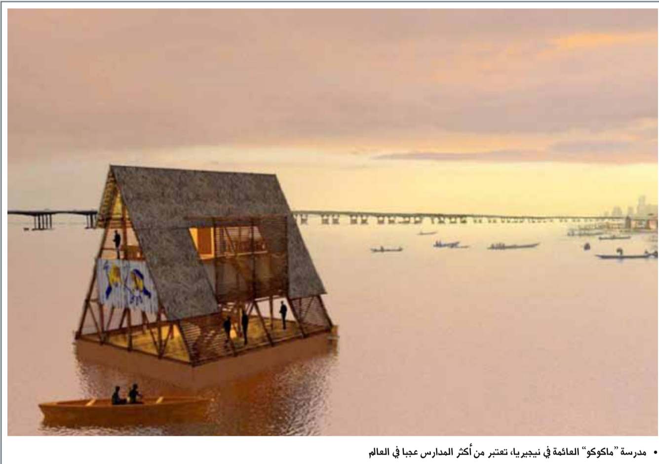
• مدرسة "ماكوكو" المائمة في نيجيريا، تعتبر من أكثر المدارس عجا في العالم