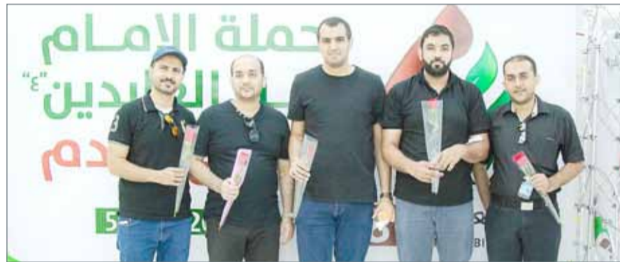
● وردة لكل متبرع

وقيم الشراكة المجتمعية بينها وبين جميع المؤسسات سواء كانت حكومية أو خاصة من أجل تفعيل دورها في المجتمع، ولتعزيز دورها في المسؤولية المجتمعية والتلاحم المجتمعي وتقديم الدعم اللازم لمن هم بحاجة إليه.