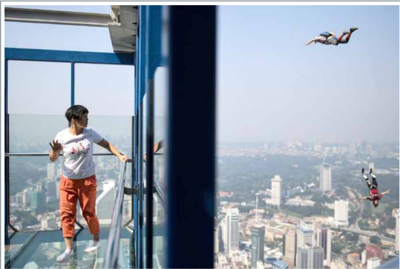
• سائحة تنظر إلى المظليين من برج على ارتفاع 300 متر في كوالا لمبور، ماليزيا