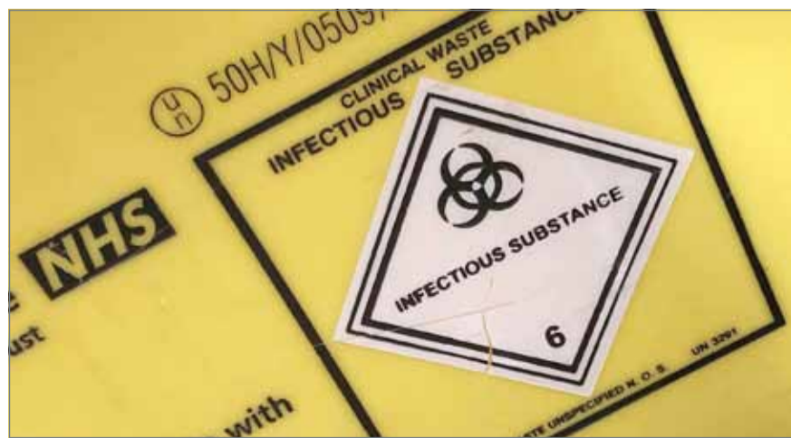
• لافتة على حاوية نفايات في مستشفى لندني

اقتحم رجل يقود سيارة أمس الجمعة، مقهى في العاصمة الألمانية برلين، مما أسفر عن إصابة عدة أشخاص، وفق ما أعلنت شرطة المدينة. وقالت الشرطة الألمانية على حسابها على تويتر، إن الحادث وقع في مقهى بمنطقة تشارلوتنبرغ بالعاصمة برلين. وأضافت الشرطة "تظهر النتائج الأولية لزملائنا في مكان الحادث أن السائق يعاني من مشكلات صحية". ولم تذكر المزيد من التفاصيل. وقال المتحدث باسم الشرطة "لا توجد مؤشرات على عمل إرهابي". وأضاف أن الاحتمال الأرجح أنه حادث نتج عن فقدان السائق التحكم في السيارة بسبب مشكلة صحية.