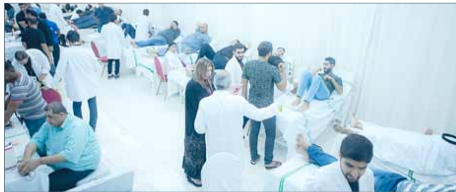
● إقبال كبير

التي شاركت كلها بالفعالية، بالإضافة إلى 60 من الكوادر الطبية والتربوية والفنية من المتطوعين الذين يشاركون سنويا بالحملة وطاقم من كوادر بنك الدم التابع للوزارة.