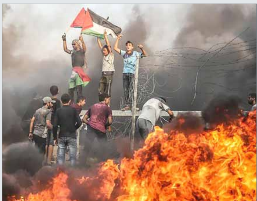
• فلسطينيون يتظاهرون قرب السياج العازل بين إسرائيل وقطاع غزة

ومنذ نهاية مارس، ينظم الفلسطينيون مسيرات عند حدود قطاع