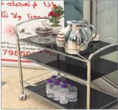
• "ترولي" ضيافة بلدية الشمالية