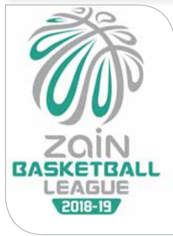
شعار دوري زين

ذلك كله سيتحقق مرور الوقت وتتابع اللقاءات الذي سيحقق للفرق التأقلم وسيدخلها في أجواء المنافسة. وكانت نتائج الجولة الأولى قد أسفرت عن فوز المنامة على النجمة (80/69)، وفوز الرفاع على سترة (68/39)، والاتحاد على الحالة (66/60)، والنويدرات على البحرين (79/46)، والمحرق على سماهيج (96/62) وأخيراً الأهلي على مدينة عيسى (106/76).