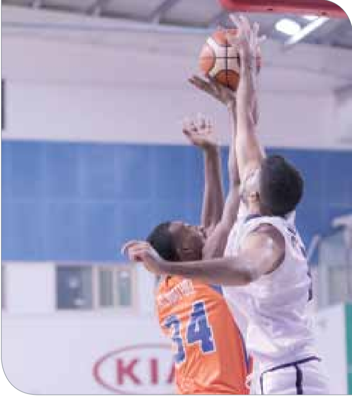
جانب من منافسات الجولة الأولى

◆ اختتمت مساء أمس الجولة الأولى (الخميس) منافسات الجولة الأولى لدوري زين لكرة السلة للرجال بنتائج متوقعة ومنطقية ومستوى متواضع من الناحية الفنية وتراجع في معدلات اللياقة البدنية لأغلب الفرق، رافق ذلك وفرة من النقاط في سلة الفرق الخاسرة. وأجمع لاعبو فرق أندية كرة السلة على أن المستوى الفني للفرق سيتصاعد بشكل تدريجي مع توالي مباريات الدوري العام.