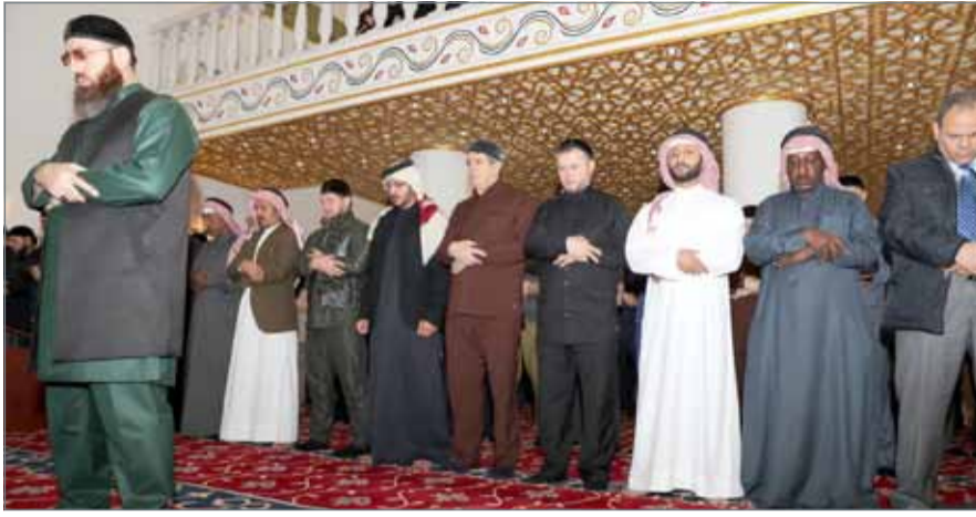
• سمو الشيخ خالد بن حمد والرئيس الشيشاني يؤديان صلاة الجمعة

الرفاع- المكتب الإعلامي لسمو الشيخ خالد بن حمد بن عيسى آل خليفة، أدى النائب الأول لرئيس المجلس الأعلى للشباب والرياضة رئيس الاتحاد البحريني لألعاب القوى الرئيس الفخري للاتحاد البحريني لفنون القتال المختلطة سمو الشيخ خالد بن حمد آل خليفة بمعية رئيس جمهورية الشيشان رمضان قاديروف، شعائر صلاة الجمعة بمسجد "حمزة بن عبدالمطلب"، وذلك خلال زيارة سموه إلى جمهورية الشيشان الصديقة؛ تلبية لدعوة الرئيس الشيشاني وحضور احتفالات الجمهورية بمناسبة مرور 200 عام على تأسيس مدينة "غروزني". وأشاد سمو الشيخ خالد بن حمد آل خليفة بالنهضة الإسلامية التي تشهدها جمهورية الشيشان، والتي بدأت في عهد الرئيس السابق أحمد قاديروف، وتواصلت مسيرتها حتى عهد الرئيس رمضان أحمد قاديروف، التي ساهمت في تعزيز الهوية الوطنية للجمهورية الشيشانية