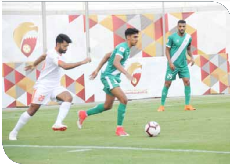
من لقاء البديع والحالة