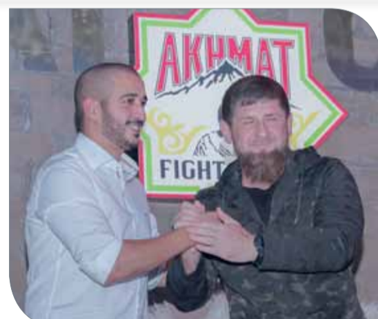
سموه مع الرئيس الشيشاني