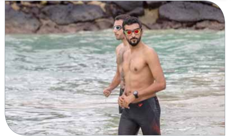
سمو الشيخ ناصر بن حمد في تدريب السباحة