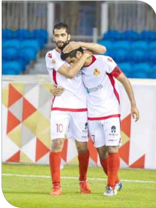
فرحة شرقاوية بهدف السبق