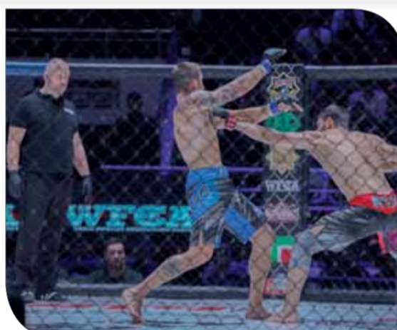
جانب منافسات بطولة WFC53