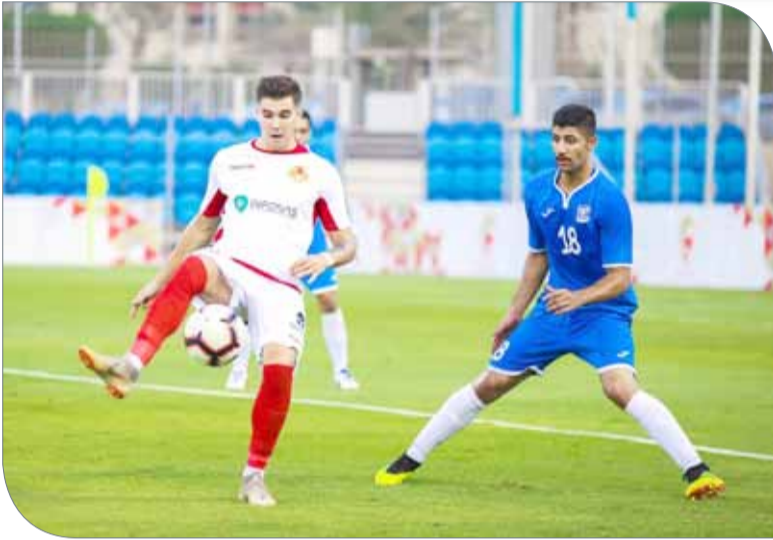
من لقاء المنامة والرفاع الشرقي