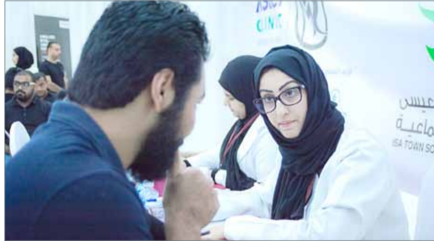
● مساهمة مميزة من "أستر"