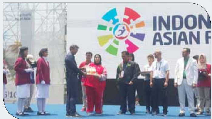
جانب من تبادل الدروع التذكارية