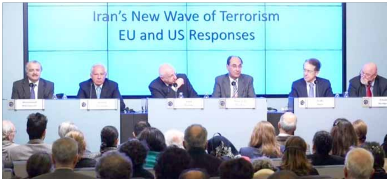
• جانب من المؤتمر في بروكسل

دعا سياسيون وخبراء إلى تشديد التحرك الأوروبي ضد الإرهاب الإيراني عقب قيام فرنسا بإغلاق مراكز إيرانية وتجميد أصول وزارة الاستخبارات الإيرانية عقب تورط طهران بمحاولة تفجير مؤتمر المعارضة الإيرانية في باريس أواخر يونيو الماضي.