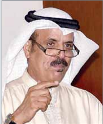
• ماجد التعيمي

مدينة عيسى - وزارة التربية والتعليم: ضمن فعاليات ملتقى العربي الأول لذوي الاحتياجات الخاصة والدمج، الذي أقيم تحت رعاية رئيس جمهورية مصر العربية، قدم وزير التربية والتعليم ماجد التعيمي عرضاً عن تجربة مملكة البحرين في دمج ذوي الاحتياجات الخاصة، والخدمات التعليمية والأنشطة الطلابية المقدمة لهم، مؤكداً نجاح الوزارة في سياسة الدمج، التي أدت إلى إكمال العديد من طلبة ذوي الاحتياجات الخاصة للمراحل الدراسية، والانتقال من الصفوف الدراسية الخاصة بهم إلى الصفوف العامة مع زملائهم.