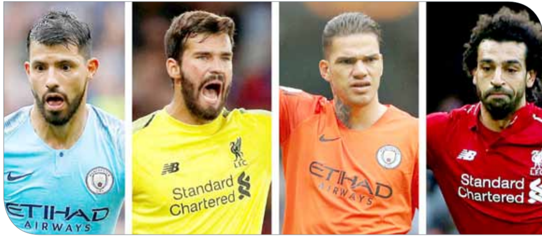
قمة فض الاشتباك

أتلتيكو مدريد الإسباني). ولا يمكن لجوزيه مورينيو، تحمل نتيجة سيئة أخرى لمانشستر يونايتد المتعثر، عندما يستضيف نيوكاسل يونايتد بقيادة رافائيل بينيتز، باستاد أولد ترافورد، يوم السبت. ووسط تقارير إعلامية عن حالة الانقسام داخل الفريق، لم يفز يونايتد في آخر أربع مباريات بجميع المسابقات، ويحتل المركز العاشر في الدوري، متأخراً بتسع نقاط عن ثنائي الصدارة. ويحل تشيلسي صاحب المركز الثالث، الذي لم يخسر هو الآخر، ضيقاً على ساوثهامبتون يوم الأحد، فيما يخرج أرسنال لمواجهة فولهام. وبعد الهزيمة أمام برشلونة يوم الأربعاء بدوري الأبطال، يلعب توتنهام هوتسبير المبتلى بالإصابات، ضد كارديف سيتي، صاحب المركز قبل الأخير.