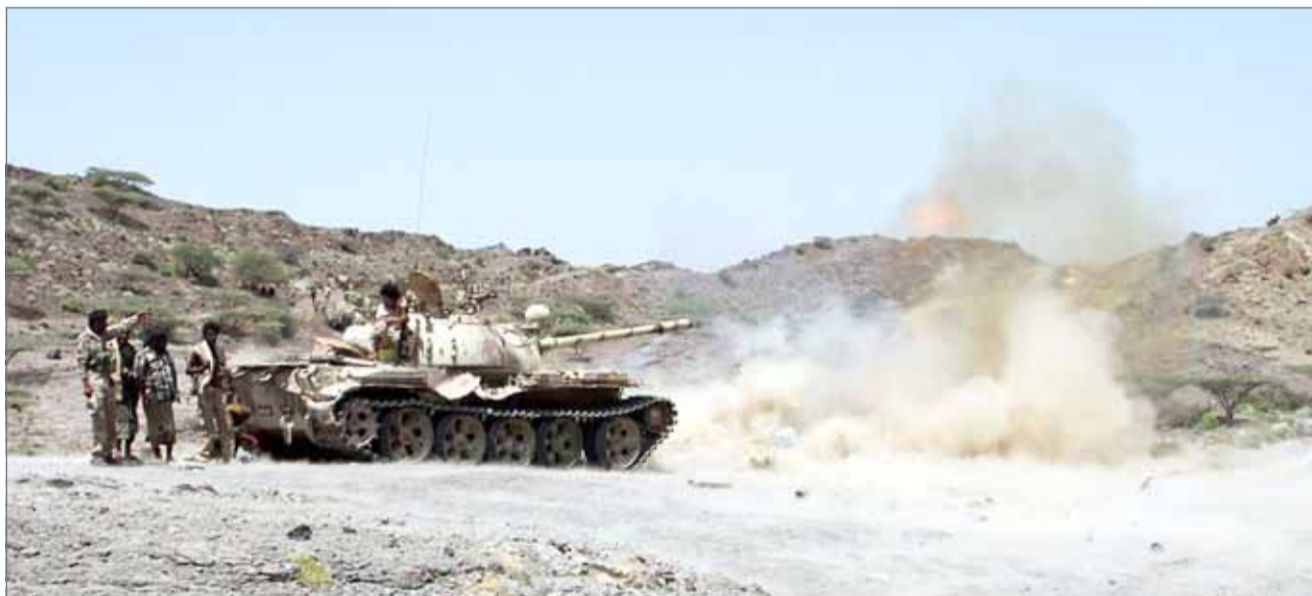
• دبابة تابعة للجيش تصف موقعا للحوثيين

وتندد مركز الملك سلمان للإغاثة والأعمال الإنسانية في بيان له، بهذه الجريمة الإنسانية البشعة التي لم ترع مبادئ حقوق الإنسان ولا القانون الإنساني الدولي التي تطلقها المليشيات الإرهابية الحوثية. وأهاب المركز للأمم المتحدة ومنظماتها للوقوف بحزم أمام هذه الجريمة الإنسانية التي أقدمت عليها المليشيات الحوثية وانتهكت خلالها كل المبادئ الدولية وحقوق الإنسان، وتكررت هذه الأفعال غير المسؤولة في التعدي على المساعدات الإغاثية والإنسانية المقدمة من المركز ونهبها، وإعاقة وصول البعض منها إلى الأماي الذين هم بأمس الحاجة إليها.