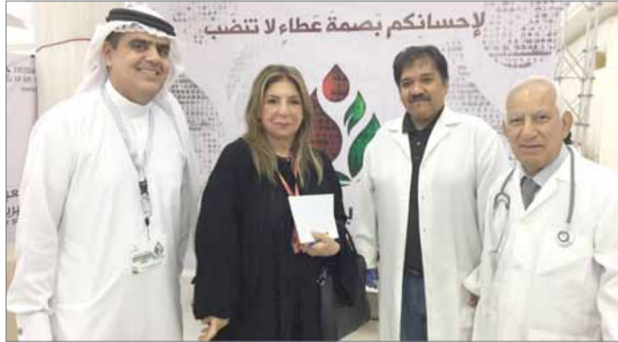
● "البلاد" مع المنظمين