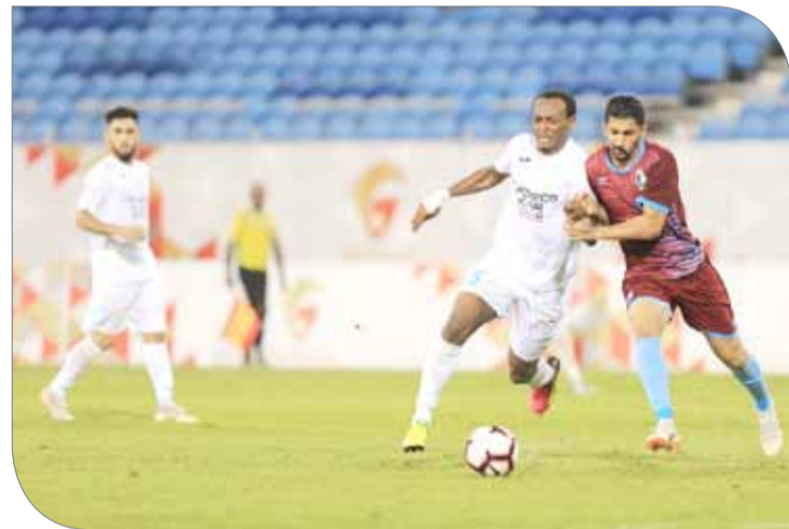
من لقاء الرفاع والشباب

المحرق والحد، خاصة مع الطابع المميز الذي تكتسي به مباريات الطرفين.