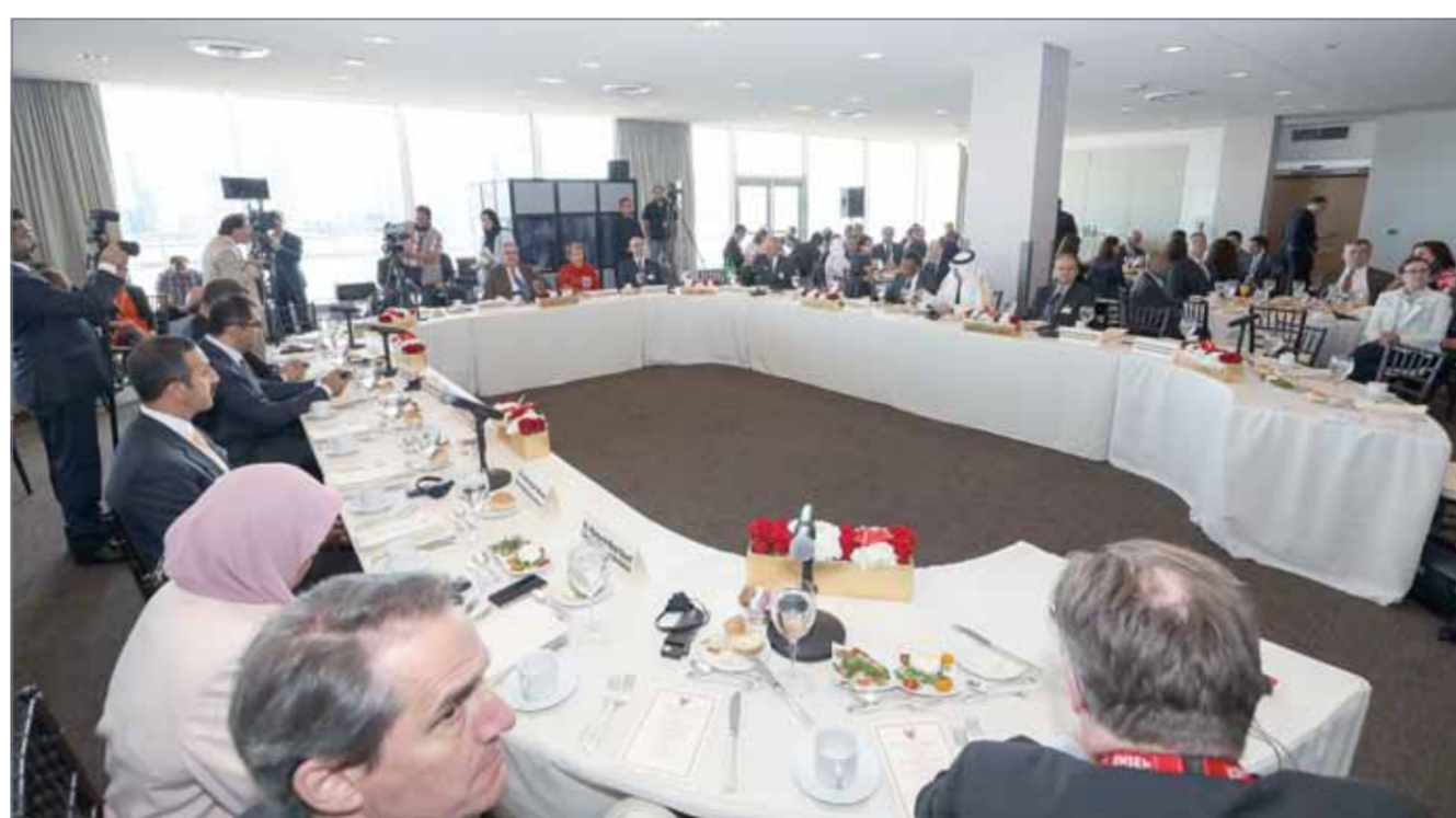
• منتدى ”رؤى البحرين“... شهادة على استشراف سمو رئيس الوزراء للمصارات المستقبلية التي تضمن استدامة السلم والتنمية الشاملة

المنامة - بنا: حققت مبادرة مملكة البحرين بتنظيم منتدى ”رؤى البحرين... رؤى مشتركة لمستقبل عالمي ناجح“، الذي عقد في مقر الأمم المتحدة بتنظيم من ديوان صاحب السمو الملكي رئيس الوزراء وبالتعاون مع معهد الأمن العالمي، مدى كبيراً وتفاعلاً إيجابياً من جميع المشاركين والمتابعين، والذين أكدوا تقديرهم لدور مملكة البحرين في تحقيق التقارب والتعاون الدولي الذي يعزز من نشر السلام وترسيخ الأمن والاستقرار ودعم جهود التنمية المستدامة في مختلف أنحاء العالم وجاءت كلمة رئيس الوزراء صاحب السمو الملكي الأمير خليفة بن سلمان آل خليفة، التي وجهها إلى المنتدى لتندد بوضوح سياسة مملكة البحرين تجاه قضايا الأمن والسلام والتنمية، وعبرت بجلاء عن الرؤى التي يتبنها سموه لكل ما يحقق السلام والخير للبشرية، وقد حملت كلمة سموه عدة رسائل، أبرزها: أولاً: توجيه أنظار المجتمع الدولي إلى العمل بشكل دؤوب من أجل بسط السلام وتوفير الأمن في المناطق التي تعاني من الصراعات، باعتبار ذلك بداية حقيقية للتحوّض والتنمية والحفاظ على مكتسبات الدول والشعوب، وهي رؤية دائماً ما يركز عليها سموه ويكررها في مختلف المناسبات لإيمان سموه العاطف بأن الأمن والتنمية متلازمان، وبناء على ذلك جاءت دعوة سموه إلى التحرك العاجل ومد يد العون لنزع فتيل الأزمات في مختلف المناطق، والاتفاق على رؤية شاملة للتنمية من أجل الإنسان والخير البشرية.