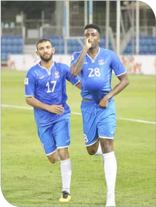
فرحة المنامة بهدف التعديل