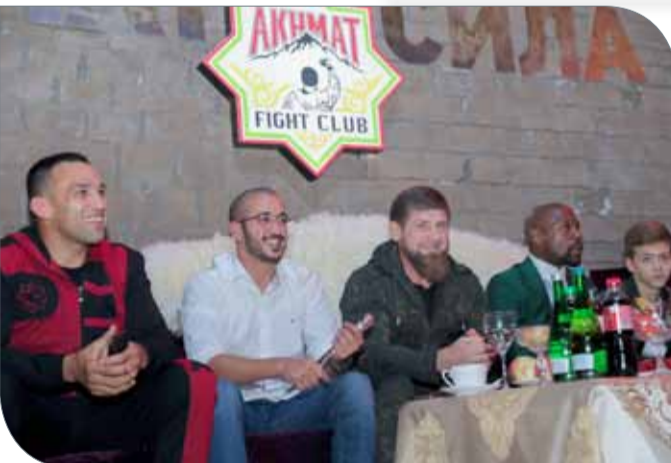
سموه مع الرئيس الشيشاني يتابعان المنافسات