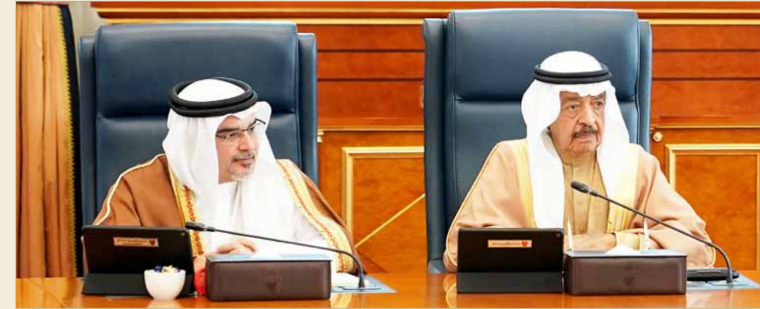
السمعة - بنا

ترأس رئيس الوزراء صاحب السمو الملكي الأمير خليفة بن سلمان آل خليفة، بحضور ولي العهد نائب القائد الأعلى النائب الأول لرئيس مجلس الوزراء صاحب السمو الملكي الأمير سلمان بن حمد آل خليفة، الجلسة الاعتيادية الأسبوعية لمجلس الوزراء، وذلك بقصر القضيبيية أمس.