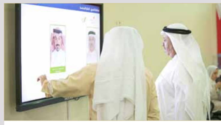
اسم النصح موجود عن دائرة سماهيج والدير البلدية