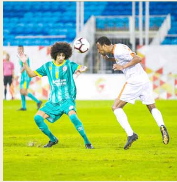
من منافسات دور ال-16 لكأس الملك