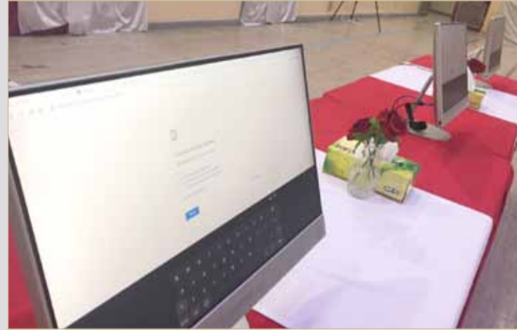
"السيستم داون" بلجنة العاصمة بعد فتح أبوابها