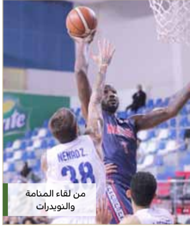
من لقاء النمامة والنويدرات

◆ المدينة يحقق الانتصار الأول على حساب سماهيج