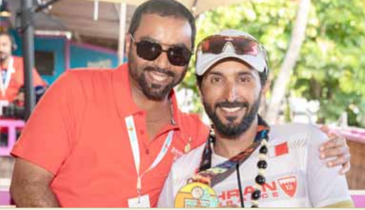
سمو الشيخ ناصر بن حمد وسمو الشيخ فيصل بن راشد

بمناسبة تحقيق ممثل جلالة الملك للأعمال الخيرية وشئون الشباب رئيس المجلس الأعلى للشباب والرياضة رئيس اللجنة الأولمبية البحرينية سمو الشيخ ناصر بن حمد آل خليفة المركز الأول في بطولة العالم للرجل الحديدي، ينظم الاتحاد الملكي للفروسية سباقات القدرة احتفالية خاصة لاستقبال سموه وستكون هذه الاحتفالية اليوم الثلاثاء من خلال امتناء الخيول من قرية البحرين الدولية للقدرة باتجاه بلاج الجزائر.