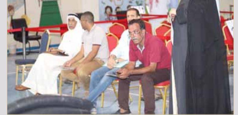
حضور واسع من المرفوض ترشحهم وآخرين ليتسلموا جدول الناخبين