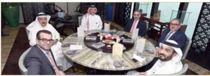
المنامة - بورصة البحرين