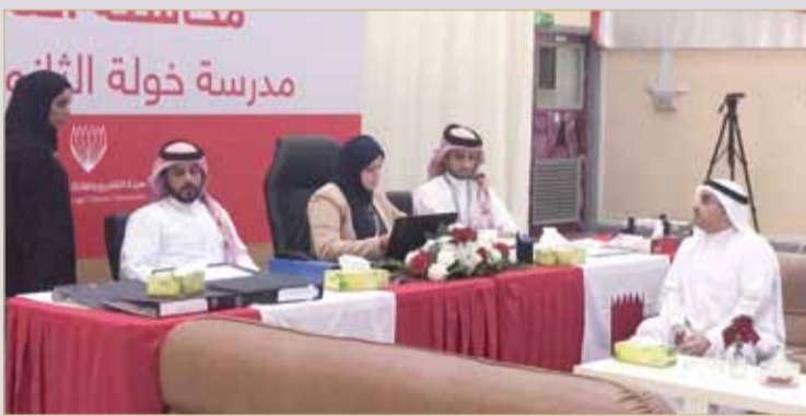
مترشح ثانية العاصمة فيصل بن رجب لم يدرج اسمه