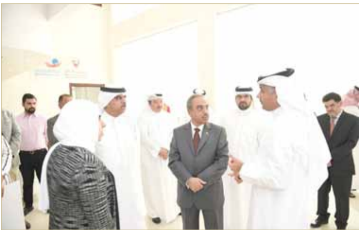
وزيرا الأشغال والمواصلات في جولة تفقدية لموقع المشروع

« صرح وزير الأشغال بأن المشروع تمت ترسيته من جانب مجلس المناقصات والمزايدات على أسيرى للمقاولات بكلفة مليونين و568 ألفاً و800 دينار، وخصصت الحكومة قطعة أرض تبلغ مساحتها 10 آلاف و907 أمتار مربع لإنشاء مبنى مركز الفرز البريدي، وتم البناء على مساحة 4 آلاف و190 متراً مربعاً.