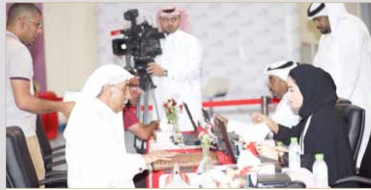
لجنة العاصمة تراجع مع بعض المترشحين