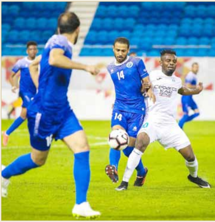
جانب من بطولة أعلى الكؤوس

« وأشار البوعيين أن التغييرات على المسابقة سيتم تدشينها ابتداء من دور الثمانية وستسعى اللجنة لتطبيقها من مرحلة الإياب بدور الستة عشر