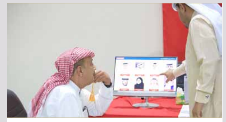
هل تتذكرون من صلي الاستخارة؟.. اسمه موجود