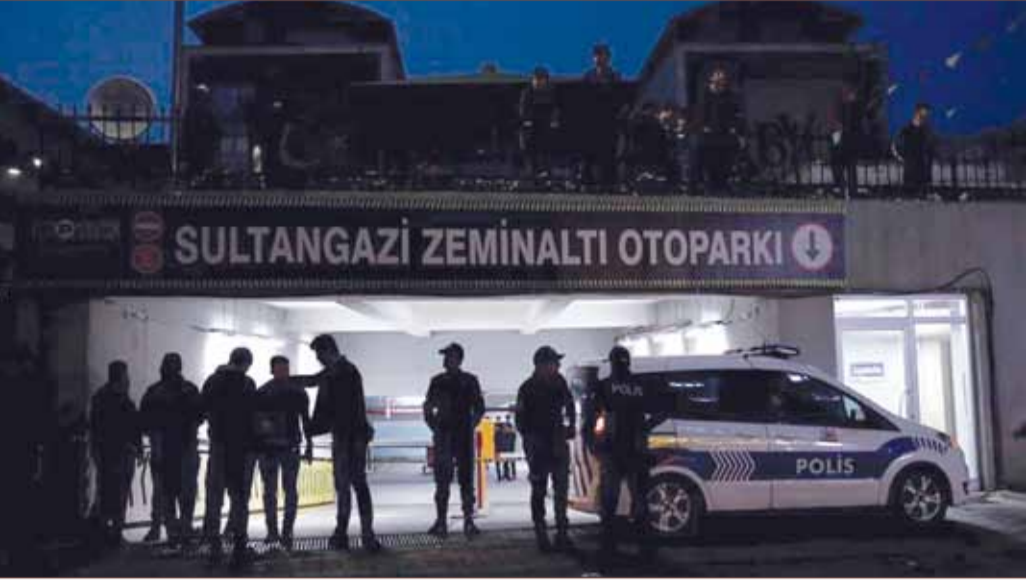
عناصر من الشرطة التركية تحرس مرآب به سيارة تخص القنصلية السعودية في اسطنبول

أعرب خادم الحرمين الشريفين العاهل السعودي الملك سلمان بن عبد العزيز عن بالغ تعازيه ومواساته لأسرة وذوي الصحفي السعودي جمال خاشقجي. جاء ذلك في اتصال هاتفي أجراه العاهل السعودي بباين الفقيه صلاح جمال خاشقجي. وفقاً لوكالة الأنباء السعودية (واس).