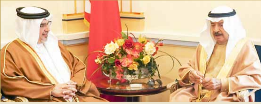
سمو رئيس الوزراء مستقبلاً سمو ولي العهد