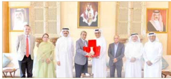
سلمان بن إبراهيم يتبادل الهدايا التذكارية مع رئيس الاتحاد الآسيوي للتنس الأرميني

استقبل الأمين العام للمجلس الأعلى للشباب والرياضة الشيخ سلمان بن إبراهيم آل خليفة مساء أمس (الأحد) أنيل كونا رئيس الاتحاد الآسيوي للتنس الأرميني، وذلك بحضور عبد الرحمن عسكر الأمين العام للجنة الأولمبية البحرينية والشيخ عبد العزيز بن مبارك آل خليفة نائب رئيس الاتحاد البحريني للتنس الأرميني وعدد من المسؤولين في الاتحادين البحريني والآسيوي للتنس الأرميني.