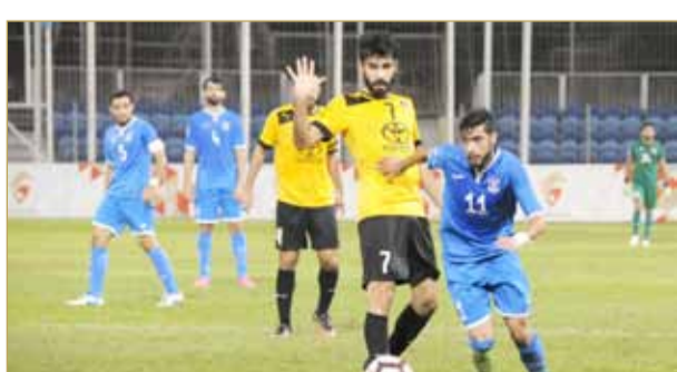
من لقاء الأهلي والمنامة