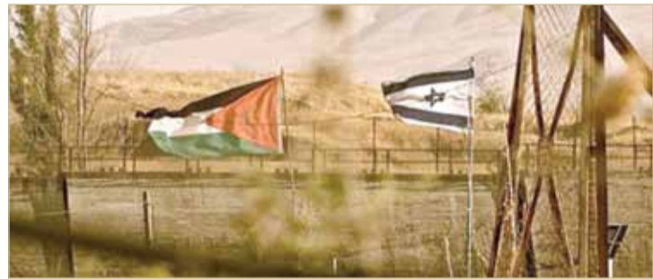
إسرائيل تهدد بقطع المياه عن الأردن بعد وقف ملحق اتفاقية السلام

هدد وزير الزراعة الإسرائيلي أوري أريئيل، أمس الاثنين، بقطع المياه عن العاصمة الأردنية عمان، رداً على إعلان ملك الأردن عبد الله الثاني وقف العمل بملحق اتفاقية السلام مع إسرائيل عام 1994، فيما يخص قريتي الغمر والباقورة.