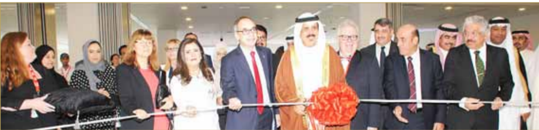
وزير التربية يفتتح الجامعة البريطانية بمملكة البحرين

صرح أمر قاعدة خفر السواحل بالمحرق، بأن الدوريات البحرية تمكنت من إنقاذ 8 بحارة بعد انقلاب القاربين الذين كانوا يقابلهم في عرض البحر، فيما تشير المعلومات إلى أن الحالة الصحية للبحارة الثمانية مستقرة. وأوضح أن قيادة خفر السواحل،