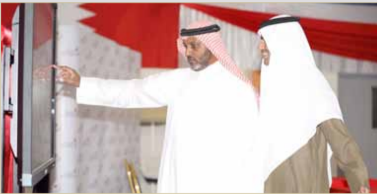
القيسي يراجع وجوده من ضمن المترشحين