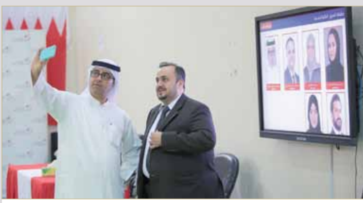
سلفي بين السماهيجي وخيامي