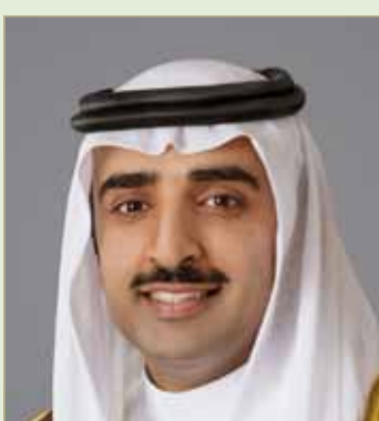
الشيخ محمد بن خليفة

المؤتمر يستهدف إشراك أصحاب المصلحة بالفرص الاستثمارية