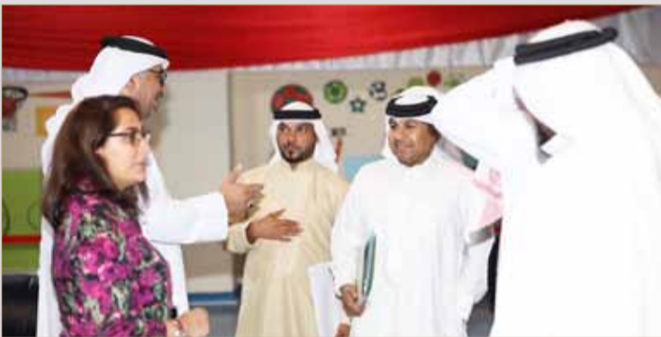
رئيس اللجنة مع عدد من المترشحين