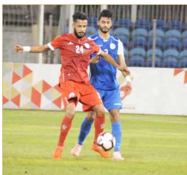
الحد تفوق على سترة بهدف