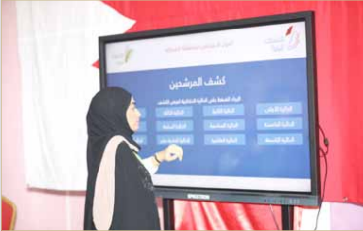
شاشة عرض كشف المترشحين رسميا