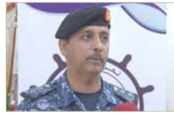
قائد التمرين البحري المشترك (جسر 19)

تنفيذه ما وصل إليه التنسيق المشترك بين سلاح البحرية الملكي البحريني والقوات البحرية الملكية السعودية، وتشمل فعاليات التمرين تنفيذ عدد من التمارين التي تهدف لتوحيد المفاهيم وتبادل الخبرات والتدريب على أحدث الأنظمة، وذلك وصولا لمرحلة التكامل على الصعيد العسكري البحري. ومن جانبه، ذكر قائد إحدى سفن القوات البحرية الملكية السعودية المشاركة: "يهدف التمرين البحري المشترك "جسر 19" لتحقيق مستوى عال من التنظيم والتنسيق وتوحيد المفاهيم بين القوات المشاركة فيه، وكما يساهم في تعزيز القدرات القتالية ورفع مستوى الأداء الاحترافي والعملي بين القوات البحرية الملكية السعودية وسلاح البحرية الملكي البحريني.