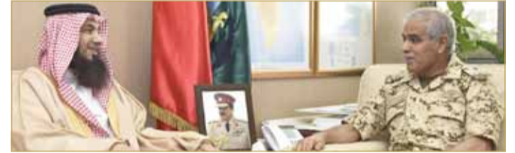
الرفاع - قوة الدفاع

استقبل رئيس هيئة الأركان الفريق الركن ذياب بن صقر النعيمي بمكتبه في القيادة العامة صباح أمس عضو مجلس النواب عبدالحليم مراد.