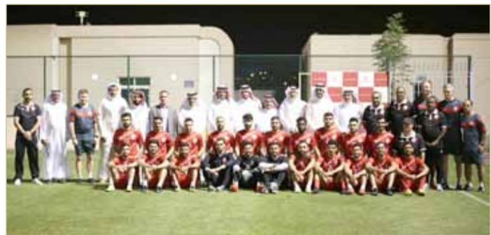
المنتخب الوطني الأول لكرة القدم

وأشار الشيخ علي بن خليفة آل خليفة إلى أن النهائيات الآسيوية تعد الاستحقاق الأكثر أهمية للمنتخب المرحلة المقبلة، التي تتطلب تكاتفاً من قبل الجميع في سبيل دعم المنتخب وخلق البيئة المناسبة والأرضية الصالحة وزيادة الثقة ورفع معنويات اللاعبين والجهاز الفني والإداري الذي يمكنه من تقديم مستويات متميزة تعكس تطور كرة القدم البحرينية وتلي الطموحات، وذلك في صورة للواجب الوطني الذي يحتم على الجميع دعم مشوار المنتخب لاستحقاق الآسيوي. وأوضح رئيس الاتحاد البحريني لكرة القدم أن مجلس إدارة الاتحاد سبق له تجديد الثقة في الجهاز الفني للمنتخب