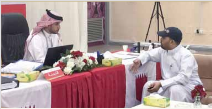
شمطوط مرفوض من الترشيح بالدائرة الجديدة