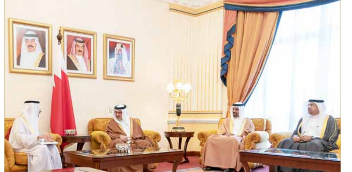
سمو ولي العهد يفتي دعوة من سمو الأمير محمد بن سلمان للمشاركة في مبادرة مستقبل الاستثمار