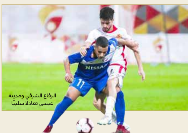
الرفاع الشرقي ومدينة عيسى تعادلا سلبيا

عجز الفريقان عن هز الشباك رغم الفرص التي سنحت لهما؛ ليكتفيا بالتعادل السلبي، ويتأجل الحسم بذلك إلى مباراة الإياب.