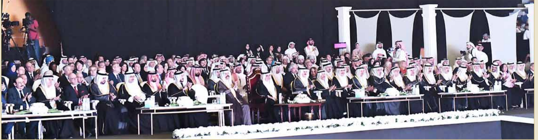
سمو ولي العهد يفتتح المهرجان الشبابي العالمي الأول لأهداف التنمية المستدامة

◆ سموه يفتتح نيابة عن جلالة الملك المهرجان الشبابي العالمي الأول لأهداف التنمية المستدامة