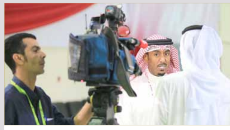
تصريح لرئيس لجنة المحرق