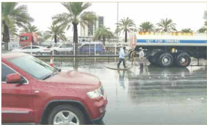
عمليات شفط مياه الأمطار من قبل وزارة الأشغال

قالت وزارة الأشغال وشؤون البلديات والتخطيط العمراني إن فريق طوارئ الأمطار موجود عند الشوارع الرئيسية والمدارس والمنطقة التعليمية والأماكن الحيوية ترقباً لسقوط الأمطار حسب ما أدلت به إدارة الأرصاد الجوية بوزارة المواصلات والاتصالات؛ لإتمام عملية شفط مياه الأمطار المتجمعة لضمان سلامة شبكة الطرق وانسيابية الحركة المرورية وعدم تعطلها.