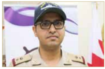
قائد إحدى السفن السعودي المشاركة في تمرين جسر 19