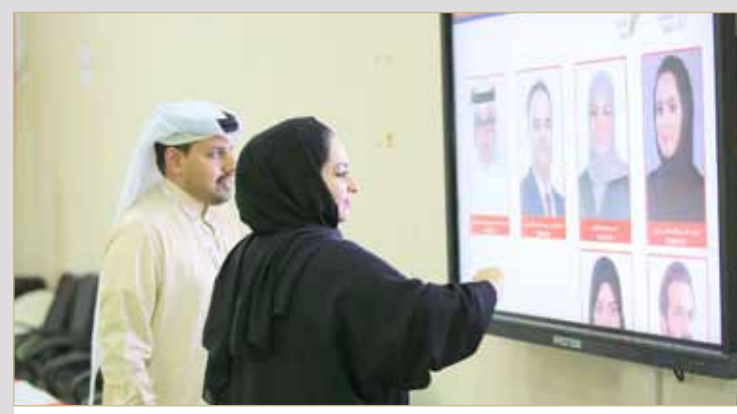
تغريد موجودة بكشف الناخبين