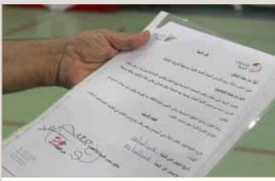
البلاد رسالة لمترشح مرفوض تبين أن سبب رفضه عضويته بجمعية "وعد" المتحلة