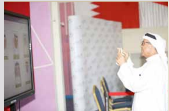
البلاد الوداعي يوثق ترشحه بطريقة صديقة للبيئة