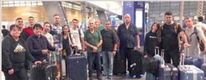
الوفد الإسرائيلي وصل إلى مطار الدوحة

ويظهر في الصورة الوفد الإسرائيلي بعد وصوله إلى مطار الدوحة، للمشاركة في بطولة العالم للجميماز، التي ستقام من 25 أكتوبر الجاري إلى 3 نوفمبر المقبل. وسارع ناشطون على موقع "تويتتر" إلى الإعراب عن تنديدهم لاستقبال الدوحة الوفد الإسرائيلي، وذلك تحت وسوم عدة، أبرزها وسم #يلا تطبيع #يلا جمباز. وتحت