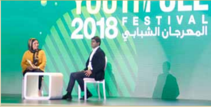
مؤتمر الشباب الدولي