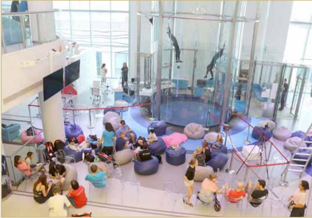
إقبال كبير للفرق وتنافس قوي متوقع على الجوائز المخصصة للبطولة