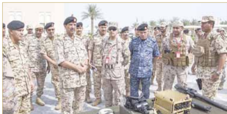
المشير لدى حضوره ختام المرحلة الفعلية لتدريب القيادات المشتركة "درع حمد 1"

شهد القائد العام لقوة دفاع البحرين المشير الركن الشيخ خليفة بن أحمد آل خليفة أمس ختام المرحلة الفعلية لتدريب القيادات المشتركة "درع حمد 1"، والذي نفذته قوات درع الجزيرة المشتركة، بحضور رئيس هيئة الأركان الفريق الركن ذياب بن صقر النعيمي.