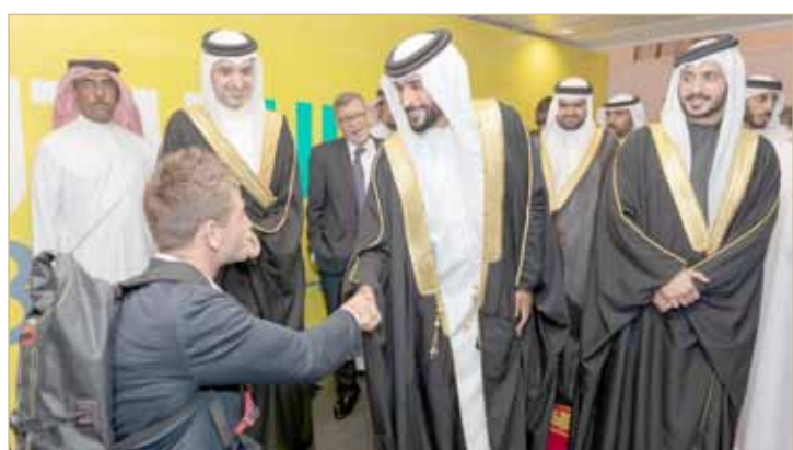
ناصر بن حمد يلتقي بالمتسابق البريطاني تاونسند

حرص ممثل جلالة الملك للأعمال الخيرية وشؤون الشباب رئيس المجلس الأعلى للشباب والرياضة رئيس اللجنة الأولمبية البحرينية سمو الشيخ ناصر بن حمد آل خليفة، على الالتقاء مع المتسابق البريطاني في بطولات الرجل الحديدي جو تاونسند، وذلك خلال افتتاح المهرجان الشبابي العالمي الأول لتحقيق أهداف التنمية المستدامة الذي يقام في المملكة.