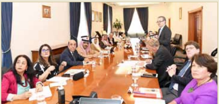
سمو الشيخ محمد بن مبارك آل خليفة مترئسا الاجتماع

ثم قدمت كلية البحرين التقنية "بوليتكنك البحرين" عرضاً تطرق إلى سير العمل في تنفيذ المرسوم بقانون رقم 26 لسنة 2018 والذي يهدف إلى إعادة تنظيم الكلية بصورة مستقلة، حيث تم استعراض جهود الكلية في إعادة صياغة الأنظمة الخاصة بها. وفي ختام الاجتماع اعتمد المجلس نتائج الدفعة 32 من تقارير المراجعة والمتابعة الصادرة عن هيئة جودة التعليم والتدريب، والتي شملت 14 مدرسة وأربع مدارس خاصة وسبع مؤسسات تدريبية، إضافة إلى نتائج تقارير مراجعة برامج التعليم العالي، كما اعتمد المجلس إدراج عدد من المؤسسات وتسكين وإسناد عدد من المؤهلات على الإطار الوطني، إضافة إلى التقرير السنوي لهيئة جودة التعليم والتدريب.