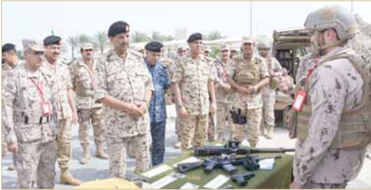
الرفاع - قوة الدفاع

القائد العام يشهد ختام المرحلة الفعلية لتمرين "درع حمد 1"