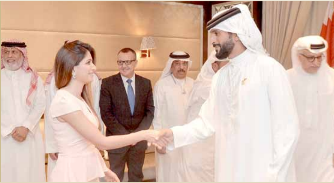
موظفو اللجنة يهنئون سموه

موظفو اللجنة هناؤا سموه واحتفلوا بإنجاز بطولة العالم للرجل الحديدي