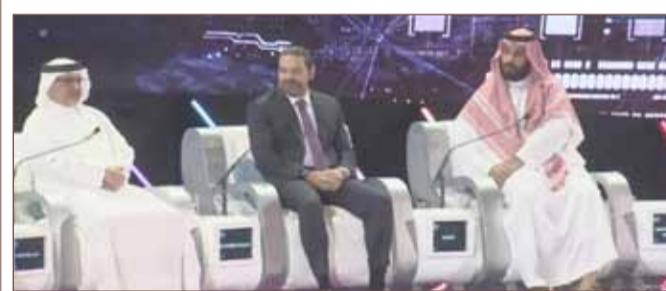
جانب من الجلسة المشتركة

توقع ولي العهد السعودي الأمير محمد بن سلمان مستقبلاً باهراً لمنطقة الشرق الأوسط، وقال إن المنطقة ستكون أوروبا الجديدة في السنوات الخمس المقبلة. وجاء تصريح ولي العهد السعودي أمس الأربعاء في جلسة مشتركة مع ولي العهد البحريني صاحب السمو الملكي الأمير سلمان بن حمد آل خليفة ورئيس وزراء لبنان المكلف سعد الحريري جرت ضمن مؤتمر "مبادرة مستقبل الاستثمار 2018"، المنعقد حالياً في العاصمة الرياض. وقال إن "الدول العربية شهدت تطوراً كبيراً على مستوى اقتصادها في السنوات