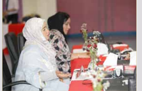
البلاد المترشحة مريم مدن تطعن ضد منافس