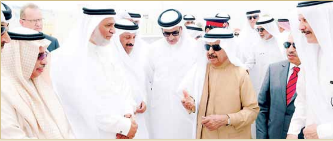
سمو رئيس الوزراء في أحد زيارته التفقدية للمحرق

« وقال الأهالي: "نعجز يا صاحب السمو عن التعبير عن امتناننا وسعادتنا لاهتمامكم الكبير المتواصل ومسعاكم الدعوى لتوفير الحياة الهائلة للمواطنين، وستظل كلمات الشكر عاجزة أمام مكرمات سموكم وجهودكم المبذولة؛ من أجل راحة آبائنا وأمهاتنا وتأمين مستقبل أبنائنا من خلال تحقيق التنمية والنهضة في كافة مناحي الحياة، أطال الله عمركم وأمدمكم بموفور الصحة والعطاء."