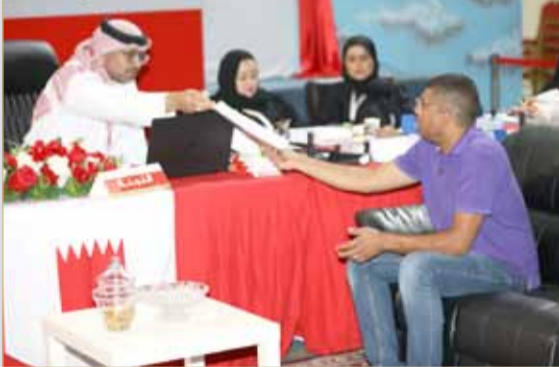
البلاد قضية جنائية تطيح باعتراض مترشح