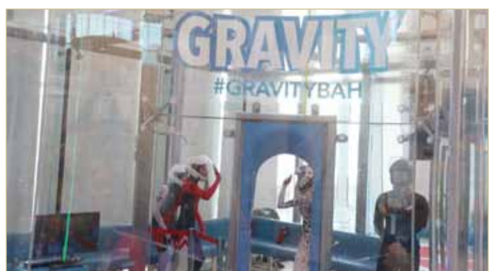
من استعدادات الفرق

9 صباحاً إلى 5 عصراً: عملية التسجيل وتصوير الفرق في النفق الأبيض