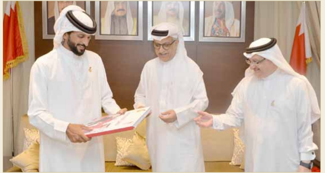
سلمان بن إبراهيم مقدماً هدية تذكارية إلى سمو الشيخ ناصر بن حمد