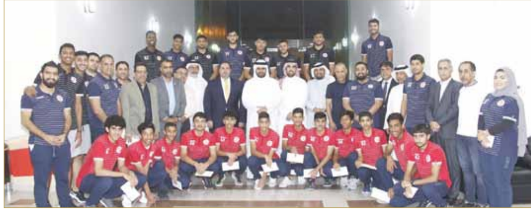
سمو الشيخ عيسى بن علي متوسط لاعبي منتخب الناشئين والشباب

أشاد رئيس الاتحاد البحريني لكرة السلة سمو الشيخ عيسى بن علي بن خليفة آل خليفة بإنجازات المتميزة التي حققتها منتخبات الفئات العمرية في البطولات الإقليمية والقارية، والتي ظهرت فيها تلك المنتخبات بمستويات كبيرة وراقية تؤكد التطور الذي تعيشه كرة السلة البحرينية في ظل الإستراتيجية الموقفة التي اعتمدها الاتحاد البحريني لكرة السلة للأعوام المقبلة، وساهمت بصورة واضحة في وصول المنتخبات الوطنية إلى تحقيق نجاحات رائعة في مختلف البطولات الرياضية.