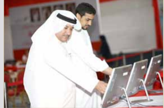
البلاد لا تحاتي بالشوملي... اسمك موجود