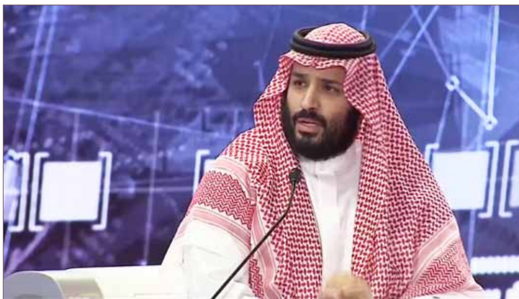
ولي العهد السعودي الأمير محمد بن سلمان متحدثاً خلال المؤتمر

وصف ولي العهد السعودي الأمير محمد بن سلمان أمس الأربعاء مقتل الصحفي جمال خاشقجي بـ "الحادث البشع"، متعهداً بتقديم "المجرمين" للعدالة، ومشهداً على استمرار التعاون بين الرياض وأنقرة.