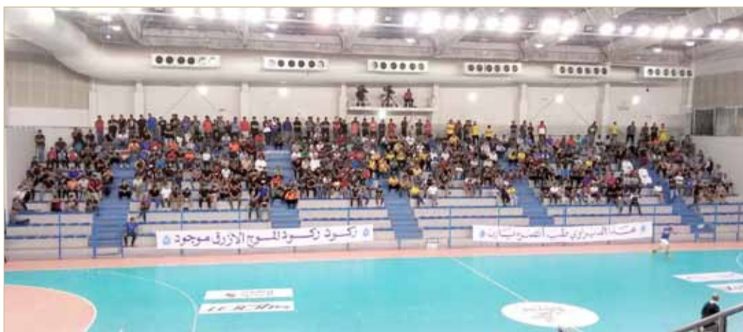
لقطة لجمهور الأهلي والدير

لقاء متوقع له الحضور الجماهيري الغفير من الناديين المتباريين في ظل موقفيهما في جدول الترتيب والإمكانات البشرية المتواجدة في صفوفهما، ما يعني أن الإثارة ستسود مدرجات الصالة كما هو الحال بأرضية الميدان وستطلق الجماهير العنان لنفسها لموازنة ومساندة لاعبي فريقها وستبدي مشاعرهما مع كل لعبة تحدث سواء أكانت إيجابية أم سلبية، ولكن اتحاد اليد (تناسي أو تغاضي) عن هذه النقطة المهمة وترك الأمور تسير بـ”البركة“ كما يقال، دون