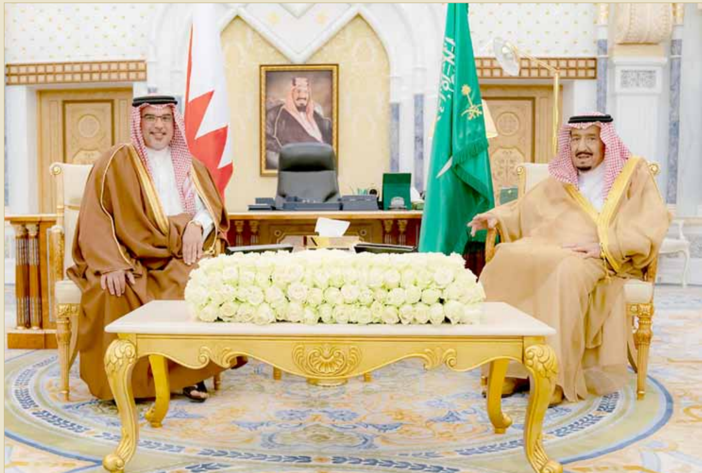
خادم الحرمين الشريفين مستقبلاً سمو ولي العهد

ولي العهد نائب القائد الأعلى النائب الأول لرئيس مجلس الوزراء