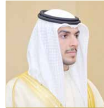
الشيخ محمد بن راشد

أكدت مدير عام "جرافيتي" خولة الحمادي أن نجاح البحرين في استضافة بطولة العالم الثالثة للطيران الداخلي بالنفق الهوائي المغلق لعام 2018، لم يكن دون دعم الشيخ محمد بن راشد بن خليفة آل خليفة، مشيرة إلى أنه المشجع الرئيسي والدافع الأساسي لدخولنا المنافسة على الاستضافة التي ظفرت بها مملكة البحرين.