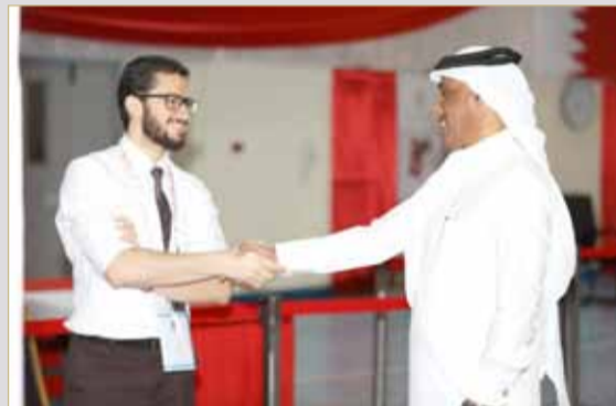
البلاد مبروك قبول ترشحه بالدوسري