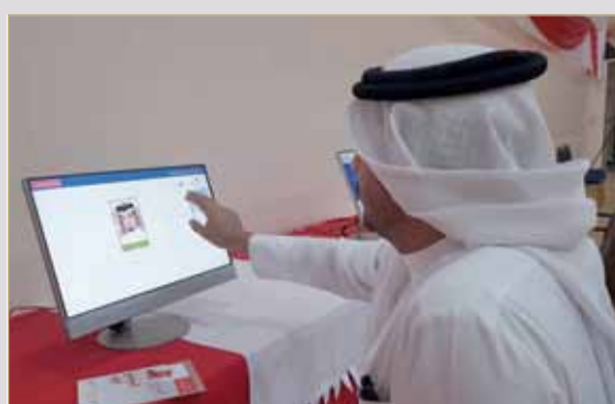
البلاد أحد المواطنين يشاهد القوائم الأولية. أشك إنه "مفتاح انتخابي"!