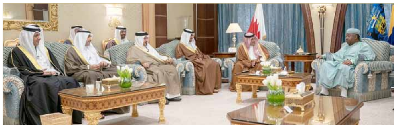
سمو ولي العهد ملتقياً برئيس جمهورية الغابون

◆ سمو ولي العهد يلتقي بونغو علي هامش مبادرة مستقبل الاستثمار