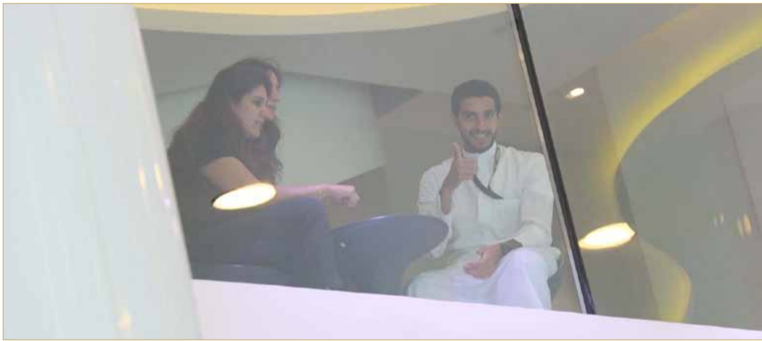
الشيخ محمد بن راشد أثناء تفقده أمس الاستعدادات الأخيرة لانطلاق البطولة اليوم

♦ جرافيتي تشهد افتتاح كأس العالم للطيران الحر