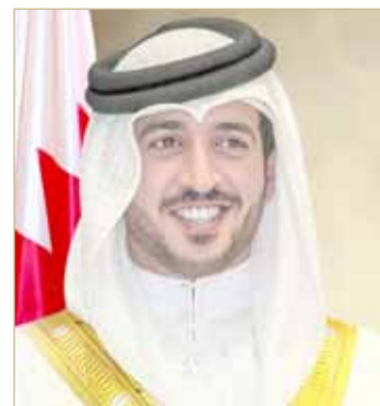
سمو الشيخ خالد بن حمد آل خليفة

بطولة العالم، يأتي ثمره لرعاية ودعم لعاهل البلاد للرياضة البحرينية، التي انعكست على تطورها وارتقاءها في العهد الزاهر لجلالته أيده الله، حيث توجت البحرين بنتائج متميزة تضاف لسجلها الرياضي الحافل بالإنجازات، حيث عزز ذلك من المكانة المرموقة التي تحتلها المملكة على خارطة الرياضة الدولية. وأضاف سمو الشيخ خالد بن حمد آل خليفة أن القطاع الرياضي يشهد حركة مميّزة بفضل المساعي والجهود الكبيرة التي يبذلها سمو الشيخ ناصر بن حمد آل خليفة، عبر الخطط والبرامج التطويرية والتحفيزية التي يطلقها سموه، التي من شأنها أن تساهم بمزيد من التقدم والنجاحات، الذي يأتي ترجمة لتوجهات العاهل للنهوض بهذا القطاع الحيوي.