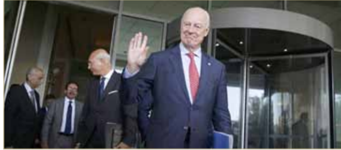
ديمستورا في دمشق

تسارعت الجهود للدفع بتشكيل لجنة الدستور السورية قبل ساعات من زيارة الوفد الدولي ستيفان دي ميستورا إلى دمشق. يأتي ذلك في ظل بروز دور أميركي مهم سياسي وعسكري على خط الاتصالات وتقييم شبه تام لإيران عن المشهد، علماً بأن موسكو قللت من فرص خروج القمة الرباعية السبت المقبل بأي اتفاقات بهذا الخصوص.