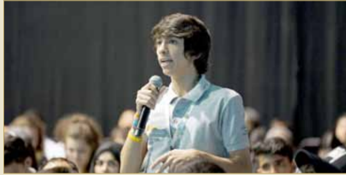
مؤتمر الشباب الدولي