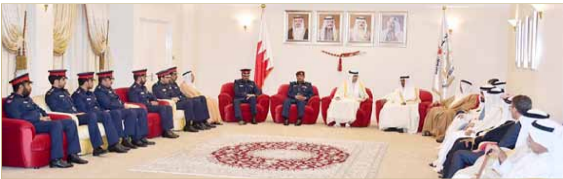
سمو الشيخ خليفة بن علي مستقبلاً عدداً من وجهاء وأعيان المحافظة الجنوبية وكبار ضباط وزارة الداخلية

بن حمد ليكون الشخصية الأساسية في البرنامج بوصف سموه من القيادات البحرينية المهمة للشباب، لما يتمتع به من خبرة عملية وشخصية قيادية استثنائية، إضافة إلى الإنجازات الكبيرة التي حققها في مختلف المجالات. وستدير الجلسة الحوارية وزييرة الدولة الإماراتية لشؤون الشباب، نائب رئيس مركز الشباب العربي شما المزروعى.