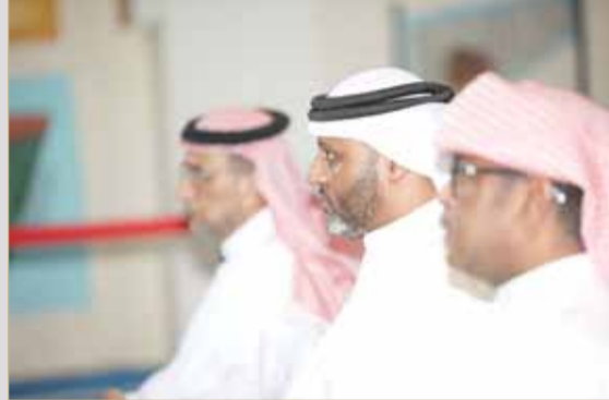
البلاد مضايقات الجنوبية تلاحق القيسي في الشمالية