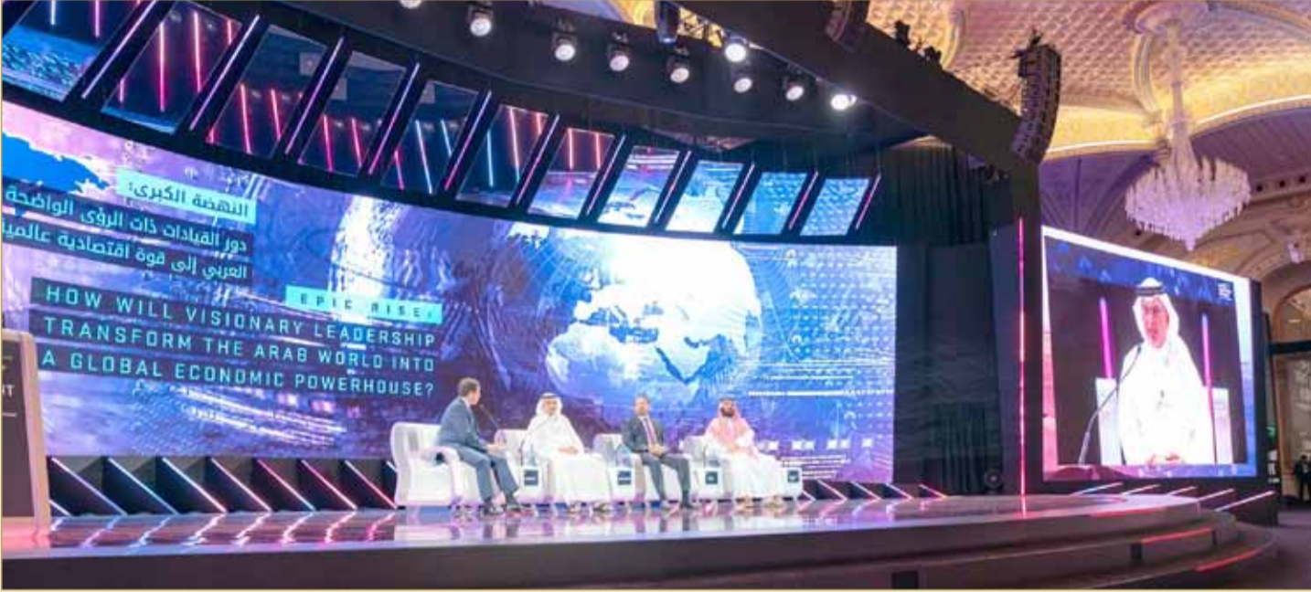
سمو ولي العهد لدى مشاركته في مبادرة منتدى مستقبل الاستثمار

◆ سمو ولي العهد يشارك بحلقة نقاشية في "مستقبل الاستثمار"