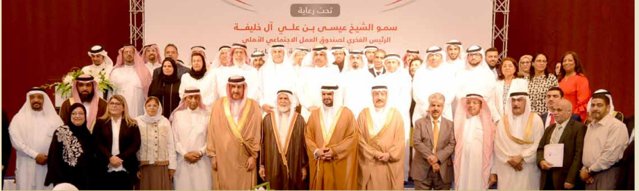
سمو الشيخ عيسى بن علي بن خليفة لدى تفضله برعاية الحفل العاشر لتوزيع المنح المالية للمنظمات الأهلية والجمعيات الخيرية الفائزة بمشروعات تنمية خدمة للمجتمع وتطويره

توزيع المنح المالية للمنظمات الأهلية والجمعيات الخيرية الفائزة بمشروعات تنمية