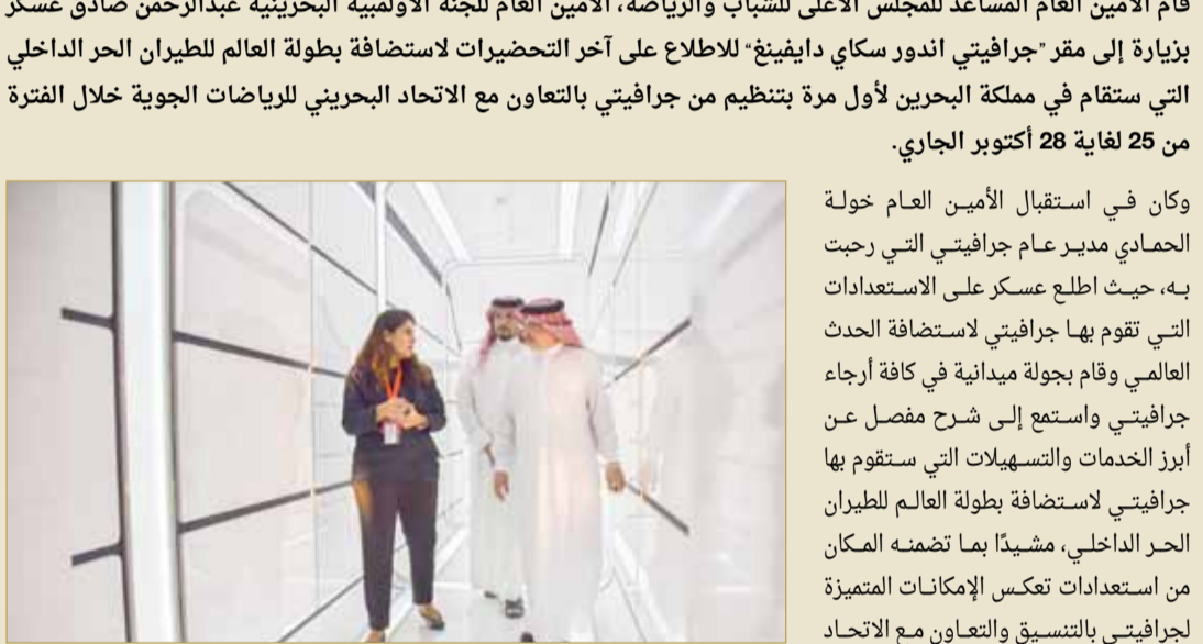
عسكر خلال تفقده موقع البطولة