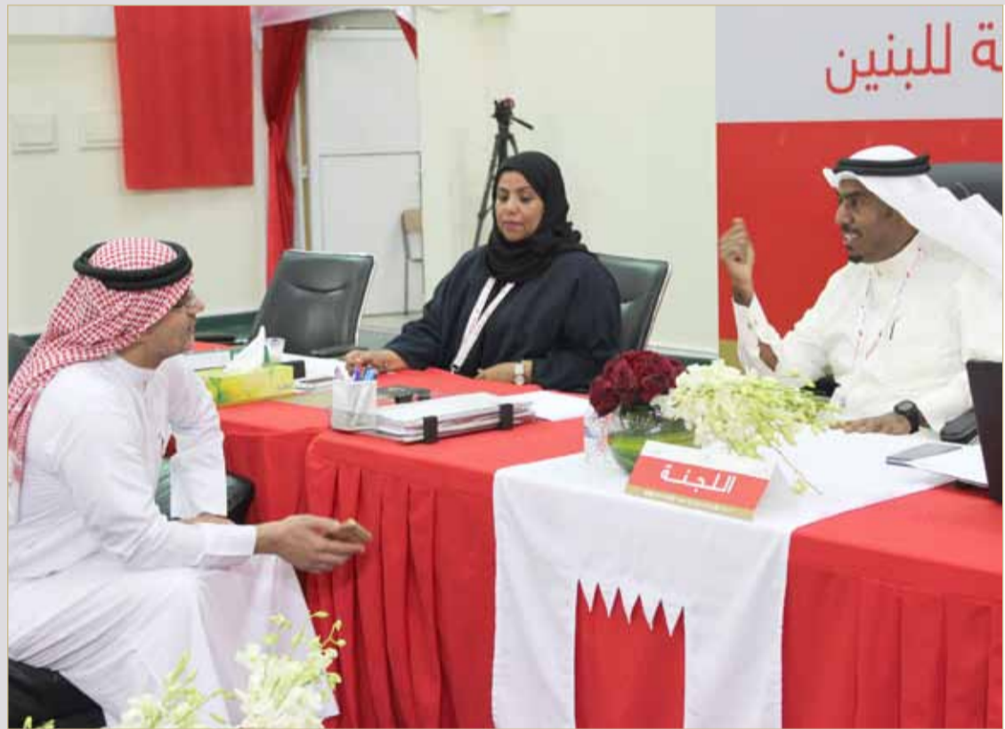
البلاد أحمد العباسي يقترح على وضع وكلاء مساوي لتعدد المراكز العامة