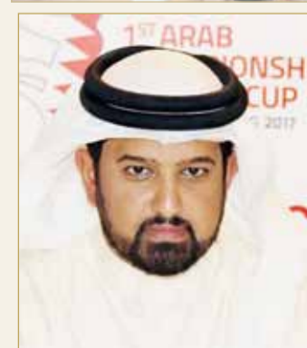
سلمان بن عبدالله