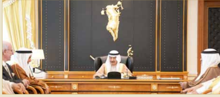
سمو رئيس الوزراء مستقبلاً الشيخ خالد بن عبدالله

استقبل رئيس الوزراء صاحب السمو الملكي الأمير خليفة بن سلمان آل خليفة بقصر القضيبي أمس نائب رئيس مجلس الوزراء الشيخ خالد بن عبدالله آل خليفة. وأكد صاحب السمو الملكي رئيس الوزراء أن الحكومة بالغة التقدير لإسهامات أبناء البحرين، والتي تحفزها على خوض غمار التحدي مهما بلغت أفاقه.