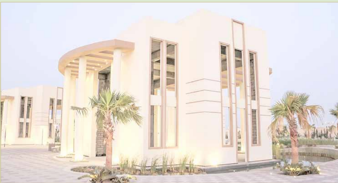
الزلاق - زلاق سبرينغز

الفعالية ستجرى طوال أيام 25 و26 و27 أكتوبر بدون رسوم