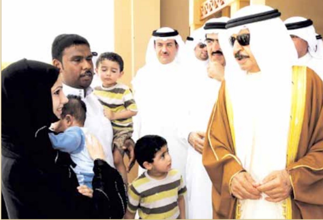
سمو رئيس الوزراء لدى زيارته للمحرق (أرشيفية)

للمجد طلعتك البهية شمس تشع على البرية وبنان كفيك للندي وطفاء ساكنة رويته ولك المناقب في سماء الفخر مژهرة مضيبة