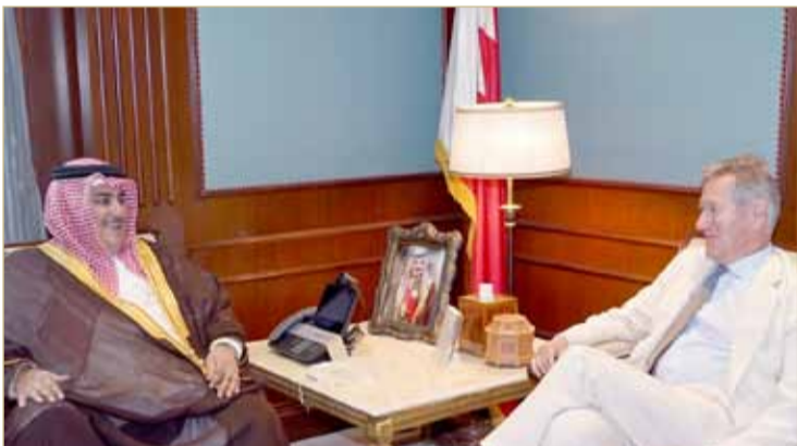
المنامة - وزارة الخارجية

دور مهم للمعهد الدولي للدراسات في نشر الفكر الاستراتيجي