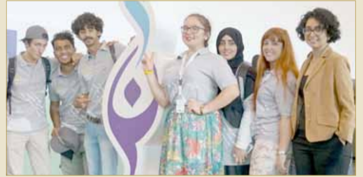
جائزة ناصر بن حمد