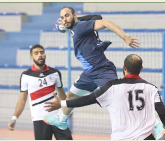
من لقاء النجمة والاتفاق