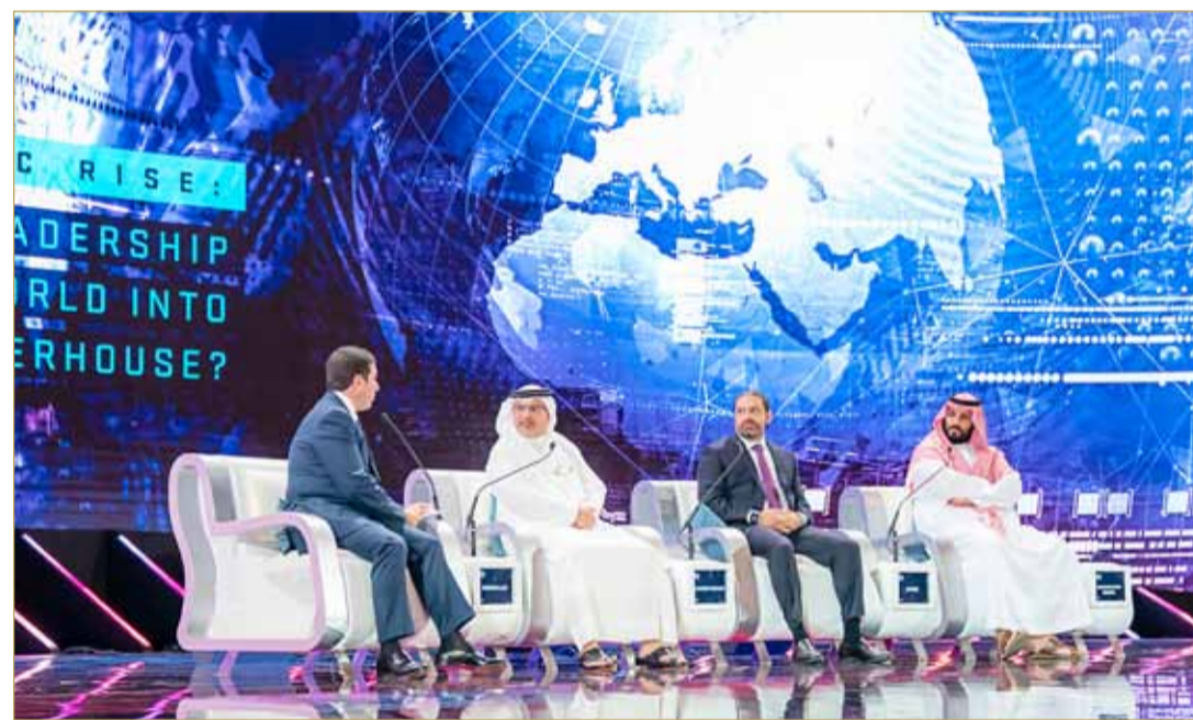
سمو ولي العهد لدى مشاركته في منتدى مستقبل الاستثمار

سمو ولي العهد شارك بالحلقة النقاشية "النهضة الكبرى"