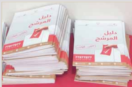
البلاد ترى إلى الآن الكميات موجودة إذا أحد "له خاطر"!