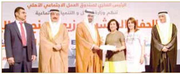
سمو الشيخ عيسى بن علي لدى رعايته للحفل