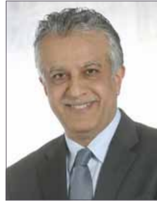
الشيخ سلمان بن إبراهيم

كيغالي - مكتب رئيس الاتحاد الآسيوي لكرة القدم