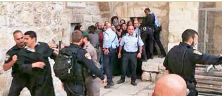
القوات الإسرائيلية تعتدي على الرهبان الأقباط في ساحة كنيسة القيامة

استهدف الطيران الإسرائيلي موقعا عسكريا في قطاع غزة أمس الأربعاء، ردا على إطلاق بالونات حارقة في اتجاه الأراضي الإسرائيلية، وفق ما أفاد الجيش في بيان.