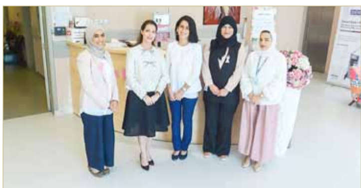
شركة إبراهيم خليل كانو تدعم حملة شهر أكتوبر للتوعية بالكشف المبكر

شاركت خدمات مطار البحرين (باس) في معرض إكسبو البحرين للضيافة والمطاعم 2018، الذي أقيم برعاية سمو الشيخ عيسى بن علي آل خليفة. وجاءت مشاركة (باس) من خلال إدارة التموين التي تفتخر بإعداد أكثر من 6.5 مليون وجبة سنوياً.