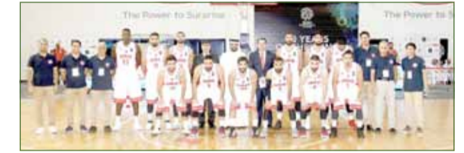
منتخبنا الوطني لكرة السلة

النتائج السلبية المتواصلة والإخفاقات التي يتلقاها فريق الكرة بنادي الاتفاق في المواسم الأخيرة، رغم وجود العديد من المواهب والخامات التي يزرع بها النادي، يتطلب وقفة حقيقية وجادة من مجلس الإدارة، لإنقاذ فريقها الكروي.