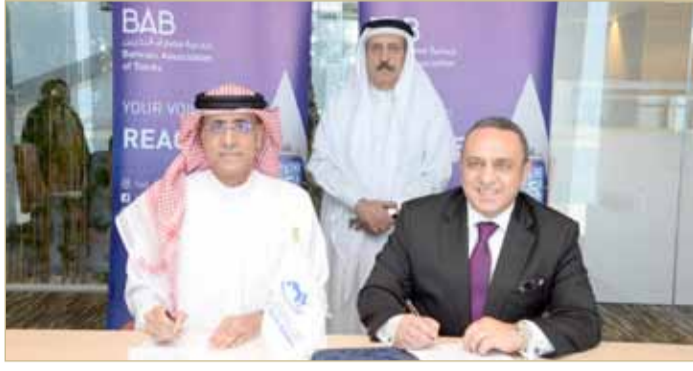
أثناء توقيع الاتفاقية

كافة ويمتلك خبرات وأنشطة متميزة وغنية، مما يجعل من تعاوننا المشترك معه قيمة مضافة لكلا الطرفين، ونتطلع إلى تفعيل التعاون المشترك في كافة المجالات.