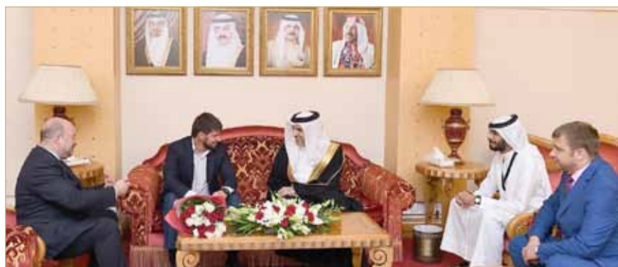
وصول نائب الرئيس الشيشاني

ما تتميز به مملكة البحرين من قدرات رائعة في التنظيم وما تمتلكه من منشآت رياضية متطورة.