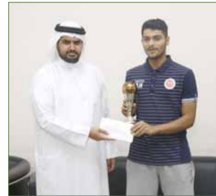
سموهه بكرم اللاعبين