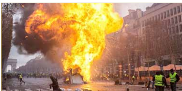
احتجاجات في باريس ضد ارتفاع أسعار البنزين

طلب الرئيس الفرنسي إيمانويل ماكرون من وزير الداخلية كريستوف كاستانير، وقادة الشرطة، تغيير التكتيكات المستخدمة من أجل الحفاظ على النظام في العاصمة باريس ووقف أعمال الشغب. وتشير التصريحات إلى توجه لاستخدام "القبضة الحديدية" ضد المحتجين، وفق ما ذكرت صحيفة "التايمز" البريطانية، أمس. وتسببت احتجاجات السترات الصفراء في خسائر بالملايين للاقتصاد الفرنسي. (14)