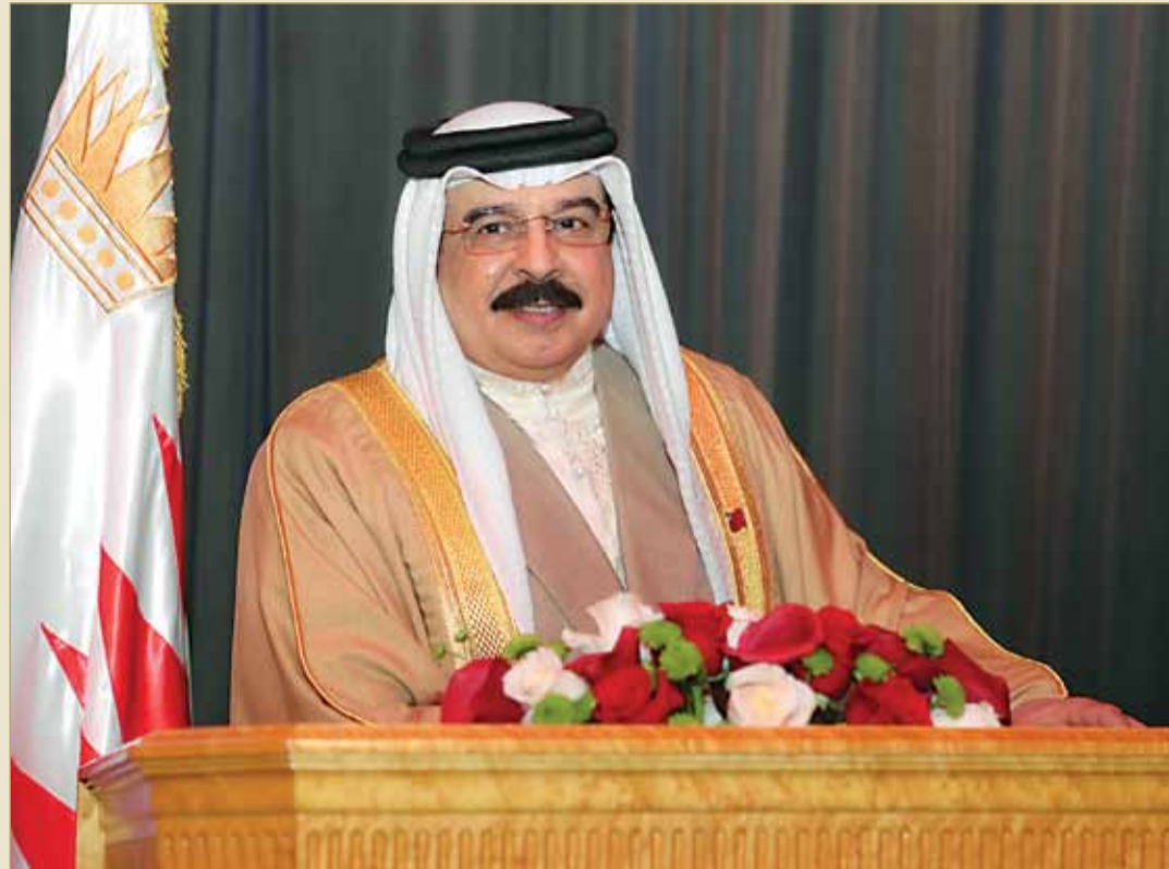
جلالة الملك ألقى كلمة سامية مسجلة بمناسبة يوم المرأة البحرينية 2018

العاهل يحيي الأداء المسوؤل والنتائج الطيبة لمشاركة المرأة في الانتخابات