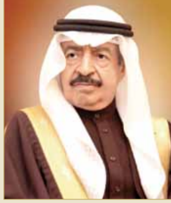
سمو رئيس الوزراء

هذه البلاد الغالية ورغبتكم الدائمة بتحقيق تقدمها ورقبها، وإنكم ستضعون عدداً من الأولويات نصب أعينكم وستجعلونها من بين الأسس التي سيقوم عليها برنامج عمل الحكومة في هذه المرحلة لاستكمال ما سبق تحقيقه بالمراحل السابقة. وأكد أن سموه هو أقدر من يضع الخطط التنفيذية والبرامج الهادفة التي تكفل استمرار تفعيل البناء الوطني على أساس من التخطيط العلمي في إطار ما تتطلبه الإدارة الحديثة للدولة، وتوجه المملكة إلى تفعيل كافة القطاعات، وتطوير مناخ الاستثمار، والارتقاء بمستوى التعليم، وتوفير المسكن الملائم لذوي الدخل المحدود، وإصلاح منظومة الرعاية الصحية وما يستلزم كل ذلك من المتابعة المستمرة للأداء، وتحقيق المزيد من العطاء والسرعة في الإنجاز.