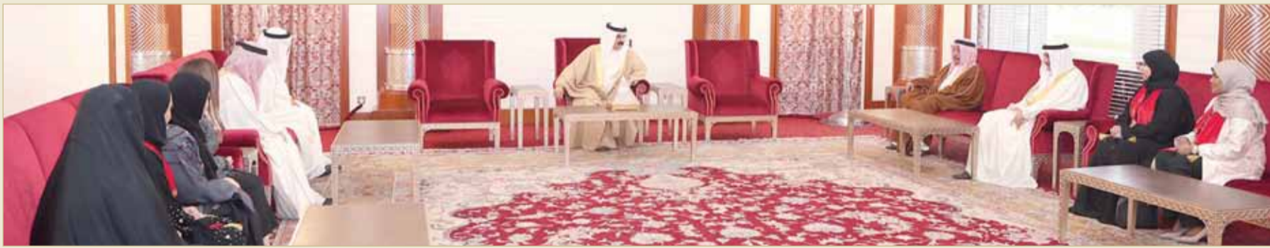
جلالة الملك مستقبلاً المعلمات الفائزات بجائزة محمد بن زايد لأفضل معلم خليجي