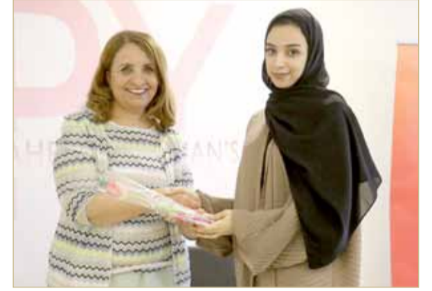
ضاحية السيف - اللجنة الأولمبية