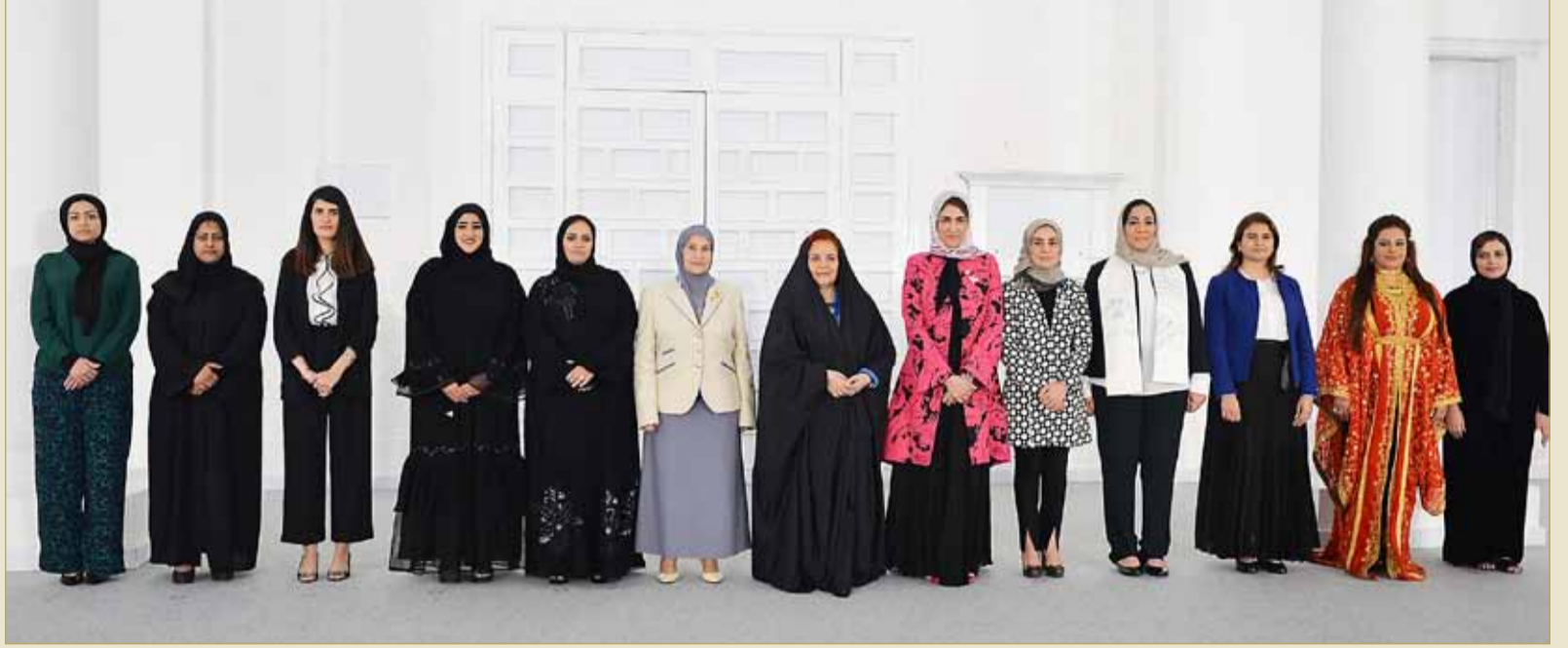
سمو فرينة جلالة الملك تتوسط الفائزات في الانتخابات النيابية والبلدية

وقدمت القيادات النسائية بالوزارة وشكرهن لرئيسة المجلس الأعلى للمرأة صاحبة سمو الملكي الأميرة سبيكة بنت إبراهيم آل خليفة على اهتمامها ورعايتها للمرأة البحرينية وعلى تخصيص يوم هذا العام للاحتفال بالمرأة في المجال التشريعي والعمل البلدي.