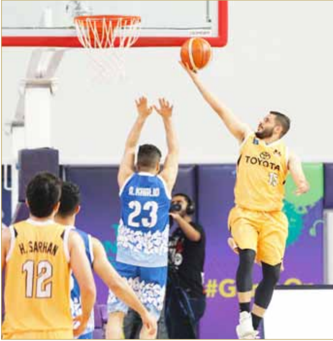
من لقاء الأهلي والنويدرات