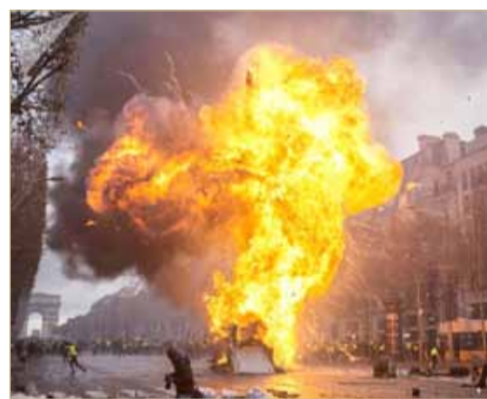
احتجاجات في باريس ضد ارتفاع أسعار البنزين

طلب الرئيس الفرنسي إيمانويل ماكرون من وزير الداخلية كريستوف كاستانير، وقادة الشرطة، تغيير التكتيكات المستخدمة من أجل الحفاظ على النظام في العاصمة باريس ووقف أعمال الشغب. وتشير هذه التصريحات، التي تأتي بعد فشل استجابة الحكومة الفرنسية لمطالب المتظاهرين من أصحاب السترات الصفراء، إلى توجه لاستخدام "القبضة الحديدية" ضد المحتجين، وفق ما ذكرت صحيفة "التايمز" البريطانية، أمس الاثنين.