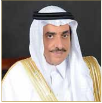
عبدالله بن عبدالمك آل الشيخ

نقلة اقتصادية كبيرة وشرينا اقتصاديا حيويا وأحد المشاريع الاقتصادية المهمة التي يعود نفعها على البلدين والشعبين الشقيقين، وله أهمية كبيرة في مسار علاقات التعاون الثنائية خصوصا في القطاع النفطي.