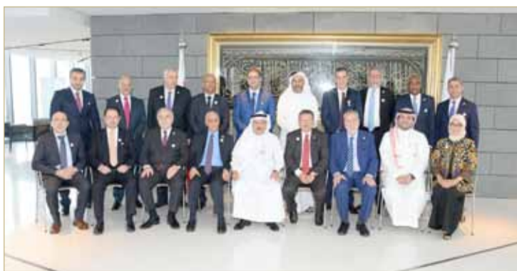
المشاركون في الاجتماع الإستراتيجي

مجموعتنا على اتخاذ إجراءات احترازية؛ للحد من المخاطر في الأسواق التي نعمل فيها، وقد نجحنا إلى حد كبير في احتواء تأثيرات العديد من الأزمات، وعلى الرغم من أن قدرتنا على السيطرة أو حتى التأثير على العوامل الخارجية محدودة للغاية، فإننا نؤمن بالعمل من منطلق إيجابي مع جميع مكونات المجموعة؛ من أجل زيادة قدرتنا التنافسية، وترشيد تكاليفنا، والالتزام الصارم بمبادئ الشريعة، والتأكيد على المعايير الجيدة للامتثال والحوكمة وتعزيز الرقمنة.