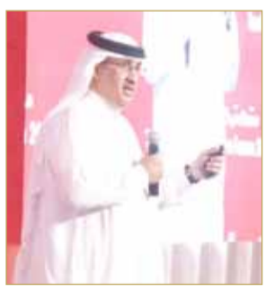
الشيخ محمد بن عيسى متحدثاً في المنتدى

قال رئيس مجلس إدارة صندوق العمل "تمكين" الشيخ محمد بن عيسى آل خليفة، خلال منتدى "تمكين" التشاوري السنوي، أمس، إن صناعة الأثر في تنمية البيئة الاقتصادية بالبحرين هي عملية تشاركية تسهم فيها جميع الجهات المعنية بالمنظومة الاقتصادية، والمنتدى يمثل خطوة أساسية على طريق تعزيز البيئات الداعمة للمؤسسات الناشئة من خلال مناقشة فرص التطوير. (09)