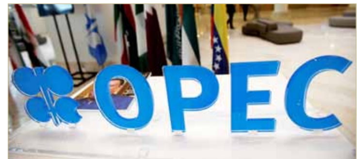
قطر تغادر منظمة أوبك

أعلنت قطر أنها أبلغت منظمة أوبك صباح أمس الإثنين قرارها بالانسحاب من المنظمة على أن يسري هذا القرار بدءًا من 19 يناير المقبل. وبعد 57 عامًا قضتها كعضو في أوبك، فسرت قطر انسحابها من المنظمة، بأسباب فنية واستراتيجية وليس سياسية، وهو تعبير يعكس ضعف تأثيرها داخل المنظمة بوصفها إحدى أصغر المنتجين داخلها.