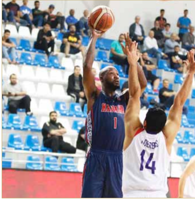
من لقاء المنامة وسترة

البلاد | محمد الدرازي