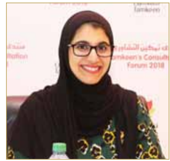
البوشي متحدثاً في منتدى "تمكين"

برنامج لدعم زيادة رأس المال من خلال "سوق البحرين"