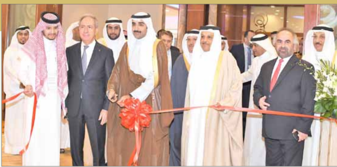
وزير النفط مفتتحاً المؤتمر والمعرض المصاحب له

ونظم المؤتمر الشركة الأوروبية للاستشارات البترولية وشركة نفط البحرين (بابكو) والاتحاد الخليجي للتكرير بالتعاون مع الهيئة الوطنية للنفط والغاز. وقال الوزير "لزيوت الوقود المتبقي أهمية متزايدة لصناعة النفط والغاز، لاسيما في ظل التحديات التي تواجه مصافي معالجة الخامات الثقيلة في الاستفادة الكلية من متبقي الزيت من نواتج التقطير، لافتاً أنه من المشجع أن نرى موضوع المؤتمر منصب على مواضيع تحسين التقنيات الصديقة للبيئة مثل الاتجاهات المتقدمة في التقاط الكربون أو الامتصاص المعزز