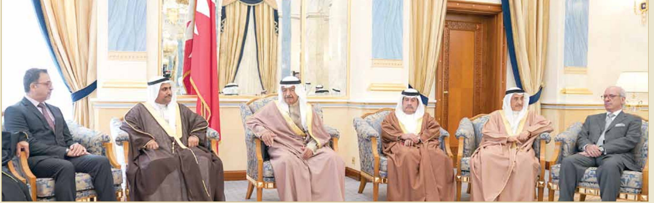
سمو رئيس الوزراء مستقبلا عددا من أعضاء مجلس النواب

◆ سمو رئيس الوزراء البحرين ستبقى واحة العطاء والعزة بقيادة العاهل