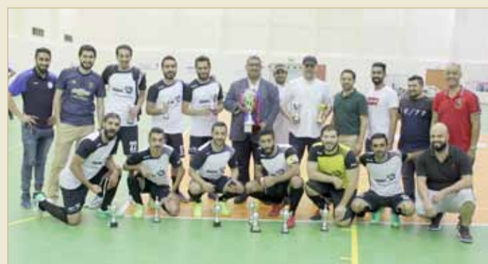
فريق بنك البحرين والكويت بطل دوري البنوك