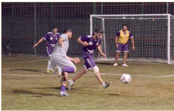
جانب من المنافسات

"HPC" يطر شباك الفتح ب 12 هدفاً في بطولة أبوصيبح