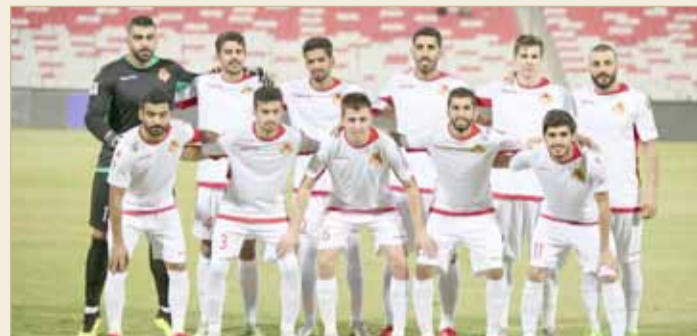
فريق الرفاع الشرقي