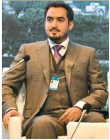
الشيخ خالد بن حمود

الإجمالي بنسبة 6.9 %، والذي يعمل على خلق العديد من الفرص الوظيفية المميزة ودعم التوجهات الاقتصادية للمملكة. إن الدور المهم المناط بالهيئة يضعها على طريق الاجتهاد نحو تحقيق أهداف الأمم المتحدة للتنمية المستدامة 2030.