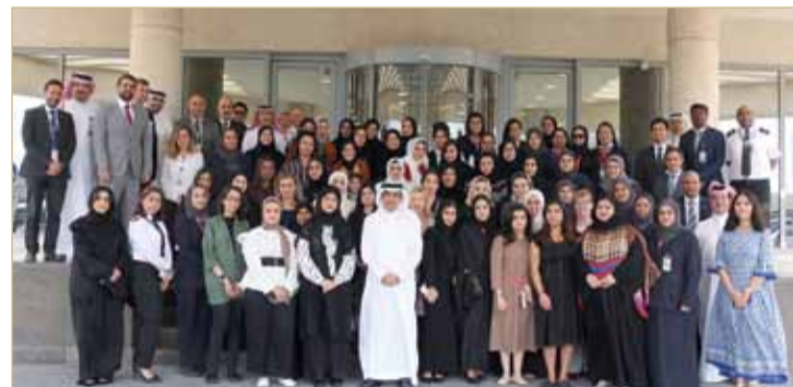
جانب من احتفال "باس" بيوم المرأة البحرينية

مضيفات منذ الاحتفال الأول بيوم المرأة البحرينية، الذي جاء نتيجة جهود دعوية من قبل قرينة عاهل البلاد رئيسة المجلس الأعلى للمرأة صاحبة السمو الملكي الأميرة سبيكة بنت إبراهيم آل خليفة". وشكرت نساء باس اللواتي يمضين أيام عمرهن في الشركة بإخلاص وتفان، بإذلات جهودهن الفعالة في رفعة شأنها ورفقها.