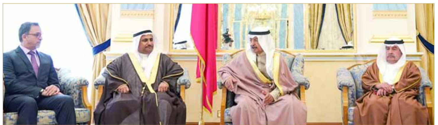
سمو رئيس الوزراء مستقبلاً عدداً من أعضاء مجلس النواب

سمو رئيس الوزراء: وجود النخبة المتميزة من الشباب والنساء بشرى خير