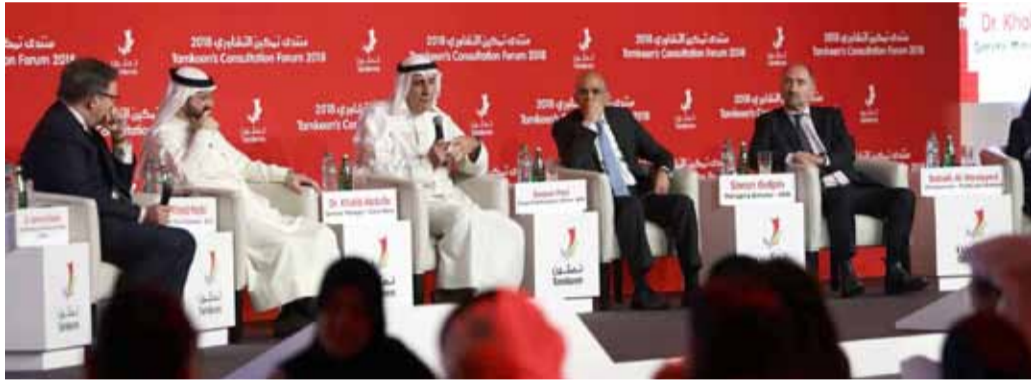
جانب من جلسات المنتدى

الشأن والمشاركات فيها، معتبراً فوز البحرين باستضافة المؤتمر العالمي لريادة الأعمال للعام 2019، للمملكة.