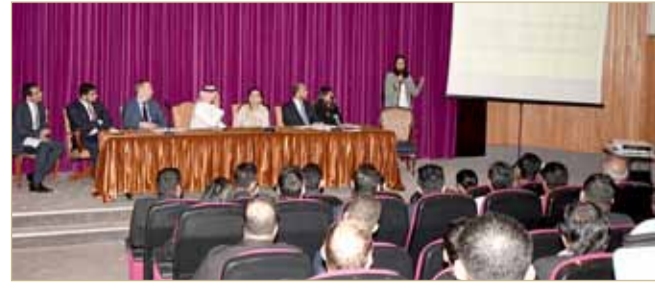
جانب من ورشة العمل

نظمت وزارة المالية ورشة عمل حول المقومات الأساسية لقيمة المضافة، حضرها أكثر من 80 شخصاً يمثلون الشركات العاملة في مجال المحاسبة والتدقيق. وتضمنت الورشة عرضاً مفصلاً لكافة الجوانب التنظيمية والإجرائية المتعلقة بضرورة القيمة المضافة، بما في ذلك آليات استيفاء طلبات التسجيل الضريبي، وتقديم الإقرارات والتقارير الضريبية مدعومة بالوثائق