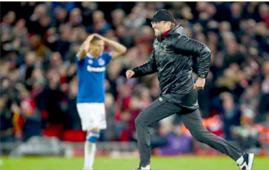
لحظة احتفال كلوب بالهدف

نفى ماركو سيلفا، المدير الفني لنادي إيفرتون، ما تحدث به نظيره في ليفربول، يورجن كلوب، بشأن اعتذاره له بعد ركضه في ملعب المباراة، عقب تسجيل الريدز، هدف الفوز في الوقت القاتل من ديربي الميرسيسايد.