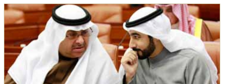
البنمحمد وال رحمة

وافق مجلس الشورى على طلب الحكومة بتأجيل مناقشة تقرير لجنة الشؤون الخارجية والدفاع والأمن الوطني بمجلس الشورى مشروع قانون بتعديل المادة (127) من قانون الإجراءات الجنائية. ويعطي المشروع النيابة العامة سلطة جواز