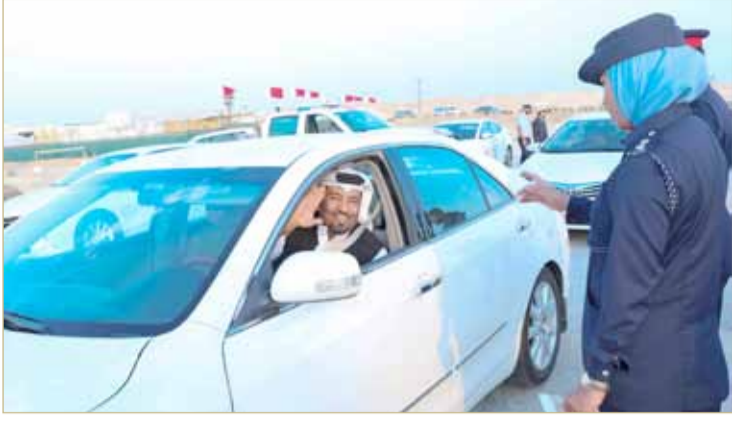
جانب من الحملة المرورية التي تنظمها المحافظة الجنوبية

تنظمها "الجنوبية" بالتعاون مع الجهات المعنية