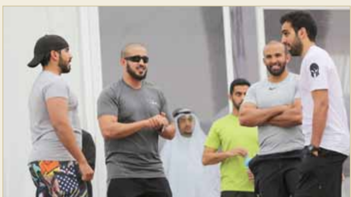
أقوى رجل بحريني

يتقدم المكتب الإعلامي لسمو الشيخ خالد بن حمد بن عيسى آل خليفة بالشكر والتقدير لجميع الجهات الحكومية والأهلية والشركات والمؤسسات الخاصة وجميع الجهات الإعلامية التي ساهمت في تنفيذ مختلف مبادرات خالد بن حمد آل خليفة لعام 2018.