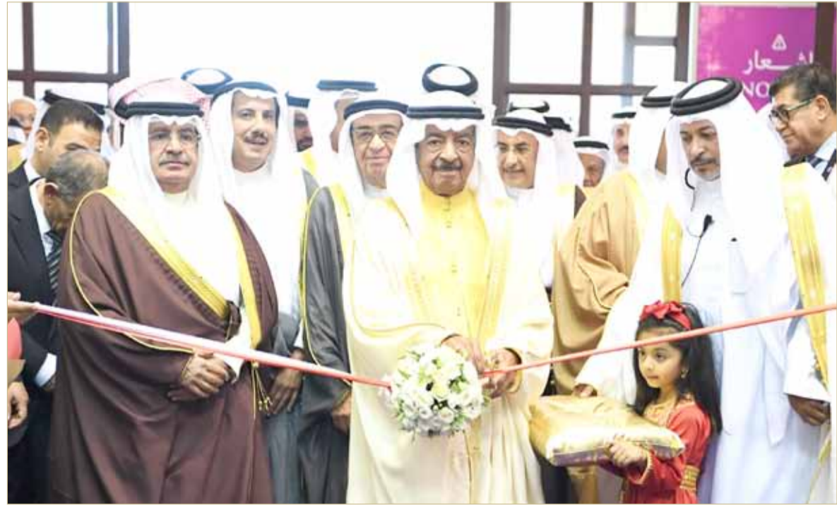
الحكومة برئاسة صاحب السمو الملكي الأمير خليفة بن سلمان آل خليفة نجحت بشكل متقدم في تنفيذ ما تعهدت به في برنامج عملها (أرشيفية)