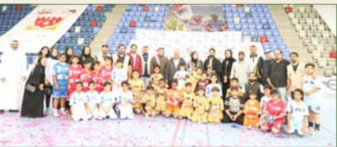
جانب من تكريم الفائزين

أشاد ممثل جلالة الملك للأعمال الخيرية وشؤون الشباب رئيس مجلس أمناء المؤسسة الخيرية الملكية رئيس المجلس الأعلى للشباب والرياضة رئيس اللجنة الأولمبية البحرينية سمو الشيخ ناصر بن حمد آل خليفة، بما حققته النسخة الأولى من بطولة "الذهب من أجل الخير" التي نظمتها المؤسسة الخيرية الملكية تحت رعاية سموه بمشاركة 13 فريقاً من الأبناء.