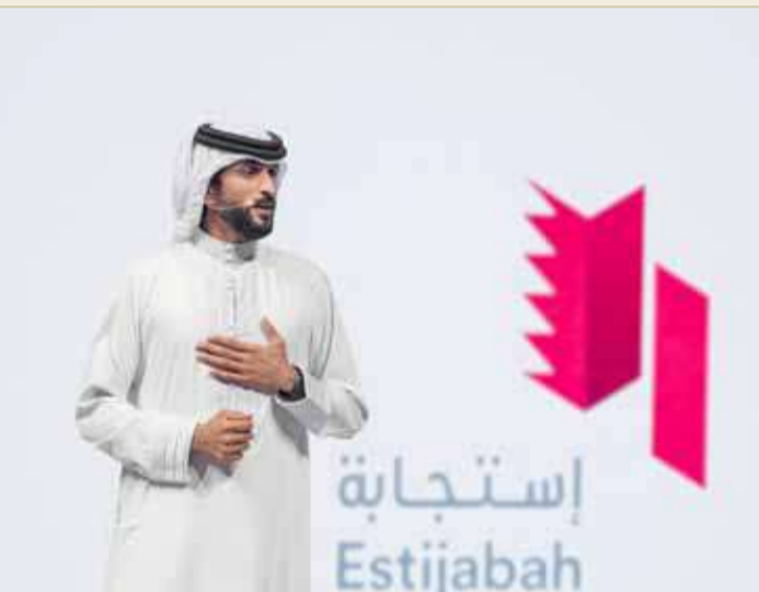
اطلاق برنامج استجابة