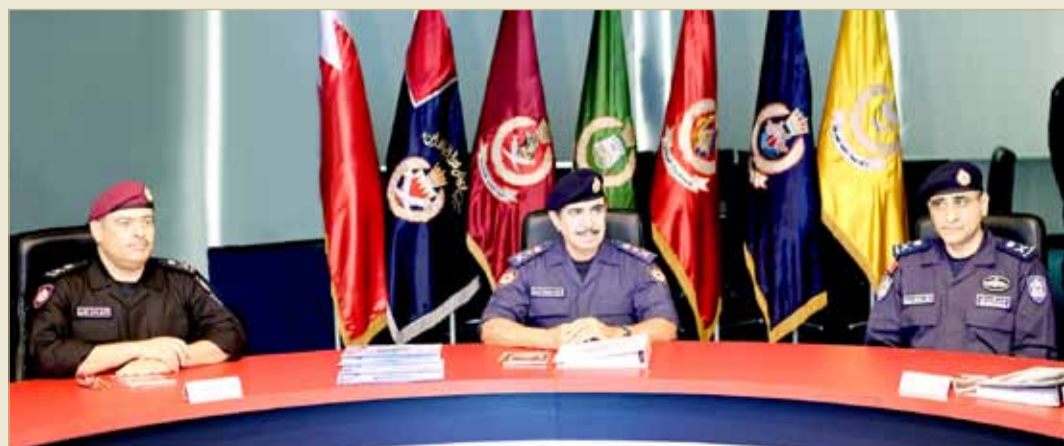
وزير الداخلية شهد ختام فعاليات التمرين البحري المشترك لقيادة خفر السواحل (الحارس اليقظ 7)

شهد وزير الداخلية الشيخ راشد بن عبدالله آل خليفة، صباح أمس، ختام فعاليات التمرين البحري المشترك لقيادة خفر السواحل (الحارس اليقظ 7) والذي شارك فيه عدد من إدارات وأجهزة وزارة الداخلية، بهدف الوقوف على مستويات الجاهزية، خصوصاً فيما يتعلق بالأمن البحري في مياه مملكة البحرين وسواحلها، والتي تشكل محوراً رئيسياً في منظومة العمل وأداء الواجبات لدى قيادة خفر السواحل.