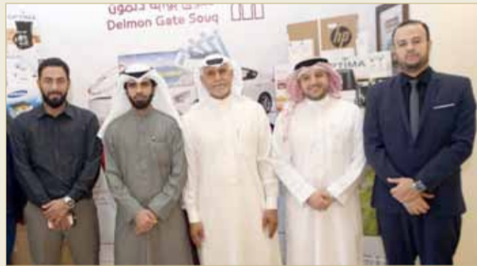
الحملة الترويجية تستمر لمدة 60 يوماً

♦ تكريماً للزبائن والمتسوقين بجميع محلات السوق