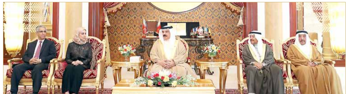
جلالة الملك مستقبلاً رئيسي مجلسي الشورى والنواب

العاهل: المواطن سيبقى دائماً موضع اهتمام وتقدير