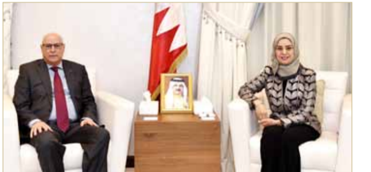
مجلس الشؤون المحلية

استقبلت رئيسة مجلس النواب فوزية زينل سفير المملكة المغربية الشقيقة لدى مملكة البحرين رشيد خطابي، وسفير المملكة الأردنية الهاشمية الشقيقة لدى مملكة البحرين رامي صالح العدوان كل على حدة.