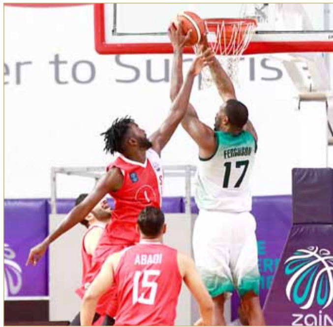
من لقاء البحرين وسترة

مباراة الرفاع والأهلي في الساعة 7:45 مساءً، وتقام المباراتان على صالة اتحاد السلة.