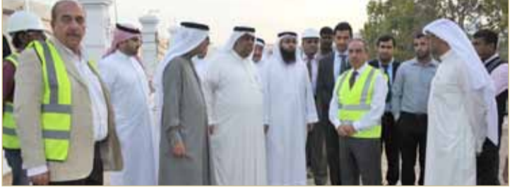
وزير الأشغال في جولة تفقدية لحديقة المحرق الكبرى

قام وزير الأشغال وشؤون البلديات والتخطيط العمراني عصام خلف بجولة تفقدية إلى حديقة المحرق الكبرى، موضحاً أن 50% من أعمال المرحلة الأولى لتطوير حديقة المحرق الكبرى قد انتهت ومن المؤمل الانتهاء من أعمال المرحلة الأولى بالكامل مع نهاية فبراير المقبل لتبدأ على الفور أعمال المرحلة الثانية.