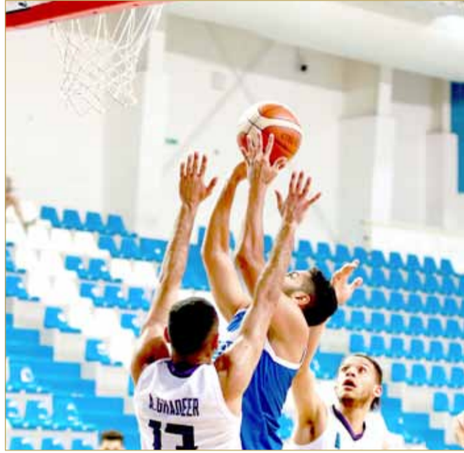
من لقاء الاتحاد ومدينة عيسى

خرج فريق سطرة بنتيجة الفوز على حساب البحرين بنتيجة (86/77)، في المباراة التي جمعتهم مساء أمس (الأحد)، على صالة اتحاد السلة بأهـم الحصم، في افتتاح منافسات الجولة الحادية عشر من الدور التمهيدي لدوري زين الدرجة الأولى.