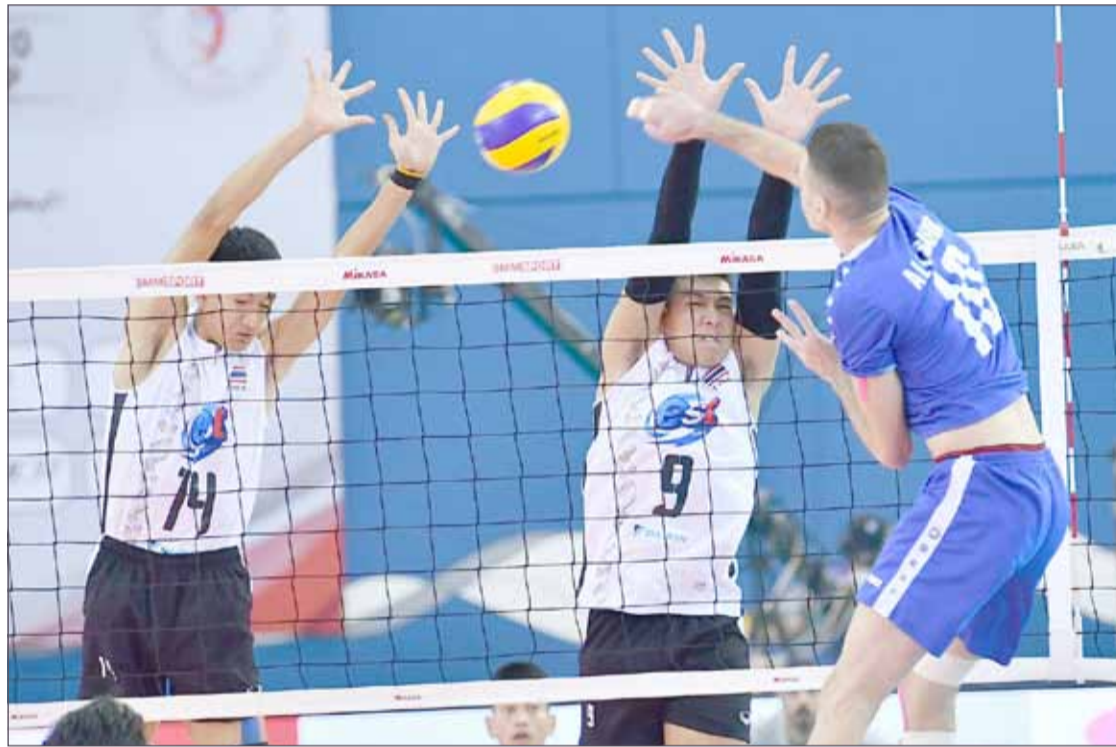
البطولات العالمية والقارية تتطلب أعدادًا كبيرة من الحكام

وعما إذا كانت هناك احتجاجات من قبل الأندية على بعض الحكام، قال "في كل موسم بعض الأندية توجه انتقاداتها لبعض الحكام وترفض إدارتهم لمبارياتها لكننا لا نتصاع لرغبتهم فنحن من يختار الحكم المناسب للمباراة المناسبة ولا ينبغي أن تفرض علينا الأندية توجهاتها ونرفض أن يكون الحكام شماعة لخسارة أي ناد.."