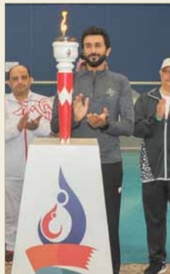
شعلة الأولمبياد المدرسي