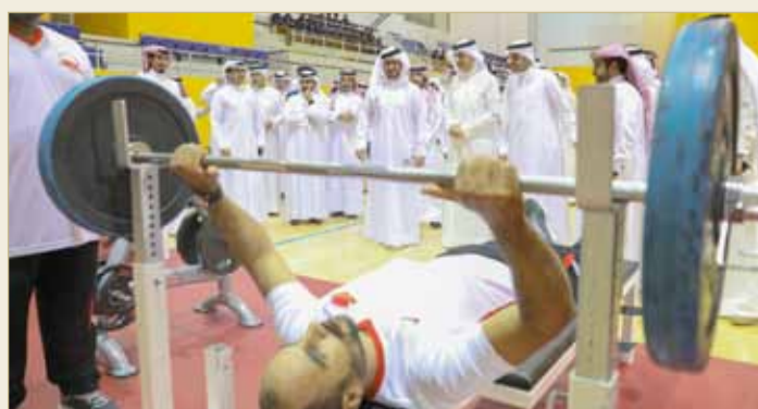
أبطال بلا حدود

وواصل سمو الشيخ خالد بن حمد آل خليفة دعم المراكز الشبابية والأندية الوطنية من