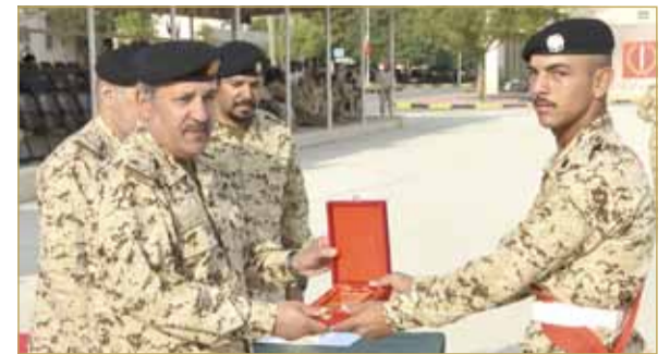
الرفاع - قوة الدفاع

أقيم بقوة دفاع البحرين أمس حفل تخريج دورة للأفراد المستجدين رقم 121، بمركز تدريب قوة الدفاع الملكي، بحضور مساعد رئيس هيئة