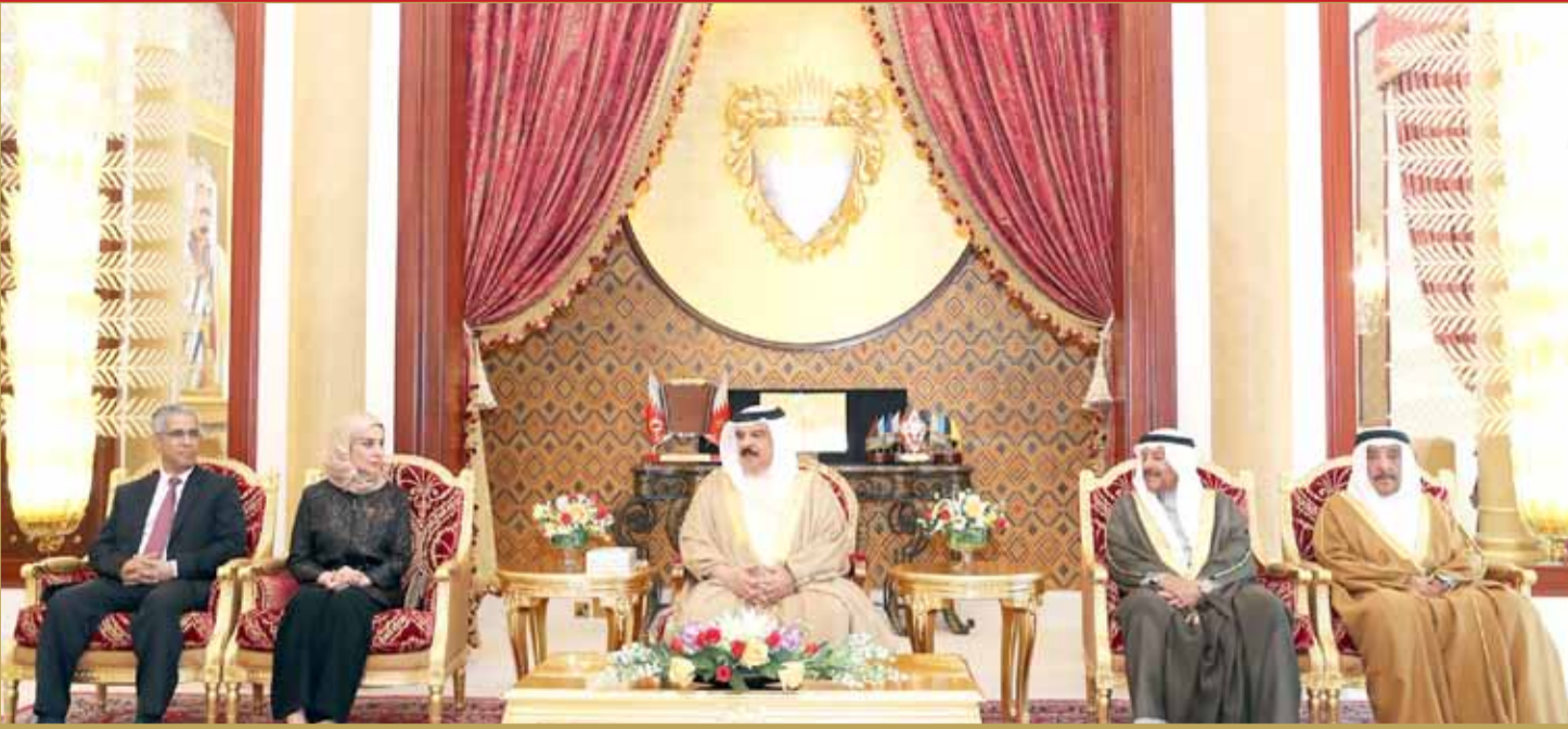
جلالة الملك مستقبلاً رئيسي مجلسي الشورى والنواب

تلقى عاهل البلاد صاحب الجلالة الملك حمد بن عيسى آل خليفة وولي العهد نائب القائد الأعلى النائب الأول لرئيس مجلس الوزراء صاحب السمو الملكي الأمير سلمان بن حمد آل خليفة، برقيتي شكر جوازية من رئيس الجمهورية الجزائرية الديمقراطية الشعبية الشقيقة الرئيس عبد العزيز بوتفليقة، رداً على برقيتي التهنية له بمناسبة ذكرى ثورة الأول من نوفمبر المجيدة، أعرب فيها عن خالص شكره وتقديره لهما على المشاعر الأخوية الصادقة، متمنياً لهما وافر الصحة والسعادة ولشعب مملكة البحرين دوام التقدم والازدهار.