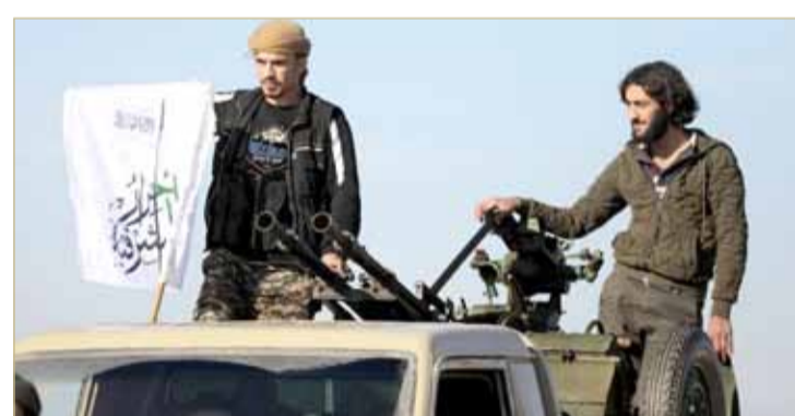
مقاتلون سوريون مدعومون من تركيا في منبج

شهدت مدينة منبج عمليات انتقال للسيطرة من طرف لآخر أكثر من معظم الأماكن خلال الحرب الأهلية في سوريا. ومع استبعاد القوات الأميركية للرحيل بعد قرار الرئيس دونالد ترامب بسحبها يخشى السكان من اندفاع أطراف أخرى لملء الفراغ مما يسبب مزيدا من الاضطرابات. ففي حين نشر الجيش السوري قواته على مقربة تهدد تركيا بشن هجوم على المدينة.