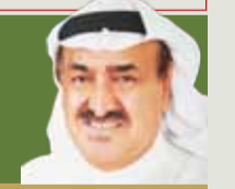
بقلم: جعفر الخراز