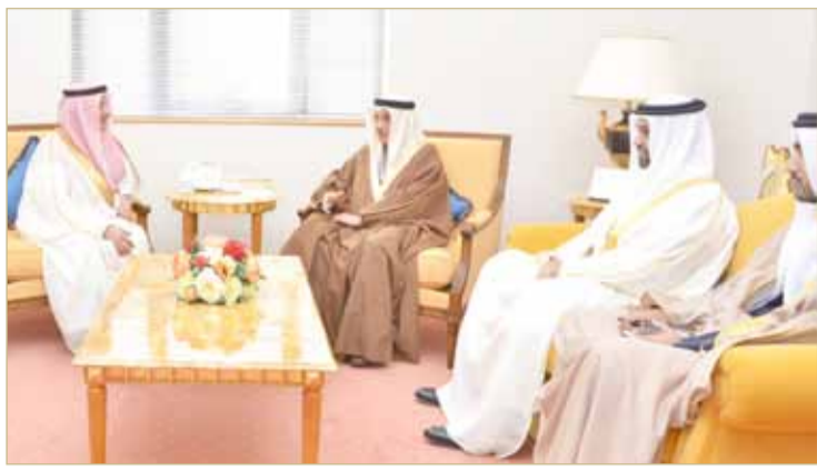
الشيخ خالد بن عبدالله مستقبلاً المدير العام رئيس مجلس إدارة صندوق النقد العربي بحضور وزير المالية والاقتصاد

♦ خالد بن عبد الله يستعرض التعاون مع "النقد العربي"