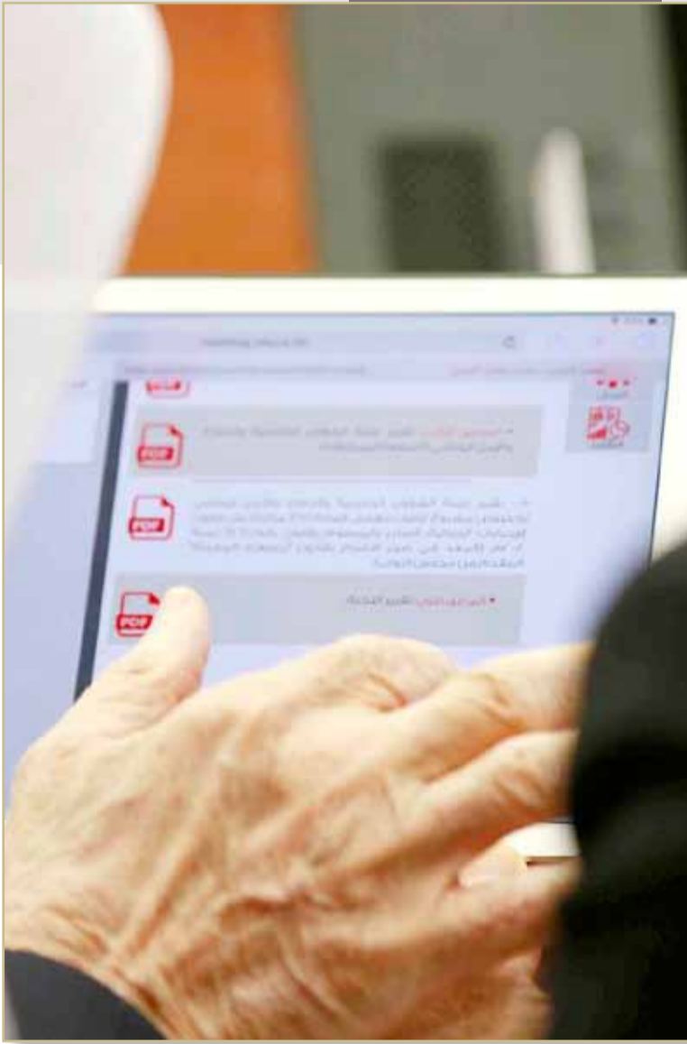
الشوريون في طور التأقلم مع النظام الإلكتروني الجديد

وتساءل عن حالة هروب المختلس إلى خارج البحرين عند اختلاس أموال كبيرة ولا نستطيع استرداد تلك الأموال. وأشاد بدور مكافحة الفساد في وزارة الداخلية في التقدم التقني.