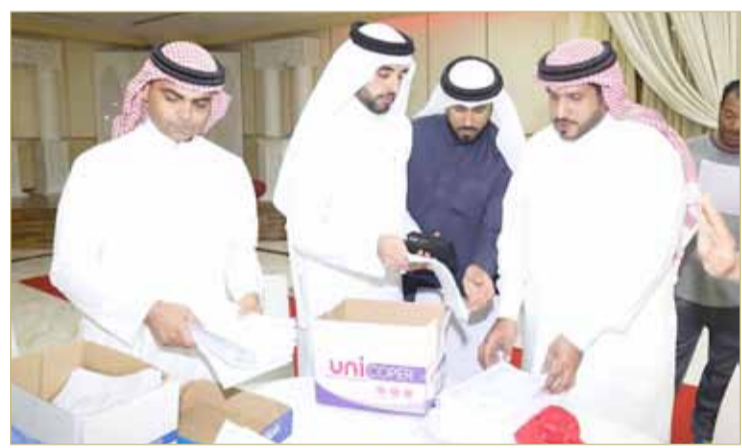
السواد متوسطاً عدداً من الأهالي

الطلاب كثيرة وتمتد فترة الانتظار لأكثر من 17 سنة. أما بشأن العاطلين، فأوضح السواد أن أعداد الخريجين الجامعيين العاطلين عن العمل في تزايد، وهذا يتطلب جهوداً كبيرة من المسؤولين في الجهات الرسمية في إيجاد وظائف مناسبة لمؤهلاتهم الأكاديمية.