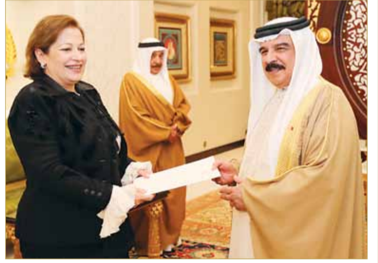
جلالة الملك يتسلم رسالة خطية من الرئيس مصري

تسلم عاهل البلاد صاحب الجلالة الملك حمد بن عيسى آل خليفة رسالة خطية من أخيه رئيس جمهورية مصر العربية الشقيقة عبد الفتاح السيسي، تتضمن دعوة جلالته للحضور والمشاركة في حفل افتتاح مسجد (الفتاح العليم) وكاتدرائية (ميلاد المسيح) والذي سيقام خلال شهر يناير المقبل.