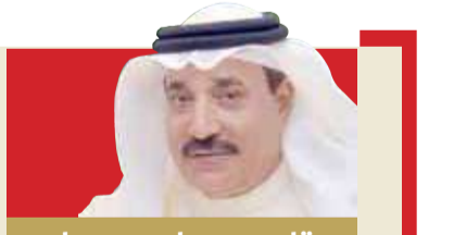
بقلم: جميل حميدان

« وأكد المسؤولون بالمركز رجوع التيار الكهربائي في تمام الساعة 2:53 مساءً. ومن جانب آخر تلا ذلك عطل في نظام الملفات الإلكتروني بسبب انقطاع الكهرباء، إلا أن ذلك لم يمنع استمرار المركز في تقديم الخدمات الصحية في الفترة المسائية.