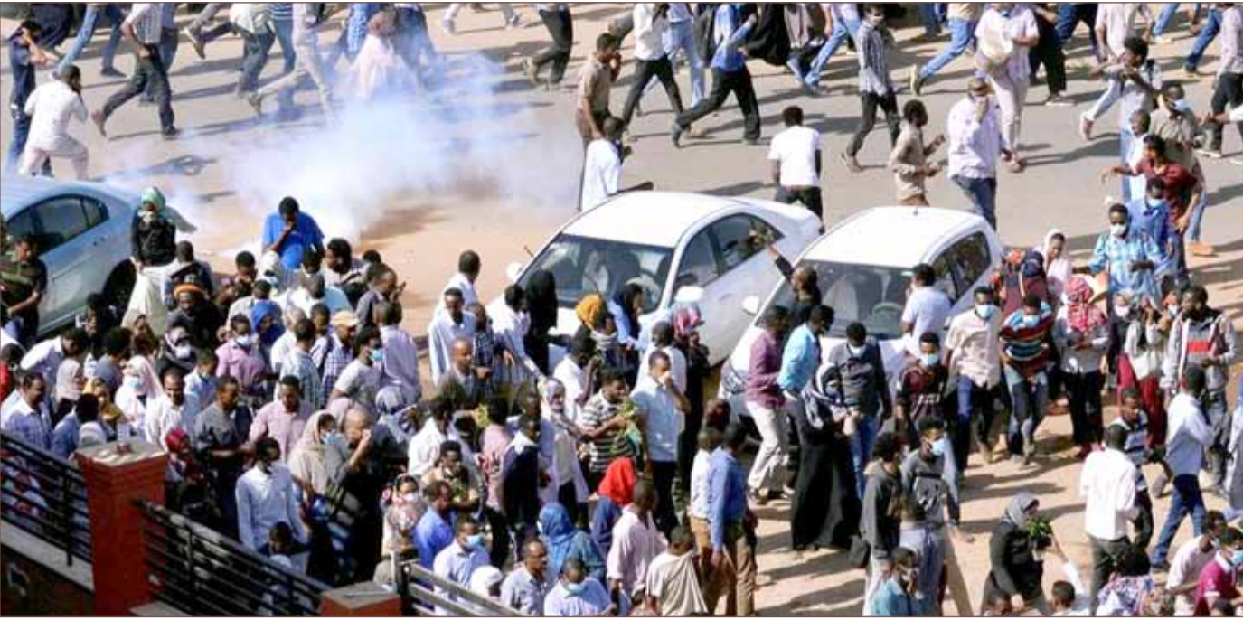
من مظاهرات السودان

ونقلت وكالة تاس للأخبار عن وزير الخارجية الروسي سيرجي لافروف قوله إن الأمر يرجع لواشنطن في مسألة عقد « كما بعث رسائل تهنئة إلى زعماء آخرين منهم رئيسة الوزراء البريطانية تيريزا ماي ورئيس وزراء اليابان شينزو آبي والرئيس الصيني شي جين بينغ.