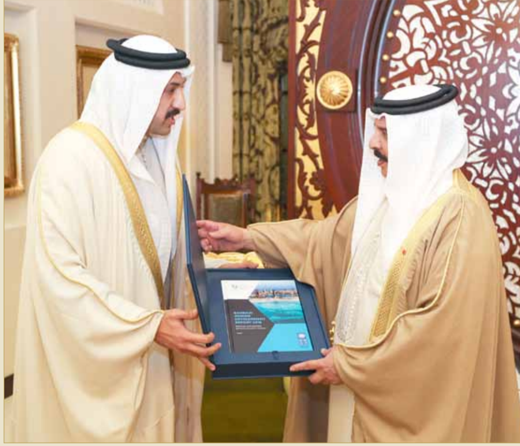
جلالة الملك مستقبلاً رئيس مجلس أمناء "دراسات" وكيل وزارة الخارجية للشؤون الدولية

◆ جلالة الملك: خيارنا الدائم سيظل الاستثمار في العنصر البشري