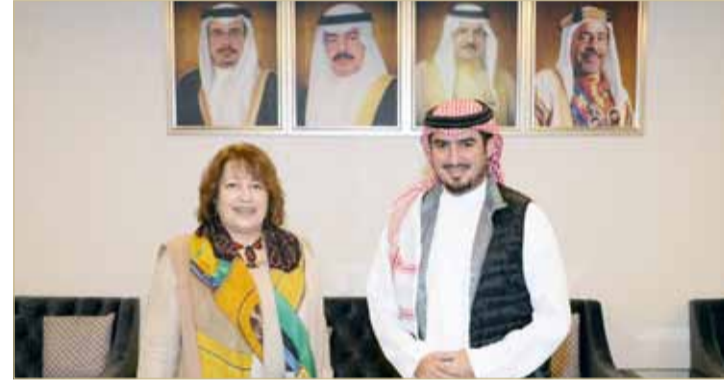
الرئيس التنفيذي لهيئة البحرين للسياحة والمعارض مستقبلاً السفيرة المصرية

استقبل الرئيس التنفيذي لهيئة البحرين للسياحة والمعارض الشيخ خالد بن حمود آل خليفة أمس السفيرة المصرية لدى مملكة البحرين سهى الفار.