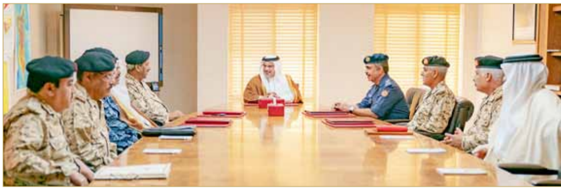
سمو ولي العهد في زيارة للقيادة العامة لقوة الدفاع

مستويات التنسيق والتعاون بين قوة دفاع البحرين ووزارة الداخلية وخطط وبرامج تطويرها وذلك لمواصلة تعزيز الأمن والاستقرار من أجل خير وازدهار الوطن.