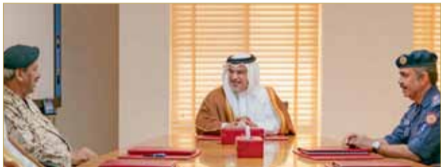
سمو ولي العهد في زيارة للقيادة العامة لقوة الدفاع