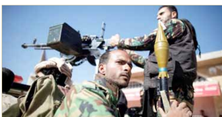
عناصر من ميليشيات الحوثي

قالت مصادر دبلوماسية إن باتريك كاميرت، رئيس فريق المراقبين الأممين في لجنة التنسيق المشتركة لمراقبة تنفيذ اتفاق ستوكهولم في الحديدة، أبلغ الجانب الحكومي اليمني "امتعاضه" مما أقدمت عليه ميليشيات الحوثي من عملية إحلال عناصر تابعة لها محل عناصر أخرى في ميناء الحديدة، في خطوة أحادية غير متفق عليها والادعاء بأنها قامت بعملية إعادة الانتشار.