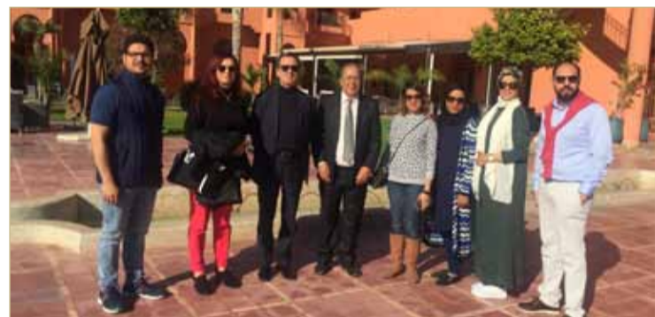
الإعلاميون البحرينيون في الدار البيضاء

نظمت طيران الخليج، مؤخرًا رحلة تعريفية لعدد من ممثلي الإعلام البحريني لتجربة طائرتها الجديدة من طراز بوينغ 787-9 دريملاينز التي حلقت بهم إلى أحدث وجهات شبكتها، الدار البيضاء بالمغرب.