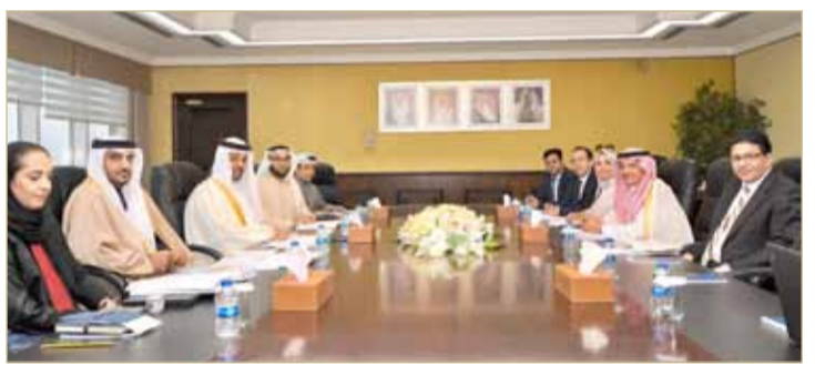
وزير المالية والاقتصاد يلتقي المدير العام رئيس صندوق النقد العربي

♦ وزير المالية: تنفيذ المبادرات وفقا لمؤشرات قياس الأداء