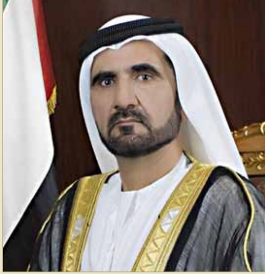
سمو الشيخ محمد بن راشد

الإمارات وجهة مرموقة للتنمية المستدامة ومحط أنظار العالم