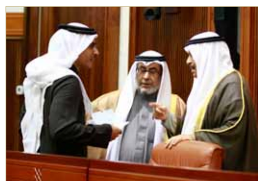
الرئيس الصالح والوزير البوعينين وأمين عام المجلس العصفور

بعد نقاش أعضاء مجلس الشورى لتعديل مادة في مشروع من قانون العقوبات حول رد السارق ما تم اختلاسه في جريمة الاختلاس في القطاع الأهلي لحوالي نصف ساعة، طلب وزير مجلسي الشورى والنواب غانم البوعينين بأن يتم تأجيل مشروع القانون "بالغلط" مبرراً بأن مرنيات الحكومة تريد أن يتم النظر فيه لمدة أطول، حيث وافق أعضاء مجلس الشورى على تأجيله بينما لم يتدخل أحد لعدم وجود تلك المرنيات بخصوص هذا المشروع في أجندة مرنيات المشروع، والذي استدعى رئيس مجلس الشورى بأن يعلن في مداخلته بوجود لبس حول تعديل مشروع القانون لآخر مما استدعى طلب التأجيل فيه، ومن ثم تم إعادة فتح باب النقاش على إعادة تقرير لجنة الشؤون الخارجية والدفاع والأمن الوطني بتعديل المادة (424) من قانون العقوبات إلى اللجنة للمزيد من الدراسة.