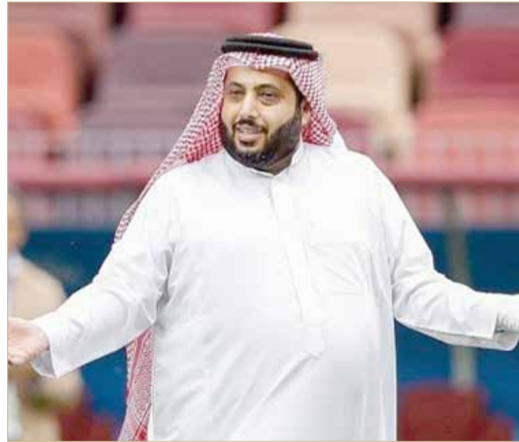
تركي آل الشيخ

فيما أوضح الشيخ علي بن خليفة آل خليفة، رئيس الاتحاد البحريني لكرة القدم، في وقت سابق، أن اجتماعًا تمتمًا جمع وفدًا من الاتحاد الآسيوي مع نظيره البحريني بخصوص مشاركة المحرق في منافسات الدوري السعودي