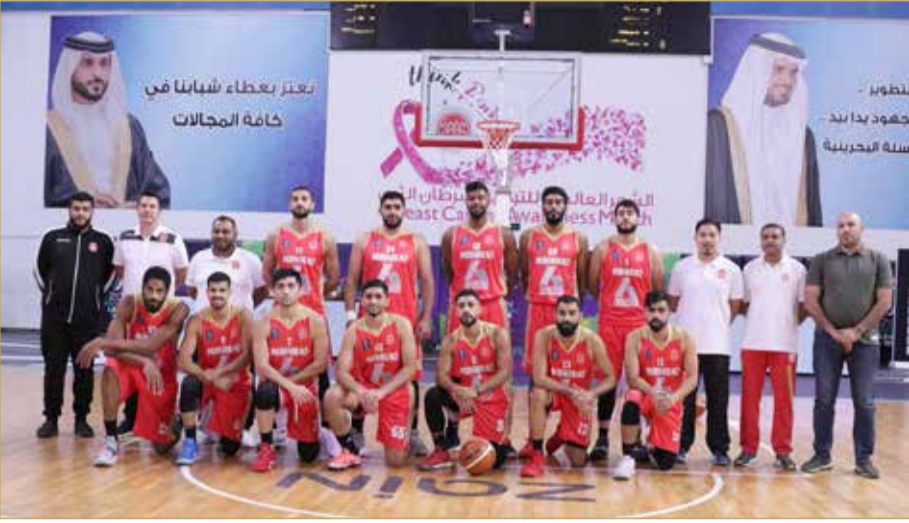
فريق المحرق لكرة السلة

تفتتح مساء اليوم (الأحد)، منافسات الجولة الثانية لحساب الدور السداسي لدوري زين الدرجة الأولى لكرة السلة، بإقامة لقائين، إذ يلتقي في المباراة الأولى المحرق والنجمة في الساعة السادسة مساءً، وتليها مباشرة مباراة النجمة والاتحاد في الساعة 7:45 مساءً، وتقام المباراتان على صالة اتحاد اللعبة بأم الحصم.