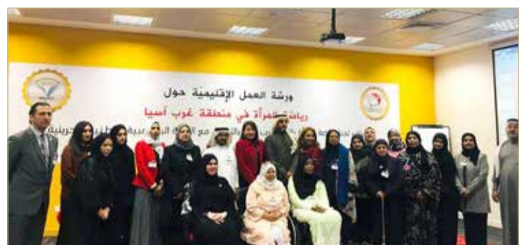
جانب من ورشة العمل الإقليمية