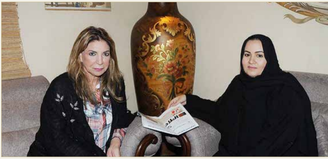
البنغديري أثناء لقائنا مع "البلاد"