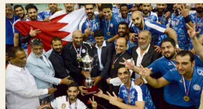
النجمة بطل بطولة الأندية الآسيوية

هو الأول من نوعه للعبة، خسارة كبيرة تستوجب إعادة النظر في مشاركته ودعمه ماليا لتمثيل الوطن. وكان نادي المحرق قد اعتذر رسمياً عن في بطولة الأندية العربية الـ 37 التي ستقام بتونس خلال شهر فبراير المقبل؛ بسبب عدم توفر الدعم المالي من قبل الوزارة، وقد يلحقه الأهلي الذي علم "البلاد سيوت" أنه يتجه نحو الاعتذار بنسبة كبيرة لذات السبب رغم أنه بطل كأس سمو ولي العهد في الموسم الماضي.