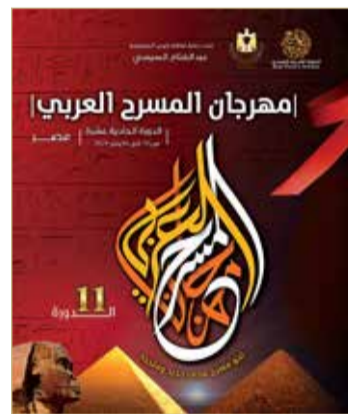
مهرجان المسرح العربي

ويخصصون فصولاً إضافية في ما يسمى بالمختبر المسرحي الذي يجتمع فيه طلاب الأقسام؛ لتبادل الخبرات والتواصل؛ من أجل الإلمام بتفاصيل المنظومة الفنية.