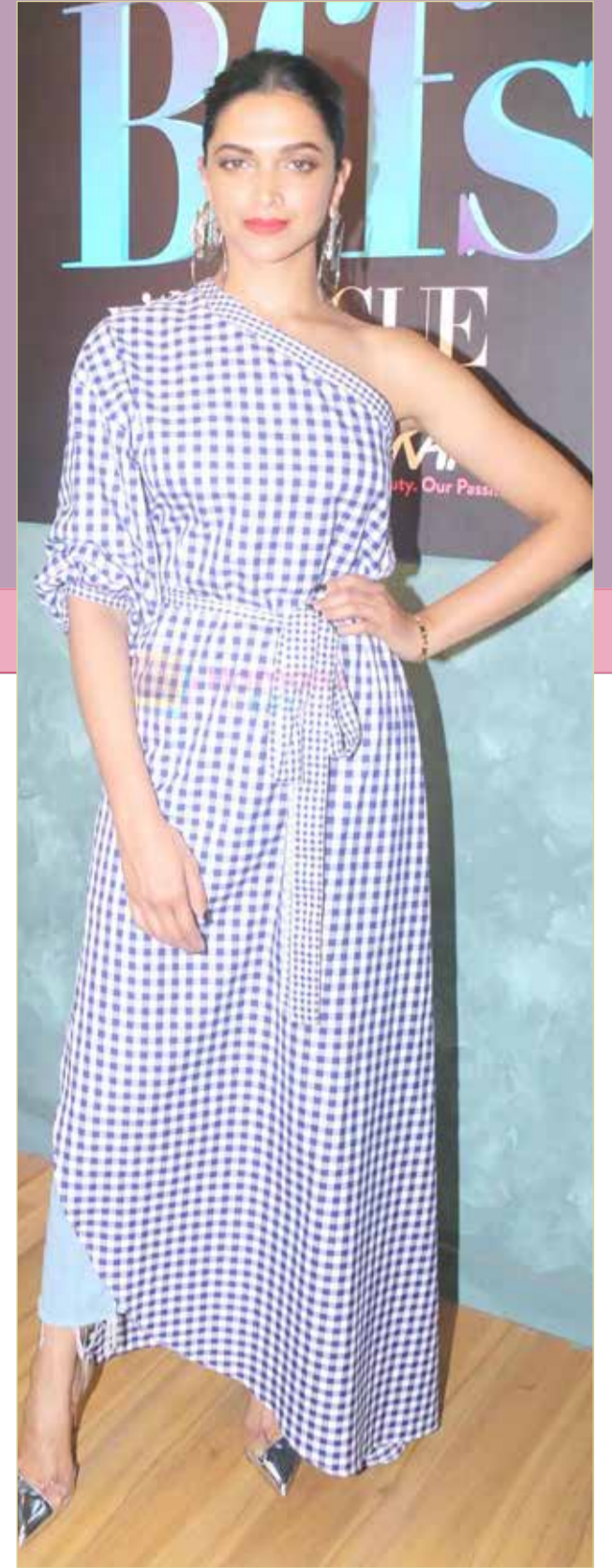
« العام الماضي كان بالتأكيد عاماً لا ينسى بالنسبة للنجمة الهندية ديبিকা بادوكون، إذ شهد تحقيق فيلمها "Padmaavat" نجاحاً ساحقاً في شباك التذاكر، كما شهد أيضاً زواجها من صديقها منذ سنوات والنجم الهندي الشهير رانفير سينغن، لكن أبرزها هو موقعها المميز في قائمة فوربس لأكثر مشاهير الهند ثراءً للعام 2018.