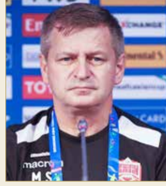
مدرب منتخبنا سكوب