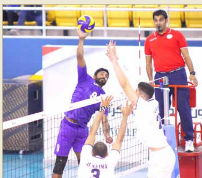
هل يكرر النجمة فوزه على داركليب؟