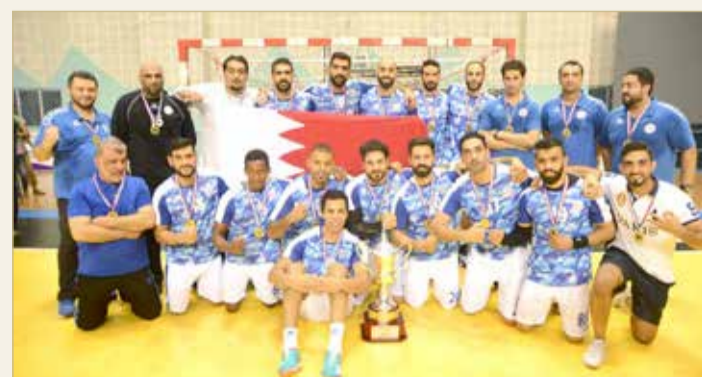
هل يحرم النجمة حامل اللقب من تمثيل المملكة في بطولة الأندية الآسيوية؟

بعد اعتذار المحرق عن العربية بسبب غياب الدعم