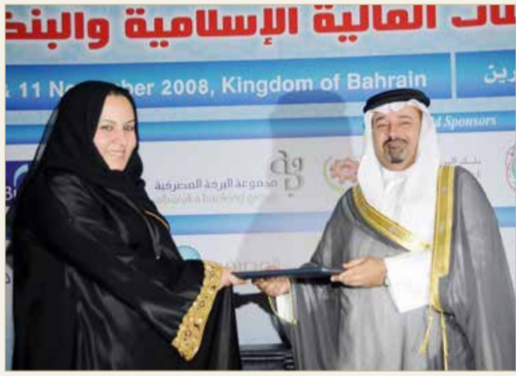
تكرمها من قبل وزير المالية السابق

أول "مدققة شرعية" على مستوى البحرين والخليج