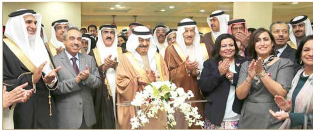
صحيفة "الفجر" ومواقع مصرية: سموه اكتسب احتراماً وتقديراً دولياً ربيعاً (أرشيفية)

نشرت صحيفة "الفجر" وعدد من المواقع الاخبارية المصرية تقريراً بعنوان "رئيس وزراء البحرين يعزز اقتصاد بلاده عبر تطوير تنويع القطاعات"، تطرقت فيه إلى الرؤية التي تتبناها الحكومة برئاسة رئيس الوزراء صاحب السمو الملكي الأمير خليفة بن سلمان آل خليفة من أجل تحقيق التوازن المالي. وبين التقرير أن سموه يحظى بتقدير عالمي، إذ اكتسب احتراماً وتقديراً ربيعاً على المستوى الدولي من منظمات الأمم المتحدة والمنظمات الدولية؛ باعتباره شخصية تنموية من الطراز الأول ساهمت بجهود كبيرة في وضع البحرين على الخريطة العالمية مؤثلاً للتنمية المستدامة. (03)