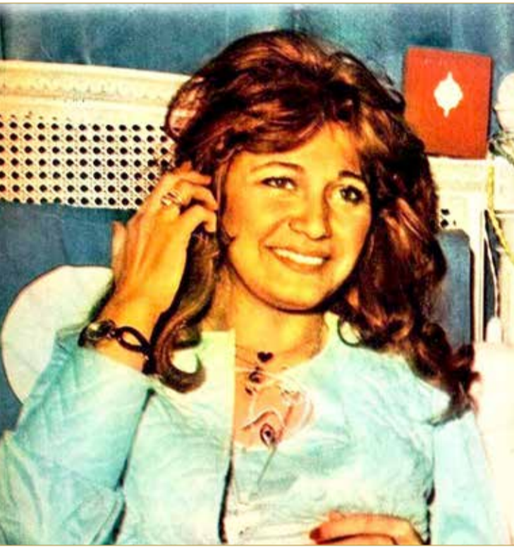
الفنانة الراحلة مديحة كامل في أوج شهرتها

رحلت الفنانة مديحة كامل، في 13 يناير من العام 1997 بعد اعتزالها الفن بـ 4 أعوام، إذ اعتزلت العام 1993 بعد أن قدمت آخر أفلامها (بوابة إبليس). وفي هذا التقرير نلقي الضوء على أهم محطاتها الفنية. اكتشفها الفنان سمير غانم وقدمها لأول مرة في فيلم "30 يوماً في السجن". وارتبطت بالإسكندرية حيث كان مولدها في حي كامب شيزار.