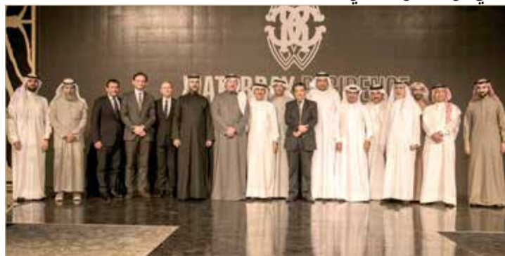
عقب إبرام الشراكة

أعلنت شركة بن فقيه للاستثمار العقاري، رسمياً عن شراكتها مع دار الأزياء الإيطالية الفاخرة والشهيرة روبيرتو كفالي، والتي ستكفل بتنفيذ التصاميم الداخلية للبرج الشرقي من مشروع واترباي.