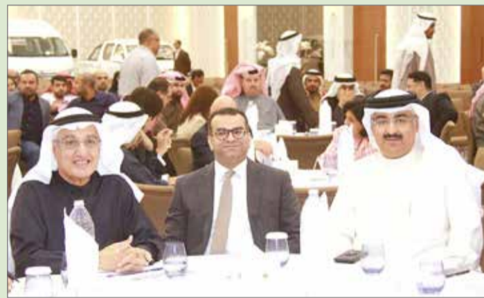
جانب من الحضور في المنتدى

أمل الحامد من المنامة | (تصوير: رسول الجبري)