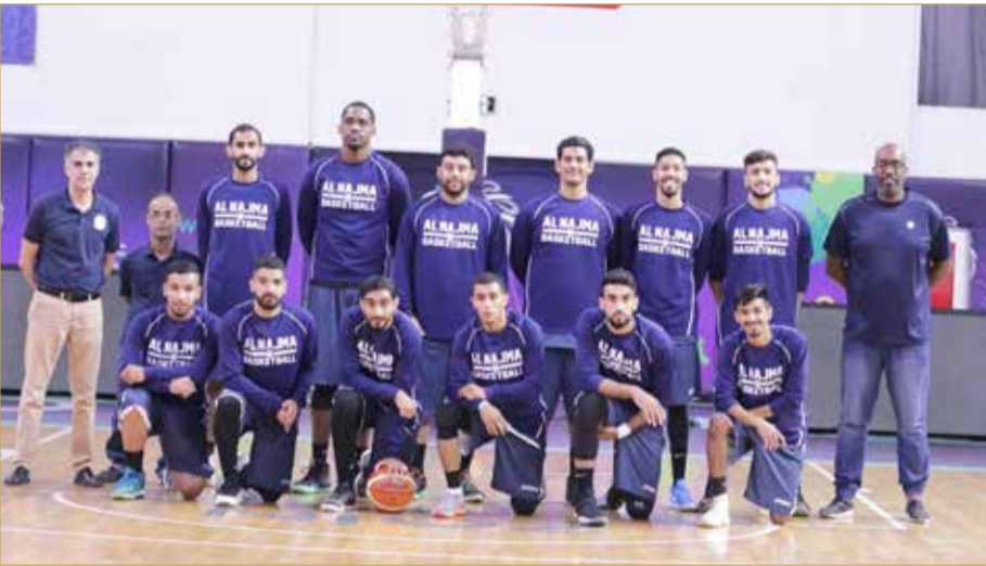
فريق النجمة لكرة السلة

وتختتم يوم غد الإثنين منافسات الجولة بلقاء واحد سيجمع الأهلي والرفاع في الساعة 7:45 مساءً.