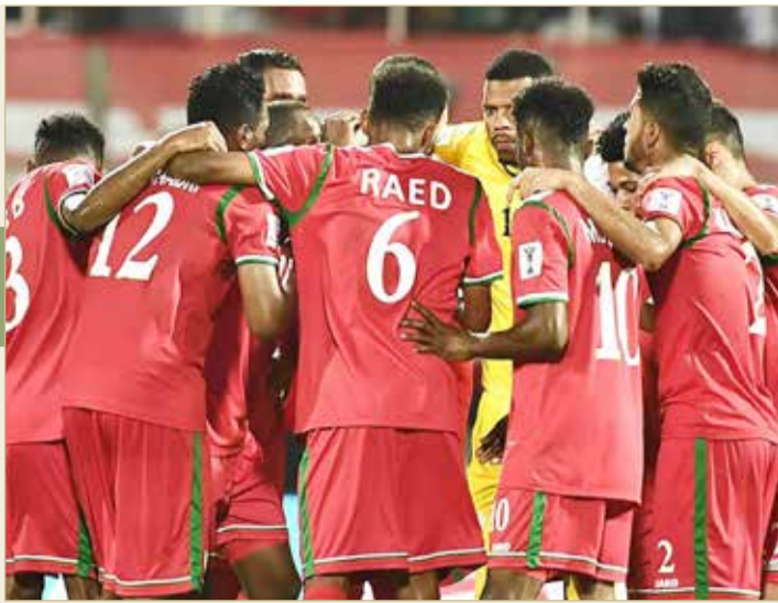
الأولى التي بدأ منافساتها بالخسارة 1-0 والتعادل مع البلد المضيف أمام الهند 1-4 قبل الفوز على البحرين (الإمارات) 1-1.