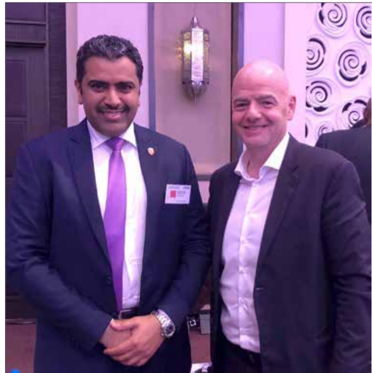
إبراهيم اليعينين مع جياني إنفانتينو

بطولة كأس العالم للأندية عبر زيادة عدد الفرق المشاركة فيها إلى 32 فريقاً. كما شهدت القمة استعراض محاور تطوير كرة القدم النسائية، بالإضافة إلى تقنية «الفيديو» للتحكيم.