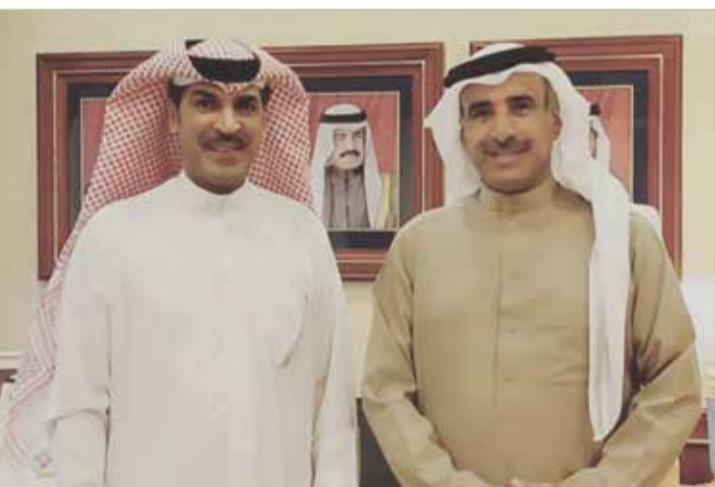
وزير الإسكان في لقاء مع النائب يوسف الذواقي

البحريني حتى ينعم بالسكن الملائم له. وفي ضوء ذلك، أعرب النائب يوسف الذواقي عن شكره لوزارة الإسكان لجهودهم الجبارة والحثيثة البينة في توفير السكن الملائم والاستقرار للمواطن وخص بالشكر وزير الإسكان باسم الحر على جهوده الملحوظة في خدمة المواطنين.