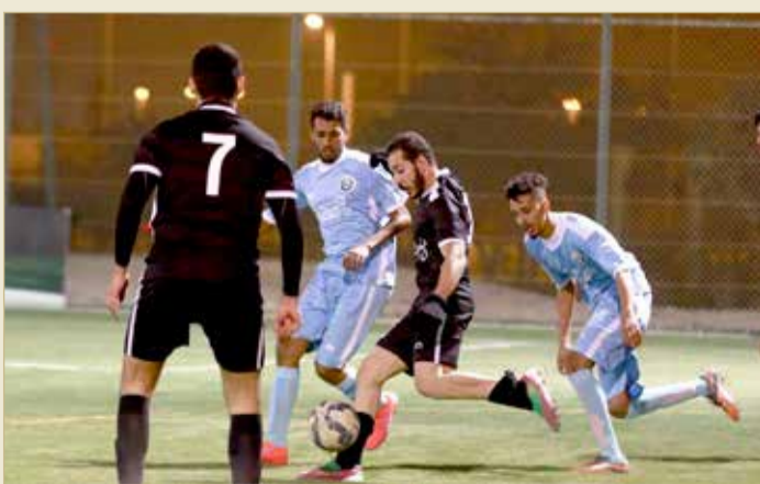
جانب من منافسات كرة القدم

ونجح لاعبو الجامعة العربية في استثمار أفضليتهم وحققوا الفارق مع نهاية الشوط الأول، وفي الشوط الثاني واصل الفريق أفضليته على رغم بعض المحاولات الفردية من لاعبي البحرين