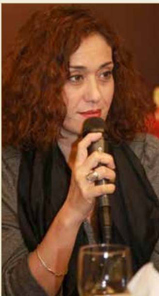
الفنانة لبنى نعمان من العرض التونسي