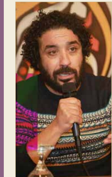
مخرج العرض التونسي وحيد العجمي