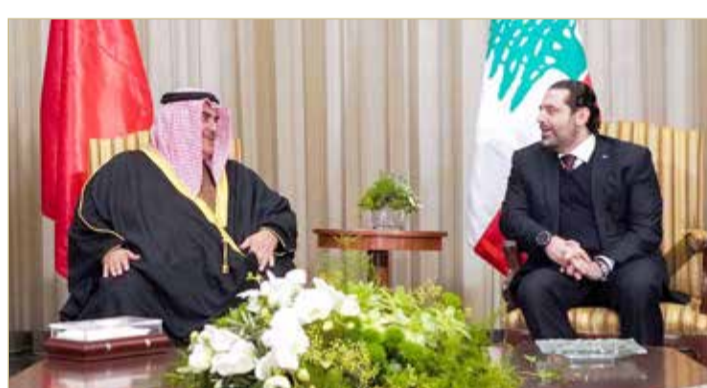
رئيس وزراء لبنان في مقدمة مستقبلي وزير الخارجية

والمتقدم، وتطلعهم إلى نجاح أعمال القمة في التوصل إلى ما يعود بالنفع على العمل العربي المشترك. ومن جانبه، أعرب رئيس وزراء الجمهورية اللبنانية لوزير الخارجية عن خالص تحياته لصاحب الجلالة الملك، ولصاحب السمو الملكي رئيس الوزراء، ولصاحب السمو الملكي ولي العهد نائب القائد الأعلى للبحرين، وولي العهد، نائب القائد الأعلى للبحرين، ورئيس مجلس الوزراء صاحب السمو الملكي الأمير سلمان بن حمد آل خليفة، وتمنياتهم للجمهورية اللبنانية رئيساً وحكومةً وشعباً بدوام الاستقرار