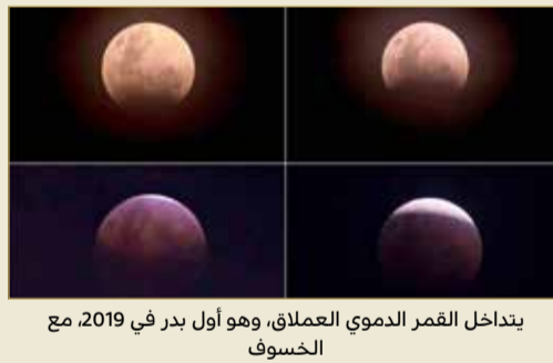
يتداخل القمر الدموي العملاق، وهو أول بدر في 2019، مع الخسوف

وإيرلندا وبريطانيا العظمى والنرويج والسويد والبرتغال والسواحل الفرنسية والإسبانية. أما بقية أوروبا، فضلاً عن أفريقيا، فستكون عندها رؤية جزئية قبل أن يصل القمر. وفي بعض الأماكن سيتم بث الظاهرة على الهواء مباشرة، بما في ذلك مرصد غريفيث في لوس أنجلوس.