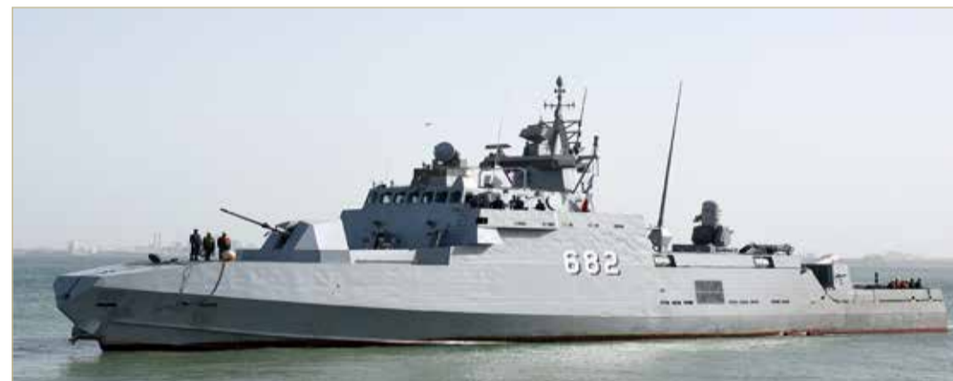
وصول مجموعة من السفن الحربية إلى البحرين