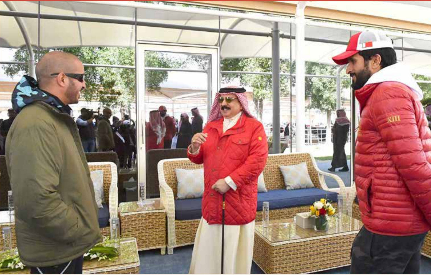
جلالة الملك يشهد منافسات سباق بطولة سمو الشيخ خالد بن حمد للقدرة بقرية البحرين الدولية للقدرة تحت رعاية سمو الشيخ ناصر بن حمد