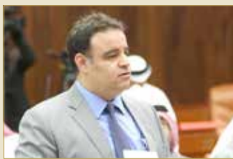
هشام العشري (رئيس اللجنة النيابية)