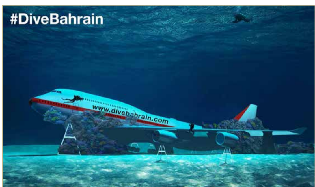
بضم طائرة بوينغ 747 ويوفر بيئة آمنة لنمو الشعاب المرجانية