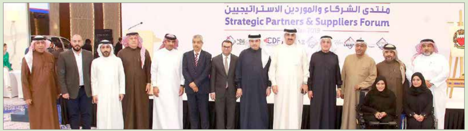
المشاركون في المنتدى