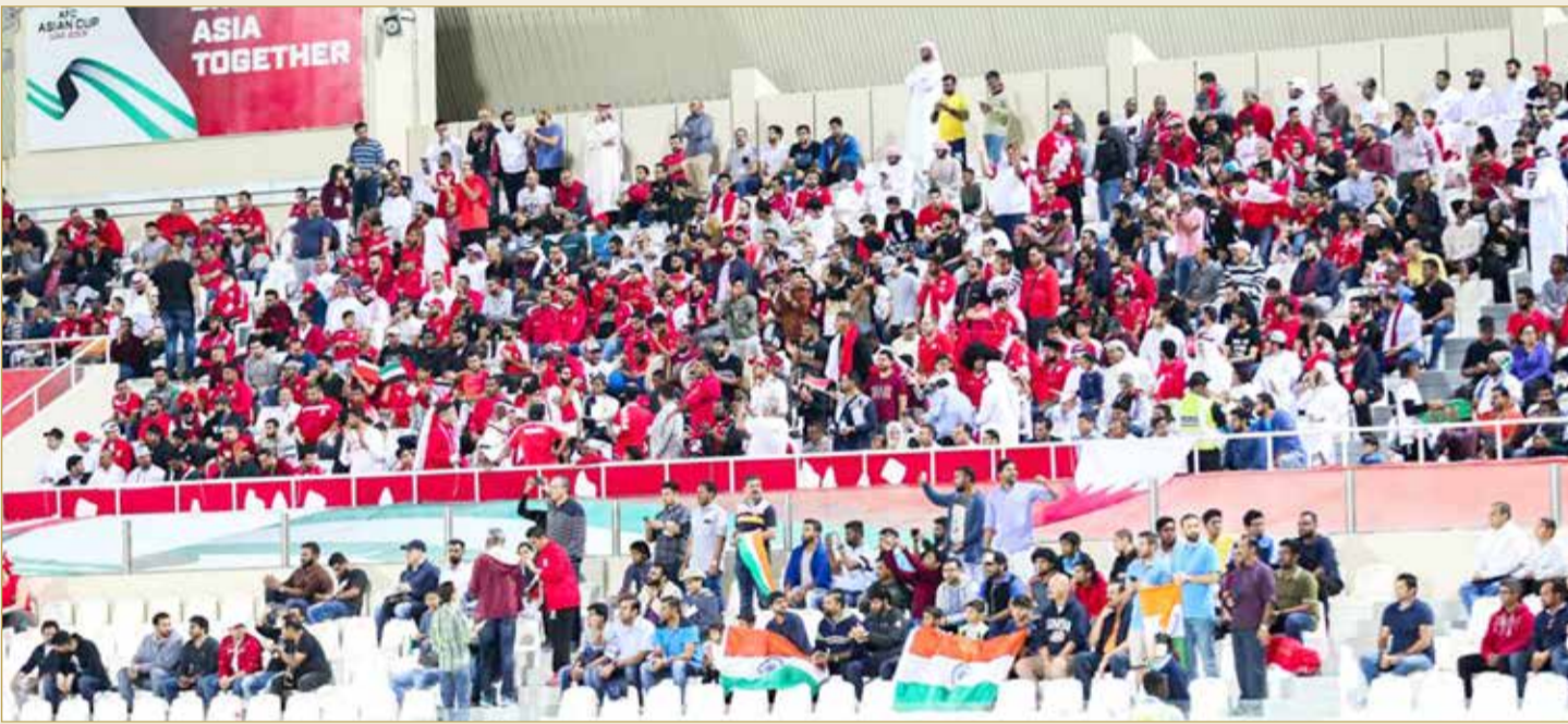
الجمهور البحرينية في كأس آسيا

نتيجة إيجابية أمام المنتخب الكوري الجنوبي. وقال إن المنتخب الكوري الجنوبي يتميز بالتكتيك العالي داخل أرضية الملعب. وأضاف "صحيح أن المنتخب الكوري الجنوبي لم يحقق الكثير على مستوى البطولات الآسيوية، إلا أنه في جميع المشاركات يكون رقما صعبا ومنافسا قويا لباقي المنتخبات". وتابع "الجميع شاهد التطور الكبير والتميز اللافت للمنتخب الكوري الجنوبي في الآونة الأخيرة، بيد أن ثقتنا عالية وكبيرة في لاعبي المنتخب للظهور بأفضل صورة خلال المباراة المقبلة، إذ نعلم جيدا قوة وكفاءة المنتخب المنافس". وبين أن "دورنا الجهاز الإداري هيئة اللاعبين على أفضل صورة، وتجهيزهم بالصورة المناسبة ذهنيا ونفسيا، مشيرا إلى أن عزيمة اللاعبين ستكون قوية نحو تحقيق الأفضل إن شاء الله".