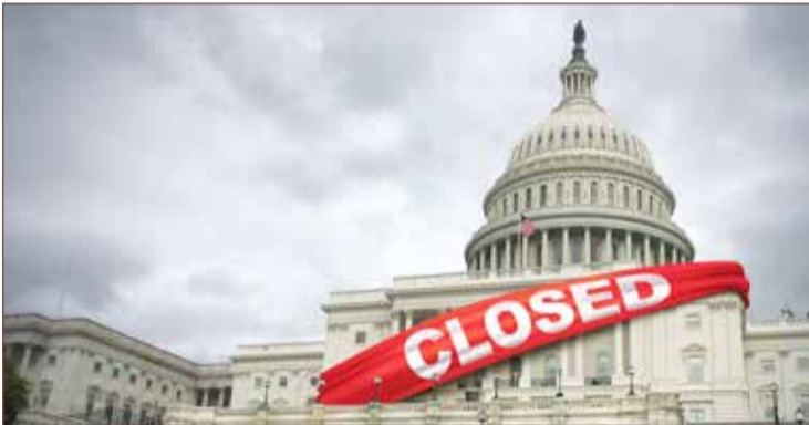
الحكومة الأميركية تستأنف عملياتها اليوم بعد إنهاء الإغلاق

نشرت الأسبوع الماضي، فإن الحكومة تدين للموظفين الاتحاديين بنحو 6 مليارات دولار من الرواتب المتأخرة.