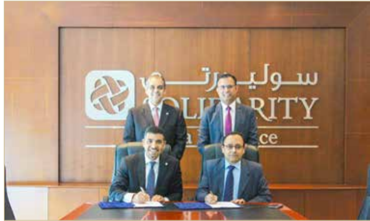
أثناء توقيع الاتفاقية

من تمييز نفسها في عالم الأعمال المعاصر (Business 4.0) وتحقيق أهدافها في النمو والتحول الرقمي. إن شراكتنا مع سوليدرتي البحرين