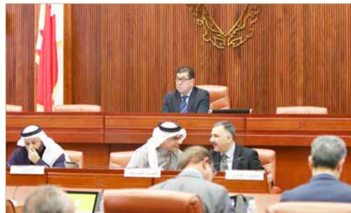
نراس جمال فخرى جلسة مجلس الشورى

جمشير: المؤسسات والهيئات لن تكون مستقلة بذاتها