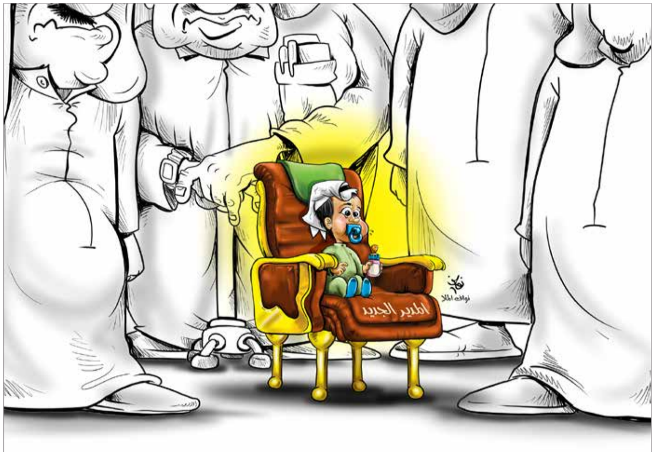
كاريكاتير فؤاد الملاح

« من جانب آخر قد يستغل بعض التجار والشركات فوضى فرض الضريبة المضافة ليرفعوا من أسعار سلعهم خصوصاً إذا لم تكن هناك مراقبة جادة وفاعلة من قبل وزارة التجارة والصناعة، لذا فإنه بمقارنة المستهلك أسعار السلع في أكثر من مكان سيتعرف على السعر الحقيقي للسلعة ويُجنّبه ذلك دفع سعر أعلى.