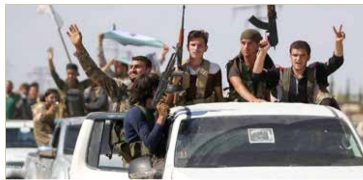
اتفاق إدلب لا يزال يشكل تحديا لروسيا وتركيا

استهدف هجوم جوي، يربح أنه بطائرات مسيرة، أمس الأحد، قاعدة حميميم الجوية، التي تعد أكبر قاعدة عسكرية روسية في سوريا، وذلك في أعقاب نحو شهرين على آخر استهداف طلال المنطقة.