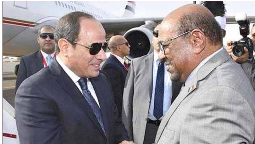
السيسي مستقبلا البشير في القاهرة

قال الرئيس السوداني عمر البشير أمس الأحد إن هناك محاولات لاستنساخ "الربيع العربي" في السودان؛ تعليقًا على الاحتجاجات التي تشهدها بلاده منذ الشهر الماضي ويشهدها البعض بالانتفاضات التي أطاحت بعدة زعماء عرب العام 2011. ويخرج طلاب ونشطاء وغيرهم في احتجاجات شبه يومية في مختلف أنحاء السودان منذ 19 ديسمبر، مطالبين بنهاية للمصاعب الاقتصادية في أطول تحد لحكم البشير المستمر منذ 3 عقود.