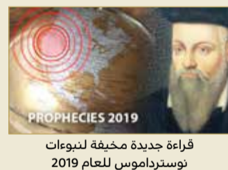
قراءة جديدة مخيفة لنبوءات نوستراداموس للعام 2019

تحذيرا خطيرا من إمكان حدوث "زلزال كبير" يمكن أن يعصف بولاية كاليفورنيا كلها.