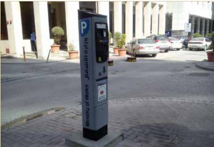
تساهم في دعم الحركة الاقتصادية

وبررت اللجنة أهمية الموضوع في كون هذه المواقع تعتبر مناخاً غير سليم لتجمع الأوبئة والقاذورات ومرتعاً للقوارض والحشرات، إلى جانب كونها تمثل أوكارا للشباب الطائش واستغلالها لأمن حاطة ومنافية للأداب والقانون. ودعت إلى الاستفادة من تجربة العين الإماراتية في معالجة هذه المشكلة التي تشكل خطراً يهدد المجتمع لما يحدث داخلها من تجاوزات وأضرار بيئية واجتماعية.