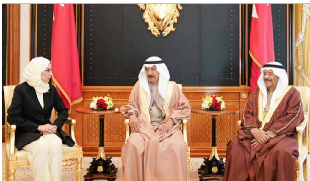
سمو رئيس الوزراء يستقبل رئيسي مجلسي النواب والشورى