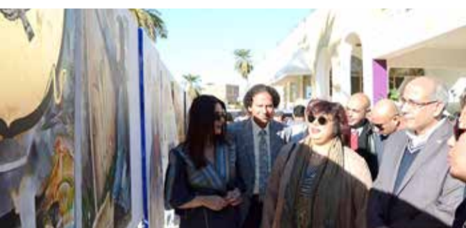
وزيرة الثقافة المصرية اثناء افتتاح المعرض الفني للمشاركين

بعدد من الرحلات بهدف مساعدة الفنان لاستلهام الأفكار واستيعاب التاريخ العريق لتلك المنطقة، مضيقة أنها اختارت الفكرة "بعد زيارة المتحف والمقابر الفرعونية والعديد من الآثار التي كانت ثرية ومهيرة"، لذا قدمت عملين مختلفين تماما من ناحية التقنية والمواد. وقالت: "اخترت للعمل الأول ورق البردي الذي عرفت به الحضارة المصرية، واستخدمت تقنية الكولاج لرسم زهرة اللوتس التي لاحظت وجودها في الكثير من المعابد الأثرية والنقوش الفرعونية، والعمل الآخر عبارة عن لوحة بألوان الأكريليك سميتها روضة تيمنا باسم طالبة الفنون الجميلة التي كانت تساعدني في الملتقى وهو رسم لفتاة تحمل تفاصيل تلك الحضارة، وترمز للمرأة الفرعونية".