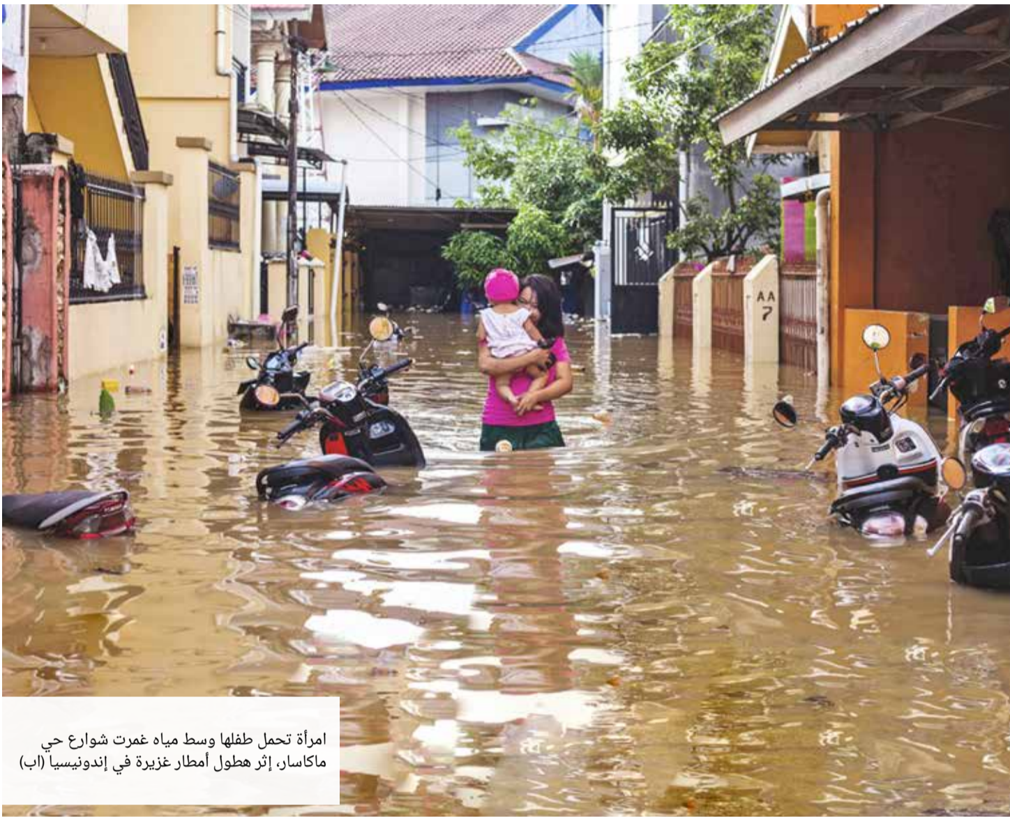
امرأة تحمل طفلها وسط مياه غمرت شوارع حي ماكاسار، إثر هطول أمطار غزيرة في إندونيسيا (أب)