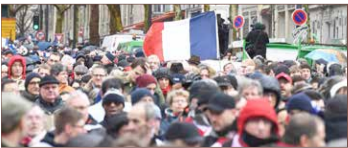
الآلاف في مسيرة مناهضة للسترات الصفراء بباريس

وتظاهر الآلاف من مؤيدي الرئيس الفرنسي إيمانويل ماكرون اليوم في "ساحة الأمة"، مرتدين أوشحة حمراء؛ بهدف "إسماع صوت الأغلبية الصامتة والدفاع عن الديمقراطية والمؤسسات". ومن المقرر أن تجوب هذه المظاهرة شوارع باريس وصولاً إلى "ساحة الجمهورية". ويرى بعض المراقبين أن هذه المسيرة ستضر بمساعي التهدئة التي يسعى إليها ماكرون