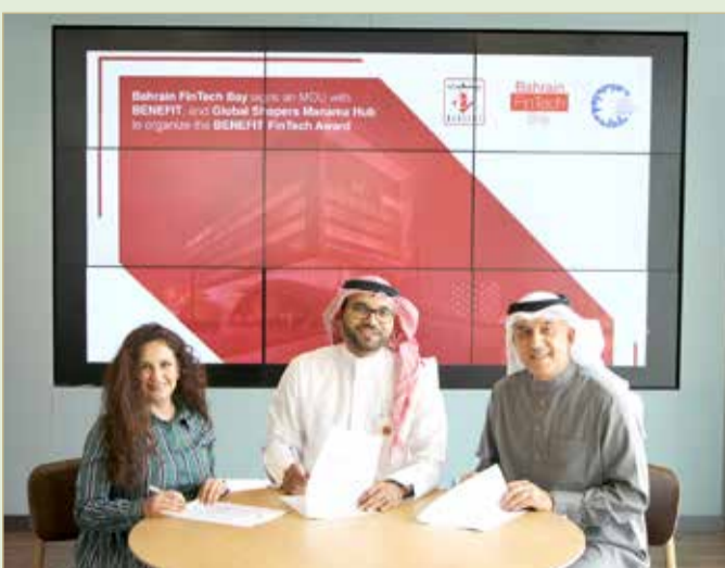
أثناء توقيع الاتفاقية بين "بنفت" وخليج التكنولوجيا المالية

نشرت صورة عن طريق الخطأ أمس مع خبر بعنوان "إطلاق هاكاون وجائزة بنفت فينتك من أجل الاستدامة في التكنولوجيا المالية للشباب"، وعليه تعذر هذا الخطأ غير المقصود والصورة المنشورة مع هذا التنويه هي الصحيحة.