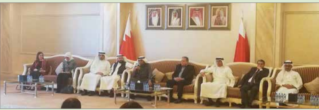
جانبا من مجلس الغرفة أمس