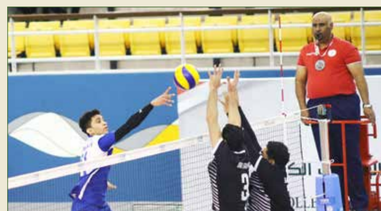
النصر يتخطى بني جمرة بصعوبة

واستطاع بني جمرة أن يفوز بالشوط الأول 15/25 قبل أن يفوز النصر بالثاني والثالث 25/27، 20/25، وعاد بني جمرة للفوز بالشوط الرابع ليحتكم الفريقان إلى الشوط الخامس الذي ذهب لصالح النصر 12/15. وبذلك الفوز رفع النصر رصيده إلى 9 نقاط في المركز 6، أما بني جمرة فإنه تلقى الخسارة