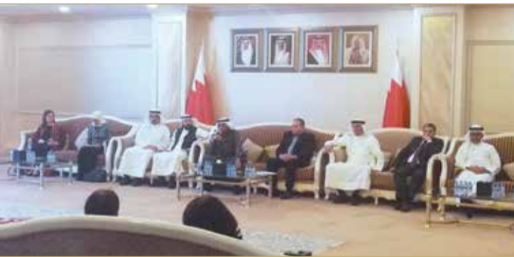
جانب من مجلس الغرفة أمس