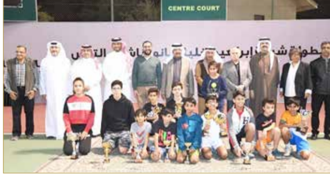
الفائزون مع كبار الحضور