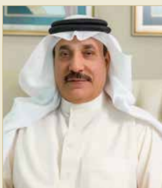
وزير العمل والتنمية الاجتماعية

في مفاوضات إيجابية رعتها "العمل" بين الأطراف