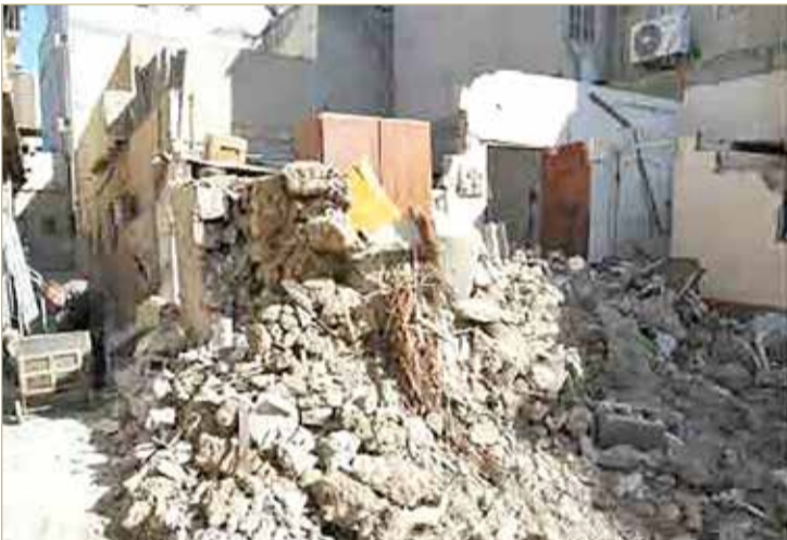
”المهجورة“ مرتعاً للقوارض والحشرات والتجمعات الشبانية ”الطائشة“

◆ لجنة ثلاثية لمعالجة ملف البيوت المهجورة