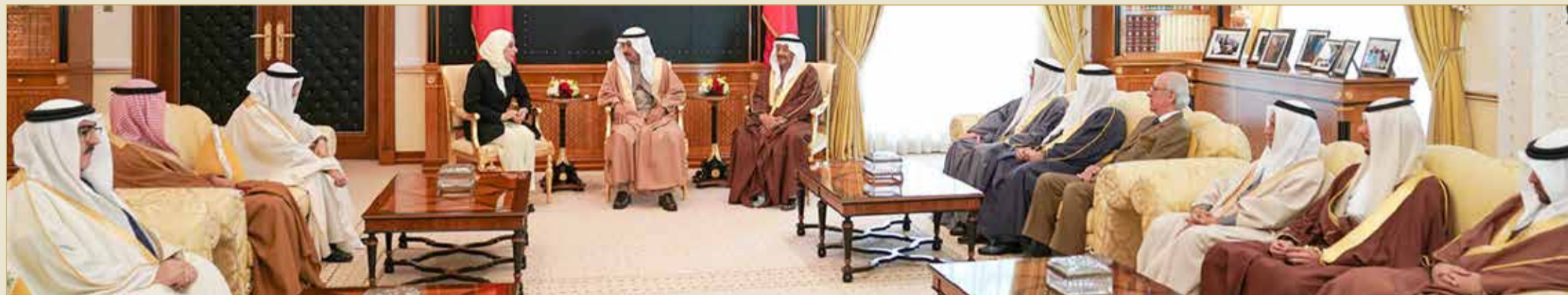
سمو رئيس الوزراء لدى استقباله رئيسي مجلسي النواب والشورى

الزيارات المتواصلة توسع آفاق التعاون الحكومي البرلماني