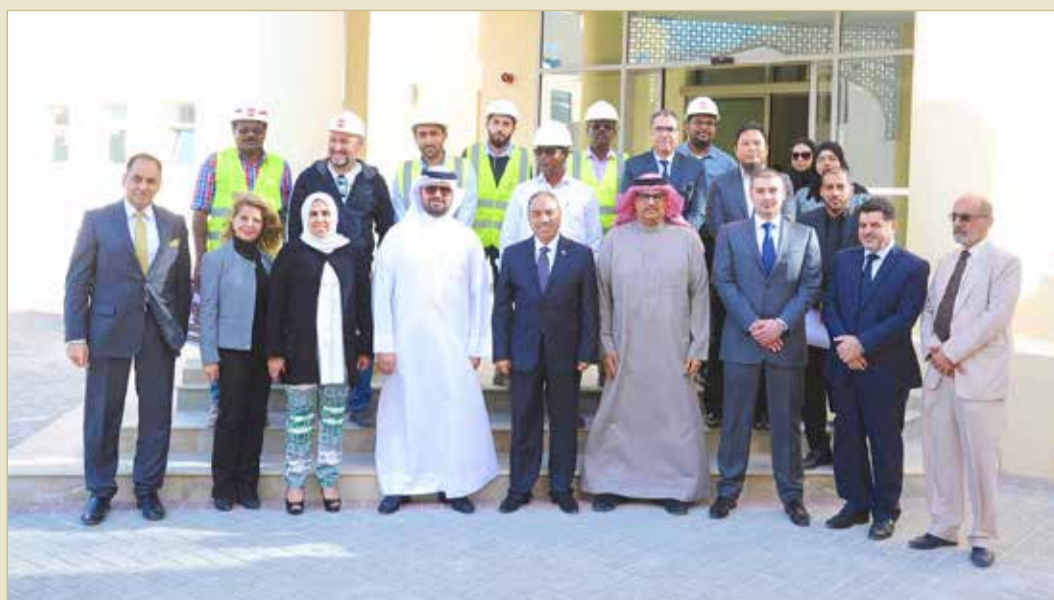
وزير الأشغال يتفقد مجمع الإعاقاة الشامل في عالي

يذكر أن المشروع ينفذ ضمن برنامج التنمية الخليجي وبدعم من الصندوق الكويتي للتنمية الاقتصادية العربية بقيمة 23 مليون دولار، والذي يغطي تكاليف الإنشاء وكافة التجهيزات اللازمة مثل المعدات الطبية والأجهزة الرياضية والوسائل التعليمية والأثاث والأجهزة الإلكترونية مع 4 حافلات مجهزة لذوي الاحتياجات الخاصة، حيث قامت الوزارة بأعمال التصميم الهندسية