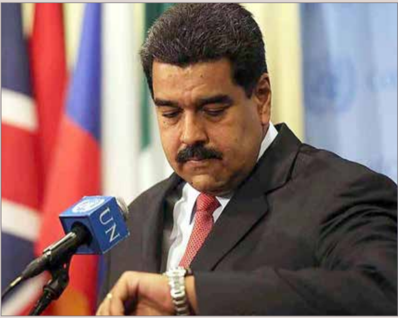
قال مادورو إنه مفتوح على الحوار

◆ فنزويلا تراجع عن تهديدها بطرد الدبلوماسيين الأمريكيين