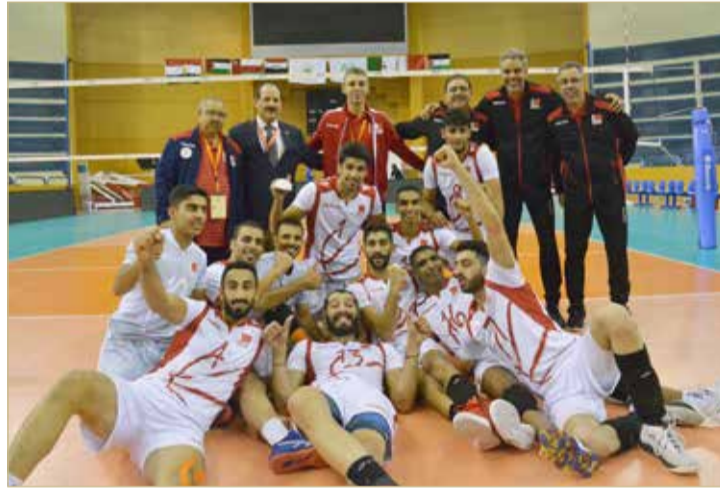
منتخب رجال الطائرة

أكد مصدر موثوق لـ "البلاد سبورت" أن الاتحاد البحريني لكرة الطائرة لن يشارك بمنتخب الرجال في البطولة الآسيوية العشرون للرجال التي من المقرر لها أن تقام بإيران خلال شهر سبتمبر المقبل وذلك لعدم حصوله على الموافقة من قبل الجهات المختصة رغم إدراجه هذه المشاركة في روزنامة بطولات 2019 واعتمادها من قبل مجلس إدارة الاتحاد.