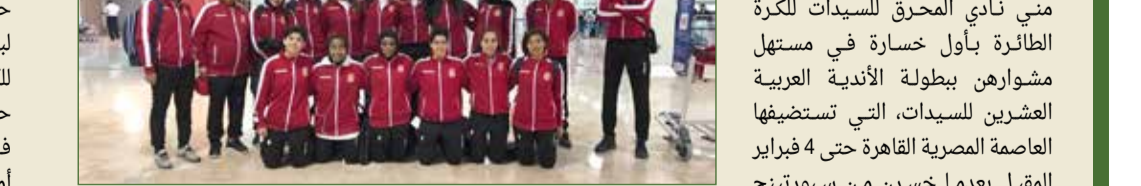
فرق سيدات طائرة المحرق

وفي المواجهة الثانية التي جمعت الزملاء المصري والصفائسي التونسي فاز الأخير على صاحبات الأرض بـ 3 أشواط نظيفة (15/25، 19/25، 21/25). وستحوز سيدات المحرق ثاني مواجهاتهن اليوم الاثنين أمام الصيد المصري الساعة 5 بتوقيت مصر (6 مساء بتوقيت البحرين).