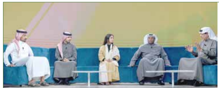
جانب من البرنامج

قدمت القناة الرياضية بتلفزيون البحرين وبالتعاون مع المكتب الإعلامي لسمو الشيخ ناصر بن حمد آل خليفة ومركز المعلومات برنامج "نواصي" والذي يسلط الضوء على سباقات القدرة في المملكة والموسم المحلي من خلال التحليل والمقابلات.