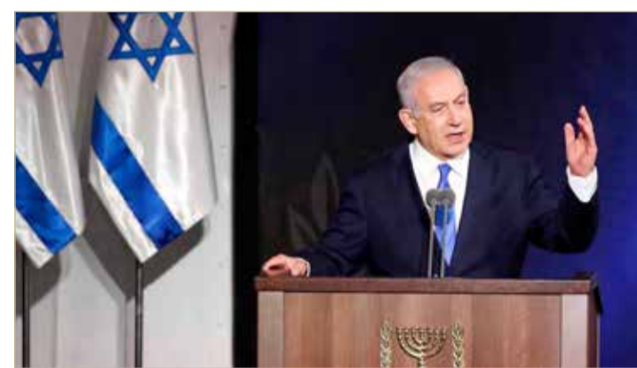
رئيس الوزراء الإسرائيلي

لفح الأمين العام لحزب الله في لبنان حسن نصر الله، إلى احتمال نشوب حرب مع إسرائيل، لكنه تجنب التطرق بعمق إلى الأزمات الداخلية التي يواجهها لبنان. جاء ذلك في مقابلة مع قناة الميادين، بعدما تجنب الظهور في خطابات لأشهر عديدة على غير عادته.