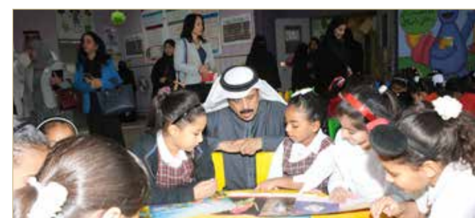
وزير التربية والتعليم يتابع تنفيذ حصص القراءة