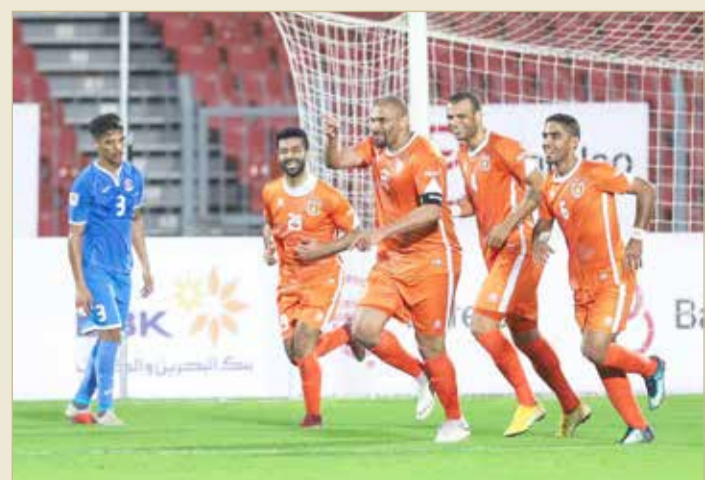
فرحة المشخص بتسجيل هدف الحالة الأول

سامويل (78)، بالدقائق الأخيرة سعى المنامة لأن يفعل شيئاً في اللقاء إلا أن كل محاولاته باءت بالفشل لينتهي