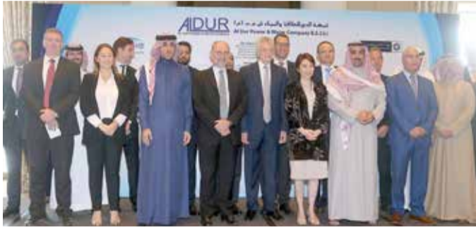
كبار الشخصيات لدى حضورهم للفعالية