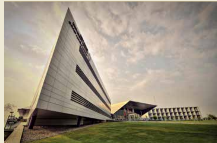
مستشفى الملك حمد الجامعي