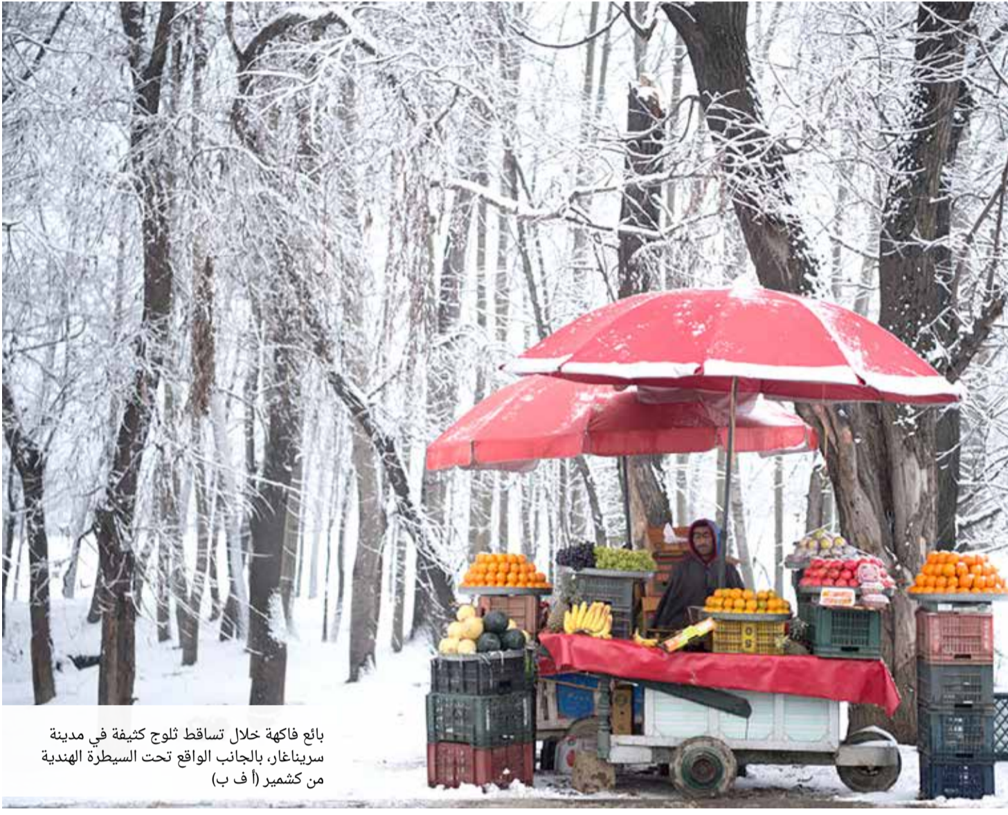
بائع فاكهة خلال تساقط ثلوج كثيفة في مدينة سرينغا، بالجانب الواقع تحت السيطرة الهندية من كشمير

حُثَّت الصحافة البريطانية وسائل التواصل الاجتماعي على تخفيف حدة نبرة الانتقادات الموجهة لدوقة ساكس ميغان ماركل زوجة الأمير هاري، ولدوقة كمبريدج كيت ميدلتون زوجة الأمير ويليام. وسعى مسؤولون بالقصر إلى مساعدة موقع “إنستغرام” لمراقبة وإزالة أي تعليقات مسيئة عن الدوقتين. ويقضي مساعدون للعائلة المالكة ساعات أسبوعياً في تعديل التعليقات على الصفحة الرسمية للقصر على موقع “إنستغرام” وإزالة أي محتوى عنصري أو جنسي. وأفادت صحيفة “ذي تايمز” أمس الثلاثاء في مقال بعنوان “انتهاك شريز” بأن العديد من التعليقات حول ميغان وكيت “مسيئة للغاية للنشر، وكانت هناك تهديدات بالعنف”. من جهتها، شتت مجلة “هاللو” حملة “لطف” حثت فيها مستخدمي وسائل التواصل الاجتماعي على التفكير مرتين قبل نشر تعليقات مسيئة. وقالت مراسلة المجلة بالقصر الملكي اميلي ناش، إن من غير المقبول وضع الدوقتين في مواجهة مع مستخدمي مواقع التواصل.