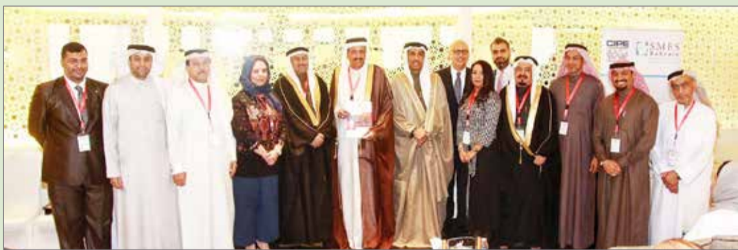
كبار الشخصيات لدى تدشين المرحلة الأخيرة لـ "أجندة الأعمال"

23 توصية... وارتفاع الرسوم والبيروقراطية أبرز التحديات