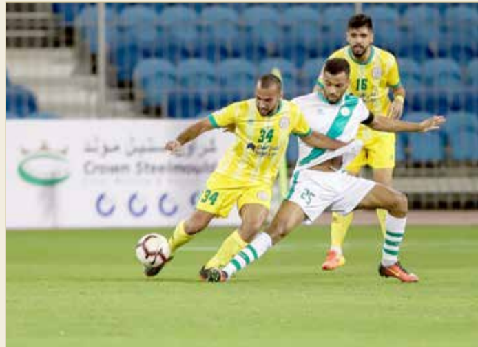
من لقاء المالكية والبديع

اتحاد الكرة تمكن فريق الرفاع من إنهاء القسم الأول لدوري ناصر بن حمد الممتاز لكرة القدم للموسم الحالي 2018-2019 في مركز الصدارة برصيد 20 نقطة.