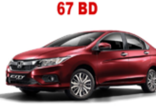
67 BD Honda City