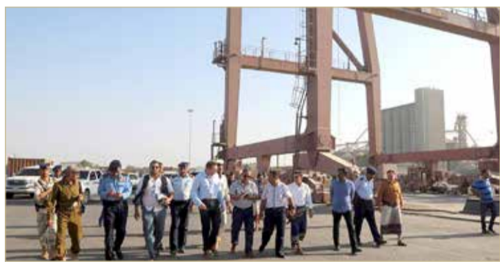
مراقبون أمميون في الحديدية

منع متمررو ميليشيات الحوثي وصول فريق من الأمم المتحدة برئاسة الجنرال باتريك كاميرت إلى مطاحن البحر الأحمر في مدينة الحديدية، حسبما ذكرت مصادر عسكرية، أمس الثلاثاء. وأطلق الانقلابيون المواليون لإيران النار على الفريق الهندسي التابع للمقاومة اليمنية المشتركة، أثناء قيامه بنزع الأنغام لتسهيل دخول الفريق الدولي. وتعرض الفريق الهندسي التابع للمقاومة المشتركة لوابل من النيران، بعدما شرع في مسح ونزع شبكات الأنغام التي كان الحوثيون قد زرعوها من قوس النصر إلى قرب خط التماس، حسبما تم الاتفاق عليه لتأمين طريق مندوبي الأمم المتحدة وتسيير الفافلة الإغاثية من مطاحن البحر الأحمر. وأشارت المصادر إلى أن كبير ضباط الارتباط التابع للأمم المتحدة، فضل في