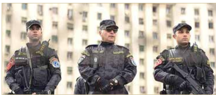
الشرطة عثرت بحوزتهم على مبالغ مالية وأدوات تخريبية

ألقت قوات الأمن المصرية القبض على 54 شخصا، بينهم أعضاء بتنظيم الإخوان الإرهابي، لتخطيطهم لتنظيم احتجاجات والقيام بأعمال تخريبية في ذكرى ثورة 25 يناير العام 2011، حسبما أعلنت وزارة الداخلية، أمس الثلاثاء. وأضافت الوزارة أن المجموعة كان يتزعمها قيادي إخواني مقيم في تركيا، وذكرت أنه "تم العثور بحوزتهم على مبالغ مالية وأدوات تخريبية تستخدم في أعمال الشغب".