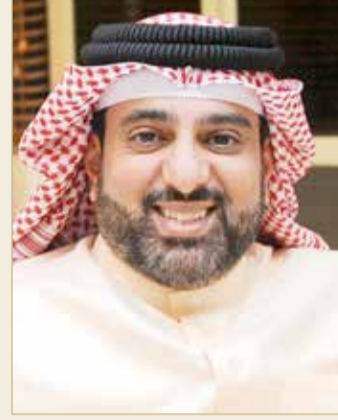
خالد بن محمد

بالإتحاد الملكي للفروسية وسباقات القدرة الشيخ خالد بن محمد آل خليفة أن المستويات الفنية في الموسم الحالي جاءت مميزة بناء على ما ظهرت عليه مسابقات البطولات الخمس الماضية.