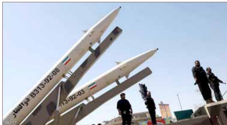
إيران تقول إن الاتفاق النووي لا يلزمها بوقف التجارب الصاروخية

المدى من أجل اختبار فعاليتها. الاتفاق الذي أبرمته إيران في العام 2015 مع الدول العظمى وهي الولايات المتحدة والصين وفرنسا وبريطانيا وروسيا وألمانيا، يتكون جزئياً من القرار 2231 الصادر عن مجلس الأمن التابع للأمم المتحدة. ويقول القرار 2231 إن إيران "مطلبة" بالتوقف لمدة تصل إلى 8 سنوات عن الأنشطة المتعلقة بالصواريخ الباليستية المصممة لتكون قادرة على حمل أسلحة نووية.