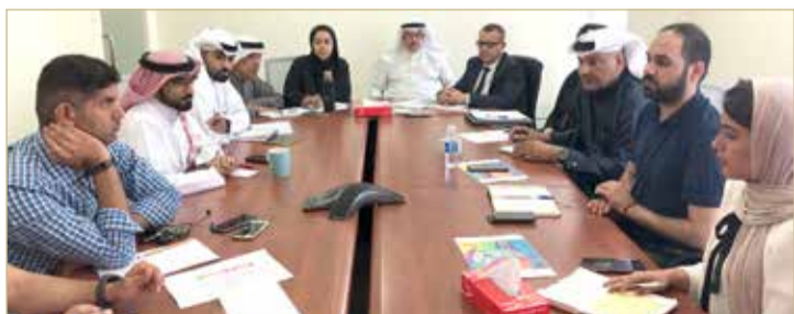
عسكر يترأس الاجتماع

♦ عسكر يشيد بالجهود التي يبذلها الجميع من أجل إنجاز الحدث