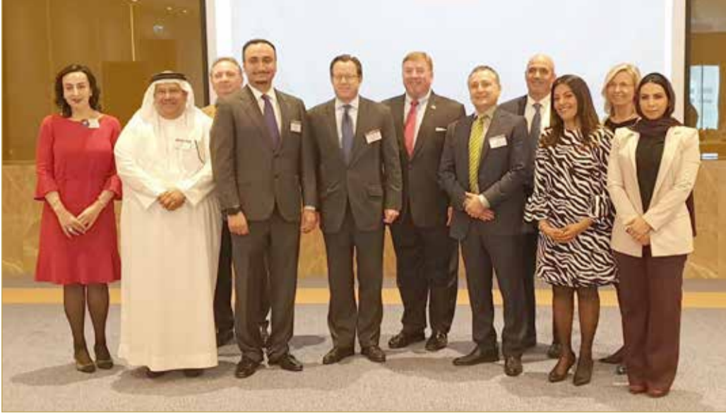
صورة جماعية للمشاركين في اللقاء

كشف مسؤول في مركز البحرين لتنمية الصادرات "صادرات البحرين"، الذي أطلقته البحرين قبل نحو 3 أشهر بغية دعم القطاع الصناعي في المملكة عن خلال تقديم تسهيلات مالية تساعد الشركات المحلية في تصدير منتجاتها إلى الخارج، أن المركز استقبل قرابة 20 طلباً من مؤسسات أبدت اهتمامها بالحصول على خدمات المركز، إذ حدد المركز مليون دينار سقفاً لتمويل الصادرات للمؤسسات المستفيدة.