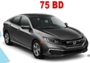
75 BD Honda Civic