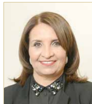
الشبيخة حياة بنت عبدالعزيز

وأكدت الشبيخة حياة بنت عبدالعزيز آل خليفة أن الاتحاد البحريني لكرة الطاولة يعزز بهذه الاستضافة وثقة الاتحاد الدولي لكرة الطاولة على حد سواء، موضحة بأن البطولة سوف تشهد مشاركة 18 دولة و113 لاعبا ولاعبة، والدول، وهي: مملكة