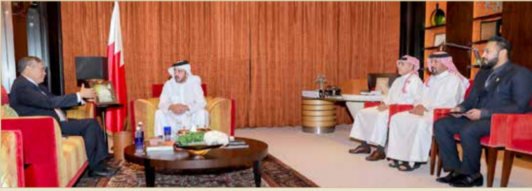
سمو الشيخ خالد بن حمد آل خليفة خلال استقباله السفير الفلبيني

استقبل النائب الأول لرئيس المجلس الأعلى للشباب والرياضة، رئيس الاتحاد البحريني لألعاب القوى، الرئيس الفخري للاتحاد البحريني لفنون القتال المختلطة سمو الشيخ خالد بن حمد آل خليفة، بـمكتب سموه بقصر الوادي سفير جمهورية الفلبين الصديقة لدى المملكة أفونسو أيفير.