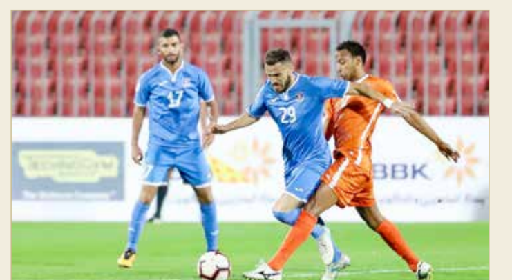
من لقاء النمامة والحالة