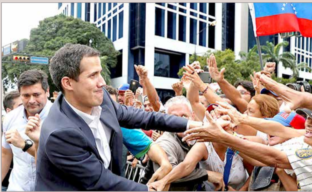
السلطات الأميركية تمنح غوايدو حق التصرف في الأموال الفنزويلية