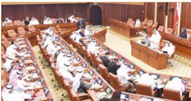
إقرار برنامج عمل الحكومة بالغالبية