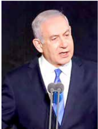
رئيس الوزراء الإسرائيلي بنيامين نتيناهو