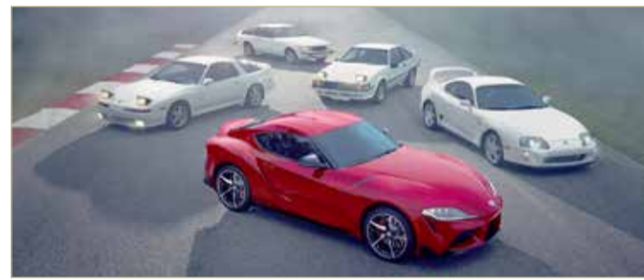
تويوتا تطلق سيارة سوبرا الجديدة كلياً في معرض ديترويت للسيارات

كشفت شركة تويوتا مؤخراً عن سيارتها المرتقبة تويوتا "سوبرا" الجديدة كلياً، وذلك خلال فعاليات معرض أميركا الشمالية الدولي للسيارات في ديترويت (NAIAS). لطالما اُقتن اسم تويوتا "سوبرا" بالقوة والأداء ودقة التحكم، وهي السمات التي كانت مرادفة للأجيال المتعاقبة من "سوبرا" على مدى ربع قرن من الزمان. وكسيارة رياضية أصيلة ومميزة، نجحت تويوتا "سوبرا" في اكتساب سمعة مرموقة باعتبارها سيارة ذات أداء استثنائي سواء على الطرق المعبدة، أو كمنافس قوي على حلبات السباق، ولتكتسب قاعدة عريضة من المعجبين في جميع أنحاء العالم.