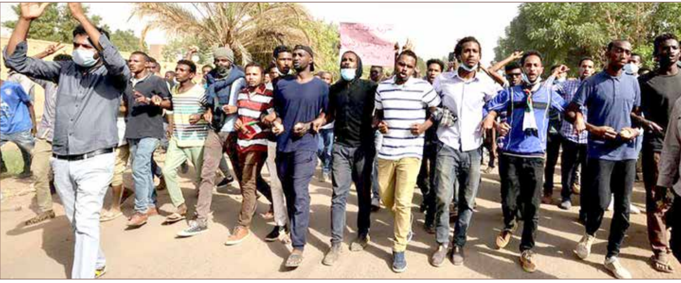
من التظاهرات في السودان

استمرار الاحتجاجات رغم إعلان الخرطوم الإفراج عن جميع المعتقلين