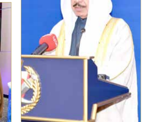
الشيخ راشد بن عبدالله آل خليفة