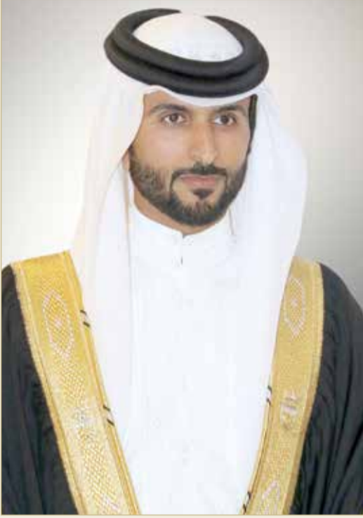
ناصر بن حمد

على أن تكون مع الشباب البحريني في مهمته المقبلة في لعبة كرة القدم من أجل تحقيق طموحاته وآماله في رؤية كرة القدم البحرينية تسير بخطى ثابتة نحو التطور والنماء ونشئ على دور الرعاية: بنك البحرين الوطني، بابكو، بتلكو، بنك البحرين والكويت، مجموعة آل شريف، Technogym، مجلس التنمية الاقتصادية، شركة المنيوم البحريني (ألبا)، إبراهيم خليل كانو، لولو هايبر ماركيت، بتروكيماويات (GPIC)، المصرف الخليجي التجاري، أميركان إكسپرس، شركة زين، بنك سيكو، بيت التمويل الكويتي، أسواق رامن البحرين، بنك الإثمار، كريدي ماكس، بنك البحرين للتنمية، بيت السفر، سوليدرتي للتأمين، سكراب البحرين، مصانع التاج، ردي ماكس المملكة، والتي كان حضورها متميزاً في دعم كرة القدم البحرينية.