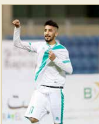
التونسي محتفلاً بهدفه في مرعى المالكية

الأول، خصوصاً أول 20 دقيقة التي أضعنا فيها عدداً من الفرص. ولفت إلى أن فريق المالكية استلم الزمام في الشوط الثاني، مؤكداً أن