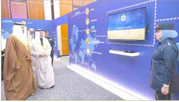
وزير الداخلية لدى حضوره الاحتفال الذي نظّمته شؤون الجمارك (06)