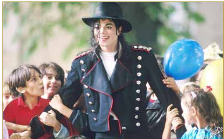
انتقدت عائلة جاكسون، الفيلم الجديد، ووصفته بـ “محاولة باسمة ووقحة” أخرى للترشح من شهرة ملك البوب العالمي بعد رحيله.

وصفت أسرة مايكل جاكسون ردود الفعل على فيلم وثائقي جديد عن ارتكابه انتهاكات جنسية مزعومة بحق أطفال بأنها “إعدام علني دون محاكمة” وقالت إنه “بريء مئة بالمئة” من تلك الاتهامات. ونشرت عائلة جاكسون بياناً تؤكد فيه أن صانعي هذا الفيلم لم يكونوا مهتمين بالحقيقة.