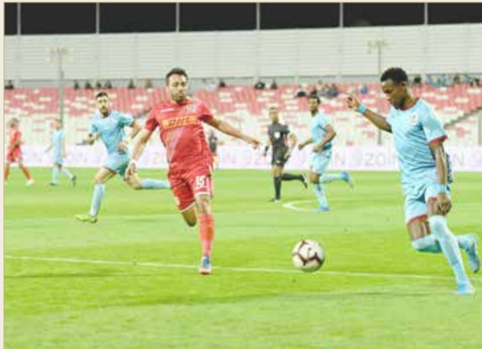
من لقاء المحرق والشباب