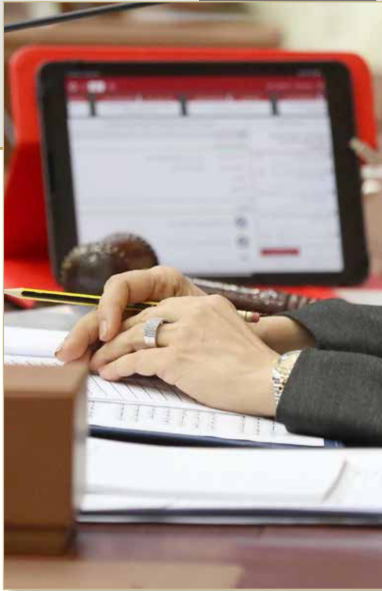
يوفر مجلس النواب للأعضاء تقنيات البث وعرض جداول الأعمال عبر الأجهزة اللوحية الموزعة على جميع الأعضاء