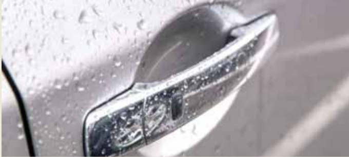
السيارات الجديدة نعمة أحياناً ونقمة أحياناً أخرى

في أنظمة تلك السيارات. وبحسب صحيفة “ديلي ميل” البريطانية، فإن اللصوص يعتمدون على جهازين، يرصد أولهما الإشارات الصادرة عن مفتاح التحكم عن بُعد لدى صاحب السيارة، وجهاز آخر يرسل إشارات مماثلة. ويعمل الجهازان مع بعضهما، إذ يقف اللص الأول قرب السيارة ومعه جهاز، فيما يقف اللص الثاني ومعه الجهاز الآخر بالقرب من الضحية. وفي النهاية تدفع هذه الخدعة السيارة