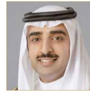
الشيخ محمد بن خليفة

الربع الأول من العام الجاري. يذكر أن هناك 52 محطة وقود مرخصة عاملة منها 45 محطة (برية) للسيارات، و7 محطات وقود (بحرية) للقوارب موزعة على مختلف مناطق البحرين، وجميع هذه المحطات تتبع وقود الجازولين بنوعيه الجيد والممتاز، في حين تتبع 6 منها الجازولين السوبر الذي طرح العام 2017. وهذا ويتوفر أيضاً بعدد من المحطات وقود الكيروسين والديزل بما يخدم السوق المحلية واحتياجاتها. من جانب آخر، أكد الوزير استمرارية الدعم الحكومي لمنتج الديزل للصيادين ولا يوجد عليه أي تغيير، مقدراً حجم الدعم الحكومي لـ 400 صياد في العام 2018 بمليون دينار.