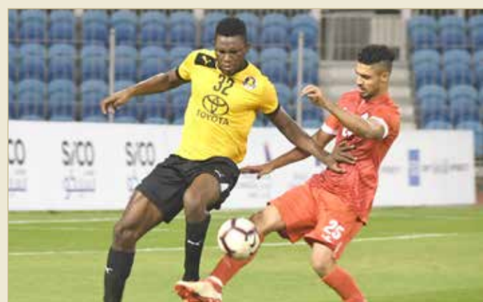
من لقاء الأهلي وسترة

عزز صدارته للدرجة الثانية في ختام الجولة السابعة