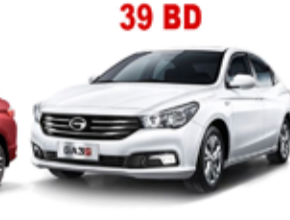
39 BD GAC GA3