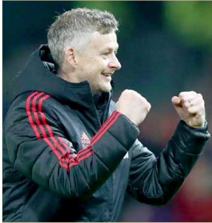
أولي جونار سولسكاير

وفاز يونايتد صاحب المركز السادس بكل مبارياته الست في الدوري، منذ تعيين سولسكاير خلفاً لجوزيه مورينيو، ليقلص الفارق مع تشيلسي الرابع من 11 إلى 3 نقاط، بينما لا يزال النادي ينافس في كأس الاتحاد ودوري أبطال أوروبا. وأبلغ سولسكاير الصحفيين قبل مواجهة أمام بيرنلي، "الهدف دائماً لمانشستر يونايتد الفوز بالدوري، لا يمكننا تحقيق ذلك هذا العام لكن يجب أن نستعيد روح التحدي، أمامنا دوري الأبطال وكأس الاتحاد، لا يجب المنافسة فقط على إنهاء الموسم بين الأربعة الأوائل". وكان آخر لقب حققه يونايتد، في الدوري الأوروبي 2017، لكنه لم يفز بالدوري الممتاز منذ آخر مواسم المدرب السابق أليكس فيرجسون مع الفريق في