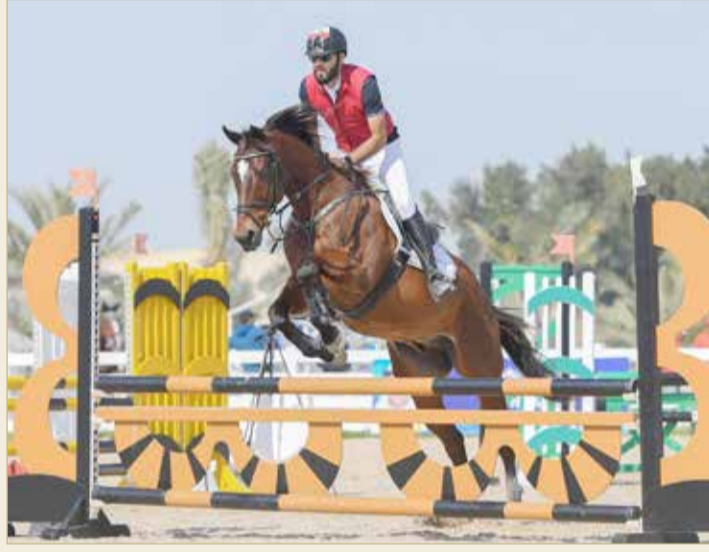
لقطات متنوعة من قفز الحواجز

وأشار سموه أن مجلس إدارة الاتحاد الملكي يتابع باستمرار وعن قرب مجريات المسابقات؛ من أجل تطويرها دائما وبالتنسيق