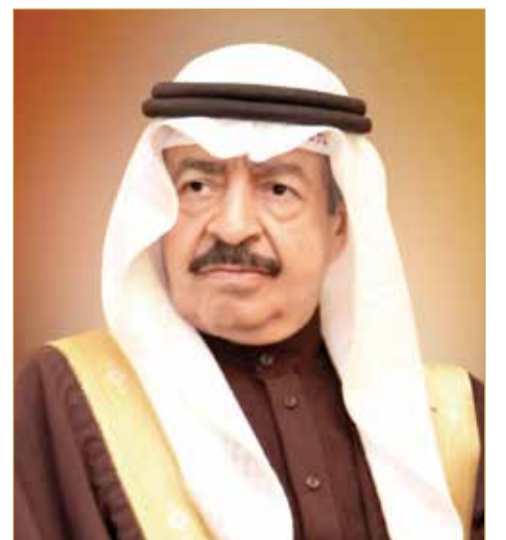
سمو رئيس الوزراء

وغيابتنا هي مواصلة جهود التنمية وتحسين المستوى المعيشي للمواطنين، وستعطي البحرين بمشيئة الله وبتكاتف شعبها والأجهزة كافة في السلطين التنفيذية والتشريعية لتحقيق المزيد من الإنجازات التي تلي تطلعات وطموحات مواطنينا. وأكد سموه أن الحكومة ستبأشر جهودها لتنفيذ الالتزامات الواردة في برنامج عملها في مختلف القطاعات، وفق الأولويات التي تواكب متطلبات المرحلة المقبلة وتكفل الاستخدام الأمثل لموارد الدولة. وجدد سموه تأكيد أهمية تعزيز التعاون الجاد والمثمر بين السلطين التنفيذية والتشريعية. وشدد سموه على أن غاية الحكومة هي توفير متطلبات المواطنين من مختلف الخدمات بجودة وكفاءة عالية. (04)