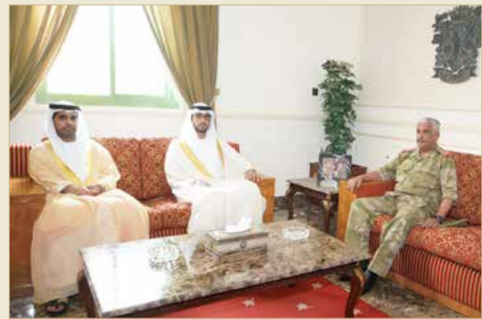
رئيس الحرس الوطني مستقبلاً السفير الإماراتي لدى البحرين

استقبل رئيس الحرس الوطني الفريق أول ركن سمو الشيخ محمد بن عيسى آل خليفة صباح أمس، سفير دولة الإمارات العربية المتحدة لدى مملكة البحرين الشيخ سلطان بن حمدان بن زايد آل نهيان، وذلك في مكتب سموه بمعسكر الصحير.