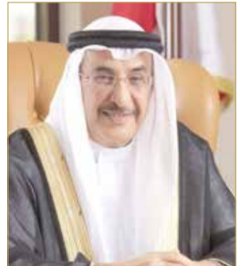
الشيخ خالد بن عبدالله

تماماً، فإنني أود التأكيد على أن العمل سيكون متواصلًا ومستمرًا لترجمة توجيهات سموكم السديدة ووضعها موضع