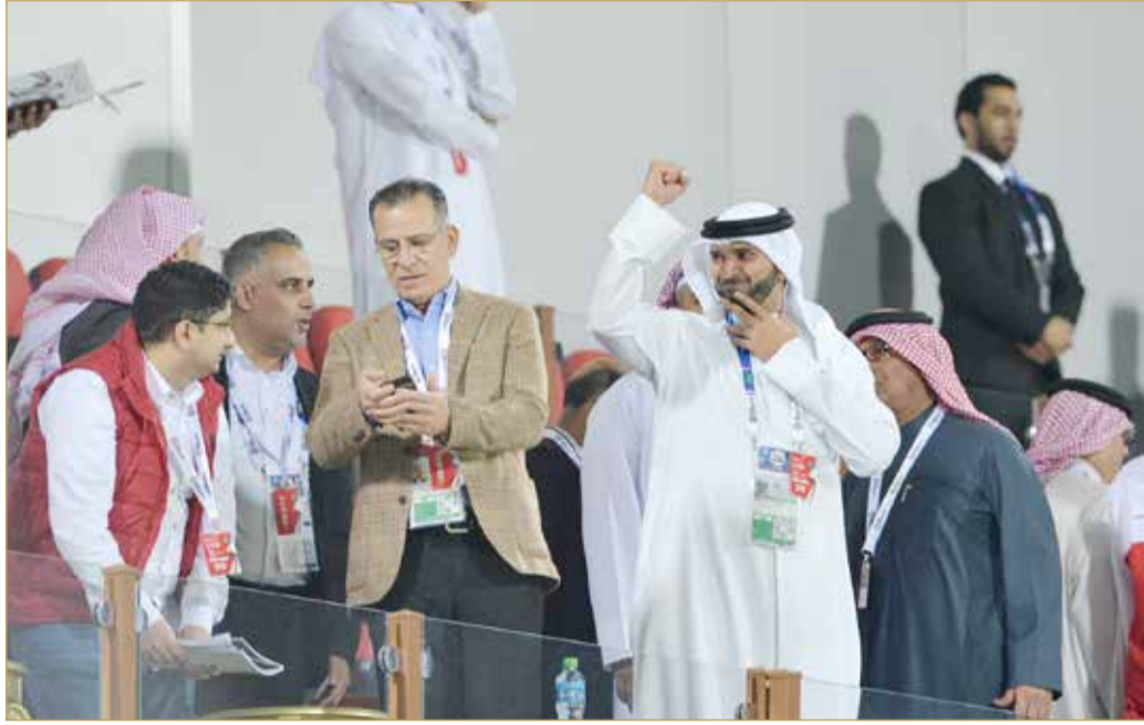
علي بن خليفة يرفع قبضة الانتصار

بكبرياء وشموخ ومن على منصة كبار الشخصيات باسناد نادي الشارقة يرفع الشيخ علي بن خليفة قبضة الانتصار عالية؛ فرحا بفوز منتخبنا الوطني لكرة القدم على الهند 1/0، والتأهل لدور الـ 16 بنهايات كأس آسيا.