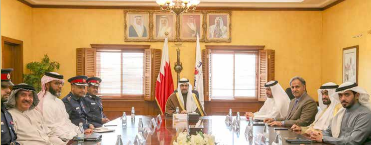
سمو محافظ الجنوبية يترأس الاجتماع التنسيقي الرابع لموسم البر

يجب أن تتضافر الجهود من أجل سلامة مرتادي البر