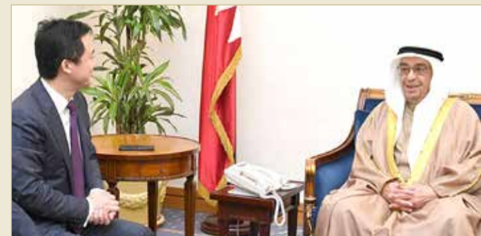
نائب رئيس مجلس الوزراء مستقبلاً يانغ يوغوي

استقبل نائب رئيس مجلس الوزراء سمو الشيخ محمد بن مبارك آل خليفة بمكتبه بقصر القضيبيبة الرئيس الإقليمي لمنطقة الشرق الأوسط لشركة هواوي الصينية يانغ يوغوي التي تعمل في مملكة البحرين منذ العام 2004م.