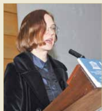
الفائزة من فنلندا

هذا، وأشاد الحاضرون بالمشروعين ودورها الكبيرين في نشر التعليم للفتات المحتاجة له، ضمن أهداف الجائزة التي تتوافق مع أهداف منظمة اليونسكو في توفير التعليم للجميع. والجدير بالذكر أنه قد تقدم هذا العام للتنافس على هذه الجائزة المهمة 202 مشروع ومبادرة من 73 دولة من مختلف أنحاء العالم.