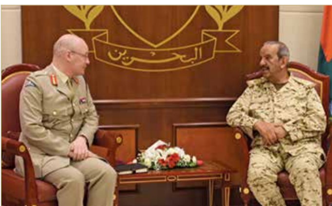
الرفاع - قوة الدفاع

استقبل القائد العام لقوة دفاع البحرين المشير الركن الشيخ خليفة بن أحمد آل خليفة كبير مستشاري الدفاع للشرق الأوسط بالمملكة المتحدة الفريق سير جون لوريمير والوفد المرافق، وذلك بحضور وزير شؤون الدفاع الفريق الركن عبدالله بن حسن النعيمي. وفي بداية اللقاء، رحب القائد العام لقوة دفاع البحرين بكبير مستشاري الدفاع للشرق الأوسط بالمملكة المتحدة والوفد المرافق، مشيداً بعلاقات الصداقة التاريخية والتميز التي تربط مملكة البحرين والمملكة المتحدة التي لها جذور تاريخية متينة، منوهاً بالتعاون القائم بين البلدين الصديقين في شتى المجالات ومنها