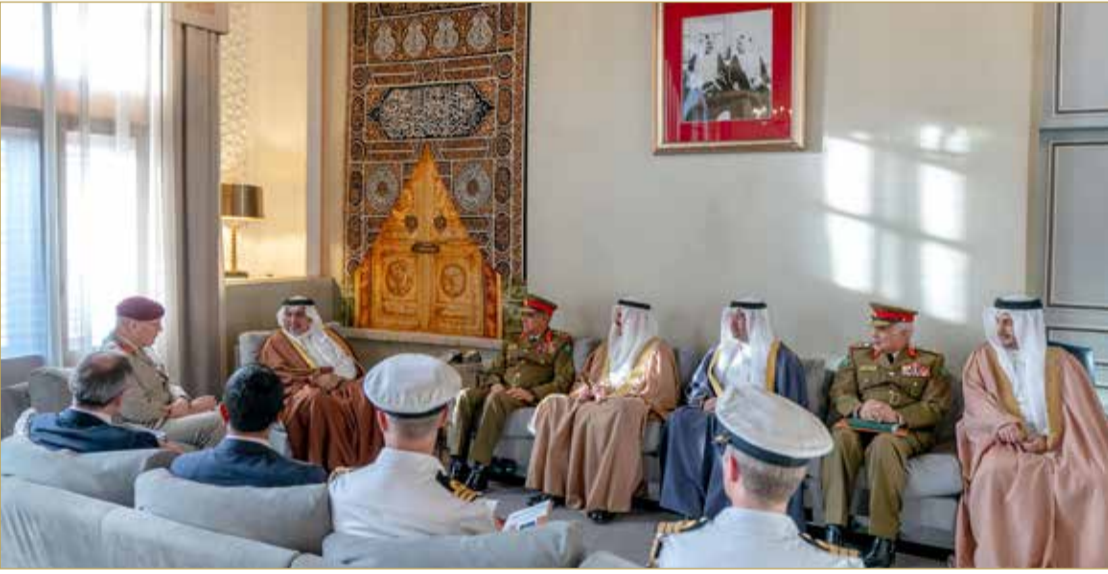
سمو نائب جلالة الملك مستقبلاً كبير مستشاري الدفاع للشرق الأوسط بالمملكة المتحدة