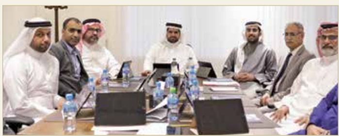
سمو الشيخ عيسى بن علي مترسناً اجتماع اتحاد السلة

وافق مجلس إدارة اتحاد السلة على المشاركة في دورة الإنعاش القلبي التي تنظمها الأكاديمية الأولمبية لأربعة دارسين من الأندية المحلية المختلفة.