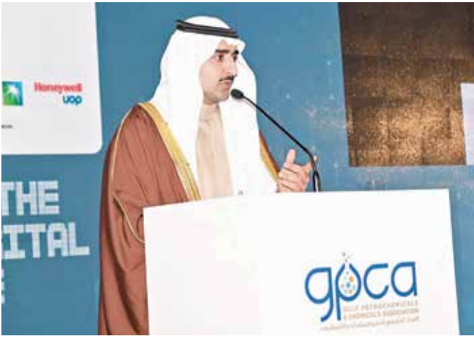
وزير النفط يلقى كلمته في المنتدى

◆ انطلاق منتدى “جيبكا” للأبحاث والابتكار بحضور 300 شخصية