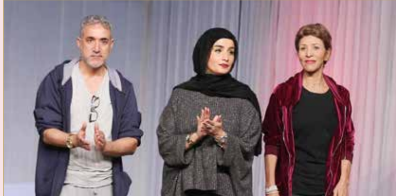
عالم واسع كبير مليء بالإبداع

غير مسبوق، فهو يبدع بمفهوم حقيقي وادراك المعاني التجديد. هناك مخرجون وممثلون ومؤلفون وفنيون استطاعوا ان يخلقوا رؤية خاصة بهم أصبحت مدرسة للآخرين، وهذه ليست مبالغة وإنما حقيقة ويعرفها القاضي والداني.