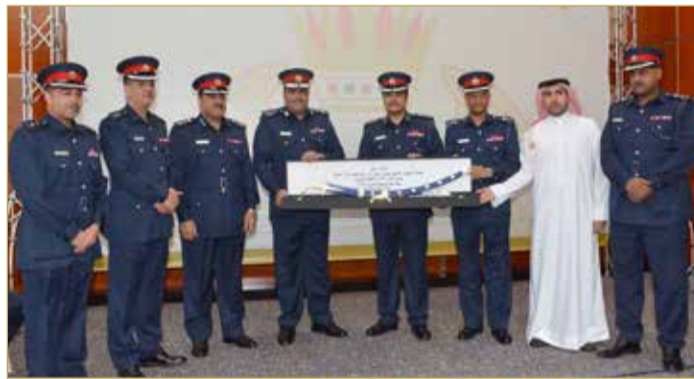
المدير العام للإدارة العامة للمرور كرم منسوبي الإدارة المتميزين