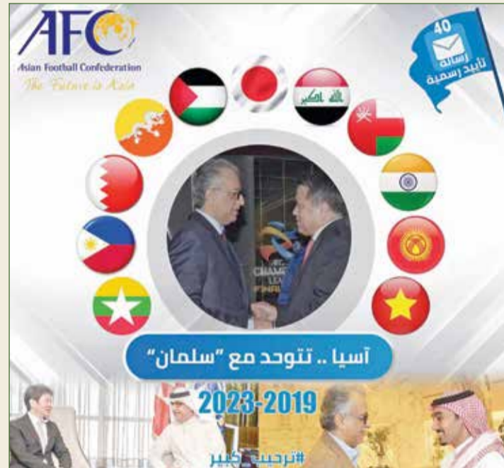
آسيا تتوحد مع سلمان

وإلى جانب ذلك، فإن الشيخ سلمان بن إبراهيم فإنه لا يزال ينتهج مبدأ النزاهة واحترام القواعد والنظم الانتخابية وقد جسد ذلك خلال كأس آسيا المقامة في الإمارات قبل شهرين عندما نأى بنفسه عن الترويج لحملته واستغلال أكبر حدث كروي قاري لتحقيق مكاسب انتخابية رغم محاولة بعض وسائل الإعلام تعكير صفو البطولة بإثارة مواضيع ذات علاقة بالانتخابات.