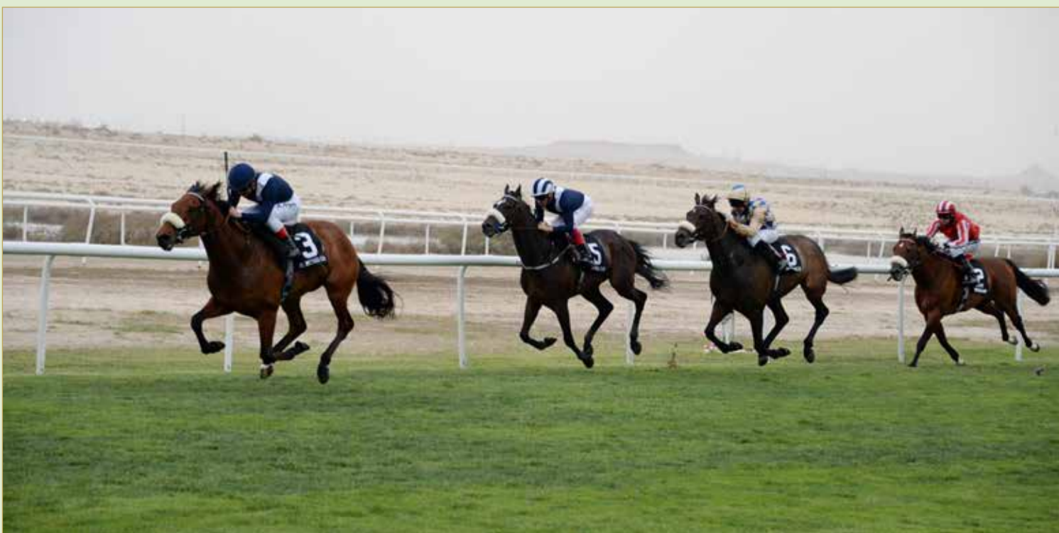
صراع قوي ينتظره الجمهور في سباق الغد