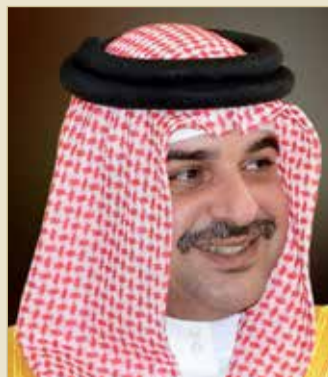
سمو الشيخ عبدالله بن حمد

أكد الممثل الشخصي لجلالة الملك، رئيس المجلس الأعلى للبيئة سمو الشيخ عبدالله بن حمد آل خليفة أن مملكة البحرين كانت وستبقى راسخة، ولها مكانة دولية مرموقة، وتحقق كل المكاسب والإنجازات في جميع المحافل والمادين المحلية والإقليمية والدولية، وذلك بفضل التوجهات السامية لعاهل البلاد صاحب الجلالة الملك حمد بن عيسى آل خليفة، ولتثبيت المملكة أنها تزخر بطاقات متميزة وعمل دؤوب يسهم في تقديم أفضل الصور وفي كافة المجالات وبما يواكب التطور وموضوع الإشادة من المجتمع الدولي.