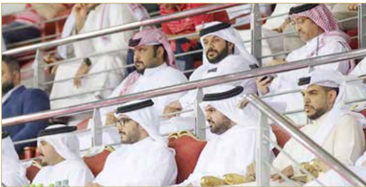
سمو الشيخ عيسى بن سلمان وسمو الشيخ عيسى بن علي يشهدان مباراة المحرق والرفاع

المبلاد | محمد الدرازي | تصوير: رسول الجبيري