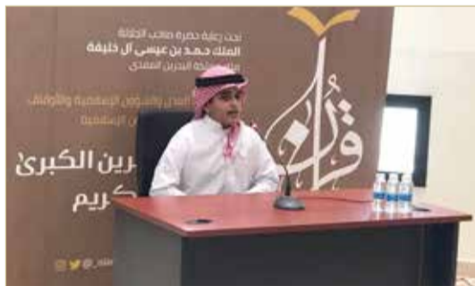
اختتام التصفيات النهائية للجائزة في دورتها الرابعة والعشرين

الشيخ خليفة للتكنولوجيا، بينما شارك في مسابقة أجراء (75 متسابقاً ومتسابقة) من ذوي الإعاقة الذهنية البسيطة، والتي انعدت تصفياتها بمركز شهبان الفارسي للتخاطب الشامل، فيما بلغ عدد المشاركين في مسابقة غفران (36 متسابقاً ومتسابقة) من نزل إدارة الإصلاح والتأهيل، وحظيت مسابقة رضوان بمشاركة (251 متسابقاً ومتسابقة) من عموم الجمهور. أما مسابقة سلمان الفارسي، فقد شارك فيها (142 متسابقاً ومتسابقة) من الناطقين بغير اللغة العربية، كما شارك في مسابقة التلاوة وحسن الأداء (550 متسابقاً ومتسابقة).