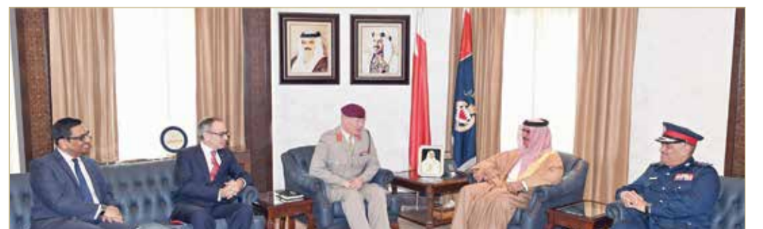
المنامة - وزارة الداخلية

◆ وزير الداخلية: فتح آفاق جديدة من العمل المشترك