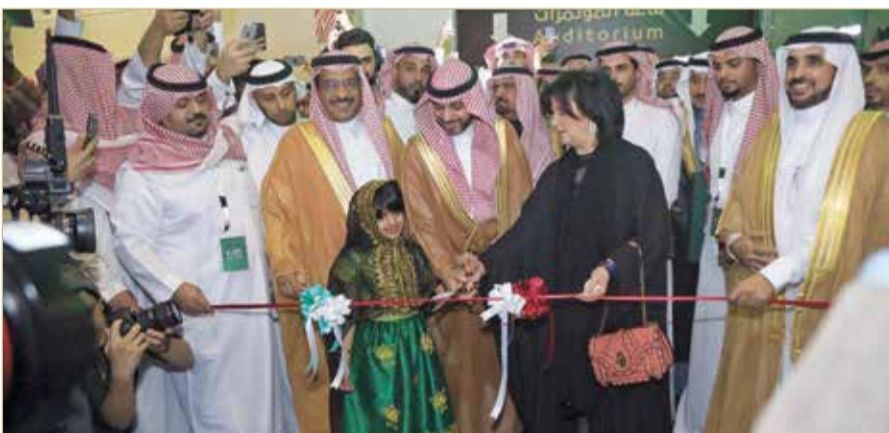
رئيس هيئة البحرين للثقافة والآثار ترأست وفد الهيئة المشارك في افتتاح المعرض

حين كانت المحرق عاصمةً للثقافة الإسلامية 2018. وأكدت ما تتشاركه الملكتان من مقومات تاريخية وثقافية أصيلة، وما تتمتعان به من علاقات أخوية عميقة وراسخة، مشيرة إلى أهمية استمرار التبادل والتعاون الثقافي ما بين البلدين الشقيقين. وعن أهمية معارض الكتاب في تعزيز الحراك الثقافي في المنطقة ذكرت "ما زال الكتاب الوسيلة الأفضل لنقول إن أوطاننا تمتلك من الوعي الثقافي ما يؤهلها لتكون مراكز للإشعاع الحضاري، ولدينا اليوم فرصة كبيرة لتأخذ بزمام