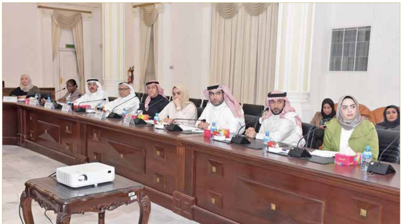
جانب من جلسة يوم أمس

وبررت اللجنة المالية والقانونية بأن التصاميم الهندسية تتطلب رسوماً إضافية قد يتم استقطاعها من الميزانية المخصصة للمشروع وبما يقلل من عدد الطلبات المنجزة أو قد يتم تحميل تلك الرسوم لمقدم طلب خدمة الترميم، وهو ما يتنافى مع أهداف المشروع المخصص للمواطنين من ذوي الدخل المحدود.