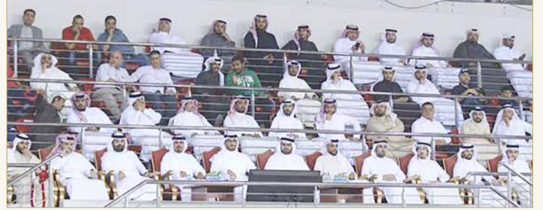
سمو الشيخ عيسى بن سلمان يشهد المباراة إلى جانب سمو الشيخ عيسى بن علي