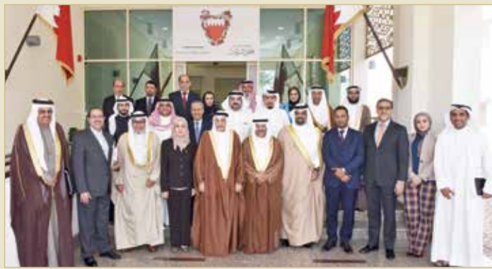
صورة جماعية للجنة الماليتين وممثلي الحكومة

وقدم وزير المالية والاقتصاد الوطني، عرضاً شرح خلاله القواعد المالية والأسس التي بُنيت عليها تقديرات الميزانية العامة المستندة في مجملها على ركيزتي برنامج عمل الحكومة وبرنامج التوازن المالي. وأشار في العرض إلى أن الحكومة وضعت المواطن واستدامة الخدمات الحكومية نصب أعينها في جميع مراحل إعداد الميزانية. كما ارتكزت على أسس مهمة منها حفظ مبالغ برامج الدعم النقدي المباشر للمواطنين لكل سنة مالية في بند الدعم الحكومي، ورصد ميزانيات تشغيلية تفوق تلك المرصودة في ميزانية (2017-2018) لوزارات التربية والتعليم، والصحة، والخارجية، وشؤون الشباب والرياضة، وأن الميزانية تستهدف خفض العجز في السنة المالية 2019 إلى 708 ملايين دينار أي بنسبة 46 % مقارنة بالسنة المالية 2018.