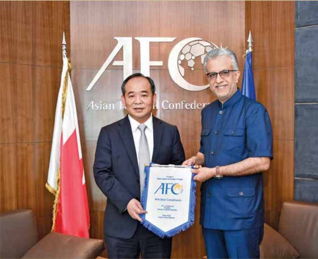
فيتنام أحد الداعمين لمرشح الوطن

تعالى أصوات الاتحادات الوطنية المؤيدة للشيخ سلمان بن إبراهيم آل خليفة لرئاسة الاتحاد الآسيوي لكرة القدم، وهو ما يعكس قوته على الساحة الآسيوية وثقة الاتحادات به ليكون على رأس الاتحاد القاري لولاية جديدة في الانتخابات التي ستجرى 6 أبريل المقبل في العاصمة الماليزية كوالالمبور.