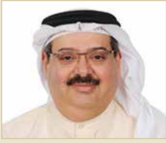
الشيخ نواف بن إبراهيم