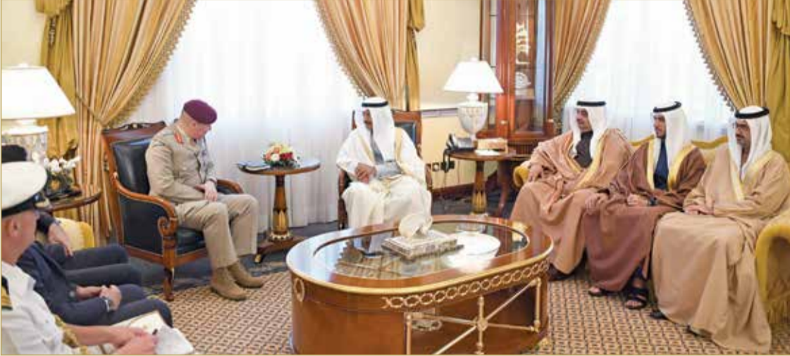
سمو رئيس الوزراء مستقبلاً كبير مستشاري الدفاع للشرق الأوسط بالمملكة المتحدة

◆ سمو رئيس الوزراء: تحالفنا مع بريطانيا إحدى الركائز لضمان الأمن بالمنطقة