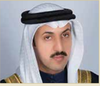
الشيخ عبدالله بن أحمد