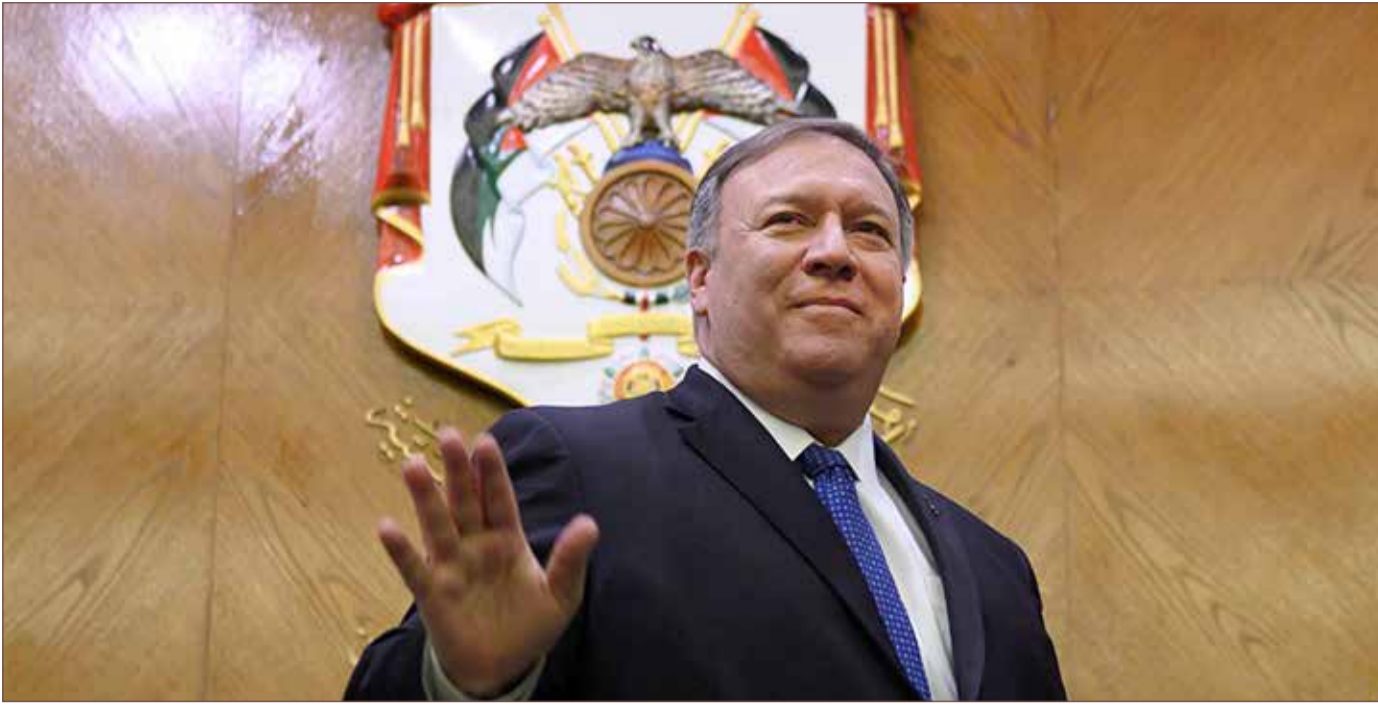
وزير الخارجية الأمريكي مايك بومبيو

واشنطن - رويترز غيرت وزارة الخارجية الأميركية وصفها المعتاد لمرتفعات الجولان، من "التي تحتلها إسرائيل" إلى "التي تسيطر عليها إسرائيل". في تقريرها السنوي العالمي لحقوق الإنسان. كما لم يشر قسم منفصل من التقرير خاص بالضفة الغربية وقطاع غزة، وهما منطقتان احتلتها إسرائيل إلى جانب مرتفعات الجولان في حرب عام 1967، إلى أن تلك الأراضي "محتلة" أو "تحت الاحتلال". ويرر مسؤول بالوزارة التغيير الجديد، قائلا في تصريح لـ"رويترز" إن "كلمة محتلة لم تستخدم لأن تقرير الخارجية ركز على حقوق الإنسان وليس القضايا القانونية". وتابع المسؤول بوزارة الخارجية: "لا تغيير في السياسة الأميركية بشأن وضع الأراضي الفلسطينية".