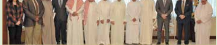
رئيس وأعضاء مجلس الإدارة

◆ مجلس الإدارة يعتمد نسب الملكية الجديدة