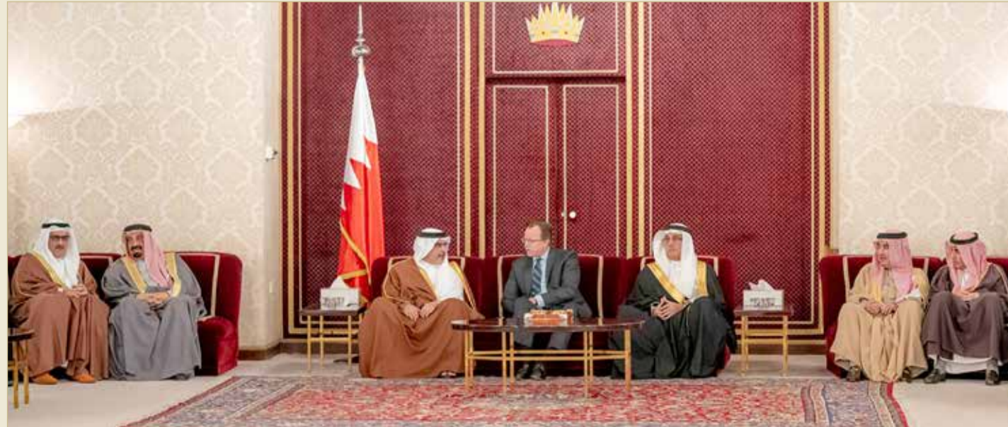
سمو نائب جلالة الملك مستقبلاً رواد مجلسه الأسبوعي

وقد رحب سموه برواد مجلسه الأسبوعي الذي يجسد صوراً من صور التواصل الذي يحرص عليه عاهل البلاد صاحب الجلالة الملك حمد بن عيسى آل خليفة تكريماً لنهج المجتمع وسنة الآباء والأجداد، وترجمةً للروح الأصيلة للمجتمع البحريني ونسجته وهويته الجامعة. وقد أثنى الحضور على حرص سموه