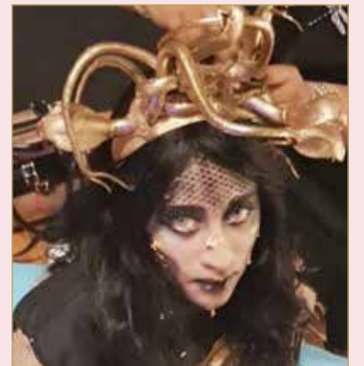
الملابس تلعب دورا كبيرا ومهما في نوعية الشخصيات