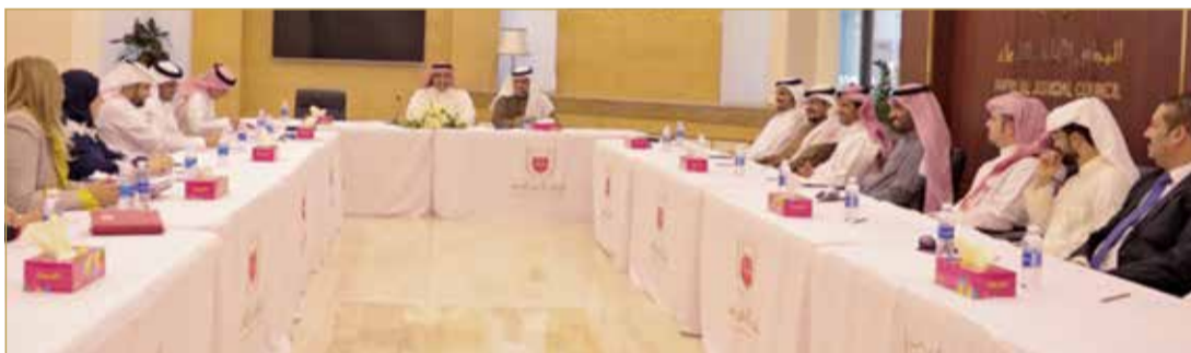
رئيس الإشراف القضائي يترأس الاجتماع

يذكر أن رئيس نيابة الجرائم الإرهابية المحامي العام المستشار أحمد الحمادي، كان قد صرح في وقت سابق من شهر نوفمبر 2018 بأن المحكمة الكبرى الجنائية الرابعة قد أصدرت حكماً على 5 متهمين عن تهم الشروع في القتل تنفيذاً لغرض إرهابي، وحباسة وإحراز أسلحة ومفرفعات بغير ترخيص من وزير الداخلية تنفيذاً لغرض إرهابي، والتدريب والتدريب على استعمال الأسلحة والمفرفعات تنفيذاً لغرض إرهابي، وإعطاء أموال لفرد خارج البلاد يمارس نشاطاً إرهابياً، بمعاقبة المتهمين الأول والثاني (المستأنفان) والرابع بالسجن المؤبد وغرامة 500 دينار، وبمعاقبة المتهم