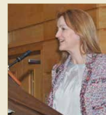
الفائزة من هولندا

مشوقة وجذابة. كما قدمت الفائزة من هولندا عرضاً حول مشروع CAN NOT WAIT TO LEARN (أتوق إلى التعلم)، والذي يهدف إلى توفير فرص التعلم لملايين الأطفال المحرومين من التعليم والمتواجدين