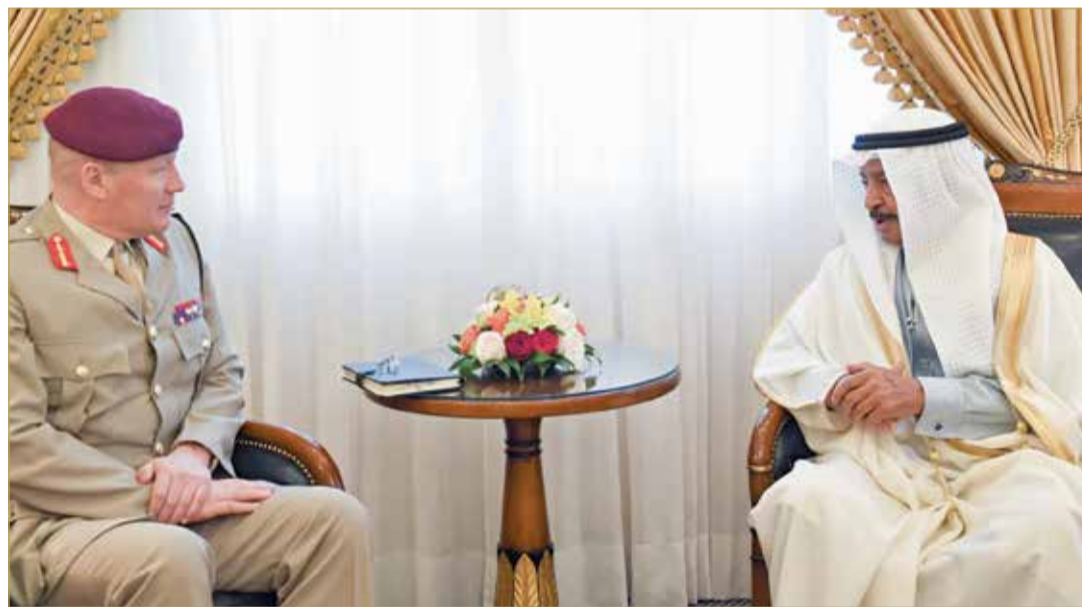
سمو رئيس الوزراء مستقبلاً كبير مستشاري الدفاع للشرق الأوسط بالملكة المتحدة

♦ سمو رئيس الوزراء: تحالفنا مع بريطانيا ركيزة لضمان أمن المنطقة