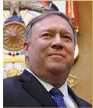
وزير الخارجية الأميركي

أكد وزير الخارجية الأميركي مايك بومبيو في أسبوع "سيرا-للاطاقة، العزم على الوصول بصادرات نفط إيران إلى الصفر.