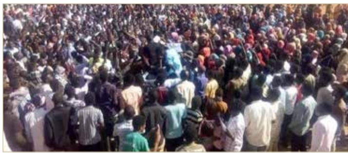
الاحتجاجات بدأت في السودان أواخر العام الماضي

أعلنت الحكومة السودانية عن تشكيلها الوزارية، أمس الأربعاء، تزامناً مع دعوات العصيان المدني، الذي دعا إليه تجمع المهنيين السودانيين. وأعلن رئيس الوزراء السوداني محمد طاهر إيلا، خلال مؤتمر صحفي، في العاصمة الخرطوم عن تشكيل الحكومة الجديدة.