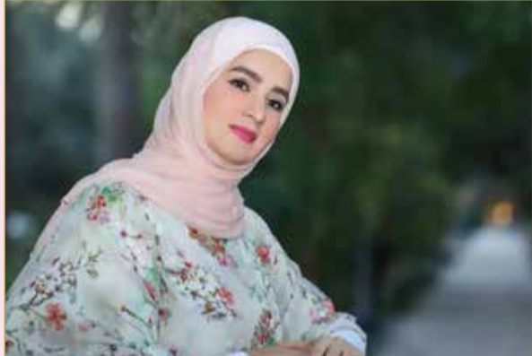
طريق الفن مليء بالمنعطفات والتحديات

لا شك أن هناك شخصيات تتطلب أزياء خاصة ودائما يكون التعامل معها صعبا حديثنا عن أصعب الشخصيات؟