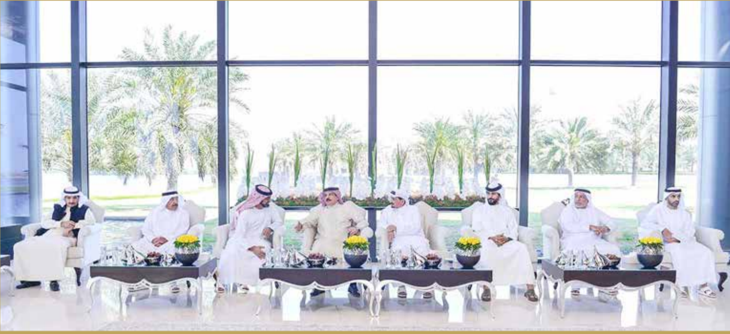
جلالة الملك ملتقيا عضو المجلس الأعلى حاكم عجمان صاحب السمو الشيخ حميد بن راشد النعيمي