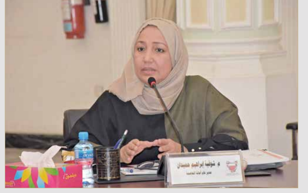
المدير العام لأمانة العاصمة شوقية حميدان

ولفتت إلى أن حملات عمليات ضبط المخالفين مازالت مستمرة من خلال رصد بعض المواقع التي يكثر فيها الباعة الجائلون، كما تم تثبيت مفتش دائم للمناطق التي تكثر فيها المخالفات، حيث يتم ضبط عدد من المخالفات في موقع واحد على فترات.