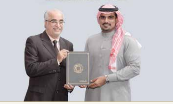
من تقديم الرعاية

التتان يعرب عن سرور البنك لدعم الحدث الرياضي المميز