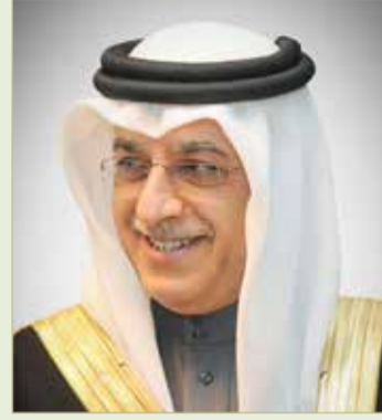
سلمان بن إبراهيم

البحرينية على الساحة الآسيوية، كما أنه يتوج جهود الاتحاد البحريني لكرة القدم في تهنية الأرضية الصلبة التي مهدت الطريق لتحقيق التأهل للحدث القاري الكبير. وأشار إلى أن الإنجاز يجسد عطاء وإخلاص لاعبي المنتخب وأفراد الجهازين الفني والإداري على امتداد منافسات التصفيات. وجدد الشيخ سلمان بن إبراهيم تقديم التهاني للشيخ علي بن خليفة، متمنياً دوام التوفيق والنجاح لرئيس الاتحاد البحريني لكرة القدم في خدمة مسيرة الكرة البحرينية على مختلف الأصعدة.