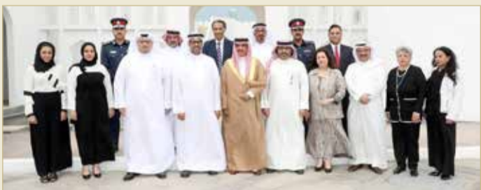
وزير الداخلية مستقبلا أعضاء لجنة إعداد وصياغة الخطة الوطنية

المبادرات السبعين التي تتضمنها الخطة التي ستعمل اللجنة التنفيذية على متابعة وضعها موضع التنفيذ بالتنسيق مع الجهات المعنية والفعاليات المجتمعية. من جهتهم، عبر أعضاء لجنة إعداد وصياغة الخطة الوطنية عن شكرهم وتقديرهم لهذه اللجنة الكريمة من وزير الداخلية، وتوجهاته حظيت به الخطة الوطنية من جانب فئات المجتمع وأطرافه. وأوضح أن التفاعل مع أهداف الخطة الوطنية والثوابت التي استندت عليها، يمثل بادرة إيجابية لتنفيذ