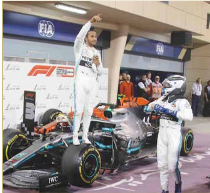
احتفال هاميلتون

توج البريطاني لويس هاميلتون سائق فريق ميرسيدس بجائزة البحرين الكبرى لطيران الخليج للفورمولا وان 2019، بعد سباق مثير استطاع من خلاله التقدم على سائقي فيراري تشارلز لوكلير وسيباستيان فيتل وكذلك زميله في الفريق فاليري بوتاس الذي حل ثانياً. وفي الوقت الذي كانت الجماهير تنتظر فيه تتويج الفيراري بأول انتصار لهم في الموسم، تعرض سائقي الحصان لمشكلتين اضطرتهما للتراجع إلى المركزين الثالث والخامس.