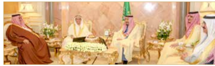
خادم الحرمين الشريفين مستقبلاً سمو الشيخ محمد بن مبارك

وإجراء استعراض أعمال القمة والقضايا المدرجة على جدول أعمالها مع تأكيد أهمية خروجها بقرارات ونتائج تعزز العمل العربي المشترك والتضامن تجاه ما تواجهه الأمة العربية من تحديات وأخطار تهدد حاضرها ومستقبلها وأمنها واستقرارها ووحدة أراضي دولها.