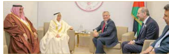
ملك الأردن مستقبلاً سمو الشيخ محمد بن مبارك

أخوية وثيقة وتنسيق وتشاور فيما يتعلق بمصالحهما المشتركة والقضايا ذات الاهتمام المشترك. كما جرى استعراض جدول أعمال القمة والقضايا المدرجة.