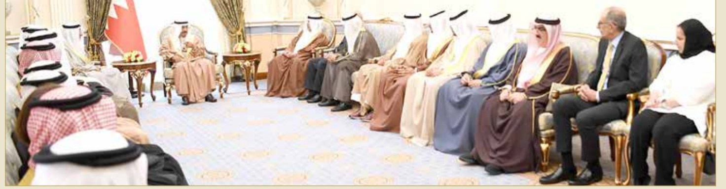
سمو رئيس الوزراء يستقبل وزير الصناعة والتجارة ورئيس غرفة التجارة

سيرة مشرفة للقطاع التجاري عبر إسهاماته الرائدة بكل مراحل التنمية