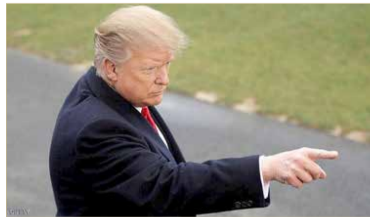
الرئيس الأميركي دونالد ترامب

النظام يدفع ثمنا كبيرا جراء "أساليبه الشريرة"