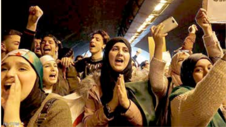
مظاهرات ضخمة تشهدها الجزائر منذ أكثر من شهر

الجيش، كما حمل المتظاهرون لافتات مكتوب عليها "الجيش والشعب خاوة خاوة" (أخوة).