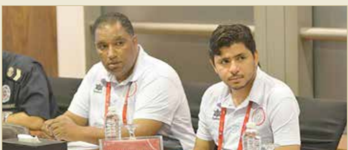
حضور ممثلي نادي المالكية للاجتماع الفني