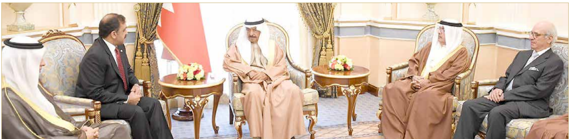
سمو رئيس الوزراء مستقبلاً السفير الباكستاني