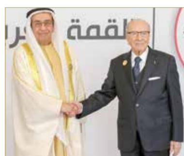
الرئيس التونسي مستقبلاً سمو الشيخ محمد بن مبارك

استقبل رئيس الجمهورية التونسية الشقيقة الباجي قائد السبسي، نائب رئيس مجلس الوزراء سمو الشيخ محمد بن مبارك آل خليفة، رئيس وفد مملكة البحرين المشارك في أعمال القمة العربية في تونس. ونقل سمو الشيخ محمد بن مبارك آل خليفة تحيات عاهل البلاد صاحب الجلالة الملك حمد بن عيسى آل خليفة، ورئيس الوزراء صاحب السمو الملكي الأمير خليفة بن سلمان آل خليفة، وولي العهد نائب القائد الأعلى النائب الأول لرئيس مجلس الوزراء صاحب السمو الملكي الأمير سلمان بن حمد آل خليفة، وتمنياتهم بموفور الصحة والرئيس التونسي ومزيداً من التقدم والرخاء لتونس الشقيقة في ظل قيادته الحكيمة. كما هنا سموه الرئيس السبسي بتولي تونس رئاسة القمة العربية مع تأكيد أن ذلك سيعزز من التضامن فيما بين الدول العربية ومسيرة عملها المشترك في ظل ما تحظى به تونس من مكانة إقليمية ودولية. وجرى في اللقاء استعراض لجدول أعمال القمة.