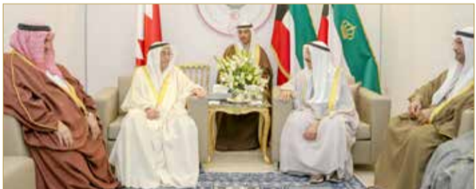
سمو أمير دولة الكويت مستقبلاً سمو الشيخ محمد بن مبارك

التي تعقد في تونس والتأكيد على أهمية وحدة الصف وتعزيز التضامن والعمل العربي المشترك في وجه الأخطار والتحديات التي تهدد أمن واستقرار الدول العربية ووحدة أراضيها وشعبها.