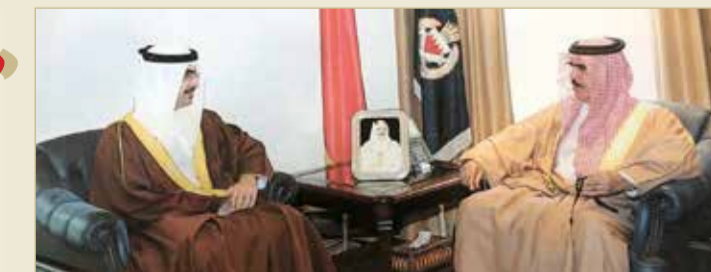
وزير الداخلية مستقبلا سمو محافظ الجنوبية

الإشادة بجهود سمو محافظ الجنوبية في دعم التعاون بين البلدين