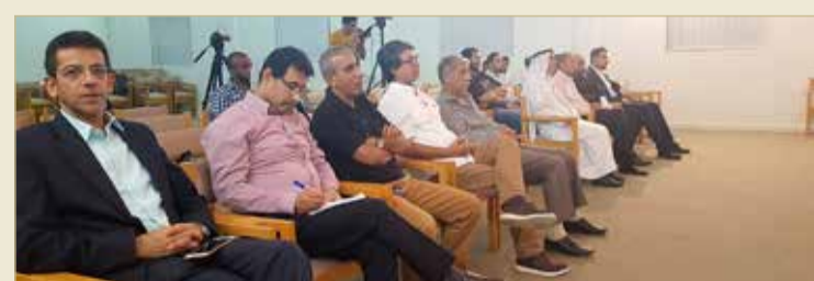
الأمين العام وقيادات الاتحاد والحضور

18 ألف دينار كلفة 150 ألف عامل بحريني في الدّين العام