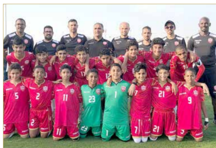
منتخب الأشبال لكرة القدم