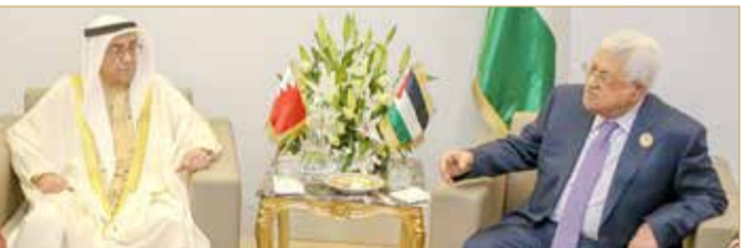
سمو الشيخ محمد بن مبارك ملتقياً الرئيس الفلسطيني

التقدم والرخاء. وتم استعراض القضايا المطروحة على القمة العربية في إطار التشاور بين البلدين الشقيقين خصوصاً فيما يتعلق بالقضية الفلسطينية.