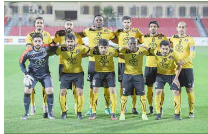
لقاء وحيد يجمع مدينة عيسى مع الأهلي على استاد مدينة خليفة الرياضية مساء اليوم

تطلق اليوم (الثنين) منافسات الجولة 14 لدوري الدرجة الثانية لكرة القدم، بإقامة لقاء وحيد يجمع مدينة عيسى مع الأهلي على استاد مدينة خليفة الرياضية عند 6 مساءً. ويسعى الأهلي لمواصلة نتائجه الإيجابية والبقاء دون خسارة حتى الآن حينما يضرب موعداً قوياً