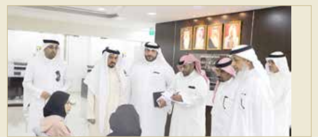
من زيارة لجنة التحقيق النيابية في البحرية لوزارة العمل