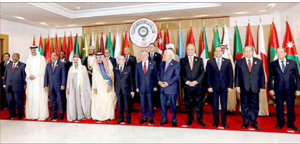
صور جماعية لقيادة والزعماء المشاركين في القمة

أبو الغيط: تدخلات إيران وتركيا تفاقم الأزمات العربية