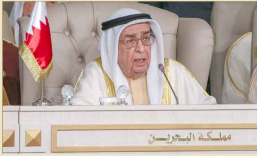
تونس - بنا

وجه عاهل البلاد صاحب الجلالة الملك حمد بن عيسى آل خليفة كلمة إلى القمة العربية في دورتها العادية الثلاثين التي انعقدت في الجمهورية التونسية أمس، ألقاها نيابة عن جلالتة نائب رئيس مجلس الوزراء سمو الشيخ محمد بن مبارك آل خليفة لدى ترؤس سموه وفد مملكة البحرين المشارك في أعمال القمة. وأعرب جلالة الملك في كلمته عن خالص تمنياته لرئيس الجمهورية التونسية الشقيقة الباجي قائد السبسي بالتوفيق والسداد، وللجمهورية التونسية وشعبها مزيداً من التقدم والازدهار والنماء.