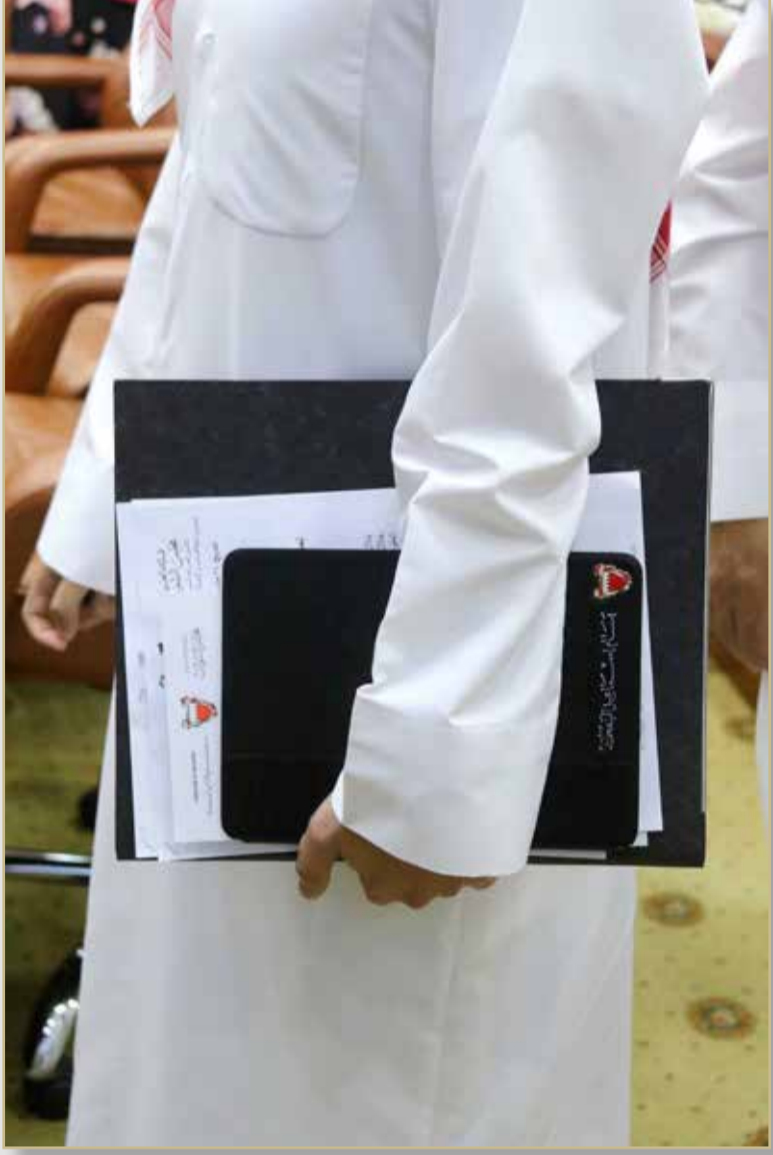
مفكرة ومراجع تشريعية بيد عضو بمجلس الشورى