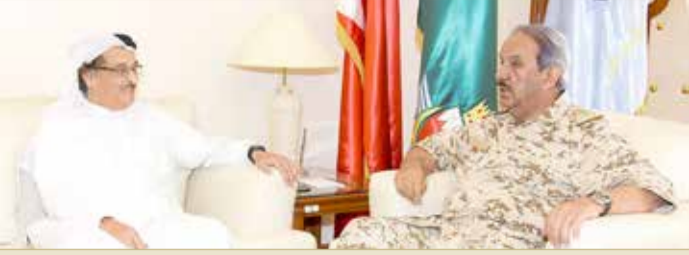
الرفاع - القيادة العامة لقوة الدفاع

استقبل القائد العام لقوة دفاع البحرين المشير الركن الشيخ خليفة بن أحمد آل خليفة في مكتبه بالقيادة العامة صباح أمس، رئيس المجلس الأعلى للصحة الفريق طبيب الشيخ محمد بن عبدالله آل خليفة. ورحب القائد العام لقوة الدفاع، برئيس المجلس الأعلى للصحة، متمنياً للجهود الطيبة المبذولة التي يقدمها المجلس الأعلى للصحة لتطوير وتحسين جودة الخدمات الصحية المقدمة لمواطني ومقيمي مملكة البحرين.