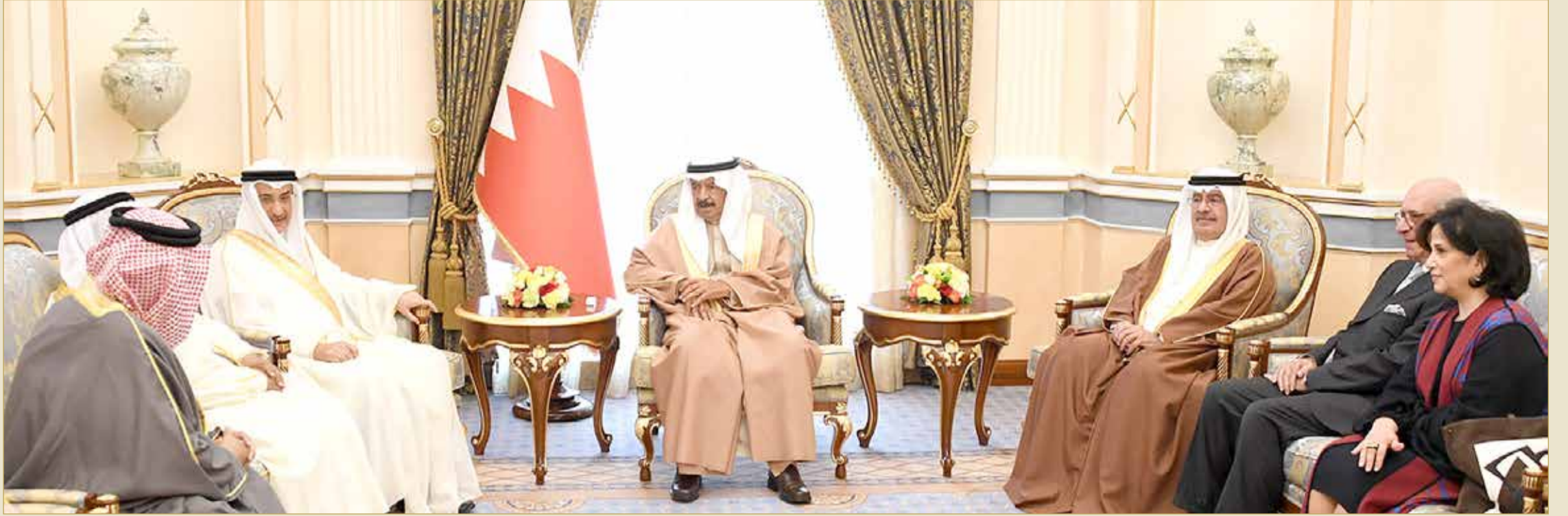
سمو رئيس الوزراء مستقبلاً عدداً من أفراد العائلة المالكة الكريمة والمسؤولين

◆ سمو رئيس الوزراء: القطاع الصحي في البحرين يحظى بكل الدعم والاهتمام