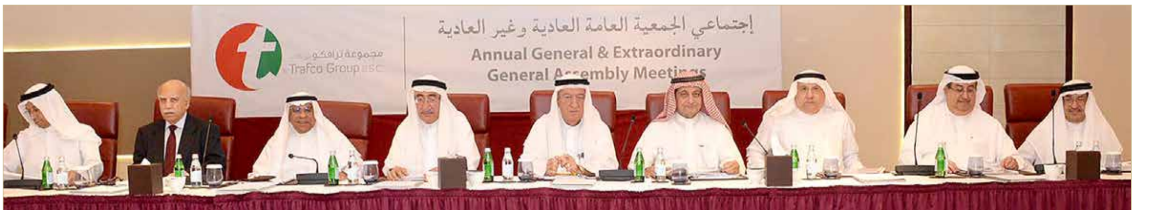
اجتماع عمومية "ترافكو"

البحرين للمواشي" تستورد اللحوم المبردة من كازاخستان