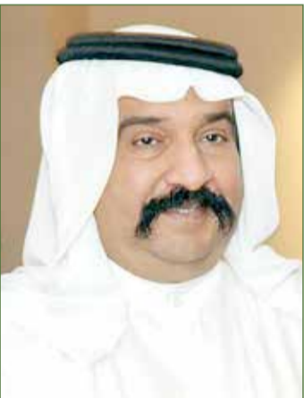
سمو الشيخ أحمد بن محمد