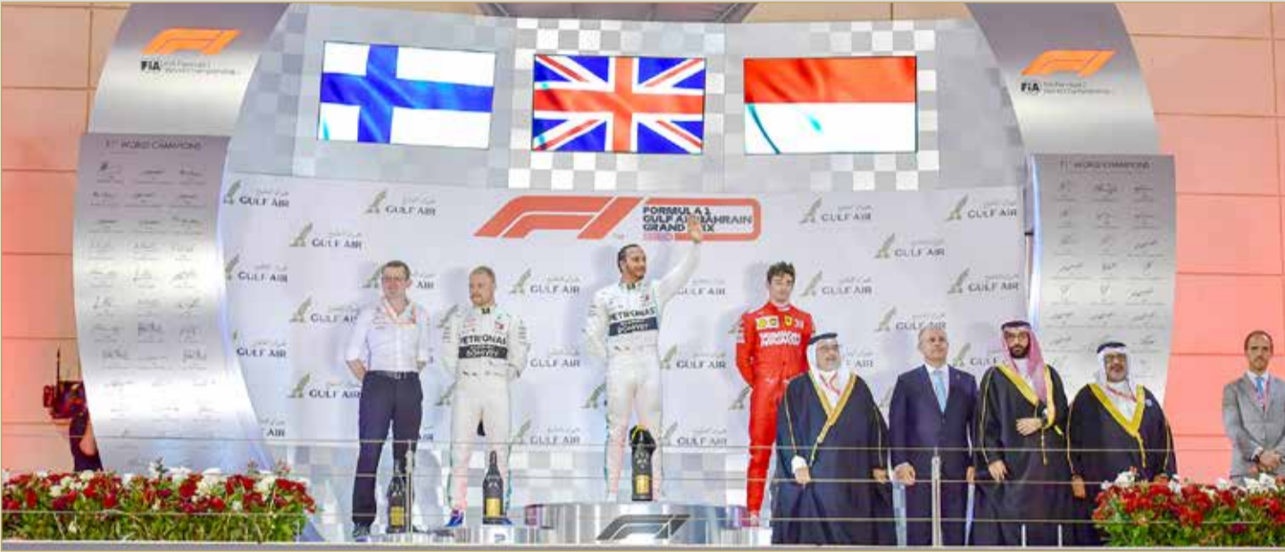
سمو ولي العهد يتوج هاميلتون بلقب جائزة البحرين الكبرى لطيران الخليج للفورمولا 1 2019

سمو ولي العهد يتوج الفائزين ويؤكد أن الكوادر الوطنية الثروة الحقيقية