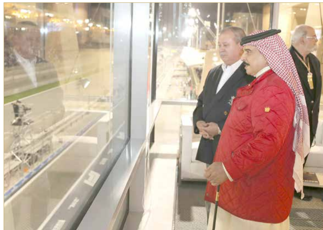
جلالة الملك يشهد ختام سباق جائزة البحرين الكبرى لطيران الخليج للفورمولا 1

«الكلبة» تسجل رقما قياسيا باستقطاب 97 ألفا لأكبر حدث رياضي