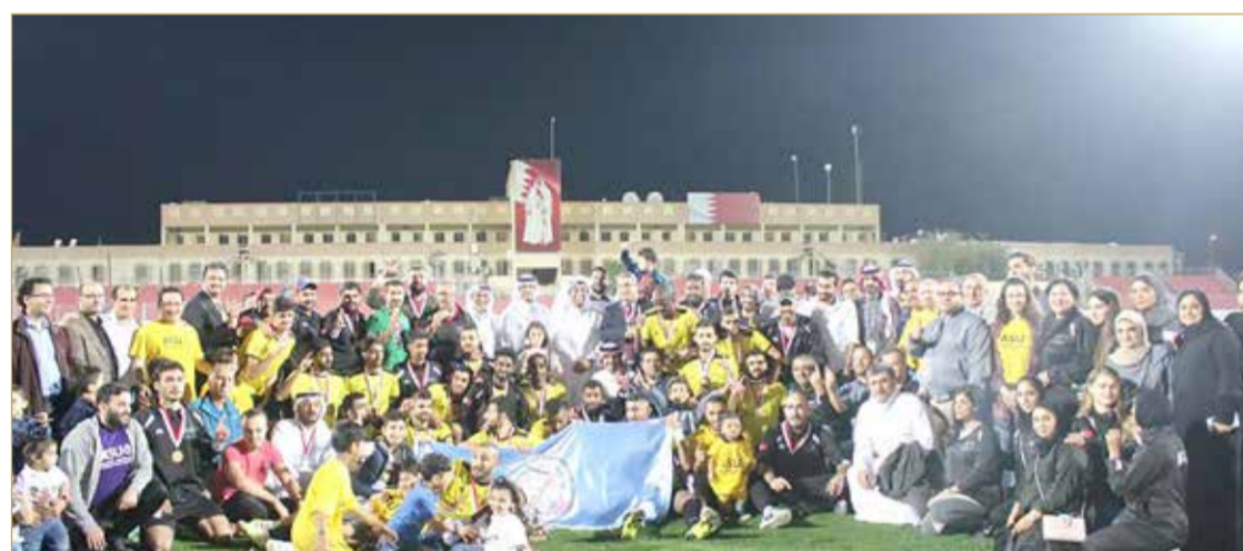
فريق جامعة العلوم التطبيقية

◆ أبطال دوري الجامعات الوطني الأول لكرة القدم