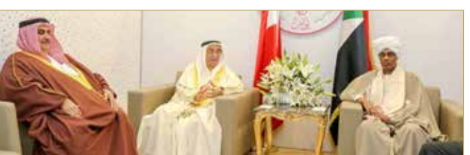
سمو الشيخ محمد بن مبارك مستقبلاً النائب الأول لرئيس السودان