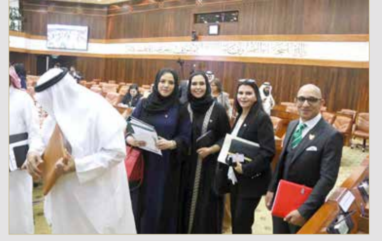
منفردى والجيب والفاضل والفضالة بعد نهاية الجلسة

ويهدف المرسوم بقانون إلى إدخال بعض التعديلات على دور ومهام وواجبات هيئة التشريع والإفتاء القانوني؛ لسد الفراغ التشريعي المتعلق بعدم وجود جهة تتولى الفصل في اختلاف وجهات النظر الحاصل بين الوزارات أو بين المؤسسات أو الهيئات العامة سواء فيما بينها أو مع غيرها، إلى جانب تعزيز مكانة الاختصاص بإبداء الرأي القانوني، بحيث يكون في المسائل ذات الأهمية التي تحال إلى الهيئة من