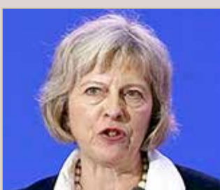
رئيسة الوزراء تيريزا ماي

الخيارات محدودة أمام بريطانيا فيما يتعلق بالخروج من التكتل وإنه يتعين على النواب مساندة اتفاق الخروج الذي توصلت إليه ماي لتجنب الانسحاب دون اتفاق أو عدم الانسحاب من أساسه. ورفض البرلمان اتفاق ماي للمرة الثالثة يوم الجمعة. ومن المقرر أن تترك بريطانيا الاتحاد دون اتفاق يوم 12 أبريل إذا لم يوافق البرلمان على أي اتفاق أو يسعى لتمديد فترة الخروج.