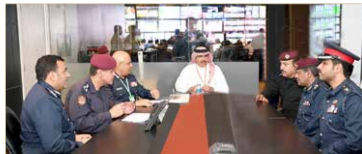
وزير الداخلية يتفقد غرفة العمليات في الحلبة

الدولية، عن شكره لرجال الشرطة في كل مواقعهم وأدائهم واجهم بمهنية والالتزام بالقانون، ما ساهم في إنجاح هذا الحدث الرياضي العالمي، الذي يعزز من مكانة البحرين على خريطة تنظيم