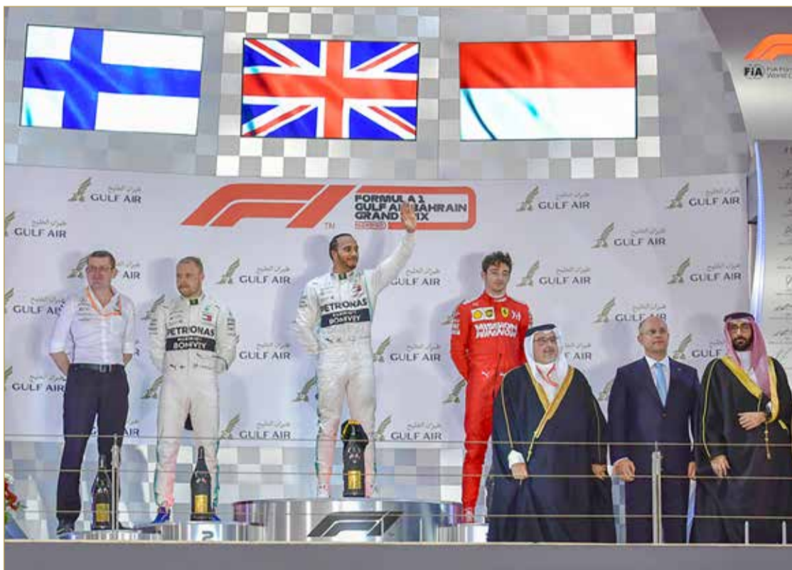
سمو ولي العهد بنوع البريطاني لويس هاميلتون بالمركز الأول

هاميلتون يكسب تحدي جائزة البحرين... وسمو ولي العهد يتوج الفائزين