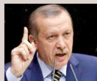
رجب طيب أردوغان

قد يفقد السيطرة على العاصمة أنقرة وحتى إسطنبول، أكبر مدن البلاد، مما قد يشكل ضربة انتخابية لأردوغان. وفي ظل انكماش الاقتصاد عقب أزمة العملة العام الماضي عندما فقدت الليرة ما يزيد عن 30 بالمئة من قيمتها، بدأ بعض الناخبين على استعداد لمعاوية أردوغان. ويحق لما يربو عن 57 مليون شخص الإدلاء بأصواتهم. وستتضح الصورة بشأن الفائزين على الأرجح بحلول منتصف الليل.