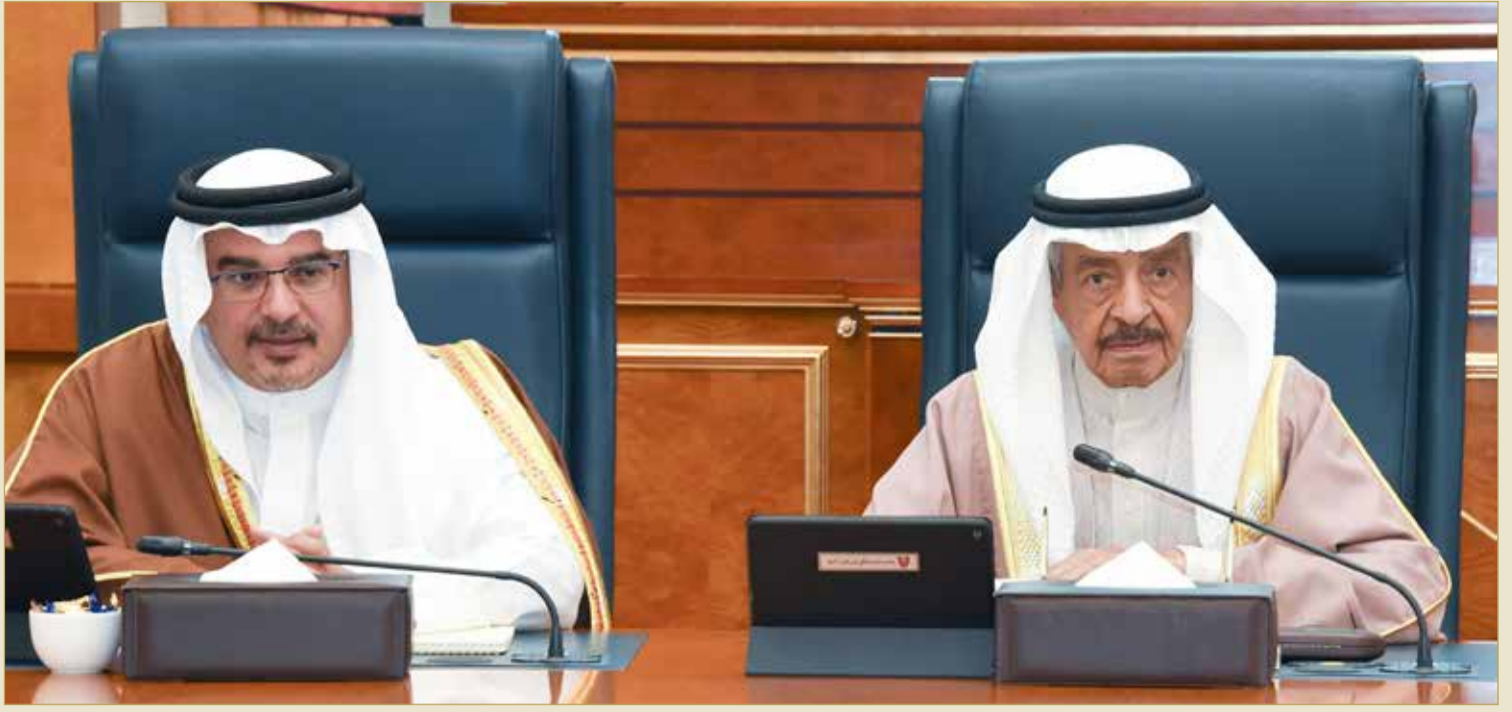
سمو رئيس الوزراء يترأس، بحضور سمو ولي العهد، جلسة مجلس الوزراء

الموافقة على إلغاء رسوم 83 خدمة مقدمة من 10 وزارات وهيئات حكومية