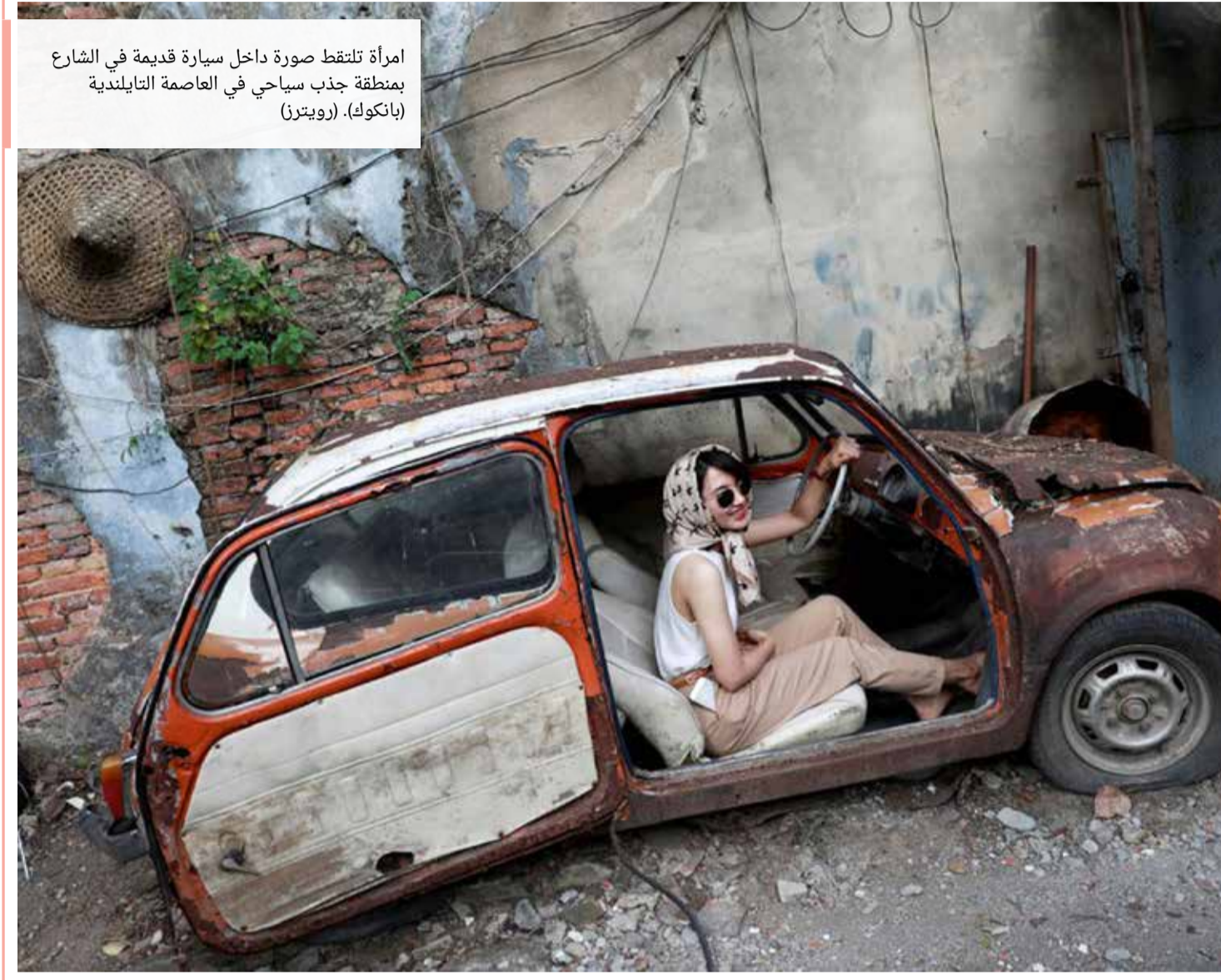
امرأة تلتقط صورة داخل سيارة قديمة في الشارع بمنطقة جذب سياحي في العاصمة النابليدية (باتوكول).