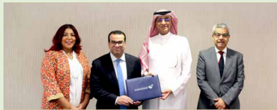
تقديم الرعاية الذهبية لـ "مئوية المصارف"

أعلنت جمعية مصارف البحرين دخول شركة البحرين للتسهيلات التجارية راعياً ذهبياً للاحتفالية البحرية بمرور 100 عام على تأسيس القطاع المصرفي، والتي تقيمها الجمعية تحت رعاية رئيس الوزراء صاحب السمو الملكي الأمير خليفة بن سلمان آل خليفة، وقد جرى الإعلان عنها في أبريل الماضي، وتتضمن جملة من الفعاليات والإصدارات واللقاءات، وصولاً ليوم الاحتفال الرسمي بهذه المناسبة بتاريخ 11 ديسمبر المقبل. وذكرت الجمعية أن هذه الرعاية الذهبية تتضمن أيضاً دعم التسهيلات التجارية لحقل "حقل الاستقبال السنوي لبنوك البحرين" الذي ستعظمه الجمعية في العاصمة الأميركية واشتد تزامنا مع الاجتماعات السنوية لصندوق النقد الدولي المقررة في الفترة من 18 وحتى 20 أكتوبر المقبل. ورحب رئيس الجمعية وحيد القاسم بانضمام شركة البحرين للتسهيلات التجارية لواقعة المؤسسات