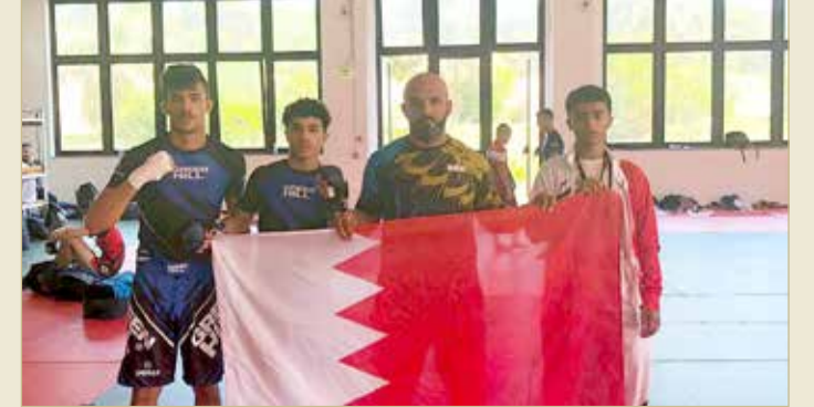
المنتخب الوطني للناشئين لفنون القتال المختلطة

للأعمال الخيرية وشؤون الشباب رئيس المجلس الأعلى للشباب والرياضة سمو الشيخ ناصر بن حمد آل خليفة، وإلى النائب الأول لرئيس المجلس الأعلى للشباب والرياضة رئيس اللجنة الأولمبية البحرينية سمو خالد بن حمد آل خليفة، وإلى رئيس المجلس البحريني للألعاب القتالية سمو الشيخ سلمان بن محمد آل خليفة؛ وذلك بمناسبة إحراز المنتخب الوطني للناشئين لفنون القتال المختلطة الميدالية البرونزية في منافسات بطولة العالم لفنون القتال المختلطة تحت 18 سنة في وزن 52 فنته ب.