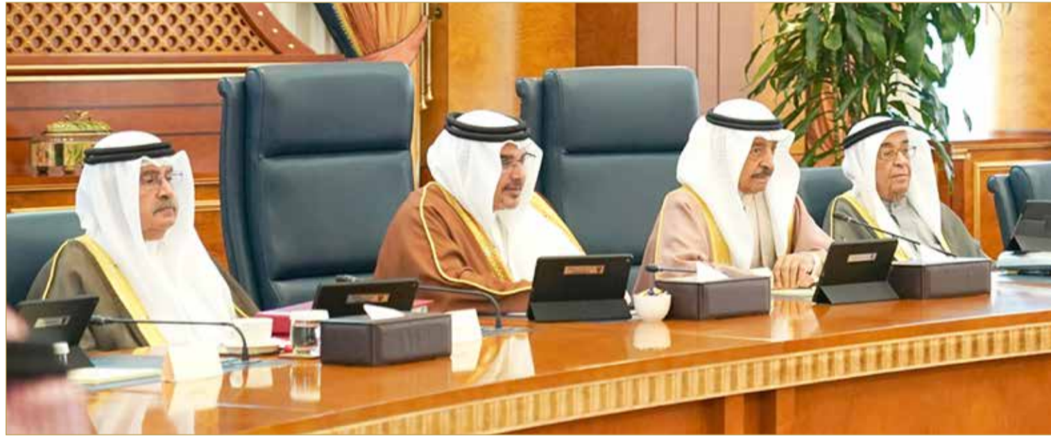
سمو رئيس الوزراء يترأس، بحضور سمو ولي العهد، جلسة مجلس الوزراء

♦ سمو رئيس الوزراء: الاستعانة بأطباء "الخاص" البحرينيين لإجراء العمليات في "السلامانية"