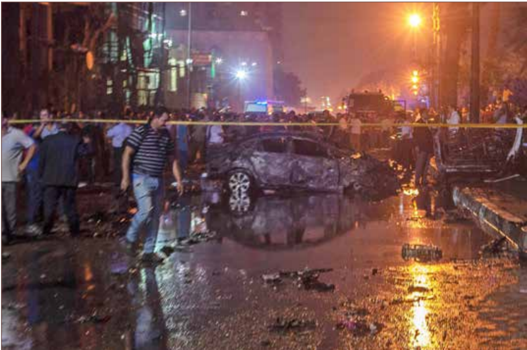
موقع الاعتداء الإرهابي وسط القاهرة

كشفت وزارة الداخلية المصرية في بيان أمس الاثنين أن حركة "حسم" التي تعتبرها السلطات الذراع العسكرية لجماعة الإخوان المسلمين، هي المسؤولة عن تجهيز السيارة المتسببة بانفجار القاهرة ليلة الأحد الذي أسفر عن وقوع 20 قتيلا. وقالت الوزارة في بيانها "توصلت التحريات المبدئية وجمع المعلومات إلى وقوف حركة حسم التابعة لجماعة الإخوان الإرهابية وراء الإعداد والتجهيز لتلك السيارة استعداداً لتنفيذ إحدى العمليات الإرهابية بمعرفة احد عناصرها".