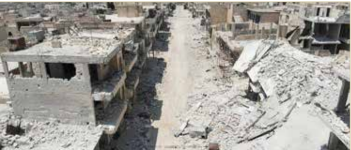
تعرضت إدلب لقصف روسي سوري شبه يومي منذ أبريل

أعلن الجيش السوري، أمس الاثنين، أنه سيستأنف عملياته القتالية في محافظة إدلب، التي تشهد ومحيطها وفقا لإطلاق النار لليوم الرابع على التوالي. وتأتي هذه الخطوة بعد إعلان دمشق موافقتها على هدنة مشروطة بتطبيق اتفاق روسي تركي ينص على إقامة منطقة منزوعة السلاح في محافظة إدلب شمالي سوريا.