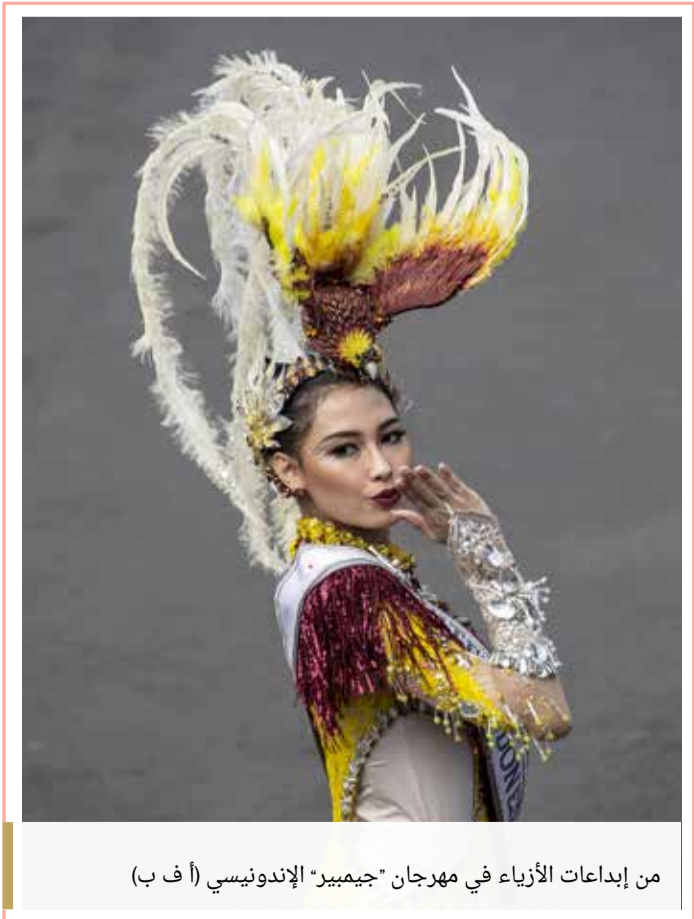
من إبداعات الأزياء في مهرجان "جيمبير" الإندونيسي

« ويعمل فريق الصحة الإلكترونية على مدار الساعة على توفير ومتابعة تطوير وتشغيل هذه الأنظمة والخدمات الإلكترونية الممكنة؛ لتقديم خدمات أكثر أماناً وجودة، وبأداء أعلى كفاءة.