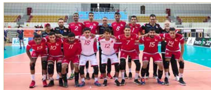
منتخب الكرة الطائرة لفئة الشباب

حقق منتخبنا لكرة الطائرة لفئة الشباب، فوزه الأول في البطولة الآسيوية تحت 23 عامًا، والمقامة حاليا في ميانمار، وذلك على حساب منتخب قطر بنتيجة (3-0)، في المباراة التي جمعتهم، أمس، ضمن منافسات الجولة الثالثة للمجموعة الثالثة.