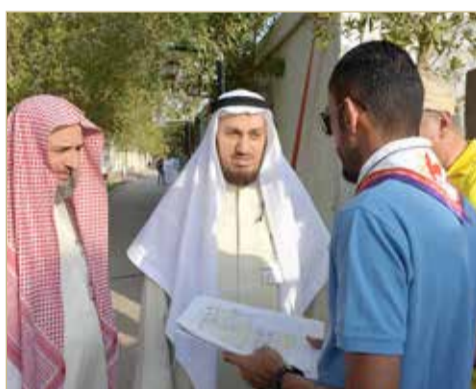
قيادة البعثة تتفقد المخيمات

جال بمدينة الحجاج واطمان على أماكن إقامتهم