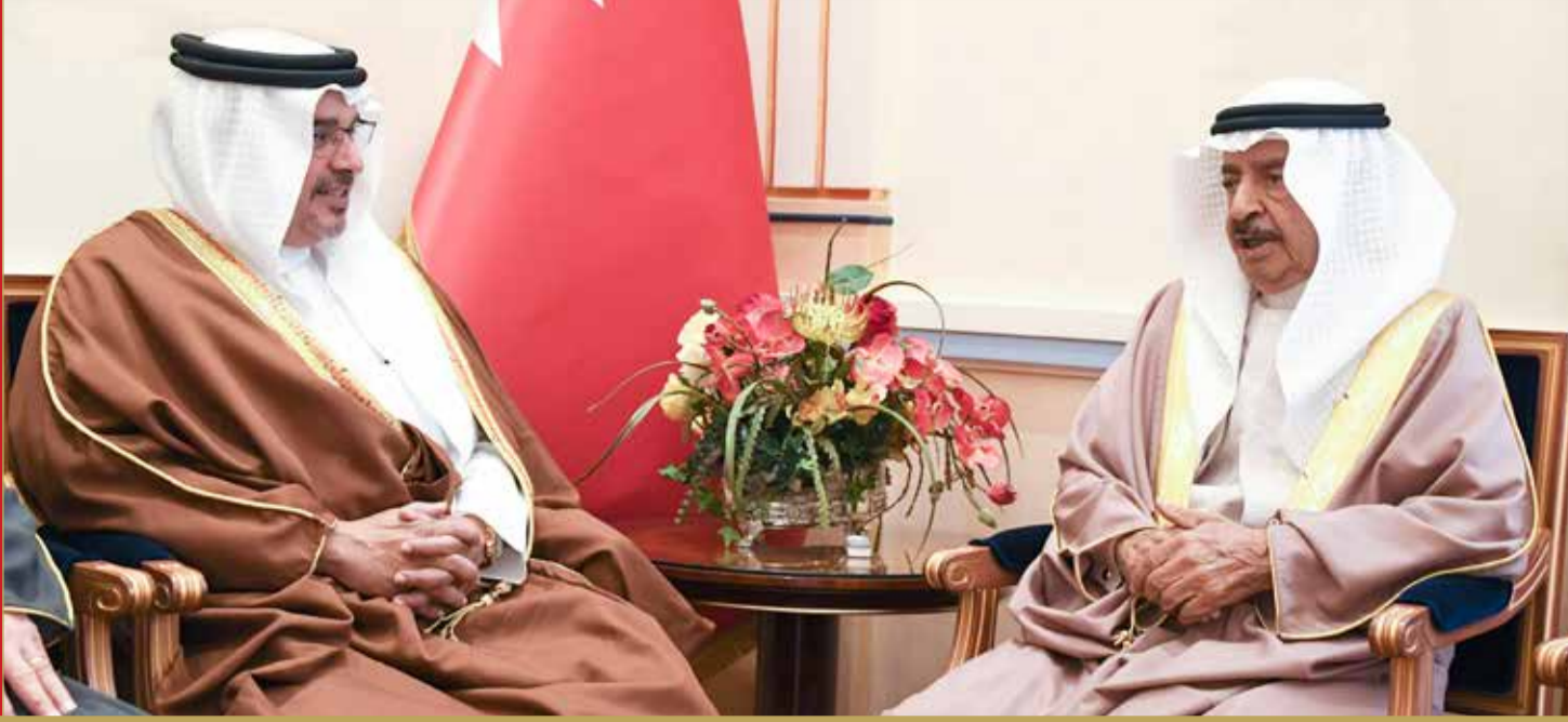
سمو رئيس الوزراء مستقبلا سمو ولي العهد أمس