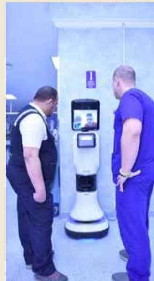
استخدام هذه التقنية الجديدة لخدمة ضيوف الرحمن

تسعى وزارة الصحة في السعودية خلال موسم الحج الحالي، إلى إطلاق تقنية "الروبوت- الآلي للاستشارات الطبية بين الأطباء في المستشفيات والمراكز الصحية في منى والقوافل المتحركة.