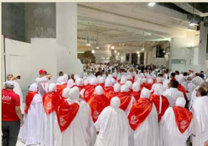
حاجات يستعدن للسعي بين الصفا والمروة