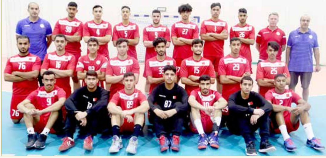
منتخبنا الوطني للناشئين لكرة اليد

خروج النجار من القائمة مونديال مقدونيا بسبب إصابة الرباط