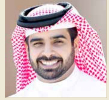
سمو الشيخ سلمان بن محمد

سلمان بن محمد: خالد بن حمد هيا الأضية الصلبة للرياضة ونسير على نهجه الهدف الأكبر بطولة العالم للرجال وسننافس بقوة على صدارتها