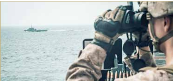
صورة نشرتها قوات المارينز الأمريكية من مضيق هرمز (رويترز)

قالت بريطانيا، أمس الاثنين، إنها ستتضم إلى مهمة بحرية أمنية بقيادة الولايات المتحدة في الخليج لحماية السفن التجارية التي تعبر مضيق هرمز. وباتت حركة مرور ناقلات النفط عبر المضيق محور مواجهة بين واشنطن وطهران وانجرت بريطانيا إلى تلك المواجهة أيضا فيما عززت الولايات المتحدة وجودها العسكري في الخليج منذ مايو.