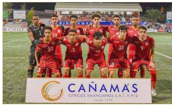
منتخب الشباب لكرة القدم

الإعداد للتصفيات الآسيوية المؤهلة لكأس آسيا للشباب 2020، إذ ستقام التصفيات خلال نوفمبر المقبل، وستلعب مباريات مجموعة منتخبنا الخامسة في البحرين، إذ وقع المنتخب في مجموعة تضم بنغلاديش وبوتان والأردن.