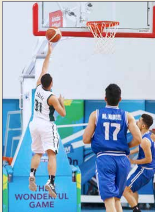
مدينة عيسى و البحرين