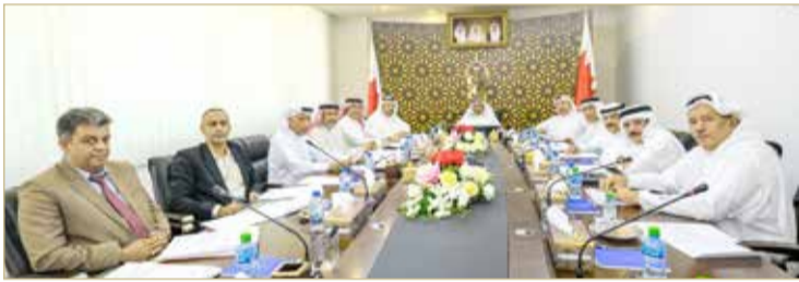
المنامة - الأوقاف الجعفرية

◆ “الجعفرية”: دور كبير لخادم الحرمين في رعاية ضيوف الرحمن