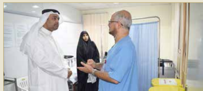
رئيس العيادة بشرح لوكيل الوزارة

ومن ثم التوجه لقسم الصيدلية لاستلام الأدوية. كما يتوفر بالعيادة إسعاف الهلال الأحمر.