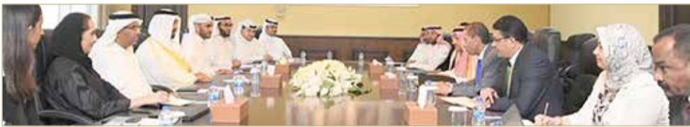
المنامة - وزارة المالية والاقتصاد الوطني

◆ وزير المالية يستعرض التعاون مع “النقد العربي”