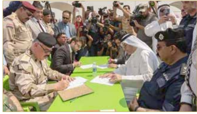
جانب من مراسم النوقع على تسلم الرفات (12)