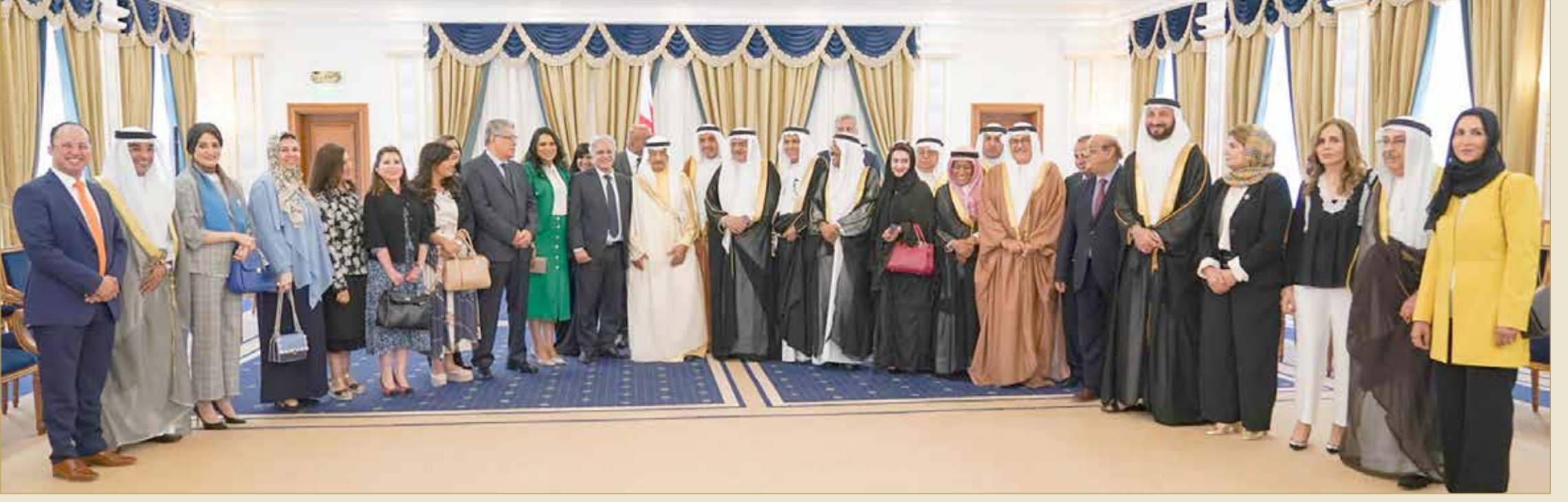
سمو رئيس الوزراء لدى استقباله رئيس وأعضاء مجلس إدارة جمعية المحامين أمين