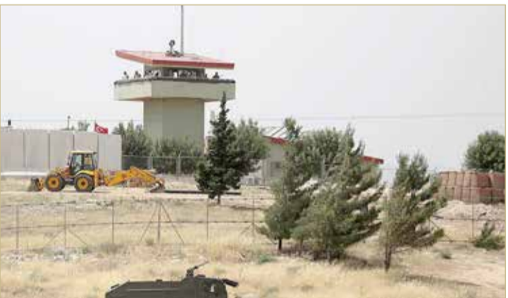
نقطة مراقبة تركية على الحدود التركية السورية

تركيا ترسل تعزيزات جديدة تزامناً مع ارتفاع وتيرة القتال