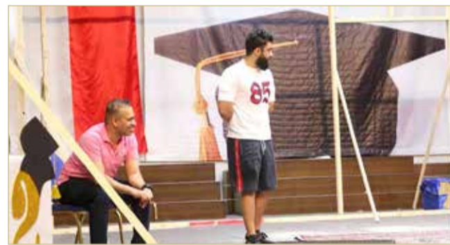
مسرحية عنتر مو ابن شداد

الكوميديا الذي أقيم في أغسطس العام 2017، وهو بلا شك يعتبر أول مهرجان مسرحي يحتفي بالكوميديا وجمهورها في مملكة البحرين. مهما يكن من أمر فإن العروض المناسباتية قد اتسع نطاق نشاطها وبرز مستواها وهناك بعض التجارب الجادة والجيدة.