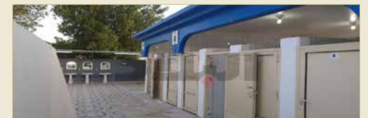
حمامات عامة وحلقها حواجز وضعتها حملة

« أعلنت البعثة عن إطلاق تطبيق ذكي يحمل خرائط إلكترونية للحجاج،