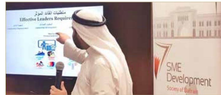
ورشة عمل ريادة الأعمال المنطوقة

الاستراتيجي لرائد الأعمال، ورائد الأعمال كقائد ومؤثر، وحوكمة إدارة الأعمال. وناقش العبدولهاب متطلبات القائد المؤثر والذي يحتاج لعملية اختبار قيادي ضمن مقياس القيادة المتكاملة في التحفيز والتخطيط والتنظيم والتحكم، وكما يتم التطوير القيادي من خلال تدريبات وأنشطة في التنمية العقلية والشخصية ودفع المهارات للتعامل مع مختلف الأنماط