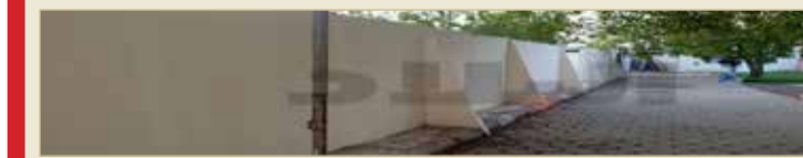
حدود التسوير لحجز الحمامات العامة

« عقيت على رد رئيس البعثة الشيخ عدنان القطان ومن خلال خبرتي بمواسم الحج السنوية أن بعض