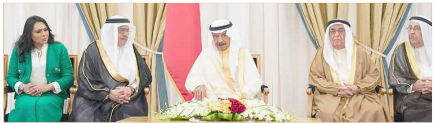
سمو رئيس الوزراء مستقبلاً رئيس وأعضاء مجلس إدارة جمعية المحامين

سمو رئيس الوزراء: نعتز برجال القانون ومهنة المحاماة وتاريخها العريق