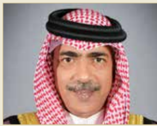
علي بن محمد

على الارتقاء بالرياضة البحرينية إلى أعلى المستويات من خلال تطبيق إستراتيجيات واضحة ومدروسة، كما أعرب عن ثقته التامة بقدرته سموه على تحقيق آمال وتطلعات الأسرة الرياضية والشبابية لما حققه من إنجازات باهرة في ميدان الرياضة ليشكل نموذجاً يحتذى به رياضي وقائد إداري من الطراز الرفيع.