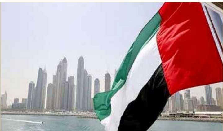
ضغوط أبو ظبي دفعت قطر لسحب إجراءات حظر بيع السلع الإماراتية

بعد تراجع الدوحة وسحب إجراءاتها التمييزية