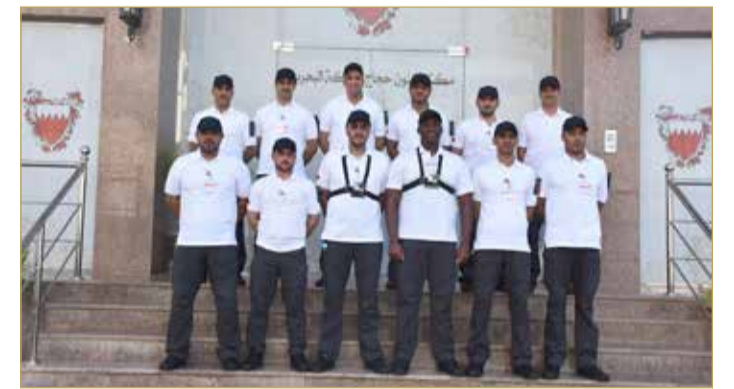
اللجنة الأمنية لبعثة الحج البحرينية (أرشيفية)

وعقدت بعثة البحرين للحج لقاء مع مندوبي التفويج بالحملات. وحصلت "البلاد" من مصادرها على أبرز مجريات الاجتماع. وقال رئيس اللجنة أنهم نظموا دورة عن إرشادات الأمن والسلامة في الحج بالأكاديمية الملكية للشرطة، وحضرها أفراد