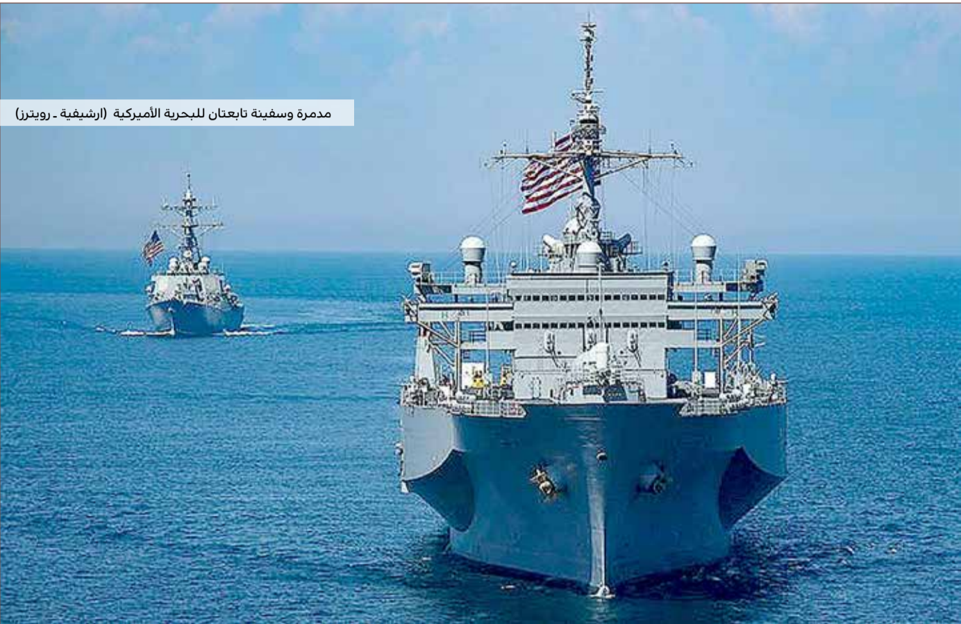
مدمرة وسفينة تابعان للبحرية الأمريكية

حشت الناقلات التجارية على إبلاغها بنقاط توقفها مسبقاً