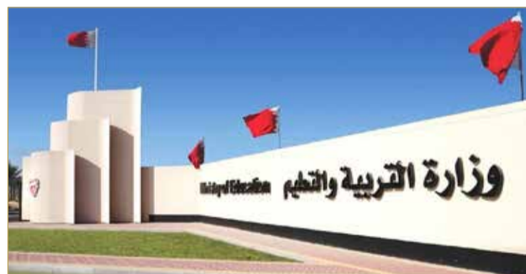
"التربية" ندعو الطلبة لمراجعة موقع الوزارة اعتباراً من اليوم

شواغر في الخطة لأصحاب المعدلات التراكمية من 90% فأكثر