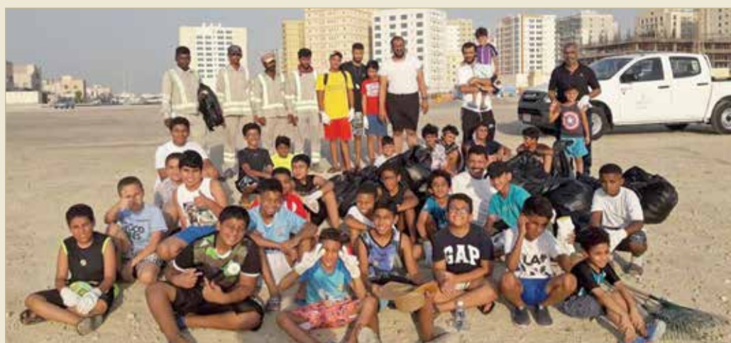
البلاد | محرر الشؤون المحلية

شاركة مجموعة من الأطفال في منطقة البسيطين بمحافظة المحرق بحملة تنظيف للساحل ضمن برنامج “إشراق صيف 2” الذي تنظمه جمعية “الفاروق الخيرية” للأطفال الذين تتراوح أعمارهم بين 6 و13 سنة.