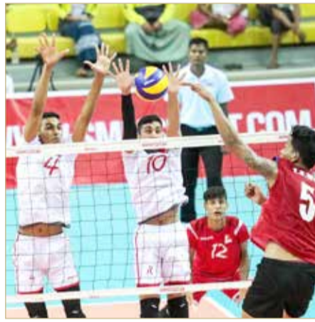
من لقاء منتخبنا وميانمار

نجح منتخبنا لكرة الطائرة لفئة الشباب، في تحقيق فوز ثمين ومهم على حساب منتخب ميانمار بنتيجة (3-0)، في اللقاء الذي جمعهما، أمس، ضمن المباريات الترتيبية في البطولة الآسيوية تحت 23 عاماً، والمقامة حالياً في ميانمار وتستمر حتى 11 أغسطس الجاري.