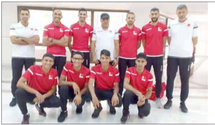
منتخب الرجال والناشئين للشواطئ

(الرجال والناشئين) نظمه الاتحاد على الملاعب الرملية الشهر الماضي. وسيعقد الاجتماع الفني للمنتخبات المشاركة يوم غد الإثنين 19 أغسطس الجاري، والذي سيتم خلاله اعتماد جدول المنافسات وأهلية اللاعبين والوان القمصان وتنسيق تدريبات المنتخب على الملاعب المعتمدة. ويتطلع منتخب الرجال لتحقيق نتيجة إيجابية بعد أن حقق المركز الثاني