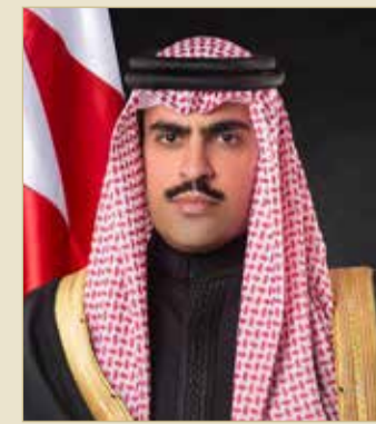
الشيخ عبدالله بن راشد