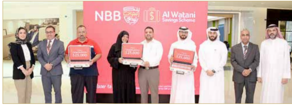
الفائزون يتسلمون جوائزهم

50 ديناراً. أما العملاء الذين لديهم متوسط رصيد شهري قدره 1000 دينار فما فوق، فيتأهلون للفوز بجميع الجوائز الشهرية والنصف سنوية إضافة إلى الجائزة الكبرى وجائزة الحلم*. كما يهدف بنك البحرين الوطني لغرس ثقافة الادخار لدى جميع أفراد المجتمع التي تعود عليهم بالمنفعة. ويحث العملاء الكرام على المشاركة والاستفادة من فرص الفوز المتعددة للبرنامج وترقب جائزة الحلم التي سيتم الإعلان عنها قريباً.