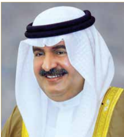
سمو الشيخ علي بن خليفة