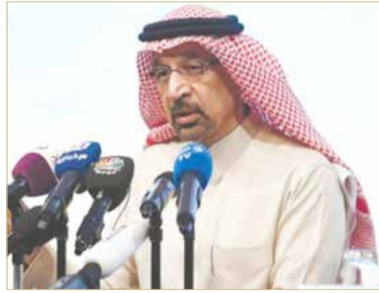
وزارة الطاقة السعودي خالد الفالح

قالت وزارة الطاقة السعودية، أمس السبت، إن إحدى وحدات معمل للغاز الطبيعي في حفل الشبية البترولي جنوب شرقي السعودية تعرضت لهجوم إرهابي. وأوضحت الوزارة أن الهجوم "تم عن طريق طائرات مسيرة من دون طيار 'درون' مفخخة، ونجم عن ذلك حريق تمت السيطرة عليه، بعد أن خلف أضرارا محدودة، ودون أي إصابات بشرية، بحسب ما أوردت وكالة الأنباء السعودية الرسمية 'واس' بحسابها الرسمي على 'تويتر'. وأكد وزير الطاقة والصناعة والثروة المعدنية، خالد الفالح، أن الاعتداء على حفل الشبية البترولي خلف أضرارا محدودة، وإنتاج المملكة وصادراتها من البترول لم تتأثر من العمل الإرهابي".