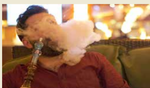
تدخين الشيشة أكثر خطورة من أشكال التدخين الأخرى

وكتب المعدون أن جرعة CO الناتجة عن تدخين الشيشة، تعادل جرعة CO الناتجة عن تدخين 12 سيجارة. وأشاروا إلى أن هناك العديد من الحالات التي عانى فيها مدخنو الشيشة، من تسمم أول أكسيد الكربون.