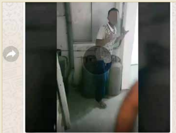
رسالة محولة هذا البارحة داخل بيت الوالد بالنويدرات سكران آسيوي .. بلغنا عنه وجات الشرطة خذوه 11:39 ص

"هذا البارحة داخل بيت الوالد بالنويدرات سكران آسيوي.. بلغنا عنه وجات الشرطة وخذوه.. تلك رسالة واتس أب تناقلها بعض أهالي العكر والنويدرات صباح الجمعة 16 أغسطس 2019. واحدة من الرسائل التي اعتاد الأهالي في القريتين، وخصوصاً في قرية العكر، ومنذ سنين، على تبادلها مع بعض معارفهم وأصدقائهم والتي تكشف معاناتهم المزمنة مع آسيويين تكررت المشاكل معهم بسبب بيع وشراء الخمر في "سوق سوداء كما يسميها الأهالي".