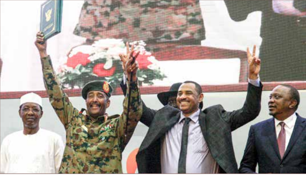
أحمد ربيع والبرهان بعد توقيع وثائق المرحلة الانتقالية

فتح السودان، أمس السبت، صفحة جديدة عقب التوقيع النهائي على وثائق المرحلة الانتقالية، التي تمثل بداية جديدة في تاريخ البلاد الحديث. ووقع الاتفاق نائب رئيس المجلس العسكري السوداني محمد حمدان دقلو، إلى جانب أحمد ربيع عن قوى الحرية والتغيير. وحضرت وفود عربية ودولية رفيعة المستوى مراسم التوقيع التاريخي على الإعلان الدستوري، الذي يمهد لتشكيل الحكومة وبدء الفترة الانتقالية.