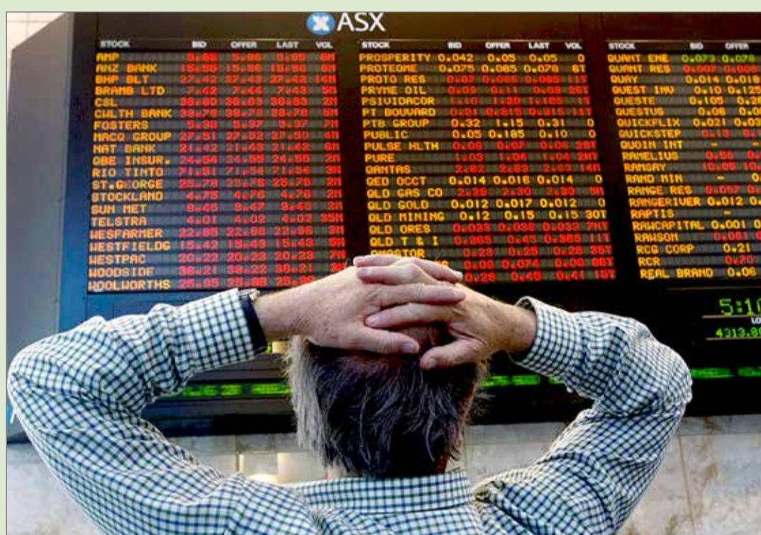
ديي - مياشر

سوق السندات أرسلت إشارات مقلقة للمستثمرين