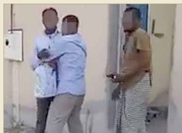
مترنحان والثالث مستانس

بالقرب من مدرسة المنذر بن ساوي الابتدائية للبنين، هناك "بؤرة.." شاهدنا مقطعاً لنشره "أبو منتظر" في حسابه على الانستغرام وفي مجموعات الواتس أب