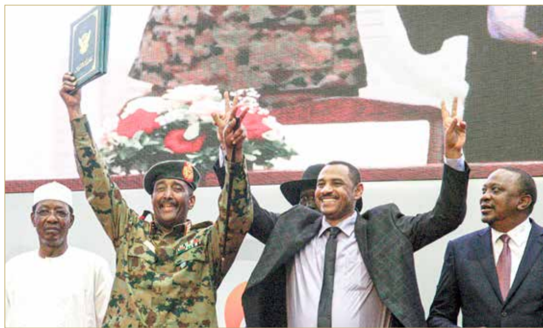
أحمد ربيع والبرهان بعد توقيع وثائق المرحلة الانتقالية