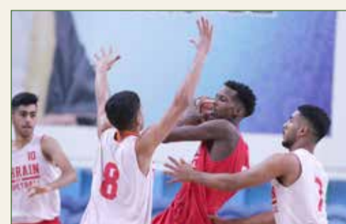
من تحضيرات منتخبنا الأخيرة

منتخب الشباب يختم معسكره اليوم وينتقل لفندق البطولة