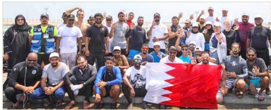
العمامة - بنا

◆ ضمن خطة تنظيف الشواطئ وحماية البيئة والكائنات البحرية