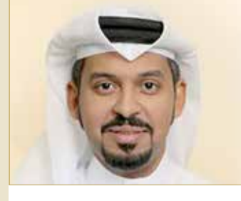
النفيعي: مسيرة سموه حافلة بالإنجازات الأمامية وهي مصدر فخر واعتزاز