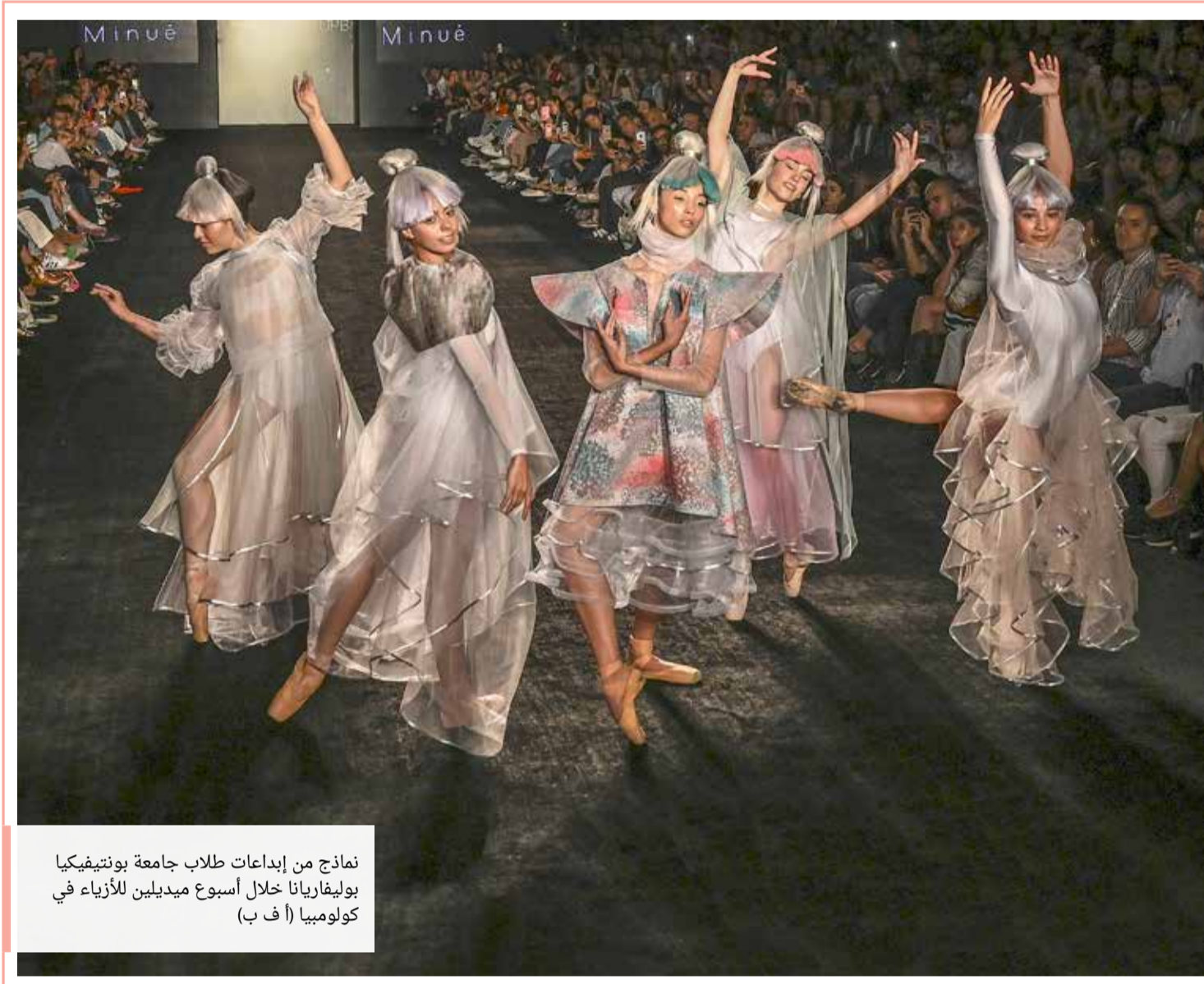
نماذج من إبداعات طلاب جامعة بونتييفيكيا بوليفارينا خلال أسبوع ميديلبين للأزياء في كولومبيا