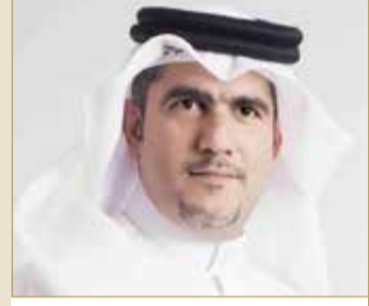
البناني: سموه مساهم فاعل في المجتمع الدولي لتعزيز نهج وثقافة السلام