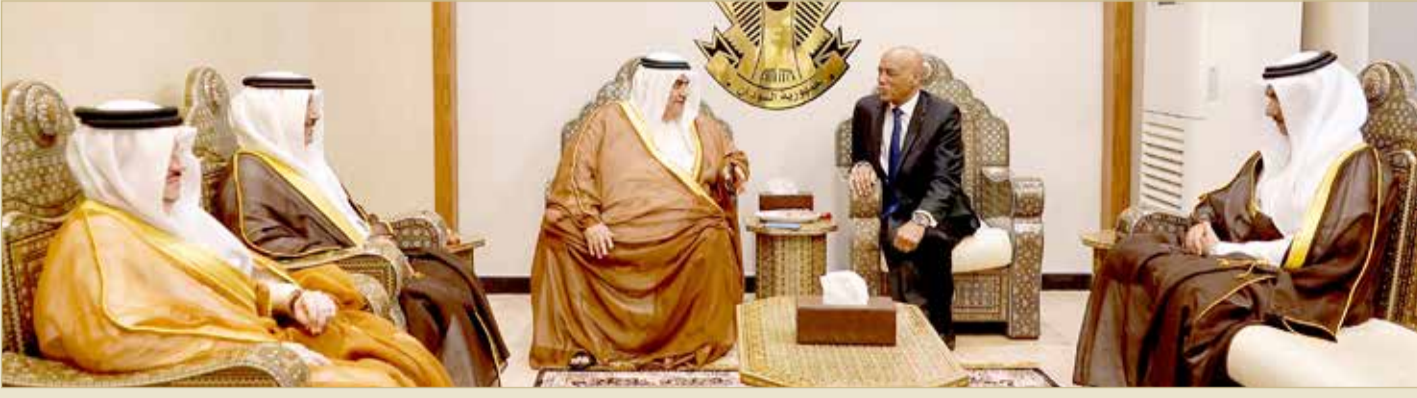
المنامة - وزارة الخارجية

وزير الخارجية يشارك في حفل إبرام وثائق الانتقال للسلطة المدنية