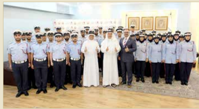
محافظ العاصمة أشاد بإنجازات برنامج "معا"