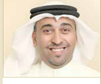
عيسى: سموه رجل سلام من طراز فريد حظي بتقدير المجتمع الدولي