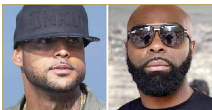
وكان الفائز سيحصل على مبلغ 1.5 مليون يورو، فيما كان الخاسر سيحصل على ثلث هذا المبلغ

« وربما اختار الفنانان كاريس (39 عاماً) وبوبا (42 عاماً) سويسرا وجهة للتقاتل في ما بينهما؛ لأن رياضة الملاكمة العنيفة هذه محظورة في فرنسا.