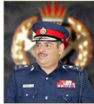
رئيس الأمن العام