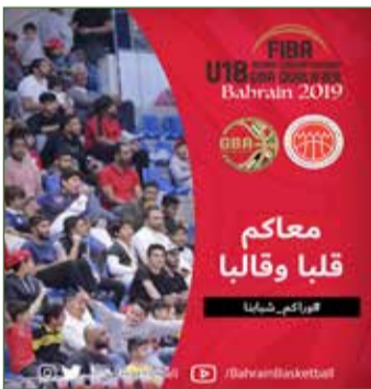
حملات تحفيز للحضور الجماهيري