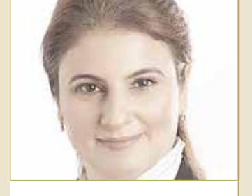
كمال: سموه يعمل جاهداً على ترسيخ ثقافة السلام وخدمة القضايا الإنسانية