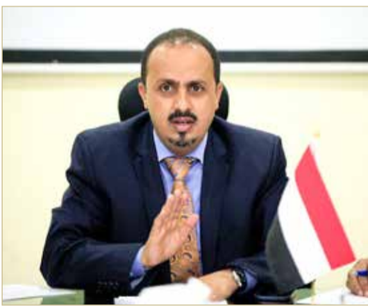
وزير الإعلام معمر الإرياني

أعلن عضو في الحكومة اليمنية المعترف بها دوليا أن القوات الانفصالية التابعة للمجلس الانتقالي الجنوبي انسحبت من مبان رسمية عدة سيطرت عليها أخيرا في عدن من القوات الموالية للرئيس عبدربه منصور هادي، على ما أعلن عضو في الحكومة أمس السبت. وكتب وزير الإعلام معمر الإرياني على تويتر أن الانفصاليين أخلوا مقر الحكومة ومجلس القضاء الأعلى والبنك المركزي إضافة إلى مستشفى عدن، بعدما كان الائتلاف العسكري بقيادة السعودية أعلن في وقت سابق عن هذا الانسحاب في بيان.