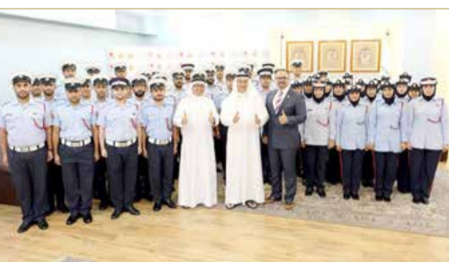
محافظ العاصمة قدم التهاني لوزير الداخلية بمناسبة الفوز