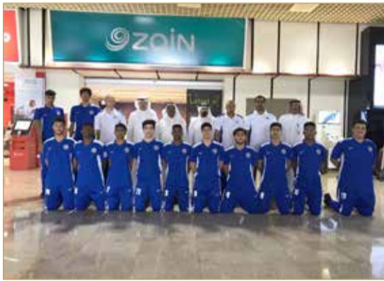
من وصول المنتخب الكويتي

وعلى صعيد النقل التلفزيوني والاهتمام الإعلامي بالبطولة، ستحظى المباريات بتغطية إعلامية من قناة البحرين الرياضية التي ستنتقل اللقاءات على الهواء مباشرة، إذ وضعت القناة خطة تغطية البطولة بشكل يعطيها الزخم الإعلامي المطلوب.