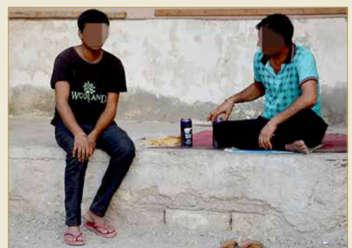
آسيويان يحتسان المنكر بالقرية

العقاب بتجاوزهم القانون باستهتار. مضت أكثر من ساعة على التجوال.. لكن الليلة كانت هادئة.. وما أن تقترب من أحد أولئك العمال في سيارة عابرة أو متوقفة سواء كانت تقل فرداً أو مجموعة، أو تؤشر لهم بيديك، حتى تتفاجأ بحركة الهروب السريعة، وكان "كاد المرعب أن يقول خذوني! أما الأهالي، فشهادتهم وقصصهم تتطابق كثيراً بشأن ظاهرة الآسيويين السكران في قرية العكر.