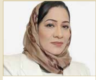
القطري: تأكيد مكانة سموه الكبيرة رجلًا للسلام على المستوى الدولي