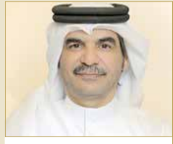
البوعيينين: مصدر فخر لنا جميعاً واستكمال لنجاحات سموه بمجالات التنمية