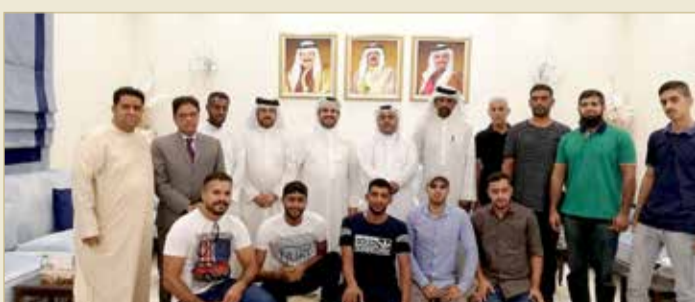
من تكريم الفائزين

لمملكة البحرين. وأشاد الكعبي بالعمل المقدم من جميع أعضاء اللجنة البحرينية للحمام الزاجل والحوام والمنظمين لإنجاح السباقات تنظيميا، مشيرا إلى أن اللجنة حققت نجاحا ملموسا في تنظيم سباقات هذا الموسم بالشكل الأمثل.