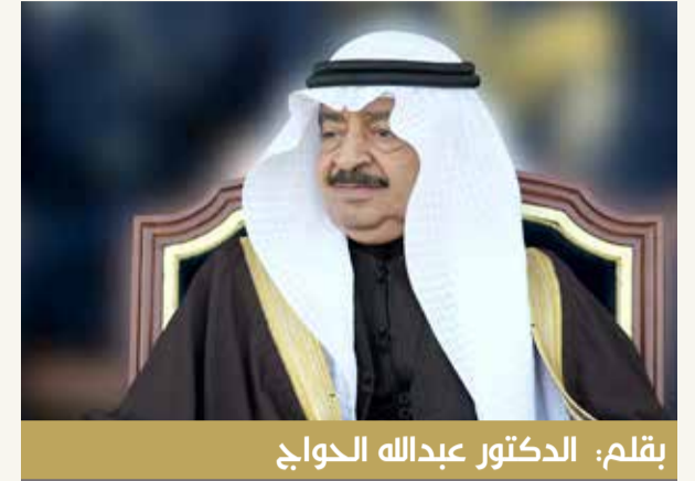
بقلم: الدكتور عبدالله الحوаж