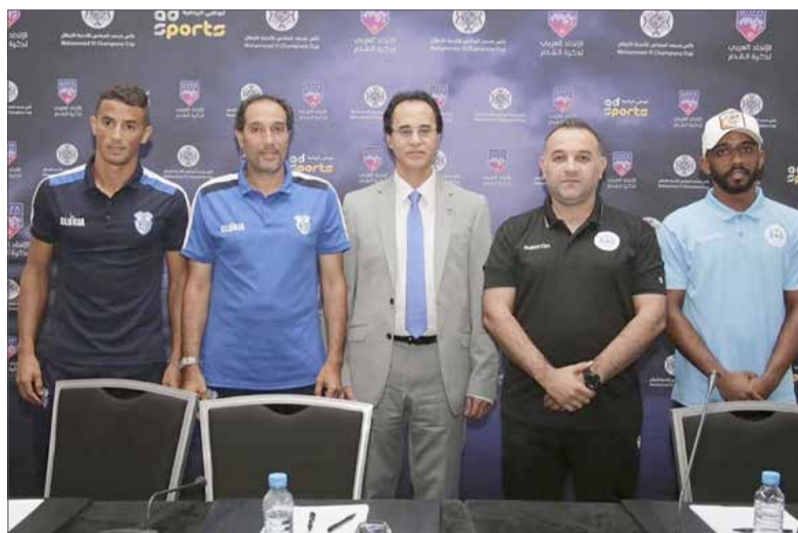
من المؤتمر الصحافي

يخوض ممثل المملكة فريق الرفاع، عند 9 مساء اليوم (الأحد)، لقاء أمام فريق اتحاد طنجة المغربي، ضمن منافسات الجولة الأولى للمجموعة الأولى للدور التمهيدي لكأس محمد السادس للأندية العرب الأبطال، على ملعب المركب الرياضي محمد الخامس في المغرب.