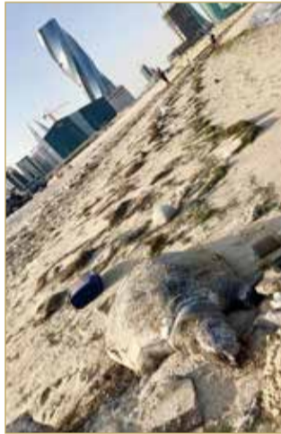
سلاحفة نافقة على أحد شواطئ المنامة