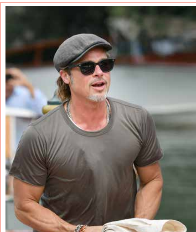
النجم الأمريكي براد بيت لدى وصوله للمشاركة في مهرجان البندقية السينمائي الـ 76 في فينيسيا ليدو.

وكتبت النجم البرازيلي (27 عاماً) في تغريدته: "تمكنت من تحقيق حلمي أن أكون جزءاً من مسلسل المفضل الآن يمكنني مشاركة ذلك معكم". وشارك نيمار في المسلسل، الذي تنتجه شركة "نتفليكس" الأميركية حامل اسم "جواو" في الحلقتين السادسة والثامنة من الجزء الأخير الذي نشر في يوليو، ولم تعرض الحلقات التي شارك فيها بسبب تورطه في قضية الاعتصاب، وفقاً لصحيفة "أس" الإسبانية. ويمجد أن أعلن القضاء البرازيلي أن