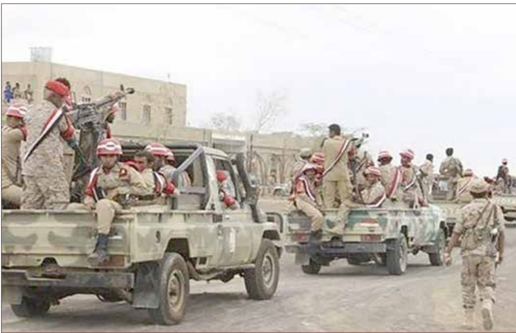
الحكومة اليمنية تستعيد السيطرة على كامل محافظة عدن

بسطت سيطرتها على المطار وقصر المعاشيق وسط ترحيب شعبي كبير