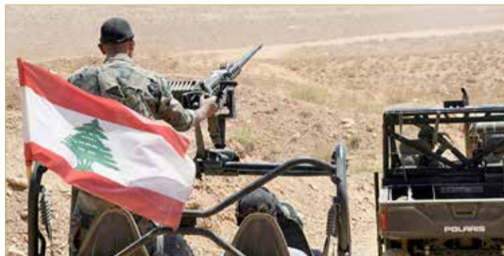
عناصر من الجيش اللبناني

الاحتلال يغلق المجال الجوي للطائرات المدنية فوق الحدود