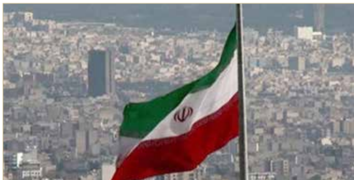
واشنطن تعرض عقوبات بحق شبكتين على صلة بإيران

طهران تدرس خطة ماكرون لتخفيف التوتر مع واشنطن