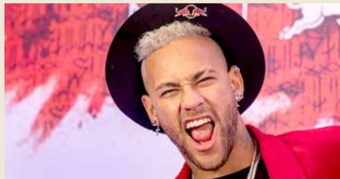
أصبح نيمار أعلى لاعب في العالم عند انتقاله إلى باريس

القضية ستفرغ بسبب عدم كفاية الأدلة، أعادت "نتفليكس" تحميل الحلقات وفيها نيمار.