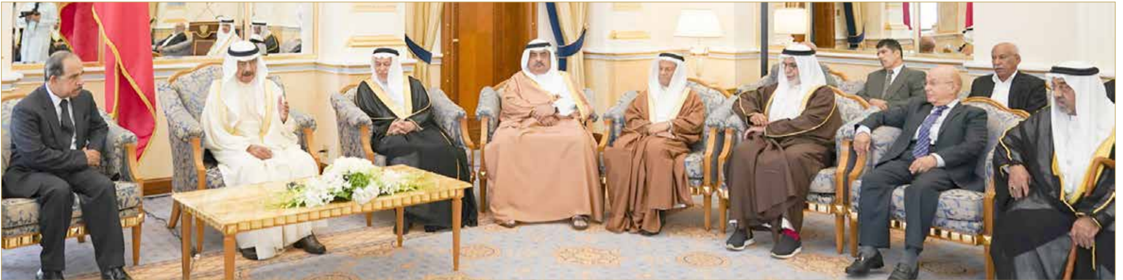
سمو رئيس الوزراء مستقبلاً عدداً من ممثلي المآتم الحسينية أمس

◆ سمو رئيس الوزراء: نبذ أي دعوات بغيضة تهدف للفرقة والشقاق بين أبناء الوطن الواحد