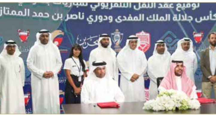
من توقيع الاتفاقية

من جانبه، أكد وزير شؤون الإعلام علي الرميحي أن الاتفاقية تعتبر نقلة نوعية في نقل الأحداث الرياضية، مشيراً إلى أن وزارة شؤون الإعلام تولي الرياضة اهتماماً خاصاً، معرباً عن سعادته بتوقيع هذه الاتفاقية التي تتميز كونها ستساهم في تطوير الكوادر الفنية البحرينية الشابة وستضفي على مسابقاتنا الرياضية زخماً خاصاً عبر النقل الاحترافي خاصة في ظل الإنجازات والمراكز المتقدمة، إضافة للأهداف المتقدمة لكرة القدم في مملكة البحرين، والتي لا بد أن تتحقق من خلال توفير الدعم في كافة المجالات وذلك تنفيذاً لتوجيهات المجلس الأعلى للشباب والرياضة برئاسة سمو الشيخ ناصر بن حمد آل خليفة ودعم ومتابعة سمو الشيخ خالد بن حمد آل خليفة رئيس اللجنة الأولمبية البحرينية والرامية إلى تطوير المسابقات المحلية الرئيسة والمتمثلة بكأس جلالة الملك ودوري ناصر بن حمد الممتاز.