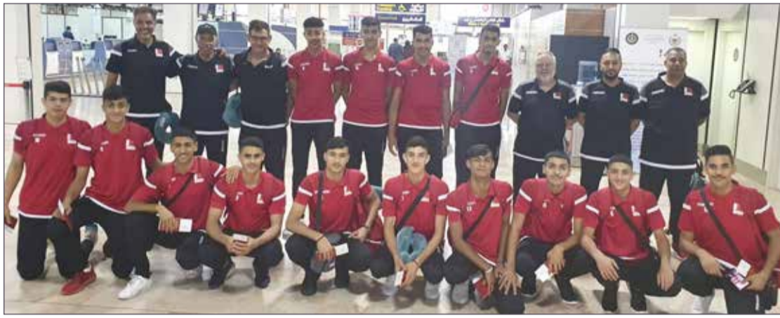
منتخبنا الوطني للناشئين لكرة الطائرة

وعاد منتخب الناشئين أمس (الأربعاء) إلى أرض الوطن بعدما خاض منافسات البطولة الدولية في تونس التي أقيمت من 10 لغاية 18 أغسطس ومن بعدها معسكر مصر التدريبي، ومن المتوقع أن يحصل اللاعبون على راحة لمدة يوم أو يومين على أن يعاود المنتخب حصة التدريب المحلية استعدادا