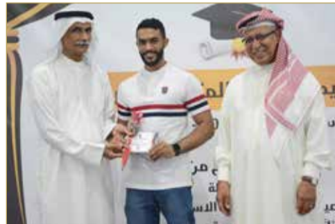
جانب من حفل تكريم اللاعبين المتفوقين

المقبلة التي تنبئ بمستقبل مشرق لمملكة البحرين في ظل الكم الهائل من الطلبة المتفوقين، وذلك تشجيعا على التفوق وتشجيعا للمتفوقين لمواصلة تفوقهم، في إطار التعاون مع الجهات الأهلية لتنفيذ برامج النادي في دعم وتنمية وتطوير المجتمع.