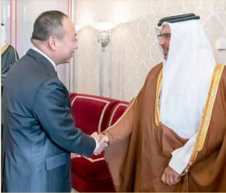
سمو ولي العهد مستقبلاً أفراد العائلة المالكة الكريمة وعدداً من المسؤولين والمواطنين

◆ الحضور يؤكدون أن سموه منصة جامعة لجميع أبناء المجتمع