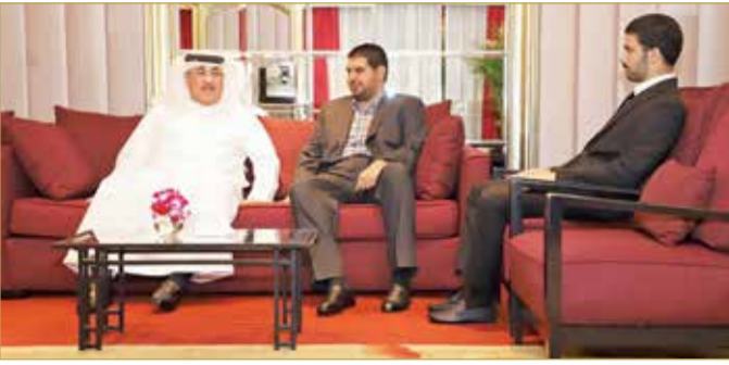
سفير مملكة البحرين في الصين مستقبلاً سمو الشيخ عيسى بن علي

اتحاد السلة نجح في تطوير اللعبة وزيادة جماهيريتها