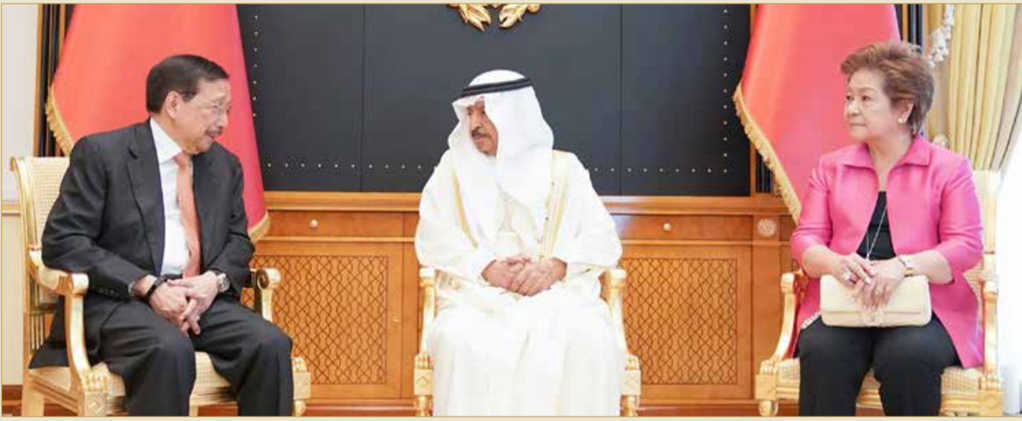
سمو رئيس الوزراء مستقبلاً مبعوث رئيس الفلبين لدول مجلس التعاون

◆ مبعوث رئيس الفلبين يشيد بمواقف البحرين الداعمة لبلاده بمختلف المحافل