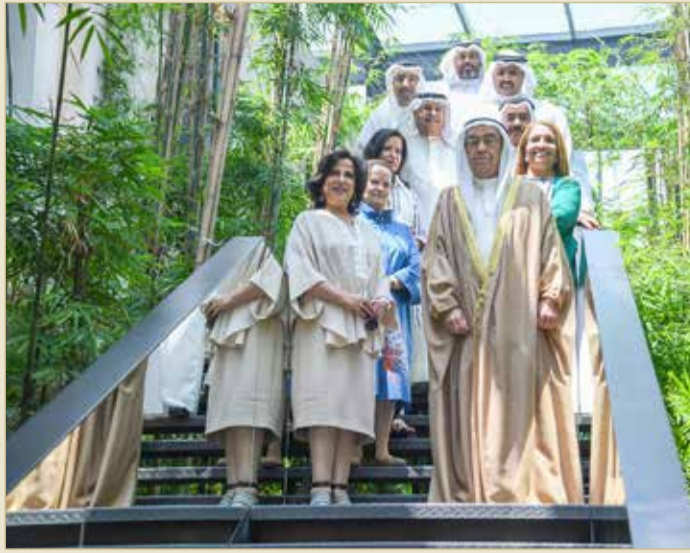
سمو الشيخ محمد بن مبارك في زيارة لمتحف "منامة القصيبي"

تخليد ذكرى الأدباء والشعراء وحفظ التراث محل تقدير