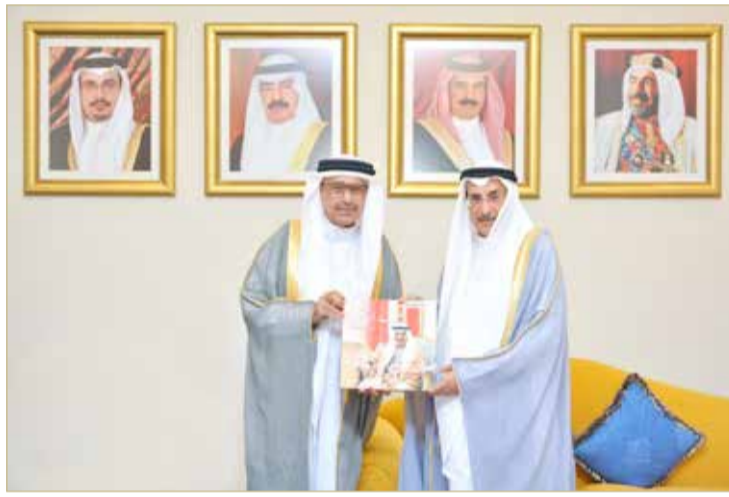
الشيخ خالد بن عبدالله مستقبلا الباحث عادل المرزوق

نوه نائب رئيس مجلس الوزراء الشيخ خالد بن عبدالله آل خليفة بأهمية البحث العلمي وجهود الباحثين في توثيق الأحداث التاريخية عبر مختلف العصور والأزمان، وما لذلك من انعكاسات جمة تسهم في أن تحقق للمجتمعات التقدم والتطور الذي تنتسده.