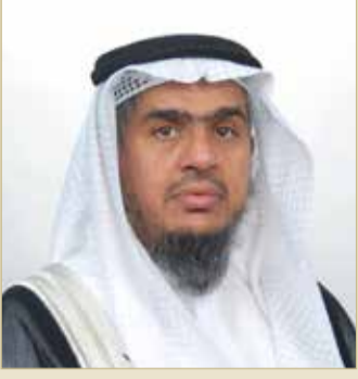
رئيس ديوان الخدمة المدنية

على 4 دفعات لأكثر من 8000 موظف مستفيد من البرنامج