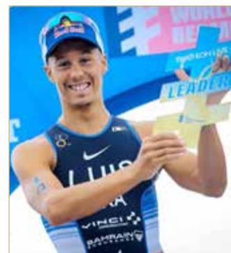
لاعب فريق البحرين للتحمل 13