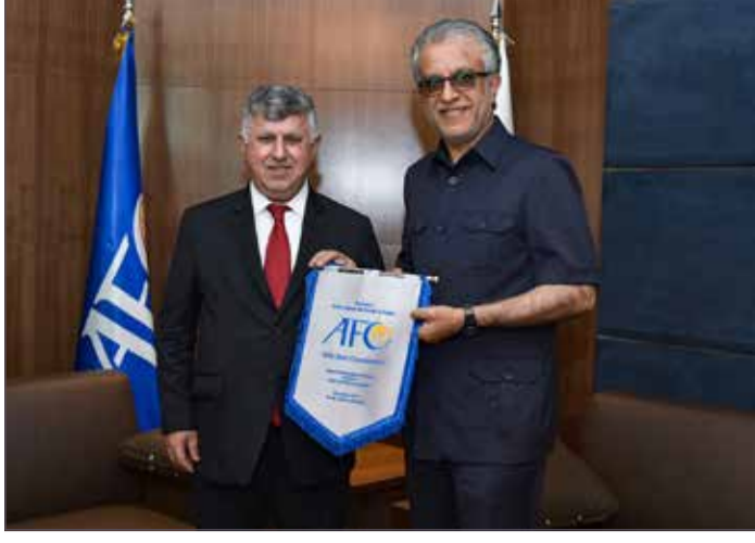
الشيخ سلمان بن إبراهيم مع رئيس الاتحاد العراقي

الاتحاد الآسيوي على مواقفه المشرفة، متمنيا له دوام التوفيق والسداد في قيادة الكرة الآسيوية نحو التميز والنجاح الدائم.