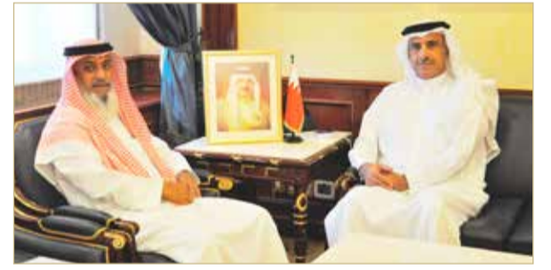
المنامة - وزارة الإسكان

استقبل وزير الإسكان باسم الحمر أمس بمكتبه بديوان الوزارة عضو مجلس النواب عبدالرزاق خطاب، حيث جرى خلال اللقاء استعراض عدد من المواضيع المتعلقة بمستجدات الملف الإسكاني. وتطرق اللقاء إلى سبل تعزيز التعاون المشترك بين وزارة الإسكان ومجلس النواب، ودعم خطط الوزارة لتلبية الطلبات الإسكانية، من خلال تسريع وتيرة العمل بالمشاريع الحالية