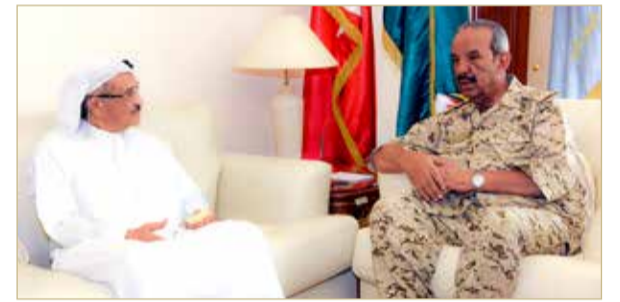
الرفاع - قوة الدفاع

استقبل القائد العام لقوة دفاع البحرين الرئيس المجلسي البحريني المشير الركن الشيخ خليفة بن أحمد آل خليفة في مكتبه بالقيادة العامة أمس رئيس المجلس الأعلى للصحة الفريق طبيب الشيخ محمد بن عبدالله آل خليفة. وخلال اللقاء رحب القائد العام