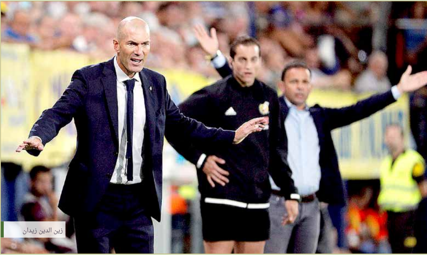
زين الدين زيدان

وبحسب صحيفة "موندو ديبورتيفو"، بعد مرور 3 جولات، حصد ريزو 5 نقاط من أصل 9، ويحتل المركز الخامس بفارق 4 نقاط عن المتصدر أتلتيكو مدريد، بينما الموسم الماضي كان يحتل الفريق المركز الثاني خلف برشلونة بفارق الأهداف فقط برصيد 9 نقاط. وكان لوبيتيجي قد قاد الملكي للانتصار على خيتافي وجرونا وليجانيس، وسجل الفريق 10 أهداف واستقبل هدفين، بينما هذا الموسم فاز الميرنجي على سيلتا فيجو وتعادل مع بلد