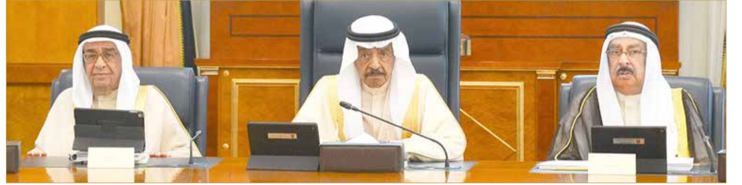
سمو رئيس الوزراء مترئساً جلسة مجلس الوزراء أمس

سمو رئيس الوزراء يوجه لمتابعة احتياجات المناطق لفعاليات عاشوراء