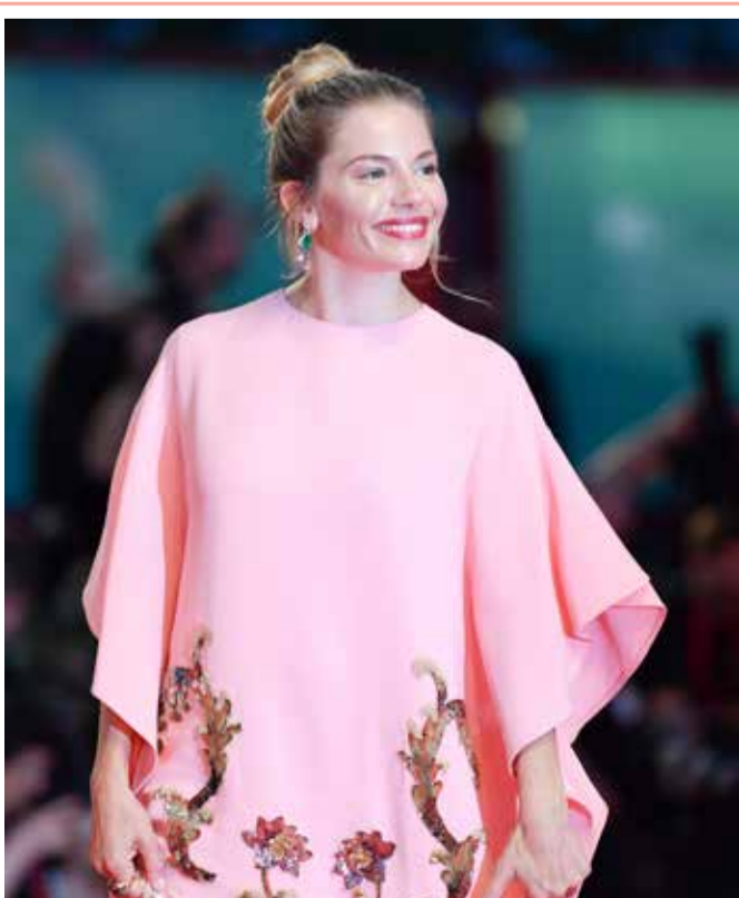
الممثلة البريطانية سيبينا ميلر تصل عرض فيلم "ذا لاندنر مات" خلال مهرجان فينيسيا السينمائي الـ 76 في فينيسيا ليدو.

« وسارعت الشرطة الهندية باعتقال 21 مشتبه بهم، من داخل المشفى، بعيد دقائق من الاعتداء على الطبيب المسن، الذي توفي خلال ساعات متأثراً بجراحه.