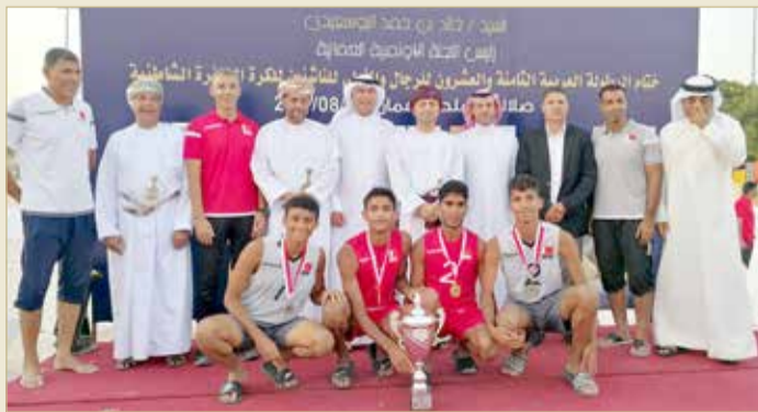
منتخب الناشئين لكرة الطائرة الشاطئية بطل العرب

البطولات فقط، أجاب "المشكلة التي تواجهنا هي عدم تفرغ اللاعبين، فهم يشاركون جميعا في منافسات الصالات، وهو ما يحول دون القدرة على تجمعهم على مدار العام، ومع ذلك فإننا