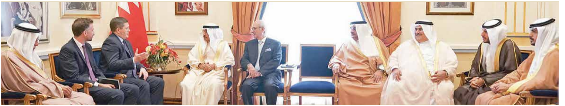
سمو رئيس الوزراء مستقبلاً سفير المملكة المتحدة

◆ سمو رئيس الوزراء يؤكد عمق العلاقات التاريخية بين البلدين