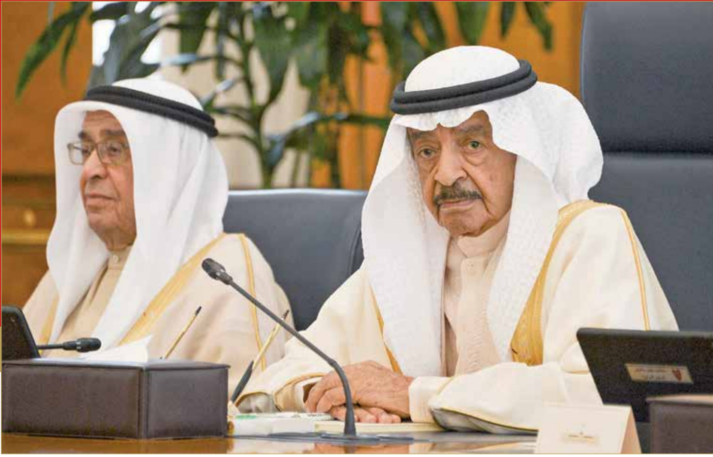
سمو رئيس الوزراء يرأس الجلسة الاعتيادية لمجلس الوزراء

اتخاذ الإجراءات الكفيلة بالحفاظ على البيئة ووقف أية ممارسات ضارة