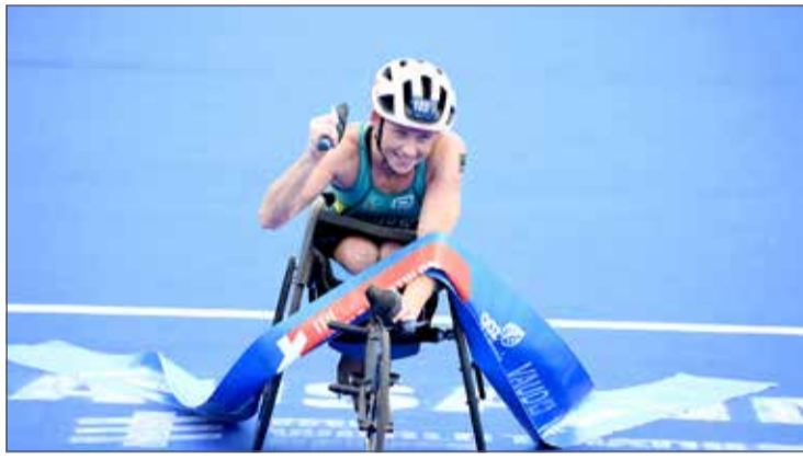
فحرة متسابق فريق البحرين بالفوز

2 برونز). لم يكن سباقًا جيدًا بالنسبة لي. لقد شعرت بأنني متوسطًا طوال اليوم، ولكنني بذلت كل ما بجهد لي للحفاظ على مركزي على المنصة.“ من جهة أخرى، استطاعت باركر أن تحقق لقب الباراترايثلون في مشاركتها الأولى هذا العام. وقالت بعد نهاية السباق: ”لا أستطيع أن أصف شعوري بعد الفوز