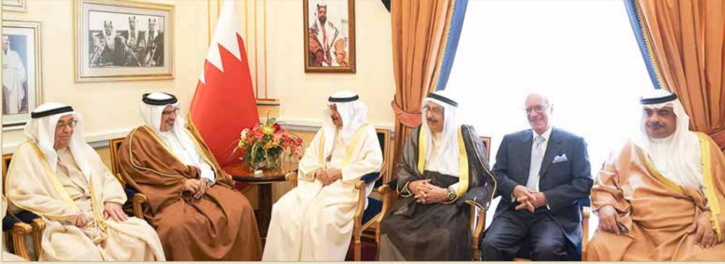
سمو نائب جلالة الملك يلتقي سمو رئيس الوزراء

◆ سمو نائب جلالة الملك وسمو رئيس الوزراء: الحفاظ على البيئة والثروات البحرية