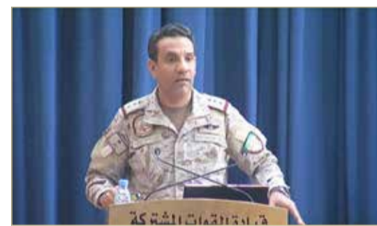
العقيد الركن تركي المالكي

قال المتحدث باسم قوات دعم الشرعية في اليمن العقيد الركن تركي المالكي، أمس الاثنين، إن اللجنة السعودية الإماراتية المشتركة عملت على تهدئة الأوضاع في مناطق يمنية عدة.