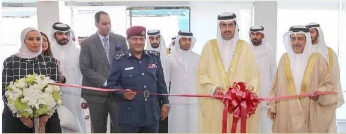
المنامة - وزارة الداخلية

سمو محافظ الجنوبية: دعم جميع المبادرات العائدة بالنفع على المواطنين