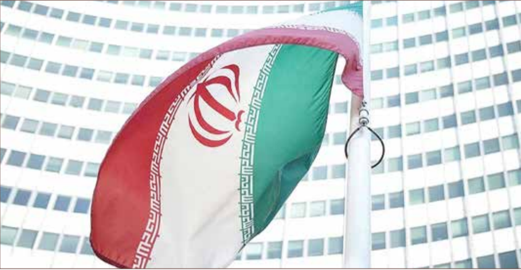
إيران تطلب الدول الأوروبية بإنقاذ الاتفاق النووي