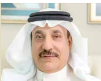
وزير العمل والتنمية الاجتماعية

حميدان: البحرين تزخر بالطاقات الشبابية الإبداعية