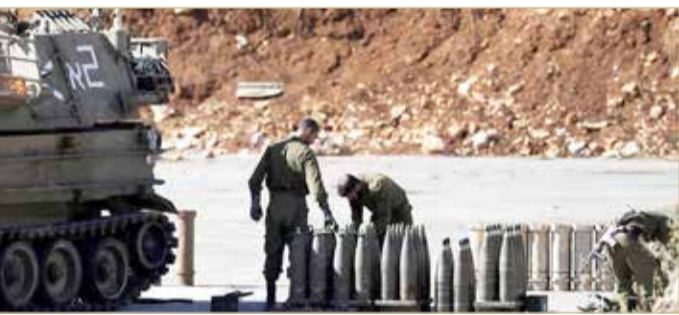
جنود إسرائيليون قبالة الحدود اللبنانية

أعلنت إسرائيل أمس الاثنين أنها ستحافظ على جهوزيتها العسكرية تحسباً لأي تطور عسكري على الحدود اللبنانية الإسرائيلية. ونقل أفيخاي أدري المتحدث باسم الجيش الإسرائيلي عن رئيس الأركان خلال اجتماع مع قائد قوات اليونيفيل، قوله إن "الجيش سيبقى في حالة جاهزية لسيناريوهات متنوعة"، وأضاف أن إسرائيل لن تقبل مشروع الصواريخ الدقيقة لحزب الله.