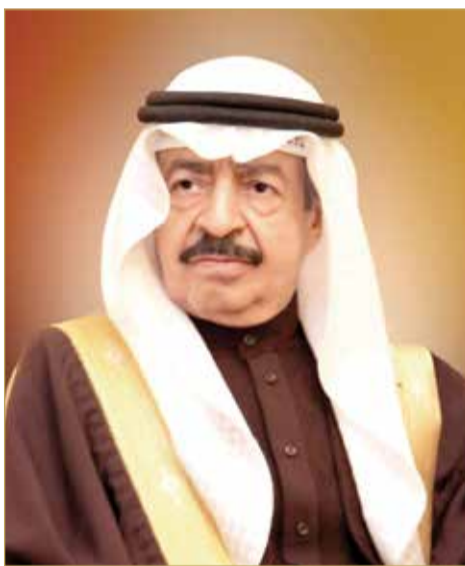
سمو رئيس الوزراء

أجمعت فعاليات وطنية أن توجيهات رئيس الوزراء صاحب السمو الملكي الأمير خليفة بن سلمان ال خليفة، للوزارات الخدمية بمتابعة كل الملاحظات والشكاوى التي يثيرها المواطنون والعمل على حلها بشكل فوري وتكثيف اللقاءات المباشرة وبالمواطنين تحقيقاً لأهداف الحكومة في الوصول لرضى المواطن عن كافة الخدمات، دليل واضح على حرص سموه التيسير على المواطنين والتأكد من وصول جميع الخدمات التي تقدمها حكومة مملكة البحرين لأبناء الوطن بيسر لاقتين إلى أن توجيهات سموه تصب دوماً في صالح المواطن الذي كان وسيبقى من أولويات عمل الحكومة.