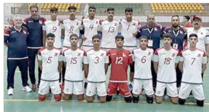
منتخب الناشئين لكرة الطائرة