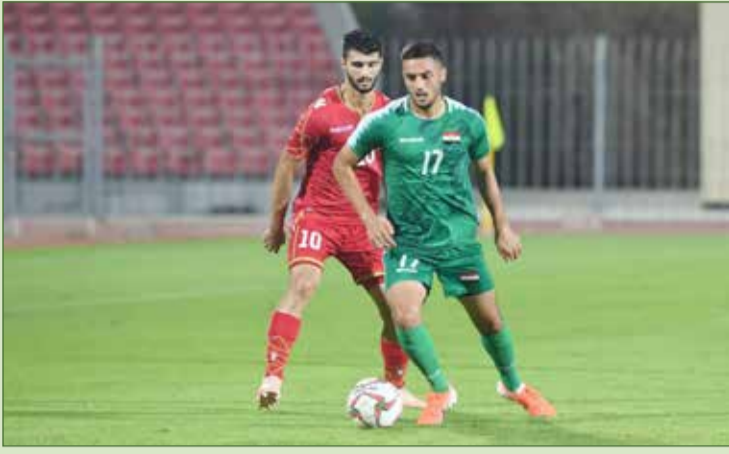
من اللقاء الأول بين منتخبنا الأولمبي ونظيره العراقي