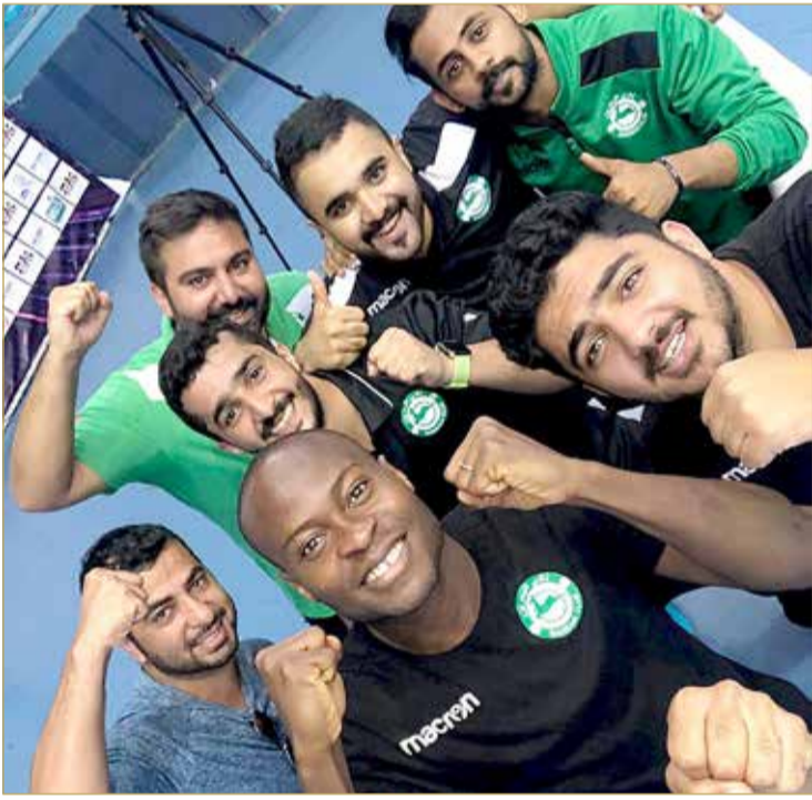
فرحة لاعبي البحرين بعد الفوز

وكان البحرين حقق 4 انتصارات متتالية في دور المجموعات كسب منها 8 نقاط كاملة اثر فوزه على