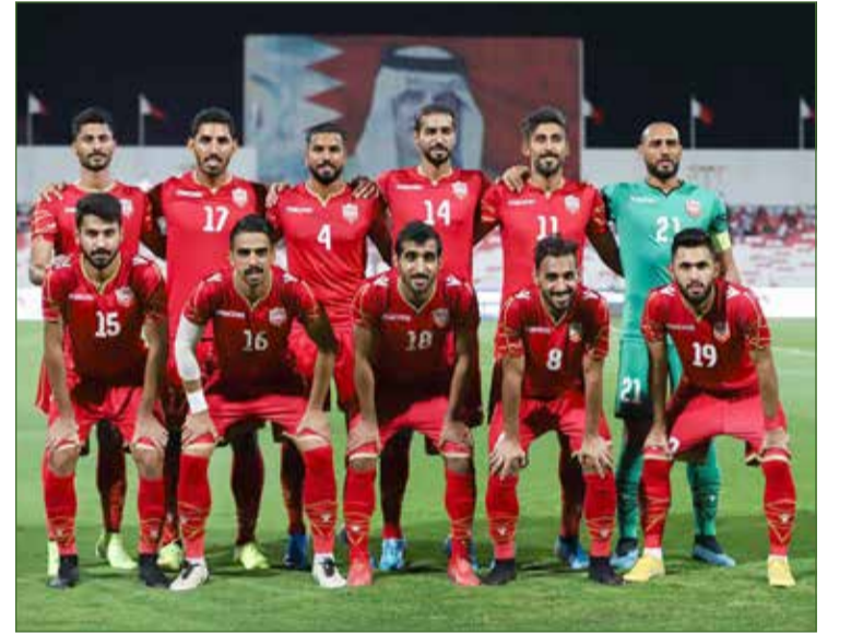
منتخبنا الوطني الأول لكرة القدم