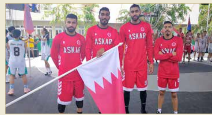
منتخب الرجال لكرة السلة 3x3

los Pioneers اللبناني بالنتيجة نفسها 4/21.