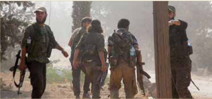
عناصر من جبهة النصرة الموالية للقاعدة في سوريا

الشباب وتجهيزهم للقتال في سوريا منذ العام 2014. ويقول التقرير إن المنظمة تربطها علاقات وطيدة بحزب العدالة والتنمية الذي يتزأسه الرئيس التركي رجب طيب أردوغان. كما أن هناك روابط تجمعها بتنظيم الإخوان الإرهابي، وكثير من الحركات التابعة له عبر العالم، بحسب التقرير.