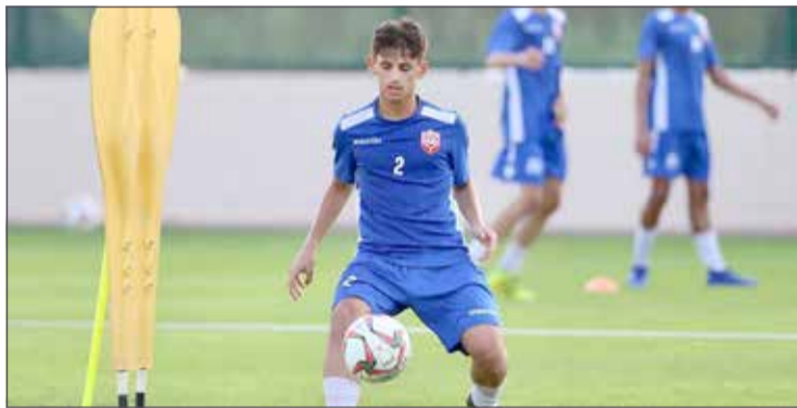
من تدريبات منتخب الناشئين