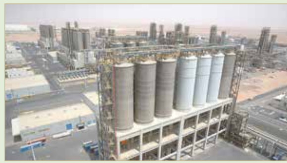
الإمارات فازت في 2014 بالإجماع بحق استضافة المؤتمر

شدها العالم آنذاك على صعيد الاقتصاد والجغرافيا السياسية. وتملك أبو ظبي أكثر من 90% من احتياطي النفط الخام الإماراتي الذي يقدر بـ98 مليار برميل. فترة وجيزة بعد الحرب العالمية الأولى، عندما قرر الأستكتندي دانيال دانلوب الجمع بين خبراء الطاقة البارزين؛ لمناقشة قضايا الطاقة الناشئة فترة ما بعد الحرب، خصوصاً مع التغيرات الكبيرة التي