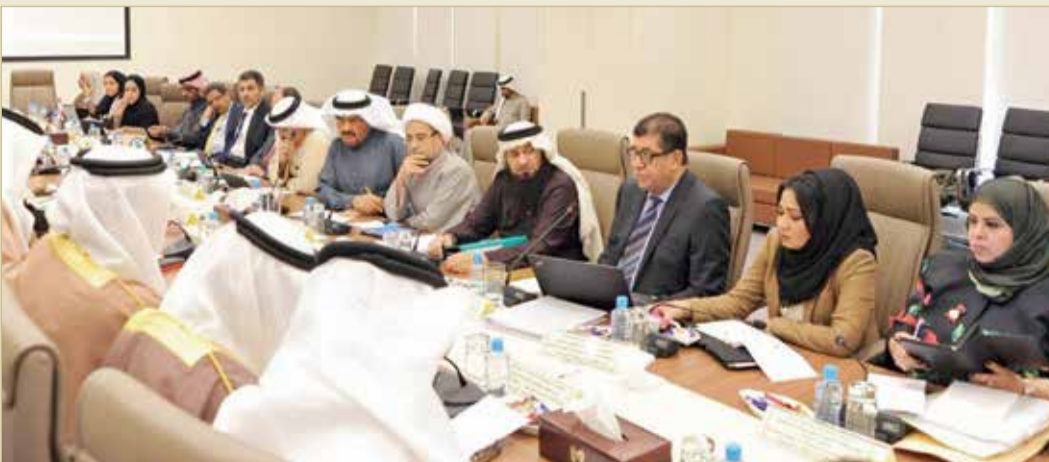
جانب من أحد اجتماعات اللجنة المشتركة (أرشيفية)

حتى اللحظة، ما يبقي موضوع إعادة هيكله الدعم على حاله بانتظار من يحرك مياهه الراكدة.