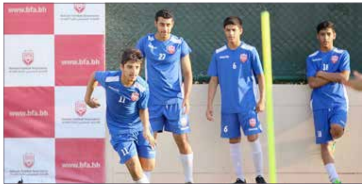
منتخب الناشئين يواصل تحضيره للتصفيات