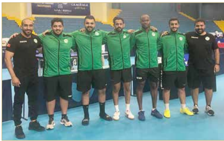
خطوة واحدة تفصل البحرين عن النهائي

إلى مواصلة المشوار لبلوغ المباراة النهائية وتحقيق نتيجة متميزة تفوق النسخة الماضية من البطولة، التي