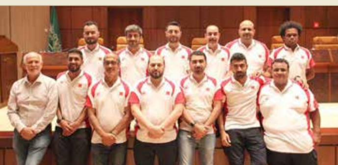
وفد الاتحاد البحريني للسيارات

مؤكدين أنهم سيبدلون قصارى جهدهم مع اخوانهم بالسعودية من أجل تحقيق أعلى معدلات النجاح في كافة المجالات وإظهار السباق بالمظهر المشرف والذي يعكس التطور الكبير الذي تعيشه الشقيقة الكبرى معتبرين أن هذا السباق وكأنه يقام على أرض مملكة البحرين وأنهم لن يألوا جهداً في تقديم كل الخدمات وتسخيرها للسباق السعودي.