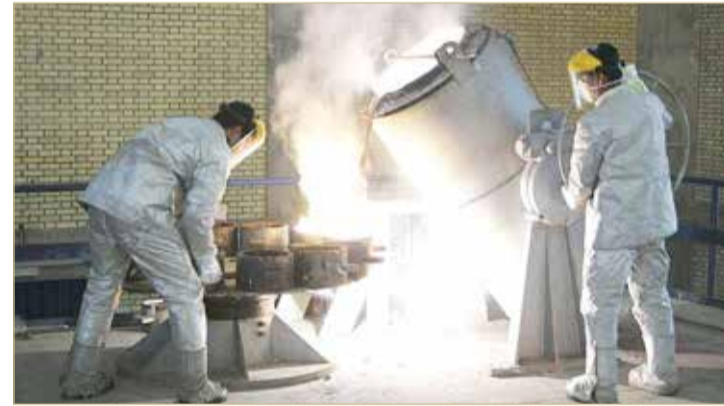
عمال في منشأة نووية إيرانية

يأتي هذا بالتزامن مع توجه المدير العام بالوكالة للوكالة الدولية للطاقة الذرية، كورنيل فيروتا، إلى طهران أمس للقاء مسؤولين إيرانيين كبار، اليوم الأحد، مع استمرار التوتر بين إيران والولايات المتحدة حول الاتفاق النووي. من جانبه، قال مستشار الأمن القومي