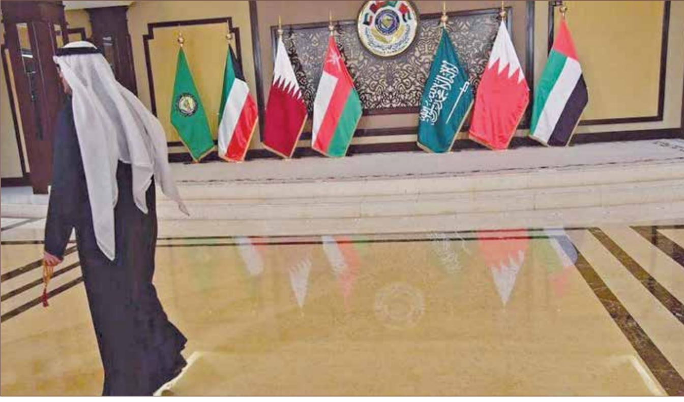
السعودية تعاونت مع دول مجلس التعاون بشأن الأزمة