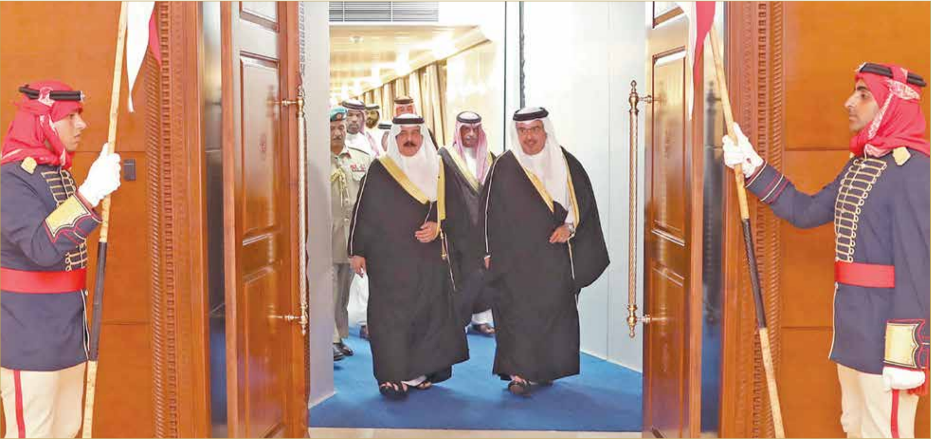
جلالة الملك لدى عودته لارض الوطن وفي مقدمة مستقبله سمو ولي العهد

منافسات هذه البطولة العالمية، وأشاد بالعلاقات الثنائية الطيبة الوطيدة بين مملكة البحرين والجمهورية الفرنسية الصديقة وخاصة في الميادين الرياضية والشبابية.