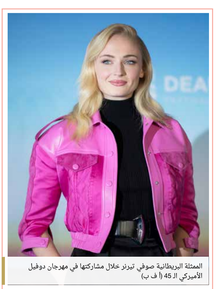
الممثلة البريطانية صوفي تيرنر خلال مشاركتها في مهرجان دوفيل الأميركي الـ 45