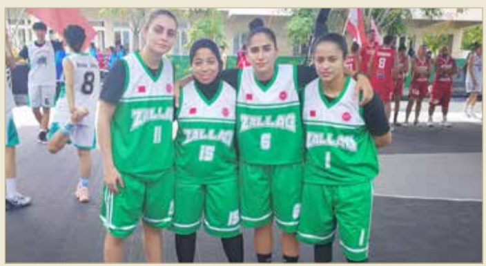
منتخب السيدات لكرة السلة 3x3

3X3 سواء من خلال تنظيم العديد من المسابقات المحلية إضافة للمشاركة الدولية للمنتخبات؛ من أجل رفع التصنيف الدولي للبحرين في هذه اللعبة ونشرها بشكل أكبر بين ممارسي كرة السلة في المملكة.