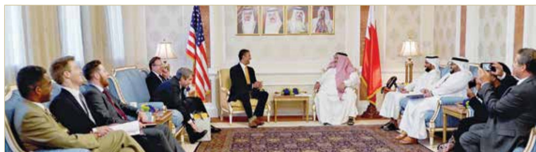
وزير الخارجية يجتمع مع رئيس لجنة الاتصالات الفيدرالية الأميركية

وزير الخارجية: البحرين تولى اهتماماً كبيراً بالقطاع