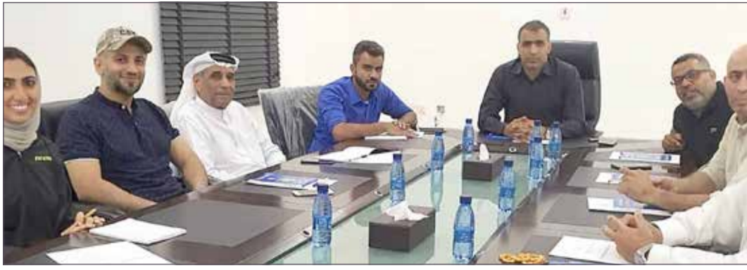
من اجتماع مجلس الإدارة