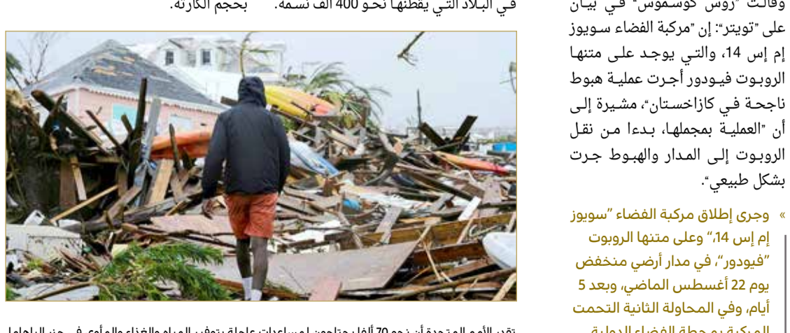
نقر الأمم المتحدة أن نحو 70 ألفا يحتاجون لمساعدات عاجلة لتوفير المياه والغذاء والمأوى في جزر الباهاما

وقالت "روس كوسموس" في بيان على "تويتر": إن "مركبة الفضاء سويوز إم إس 14، والتي يوجد على متنها الروبوت فيودور أجرت عملية هبوط ناجحة في كازاخستان، مشيرة إلى أن "العملية بمجملها، بدءا من نقل الروبوت إلى المدار والهبوط جرت بشكل طبيعي".