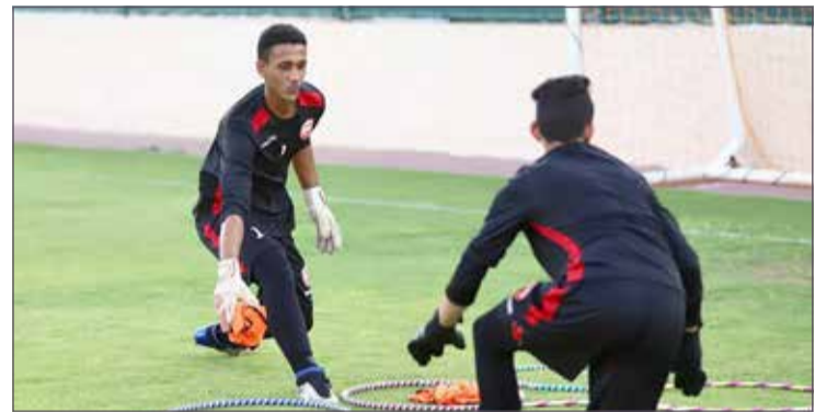
من تدريبات حراس المرمى