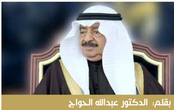
بقلم: الدكتور عبدالله الحواج