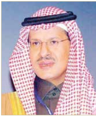
وزير الطاقة السعودي الجديد

وتابع "لا يمكن أن تعمل السعودية وحدها دون تشاور مع بقية أعضاء أوبك وأن التحالف بين أوبك ومنتجين مستقلين، المعروف باسم أوبك+، مستمر لفترة طويلة". ورأى تقرير نشرته وكالة "بلومبرغ" أن الدول