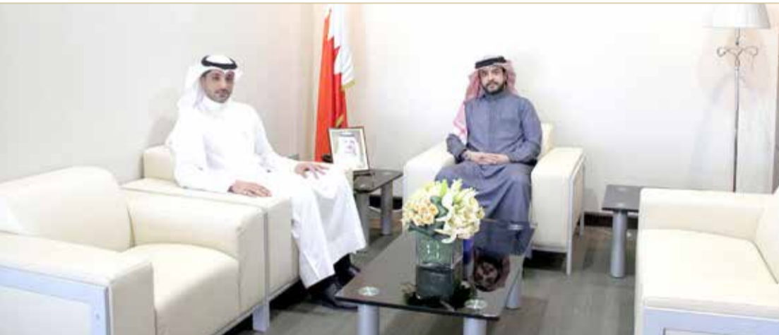
المؤسسة الوطنية لحقوق الإنسان تستقبل النائب غازي آل رحمة

استقبل نائب رئيس المؤسسة الوطنية لحقوق الإنسان خالد الشاعر، النائب غازي فيصل آل رحمة، وذلك بمقر المؤسسة الوطنية بضاحية السيف، حيث رغب به وأشاد بجهود مجلس النواب في طرح ومناقشة القضايا التي تمس مصلحة الوطن والمواطن، وبدور جميع أعضاء المجلس النيابي في الوقوف على متطلبات المواطنين.