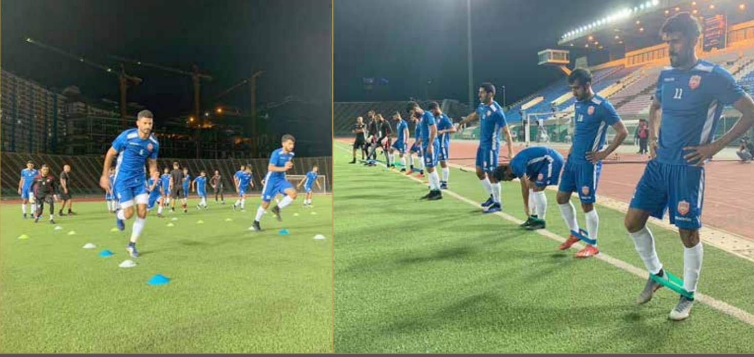
المنتخب أجرى مراناً أخيراً على ملعب المباراة