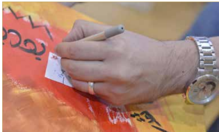
من دورات الخط العربي

♦ الفن يكرس القيم الطيبة بنفوس الأطفال والشباب