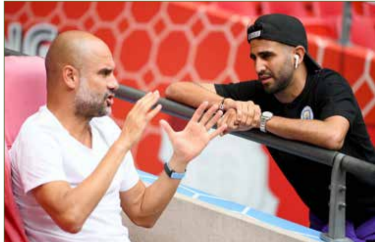
رياض محرز وبيب جوارديولا

من ناحية أخرى، دعا جمال بلماضي مدرب منتخب الجزائر، جماهير بلاده للاحتفال بالتتويج القاري خلال ودية بنين. وقال بلماضي للجماهير "نحن في انتظار حضوركم بقوة في ودية بنين، المباراة ستكون فرصة للاحتفال بحصد لقب الكان".