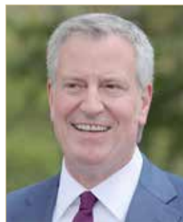
بيل دي بلاسيو