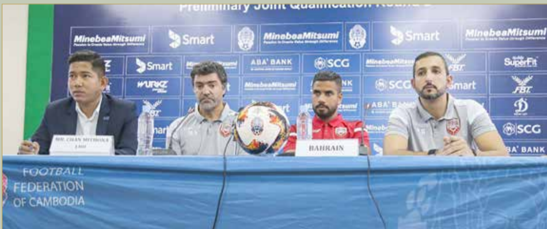
خلال المؤتمر الصحفي

وسيكون اللقاء اليوم بين منتخبنا وكمبوديا منقول مباشرة على قناة البحرين الرياضية، إذ بإمكان جماهير الأحمر مشاهدة المباراة.