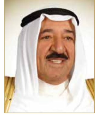
سمو أمير دولة الكويت

للدخل القطري يقول فيه إنه بخير ولم يتأثر بعزلته التي سببتها سياساته في المنطقة، بينما خطابه الموجه للمجتمع الدولي مضمونه الهوان والتباكي، فيما يبقى على خطابه العربي المحرض على الأنظمة والشعوب والداعم للتطرف والكرهية في العالم الإسلامي، وهي سياسة إعلامية تعكس استخفافاً بالشراع العربي لن ينطلي على أحد ولن يلقي الرواج الذي يتأمله الراسمون لتلك السياسات.