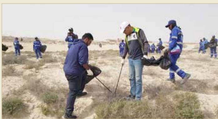
جانب من إحدى حملات النظافة (ارشيفية)

ونفذت بلدية المنطقة الجنوبية منذ مطلع العام الجاري عدداً من مشاريع التطوير بقسم المنتزهات والحدائق والتي شملت زراعة 400 شتلة من شجيرات الهيسكس في المنطقة الواقعة بين دوار عوالي ودوار سافرة لتشكيل سياج زراعي وجمالي للشارع، كما تم توفير 250 شتلة من نبات الجهني من مشتل الوزارة. وشملت مشاريع التطوير تزيين عدد من الشوارع والتقاطعات الرئيسية بالإتارة بمناسبة شهر رمضان وفعالية الفورمولا 1، إلى جانب تطوير كل من حديقة أم غويفة من خلال استبدال الألعاب القديمة