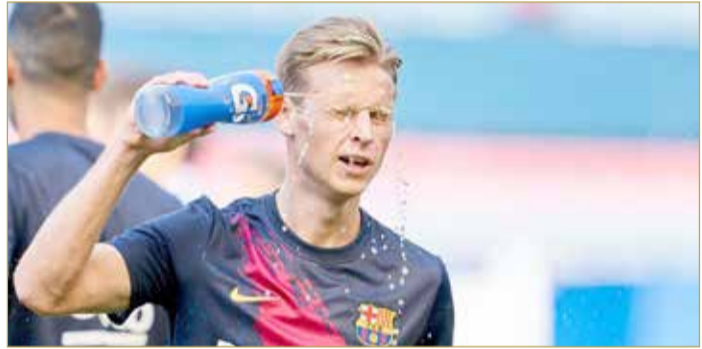
فرينكي دي يونج

انتقد فرانك دي بور، مدرب أياكس السابق، طريقة تعامل إرنستو فالفيديري المدير الفني لبرشلونة الإسباني، مع فرينكي دي يونج، لاعب وسط البلوجرانا. وأكد لاعب البارسا السابق، أنه فوجئ بالمركز الذي يلعب فيه دي يونج تحت قيادة فالفيديري. وقال دي بور في تصريحات وفقًا لصحيفة "موندو ديبورتيفو": "لقد رأيت المباراة الأخيرة لبرشلونة، وفرينكي كان يلعب متطرفًا في وسط الملعب،