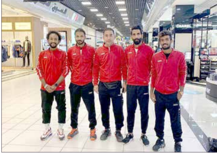
منتخبنا لدى مغادرته أرض الوطن

تشارك مملكة البحرين في تصفيات كأس ديفيس للمجموعة الرابعة الآسيوية التي تقام فعالياتها بمدينة الحسين الرياضية بعاصمة المملكة الأردنية الهاشمية عمان بمشاركة 15 دولة. وتوجه منتخبنا الوطني للتنس للرجال إلى عمان مساء أمس للمشاركة في التصفيات خلال التي تقام في الفترة من 9 ولغاية 15 سبتمبر الجاري.