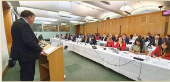
المنتدى البرلماني العالمي لحرية الإعلام المنعقد في العاصمة البريطانية

الآخرين لجعل هذه الآليات الدولية أكثر فعالية. كما ركزت أوراق العمل على أهمية ضمان الحفاظ على بيئة عادلة ومنفتحة وتنافسية للصحفيين للعمل داخلها.