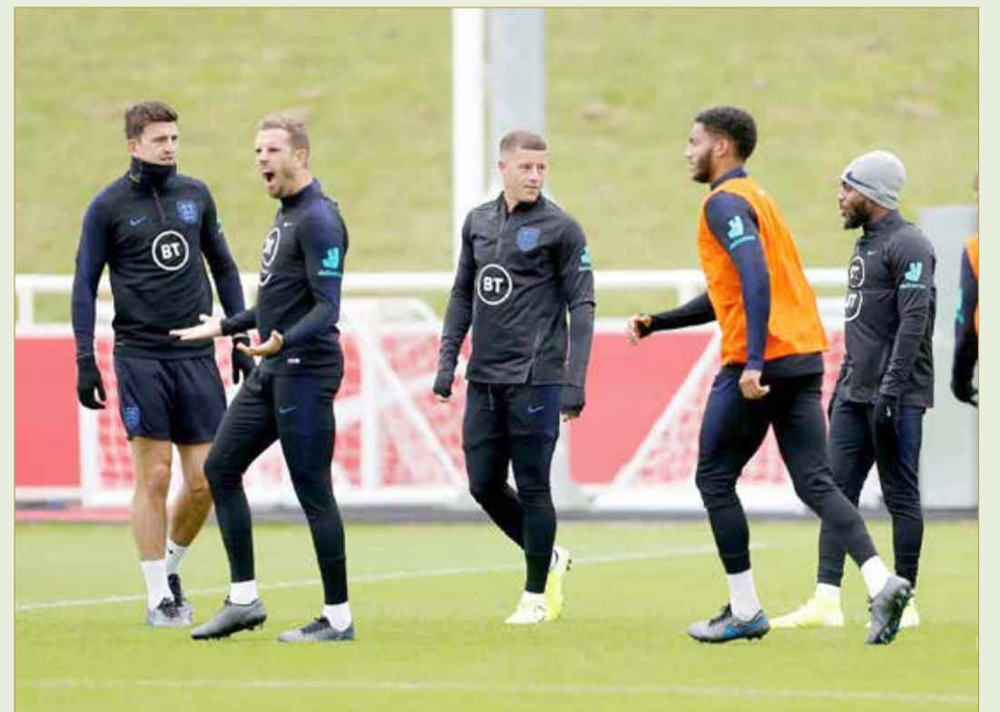
من استعدادات منتخب إنجلترا

وكان نصيب هداف المنتخب وتوتتهام هاري كاين 6 أهداف بينها هاتريك في مرمى بلغاريا رافعا رصيده إلى 25 هدفا في 40 مباراة دولية، ورحيم ستيرلينغ مهاجم مانشستر سيتي 4 أهداف بينها هاتريك في مرمى الجمهورية التشيكية. وأحرز منتخب الأسود الثلاثة لقبًا كبيرًا واحدًا عندما استضاف كأس العالم عام 1966 بالفوز على ألمانيا الغربية 4-2 بعد