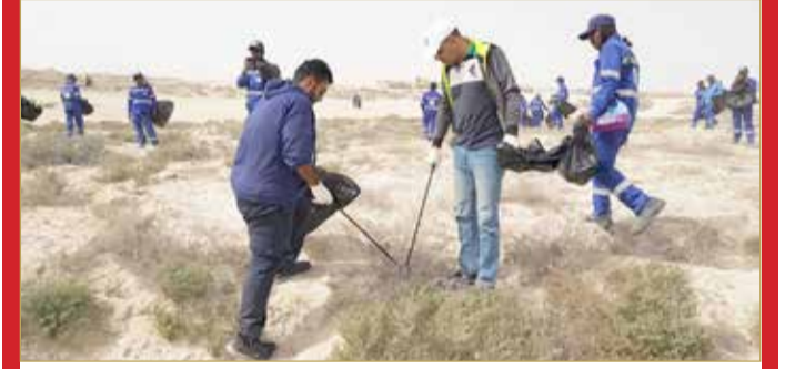
جانب من إحدى حملات النظافة (أرشيفية)