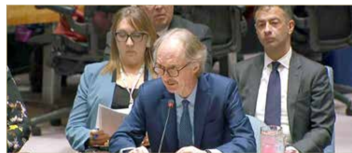
المبعوث الدولي إلى سوريا غير بيدرسون

وحذر من المعاناة المستمرة في سوريا، واليأس المنتشر بين السوريين. وأوضح أن الشعب السوري هو من سيوافق على الدستور الجديد، مؤكدا أن اللجنة الدستورية لن تحل الأزمة السورية بمفردها. وأكد بيدرسون أن شبح الانفجار الإقليمي بسبب أزمة سوريا مازال يلوح بالأفق.