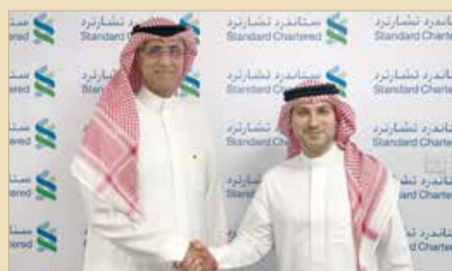
أثناء إبرام اتفاق الرعاية

تحت رعاية صاحب السمو الملكي رئيس الوزراء