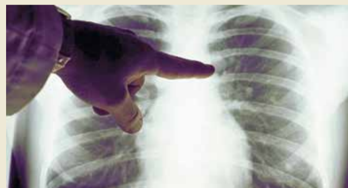
يصيب سرطان الثدي نحو 55 ألف بريطانية في السنة

في الدراسة تم منح ثلثي المشاركات عقاقير العلاج المناعي مع العلاج الكيميائي، في حين كانت الباقيات يعتمدن العلاج الكيميائي فقط.