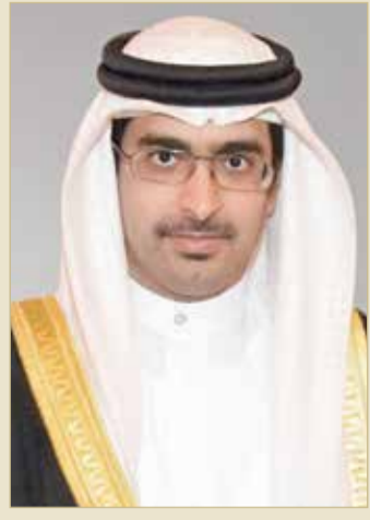
سمو الشيخ خليفة بن علي

ويهدف المنتدى إلى إبراز دور رواد الأعمال الشباب البحرنيين والأعمال المميزة، التي تعزز من دور المحافظة لتكون مركزا مهما لبيكونوا جزءا من المبادرات المجتمعية للمحافظة الجنوبية، نحو تمكين أفراد المجتمع إلى منصات الريادة والإبداع، إضافة إلى تعزيز دور رواد الأعمال الشباب