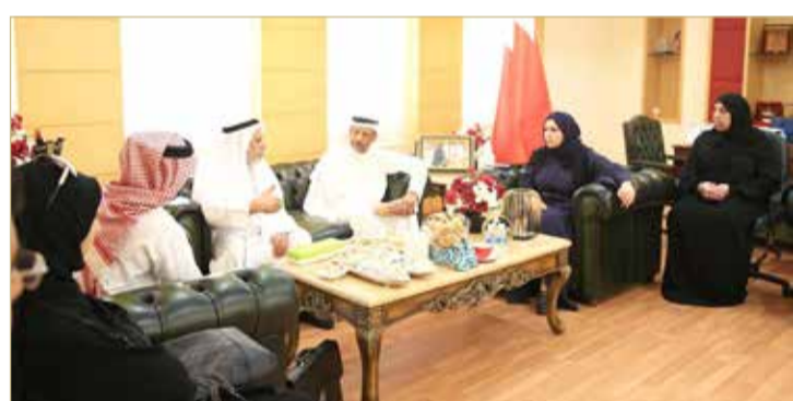
الفضالة: نحن وزارة خدمية ومن مهامنا التواصل مباشرة مع المواطنين

◆ 30 مراجعاً في اليوم المفتوح ومناقشات ودية