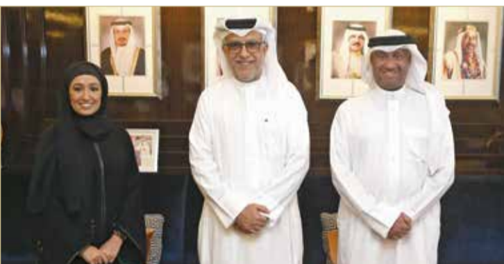
... ومستقبلاً عالية المناخي