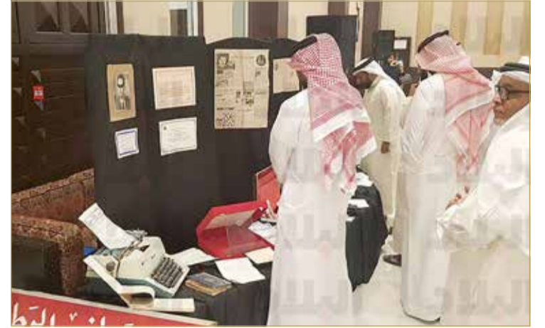
جانب من معرض مقتنيات الشخصية