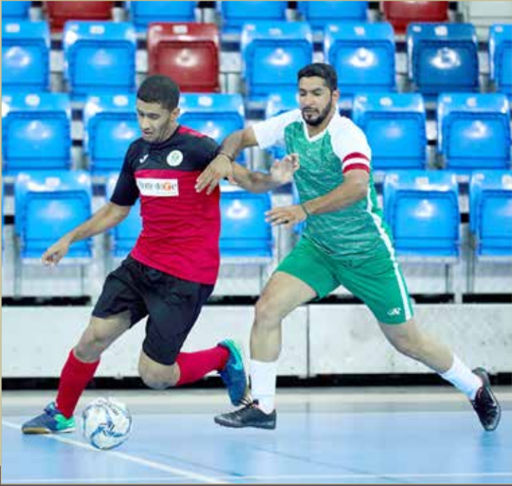
لقاء سار والسهلة الجنوبية