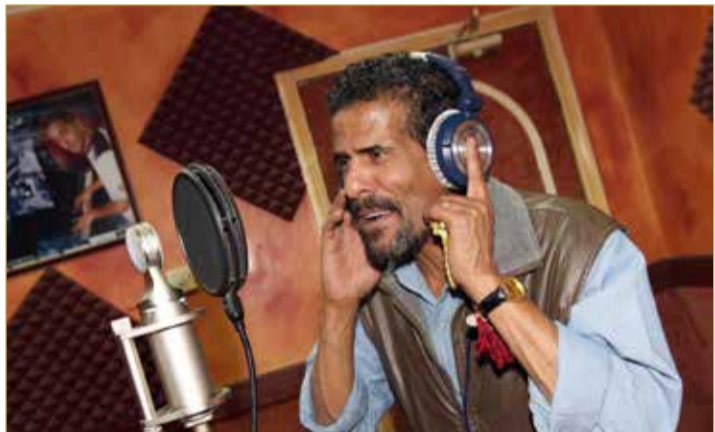
الفنان الراحل علي بحر