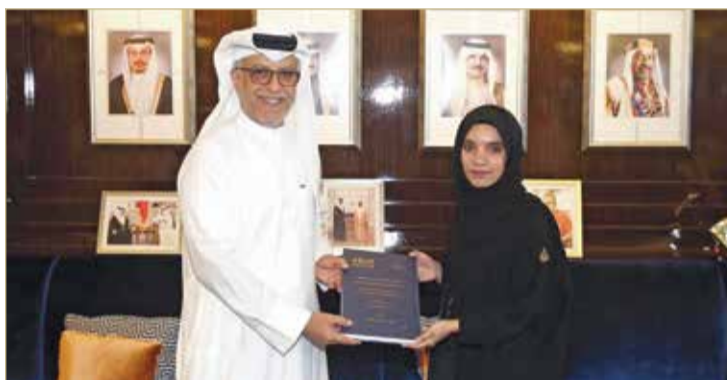
... ومستقبلاً وفاء عون