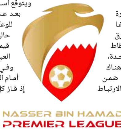
NASSER BIN HAMAD PREMIER LEAGUE

البلاد | أحمد مهدي تنتقل اليوم (الثلاثاء) منافسات الجولة الثالثة لدوري ناصر بن حمد الممتاز، وذلك بإقامة لقاءين على استاد الشيخ علي بن محمد آل خليفة. يلعب الحد أمام النجمة عند 6 مساءً، والرفاع الشرقي أمام الأهلي عند 8.30 مساءً. وتستكمل مباريات الجولة غدا (الأربعاء)، إذ يلعب النمامة مع الحالة، والمحرق مع الشباب، على استاد مدينة خليفة الرياضية، على أن تختتم المباريات يوم الجمعة 4 أكتوبر الجاري بلقاء البستين مع الرفاع على استاد الشيخ علي بن محمد آل خليفة. ويشير ترتيب الدوري حاليا إلى صدارة الحد برصيد 6 نقاط، النمامة وصيفا برصيد 4 نقاط، الأهلي والنجمة والمحرق والرفاع الشرقي والشباب برصيد 3 نقاط لكل واحد منهم، البستين نقطة واحدة، والرفاع والحالة بلا نقاط، علما أنه هناك لقاء موقبل بين المحرق والرفاع، ضمن الجولة الأولى، بعد غيابهما؛ بسبب الارتباط بكأس محمد السادس للأندية العرب الأبطال. وبالعودة إلى مباريات اليوم، فإن