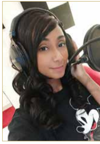
البحرين منبع الإبداع والتميز