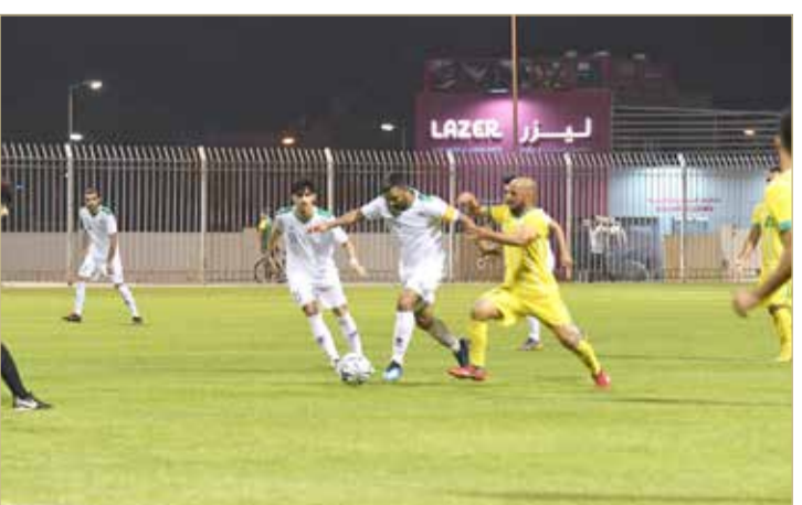
من لقاء المالكية والبديع

صار كالاتي: المالكية والبحرين 9 نقاط لكل واحد منهما، البديع 6 نقاط، سطرة والاتفاق 4 نقاط لكل واحد منهما، قلالي 3 نقاط، التضامن ومدينة عيسى والاتحاد جميعهم بلا نقاط.