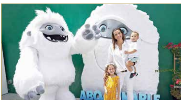
الفيلم حقق نحو 21 مليون دولار

فيلم أبوميابل كان الأحدث إنتاجًا نهاية الأسبوع، وهو إنتاج مشترك بين الولايات المتحدة والصين بين شركتي دريم وركس التابعة لشركة يونيفرسال واستوديوهات بيرل الصينية، ولذا فإن عرضه في الصين سيسهم بشكل كبير في نجاحه.