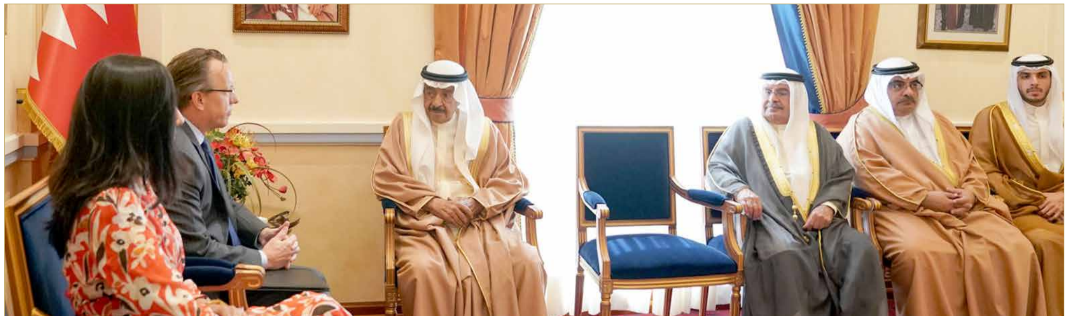
سمو رئيس الوزراء مستقبلا السفير الأميركي

◆ تطوير أطر التعاون وفتح مجالات أوسع لتنمية الاستثمارات