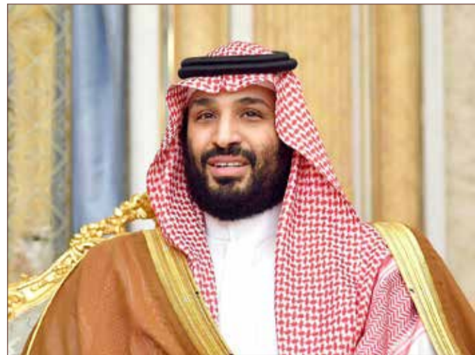
ولي العهد السعودي الأمير محمد بن سلمان

حذر ولي العهد السعودي الأمير محمد بن سلمان خلال مقابلة تلفزيونية من أن أسعار النفط يمكن أن ترتفع إلى أرقام خيالية ما لم يتخذ العالم موقفا قويا لردع إيران، لكن قال إنه يفضل الحل السياسي على الحل العسكري. وفي مقابلة مع برنامج 60 دقيقة على شاشة قناة (سي.بي.إس)، قال الأمير محمد "إذا لم يتخذ العالم موقفا قويا لردع إيران، فسئرى المزيد من التصعيد"، مضيفا أن إمدادات النفط ستتتعطل وسترتفع أسعار الخام إلى أرقام خيالية.