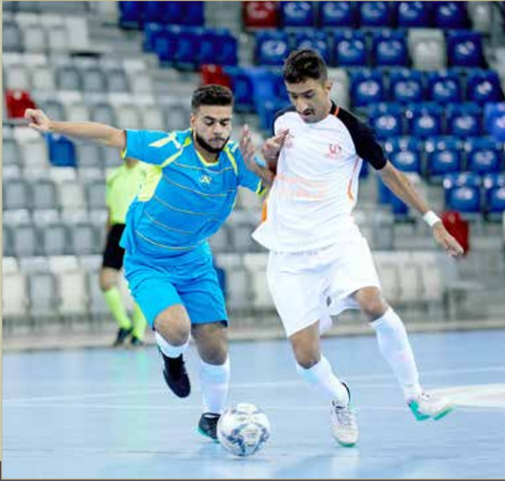
لقاء سافرة والنعيم