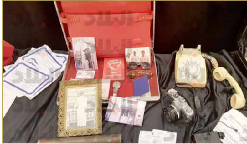
مجموعة من مقتنيات المرحوم