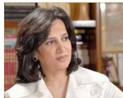
الشيخة مي بنت محمد

وفاز في هذه الدورة التي تقدم لها 1745 مرشحا، كل من علي جعفر العلق من العراق في مجال الشعر، بينما فازت علوية صبح من لبنان في مجال القصة والرواية المسرحية. أما محمد لطفي اليوسفي من تونس، فقد فاز في مجال الدراسات الأدبية والنقدية، بينما فاز حيدر إبراهيم علي من السودان في مجال الدراسات الإنسانية والمستقبلية.