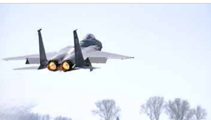
في التجربة كانت هناك 300 طائرة أميركية تحلق في الأجواء

وخيم السكون على مدار 24 ساعة على قاعدة التحكم في قاعدة العديد الجوية، التي من المفترض أن تكون واحدة من الأكثر انشغالا في العالم، وختل تماما من الموظفين. وتعد القاعدة الأميركية العسكرية الأضخم في الشرق الأوسط، والتي تتخذ من قطر مقرا لها. وقالت صحيفة "واشنطن بوست" الأميركية أن تهديدات إيران المستمرة في المنطقة دفع سلاح الجو الأميركي إلى اختبار هذا الإجراء، لا سيما أن