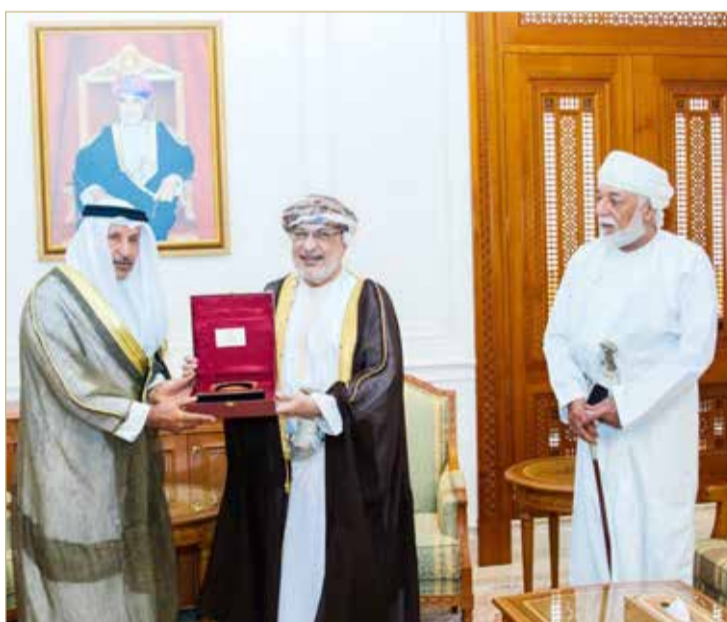
لقطة من الزيارة

جاء ذلك بعد زيارة وفد التوأمة الشبابي والرياضي من مملكة البحرين إلى سلطنة عمان برئاسة صالح بن هندي وتعتبر هذه الزيارة التأسيسية لهذه التوأمة. وقد التقى صالح بن هندي والوفد المرافق بكبار المسؤولين في السلطنة، حيث التقى رئيس مجلس الدولة يحيى بن محفوظ وكذلك بوزير الشؤون الرياضية الشيخ سعد بن محمد ووكيل الوزارة الشيخ رشاد بن أحمد. واشتملت الزيارة على اللقاء مع خالد البوسعيدي رئيس اللجنة الأولمبية العمانية والاتحاد العماني للتنس الأرضي. وسادت أجواء الزيارات واللقاءات عمق ومتانة العلاقات الرياضية الوثيقة التي تربط