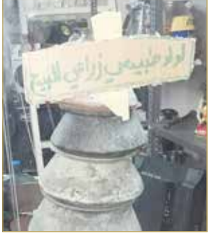
إعلان على واجهة المحل

يعرض محل في السوق الشعبية بمدينة عيسى لؤلؤاً مزروعاً للبيع، رغم أن القانون يمنع الاتجار به، ويحاسب عليه. ولم يتسن لمندوب "البلاد" الحديث مع صاحب المحل، الذي وضع لوحة على واجهة محله "جهازاً نهاراً" تؤكد وجود لؤلؤ طبيعي مزروع للبيع.