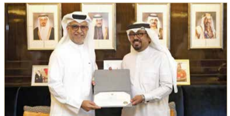
الشيخ سلمان بن إبراهيم مستقبلاً فيصل الشروقي

النماة - الأمانة العامة للمجلس الأعلى للشباب والرياضة