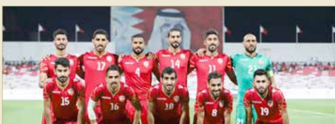
منتخبنا الوطني الأول لكرة القدم