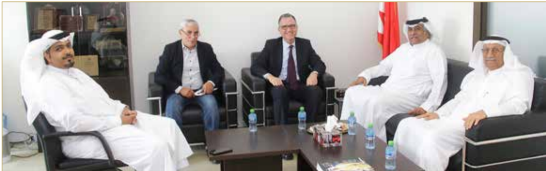
من اليمين: البحر، المردي، السفير المغربي، هام، الغائب

استقبل رئيس التحرير مؤسس المردي بكتبه سفير المملكة المغربية الشقيقة لدى مملكة البحرين مصطفى بنحبي، وذلك بمناسبة تعيينه سفيراً لبلاده بالمنامة. ورحب المردي بسفير الرباط، مؤكداً متانة علاقة الأخوة بين قيادة البلدين والشعبين، لافتاً إلى عمق الشراكات القائمة بين البلدين بمختلف المجالات، والتي انعكست بزيادة وتيرة ازدهار النشاط وتطوره بمجالات برلمانية وثقافية واقتصادية وتنموية ورياضية وغيرها.