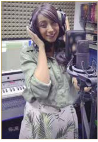
الفنانة العمانية ريم الهنائي