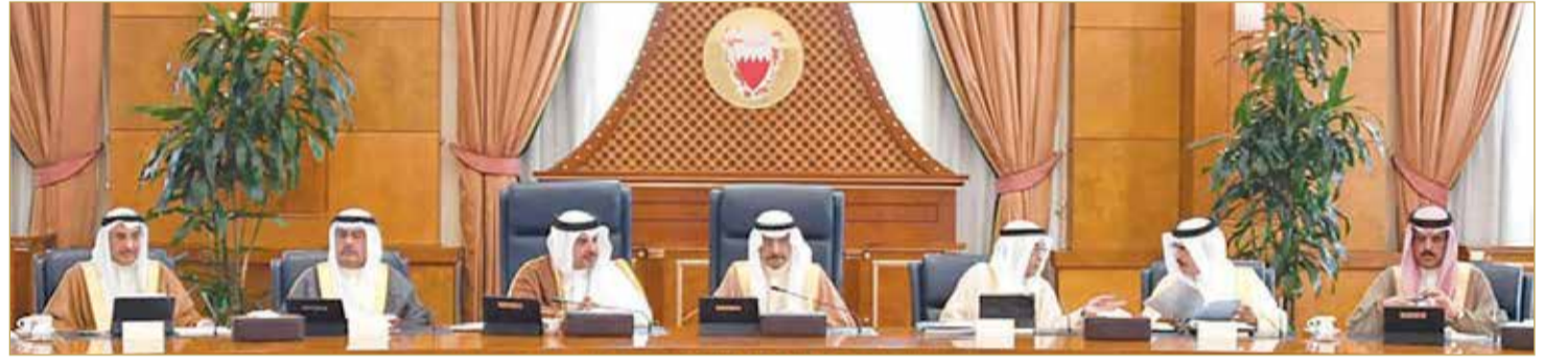
سمو رئيس الوزراء وبحضور سمو ولي العهد مترنسا جلسة مجلس الوزراء

سمو رئيس الوزراء يوجه للاستغناء عن استخدام الكبائن كصفوف مدرسية