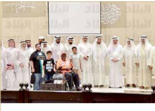
لقطة تذكارية من الحفل