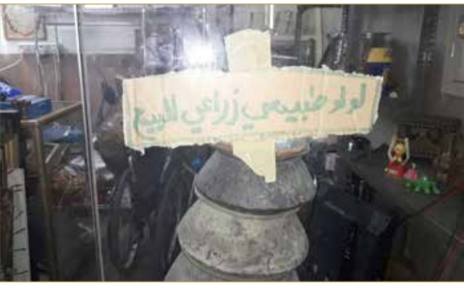
إعلان على واجهة المحل يؤكد بيع اللؤلؤ المزروع

مخالفًا للقانون... وعيون "التجارة" غافلة