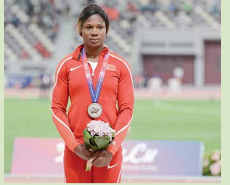
أمينات صاحبة فضية آسيا 2019