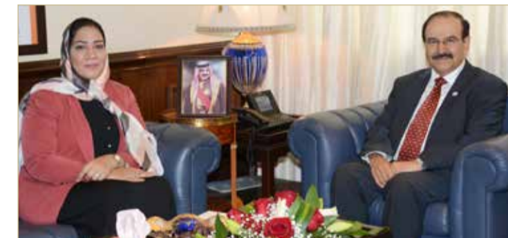
وزير الكهرباء والماء مستقبلاً فاطمة القطري

في هيئة الكهرباء والماء للتخصصات الهندسية، حيث أعطت النائب فاطمة القطري اهتماماً بهذا الإعلان، وقالت إنه فرصة سانحة لأبناء الوطن التطوير الوظيفي. وكان ديوان الخدمة المدنية قد أعلن مؤخراً عن بعض الوظائف الشاغرة