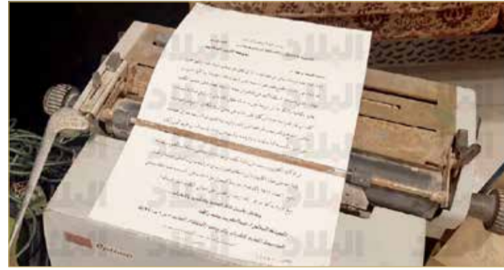
آلة كتابة تعلم عليها كثير من البحرينيين