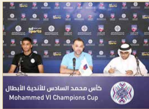
المؤتمر الصحافي للرفاع