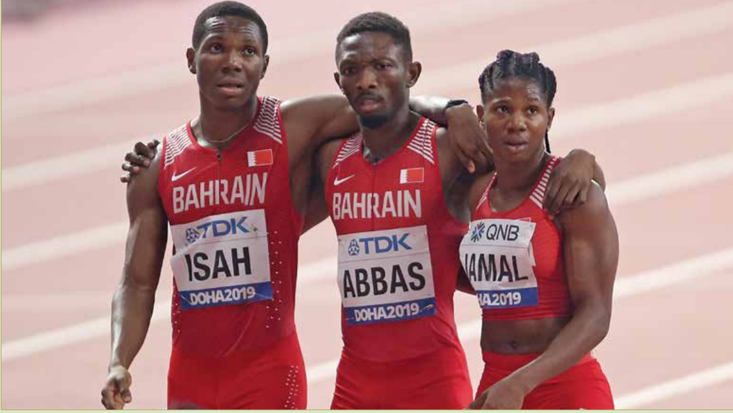
فريق المتابع بعد الفوز