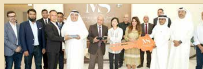
بدء عملية تسليم الوحدات