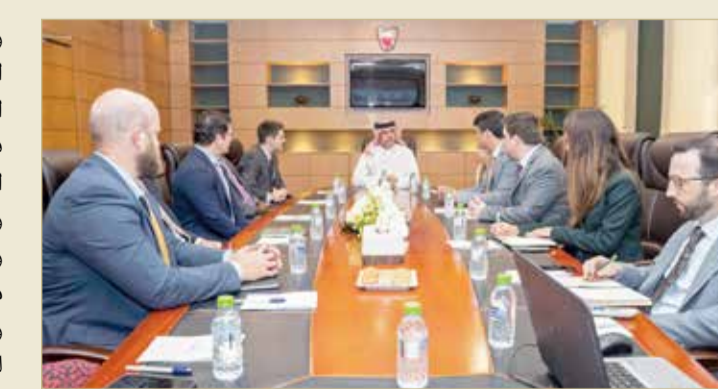
مساعد وزير الخارجية مستقبلاً وفدا من موظفي مجلسي النواب والشيوخ الأمريكي

وحامية لمسيرة البناء والرفاهية والعيش الكريم، وأن تلك الإنجازات والجهود الوطنية قد لبثت تطلعات المملكة وشعبها في أفضل الممارسات والنجاحات في تمتع بالحقوق الديمقراطية والمدنية والسياسية والاقتصادية والاجتماعية والثقافية. من جانبهم، أعرب موظفي مجلسي النواب والكونغرس الأمريكي عن تقديرهم لقاء مساعد وزير الخارجية، مشيدين بما تشهده العلاقات الصداقة القائمة بين مملكة البحرين والولايات المتحدة الأميركية من تطور ونماء في مختلف المجالات، متمنين لمملكة البحرين المزيد من التقدم والازدهار. كما جرى خلال اللقاء استعراض عدد من الموضوعات والقضايا على الساحتين الإقليمية والدولية ذات الاهتمام المشترك.