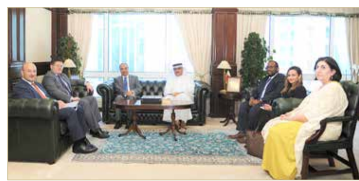
وزير الأشغال مستقبلاً سفير المملكة المتحدة

من جانبه، أشاد السفير البريطاني بالتعاون الذي تبديه الوزارة مع السفارة من جهود نحو تعزيز أواصر التعاون في مجال البنية التحتية، متمنياً استمرار التعاون بين الجانبين لمواصلة نهج التطور والازدهار.