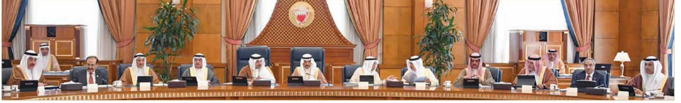
سمو رئيس الوزراء، بحضور سمو ولي العهد، مترنسا جلسة مجلس الوزراء أمس

◆ مجلس الوزراء يشيد بنتائج زيارة جلالة الملك للسعودية.. وسمو رئيس الوزراء يصدر عدة توجيهات