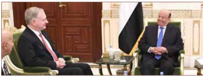
الرئيس اليمني خلال لقائه السفير الأميركي

وحذر في لقائه السفير الأميركي كريستوف هينزل، بحسب ما أفادت وكالة الأنباء اليمنية، أمس، من "الخطر والأطماع الإيرانية عبر أدواتها الانقلابية المختلفة على اليمن والمنطقة، التي تؤكد تنامي الخطر الإيراني على العالم والملاحة الدولية". كما أعرب عن تقدير الحكومة اليمنية لجهود الولايات المتحدة الأميركية، ودعمها لليمن ومسارات السلام. من جهته، أكد السفير الأميركي دعم بلاده