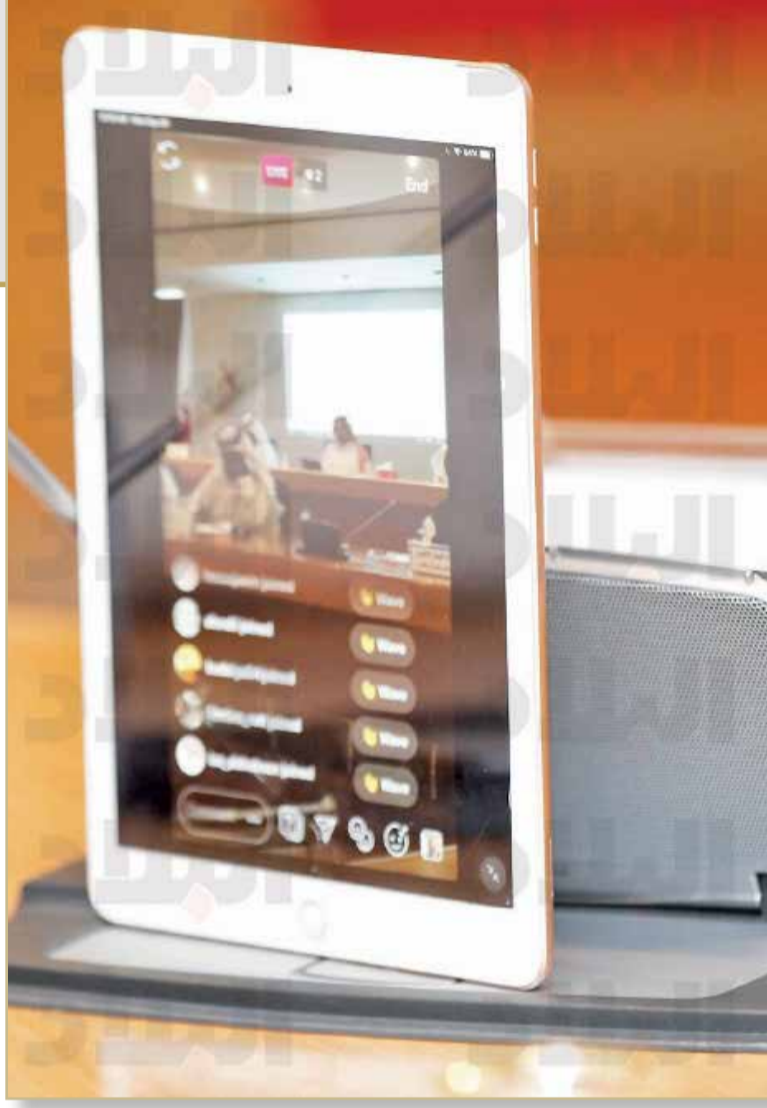
أحد الأعضاء البلديين لدى بثه مجريات الاجتماع الاعتيادي على حسابه عبر شبكات التواصل الاجتماعية