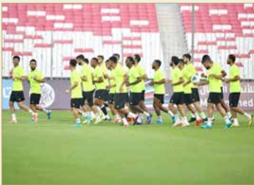
من تدريب الرفاع أمس على الاستاد الوطني

المغربي ممتاز، مشيرا إلى أن الرفاع خاض تدريبه الأخير قبل المباراة بتواجد جميع اللاعبين في القائمة. وبين مدرب الفريق السماوي أن الرفاع يسعى لتقديم مستويات تليق بكره القدم البحرينية وترفع اسمها في سماء الكرة العربية، موضحا معرفته التامة بنقاط القوة والضعف للفريق المغربي. ولفت إلى أن الرفاع حضر بدنيا ومهاريا وذهنيا للمباراة، مبيانا أن حظوظ فريقه أكبر