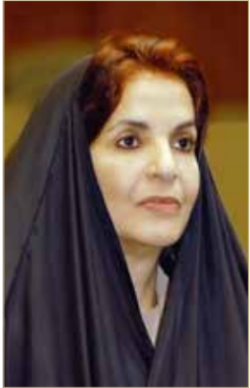
سمو الأميرة سبيكة بنت إبراهيم

وإسهاماتها القيمة، مكررة في مثل هذه المناسبة السعيدة، فخر سموها برئيسة هيئة البحرين للثقافة والآثار كأحد نساء الوطن الجديرات بالتقدير بتوليهن لمسئولياتهن الوطنية باقتدار، وحرصهن الدائم على العطاء المتميز وتقديم ما يحفظ للبحرين مكانتها الرائدة بين الأمم.