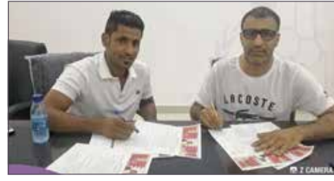
جانب من توقيع العقد