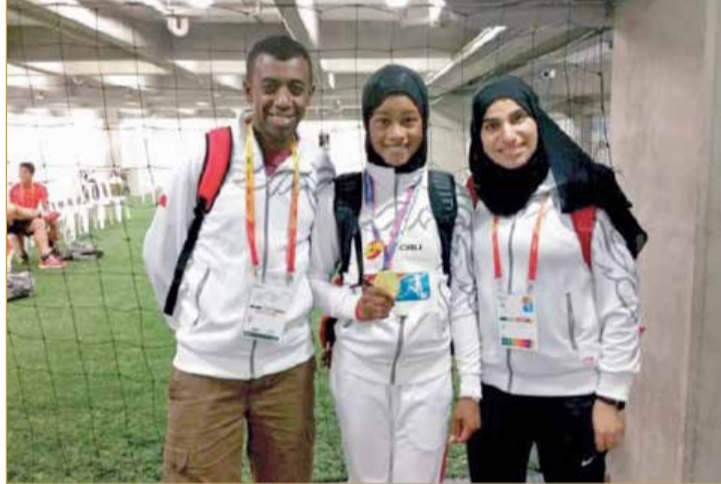
سلوى عيد متوجة بذهبية بطولة العالم للناشئين بكولومبيا 2015

بعد النجاحات العالمية والقارية المتعددة كان لا بد للعداءة سلوى عيد أن تشارك في منافسات الدوري الماسي وتخوض أكبر عدد من السباقات سعياً وراء الاحتكاك مع عمالقة العداءات في العالم وتحسين زمنها، وكعادتها فقد فاجأت الجميع وفازت بلقب الدوري الماسي في 2018 وبآتي هذا الإنجاز بعد الفوز في 7 انتصارات بالدوري الماسي لتتربع على عرش سباق 400 متر للسيدات على مستوى العالم وتفرض هيمنتها المطلقة. وفي الدوري الماسي لهذا العام 2019 توجت العداءة باللقب للعام الثاني على التوالي، حيث اعتلت صدارة الترتيب العام لسباق 400 متر في الدوري الماسي بعدما حققت 40 نقطة في جميع الجولات التي خاضتها ونجحت في تحقيق المركز الأول 5 مرات، ودخلت العداءة 78 سلوى عيد التاريخ باعتبارها أول عداءة عربية وآسيوية تفوز بلقب الدوري الماسي في سباق 400 متر للسيدات مرتين متتاليتين.