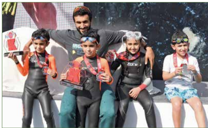
سمو الشيخ ناصر بن حمد أنجاله

موقع البطولة يستقبل طلبات المشاركة وارتفاع عدد المشاركين