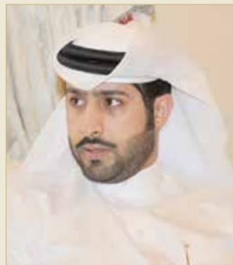
الشيخ دعيح بن عيسى

الوطن والاقتصاد الوطني، من خلال تعزيز وتطوير العلاقات الاقتصادية والثقافية والاجتماعية بين البحرين ودول الآسيان العشر وهي “إندونيسيا، ماليزيا، سنغافورة، بروناي، ميانمار، تايلند، كمبوديا، لاوس، فيتنام،