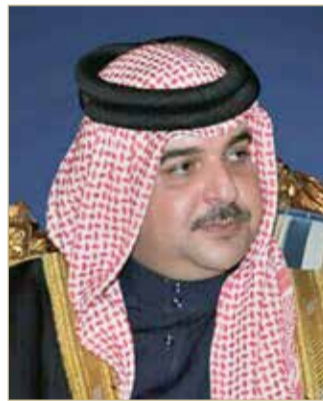
سمو الشيخ عبدالله بن حمد

عليها، والمشاركة في مواجهة التحديات التي تواجه العالم فيما يتعلق بالمتغيرات المناخية. وقال سمو الشيخ عبدالله بن حمد آل خليفة إن "مملكة البحرين ممثلة بالمجلس الأعلى للبيئة استطاعت من تحويل التحديات المختلفة التي واجهت العمل البيئي إلى الوصول إلى أفضل النتائج والإنجازات، وتحقيق إشادات متميزة دولية من منظمات أممية ودولية ومدنية مختلفة في العمل البيئي بما تحقق للمملكة من مستوى متطور في العمل البيئي، واستطعنا أن نقدم تجاربنا ومساهماتنا إلى دول عدة، بالإضافة إلى طرح المبادرات النوعية في تطوير الوضع البيئي والمناخي في المملكة، واستحداث مشاريع بيئية محسنة للظروف المناخية"، مشيراً سموه