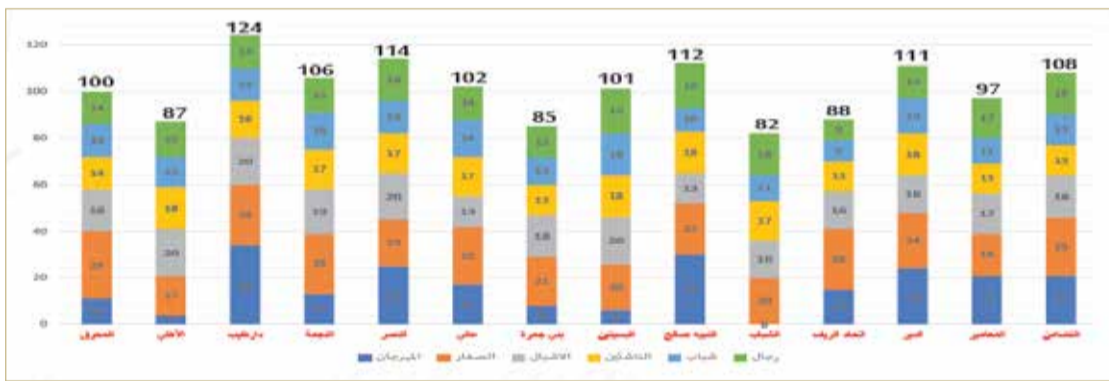
إحصائية بعدد لاعبي الأندية في الموسم الماضي 2018 - 2019

تصدر نادي داركليب قائمة الأندية الأكثر تسجيلاً للاعبين بمختلف الفئات في الموسم الماضي 2018/2019 ابتداء من فئة الرجال حتى فئة المهرجان بعدما سجل ما يقارب من 123 لاعباً في كشوفات الاتحاد البحريني لكرة الطائرة بالفئات الست (الرجال، الشباب، الناشئين، الأشبال، الصغار، المهرجان)، وهي انعكاس طبيعي لاهتمام النادي بالعبة وتصديره للعديد من المواهب والخامات إلى باقي الأندية الوطنية، حتى بات لا يوجد ناد في البحرين بلعبة الكرة الطائرة لا يوجد به لاعب من داركليب.