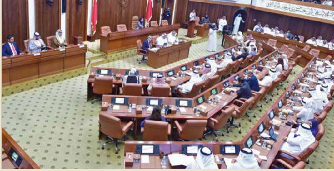
جلسة مجلس النواب الأولى

◆ زينل في الجلسة الأولى لدور الانعقاد الثاني