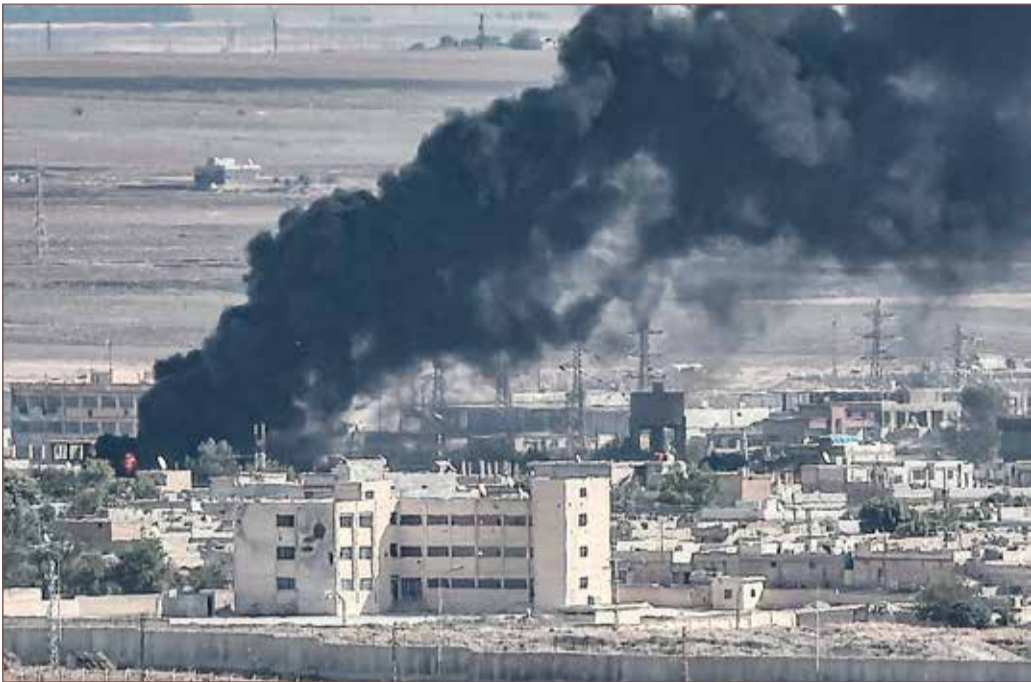
دخان يتصاعد من مدينة رأس العين الحدودية بشمال شرق سوريا أمس الأحد

بدأت وحدات من جيش النظام السوري، أمس الأحد، بالتحرك باتجاه شمال البلاد "لمواجهة العدوان التركي"، وفق ما أفادت وكالة الأنباء السورية الرسمية (سانا)، في اليوم الرابع من هجوم أنقرة وفصائل سورية موالية لها ضد المقاتلين الأكراد. ولم تورد الوكالة الرسمية أي تفاصيل إضافية وما إذا كان هذا التحرك يأتي في إطار اتفاق مع الأكراد، في وقت قال مسؤول كردي لوكالة فرانس برس أن هناك "مفاوضات" بين الإدارة الذاتية الكردية والحكومة السورية.