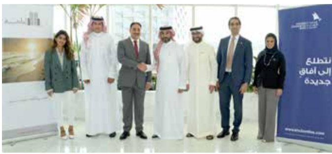
عقب توقيع الاتفاقية بين الجانبين

الطبي بالتعاون مع "إدامة" والذي يعتبر مرفقاً حيوياً سيساهم في سهولة وصول المواطنين للخدمات الطبية، إننا في المصرف الخليجي التجاري نحرس على أن ندخل في شراكات ذات بعد إستراتيجي بالإضافة إلى مساهمتها في دعم توجهات الحكومة لتطوير القطاعات المختلفة تحقيقاً للتنمية الشاملة للمملكة.