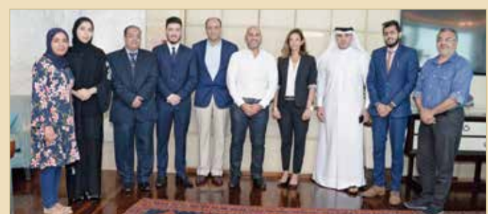
المشاركون في ورشة العمل