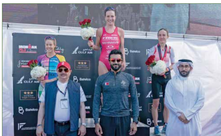
جانب من تنوع الإبطال سابقاً