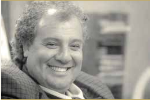
لشاعر زياد خداش

ترعرعت في ليبيا ومن ثم تنقلت بين لبنان وسوريا قبل عودتها إلى فلسطين، لها العديد من الدواوين الشعرية.