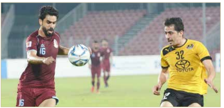
من لقاء الشباب والأهلي (إعلام نادي الشباب)

الثانية: الرفاع الشرقي 6 نقاط، مدينة عيسى 5 نقاط، قلالي 3، المالكية والمامة بنقطة: وحيدة لكل واحد منهما. المجموعة الثالثة: الأهلي 6 نقاط، المحرق والشباب بـ 4 نقاط لكل واحد منهما. الاتحاد 3، وأخيرًا الاتفاق بلا نقاط، المجموعة الرابعة: البسيتين 4 نقاط، النجمة والبحرين بنقطين لكل واحد منهما، وأخيرًا الحالة بنقطة واحدة.