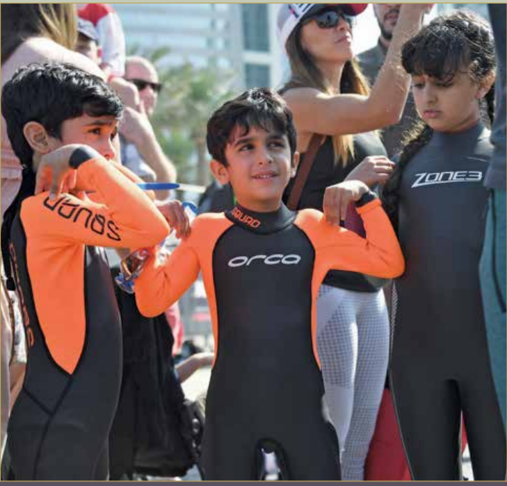
أنجال سمو الشيخ ناصر بن حمد خلال مشاركتهم في الفعاليات