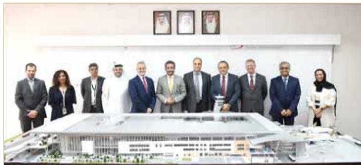
البنفلاخ: بني التقنية سيساهم بتحسين العمليات التشغيلية

مع أهداف الرؤية الاقتصادية 2030، وتظل شركة مطار البحرين ملتزمة بالاستثمار بكثافة في تعزيز قدرات تقنية المعلومات والاتصالات، وهو ما سيمكّنها بدوره من مواكبة مبادرات التحول الرقمي التي تشهدها البلاد. وتعد تقنية "Oracle Fusion" حالياً الأداة الوحيدة التي يستخدمها جميع موظفي شركات مطار البحرين