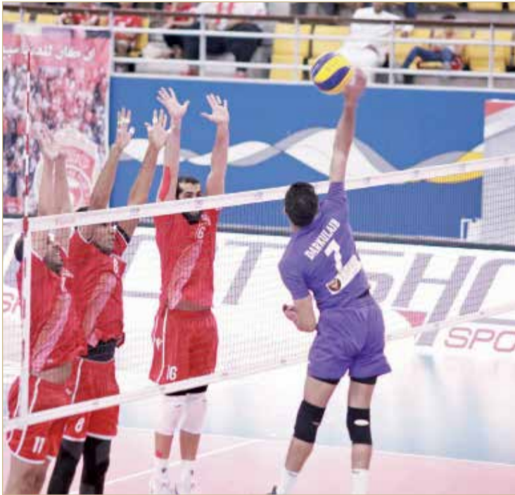
من منافسات الكرة الطائرة في الموسم الماضي

على الصعيد المحلي في ظل العدد الكبير من ممارسي اللعبة بمختلف فئاتها وهو ما يعكس الحراك المتميز وقدرة الأندية بالتعاون مع الاتحاد في استقطاب أعداد كبيرة من الشباب والناشئة والأطفال لممارسة نشاط الكرة الطائرة وتفرغ طاقاتهم ومواهبهم وهي الغاية الأسمى من الرياضة والتي لا تنحصر في المنافسة فقط.