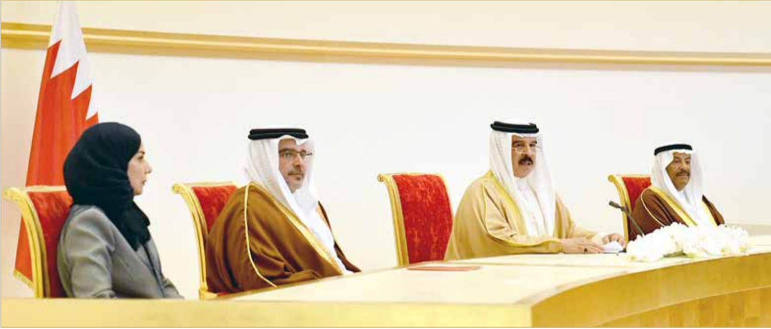
جلالة الملك لدى تفصله بحضور سمو ولي العهد بافتتاح دور الانعقاد الثاني لمجلسي النواب والشورى

♦ جلاله الملك: نحتاج تفكيراً متجدداً لحفظ تقدمنا بميادين العمل والإنتاج