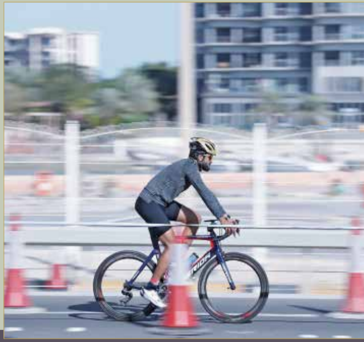
لقطة لمشاركة سمو الشيخ ناصر بن حمد في الفعاليات