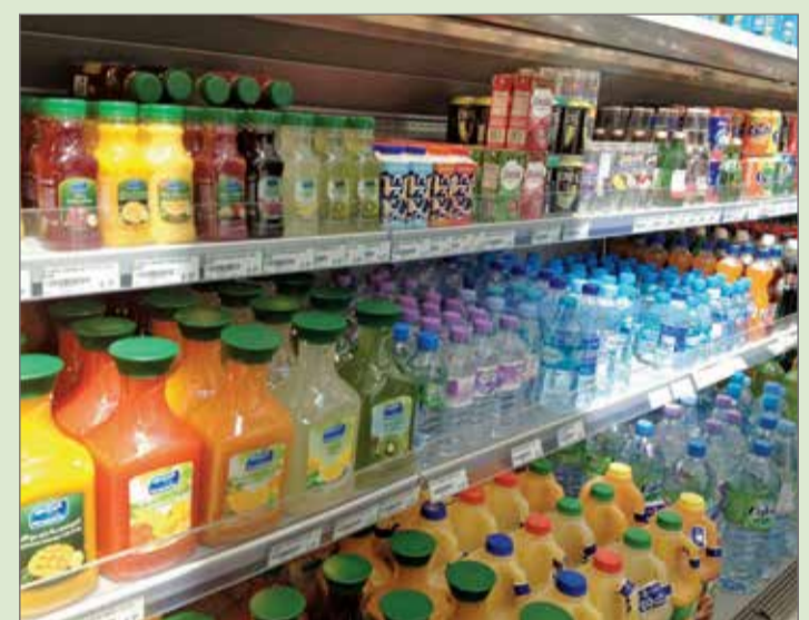
قطاعات كثيرة تعاني ”التستر التجاري“ وليس ”الأغذية“ فقط