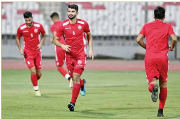
من تدريبات المنتخب الوطني

4 نقاط من لقاءين لكل واحد منهما، هونغ كونغ وكيمبوديا بواقع نقطة واحدة و3 لقاءات.