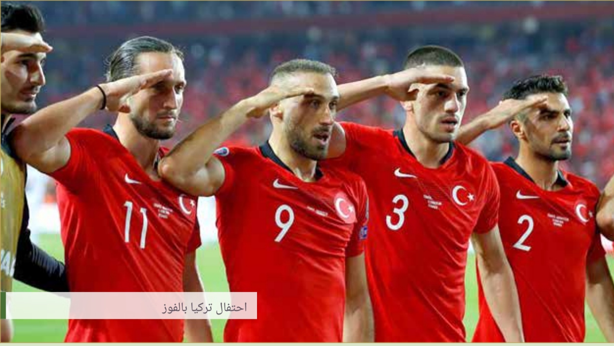
احتفال تركيا بالفوز

أعلن مسؤول الاتحاد الأوروبي لكرة القدم أن الاتحاد "سينظر" في معلومات أفادت أن لاعبين أتراكًا احتفلوا بفوز فريقهم على ألبانيا بأداء التحية العسكرية، في وقت ينفذ فيه الجيش التركي عملية في شمال شرق سوريا.