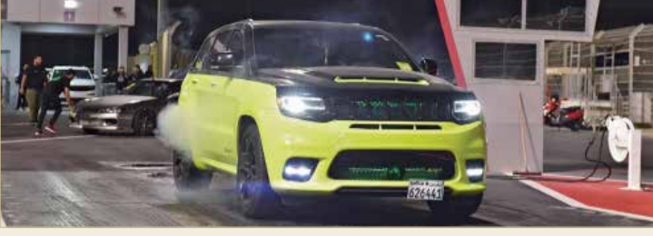
جانب من الفعاليات

وخصصت الحلبة مدرج بتلكو الرئيس ومشاهدة جوانب الإثارة كاملة المثل على المضمار الرئيس للفعالية بتذاكر تبلغ قيمتها 4 دينارين، فيما سيتمكن الراكبون من ملازمة السائقين في سياراتهم أيضاً لعيش اللحظة بمبلغ 4 دينارين.