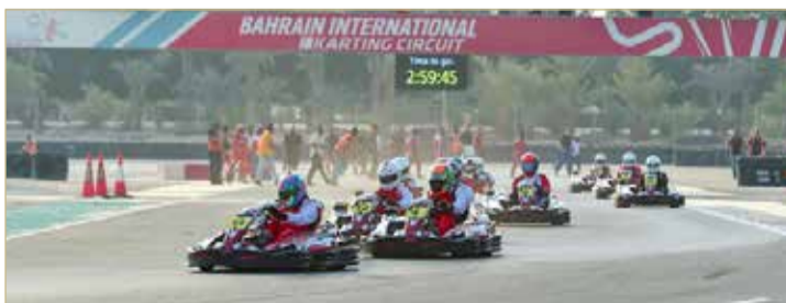
جانب من الفعاليات