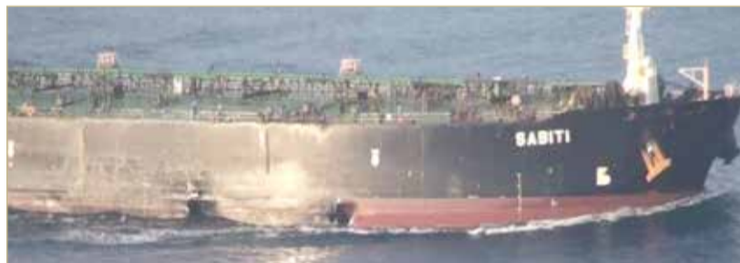
مقدمة الناقله تعرضت لكسر نتج عنه تسرب نفطي في البحر من شحنة وخزانات الناقله

◆ "سابيتي" أغلقت جهاز تتبعها قبل القرب من "سافيز"