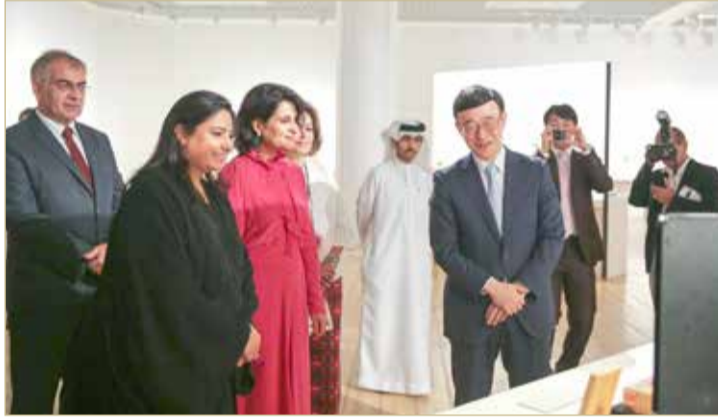
المنامة - هيئة البحرين للثقافة والآثار

افتتحت هيئة البحرين للثقافة والآثار مساء أمس معرض “دمي اليابان” بالتعاون مع السفارة اليابانية، وذلك في متحف الوطني بحضور حضور وكيل وزارة الخارجية الشيخة رنا بنت عيسى بن دعيح آل خليفة، مدير عام الثقافة والفنون بهيئة الثقافة الشيخة هلا بنت محمد آل خليفة، والسفير الياباني لدى البحرين هيديكي إيتو، إضافة إلى تواجد شخصيات دبلوماسية والعديد من المهتمين بالشأن الثقافي في المملكة. وبهذه المناسبة، أشادت الشيخة هلا بنت محمد بالحضور الثقافي الياباني المستمر في الحرار الحضاري في البحرين، شاكرة سفارة اليابان على تعاونها الدائم وحرصها على تقريب المسافات ما بين البلدين الصديقين. وأوضحت أن المعرض يقدم لمواطني ومقيمي وزوار البحرين فرصة للاطلاع على الثقافة اليابانية من زاوية مغايرة بما يعزز الانفتاح الحضاري الذي تعايشه المملكة هذه الأيام.