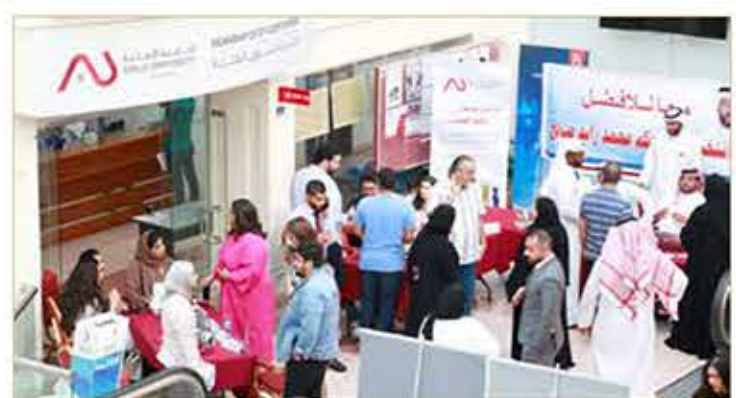
تستعد الجامعة لمؤتمر تكافؤ الفرص بين المرأة والرجل في نوفمبر

وذكرت أن الانتخابات تجري فيما تستعد الجامعة لإطلاق النسخة الثالثة من مؤتمر تكافؤ الفرص بين المرأة والرجل في نهاية شهر نوفمبر 2019 المقبل بالشراكة مع جامعة برنول البريطانية، وبمشاركة باحثين ومختصين من مختلف المؤسسات الرسمية والأهلية ذات العلاقة.