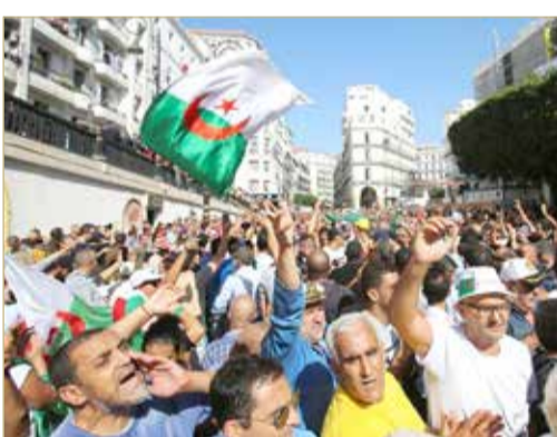
محتجون يهتفون خلال مظاهرة أمس ضد القانون المقترح

◆ المقترح يسمح في حالة إقرار البرلمان له بتجاوز ملكية الأجانب 49%