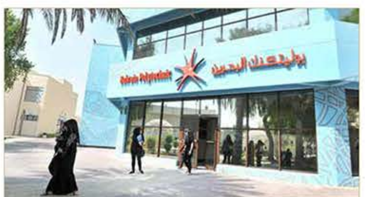
مدينة عيس - بوليتكنك البحرين

برعاية نائب رئيس مجلس الوزراء سمو الشيخ محمد بن مبارك آل خليفة نائب رئيس مجلس الوزراء رئيس المجلس الأعلى لتطوير التعليم والتدريب، تحتفل كلية البحرين التقنية (بوليتكنك البحرين) 15 أكتوبر (الثلاثاء) بتخريج الفوج السادس من طلبتها في البرامج التالية: البكالوريوس في تقنية الهندسة، والبكالوريوس في إدارة الأعمال، والبكالوريوس في تقنية المعلومات والاتصالات، والبكالوريوس في إدارة اللوجستيات العالمية.