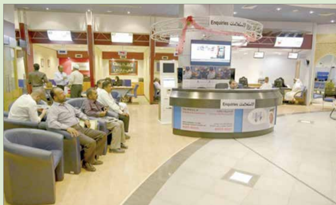
المشكلة عرضت على ”التجارة“ بغية بحرنة قطاع بيع الأغذية

وظل نشاط المؤسسات الفردية مقتصر على البحرينيين فقط في حين يسمح للأجانب بفتح أنشطة عن غير تأسيس شركات والتي تم تسهيلها في السنوات الأخيرة عبر إلغاء متطلبات رأس المال ما يعني افتتاح شركات بأقل قدر من التكلفة، لكن ظاهرة التستر التجاري