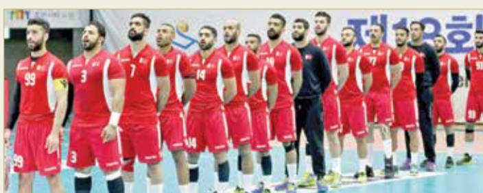
منتخبنا الوطني لكرة اليد

وقال باقر في تصريح لـ "البلاد سيورت" إن مجلس الإدارة والجهاز الإداري قد عمل في الفترة الأخيرة بكل جهد من أجل توفير كافة الأجواء المثالية لأفراد المنتخب، وذلك عبر التدريبات وإقامة المعسكرات وتأمين عدد من المباريات الودية مع مختلف الفرق الأوروبية. مضيقاً في معسكر سلوفينيا لعب منتخبنا 4 مباريات مع فرق نمساوية وكرواتية وسلوفينية، وتمكن مدرب منتخبنا آرون من خلق توفيق مميزة عبر المجموعة التي كانت تحت يده والتي افتتحت للاعبين المحترفين