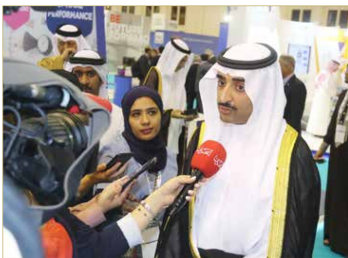
الشيخ محمد بن خليفة مصرا للصحافيين

البلاد | أمل الحامد من المنامة