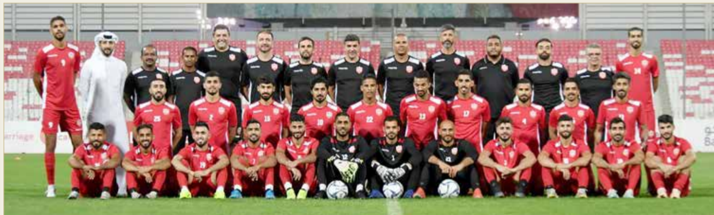
منتخبنا الوطني الأول لكرة القدم