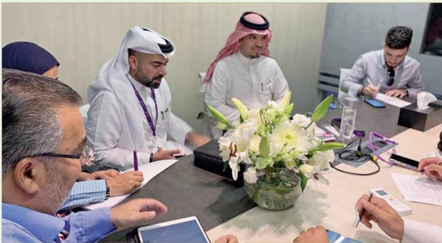
بانبيله ملتقى الصحفيين على هامش ”جيتكس 2019“

وذكرت السيد أن مشروعها الصغير الذي يعتمد على العبايات والجلابيات بعد ترويج ”أرتيزانا +973“ تمكن من فهم