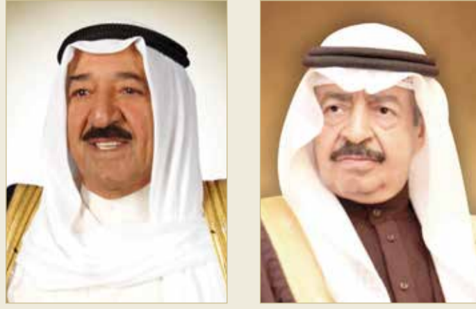
سنو الشيخ صباح الأحمد