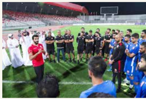
سمو الشيخ ناصر بن حمد يتحدث للاعبين

للمنتخب على الاستعدادات الأخيرة للمنتخب، كما استمع سموه إلى شرح مفصل عن الحالة الفنية والتجهيزات الإدارية للمنتخب قبل خوض مباراة اليوم أمام المنتخب الإيراني.