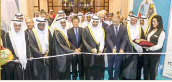
وزير النفط لدى افتتاحه مؤتمر ومعرض "مبييك 2019" (10)