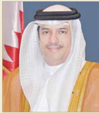
مساعد وزير الخارجية

وأكد مساعد وزير الخارجية حرص البحرين على تعزيز الشراكة مع الأمم المتحدة وأجهزتها الرئيسية ووكالاتها المتخصصة بما يخدم أهدافها السامية في الحفاظ على السلم والأمن الإقليمي والدولي، واحترام حقوق الإنسان، ودعم أهداف خطة التنمية المستدامة لعام 2030، وتطوير التعاون مع المفوضية السامية لحقوق الإنسان، لافتاً إلى توقيع المملكة لاتفاقية إطارية للشراكة الاستراتيجية مع 16 وكالة أممية للسنوات (2018 - 2022)، وهي الأولى من نوعها في منطقة الشرق الأوسط. وأشار إلى تنفيذ المملكة تعهداتها الحقوقية الطوعية بالتعاون مع مجلس حقوق الإنسان ضمن آلية الاستعراض