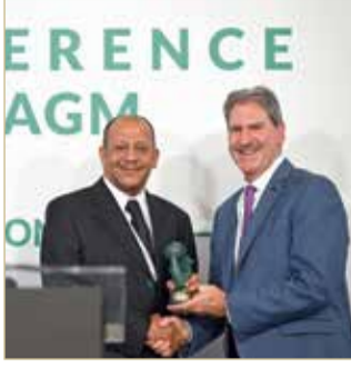
جانب من تسلم الجائزة

الدول الذين يري أنهم ساهموا في النهوض والارتقاء باللعبة على المستويين المحلي والدولي. وقد حضر تسليم الجائزة الشيخ عبد العزيز بن مبارك آل خليفة نائب رئيس الاتحاد البحريني للتنس، الذي أعرب عن جزيل شكره وتقديره لرئيس الاتحاد الدولي وأعضاء المجلس التنفيذي على هذه المبادرة الطيبة.