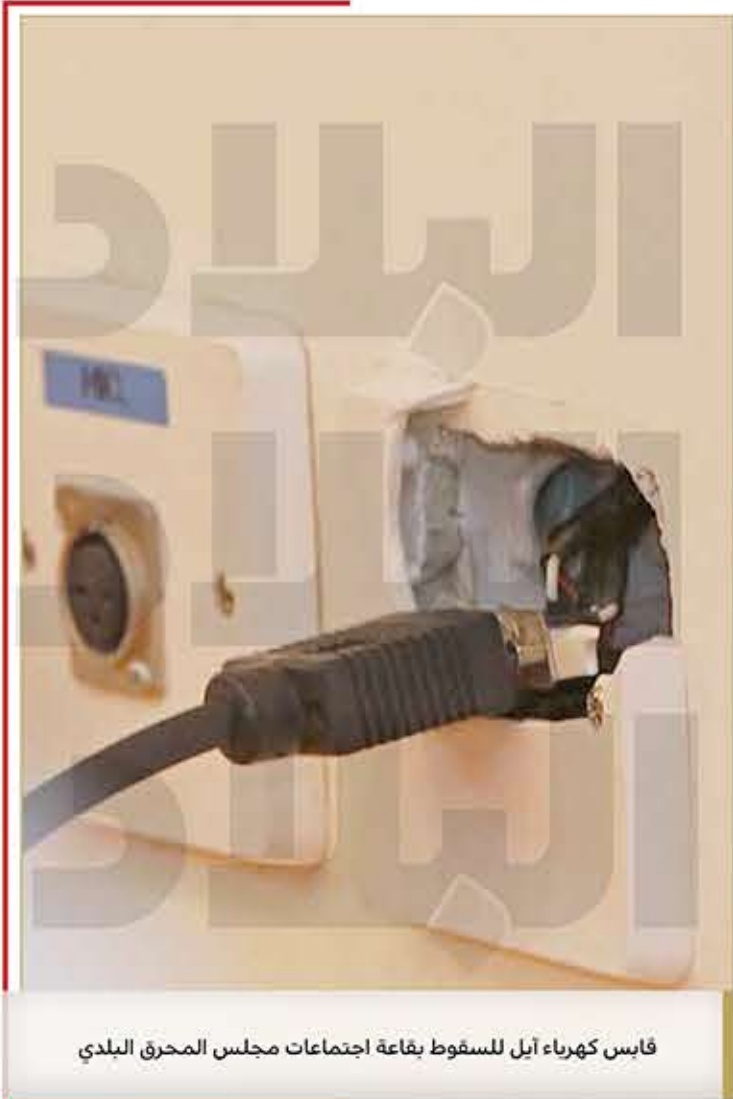
فابس كهرباء آيل للسقوط بقاعة اجتماعات مجلس المحرق البلدي