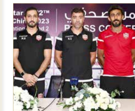
من المؤتمر الصحفي

وبين سوزا أن منتخبنا سيلعب أمام الفريق الإيراني المصنف 23 عالميا، مشيرا إلى أن منتخبنا سيقا تل