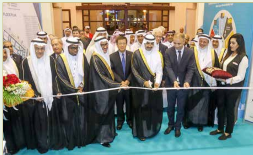
وزير النفط لدى افتتاحه مؤتمر ومعرض “مبيك 2019”

المنامة - الوطنية للنفط والغاز | (تصوير: خليل إبراهيم)