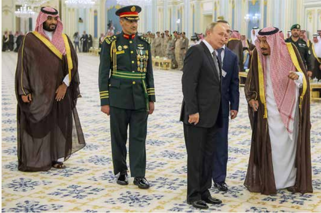
الملك سلمان والرئيس الروسي فلاديمير بوتين في الرياض أمس

وصف خادم الحرمين الشريفين الملك سلمان بن عبدالعزيز، أمس الإثنين، زيارة الرئيس الروسي فلاديمير بوتين، بأنها فرصة كبيرة لتوطيد أواصر الصداقة بين البلدين. وأضاف في كلمة له بحضور الرئيس الروسي، أن "الاتفاقيات بين روسيا والسعودية خصوصاً في مجال الطاقة سيكون لها آثار إيجابية". وقال أيضاً "نتطلع للعمل مع روسيا دوماً لتحقيق الأمن والاستقرار ومحاربة الإرهاب".