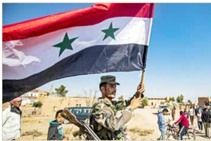
جندي سوري يحمل العلم السوري عند المدخل الغربي لبلدة تل تمر في محافظة الحسكة شمالي شرق سوريا أمس

يرحبون بوصول القوات الحكومية. كما تحدثت وسائل الإعلام السورية أن الجيش السوري انتشر في بلدة الطبقة قرب الرقة، في منطقة يوجد بها سد كبير لتوليد الطاقة الكهرومائية. وقالت وكالة الأنباء السورية الرسمية (سانا)، في وقت سابق أمس، إن القوات الحكومية دخلت بلدة تل تمر القريبة من الحدود التركية، شمال شرقي البلاد، حيث تقوم القوات التركية بهجوم لليوم السادس على التوالي. وأوضحت أن الجيش السوري انتقل إلى المنطقة "لمواجهة العدوان التركي"، دون تقديم مزيد من التفاصيل، مشيرة إلى أن سكان بلدة تل تمر رحبوا بالقوات.