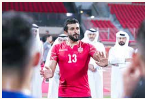
سمو الشيخ ناصر بن حمد يتحدث للاعبين

◆ سموه اطمأن على الحالة الفنية والتجهيزات الإدارية