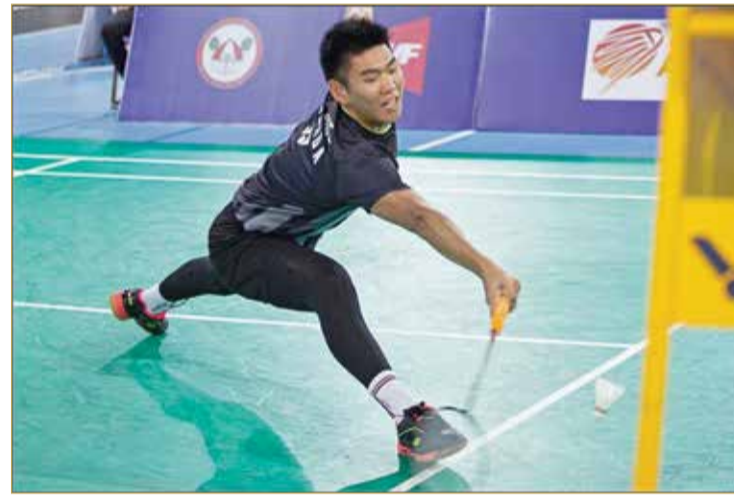
جانب من المنافسات

قدرة الدول العربية في استضافة كبرى البطولات الدولية على صعيد اللعبة. وأكدت أن البطولة تعتبر تجسيداً حقيقياً لرؤية سمو الشيخ ناصر بن حمد آل خليفة ممثل جلالة الملك للأعمال الخيرية وشؤون الشباب، رئيس المجلس الأعلى للشباب والرياضة، وسمو الشيخ خالد بن حمد آل خليفة النائب الأول لرئيس المجلس الأعلى للشباب والرياضة، رئيس اللجنة الأولمبية البحرينية في استقطاب مختلف البطولات الدولية الرياضية التي تعزز مكانة البحرين وتساهم في التعريف بمنجزاتها ومكانتها على مر التاريخ وثقافة شعبها الأصيل.