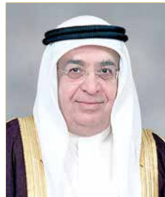
سمو الشيخ محمد بن مبارك

على سموه موفور الصحة والعافية وطول العمر لمواصلة مسيرة العطاء والبناء في هذا الوطن الغالي. ثم رحب مجلس الوزراء بانضمام وائل المبارك إلى الوزارة إثر صدور المرسوم الملكي السامي بتعيينه وزيراً للشؤون الكهربائية والماء، متمنياً له التوفيق والنجاح في مهامه، مستذكراً المجلس بالتقدير إسهامات سلفه عبدالحسين ميرزا في قطاع الكهرباء والماء، متمنياً له التوفيق في حياته المستقبلية.