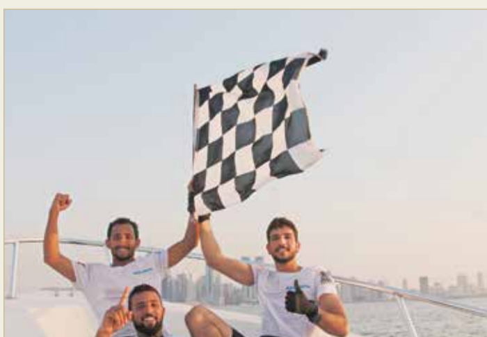
جانب من منافسات كأس سمو الشيخ حمد بن ناصر