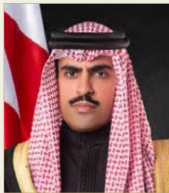
الشيخ عبدالله بن راشد

وصفت الولايات المتحدة الأميركية التمرين البحري بأنه الأكثر شمولاً في العالم، ويهدف إلى تعزيز العلاقات وقابلية العمل المشترك بين القوى الداعمة وعمليات الأمن البحري من خلال العمل سوياً كائتلاف لخلق نوع