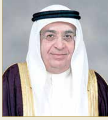
سمو الشيخ محمد بن مبارك

عقد مجلس الوزراء جلسته الاعتيادية الأسبوعية برئاسة نائب رئيس مجلس الوزراء سمو الشيخ محمد بن مبارك آل خليفة، وذلك بقصر القضيبي أمس. وقد أدلى الأمين العام لمجلس الوزراء ياسر الناصر عقب الجلسة بالتصريح التالي: