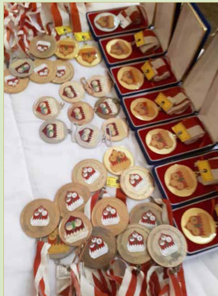
صورة للميداليات التي حاز عليها المقلة

الالاتحاد الآن يطمح لهذه الأمور؛ لأننا نملك نفس الفكر في هذه الرياضة ونفس الطموح.