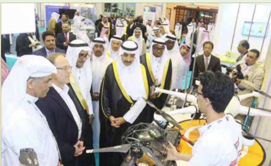
وزير النفط يتفقد المعرض المصاحب

سمو رئيس الوزراء ينيب وزير النفط لافتتاح مؤتمر ومعرض “مبيك 2019”