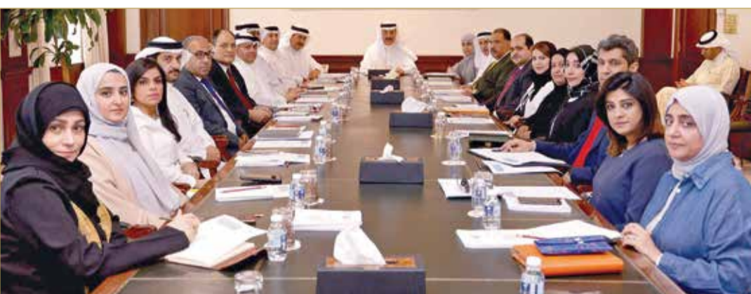
اجتماع اللجنة العليا للتخطيط والمتابعة

التي تحققت على صعيد العمل والرعاية الاجتماعية. وأشار وزير العمل والتنمية الاجتماعية إلى أن الوزارة تستهدف خلال المرحلة المقبلة تنويع المبادرات الخلاقة وتعزيز جسور التعاون مع مختلف الهيئات الحكومية والخاصة ذات الصلة من