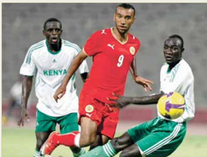
حسن علي "بيليه" في إحدى مباريات المنتخب

المبادرة بالهجوم وتجنب دخول مرمانا هدفاً مبكراً