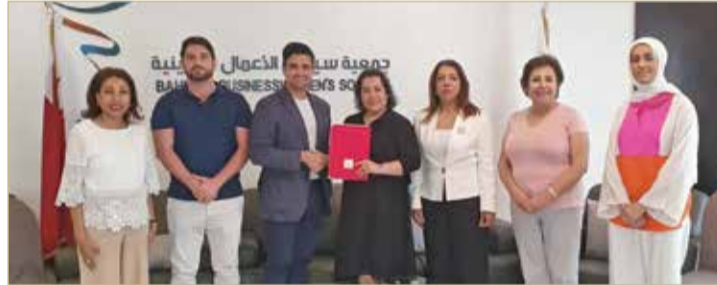
عقب توقيع مذكرة التفاهم