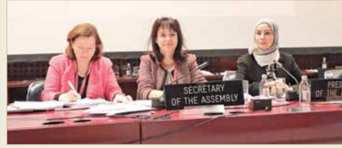
زينل تترأس الجمعية العامة

في إنجاز جديد للبحرين والدبلوماسية البرلمانية