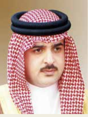
سمو الشيخ عبدالله بن حمد

الوطنية، متمنياً سموه لسمو الشيخ ناصر بن حمد آل خليفة التوفيق والسداد تحت راية عاهل البلاد صاحب الجلالة الملك حمد بن عيسى آل خليفة.