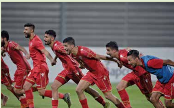
فرحة لاعبي المنتخب

إن الفوز على إيران رفع من حظوظ المنتخب في بلوغ الدور الثاني من التصفيات دون المبالغة في الأمر