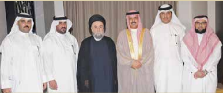
اللقاء مع الأمين

النظامي الحكومي فيها، حيث وجه جلالة الملك بأن تحمل الكلية اسم المغفور له بإذن الله تعالى سمو الشيخ عبدالله بن خالد آل خليفة طيب الله ثراه؛ تقديراً لإسهاماته في خدمة الإسلام والمسلمين، وفي إشاعة ثقافة الوسطية والاعتدال.