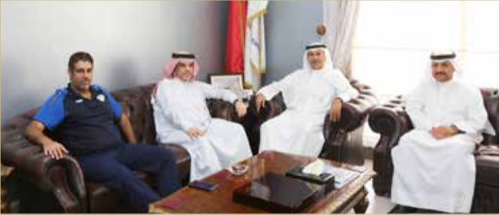
جانب من استقبال محافظ العاصمة رئيس نادي النجمة

بدور النائب الأول لرئيس المجلس الأعلى للشباب والرياضة رئيس اللجنة الأولمبية البحرينية سمو الشيخ خالد بن حمد آل خليفة، لما يولونه من دعم واهتمام ورعاية للشباب والرياضة في مملكة البحرين للوصول للعالمية. حضر اللقاء صلاح بوزيد الدوسري ويوسف الزياتي أعضاء مجلس إدارة النادي.