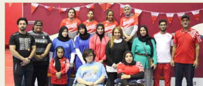
حياة بنت عبدالعزيز تتوسط لاعبات منتخب الرماية

وأبدت الشبيخة حياة بنت عبدالعزيز ثققتها الكبيرة بقدرة لاعباتنا على تحقيق التميز المنشود منهن للصعود على منصة التتويج، مؤكدة حرص اللجنة الإدارية على تقديم كافة أشكال الدعم والمساندة لجميع المنتخبات الوطنية، متمنية لهم التفوق والنجاح في الدورة لإعلاء راية الوطن.