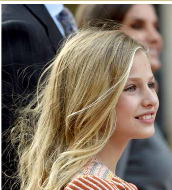
الأميرة ليونور، ابنة الكبرى لملك إسبانيا فيليب السادس لدى وصولها بصحة والديها وشقيقتها الأميرة صوفيا إلى كاتدرائية أوفييدو أمس الخميس، عشية مهرجان جوائز أميرة أستورياس