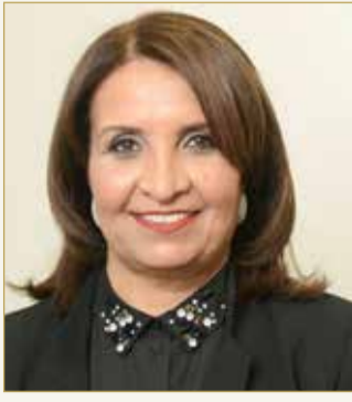
حياة بنت عبدالعزيز

الصباح رئيسة اللجنة التنظيمية لرياضة المرأة الخليجية وجهود اللجنة العليا المنظمة للدورة.