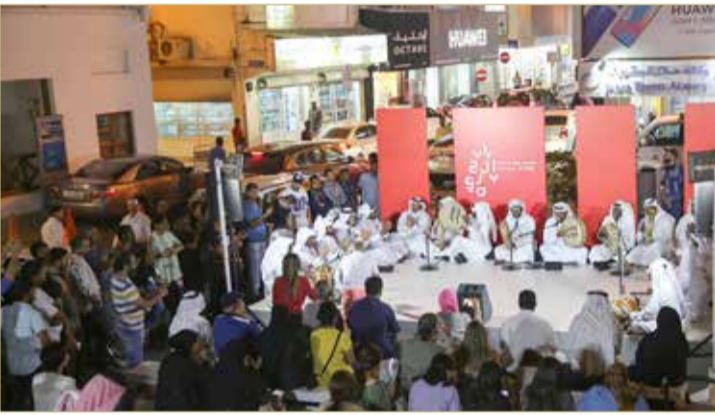
المنامة - هيئة البحرين للثقافة والآثار

قدمت فرقة إسماعيل دواس أمسية فنون شعبية في منطقة باب البحرين أمس، ضمن فعاليات "الخامسة بتوقيت الباب" والتي تنظمها أسبوعياً هيئة البحرين للثقافة والآثار.