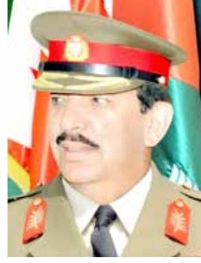
القائد العام لقوة دفاع البحرين

والذي يصب في مصلحة مملكة البحرين ورفعة لمكانتها، مؤكداً أن هذه الجهود هي محل فخر وتقدير الجميع تحت ظل عاهل البلاد القائد الأعلى. وتمنى القائد العام لسمو الشيخ ناصر بن حمد دوام التوفيق والسداد لخدمة هذا الوطن الغالي.