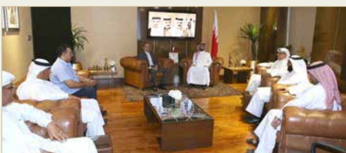
المؤيد يستقبل الشهابي ويوقع واللجنة المنظمة

استقبل نائب رئيس النادي الأهلي ومدير مركز براعة للتدريب