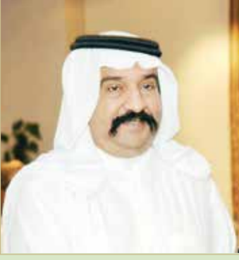
سمو الشيخ أحمد بن محمد

وقال سمو الشيخ أحمد بن محمد بن سلمان آل خليفة: "إن ما تحقق من نتيجة مهمة - رفعت ترتيب المنتخب في مجموعته - جاءت نتيجة الاهتمام المباشر من لدن جلالة الملك المفدى، واهتمام ومتابعة قريبة من سمو الشيخ ناصر بن حمد آل خليفة، حيث كانت لزيارته قبل المباراة بأقل من 24 ساعة؛ تأثير إيجابي كبير على تحقق الفوز ورفع المعنويات كثيرًا، لذا قدّموا لاعبونا مستوىً فنيًا راقيًا، ولعبوا بروح قتالية، حافظوا من خلالها على شبك المنتخب