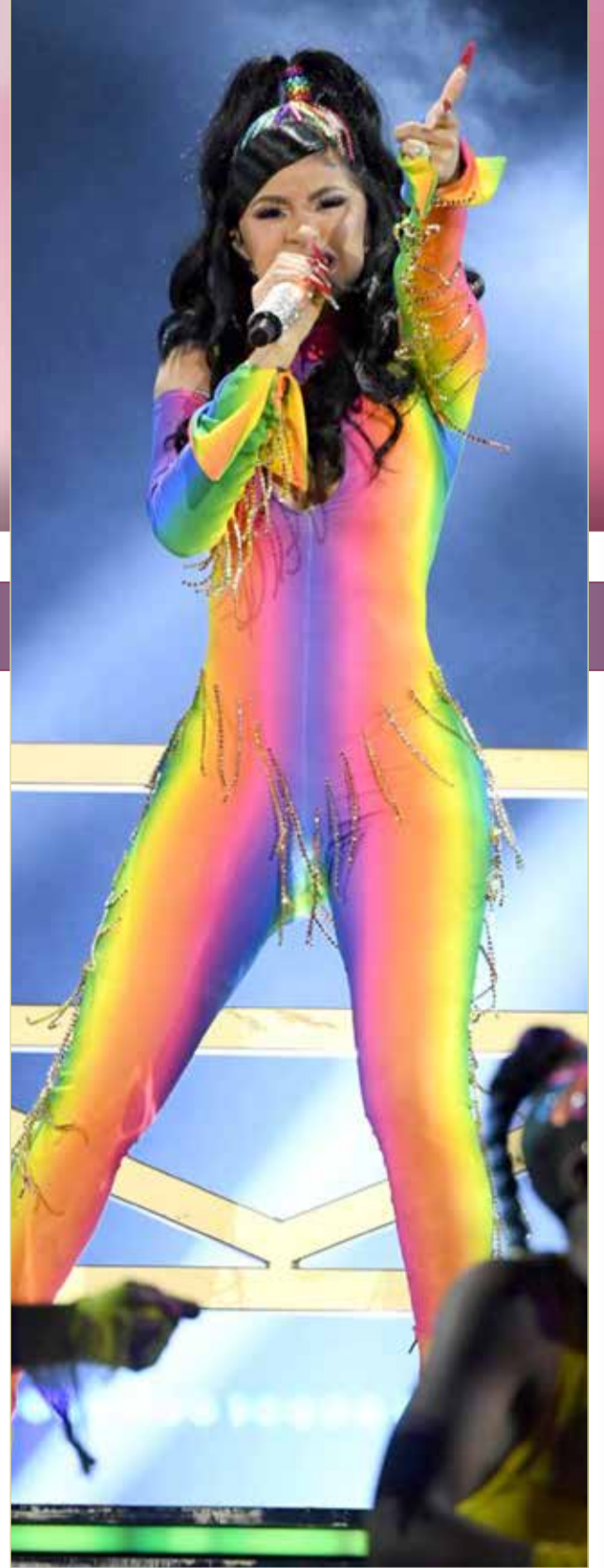
« تلقت المغنية كاردي بي هدية مميزة وثمانية من زوجها مغني الراب الأمريكي أوفست، احتفالاً بعيد ميلادها الـ 27، عبارة عن خاتم يتكون من نطاقين مع ألماسة كبيرة، على شكل قلب، يطلق عليها اسم "تيتانيك دايموند". وأشارت لورين مكاولي، خبيرة المجوهرات والأناقة، إلى أن خاتم كاردي بالماسه الكبيرة -تيتانيك دايموند- لم يقل ثمنه عن 4 ملايين دولار.