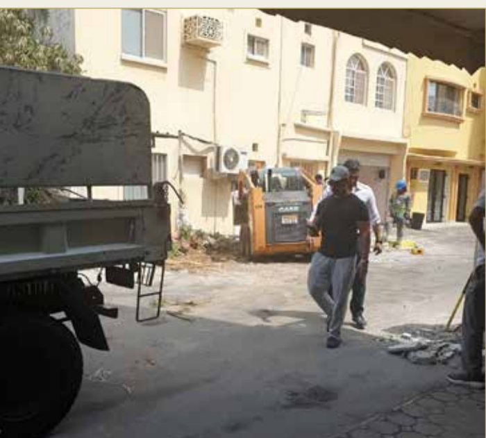
أثناء عملية الإزالة

التي أجازت للمدعى أو موروثه بعمل هذا السياج خارج حدود الملك. وأضاف أن محكمة الأمور المستعجلة أكدت أن التسوير لا يهدد سلامة القاطنين أو المارة كما ادعت البلدية، وأن التسوير المحدث كان وفقًا لتراخيص صادرة عن البلدية قبل 40 سنة. وأكد المواطن عدم معانته لأي إجراءات تهدف إلى تصحيح الأوضاع وإزالة المخالفات، إلا أن المستغرب هو إزالة البلدية، وظل قائمًا طوال تلك المدة دون أن يتسبب بأضرار لأحد، وعدم اتخاذها إجراءات مماثلة لبقية المخالفات في المنطقة نفسها.