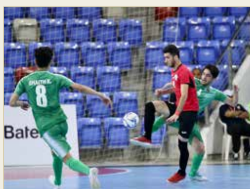
من لقاء العراق وفلسطين

الظهور بالشكل المطلوب وتقديم الاداء الذي يحقق لهم نتيجة الانتصار الاول".