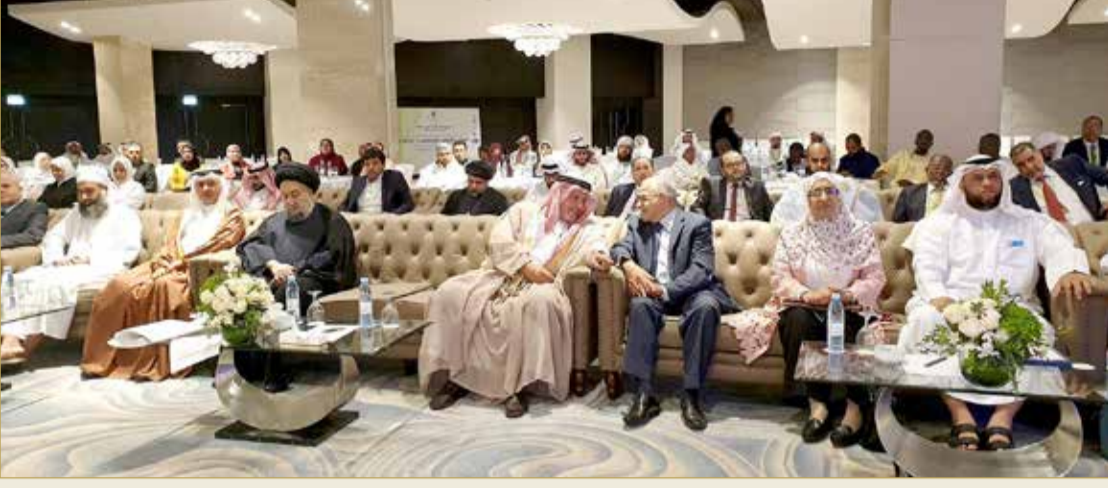
جانب من ختام فعاليات المؤتمر الدولي، الزكاة والتنمية الشاملة

اختتام أعمال المؤتمر الدولي بمشاركة 80 باحثاً من 19 دولة