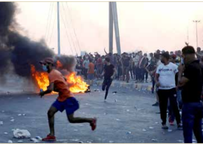
مظاهرون عراقيون خلال احتجاجات في بغداد يوم 5 أكتوبر 2019

وقال أحد المصدرين الأمنيين "لدينا أدلة مؤكدة بأن القناصين كانوا عناصر من المجاميع المسلحة والذين يتلقون الأوامر من قادتهم بدلًا من القائد العام