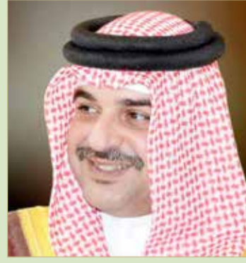
سمو الشيخ عبدالله بن حمد

عبدالله بن عيسى أن اتحاد السيارات البحريني وجميع منتسبيه وعشاق رياضة السيارات ومحبيها يفتخرون بهذا الإنجاز البحريني من الولايات المتحدة الأمريكية، متمنين للفريق العالمي تحقيق المزيد من الانتصارات لمملكتنا الحبيبة.