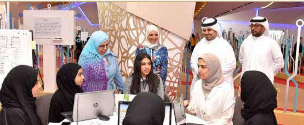
النصاري تتفقد الفرق المشاركة في الهاكاون

أيام، يقدم خلالها 60 مشاركاً ومشاركة في هذا الهاكاون موزعين على 12 فريقاً مشاريعهم التقنية، وسط نقاشات مع مرشدين ومدربين حول فكرة المشروع وآليات تطويرها، وجوانب المشروع على صعيد الابتكار والتطبيق، إضافة إلى التمويل وغيرها.