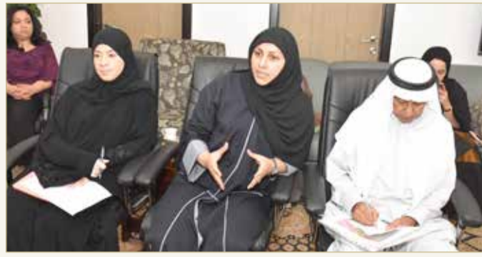
مع المسؤولين المعنيين بإدارة الصرف الصحي

♦ "الأشغال": من غير المجدي إنفاق الملايين بموسم الأمطار