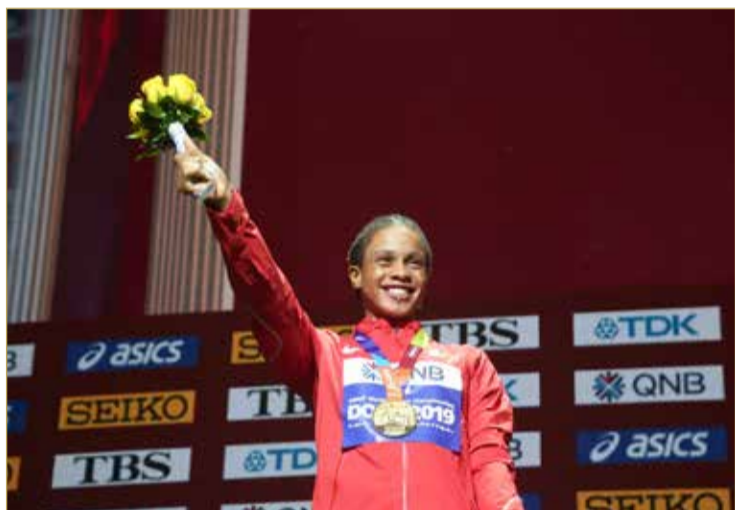
سلوى عيد على منصة التتويج

ويعتبر اختيار سلوى عيد البطلة العالمية وأحد ألمع نجوم رياضة أم الألعاب بمثابة إنجاز جديد في مسيرتها يضاف إلى نجاحاتها الكثيرة والمتعددة سواء على صعيد البطولات وإحراز الميداليات أو على مستوى حصد الألقاب والجوائز الشخصية والتي كان آخرها اختيارها ضمن قائمة الـ 11 عداءة لأفضل رياضية في العام الجاري 2019 من قبل الاتحاد الدولي لألعاب القوى، بالإضافة إلى اختيارها كثنائي أفضل رياضية في بطولة العالم الأخيرة. ويأتي اختيار قائمة النساء الملهامات من خلال قصص النجاح التي يحققونها والمبادرات والإنجازات اللواتي يصنعنها في مختلف مجالات الحياة ومن بينها الرياضة، ليشكلن