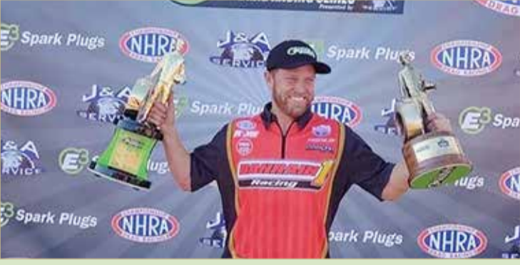
فريق بحرين ون متوجًا بالسباق الأخير