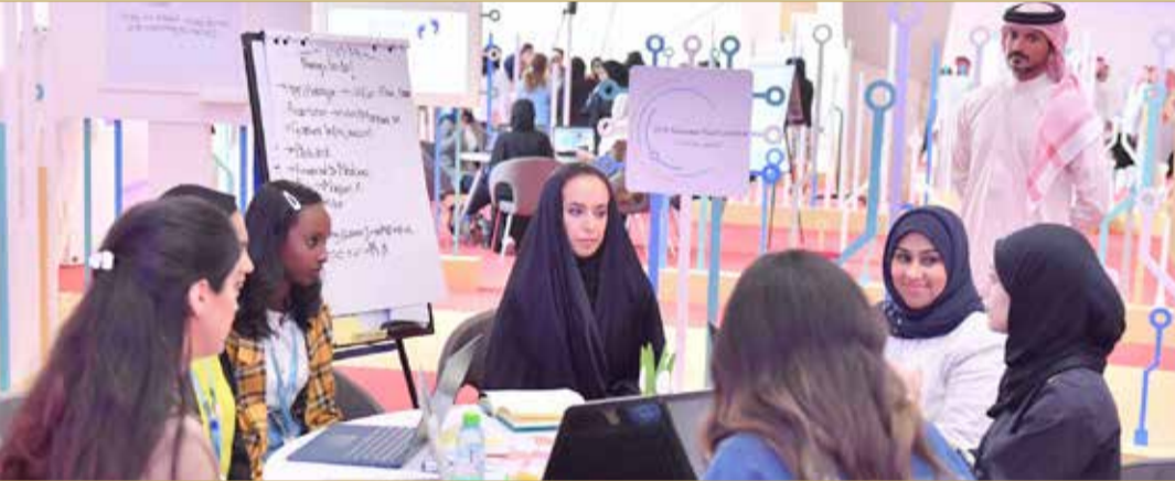
سمو الشبخة حصة بنت خليفة آل خليفة تناقش إحدى الفرق المشاركة في الهاكاون