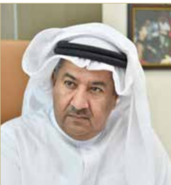
محمد بن جلال

سلوى عيد بطلة العالم لألعاب القوى في سباق 400 متر للسيدات، اسم بات يتردد على كل لسان، ومن نجاح إلى نجاح.. فقد اختيرت مؤخرًا من قبل شبكة (BBC) البريطانية الإعلامية واحدة ضمن قائمة أكثر 100 امرأة ملهمة ومؤثرة لعام 2019، ومن بين 18 اسماً من البلدان العربية، وذلك بعد الإنجاز العالمي الذي حققته في بطولة العالم لألعاب القوى للرجال والسيدات مؤخرًا بتحقيقها المركز الأول والميدالية الذهبية في السباق بزمن 48:14 ثانية لتحرز ثالث أفضل زمن في تاريخ السباق.