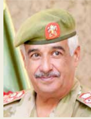
سمو رئيس الحرس الوطني

المملكة تحت راية عاهل البلاد المفدى القائد الأعلى صاحب الجلالة الملك حمد بن عيسى آل خليفة.