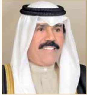
سمو الشيخ نواف الاحمد الجابر

تلقى رئيس الوزراء صاحب السمو الملكي الأمير خليفة بن سلمان آل خليفة وولي العهد نائب القائد الأعلى النائب الأول لرئيس مجلس الوزراء صاحب السمو الملكي الأمير سلمان بن حمد آل خليفة، برقيتي تعزية من ولي عهد دولة الكويت الشقيقة أخيهما سمو الشيخ نواف الأحمد الجابر المبارك الصباح في وفاة الشيخ عبدالله بن سلمان بن أحمد آل خليفة.