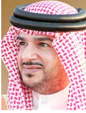
سمو الشيخ علي بن عيسى

الجهود المشرفة التي بذلها سمو الشيخ ناصر بن حمد في المحافل الوطنية، متمنياً لسموه دوام التوفيق والسداد تحت راية عاهل البلاد صاحب الجلالة الملك حمد بن عيسى آل خليفة.