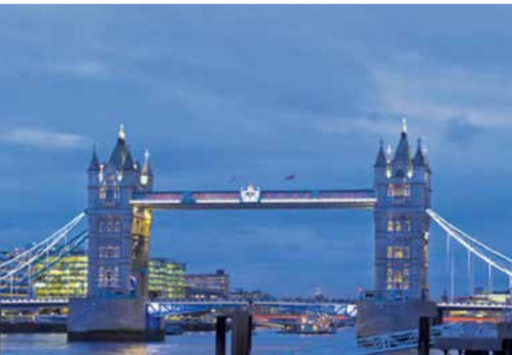
عقارات أوروبا تسحر المستثمرين البحرينيين

صغيرة الحجم. وأوضح التقرير أن المستثمرين اللبنانيين يمكنهم الاستثمار بتقريب أقل قليلا من بعض أقرانهم في الشرق الأوسط، لاسيما وأن التقيد بأحكام الشريعة الإسلامية أقل إلزاما لهم، وهذا يمنحهم مرونة أكبر عند البحث عن فرص عقارية في الأسواق الخارجية، وبالنسبة لمديري الاستثمار، فإنه يسمح بتقديم مجموعة واسعة من الخيارات.