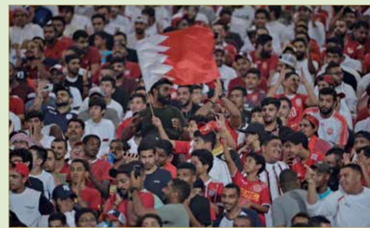
عودة الجماهير مكسب كبير

يسير منتخبنا الوطني لكرة القدم بخطى ثابتة في مشوار التأهل لمونديال 2022 بعد أن حقق فوزًا ثمينًا على إيران المصنف الأول آسيويًا وال 23 عالميًا في مواجهة الذهاب الأخيرة التي انتهت 1/0 في النمامة ليرفع رصيده إلى 7 نقاط من فوزين وتعادل جعلته يتقاسم الصدارة مع العراق ليعزز حظوظه في بلوغ النهائيات لأول مرة وإن كان المشوار مازال طويلًا.