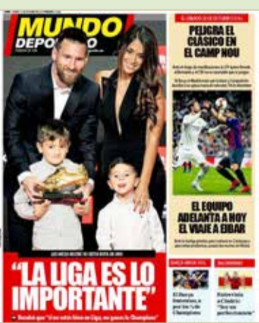
غلاف موندو ديپورتيفو

وانتقل حاتم بن عرفه إلى رين، ولعب له الموسم الماضي، وتوج معه بكأس فرنسا، ويبقى حالياً بلا ناد.