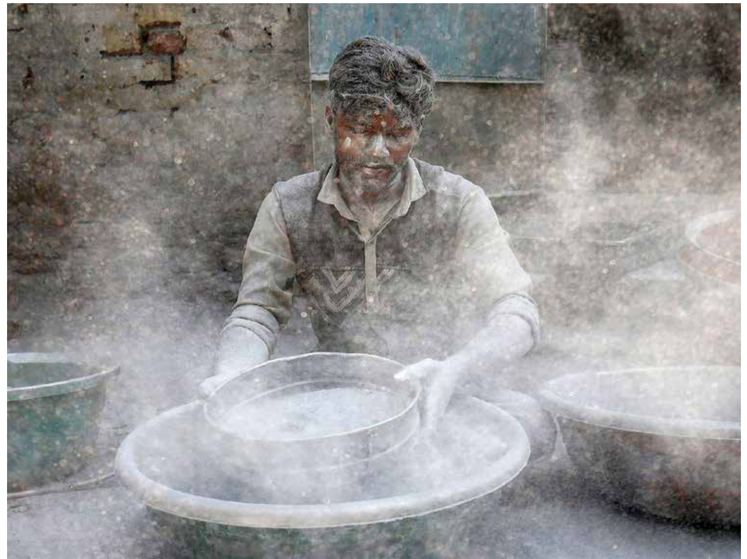
عامل يحضر البارود بأحد المصانع في مدينة أحمد آباد، وذلك لاستخدامه لاحقا في الألعاب النارية المصاحبة لاحتفالات الديوالي