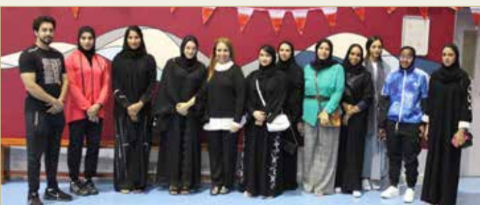
وفد اللجنة الأولمبية مع لاعبات منتخب ذوي العزيمة