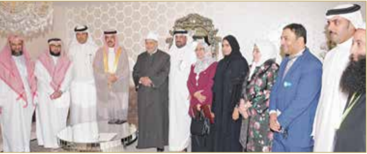
.. ولقاء رئيس جامعة الأزهر

كما التقى وزير التربية والتعليم نائب رئيس جامعة الأزهر بجمهورية مصر العربية الشقيقة محمد أبو زيد، والذي أثنى بدوره على خطوة إنشاء هذه الكلية، مؤكدا أن إنشاء هذا الصرح التعليمي الرائد والمتفرد يؤكد نهج مملكة البحرين المنفتح والمعزز للتسامح والتآخي بين المذاهب والأديان،