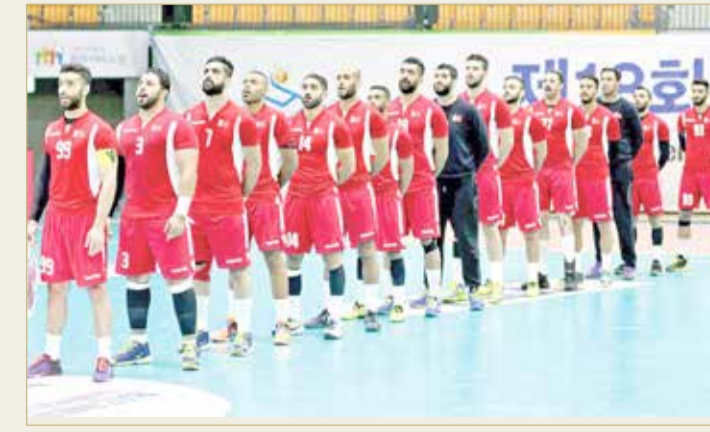
منتخبنا الوطني لكرة اليد

لاعبنا التوفيق والنجاح في مبارياتهم. وكان منتخبنا قد وصل الأربعاء إلى قطر بقائمة تضم 18 لاعباً.