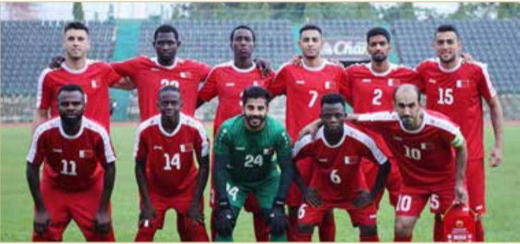
منتخبنا الوطني العسكري

ضمن منافسات دورة الألعاب العالمية العسكرية