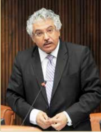
حمزة جلسة سابقة للبرلمان

"البلاد" نشرت قصصا من قلب الجامعة.. وعدم رد الإدارة إدانة