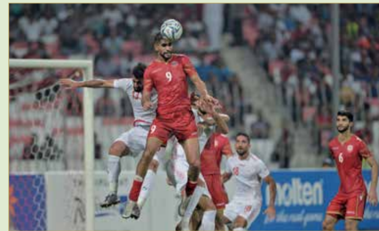
من لقاء منتخبنا وإيران

على امتداد ال 10 سنوات الماضية فقد المنتخب ثقة الجماهير، باستثناء خليجي 23 بدولة الكويت التي شهدت