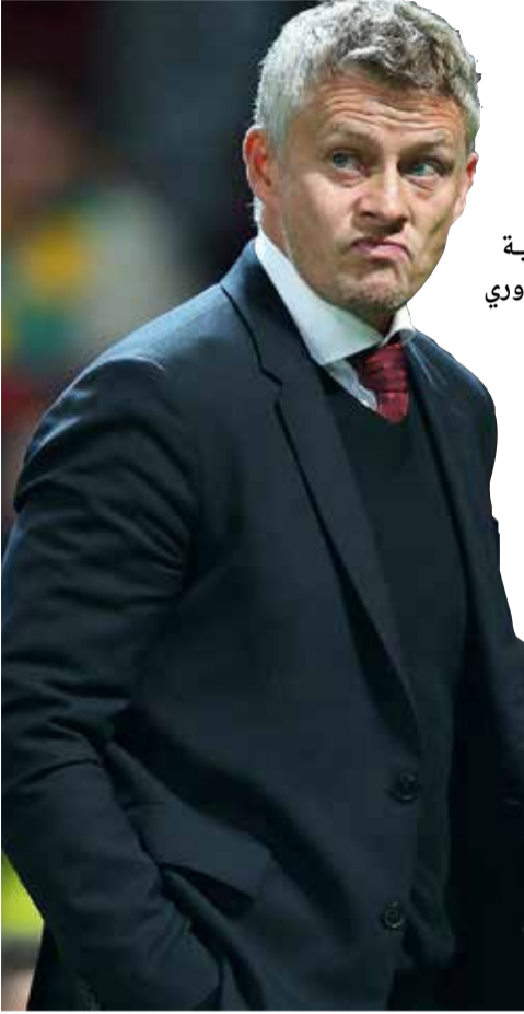
أولي غونار سولسكاير

أعلن السويسري المخضرم روجيه فيدرر أنه سيشارك عام 2020 في بطولة رولان غاروس الفرنسية، ثمانية البطولات الأربع الكبرى في كرة المضرب، وذلك في مقابلة الخميس مع قناة "سي أن أن" الأميركية. وكان فيدرر (38 عاماً) قد عاد إلى الملاعب الترابية للبطولة الفرنسية في مايو الماضي بعد غيابه عن النسخ الثلاث السابقة، وبلغ الدور نصف النهائي في البطولة التي أحرز لقبها مرة يتيمة في 2009. وقال فيدرر "سأخوض بطولة فرنسا المفتوحة، وعلى الأرجح لن أعب قبل ذلك كثيراً، لأنني بحاجة كي أبتعد قليلاً (عن كرة المضرب) وأحتاج لبعض الوقت مع العائلة". وأعلن حامل الرقم القياسي في