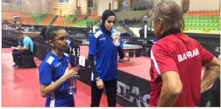
جانب من مشاركة منتخبنا