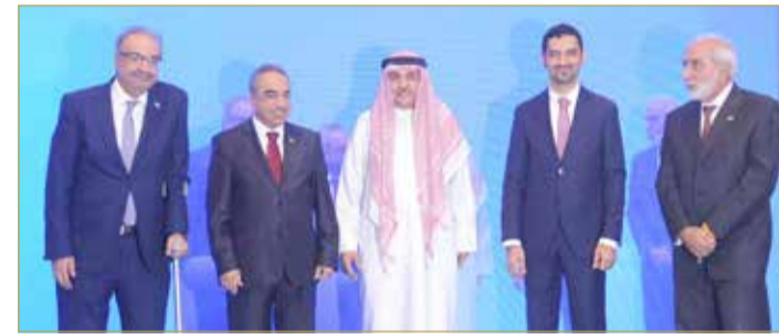
المنامة - وزارة الأشغال

خلف يشارك في حفل جمعية المهندسين بحضور وزير الكهرباء