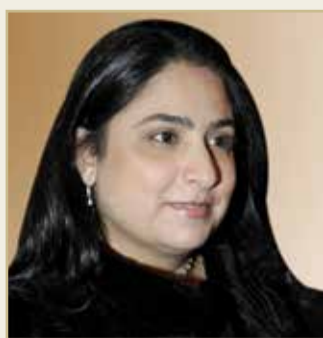
الشيخة رنا بنت عيسى بن دعيح

رفعت وكيل وزارة الخارجية الشيخة رنا بنت عيسى بن دعيح آل خليفة، خالص التهاني والتبريكات، إلى ممثل جلالة الملك للأعمال الخيرية وشؤون الشباب رئيس المجلس الأعلى للشباب والرياضة اللواء الركن سمو الشيخ ناصر بن حمد آل خليفة بمناسبة صدور الأمر الملكي السامي من عاهل البلاد ، بتعيين سموه مستشاراً للأمن الوطني. وأشادت وكيل وزارة الخارجية بالجهود الطيبة التي يبذلها سموه وعمله المخلص والدؤوب في كل ما من شأنه تحقيق المزيد