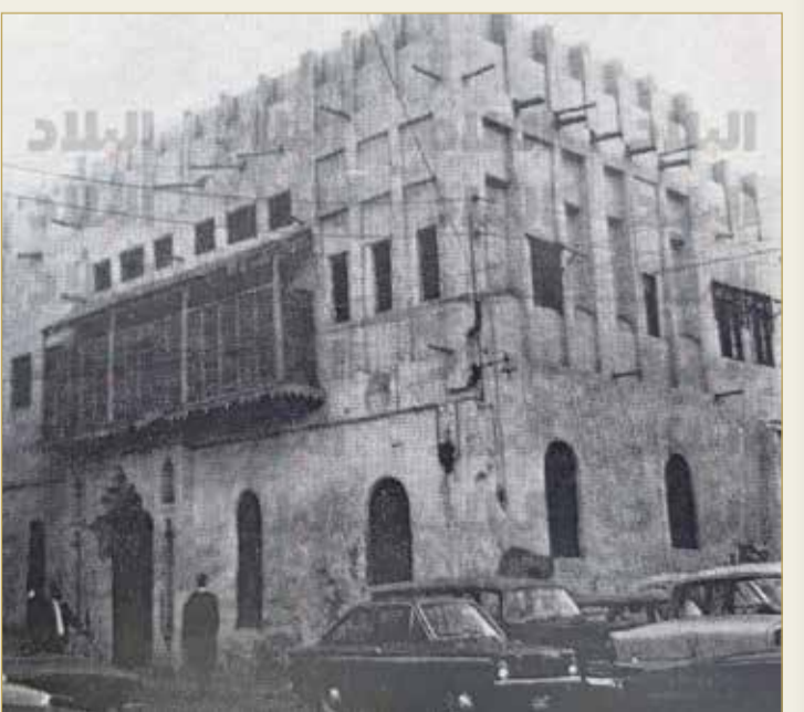
البنك الشرقي المحدود بالمنامة

- يجوز إيداع الدراهم باسم شخصين أو أكثر ويمكن جعلها قابلة الدفع إلى أي