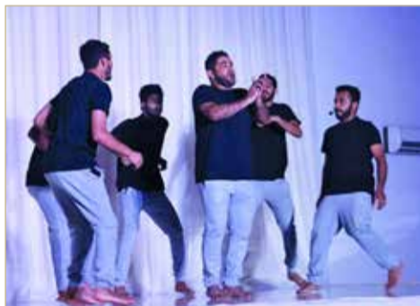
مسرحية لقمة عيش