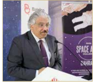
رئيس جامعة البحرين