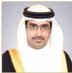
سمو الشيخ خليفة بن علي بن خليفة

هنأ محافظ الجنوبية سمو الشيخ خليفة بن علي بن خليفة ممثل جلالة الملك للأعمال الخيرية وشؤون الشباب رئيس المجلس الأعلى للشباب والرياضة اللواء الركن سمو الشيخ ناصر بن حمد آل خليفة، بمناسبة صدور الأمر الملكي السامي عن عاهل البلاد صاحب الجلالة الملك حمد بن عيسى آل خليفة بتعيين سموه مستشاراً للأمن الوطني. وأكد سمو الشيخ خليفة بن علي أن هذا الأمر يؤكد ما يحظى به سمو الشيخ ناصر بن حمد من مكانة رفيعة وكفاءة كبيرة من خلال ما