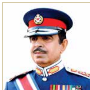
الشيخ راشد بن عبدالله

رفع وزير الداخلية الفريق أول ركن الشيخ راشد بن عبدالله آل خليفة، خالص التهاني والتبريكات، إلى ممثل جلالة الملك للأعمال الخيرية وشؤون الشباب رئيس المجلس الأعلى للشباب والرياضة اللواء الركن سمو الشيخ ناصر بن حمد آل خليفة بمناسبة صدور الأمر الملكي السامي بتعيين سموه مستشاراً للأمن الوطني. وبارك وزير الداخلية لسموه هذه الثقة التي تدل على جدارة سموه بها، ودعا المولى عز وجل