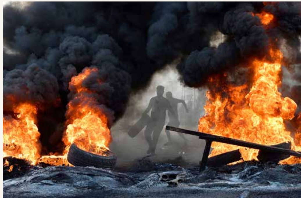
مناظر بحرق إطار سيارة في طريق المتن بالعاصمة اللبنانية بيروت أمس

الحريري: 72 ساعة مهلة للخروج من الأزمة الاقتصادية