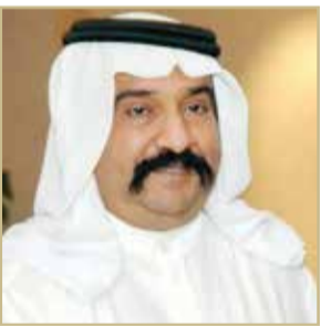
سمو الشيخ أحمد بن محمد بن سلمان

هنأ رئيس مجلس إدارة الاتحاد البحريني للتنس سمو الشيخ أحمد بن محمد بن سلمان آل خليفة ممثل جلالة الملك للأعمال الخيرية وشؤون الشباب رئيس المجلس الأعلى للشباب والرياضة اللواء الركن سمو الشيخ ناصر بن حمد آل خليفة، بمناسبة صدور الأمر الملكي السامي عن عاهل البلاد صاحب الجلالة الملك حمد بن عيسى آل خليفة، بتعيين سموه مستشاراً للأمن الوطني. وأكد سموه أن اللواء الركن سمو الشيخ ناصر بن حمد آل خليفة يبذل جهوداً طيبة من خلال عمله الدؤوب في كل ما من شأنه تحقيق المزيد من التقدم والتطور والازدهار في جميع المجالات التي تصب في مصلحة الوطن