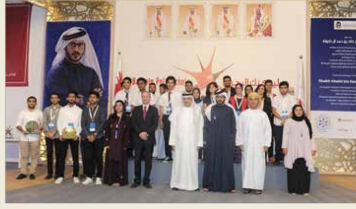
مدينة عيسى - بوليتكنك البحرين

تهدف إلى الوصول لأفضل المهارات في استخدام التكنولوجيا