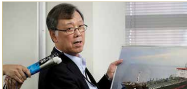
مسؤول ياباني يتحدث عن تعرض إحدى ناقلات شركته لهجوم (أرشيفية)

طوكيو قررت إرسال قواتها للدفاع الذاتي إلى مضيق هرمز