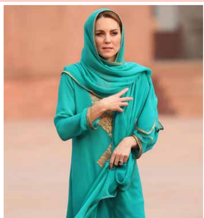
اختارت دوقة كامبريدج، كايت ميدلتون، إطلالة لافتة بالحجاب في إطار زيارتها الرسمية إلى باكستان التي ترافق بها زوجها الأمير ويليام. فقد بدت كايت متألقة في اليوم ما قبل الأخير للزيارة عندما قصدت مسجد Badshahi. وقد ارتدت المناسبة زياً باكستانياً تقليدياً يُعرف بال Shalwar Kameez حمل توقيع المصمم ماهين خان.

يتزايد ميل الفلسطينيين في غزة لاقتناء الحيوانات الأليفة.. علمم يجدون فيها ملاذاً من قسوة الواقع في قطاع يئن تحت وطأة الضغوط الاقتصادية، لكن عدد الحيوانات المتنامي يثقل كاهل المنشآت البيطرية ضعيفة التجهيز. ويعمل نحو 130 طبيباً بيطرياً في غزة، لكن خلو القطاع من المستشفيات البيطرية يدفع معظمهم للجوء للمنشآت الطبية العادية الخاصة بالبشر بل وأحياناً لإسرائيل للمساعدة في رعاية الحيوانات المريضة. وإلى جانب اقتناء القطط، يُقبل مزيد من أهل غزة على تربية الكلاب، كما يتوفر طعامها بشكل متزايد في المحلات.