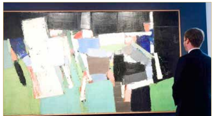
اللوحة تمثل مباراة لكرة القدم مع ألوان مستتبلة من أزرق وأحمر وأبيض وأسود

وكان سعر لوحة "بارك دي برينس" العائدة إلى عام 1952 مقدرًا بين 18 و25 مليون يورو، وتعرض في السوق للمرة الأولى. والسعر هو تقريباً ضعف السعر