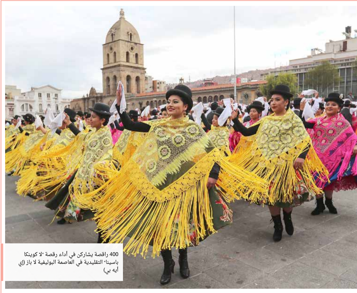
400 راقصة يشاركن في أداء رقصة "لا كوينكا باسينا" التقليدية في العاصمة البوليفية لا باز