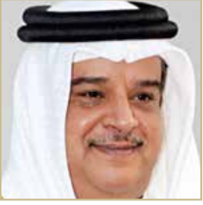
سمو الشيخ عبدالله بن عيسى

هنأ رئيس الهيئة العليا لنادي راشد للفروسية وسباق الخيل سمو الشيخ عبدالله بن عيسى آل خليفة اللواء الركن سمو الشيخ ناصر بن حمد آل خليفة، بمناسبة صدور الأمر الملكي السامي من عاهل البلاد صاحب الجلالة الملك حمد بن عيسى آل خليفة، بتعيين سموه مستشاراً للأمن الوطني. وأكد سمو رئيس الهيئة العليا لنادي راشد للفروسية وسباق الخيل أن صدور الثقة الملكية السامية بتعيين سمو الشيخ ناصر بن حمد آل خليفة مستشاراً للأمن الوطني تأتي في ظل ما يقوم به سموه من أدوار بارزة في العديد من المجالات أسهمت في تحقيق النجاحات