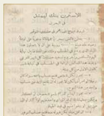
غلاف شروط الإيداع