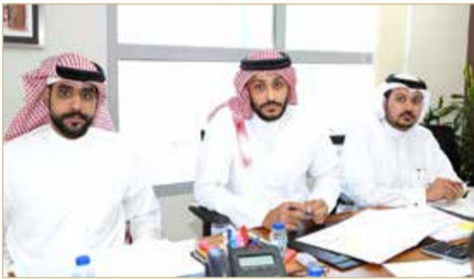
رئيس وأعضاء اللجنة أثناء الاجتماع

والمديرين والإداريين والفنيين وبين الأندية الوطنية لحسم النزاع فيما يتعلق بمستحقات الرياضيين. وتختص الهيئة بالفصل في المنازعات المحالة إليها من قبل وزارة شؤون الشباب والرياضة والمتعلقة بتنفيذ البرنامج الوطني لإنهاء ملف المستحقات العالية للرياضيين وفقاً لاتفاق التحكيم المنصوص على أن تقوم الهيئة بتحديد إجراءات وقواعد الفصل في المنازعات المعروضة عليها، وتستعمل اللجنة على مباشرة أعمالها والنظر في المنازعات المرفوعة لها والمتعلقة بمستحقات الرياضيين.