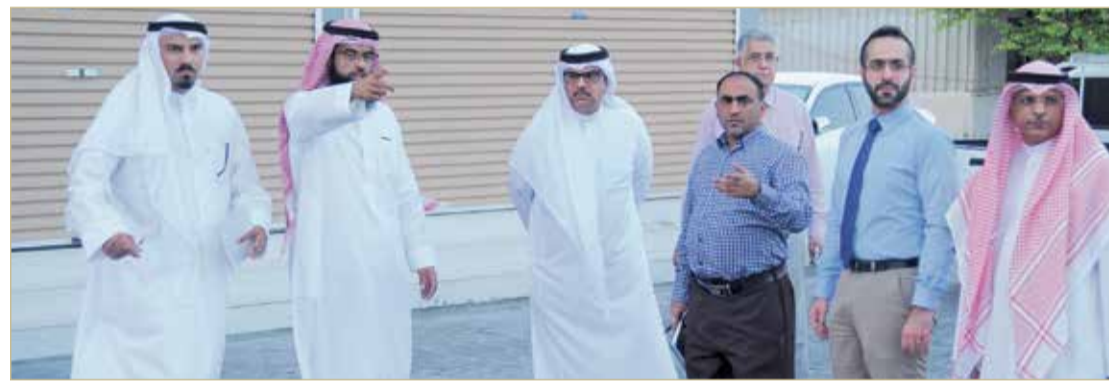
المنامة - وزارة الأشغال وشؤون البلديات والتخطيط العمراني

وفي ختام الجولة تقدم ممثل الدائرة الثامنة بالمجلس البلدي بالمحرق) بالشكر والتقدير إلى وكيل الوزارة لشؤون الأشغال وفريق المهندسين بالوزارة على تعاونهم الدائم وجهودهم المتواصلة؛ لتلبية احتياجات أهالي الدائرة.