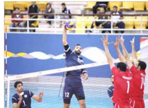
من منافسات دوري الدرجة الأولى الموسم الماضي