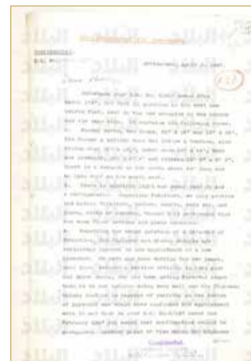
رسالة سرية من المعتمد للحكومة البريطانية