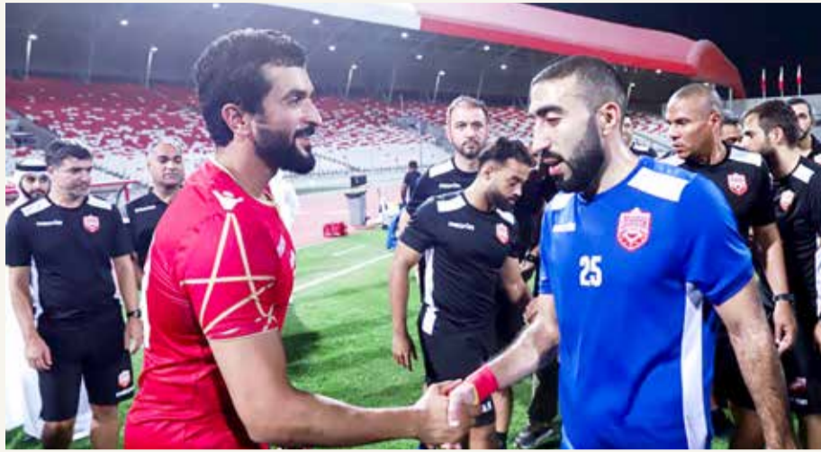
حميدان مصافحا سمو الشيخ ناصر بن حمد أثناء زيارة تدريبات المنتخب