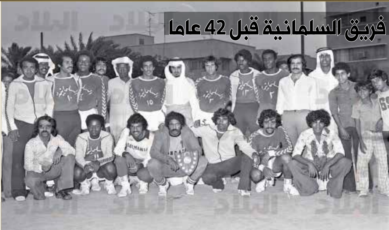
صورة لفريق السلمانية بعد المباراة الختامية لكرة اليد بينه وفريق البرموك بشهر مايو 1977م

نقاب صفحات الوثائق القديمة ونفتش عن قصص بحرينية