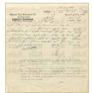
شكوى الشواف للبالوز

يرفضون ذلك ويقصد أن تجار السوق أيضاً امتنعوا عن صرف "النوط أبو ألف". وطلب التاجر الكويتي من "الباليوز" ما أسماه "تيسير مسألته". وردت المعتمدية على طلب التاجر بالإيجاب. وبأنها ستوجه البنك بذلك. ووقع الشواف رسالته في 23 أغسطس 1942. يشار إلى أن الشواف فتح محلات لتجارة المواد الغذائية المستوردة من البصرة والمحمرة وعبدان. وفتح محلاً في البحرين.