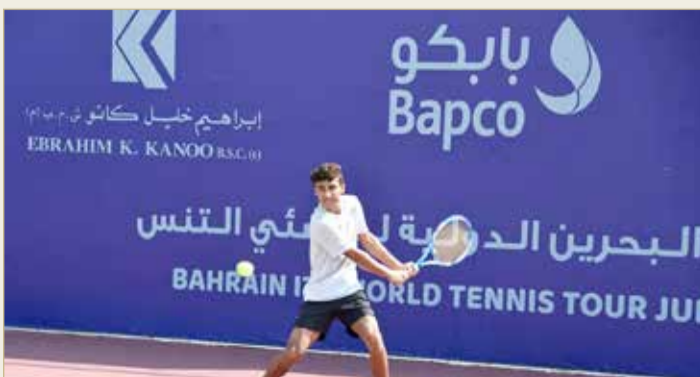
جانب من تدريب أمس

نادي البحرين للتنس؛ من أجل التعرف استعداد المنظمين وأجواء البطولة إدراياً وفنياً وكل من أجل التعرف عن قرب على الملاعب التي ستقام عليها المباريات، وقام عدد من اللاعبين في يوم أمس بأداء بعض التدريبات الخفيفة استعداداً لمواجهة اليوم المهمة جداً في مشوارهم بالبطولة، وقد أشاد عدد كبير من اللاعبين بما شاهدوه من تميز في مقر النادي وملاعبه النموذجية وبأجواء البطولة المثالية، كما أبدى الجميع إعجابهم من احترافية التنظيم