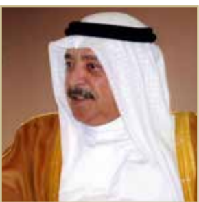
الشيخ خالد بن أحمد

هنأ وزير الديوان الملكي الشيخ خالد بن أحمد آل خليفة ممثل جلالة الملك للأعمال الخيرية وشؤون الشباب رئيس المجلس الأعلى للشباب والرياضة اللواء الركن سمو الشيخ ناصر بن حمد آل خليفة بمناسبة صدور الأمر الملكي السامي بتعيين سموه مستشاراً للأمن الوطني. وأكد وزير الديوان الملكي أن الثقة الملكية السامية جاءت لتؤكد كفاءة وقدرة سمو الشيخ ناصر بن حمد آل خليفة، ومعرباً عن خالص تمنياته لسموه بدوام التوفيق والنجاح والسداد في أداء هذه المهمة الوطنية الموكلة إليه على الوجه الأكمل. ونوه وزير الديوان الملكي بعطاء