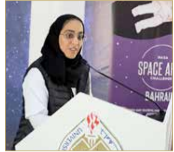
الشيخة لطيفة آل خليفة

تأكيداً للأولويات الوطنية في البحث العلمي وتحقيقاً لجملة من الأهداف