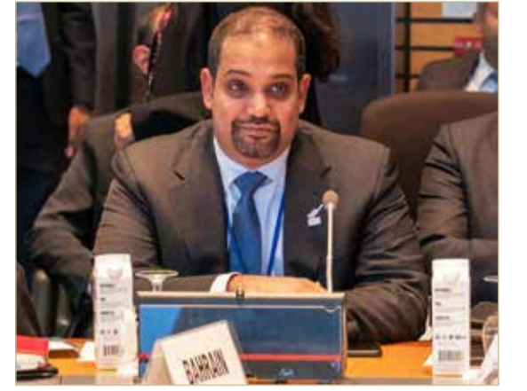
المنامة - وزارة المالية والاقتصاد الوطني

الحديثة حرصاً على الصحة العامة والتي ساهمت في الحفاظ مملكة البحرين على مركزها المتميز في مؤشرات التنمية البشرية.