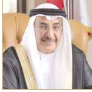
الشيخ خالد بن عبدالله

هنأ نائب رئيس مجلس الوزراء الشيخ خالد بن عبدالله آل خليفة، ممثل جلالة الملك للأعمال الخيرية وشؤون الشباب رئيس المجلس الأعلى للشباب والرياضة اللواء الركن سمو الشيخ ناصر بن حمد آل خليفة، بمناسبة صدور الأمر الملكي السامي رقم (54) لسنة 2019 بتعيين سموه مستشاراً للأمن الوطني. وأكد أن تعيين سمو الشيخ ناصر بن حمد في هذا المنصب ليعكس الثقة الغالية التي أولاهها لسموه عاهل البلاد صاحب الجلالة الملك حمد بن عيسى آل خليفة، وإيماناً من جلالتيه بالجهود الكبيرة والنجاحات المقدرتها التي يبذلها ويضطلع بها