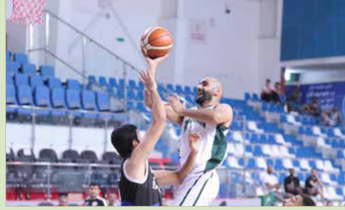
من لقاء سماهيح والبحرين

حيث تقدم البحرين أولا بتفوقه في الربع الأول 29/18، ثم عزز تقدمه بفوزه في الربع الثاني 14/11، قبل أن يعود البحرين ويفرض أفضليته في الشوط الثاني ليفوز في الربع الثالث والرابع ب19/14 و29/16.