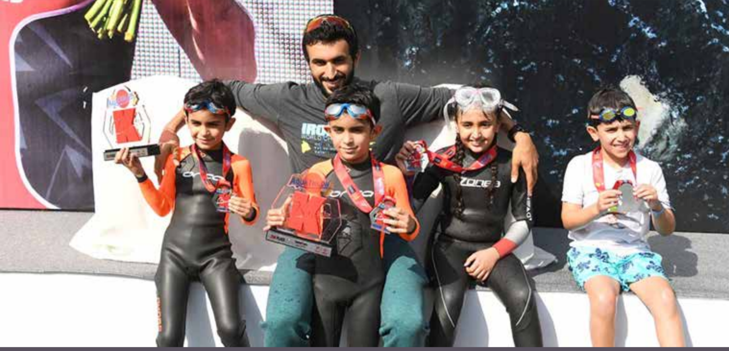
سمو الشيخ ناصر بن حمد مع أبنائه خلال فعالية الرجل الحديدي