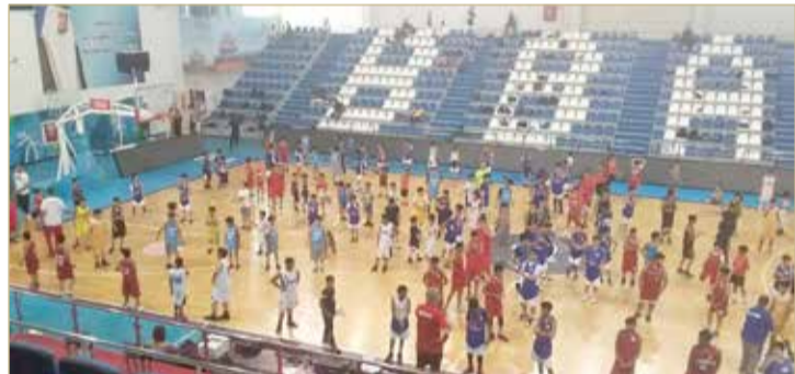
جانب من بروقات الاستعداد للمؤتمر الدولي

في إطار الشراكة مع الاتحاد الدولي لتنشيط اللعبة وتوسيع قاعدتها