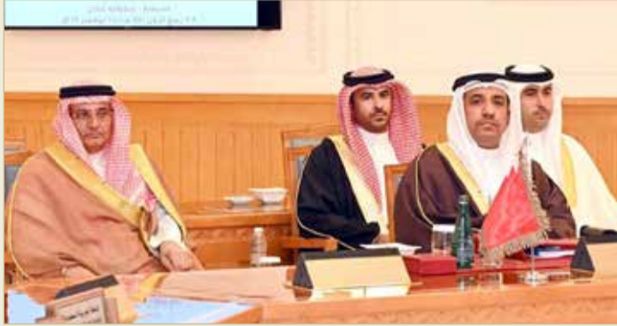
المستشار عبدالله البوعينين يشارك في اللقاء الدوري الخامس لرؤساء المحاكم العليا والتميز بدول التعاون الخليجي

اليوميين إن مبادرة المجلس الأعلى للقضاء فرصة لمناقشة وتبادل الأفكار حول استخدام الذكاء الاصطناعي والاستفادة منه في مستقبل المحاكم؛ لتسهيل سير العدالة واختصار الوقت، ودوره في استشراف المستقبل للمنظومة القضائية، وطرح التحديات التي تواجه المحاكم في ظل هذه التغيرات التقنية الحديثة، من حيث مدى تأثير إدخال الذكاء الاصطناعي على إجراءات التقاضي في المحاكم عموماً وعلى الخدمات القضائية للمتقاضين.