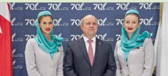
خلال الإعلان عن الوجهات الجديدة

أعلن مصرف البحرين المركزي بأنه تمت تغطية الإصدار رقم 171 ISIN BH00013602Y2 (من صكوك التأجير الإسلامية الحكومية قصيرة الأجل التي يصدرها مصرف البحرين المركزي نيابة عن حكومة البحرين. تبلغ قيمة الإصدار 26 مليون دينار لفترة استحقاق 182 يومًا تبدأ في 7 نوفمبر 2019 إلى 7 مايو 2020. ويبلغ العائد المتوقع لهذه الصكوك 2.65% مقارنة بسعر 2.86% للإصدار السابق بتاريخ 10 أكتوبر 2019، علمًا بأنه قد تمت تغطية الإصدار بنسبة 468%.