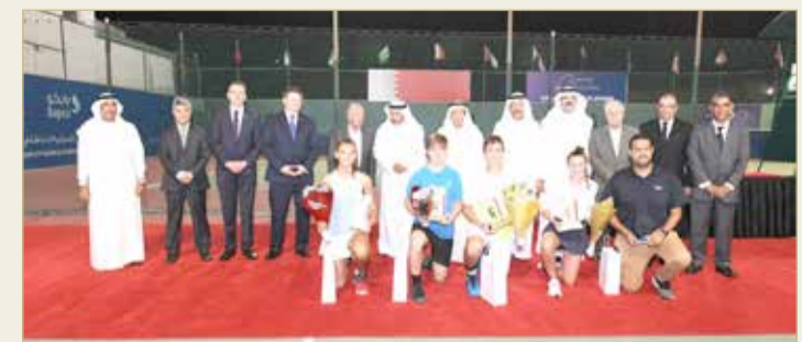
الحفل الختامي للبطولة

المقلة يؤكد تميز النادي في تنظيم البطولات الدولية منذ العام 2009