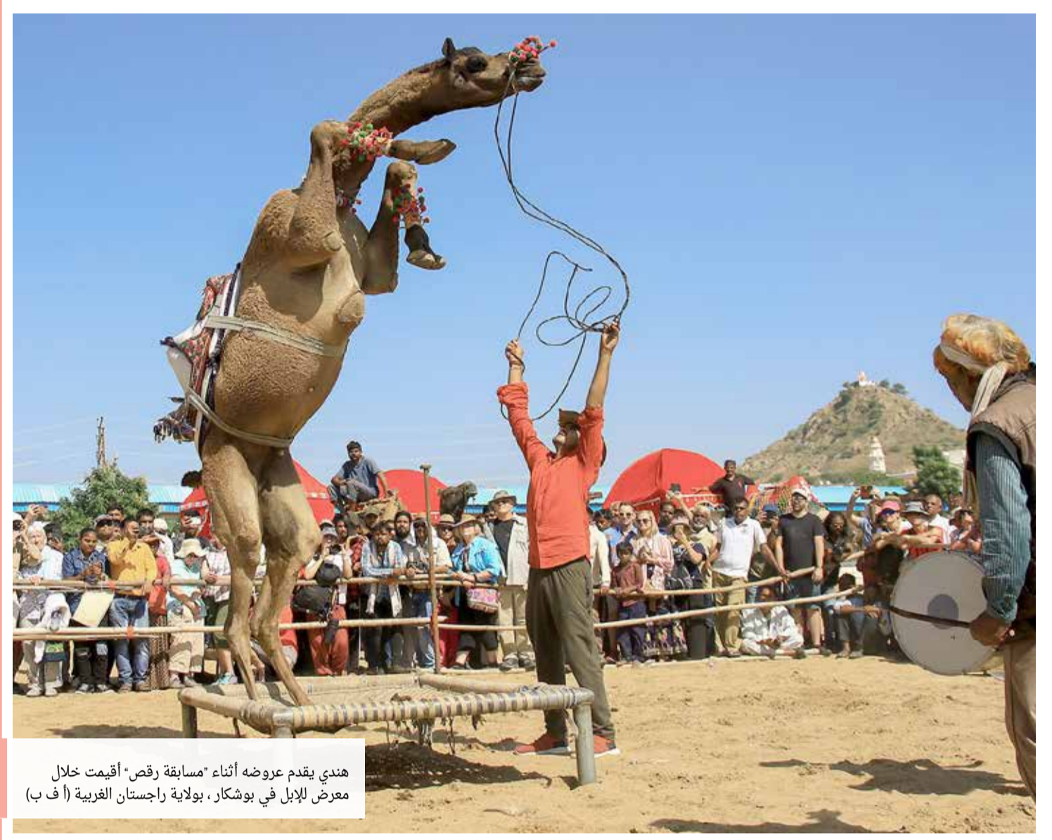
هندي يقدم عروضه أثناء "مسابقة رقص" أقيمت خلال معرض للإبل في بوشكار، بولاية راجستان الغربية

إدارة التحرير: +973 17111444 +973 17111467 385 @local@albiladpress.com 2008 تصدر عن دار البلاد للصحافة والنشر والتوزيع س.ت 67133 تطبع في مؤسسة الأبرام للنشر قسم الإعلانات: +973 17111501 / 508 +973 32224492 / 39615645 +973 17580939 +973 17111432 +973 17111434