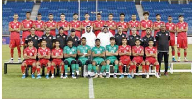
منتخب الشباب لكرة القدم