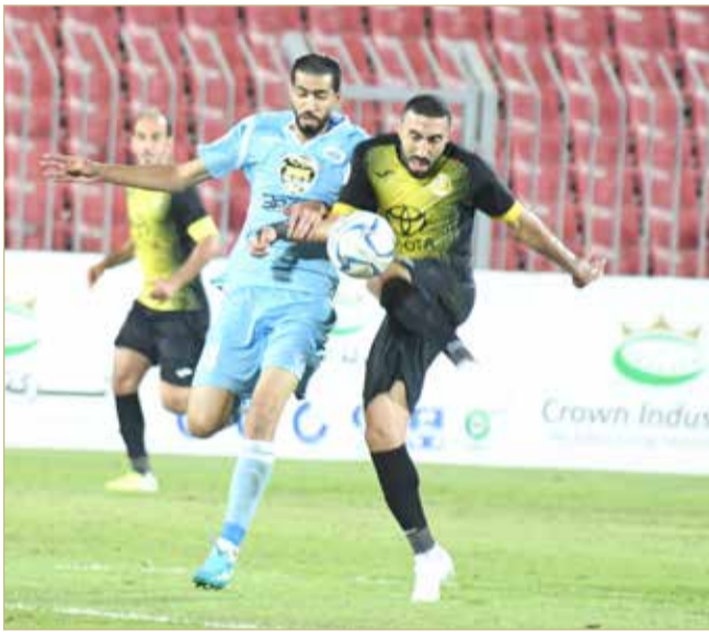
لقاء الرفاع والأهلي

ودع فريق الأهلي الأول لكرة القدم منافسات كأس الملك إثر خسارته مجددا أمام نظيره الرفاع (0/2) في المباراة التي جمعتهما أمس الثلاثاء ضمن مرحلة الإياب للدور الـ 16.