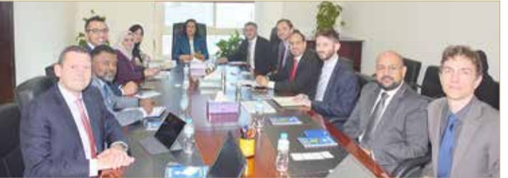
وزيرة الصحة تجتمع مع الوفد الدولي

♦ الصالح: "الصحة" تسعى لنتائج وتوصيات يمكن تنفيذها في الواقع