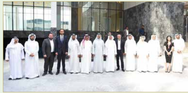
صورة جماعية خلال زيارة “واتر بي”

وأشار إلى أن مشروع “واتر بي” يعد من أكبر مشاريع شركة بن فقيه، إذ يبلغ عدد الشقق 716 شقة تتمتع بموقع استراتيجي مع إطلاله متميزة على خليج البحرين “بحرين بي” والذي يعتبر وجهة رئيسية للمقيمين والمستثمرين في قلب العاصمة المنامة، إلى جانب كون المشروع على مقربة من العديد من مراكز التسوق مثل مجمع أفنيوز - البحرين والمنطقة التجارية.