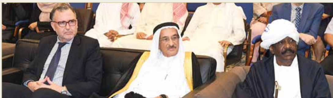
المكتب الثقافي الكويتي يقيم الملتقى الثقافي السادس للملحقين الثقافيين العرب

وأوضح أن التعاون الثقافي بين السفارات العربية، وأقامتها لفعاليات مشتركة هو دليل على ريادتها في تنظيم الفعاليات والأنشطة التي تهم المجتمع، مؤكداً أهمية مثل هذه الملتقيات لما لها من دور كبير في إبراز الجانب الثقافي والتوعوي والصحي في تنمية المجتمع.