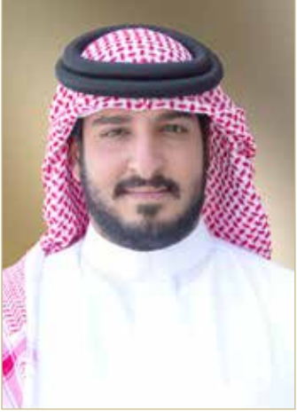
سمو الشيخ عيسى بن عبدالله