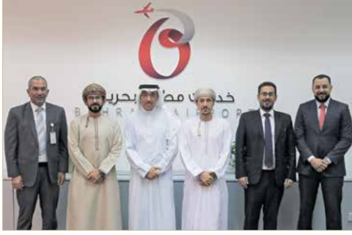
المحميد مستقبلاً وفد “طيران السلام”

لتوسيع شبكة محطاتها. وتعتبر شركة طيران السلام أول ناقل اقتصادي في سلطنة عمان، حيث تأسست في عام 2016 لتقدم رحلات منخفضة التكاليف، وتوفر خيارات سفر مريحة لمجموعة من الوجهات في شتى أنحاء العالم.