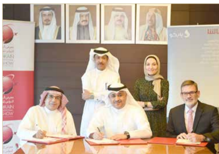
أثناء توقيع اتفاقية الرعاية