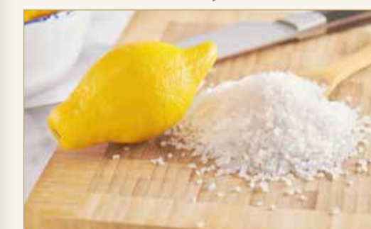
الحل السحري يساعد في القضاء على الروائح الكريهة أيضا

يمنحك هذا المعقم الطبيعي القوي نتائج رائعة بمنتجات طبيعية بديلة عن المواد الكيميائية التقليدية المستعملة في التنظيف.