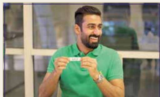
جانب من مراسم قرعة البطولة

بيت التمويل الكويتي وبنك الأهلي المتحد وبنك البحرين للتنمية. ولن تحلو المنافسة في المجموعة الثانية التي تضم حامل لقب مسابقة الكأس في العام الماضي فريق تمكين، حيث سيلعب مع فرق منافسة وقوية من خلال تواجد بنك البحرين الوطني والمصرف الخليجي التجاري، وجميعها تسعى للمنافسة على البطولة.