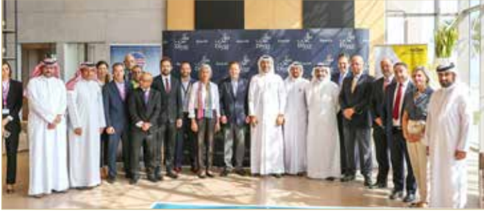
زيارة السفير الأميركي لـ "ديار المحرق"

إيكوم "AECOM" الشركة العالمية للاستشارات، بالتحدث عن إنجازات الشركة بكونها الطرف المسؤول عن إعداد المخطط الرئيس للمشروع. وأصحب المسؤولون بعد ذلك السفير إلى مكتب مبيعات "مراسي البحرين"، حيث أطلع السفير برفقة المجموعة على مكتب المبيعات، مع تعريفه بهذا المشروع الذي يقع في قلب مدينة "ديار المحرق"، وما يشكله من أهمية كبرى بالنسبة للمشروع الرئيس.