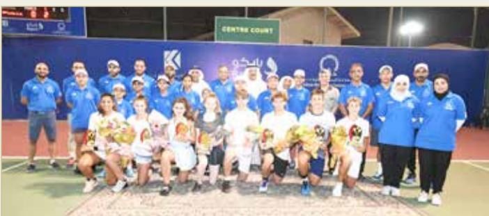
اللجان المنظمة مع أبطال الزوجي