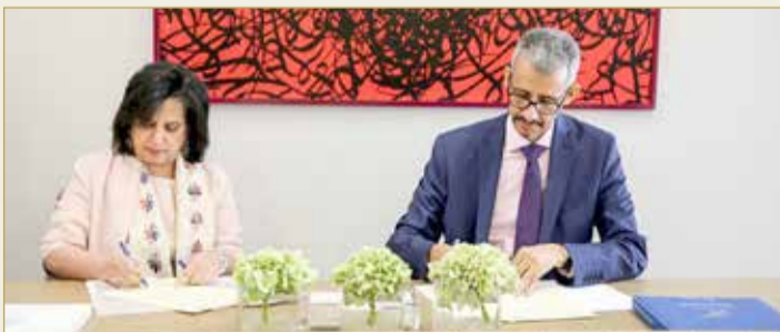
رئيسة مجلس إدارة المركز الإقليمي العربي للتراث العالمي توقيع الاتفاقية مع المدير العام لمنظمة ألكسو

وتنص مذكرة التفاهم على تنظيم أنشطة مشتركة متنوعة ما بين لقاءات واجتماعات وورش عمل ودورات تدريبية، ودعم فني للدول العربية، وبرامج مشتركة في عدد من المجالات؛