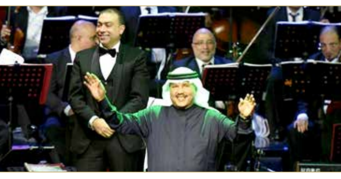
سيقام الحفل على مسرح يحمل اسم الفنان السعودي، ويتسع لـ 22 ألف متفرج، حسب ما ذكرت إدارة موسم الرياض.

وأوضح رئيس مجلس إدارة الهيئة العامة للترفيه، رئيس موسم الرياض، تركي آل الشيخ، أنه سيتم أيضا تكريم الفنان عبادي الجوهري، في ليلة "عباديات" أواخر شهر نوفمبر، مشيرا إلى أنه سيكون حفلا "استثنائيا". وتقدم عبده بالشكر للعاهل السعودي الملك سلمان بن عبدالعزيز، لما يقدمه للسعودية "من