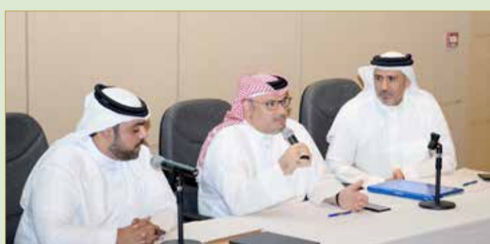
المحاضرون في المحاضرة

“التكنولوجيا والأعمال” تدعو لوضع استراتيجية شاملة للقطاع