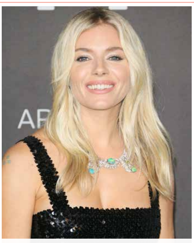
الممثلة البريطانية الأميركية سيبينا ميلر تصل حفل متحف مقاطعة لوس أنجلوس للفنون

بعد أن وصفت بـ"غرفة الغاز"، التقط راكب في طائرة كانت تحلق فوق نيودلهي، مقطع فيديو تظهر ضبابا كثيفا يغطي مختلف أرجاء المدينة الهندية، التي بلغ فيها التلوث مستويات تفوق القدرة على الاحتمال. وقبل أيام، سجلت أسوأ معدلات للتلوث منذ بداية عام 2019 في مدينة نيودلهي الهندية، حيث سجل مؤشر جودة الهواء مستوى "شديد السوء"، وسط ترجيحات بالمزيد من التدهور. وغطى الضباب الدخاني الكثيف نيودلهي بشكل غير طبيعي، فيما وصلت جودة الهواء في المدينة الهندية إلى مستويات "خطيرة".