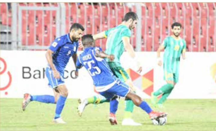
لقاء الحد والمالكية

سقط فريق المالكية أمام نظيره الحد بنتيجة (1/4) ليخرج من منافسات دور الـ 16 من مسابقة أعلى الكؤوس - بعدما انتهت مواجهة الذهاب بالتعادل (2/2).