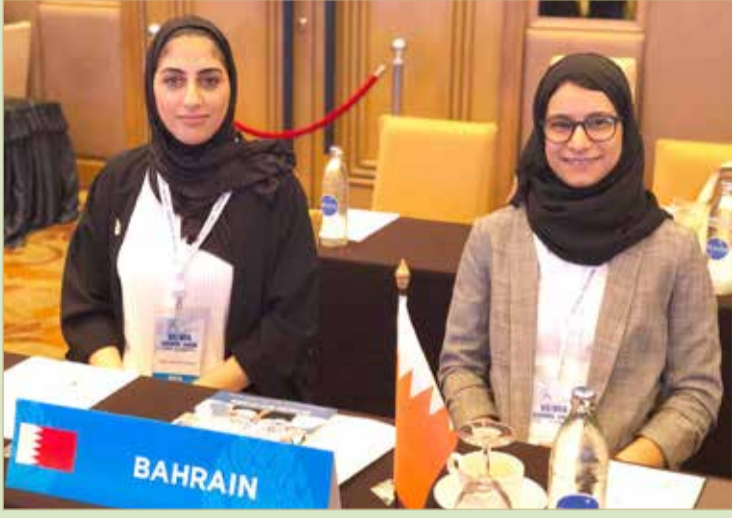
جانب من مشاركة وفد اللجنة الأولمبية

“الأولمبية” تشارك بالمنتدى الإقليمي للتضامن الأولمبي والمجلس الآسيوي