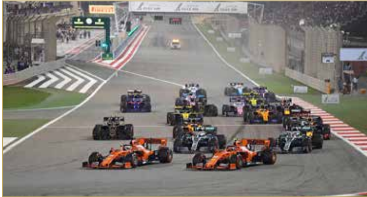
من سباق الفورمولا 1 في البحرين

تشمل مجموعة مختارة من أشهر الفنانين الموسيقيين في العالم إلى جانب نخبة من نجوم الغناء وغيرهم من فعاليات الترفيه العالمية على مدار عطلة نهاية الأسبوع، والمزيد من الفعاليات والمفاجآت التي سيتم الإعلان عنها قريباً.