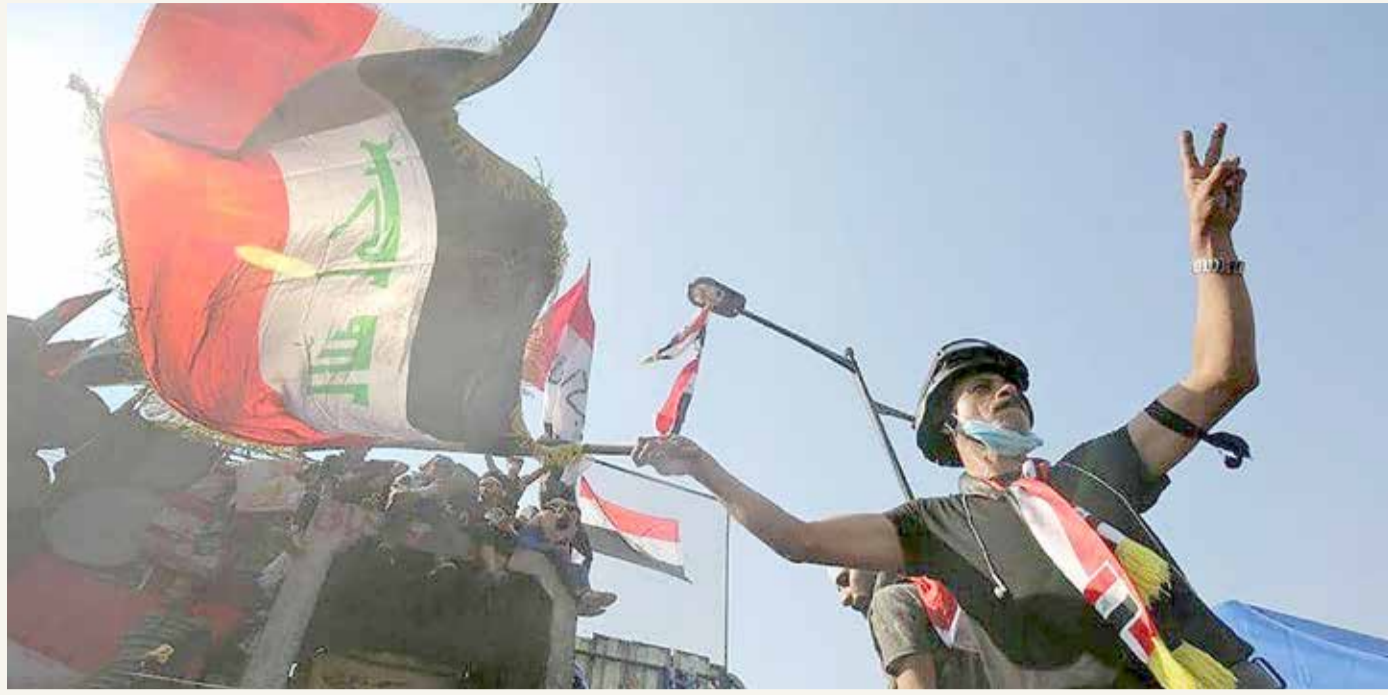
استمرار التظاهرات في بغداد ومدن عراقية أخرى

ويؤسس الاتفاق، الذي رعته السعودية بين الأطراف المتحالفة ضد ميليشيات الحوثي، لمرحلة جديدة من التعاون والشراكة، وتوحيد الجهود للقضاء على الانقلاب واستئناف عمليات التنمية والبناء، خصوصا في المحافظات المحررة جنوب اليمن.