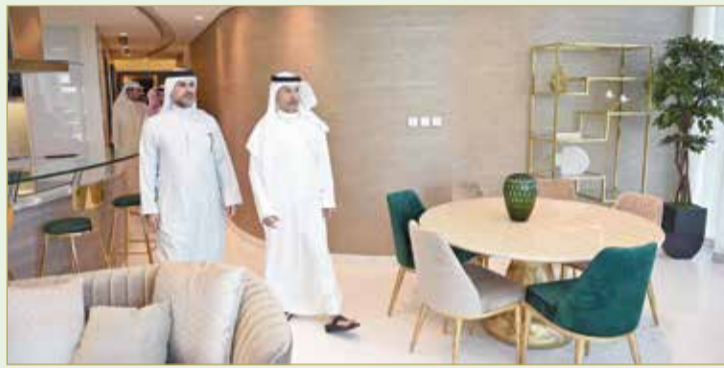
محافظ العاصمة لدى زيارته مشروع “واتر بي”

تمتاز بالشفافية والجاذبية، منوهاً بأن الفضل يعود في ذلك لتوجهات القيادة الرشيدة في تطوير البنية التحتية من خلال الاهتمام باستقطاب الاستثمارات والمشاريع الضخمة الخارجية بما يحقق رؤيتها في تنوع مصادر الدخل لدور ذلك الإيجابي في تنمية الاقتصاد الوطني وخلق فرص العمل للمواطنين. وقال إن مشروع “واتر بي” يعد من أبرز المشاريع الاستثمارية في المجال العقاري لتضمينه مرفق مميزة وجاذبة، إضافة إلى موقعه المميز الذي يعكس الصورة الجمالية والواجهة البحرية الرائعة للعاصمة، مشيداً بالمحافظ بالمشروع الرائدة والمتنوعة التي تقدمها شركة بن فقيه للاستثمار العقاري وما أنجزته في السنوات الأخيرة.