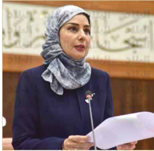
رئيسة المجلس متحدثة من على مقاعد الأعضاء

زينل: ليس منهجا دراسيا ينتهي بتقديم الامتحانات