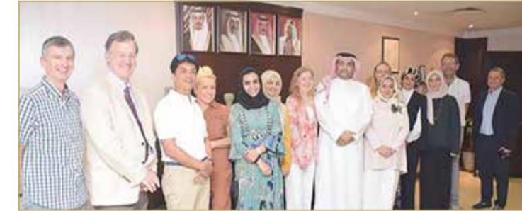
قسم التعليم والتدريب لبرامج طب الأسنان عقد امتحان الزمالة في طب وجراحة الأسنان

♦ المانع : حريصون على التعاون مع الكلية الملكية للجراحين بطب الأسنان