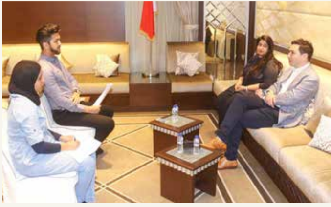
جانب من المؤتمر الصحفي أمس

توقع 12 مليون مشاهد لجولة البطولة النهائية بالبحرين