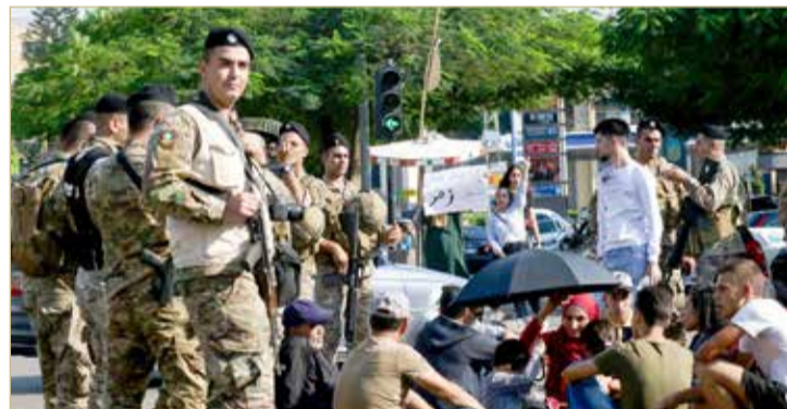
طلاب المدارس يشاركون في مظاهرة بمدينة صيدا الجنوبية

وأوقفت قوى الأمن اللبناني في بيروت 4 شبان حاولوا اعتراض الجيش ومنعه من فتح عند الشارعين الغربي والشرقي في الطريق الساحلي الرئيسي عند محلة جل الديب. وذكرت أن الجيش اللبناني استقدم جرافات وآليات لإعادة فتح عدد من الطرقات المغلقة، أمس، مشيرة إلى أنه يتوجه حالياً إلى منطقة الزوق لإعادة فتح الطريق الرئيسي هناك. وفي اليوم العشرين من التحركات الشعبية في لبنان قرّر المتظاهرون تنفيذ اعتصامات أمام المؤسسات العامة والمصارف المركزية والبنوك التجارية