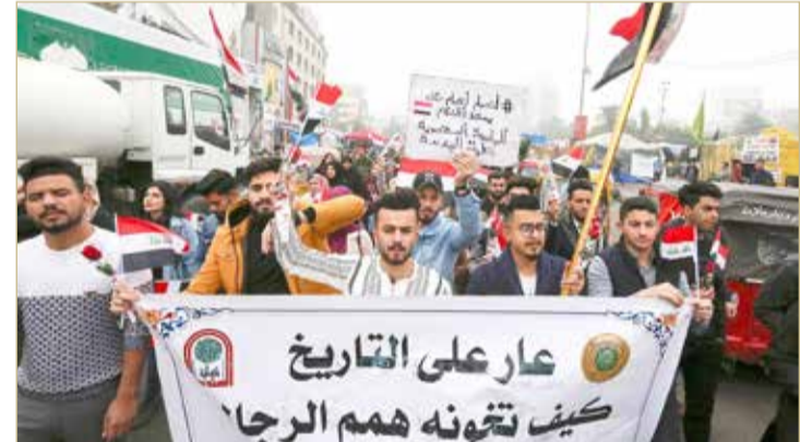
من احتجاجات العراق

لم يكن تحدد بعد من هي الكتلة الأكبر في البرلمان العراقي. ووسط استمرار هذه التظاهرات والحراك، أعلنت مجموعة من الناشطين عن حراك جديد أطلقت عليه اسم "حراك 25 تشرين". إلى ذلك، نقلت وكالة الأنباء العراقية عن "مصادر سياسية مطلعة"