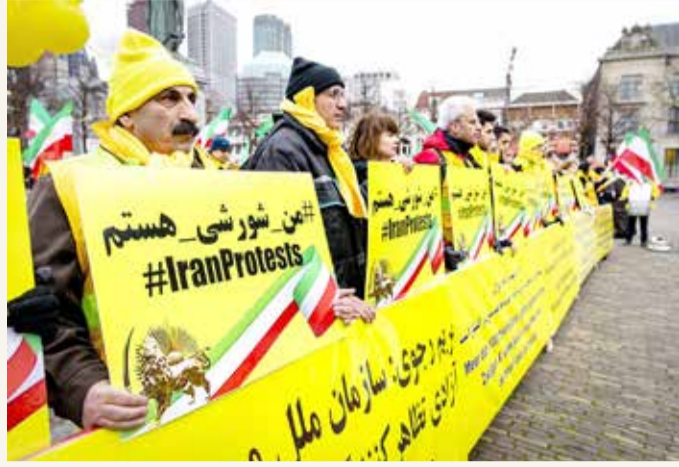
أعضاء رابطة الأكاديميين الإيرانيين يتظاهرون في لاهاي 10 ديسمبر الجاري ضد قمع النظام للمتظاهرين وانتهاكات حقوق الإنسان

الإيرانية: "لا نتدخل في شؤون العراق ونأمل بعودة الاستقرار إليه". وكما عتبر عن موقف الحكومة الإيرانية إزاء احتجاجات العراق المستمرة بالقول إن "الأحداث في العراق ليست في مصلحة الشعب العراقي". إلى ذلك، أقرت الرئاسة الإيرانية بانخفاض شديد لصادرات البلاد النفطية بسبب العقوبات