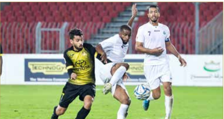
البسيتين قلب تأخره إلى فوز على الأهلي

شهدت مباريات الجولة الرابعة من مسابقة دوري ناصر بن حمد