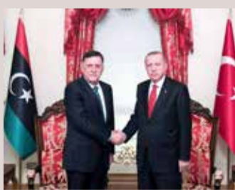
دبي - العربية نت

كشفت مصادر لقناتي "العربية" و"الحدث" أن تركيا أرسلت معدات عسكرية إلى ليبيا كانت حكومة الوفاق قد طلبتها سابقاً، كما أرسلت قوات خاصة لحماية شخصيات من الوفاق، إضافة إلى إيفاد مستشارين عسكريين إلى العاصمة الليبية طرابلس لتقييم الوضع. وكانت لجنة العلاقات الخارجية في البرلمان التركي، الذي يهيمن عليه "حزب العدالة والتنمية" الحاكم بزعامة الرئيس رجب طيب أردوغان قد وافقت في وقت سابق من اليوم على مقترح قانون للمصادقة على مذكرة التفاهم المبرمة بين تركيا وحكومة الوفاق بشأن التعاون العسكري والأمني بينهما. وتنص الاتفاقية التي أرسلت إلى