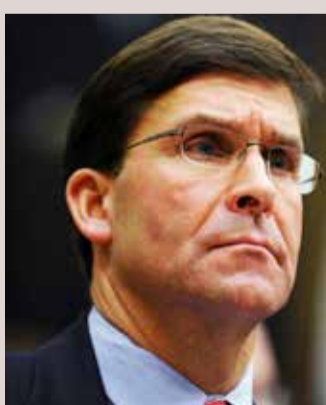
بغداد - رويترز

ذكر بيان صادر عن مكتب رئيس الوزراء العراقي عادل عبد المهدي أن وزير الدفاع الأمريكي مارك إسبر حث عبد المهدي، أمس الإثنين، على اتخاذ خطوات لإيقاف قصف القواعد التي تضم قوات أميركية. جاء ذلك بعد أن حذر مسؤول أميركي عسكري بارز الأسبوع الماضي من أن هجمات تشنها فصائل مدعومة من إيران على قواعد تستضيف قوات أميركية في العراق تدفع كل الأطراف صوب تصعيد خارج عن السيطرة. وتزايدت في الأسابيع القليلة الماضية الضربات الصاروخية التي تستهدف قواعد عراقية يتركز فيها أيضاً أفراد من قوات التحالف بقيادة الولايات المتحدة دون أن تعلن أي جهة مسؤوليتها عن تلك الهجمات. لكن المسؤول العسكري الأميركي قال