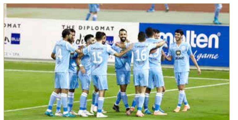
فرحة رفاعية تكررت 5 مرات