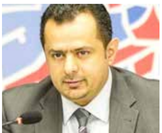
دبي - العربية نت

أكد رئيس الحكومة اليمنية، معين عبدالملك، أمس، أن "مصلحة المجتمع الدولي هو في دعم الحكومة وتحالف دعم الشرعية بقيادة السعودية للقضاء على التهديد الحوثي بإيعاز من داعمها في طهران للملاحة الدولية وزعزعة الأمن والاستقرار في المنطقة". وأشار خلال لقائه في العاصمة المؤقتة عدن، سفير كوريا لدى اليمن، باك وونج تشول، إلى استمرار ميليشيا الحوثي الانقلابية في رفض كل فرض السلام، بما في ذلك اتفاق استوكهولم الذي مرع اعلى توقيعه من دون التزامها بتنفيذ أي من بنوده، ومواصلة تهديدها للملاحة الدولية وآخرها احتطاف سفينتين كوريتين في مياه البحر الأحمر. وجدد معين عبدالملك، التأكيد على