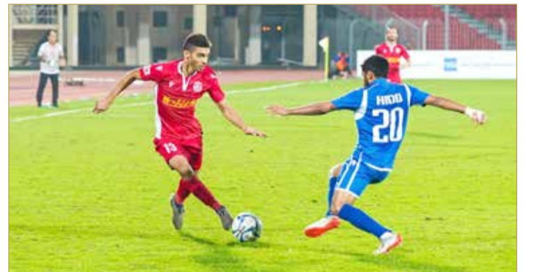
الحد تفوق على المحرق وانفرد بالصدارة