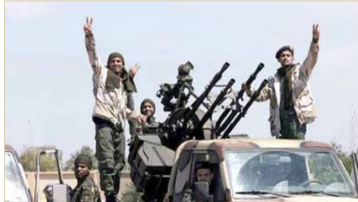
عناصر من الجيش الليبي

مصراة. وقال المركز الإعلامي للجيش الوطني الليبي إن الوزير تعرض لمحاولة اغتيال في مصراة الليبية على يد عناصر من الميليشيات المسلحة، تحمله المسؤولية عن هزائنها أمام الجيش الليبي.