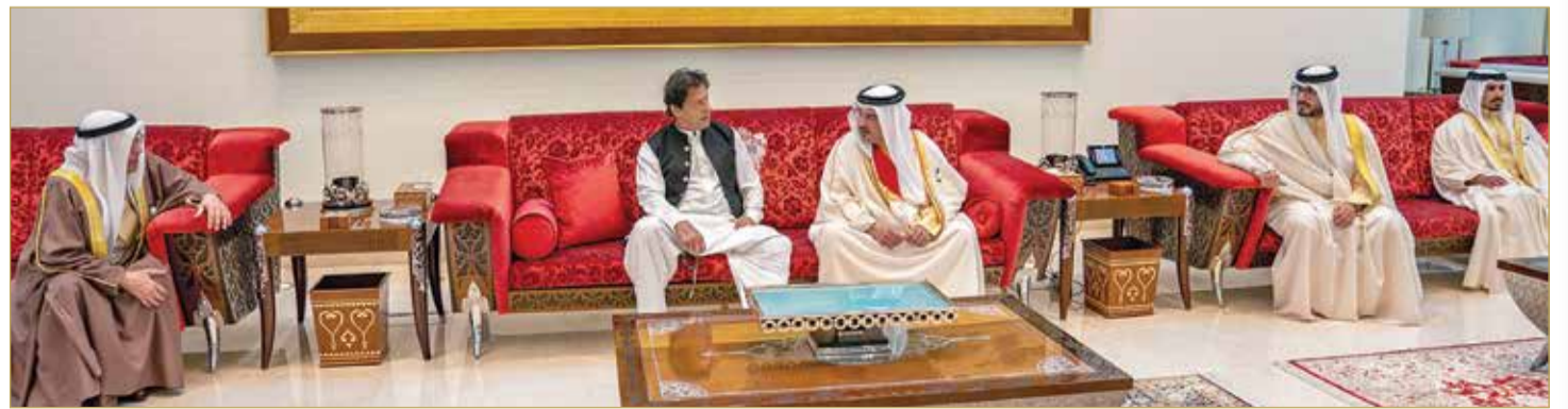
سمو ولي العهد في مقدمة مودعي رئيس وزراء باكستان

الشقيقة. كما تم التوقيع على عدد من مذكرات التفاهم بين البلدين الشقيقتين. وكان في الوداع عدد من أصحاب السمو والمعالي وعدد من كبار المسؤولين بالمملكة.