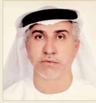
الإعلامي الإماراتي فلاح الكبسي

العربي، نعتز ونفخر ونشرف بما تحققه البحرين من إنجازات، وكل إنجاز مميز نعتبره إنجازاً لنا ونحذ على سبيل المثال، الحدث التاريخي البارز رياضياً، وهو فوز البحرين بكأس خليجي 24 وكيف شاهدنا الفرحة والتهاني تعم الخليج بل والعالم العربي لأن شعب البحرين نموذج يستحق الثناء والاعتزاز والتقدير.