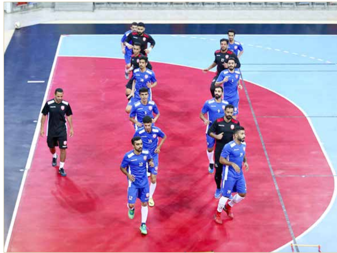
من تدريبات المنتخب

يواصل منتخبنا الوطني لكرة الصالات، سلسلة تحضيراته لبطولة آسيا 2020، وذلك بخوضه حصص تدريبية يومية على صالة مدينة خليفة الرياضية.