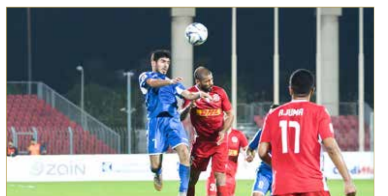
من لقاء الحد والمحرق