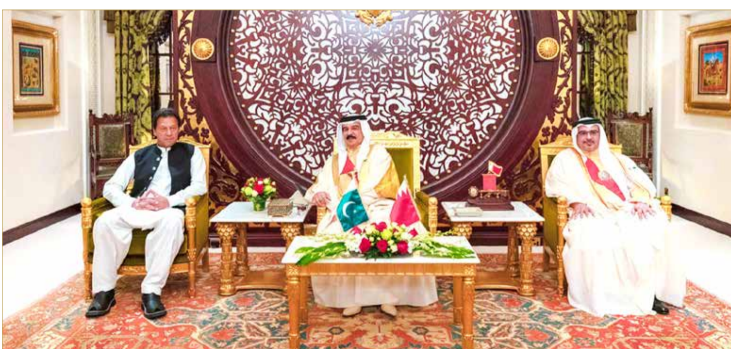
جلالة الملك وبحضور سمو ولي العهد يستقبل رئيس وزراء باكستان

المنامة - بنا استقبل عاهل البلاد صاحب الجلالة الملك حمد بن عيسى آل خليفة، بحضور ولي العهد نائب القائد الأعلى النائب الأول لرئيس مجلس الوزراء صاحب السمو الملكي الأمير سلمان بن حمد آل خليفة في قصر الصخير أمس، بحضور ولي العهد نائب القائد الأعلى النائب الأول لرئيس مجلس الوزراء صاحب السمو الملكي الأمير سلمان بن حمد آل خليفة، وبحضور دولة رئيس وزراء جمهورية باكستان الإسلامية الشقيقة دولة عمران خان بمناسبة زيارته الرسمية للمملكة. وعقد صاحب الجلالة الملك اجتماعاً مع رئيس الوزراء الباكستاني، جرى خلاله استعراض مجمل العلاقات التاريخية الوثيقة، والخطوات التي تسهم في تعزيز التعاون الثنائي في كافة المجالات. كما جرى خلال اللقاء تبادل جهات النظر بشأن التطورات الإقليمية والدولية بما فيها القضايا التي تهم العالم الإسلامي والموضوعات ذات الاهتمام المشترك. وتفضل عاهل البلاد صاحب الجلالة الملك فشمع برعايته الكريمة في قصر الصخير أمس، بحضور ولي العهد نائب القائد الأعلى النائب الأول لرئيس مجلس الوزراء صاحب السمو الملكي الأمير سلمان بن حمد آل خليفة، وبحضور دولة رئيس وزراء جمهورية باكستان الإسلامية الشقيقة، الاحتفال الذي أقيم بمناسبة أعياد مملكة البحرين الوطنية. وقال جلالتة في كلمة سامية: "تحل علينا هذه المناسبة العطرة والبحرين تزدهو بتأسيسها المدني وبنائها الحدائي، وإنجازاتها العريقة في كافة المجالات التنموية التي تعود بالزمن لتلك الانطلاقة العريقة على يد مؤسسي الدولة البحرينية، قبل أكثر من قرنين". (04 - 06)