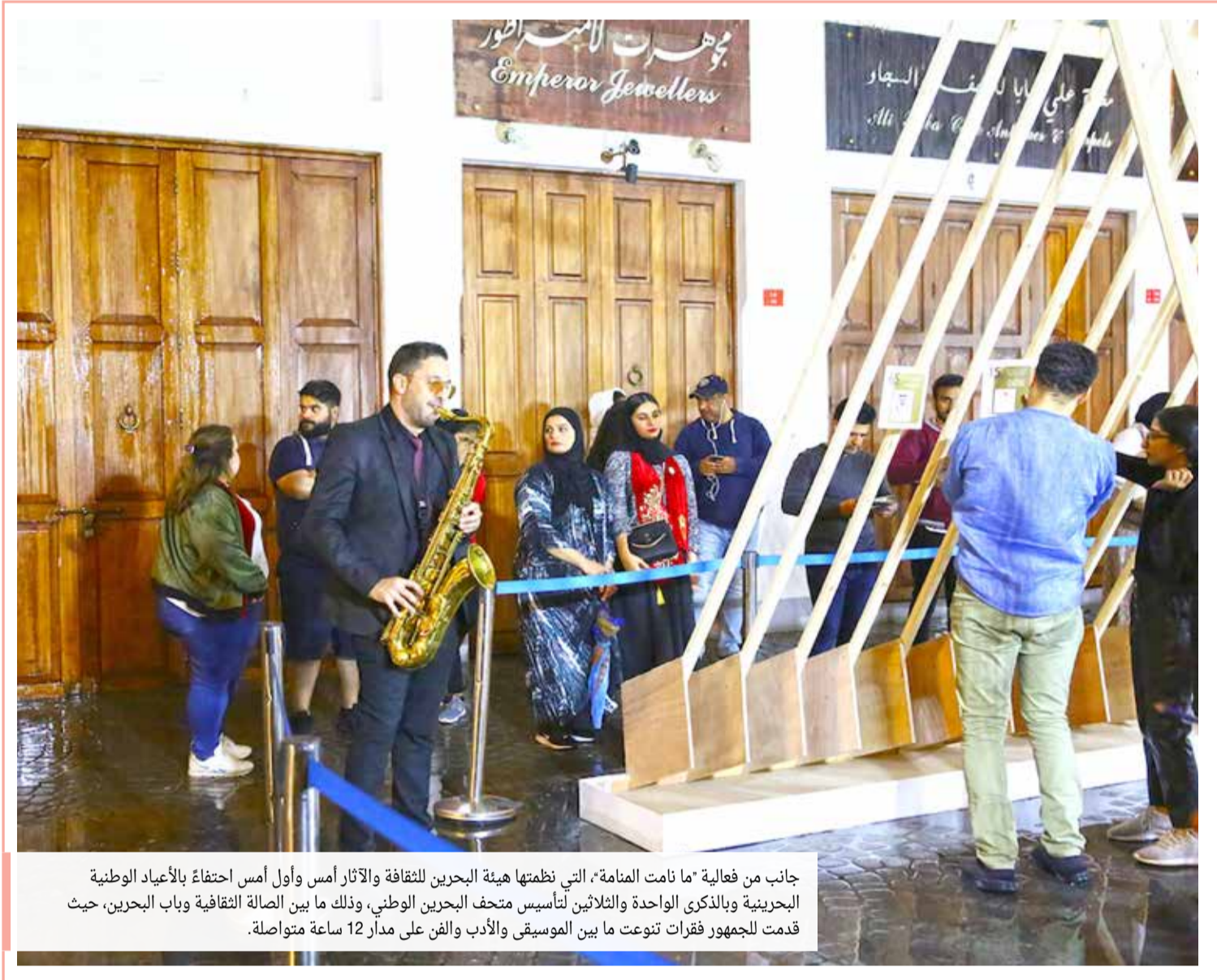
جانب من فعالية "ما نامت المنامة" التي نظمتها هيئة البحرين للثقافة والآثار أمس وأول أمس احتفاءً بالأعياد الوطنية البحرينية وبالذكرى الواحدة والثلاثين لتأسيس متحف البحرين الوطني، وذلك ما بين الصالة الثقافية وباب البحرين، حيث قدمت للجوهر فقرات تنوعت ما بين الموسيقى والأدب والفن على مدار 12 ساعة متواصلة.

البحرينية في عهد المؤسس أحمد الفاتح كدولة عربية مسلمة عام 1783 ميلادية، وذكرى انضمامها في الأمم المتحدة كدولة كاملة العضوية، وذكرى تولي صاحب الجلالة الملك لمقاليده الحكم. ازدان محرك البحث جوجل أمس بعلم مملكة البحرين مشاركة في احتفالات مملكة البحرين بأعيادها الوطنية إحياءً لذكرى قيام الدولة