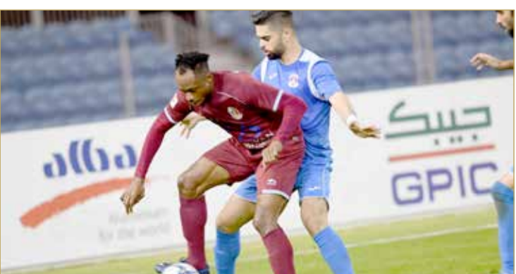
من لقاء المنامة والشباب