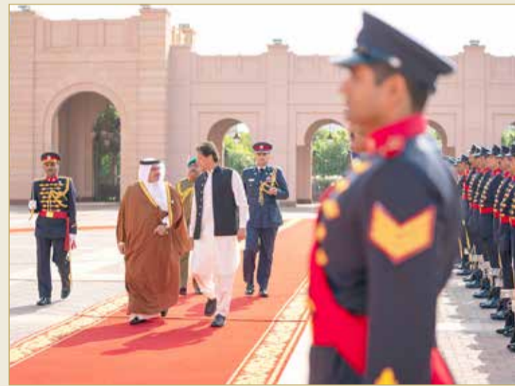
سمو ولي العهد يعقد جلسة مباحثات رسمية مع دولة رئيس وزراء جمهورية باكستان الإسلامية

هذا وأقام صاحب السمو الملكي ولي العهد نائب القائد الأعلى النائب الأول لرئيس مجلس الوزراء مآدبة غداء، حضرها عدد من أصحاب السمو والمعالي والسعادة وكبار المسؤولين، تكريماً لدولة رئيس وزراء جمهورية باكستان الإسلامية الشقيقة والوفد المرافق.