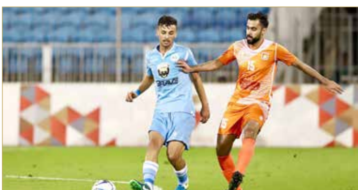
من لقاء الرفاع والحالة