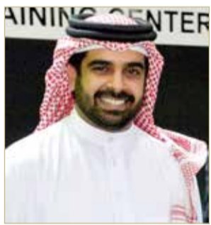
سمو الشيخ سلمان بن محمد

المجلس البحريني للألعاب القتالية - المركز الإعلامي