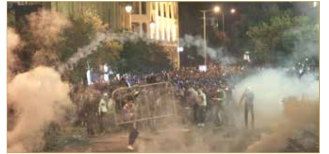
متظاهرون لبنانيون يرحلون عنقافاً حديدياً في وسط بيروت أمس الأول (أ ف ب)

« نفى المتحدث باسم الحكومة الإيرانية، علي رباعي، نية الرئيس حسن روحاني تقديم استقالته، عقب الاحتجاجات التي اندلعت في نوفمبر الماضي، إثر قرار الحكومة رفع أسعار البنزين، والتي قمعت بعنف دموي قتل خلالها « مجرد إشاعات لا أساس لها من الصحة. » « وعزى المتحدث باسم الحكومة الإيرانية الاحتجاجات التي تحولت إلى حراك مطالب بإسقاط النظام إلى تأثير العقوبات الأميركية، وقال إن الحكومة الأميركية تقف وراءها. « رفض رباعي في مؤتمر صحفي، أمس، صحة تصريحات نسبت ل نائب الرئيس الإيراني وفادة بالجناح الإصلاح، مثل: عباس عبيدي، حول مشروع لدفع روحاني للاستقالة، وقال إنها « نية المتحدث باسم الحكومة الإيرانية، علي رباعي، نية الرئيس حسن روحاني تقديم استقالته، عقب الاحتجاجات التي اندلعت في نوفمبر الماضي، إثر قرار الحكومة رفع أسعار البنزين، والتي قمعت بعنف دموي قتل خلالها