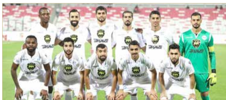
فريق الرفاع حامل اللقب

أحرزه الموسم الماضي. آخر المباريات ستجمع الحد متصدر دوري ناصر بن حمد الممتاز حالياً أمام الشباب الذي كانت له فرصة للوصول للنهاية قبل موسمين، قبل أن يتعثّر في نصف النهائي أمام المنامة، فيما الحد يأمل في الوصول