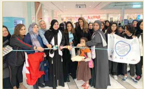
الشيخة لبنى تقص الشريط

صالح الفرد والمجتمع. كما أكدت، رئيسة لجنة العلاقات العامة والعلاقات العامة بجمعية النور للبر حنان بن عربي، إن هذه الفعالية جاءت من منطلق اهتمام دار البر لرعاية الوالدين بالصحة العامة وبتوعية الفرد بأهمية الوقاية قبل العلاج، وإن نجاح الماراثون والمعرض جاء نتيجة جهود متضافرة بين الجهات المشاركة. وكزمت رئيسة جمعية النور للبر الشيخة لمياء بنت محمد والداعمين والمساهمين في ختام الفعالية.