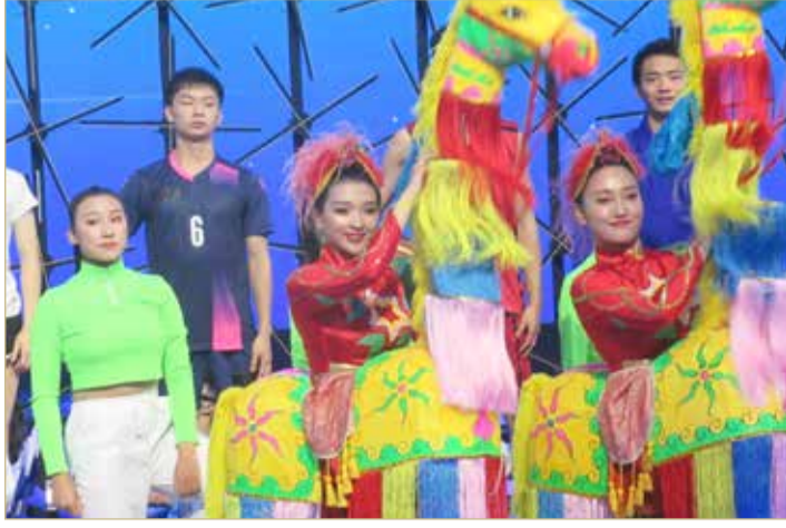
شعار الألعاب الآسيوية

بفضل خبرتنا وخبرة شركائنا في الصين. وتقام دورة الألعاب الآسيوية التاسعة عشرة في هانغتشو من 10 إلى 25 سبتمبر العام 2022، وستكون المرة الثالثة التي تستضيف فيها الصين هذه الألعاب التي يشرف عليها المجلس الأولمبي الآسيوي بعد بكين 1990 وغوانغتشو 2010.