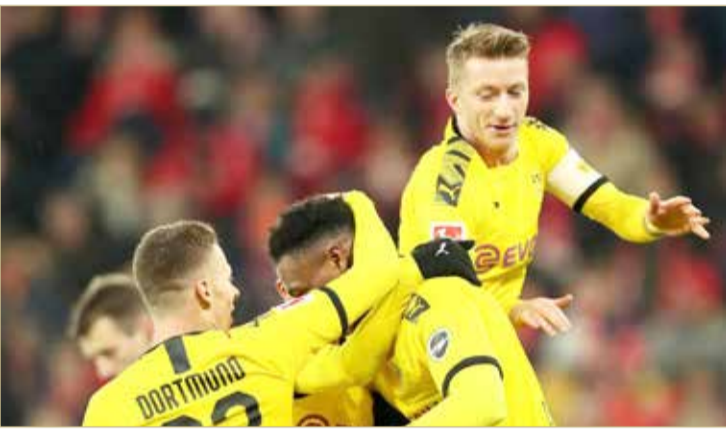
دورتموند يواجه لايرغ في مباراة قمة

وكانت مجموعة تسونامي الديمقراطية الاحتجاجية، قد وجهت رسالة بشأن الكلاسيكو، حيث قالت "من السهل إقامة المباراة بشكل طبيعي، وما على إدارة برشلونة سوى ضمان وجود الافتتاح الخاصة بنا في مدرجات كامب نو، وداخل الملعب". ووفقًا لبرنامج "النشيريونجيتو" الإسباني، فإن بعثة ريال مدريد ستتحرك إلى "كامب نو" في حماية 12 مدرعة من الأمن المحلي. وسبق أن زعمت تقارير أن لاعبي ريال مدريد لن يغادروا الطائرة في كتالونيا، إلا إذا تأكدوا من وجود قوات أمن كافية لحماية وصولهم إلى "كامب نو". يذكر أنه كان مقرراً إقامة الكلاسيكو يوم 26 أكتوبر الماضي، ضمن منافسات الجولة العاشرة من الليجا، قبل أن يتم تأجيله بسبب المظاهرات الاحتجاجية في كتالونيا إلى يوم 18 من الشهر الجاري.