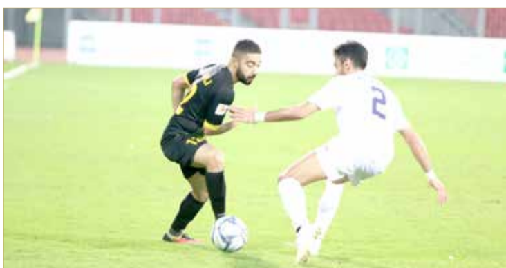
من لقاء البسيتين والأهلي