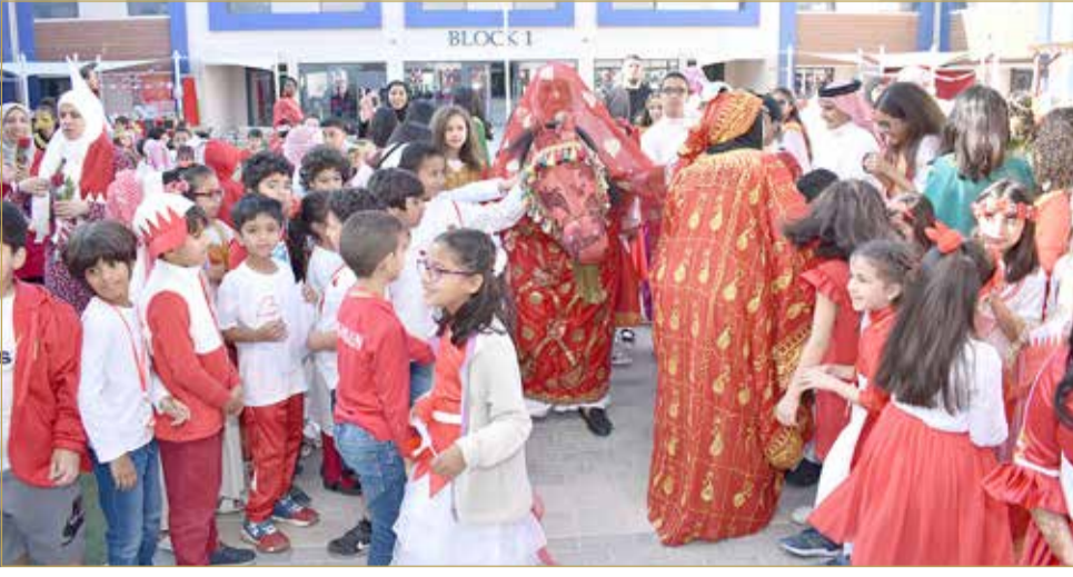
احتفال طلبة مدرسة نور الديار