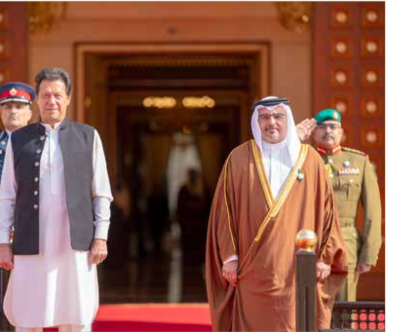
سمو ولي العهد عقد جلسة مباحثات رسمية مع رئيس وزراء باكستان

أكد ولي العهد نائب القائد الأعلى النائب الأول لرئيس مجلس الوزراء صاحب السمو الملكي الأمير سلمان بن حمد آل خليفة أن مملكة البحرين تسعى دائماً إلى توسيع علاقاتها مع الدول الآسيوية الشقيقة والصديقة وترسيخ شراكاتها الاستراتيجية معها بما يخدم المصالح المشتركة، واستمرارية تضافر الجهود بما يحقق الأمن والاستقرار في المنطقة. جاء ذلك لدى لقاء سموه بقصر القضيبيي أمس، دولة رئيس وزراء جمهورية باكستان الإسلامية عمران خان. وعقد سموه جلسة مباحثات مع دولة رئيس وزراء جمهورية باكستان الإسلامية، وشهدا توقيع مذكرة التفاهم في مجال التعليم والتعليم العالي والبحث العلمي ومذكرة التفاهم في مجال الشباب والرياضة ومذكرة التفاهم في مجال الرعاية الصحية. وقال البيان الختامي إن الجانبين رحبا بالتوقيع مؤرخاً على اتفاقية للتعاون العسكري، وقررا زيادة تبادل المعلومات والاستخبارات والتقييمات. ونددا بالإرهاب في كافة أشكاله ومظاهره وأكدوا من جديد الرغبة في تعزيز التعاون على الصعيدين الثنائي والمتعدد الأطراف في مجال مكافحة الإرهاب وتمويله. (07 - 08)