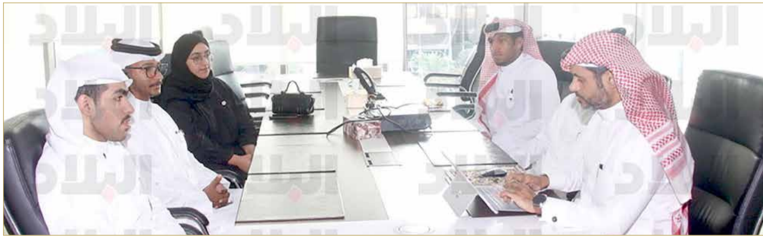
حوار الطلبة مع "البلاد"

احتضان مقرر العيادة القانونية وحقوق الإنسان بكلية الحقوق جامعة البحرين للدراسات النوعية كـ "الاستغلال الإلكتروني للأطفال" والتي ترتبط بـ "بالحقوق الرقمية" أمر مشاء، ويعتبر منصة لبقية الجهات المختصة في الدولة؛ لأن الدراسات الشبيهة تعتبر كمراجع لها، وبوصلة مسار، تحدد خلالها أولوياتها وواجباتها ومسئولياتها تجاه المجتمع.