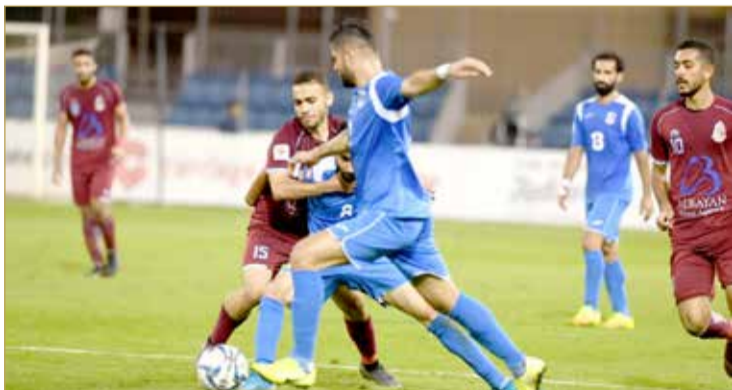
التعادل السلبي على لقاء المنامة والشباب