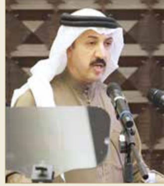
الشيخ عبدالله بن أحمد آل خليفة