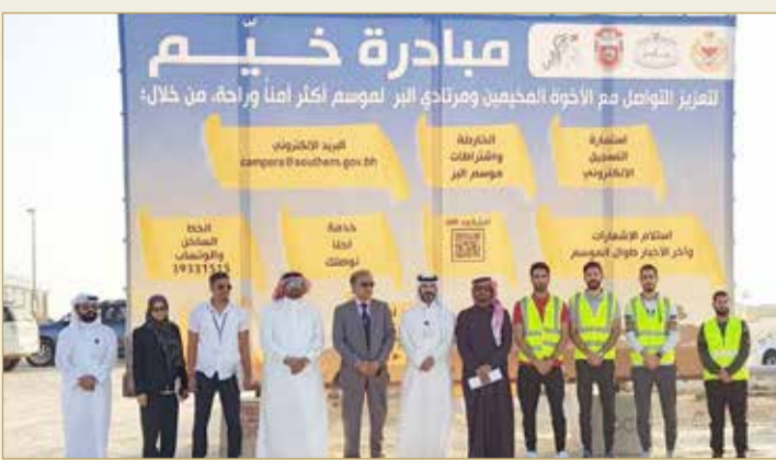
عوالي - المحافظة الجنوبية

بتوجيهات من محافظ الجنوبية سمو الشيخ خليفة بن علي بن خليفة آل خليفة بهدف تحقيق موسم بر آمن وناجح، نظمت المحافظة وبالتعاون مع وزارة الصحة وبلدية المنطقة الجنوبية، حملة توعوية وتفتيشية بالمنطقة التجارية بالقرب من شجرة الحياة، تعد الأولى ضمن سلسلة حملات، تعزز القيام بها خلال موسم البر هذا العام، للتعرف على مدى استيفاء المحلات التجارية بالمنطقة للاشتراطات الصحية، وفحص حالة الأغذية وطرق تخزينها، والتأكد من حالة السجلات التجارية.