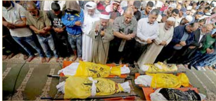
أفراد عائلة فلسطينية قتلوا جراء قصف الطيران الإسرائيلي لمسكن في غزة

عدد الأطفال من مجمل الضحايا بلغ 33، (نحو 23%)، ما يمثل زيادة بنسبة 5% مقارنة مع العام الماضي. وبحسب البيان، فقد قارب عدد الضحايا خلال العام 2019 المعدل العام لأعداد الضحايا خلال الأعوام الخمسة الأخيرة، والذي بلغ خلال الفترة المذكورة 161 قتيلاً في كل عام.