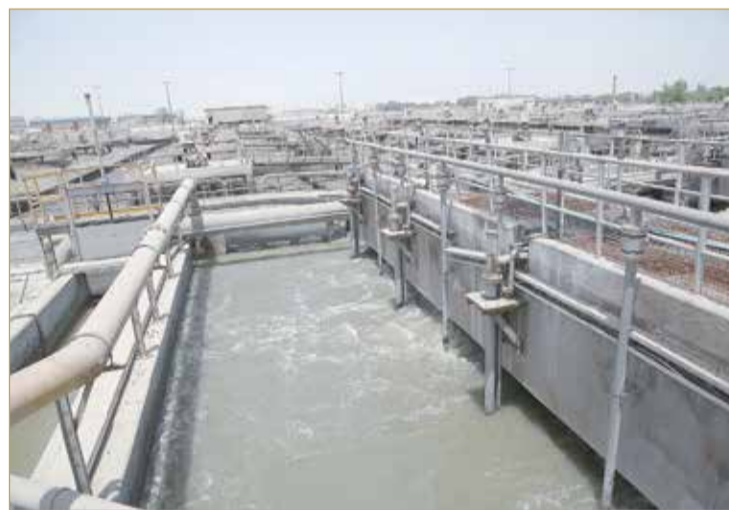
الاستخدام اليومي عن طريق الصهاريج محدود مقارنة بالمحطة.

◆ الاستفادة من صهاريج مياه الصرف... مجاني