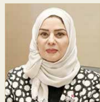
رئيسة مجلس النواب

الرفيعة للوطن والمواطنين، برئاسة سمو رئيس الوزراء، وولي العهد نائب القائد الأعلى النائب الأول لرئيس مجلس الوزراء صاحب السمو الملكي الأمير سلمان بن حمد آل خليفة. وأكدت أن مسيرة سموه الحافلة بالإنجازات الوطنية والدولية، والتي نالت التقدير والتكريم، إقليمياً ودولياً، والمكانة الرفيعة لسموه عند الشعب البحريني خاصة، هي دليل بارز على دور سموه في دعم نهضة مملكة البحرين بقيادة حضرة صاحب الجلالة الملك، وإسهامات سموه الرائدة والمتميزة في خدمة الوطن والمواطن.