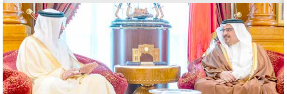
سمو ولي العهد مستقبلاً عبداللطيف الزباني

◆ سمو ولي العهد: خالد بن أحمد مستشار الملك للشؤون الدبلوماسية