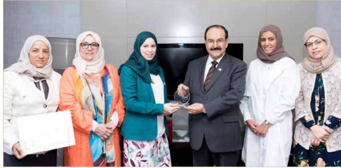
الجمعية النسائية للتنمية النسائية

المنامة - مكتب رئيس هيئة الطاقة المستدامة