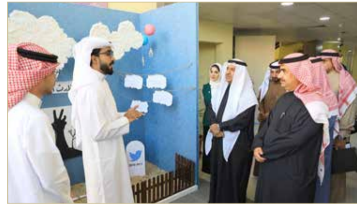
من فعاليات كلية الحقوق بجامعة البحرين

وتحدث د. أحمد عن تاريخ الدراسات القانونية في جامعة البحرين، وأبرز محطات تطورها، مؤكداً أن خريجي الكلية يعدون الاختيار الأول في سوق العمل، علاوة على أن الإنتاج العلمي للمنتسبين إلى الكلية من مؤلفات وإصدارات بدأ يشكل ملامح بارزة للفقهاء البحريني في المجال القانوني. واحتفلت الكلية الفتيبة مؤخراً بمناسبة مرور عقدين من الزمن على بدء الدراسات القانونية في الجامعة