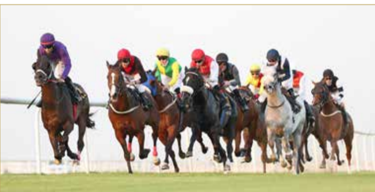
منافسات قوية يشهدها سباق اليوم

وستطلق الإثارة من الشوط الأول الذي سيقام على كأس شركة أمنيوم البحرين "ألبا" للجياد الدرجة الثالثة والرابعة والمبتدئات "نتاج محلي" مسافة 2200 متر والجائزة 2500 دينار وبمشاركة 7 جياد، حيث سيكون الشوط مفتوحاً للمنافسة بين الفرسان المتميزين البحرينيين الذين سيخوضون الصراع الثالث بينهم خلال الأشواط المخصصة بينهم هذا الموسم لكن شوط اليوم سيشهد غياب عدد من الفرسان المتميزين لأسباب مختلفة مما سيجعل