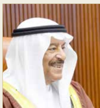
رئيس مجلس الشورى

من دعم ورعاية من قبل سموه، وما بلغت مستويات التعاون والتنسيق المشترك بين السلطتين التشريعية والتنفيذية، والتي أثمرت العديد من المنجزات التشريعية بفضل توجيهات سموه لتنفيذ جميع التشريعات الداعمة لمصلحة البحرين وشعبها الوفي. وقال رئيس مجلس الشورى "إن لسموه المكانة الوطنية الكبيرة في نفوس شعب البحرين الوفي، وهو الأب الحريص على مصلحة أبنائه من المواطنين، وصاحب المبادرات الوطنية الداعمة لمسيرة البحرين التنموية في جميع القطاعات، وإنه ليس بغريب على شعب البحرين هذا الحب الكبير الذي يكنه لسموه حفظه الله".