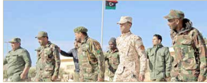
الجيش الليبي: سعت قوات تركيا ميليشيات وفنائها