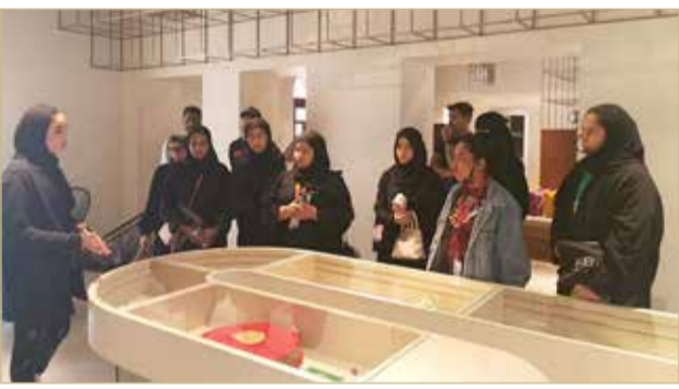
جولة لمتدربي "BTI" بباب البحرين

نظم قسم أنشطة المتدربين بمعهد البحرين للتدريب زيارة ميدانية إلى باب البحرين لعدد من متدربي المعهد من مختلف الأقسام التدريبية؛ بهدف التعرف على المواقع المهمة والسياحية التاريخية في مملكة البحرين. وقام فريق من مرشحات هيئة البحرين للثقافة والآثار باستقبال متدربي المعهد، وأخذهم في