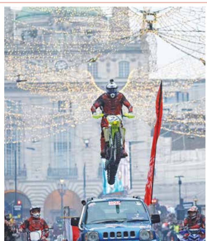
متسابق يقفز بالدراجة النارية خلال موكب يوم رأس السنة السنوي في وسط لندن

« وبحسب التقرير، فإن المشروع الذي يصل البحر الأسود بمرمرة من خلال آخر مناطق الغابات المتبقية بإسطنبول، سيحمل مياه شاطئ البحر الأسود الملوثة إلى النظام البيئي النظيف لبحر مرمرة.