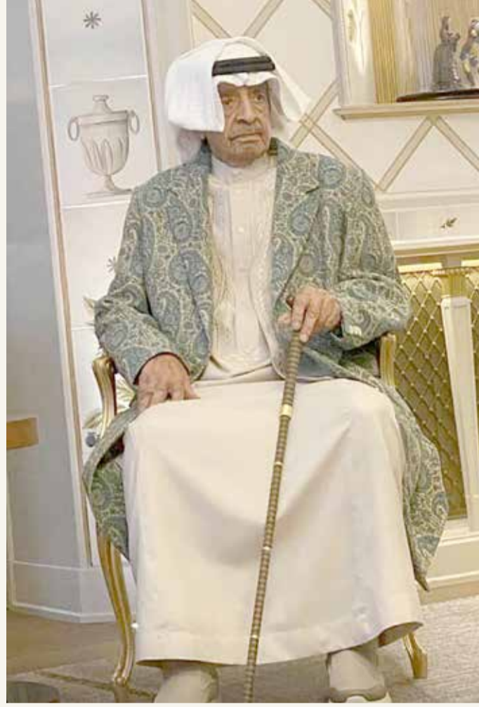
البلاد إبراهيم النهام

عبر جمع غفير من المواطنين في شبكات التواصل الاجتماعي عن تفاعلهم للأخبار والصور الجديدة لرئيس الوزراء صاحب السمو الملكي الأمير خليفة بن سلمان آل خليفة، متمنين لسموه الكريم بموفور الصحة والعافية، متمنين عودة سموه لربوع الوطن الذي يشترق إليه.