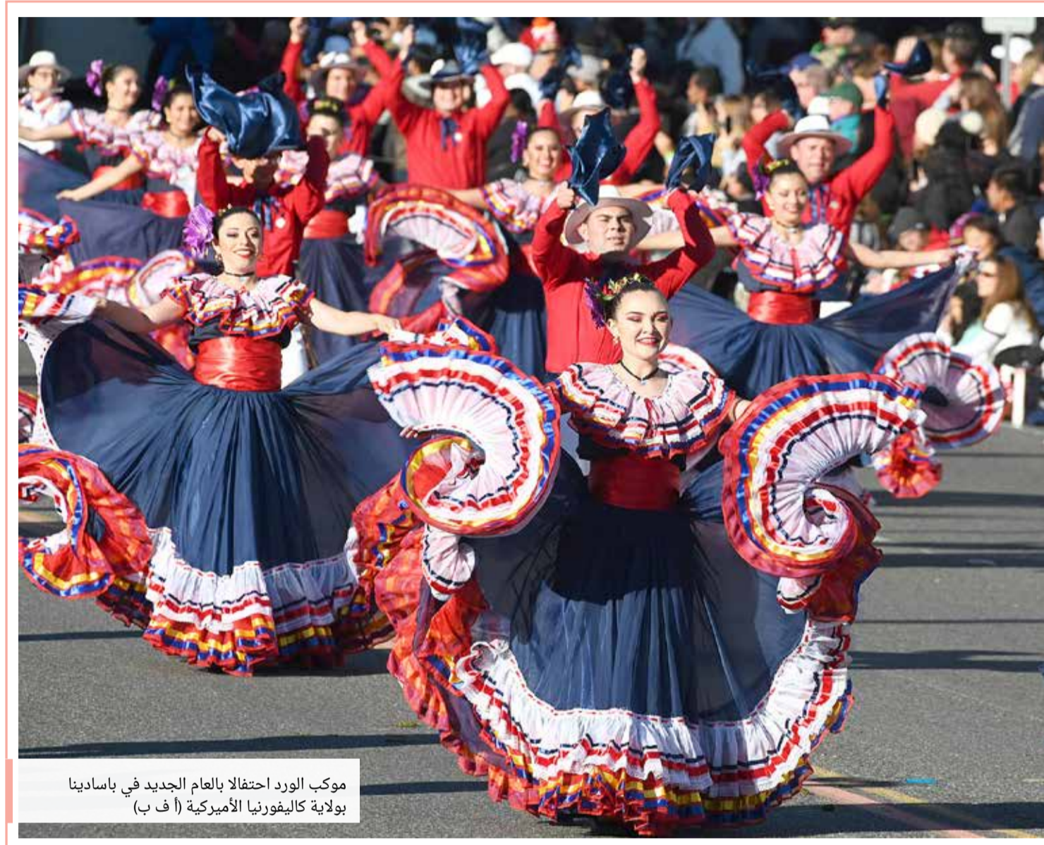
موكب الورد احتفالاً بالعام الجديد في باسادينا ولاية كاليفورنيا الأميركية