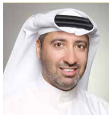
دعيج بن سلمان