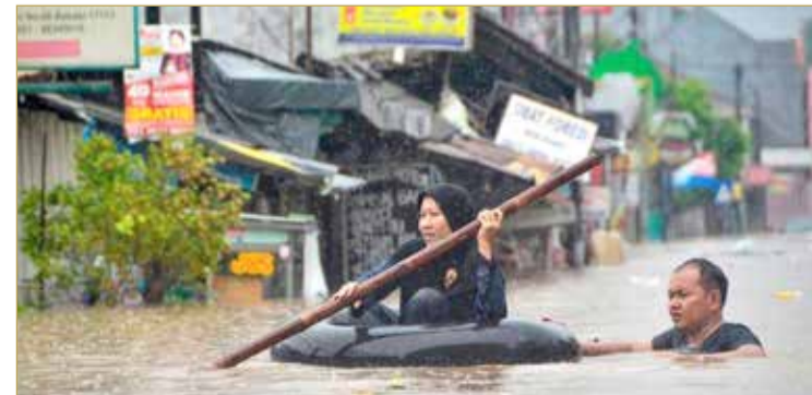
ذكر وبيوو أن أكثر من 31 ألف شخص توجهوا إلى ملاجئ مؤقتة بعد أن وصلت مياه الفيضان إلى ارتفاع 2.5 متر في بعض الأماكن، حسبما نقلت "الأسوشيتد برس".

قالت وكالة إدارة الكوارث في إندونيسيا، أمس الخميس، إن الفيضانات الشديدة التي وقعت في العاصمة جاكرتا مع احتفال السكان بالعام الجديد، أسفرت عن مقتل 16 شخصا على الأقل، وتشريد عشرات الآلاف، وأجبرت السلطات على إغلاق مطار. وقال المتحدث باسم الوكالة الوطنية للتخفيف من الكوارث أغوس وبيوو: إن الأمطار الموسمية وارتفاع منسوب