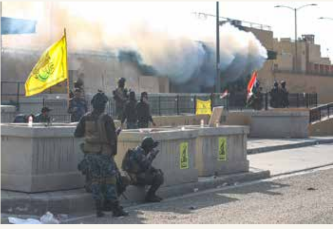
قوات الأمن العراقية تنتشر حول السفارة الأميركية في العاصمة بغداد