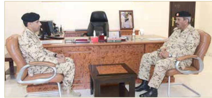
الرفاع - قوة دفاع البحرين

◆ القائد العام: رجال قوة الدفاع لا يدخرون جهداً في العطاء والتضحية