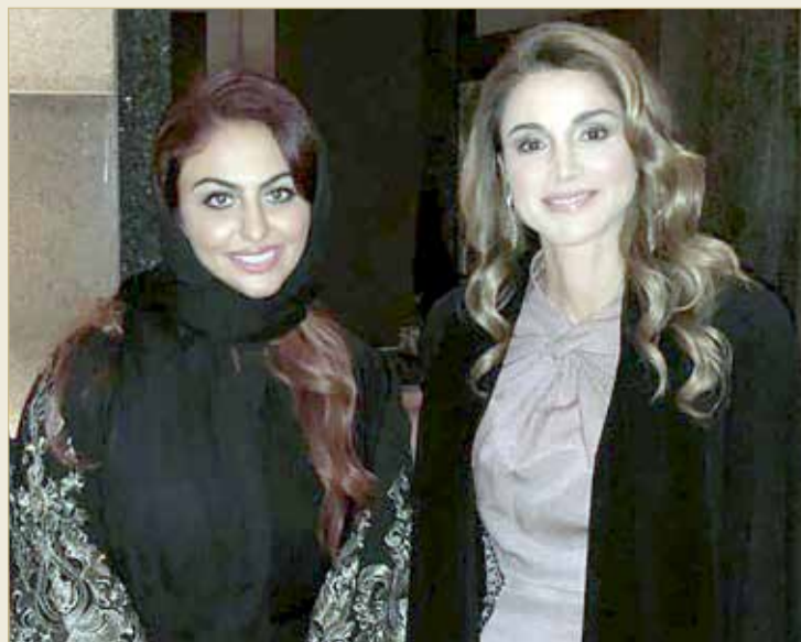
نبيلة أبو الجدايل مع الملكة رانيا

المرأة السعودية جاهزة لحفر اسمها في رؤية 2030