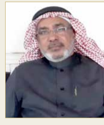
الفنان البحريني التشكيلي بديع بوبشيت

والفن التشكيلي. والفن التشكيلي ليس مجرد أن ترسم أي شيء تراه إنما الفن التشكيلي هو أن ترسم لوحة ذات معنى وانطباع جيد، فأنا أرى أن الشباب هنا يستعجلون الظهور من غير إدراك ووعي فالمفترض أن تكون لديهم الثقافة والمعرفة وأن يملأوا جميع مدارس الفن التشكيلي ويتعلموا من الفنانين.