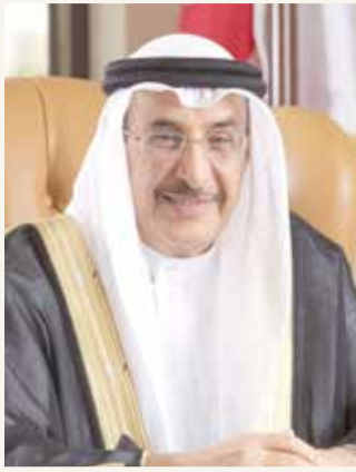
الشيخ خالد بن عبد الله آل خليفة

♦ خالد بن عبد الله يشيد بمحتوى "البحرين وطن السلام"