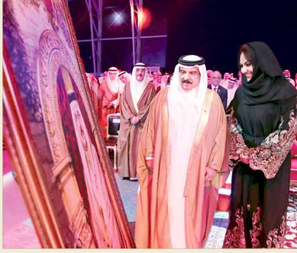
صورة حريرية لجلالة الملك