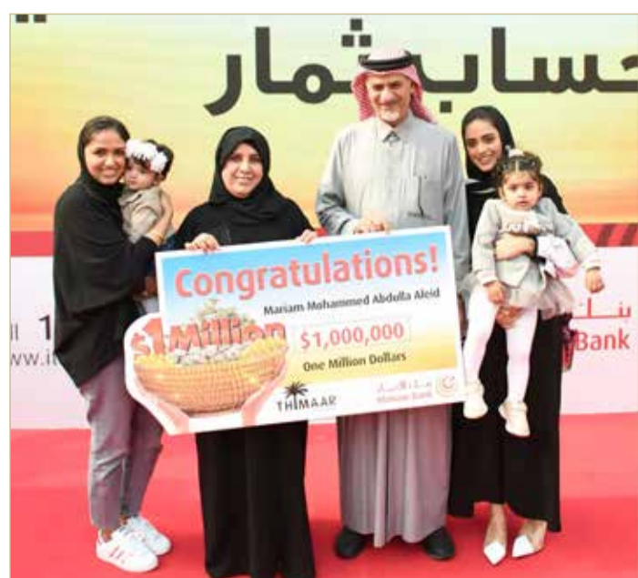
أثناء تسليم الجائزة

الجائزة الكبرى تحصدتها أم بحرينية لـ 5 أبناء