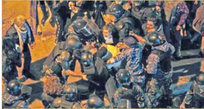
عناصر من مكافحة الشغب يوقفون متظاهرا أمام مقر قيادة شرطة بيروت