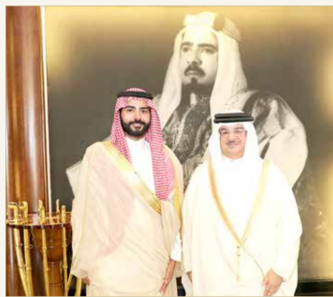
سمو الشيخ علي بن عيسى آل خليفة يستقبل السفير السعودي الجديد

♦ وزير الديوان الملكي يستقبل السفير السعودي الجديد