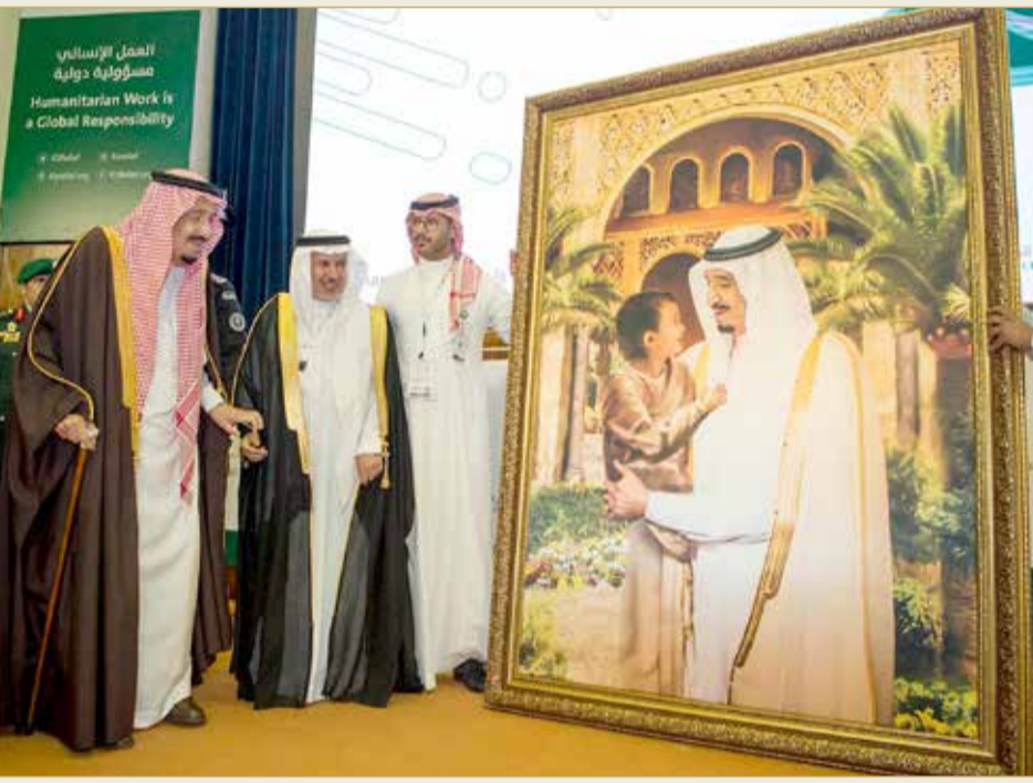
خادم الحرمين الشريفين يطلع على إحدى رسومات أبو الجدايل

رسمت 400 لوحة تشكيلية حريرية عدد منها بقصر خادم الحرمين