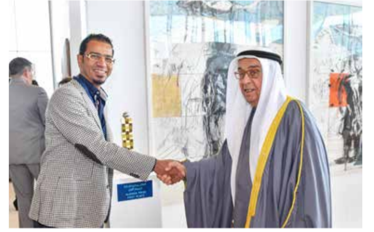
صورة الفائز بالمركز الأول

أنايب رئيس مجلس الوزراء صاحب السمو الملكي الأمير خليفة بن سلمان آل خليفة، نائب رئيس مجلس الوزراء الشيخ محمد بن مبارك آل خليفة صباح أمس الأول لافتتاح معرض البحرين السنوي للفنون التشكيلية في دورته الـ 46، والذي تنظمه هيئة البحرين للثقافة والآثار في كل من متحف البحرين الوطني ومسرح البحرين الوطني بمشاركة فنانين بحرينيين ومقيمين في المملكة قدموا في المعرض المتنوع عددا من الأعمال الفنية في مختلف الاتجاهات الفنية مثل الرسم الجرافيكي والنحت، والتصوير الفوتوغرافي والرسم مختلف الخامات والمواد والأشكال وأعمال الفيديو والتكريب.