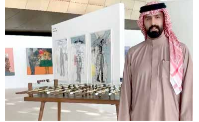
الفنان راشد العريفي