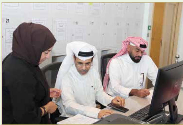
فتح مظاريف مناقصات جلسة أمس

كذلك فتح المجلس، مزايدة لشركة طيران الخليج لبيع وإعادة تأجير 3 طائرات من طراز بوينج (-787) (9 تصل إلى الشركة بين أبريل 2020 وديسمبر 2020) تقدم إليها 7 عطاءات فنية، ومناقصة لشركة مطار البحرين لإبرام عقد لتعيين