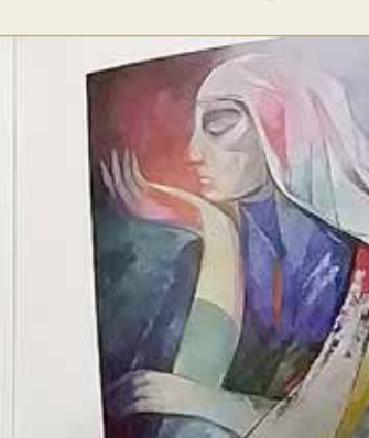
من لوحات بديع بوبشيت

« ما مدى تجاوب المجتمع البحريني مع الفن التشكيلي، وهل يحصل الفنان البحريني على الدعم الكافي؟ »