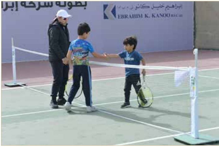
من مباريات البراعم

حيث يتنافس 91 لاعبا ولاعبة على المراكز الأولى في الفردي مختلط أولاد وبنات، ويقام المهرجان اليوم وغدا في الفترة الصباحية، ويختتم بالمباريات النهائية يومي الجمعة والسبت 24 و 25 يناير الجاري.