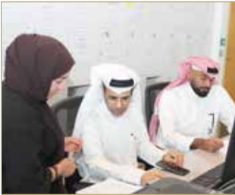
فتح مطاريف مناقصات جلسة أمس (09)

طرحت شركة "تطوير" للبتترول في جلسة مجلس المناقصات والمزايدات أمس مناقصة لتوفير مرافق ضغط الغاز غير المرتبطة تقدم إليها 5 عطاءات أقلها بقيمة 34.8 مليون دولار (ما يعادل 13.1 مليون دينار). (09)