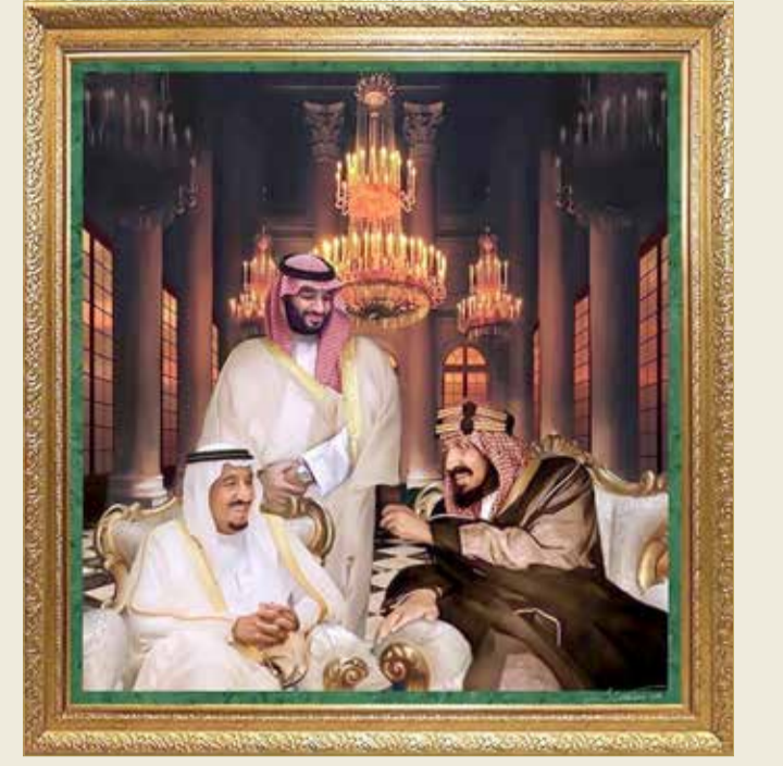
لوحة تحت عنوان "تحالف المجد"