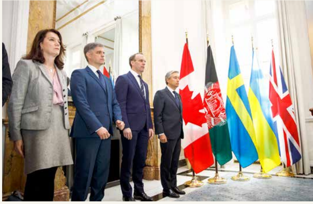
وزراء خارجية السويد وأوكرانيا وبريطانيا وكندا يقفون دقيقة حداد قبيل اجتماع تنسيقي في لندن أمس (أ ف ب)

◆ إيرانيون بدفن ضحايا الأوكرانية: عدونا هنا... ليس أميركا