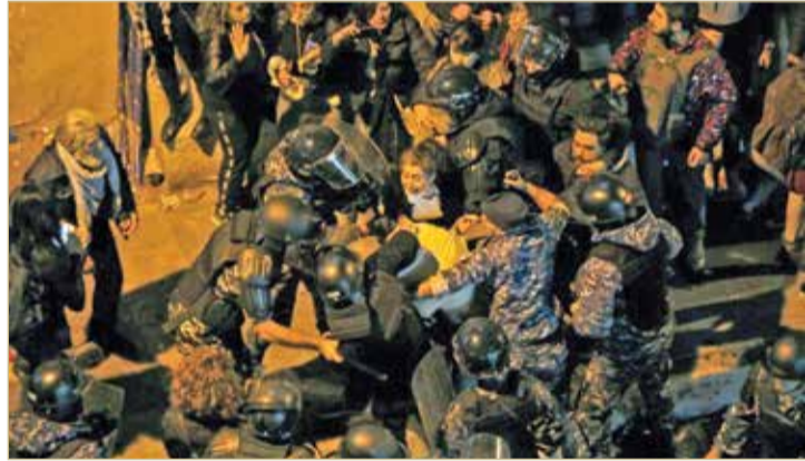
عناصر من مكافحة الشغب يقفون منظرهم أمام مقر قيادة شرطة بيروت أمس الأول

◆ اندلاع اشتباكات الليلة الثانية في احتجاجات بيروت