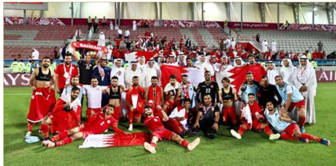
الاحتفال بلقب خليجي 24 تحول إلى نعمة لعائلة الطفل المتوفى

الشمالية التي تتوافر فيها مساحات شاسعة، حتى لا يكون استخدام الدراجات الهوائية مبني على الخوف والقلق والحذر المستمر.