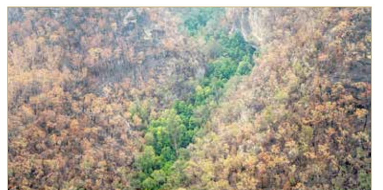
لقطة من الجو لمحمية وولمي الوطنية في مقاطعة نيو ساوث ويلز بأستراليا الأربعاء

لكن المسؤولين حذروا من أن العواصف الرعدية القصيرة والشديدة قد تؤدي إلى سيول، في الوقت الذي يهدد فيه البرق بإشعال حرائق جديدة. وقال الخبير في مكتب الأرصاد الجوية لراديو هيئة الإذاعة الأسترالية جيك فيليبس "نتوقع طقسا غير مستقر في الأيام الأربعة أو الخمسة القادمة أو نحو ذلك". ومضى يقول "تساقط الأمطار قد يكون مفيدا في بعض المناطق وفي مناطق أخرى قد يكون مليمتر أو مليمترين فقط.