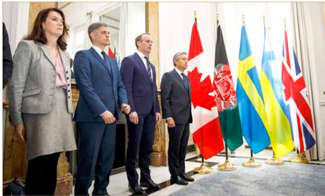
وزراء خارجية السويد وأوكرانيا وبريطانيا وكندا يقفون دقيقة حداد قبيل اجتماع تنسيقي في لندن أمس

إيرانيون بدفن ضحايا الأوكرانية: عدونا هنا... ليس أميركا