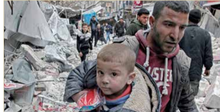
إجلاء طفل سوري بعد غارة للنظام السوري في محافظة إدلب أمس الأول

◆ الأمم المتحدة: 350 ألف سوري نزحوا من المحافظة منذ أول ديسمبر