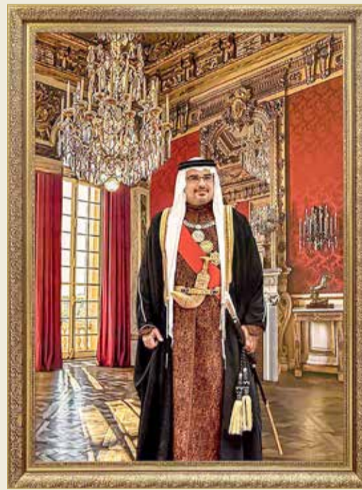
صورة حريرية لولي العهد