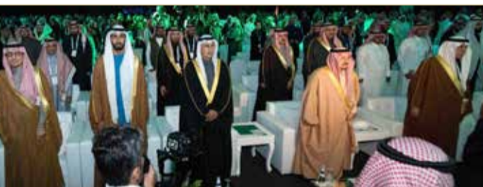
الوزير الزباني لدى مشاركته في الملتقى

إلى التمويل، ونشر ثقافة زيادة الأعمال، إضافة إلى تقديم أكثر من 300 برنامج تدريبي وورش عمل يقدمها 150 مدرباً ومدربة؛ لدعم وتمكين الراغبين في البدء بعالم الأعمال، عن طريق مساعدة الشباب وتحويل أفكارهم إلى مشاريع، ومساعدتهم لمعرفة أدوات بناء مشروع تجاري ناجح، ورفع أداء أصحاب المنشآت الصغيرة والمتوسطة ورواد الأعمال.