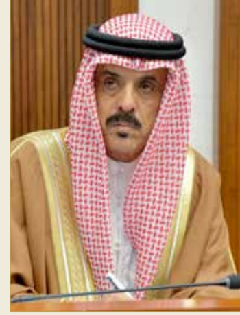
وزير التربية والتعليم