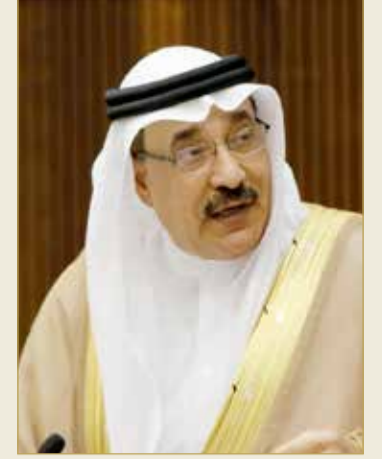
وزير العمل والتنمية الاجتماعية