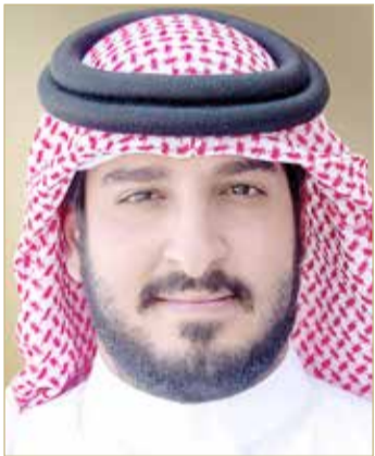
سمو الشيخ عيسى بن عبدالله

سم سرعة المسلك 350 متر/دقيقة، المسابقة الثالثة فئة المبتدئين من العموم المستوى الأول، وهي (مسابقة على مرحلتين) وارتفاع حواجزها 110 سم وسرعة المسلك 350 متر/دقيقة، المسابقة الرابعة للمتقدمين (مسابقة السرعة ضد الزمن) ونوعها مسابقة سرعة مباشرة ضد الزمن وارتفاع حواجزها 120 سم، سرعة المسلك 350 متر/دقيقة، والمسابقة الخامسة فئة المتقدمين المستوى الثالث مسابقة جمع النقاط التراكمية مع حاجز الجوكر وارتفاع حواجزها 130 سم وسرعة المسلك 350 متر/دقيقة والمسابقة السادسة، وهي أهم وأقوى المسابقات المسابقة الكبرى جولتين غير متماثلتين، مجموع أخطاء الجولتين وزمن الجولة الثانية وارتفاع حواجزها 140 سم، سرعة المسلك 350 متر/دقيقة.