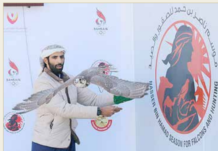
جانب من منافسات بطولة خالد بن حمد للصدور

الشباب مستشار الأمن الوطني رئيس المجلس الأعلى للشباب والرياضة. وكانت البطولة قد بدأت فعلياً بإقامة فعاليات التسجيل والتشبيه خلال أيام الأسبوع الماضي لتسجيل المشاركين في الأشواط المختلفة للمسابقة. وتقام في الفترة الصباحية منافسات الشواهيين، ثم منافسات الحران، فيما تقام في الفترة المسائية شوطي جيرات الشواهيين، ثم جيرات الخلط، إذ إن جميع الأشواط مخصصة للعموم فئة الفروخ.