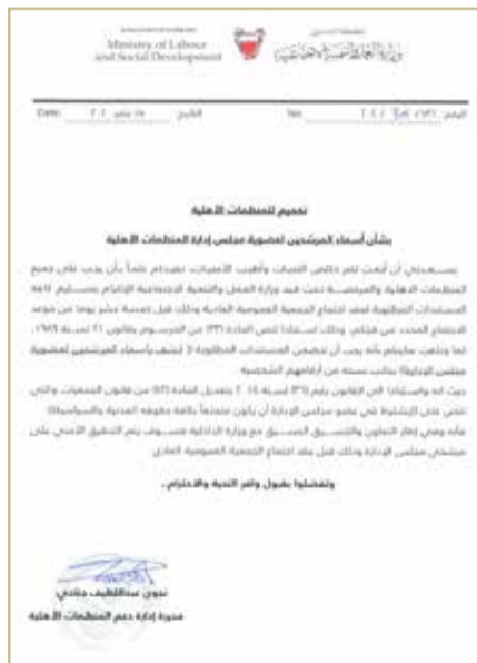
صورة ضوئية من تعميم الوزارة للجمعيات الأهلية

وقالت الوزارة: في إطار التعاون والتنسيق المسبق مع وزارة الداخلية فسيتم التدقيق