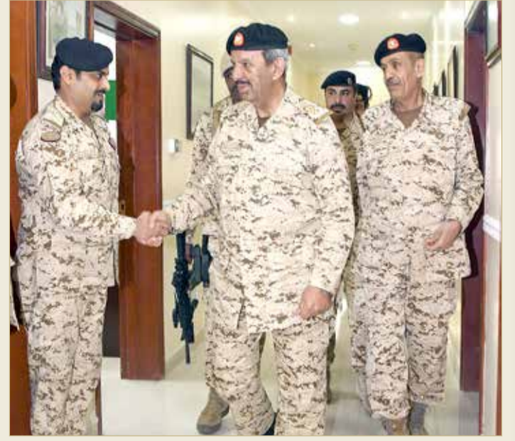
القائد العام يتفقد إحدى وحدات قوة الدفاع

وأكد القائد العام أنه يعون من الله تعالى، ومن ثم بالتوجهات السديدة من لدن عاهل البلاد صاحب الجلالة الملك حمد بن عيسى آل خليفة، قوة