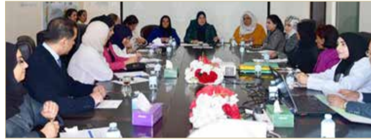
وزارة الصحة تعقد اجتماع فريق عمل الجائحات (الوبائيات) الصحية

وتم إطلاع المسؤولين كافة على أهم المستجدات الإقليمية والعالمية المتعلقة بالوضع الراهن حول انتشار فيروس كورونا الجديد، ووضع خطة إستراتيجية مشتركة ومتكاملة؛ لتعزيز الإجراءات الاحترازية والوقائية اللازمة على توفير مستلزمات الفحص والعلاج بجميع المراكز الصحية