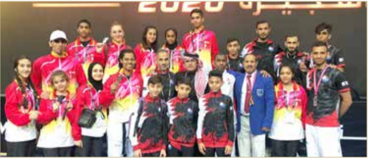
لقطات من التتويج

◆ 5 ميداليات ملونة منها ذهبية وفضية و3 برونزيات