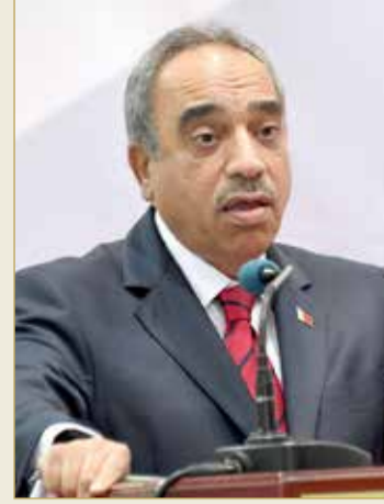
وزير الأشغال وشؤون البلديات