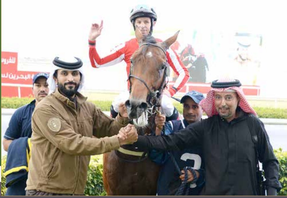
سمو الشيخ ناصر بن حمد مع المصغر فوزي ناس