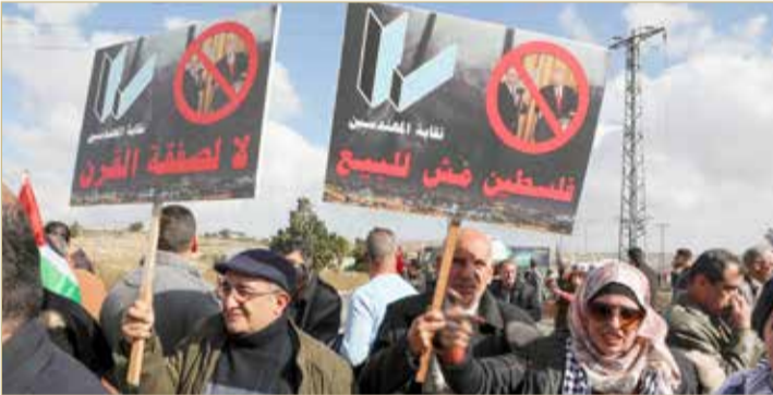
تظاهرة فلسطينية ضد خطة السلام الأميركية عند المدخل الشمالي لمدينة رام الله بالضفة الغربية (أ ف ب)

في ظل اعتزام الحكومة الإسرائيلية ضم مستوطنات في الضفة الغربية والأغوار وشمال البحر الميت، وحذروا من إجراءات كهذه من طرف واحد، من شأنها أن تعكس سلبيًا على العلاقات مع الأردن. وفي سياق آخر، أفاد "نادي الأسير" الفلسطيني بأن قوات الاحتلال الإسرائيلي، خلال الـ24 ساعة الماضية، اعتقلت 33 شخصاً.