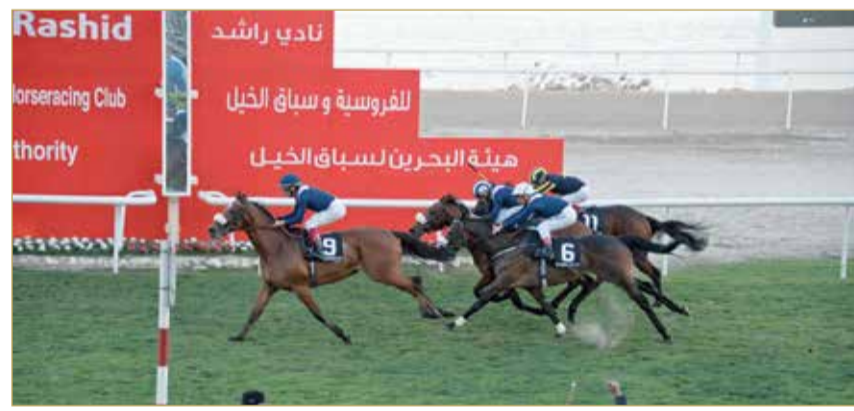
منافسات قوية يشهدها سباق ولي العهد اليوم

ويقيم الشوط الرابع على أوكس البحرين "برعاية مزرعة المزدهر" والمخصص للأفرس من النجاج المحلي مسافة 1800 متر والجائزة 4500 دينار، ويتوقع أن يشهد منافسة ثنائية بين الفرس "صابرينا" لأسطبل فيكتوربوس