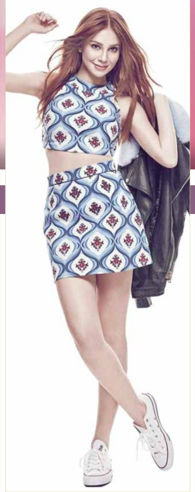
« رفضت النجمة الأشين سانغو خوض بطولة مسلسل "حياة جديدة"؛ لأسباب لم يكشف عنها، رغم أنه لم يعرض أي جديد لها في هذه الفترة، واعتبرت وسائل إعلام تركية، أن سانغو تبحث عن نص يعيدها بقوة إلى الجمهور، بعد فشلها في مسلسلها السابق "اصطدام". يذكر أن سانغو عُرفت في العالم العربي بدور "ديما" في مسلسل "حب للإيجار"، وبعده خاضت بطولة فيلم "وقت السعادة". »