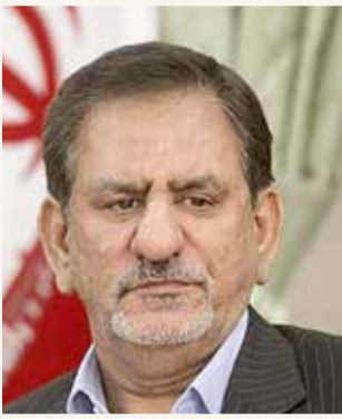
نائب الرئيس الإيراني إسحاق جهانغيري

يأتي هذا الكلام بعد أن أشار تقرير لمنظمة الشفافية الدولية للعام 2019 إلى أن إيران من أكثر الدول فساداً، بحيث تحتل المرتبة 146 من بين 180 دولة. 40% تحت خط الفقر كما يأتي حديث نائب الرئيس الإيراني عن تفشي الفساد والفقر، في حين كشفت النائبة في البرلمان الإيراني، هاجر تشناراني، في مقابلة لها الإثنين، مع موقع "إصلاحات نيوز" أن "40% من الشعب الإيراني يزرعون تحت خط الفقر بسبب سوء الإدارة وعدم كفاءة بعض المسؤولين في إيران الغنية، كما أن العملة الإيرانية هي الأضعف في العالم". ورأت تشناراني، وهي عضو لجنة الأمن القومي والسياسة الخارجية بالبرلمان الإيراني أن "لا الهجوم الخارجي ولا الأقمار الاصطناعية يمكن أن تزعزع إرادة الشعب الإيراني، لكن سوء الإدارة وإجحاف