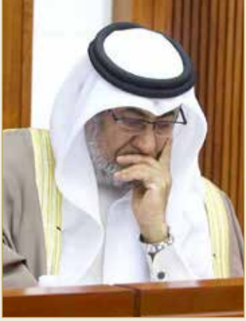
وزير شؤون مجلسي الشورى والنواب