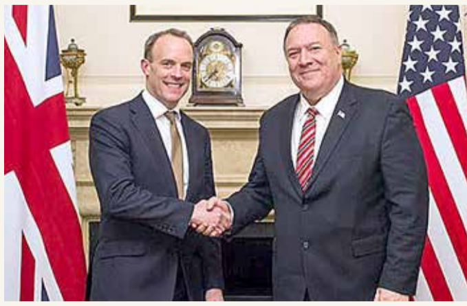
بومبيو ورأب في لندن