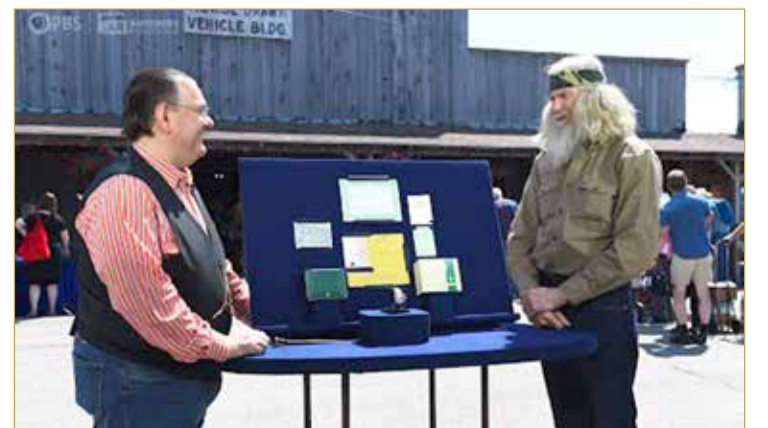
جاء ذلك خلال حلقة من سلسلة "أنتيك رود شو" التي تعرضها شبكة "فيرمونت بي بي إس" التي تتناول فعاليات المعرض المتنقل الذي يجوب الولايات المتحدة بحثًا عن الكوز والمتعلقات الثمينة.

تساوي الآن نحو 400 ألف دولار إذا بيعت في المزاد العلني، لينتطح الرجل أرضًا فور سماع القيمة. لكن ما زاد من مفاجأته هو تعليق المثمن في المعرض المتنقل الذي قال: "يفضل الحالة الجيدة للساعة (كما لو أنها جديدة) فإنها قد تباع مقابل ما بين 500 ألف إلى 700 ألف دولار".