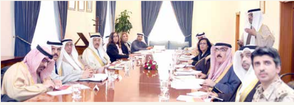
سمو الشيخ محمد بن مبارك يترأس اجتماعاً لإيجاد الحلول للطلبة البحرينيين الحاصلين على شهادات جامعية من الصين

محمد بن مبارك: فريق عمل لبحث الخيارات ورفعها بالاجتماع المقبل