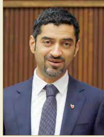
وزير شؤون الكهرباء والماء