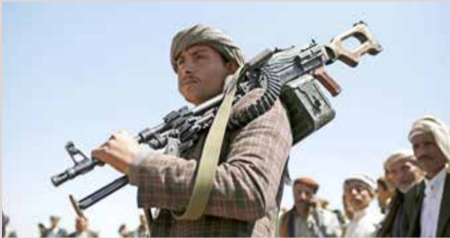
عناصر من ميليشيا الحوثي في صنعاء

« اعترفت ميليشيا الحوثي الانقلابية بتلاعب مسؤولين تابعين لها بالمساعدات الإنسانية ونهبها، وذلك بعد تهديد المنظمات الدولية العاملة في اليمن بخفض مساعداتها في مناطق سيطرة الميليشيا. وأقر شفيق زعيم الميليشيا، وزير التربية في حكومة الانقلاب الحوثية يحيى الحوثي، بوجود حالة من التجاذب والتوتر بين ما يسمى مجلس تنسيق المساعدات وبين المنظمات الإنسانية. وذكر الحوثي، في بيان نشره موقع وزارة التربية الخاضعة لسيطرة الميليشيا في صنعاء، أن عبدالمحسن