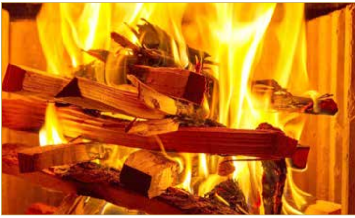
مايو 2019، أولا: أشعلا وآخرون مجهولون عمدا حريقا في الأوراق من شأنه تعريض حياة الناس وأموالهم للخطر.

الفلسطينية، فاتجهوا حيث المكان المتفق عليه ملثمين وحاملين معهم الأخشاب والبتروك وكروسي الشارع عند مدخل منطقة أبو صبيح بالأخشاب وسكبوا عليها البترول وأشعلوا النيران فيها، حتى يمنعوا القوات الأمنية من الوصول إليهم. وذكرت المحكمة أنه كان قصدهم