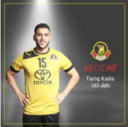
الإعلان الترحيبي للاعب بحساب النادي الرسمي

تؤدي إلى هبوطه مجدداً لدوري الدرجة الثانية.