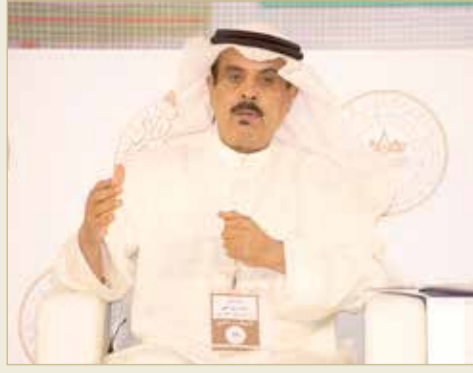
وزير التربية والتعليم