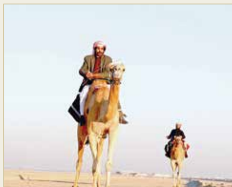
جانب من منافسات المجموعة الثالثة لفارس الموروث

فيها المتسابقون لملء القرية بالمياه وحملها لخط النهاية لقياس معدل الماء بعد انتهاء مرحلة الهجن التي شهدت بعض الانسحابات لصعوبة هذه المرحلة. وبعد أداء صلاة الجمعة، بدأت مسابقة