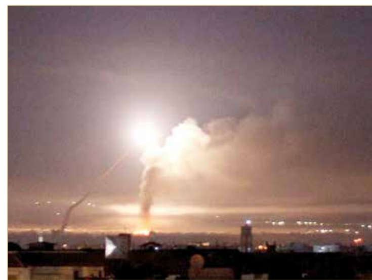
الدفاعات السورية تتصدى لاهداف معادية فوق دمشق

◆ جيش النظام يواصل تقدمه.. والفصائل تسقط مروحية ثانية