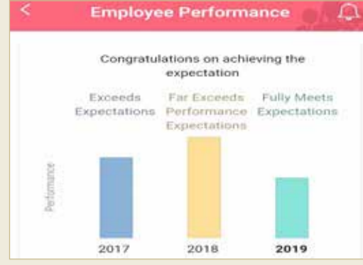
مقارنة للتقييم السنوي لثلاثة أعوام