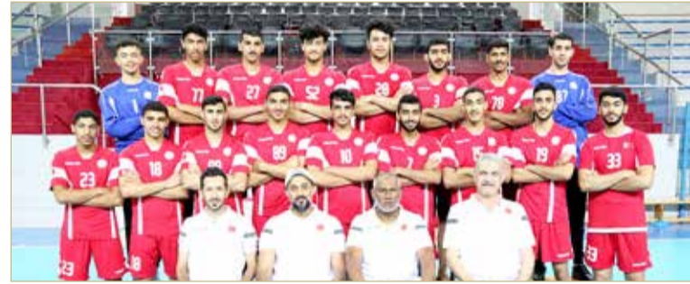
منتخبنا الوطني لكرة اليد

يغادر منتخبنا الوطني للناشئين لكرة اليد فجر غد الأحد إلى اليونان؛ للمشاركة في البطولة الدولية الودية، التي تنطلق في الفترة من 17 - 22، ضمن البرنامج الإعدادي للمنتخب في إطار التحضير للتصفيات الآسيوية المؤهلة لنهائيات كأس العالم 2022.