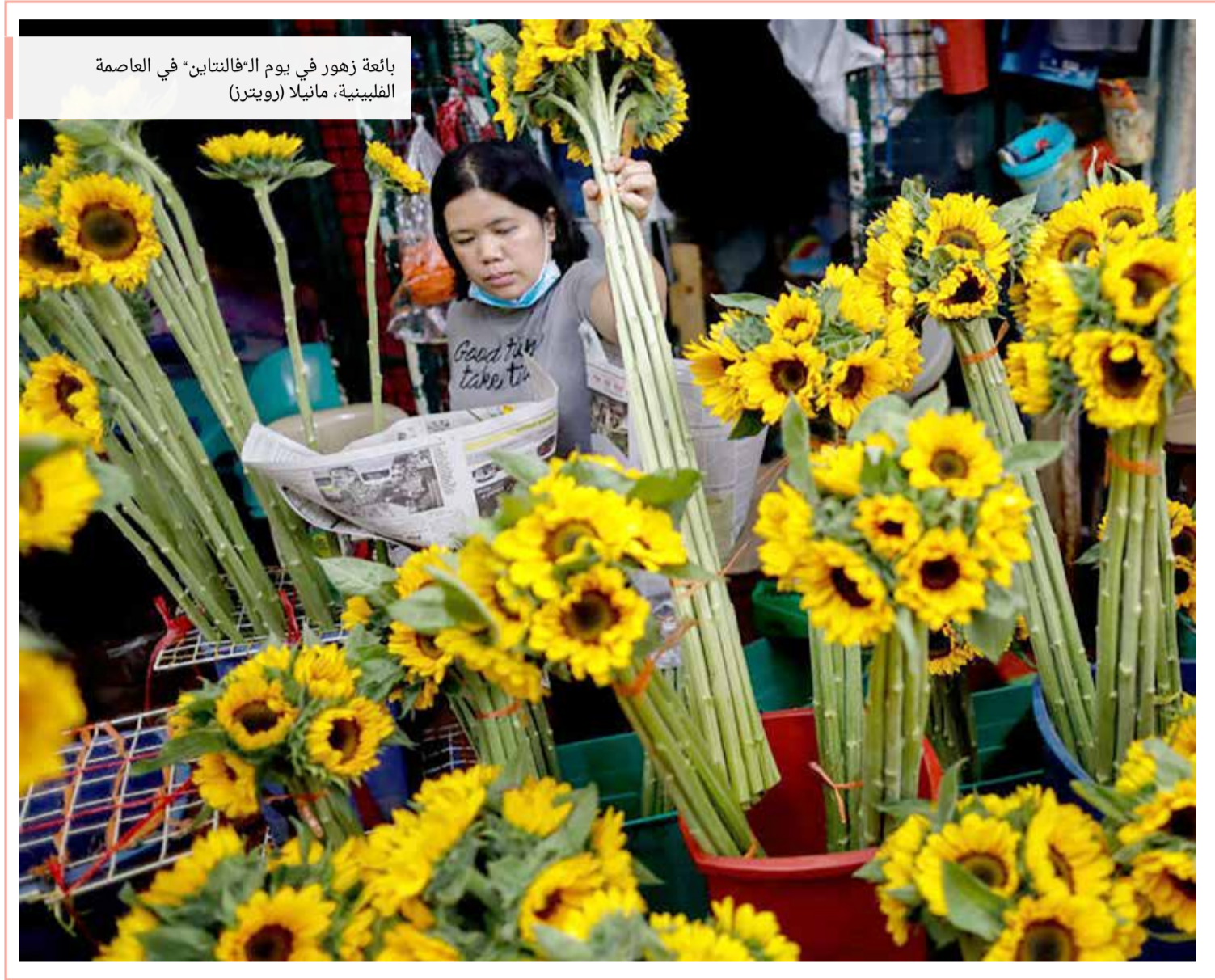
بانعة زهور في يوم 'الفلانتاين' في العاصمة الفلبينية، ماينلا