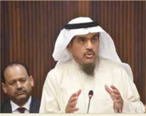
رئيس ديوان الخدمة المدنية