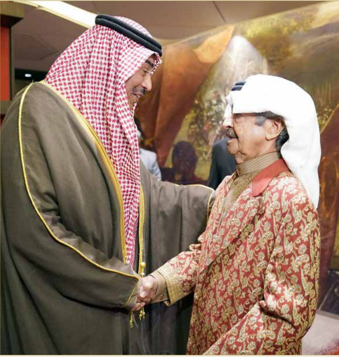
سمو رئيس الوزراء مستقبلاً رئيس وزراء دولة الكويت

لقاء سمو رئيس الوزراء بسمو الشيخ صباح الخالد الحمد الصباح يحظى باهتمام كبير من الصحافة الكويتية