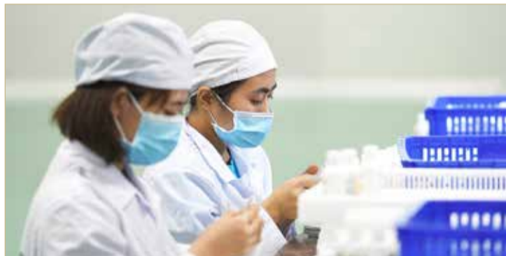
مصنع للمطهرات اليدوية في هانوي وسط مخاوف من تفشي كورونا

«خيبة أمل» أميركية لعدم تعامل الصين بشفافية مع الوباء المستجد