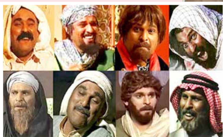
وتميز بالحذر الشديد في اختيار أدواره