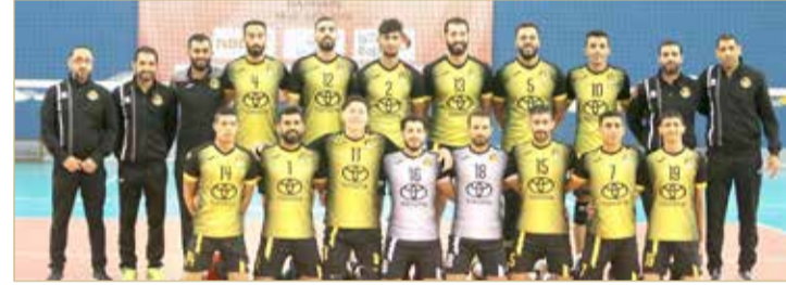
فريق الأهلي للكرة الطائرة

حصة تدريبية أخرى من الساعة 4 لغاية 6 مساء بنفس اليوم، فيما سيخوض الفريق أولى مبارياته الودية مع الزمالك المصري السبت 15 فبراير عصرًا على أن يخوض حصة تدريبية صباحية بذات اليوم. وأضاف الحلواجي أن الفريق سيخوض ثاني مبارياته يوم الأحد 16 فبراير مع طلائع الجيش المصري على أن يدخل البطولة رسميًا يوم الإثنين 17 فبراير.