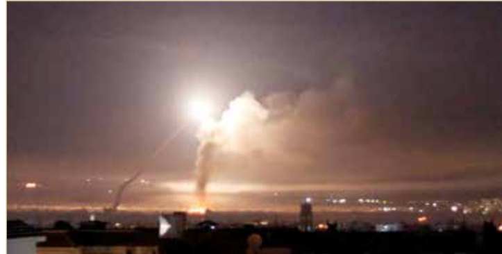
الدفاعات السورية تنصت لأهداف معادية فوق دمشق

جيش النظام يواصل تقدمه.. والفصائل تسقط مروحية ثانية