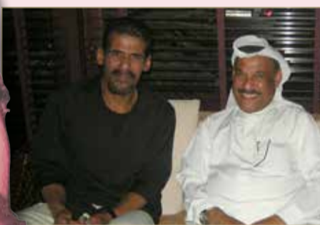
مع شقيقة الفنان علي بحر