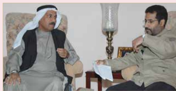
حياته مليئة بالقرارات والبحوث