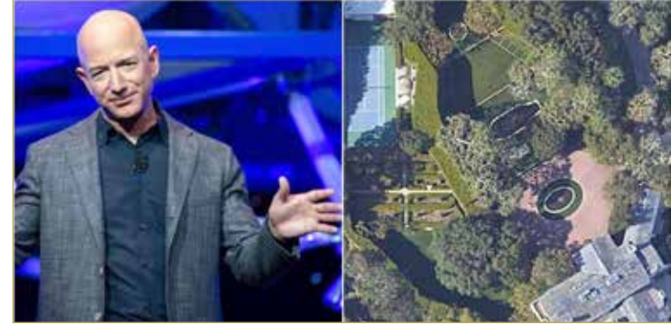
يشترى إلى أن بيزوس هو أغنى رجل بالعالم، وتقدّر ثروته بأكثر من 130 مليار دولار

حظّم مؤسس شركة أمازون، جيف بيزوس، رقماً قياسياً جديداً، واشترى أعلى قصر في لوس أنجلوس، مقابل مبلغ ضخم. وقالت صحيفة "وول ستريت جورنال" إن بيزوس دفع مبلغ 165 مليون دولار، لشراء منزل جديد في لوس أنجلوس، ليصبح أعلى منزل يتم شراؤه في المدينة المكتظة بالأثرياء والنجوم. وحظّم بيزوس الرقم القياسي لأعلى قصر في لوس أنجلوس، والذي كان باسم