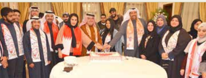
سفارة مملكة البحرين لدى دولة الكويت تحتفل بذكرى الميثاق

المالكي: البحرين نموذج فريد في الإصلاح والانتقال الديمقراطي