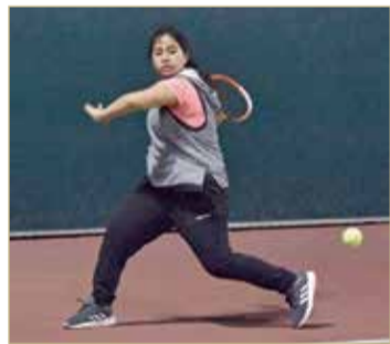
إحدى اللاعبات المتنافسات