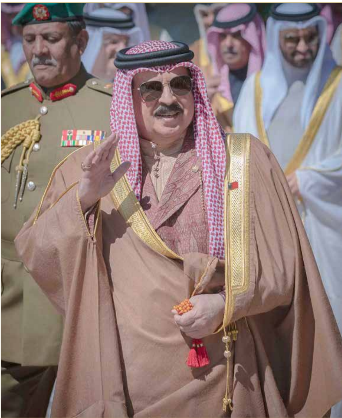
جلالة الملك يستقبل، وبحضور سمو ولي العهد، كبار أفراد العائلة المالكة الكريمة

السنة 12 العدد 4141 السبت Sat 15 فبراير 2020 21 جمادى الآخرة 1441 (2) JMD رقم التسجيل 1985-8566 ISSN