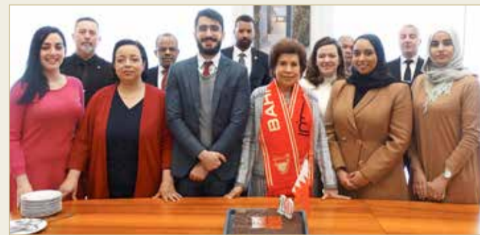
سفارة البحرين في بروكسل تحتفل بذكرى "الميثاق"

الجشي: البحرين مثال في رسم مسيرة العمل المؤسسي الجاد