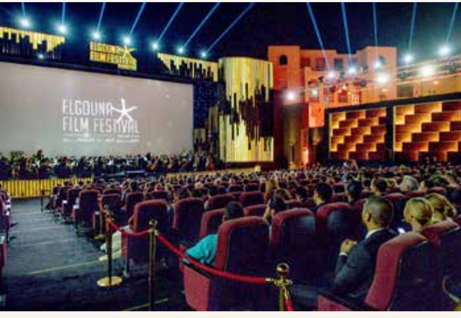
تظاهرة سينمائية مهمة

دعوة للمخرجين البحرينيين الاستعداد وتقديم الأفلام والمنافسة