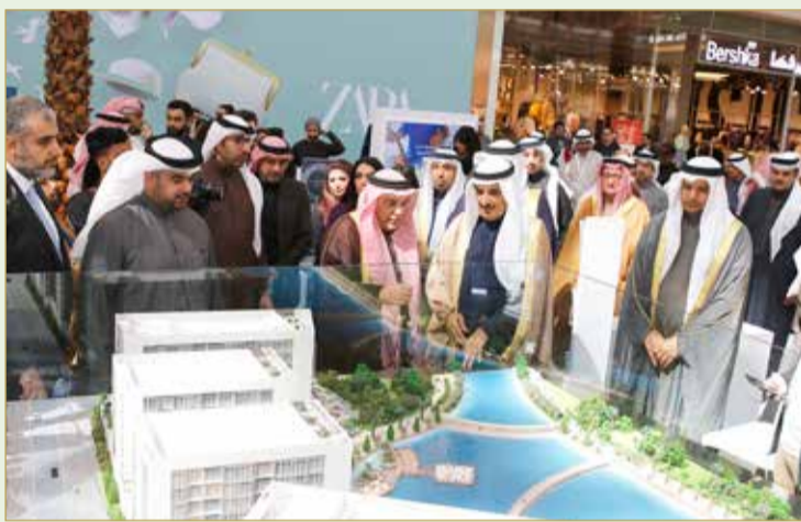
”نسيج“ تعرض مشروع كنال فيو في معرض البحرين للاستثمار العقاري