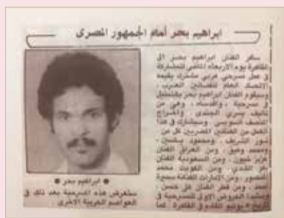
مشاركته في المسرحية العربية الشهيرة وأقداسه