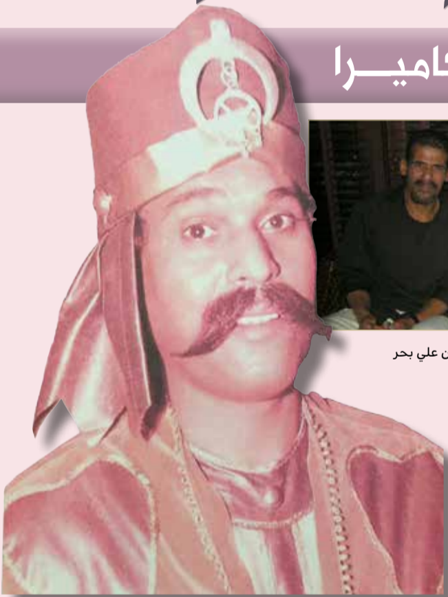
يعيش الشخصية بعمق ووعي

ذات مرة، دخلت عليه في غرفة الاستراحة أيام تصوير مسلسل "الفجر المستحيل" العام 2007، وكان العمل من تأليف معصومة المطاوعة وإخراج ياسر ناصر، فوجدته يضع خطوطاً وتشكيلات وألواناً وانطباعات على النص الذي كان بيده، وأدركت حينها أنه كان يغوص في أعماق الشخصية، ويريد أن يعيش دقائق حياته في المسلسل بعمق ووعي نادرين، فما دلالة كل هذا الغناء الفني الخصب؟ أولاً: تميز إبراهيم بحر بالالتزام الفني والرؤى الفلسفية المتنوعة، ما جعلته يقدم أنماط الأدوار كافة، في المسرح وفي الدراما التلفزيونية، ومرد ذلك يعود إلى العصر الذي نشأ فيه، الذي كان مشحوناً بمئات الأفكار والتفسيرات التي أنجبتها الواقع الحضاري، فبحر انطلق من فكرة أساسية مفادها إمكانية الفن أن يغير من