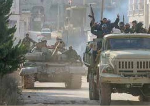
قوات النظام السوري في شمال شرق سوريا

◆ روسيا ترسل سفينتين حربيتين إلى البحر المتوسط