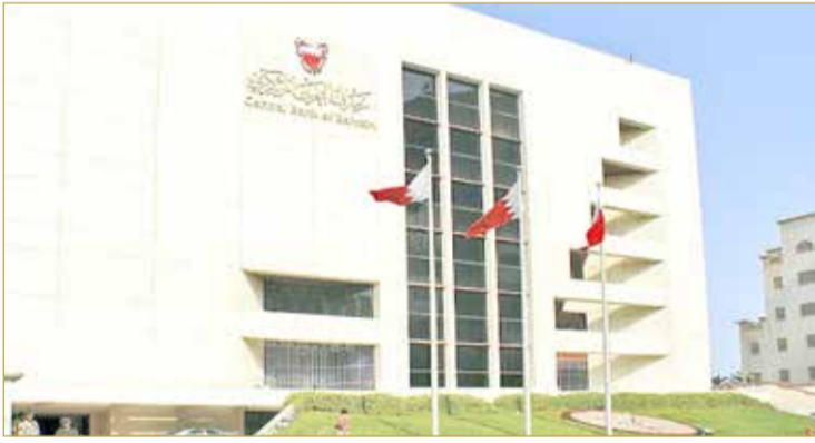
توحيد سقف الأسعار والغاء رسوم لصالح زبائن البنوك

حدد مصرف البحرين المركزي البنوك العاملة أمس الأول (الخميس) موعد تطبيق الجدول الجديد للرسوم الإدارية الموحدة التي تفرضها البنوك لمنح القروض، ليكون بدء سريانها في الأول من يونيو المقبل، في خطوة تصب في صالح زبائن البنوك والمقترضين. ويمثل الجدول سقفاً أعلى لا يسمح لبنوك بتجاوزه، وجاءت الرسوم المنصوص عليها في توجيهات مصرف البحرين المركزي بعد أن أجرى الأخير مشاورات مع بنوك بخصوص هذه الرسوم. وكانت بنوك محلية بدأت بالفعل في تعديل رسومها الإدارية المتعلقة ببعض الرسوم والتي كانت تختلف من بنك لآخر. (08)