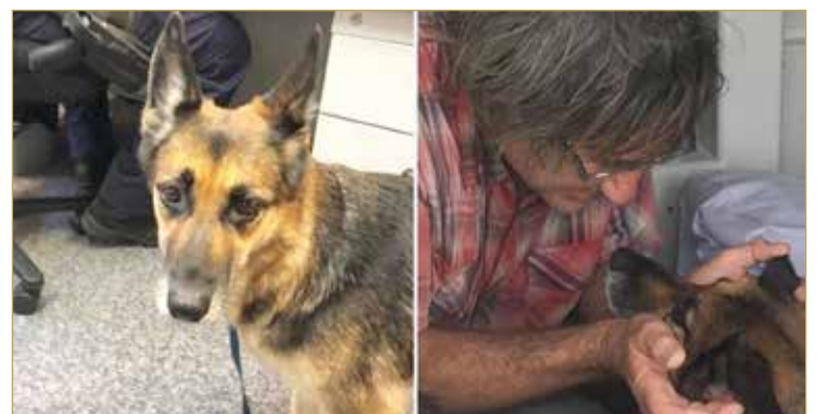
أكد صاحب الكلب البالغ من العمر 63 عامًا أنه قضى 15 ساعة في الماء، بينما قضى الكلب "هايدي" 11 ساعة في السباحة بحثًا عن المساعدة. وأشارت التقارير الإعلامية إلى أن الكلب وصاحبه في صحة جيدة.

سبح كلب ألماني لمدة 11 ساعة بحثًا عن المساعدة لإنقاذ صاحبه بعدما انجرف في خليج بمدينة بريبان الأسترالية. وتداولت وسائل إعلام أميركية تقارير تفيد بسباحة كلب ألماني لمدة 11 ساعة لإنقاذ صاحبه بعدما انقلب قاربه في سواحل مدينة بريسان الأسترالية. وتمكن أحد الصيادين على سواحل المدينة من إخراج الكلب من الماء