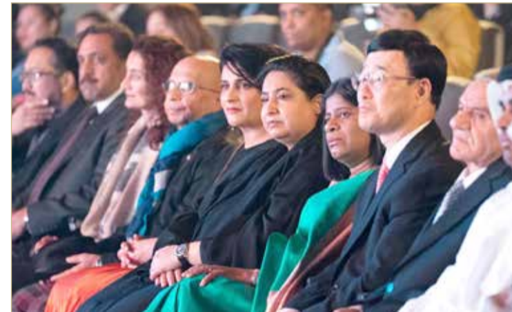
إحياء الأمسية الثقافية السريلانكية بمشاركة وكيل وزارة الخارجية

كما أعربت وكيل وزارة الخارجية عن ثققتها التامة وإيمانها الراسخ بتوسع وإزدهار علاقات الصداقة بين البلدين على كافة الأصعدة خلال السنوات القادمة بما يعود بالخير والمنفعة عليهما وعلى شعبيهما، مما سيكون له أطيّب الأثر في الدفع بالعلاقات الدبلوماسية إلى آفاق أرحب وأوسع.