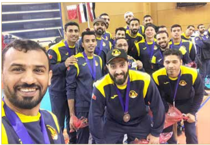
الأهلي متوجاً بالبرونزية العربية