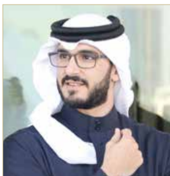
سمو الشيخ عيسى بن سلمان

وأوضح سمو الشيخ عيسى بن سلمان بن حمد آل خليفة أن سباق كأس السعودية العالمي للخيل يحظى باهتمام كبير من مختلف الدول، متوقفاً سموه أن يشهد السباق إثارة والتنافسية في مختلف أشواطه. وكانت المملكة العربية السعودية قد أعلنت عن تنظيم أعلى سباقات الخيل، إذ يصل إجمالي جوائز 29.2 مليون دولار، إذ يعتبر "كأس السعودية" العالمي لسباقات الخيل في دورته الأولى من بين أعلى المسابقات، ومن شأنه أن ينقل للعالم المشهد الحضاري الذي تعيشه المملكة العربية السعودية، ليس على المستوى الرياضي فحسب، بل على جميع الأصعدة، كما سيكسب صورة المجتمع النابض بالحياة، والاقتصاد المزدهر والتقدم في شتى المجالات التي تضمنتها رؤية