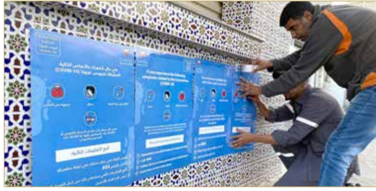
تعميم الملصقات التوعوية على جميع المساجد والمامت

والمساجد والحسينيات في العديد من مناطق مملكة البحرين، وبمشاركة أطباء من وزارة الصحة وعدد من الأطباء المتطوعين، والعمل جار على تنفيذ حملات جديدة في مجموعة جديدة من الجوامع والمساجد والحسينيات بمختلف محافظات المملكة، وعليه تم التواصل مع إدارة تعزيز الصحة بوزارة الصحة لاستمرار الحملات التوعوية وتعزيزها خصوصاً بعد توجيه مجلس الوزراء.