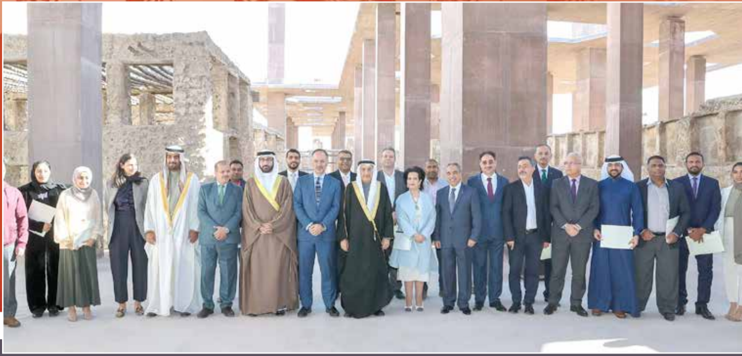
صورة تذكارية للمشاركين في مشروع إعادة إحياء المحرق بحضور المسؤولين من مملكة البحرين وجائزة الأغا خان للعمارة

Osama.almajed@albiladpress.com 07 البلاد