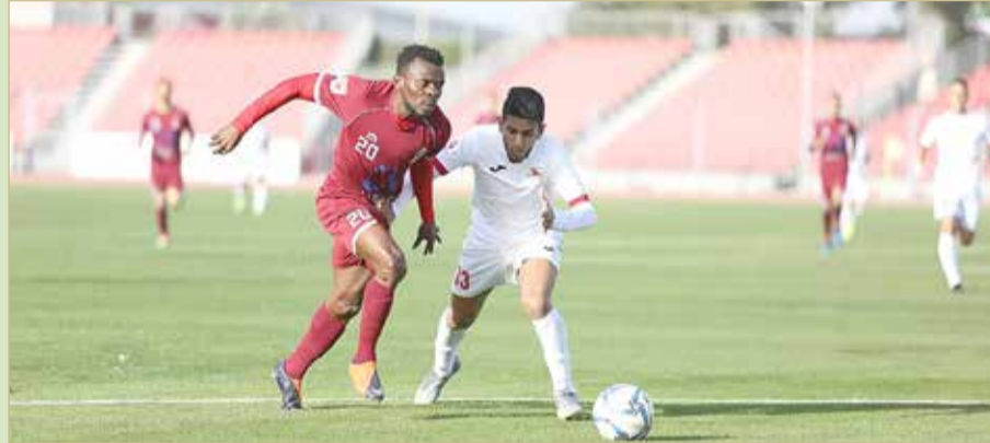
الشرقي تفوق بثلاثية على ماروني الشباب

والحكم الرابع عبدالله قاسم. وتختتم اليوم- السبت، منافسات الجولة التاسعة، وذلك بإقامة 3 مباريات. يلعب المحرق مع المنامة عند 5.10 مساءً على استاد الشيخ علي بن محمد آل خليفة، وعند 6.30 مساءً يلعب النجمة مع الرفاع على استاد مدينة خليفة الرياضية، وعند 7.30 مساءً يلعب الحالة مع الأهلي. في المباراة الأولى يدخل المحرق وفي رصيد 16 نقطة تحت قيادة