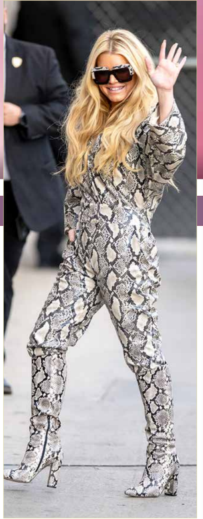
« أفادت تقارير إعلامية، بأن النجمة جيسكا سمبسون، تحاول الانضمام إلى فريق عمل مسلسل "The Real Housewives of Beverly Hills"، وهو ما جرى نفيه. وبدأت الشائعات بنشر خبر يؤكد أن سمبسون تعمل من أجل الانضمام إلى المسلسل المذكور، وبأنها ستكون الإضافة المثالية لهذا العمل.

ويأتي في المرتبة الثانية في قائمة "الإزعاج"، طلب البالغين لأطباق مخصصة للأطفال، وذلك لأن وجبات الصغار عادة ما تكون