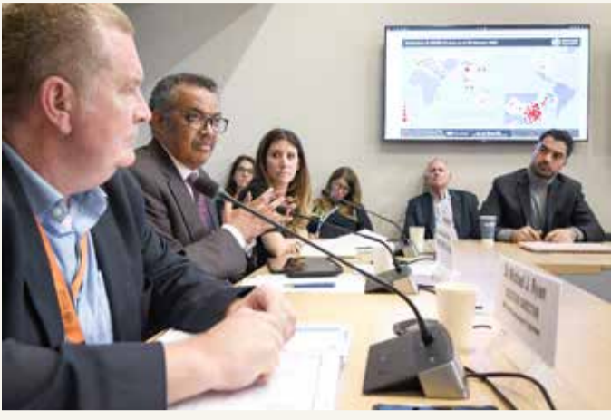
مؤتمر صحفي عن فيروس كورونا بمقر منظمة الصحة العالمية في جنيف

◆ أكثر من 80 ألف مصاب بالفيروس مع تأكيد وفاة نحو 2800 شخص