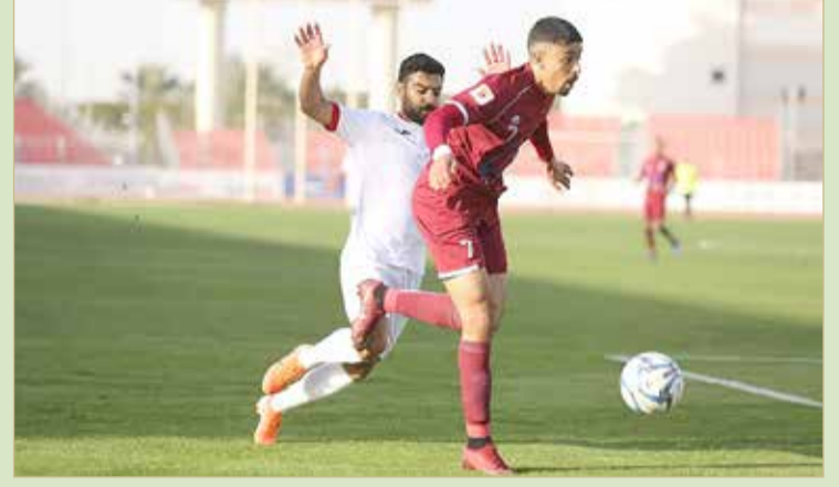
من لقاء الرفاع الشرقي والشباب

البلاد | أحمد مهدي