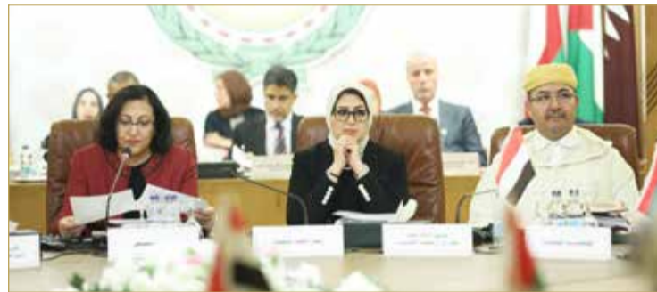
وزيرة الصحة تترأس أعمال الدورة العادية لمجلس وزراء الصحة العرب والاجتماع السنوي عن "كورونا"

وفي الكلمة الافتتاحية دعت الصالح إلى التكامل والتعاون العربي للتصدي للتحديات التي تواجه العالم فيما يخص انتشار الأمراض المعدية والفاشيات والأوبئة المحتملة وفيروسات كورونا، خصوصاً في هذه الفترة بعد ظهور حالات العدوى البشرية بفيروس كورونا المستجد في الصين. وأكدت أهمية