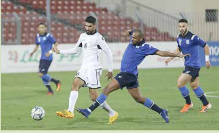
الحد حقق فوزاً جديداً