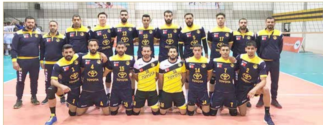
فريق الأهلي لكرة الطائرة

العربي لتتسع حضور البحرين الفوز باللقب. وعلى صعيد متصل، عبر الحلواجي عن ارتياحه من المستوى الذي قدمه الفريق في بطولة الأندية العربية لكنه في الوقت ذاته قال بأنه كان