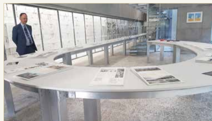
معرض جائزة الأغا خان للعمارة 2019 في البحرين

لم تكن جولتي في مشروع إحياء منطقة المحرق في البحرين - الذي تم اختياره مؤخراً من بين المشاريع الستة الفائزة بجائزة الأغا خان للعمارة في دورتها الأخيرة 2019 - كما توقعت، بل للأمانة تجاوز هذا المشروع إلى حد كبير أقصى توقعاتي. كيف لا، وقد وضع فريق رائع متنوع من المهندسين المعماريين والمخططين الحضريين والخبراء المختصين في مجالات مختلفة (من ترميم المواقع الأثرية والتراث إلى الزراعة) بصماته الرائعة ورؤيته المتميزة في كل زاوية من زوايا هذا المشروع المتكامل.