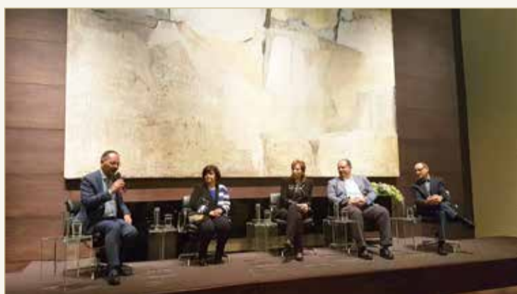
جانب من الندوة عن جائزة الأغا خان للعمارة