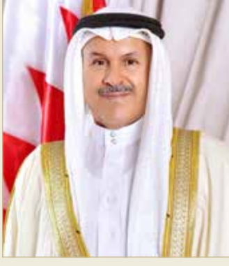
الشيخ هشام بن عبدالرحمن

وأكد المحافظ أن الثقة الملكية دافع لمضاعفة الجهود للارتقاء بمستوى الخدمات المقدمة لأهالي محافظة العاصمة، وتعزيز مفاهيم المواطنة، والشراكة المجتمعية، منوهاً إلى مواصلة العمل لخدمة الوطن والمواطنين والمقيمين على أرض المملكة، والسير ضمن نهج جلالة الملك في مواصلة