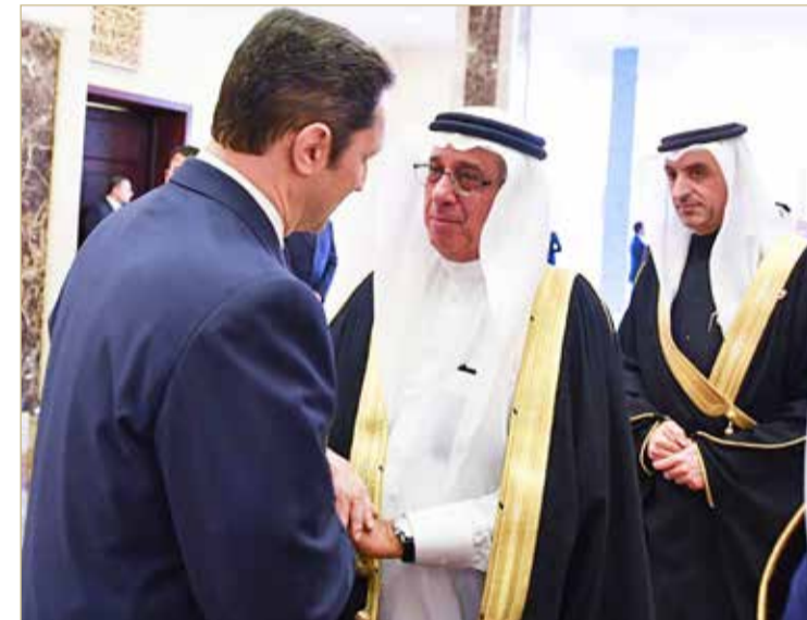
بتكليف من جلالة الملك... الحمر ينقل تعازي ومواساة جلالته إلى أسرة الرئيس المصري الأسبق حسني مبارك

وكان الحمر قد وصل إلى القاهرة أمس، بتكليف من صاحب الجلالة ملك البلاد لتقديم التعازي في وفاة الرئيس المصري الأسبق محمد حسني مبارك (رحمه الله).