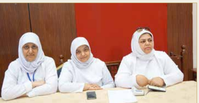
مدينة عيسى - وزارة التربية والتعليم

حول فيروس كورونا ومصادره وطرق العدوى وأعراض الإصابة به وكيفية العلاج منه، إلى جانب أهم التعليمات والإرشادات التي يجب اتباعها للوقاية منه، وللمسافرين إلى البلدان التي ظهر فيها مرض فيروس كورونا، والقادمين إلى مملكة البحرين خلال الأيام الماضية.