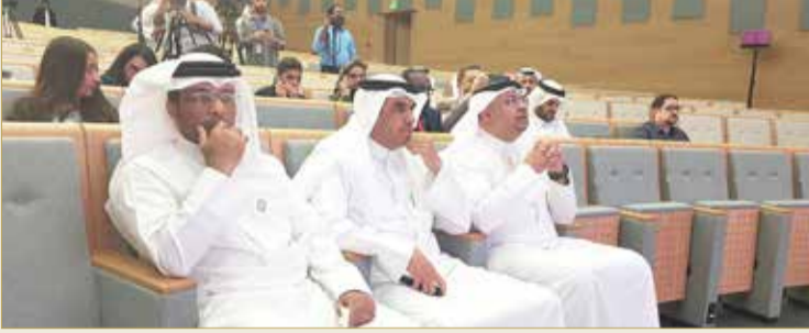
وزير الإعلام وعدد من المسؤولين وممثلو وسائل الإعلام يتابعون المستجدات

دعوة جميع من عاد من إيران أخيراً إلى المبادرة للتسجيل وإجراء الفحص الطبي