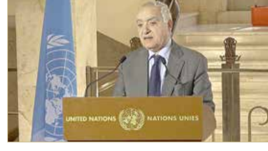
المبعوث الأممي إلى ليبيا غسان سلامة

◆ مقتل 15 عسكريا تركيا بقصف للجيش على معيتيقة