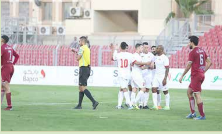
فرحة شرقاوية تكررت 3 مرات

الرفاع الشرقي يتخطى الشباب بثلاثية في افتتاح الجولة 14