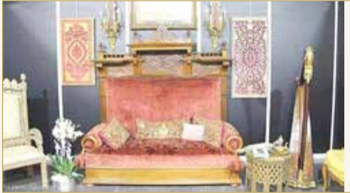
"عرش" بيع في مزاد ويعتقد بأنه يعود لقصر بلدر التركي

خلال واحد منها، وكانت والدتي تعيش في منزل عصري، لذا فإنها خبأت هذا العرش في العلية". ومن جانبه، ذكر المدير السابق للمتحف الخاص بقصر بلدر، سيهاهاتن تورك أوغلو، بحادثة النهب التاريخية العام 1909، موضحاً أن عرشاً آخر عُرض للبيع قبل 20 عاماً، لكنه أوقف عملية البيع واسترجع العرش.