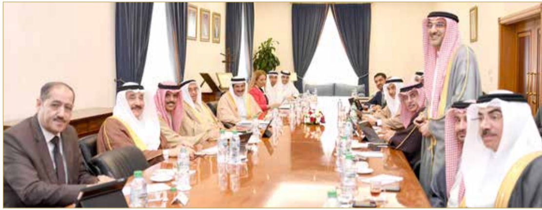
سمو الشيخ محمد بن مبارك مترسدا اجتماع اللجنة العليا لتقنية المعلومات والاتصالات

الإلكترونية الذي وصل إلى 93% ومستوى استخدامها إلى 74%، وما وصل إليه المؤشر العام لرضا العملاء وفقاً للنموذج والمقياس الأميركي نسبة 77% وهي نسبة تجاوزت المعدل العالمي في هذا المجال. وفي ختام الاجتماع، عبر سمو الشيخ محمد بن مبارك آل خليفة عن شكره وتقديره لهيئة المعلومات والحكومة الإلكترونية في ضوء التقارير الإيجابية والإنجازات المتحققة خلال الفترة الماضية، مؤكداً سموه ضرورة العمل بنفس التوتيرة في المرحلة القادمة في تحقيقاً لأهداف وتطلعات الحكومة في هذا المجال الحيوي والمهم.