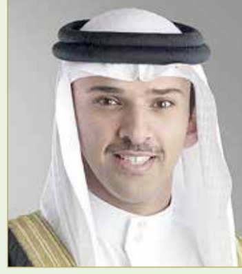
الشيخ علي بن خليفة

وقدم الشيخ علي بن خليفة بن أحمد آل خليفة، التهاني إلى سمو الشيخ ناصر بن