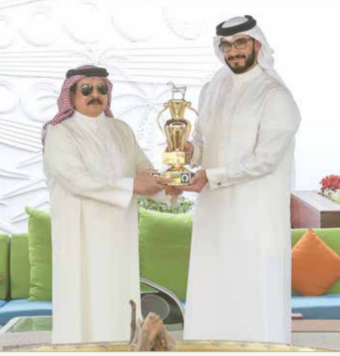
جلالة الملك مستقبلا سمو الشيخ عيسى بن سلمان

ناصر بن حمد وعيسى بن سلمان أهديا جلالته كؤوس بطولة سباق الخيل