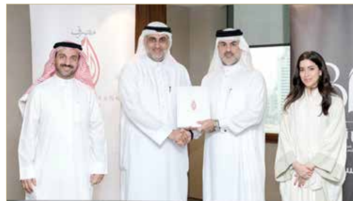
عقب توقيع مذكرة التفاهم

يشكل مشروع السدره مجمعًا سكنيًا مسوّراً ضمّ خصيصًا ليناسب احتياجات العائلة، ويضم 452 فيلا فاخرة مكونة من غرفتين إلى 5 غرف نوم وتحيط بها حدائق خضراء، مع مناطق اللعب للأطفال ومواقف للسيارات وأنظمة كاميرات مراقبة تعمل على مدار الساعة. ويمكن لجميع العلاء الاستفادة من برنامج "اري" للتمويل العقاري الخاص بمصرف السلام بدفعات مقدمة تبدأ من 10%.