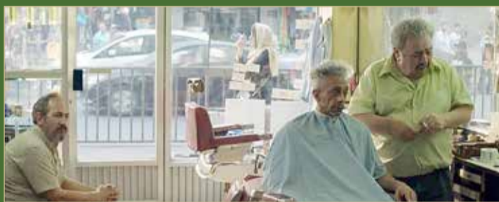
فيلم أحن إليك أحن إلي