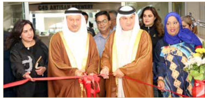
المنامة - محافظة العاصمة

تنمية قطاع ريادة الأعمال في مجال المجوهرات والأزياء