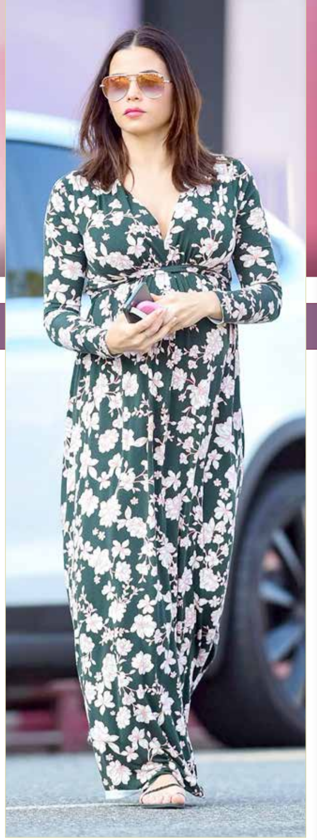
« بعد 5 أشهر من إعلانهما انتظارهما طفلهما الأول، أعلنت الممثلة والراقصة الأميركية من أصول لبنانية جينا ديوان، والممثل ستيف كازي خطبتهما عبر صفحتاهما الخاصة على أحد مواقع التواصل الاجتماعي.

أقامت الفنانة البحرينية هيفاء حسين وزوجها الفنان الإماراتي حبيب غلوم حفل استقبال فخم جديد لتوأمها سلطان وجواهر، في الإمارات العربية المتحدة، بعد 3 أشهر من الحفل الأول الذي أقيم للتوأم في البحرين. ونشرت الفنانة هيفاء بعضا من صور حفل الاستقبال الثاني، الذي أقيم لتوأمها سلطان وجواهر في الإمارات، بعد أن أقيم الحفل الأول لهما عند ولادتهما في دولة البحرين. والصور التي نشرتها هيفاء عبر خاصية "الاستوري" في حسابها على "انستغرام"، أظهرت مدى الفخامة التي كانت في الحفل الذي حضره العديد من أصدقاء وزملاء النجمين، وظهرت الهدايا المتنوعة التي كتب عليها أسماء التوأم سلطان وجواهر، وزينت الأطعمة والمشروبات، والتقطت هيفاء العديد من الصور مع