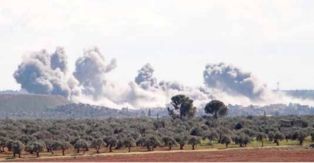
عمدة الدخان تتصاعد جراء القصف في إدلب

وفي وقت سابق من أمس، تجمع مسلحون مدعومون من تركيا قرب حطام طائرة سورية من طراز "سو 23"، غير أن وكالة الأنباء السورية أكدت أن الطائرة تركية مسيرة، ودخلت الأجواء السورية وتم إسقاطها، وهو ما أكدته وزارة الدفاع التركية لاحقا.