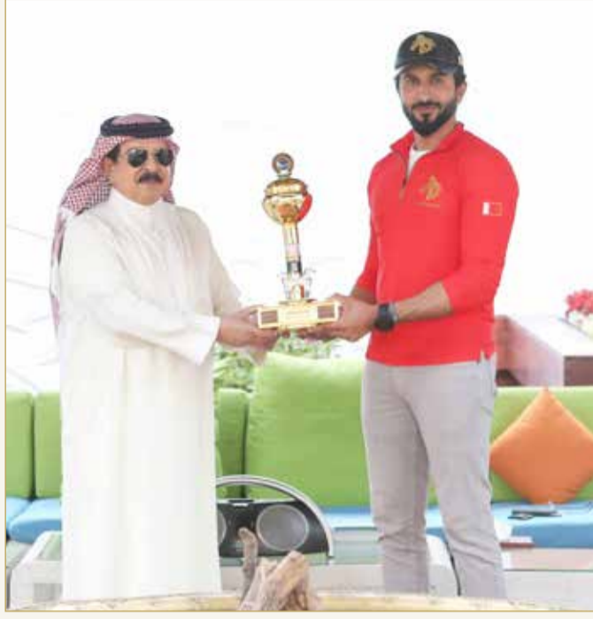
جلالة الملك مستقبلا سمو الشيخ ناصر بن حمد

ودعم وتشجيع فرسان المملكة وتطوير هذه الرياضة الأصيلة التي حققت فيها المملكة إنجازات عديدة ومشرفة على مختلف المستويات القارية والعالمية، معرباً جلالته كذلك عن تقديره للإسهامات الطيبة لسمو الشيخ عيسى بن سلمان بن حمد آل خليفة في دعم هذه الرياضة وتعزيز مكانتها والسعي نحو الارتقاء بها إلى أفضل المستويات.