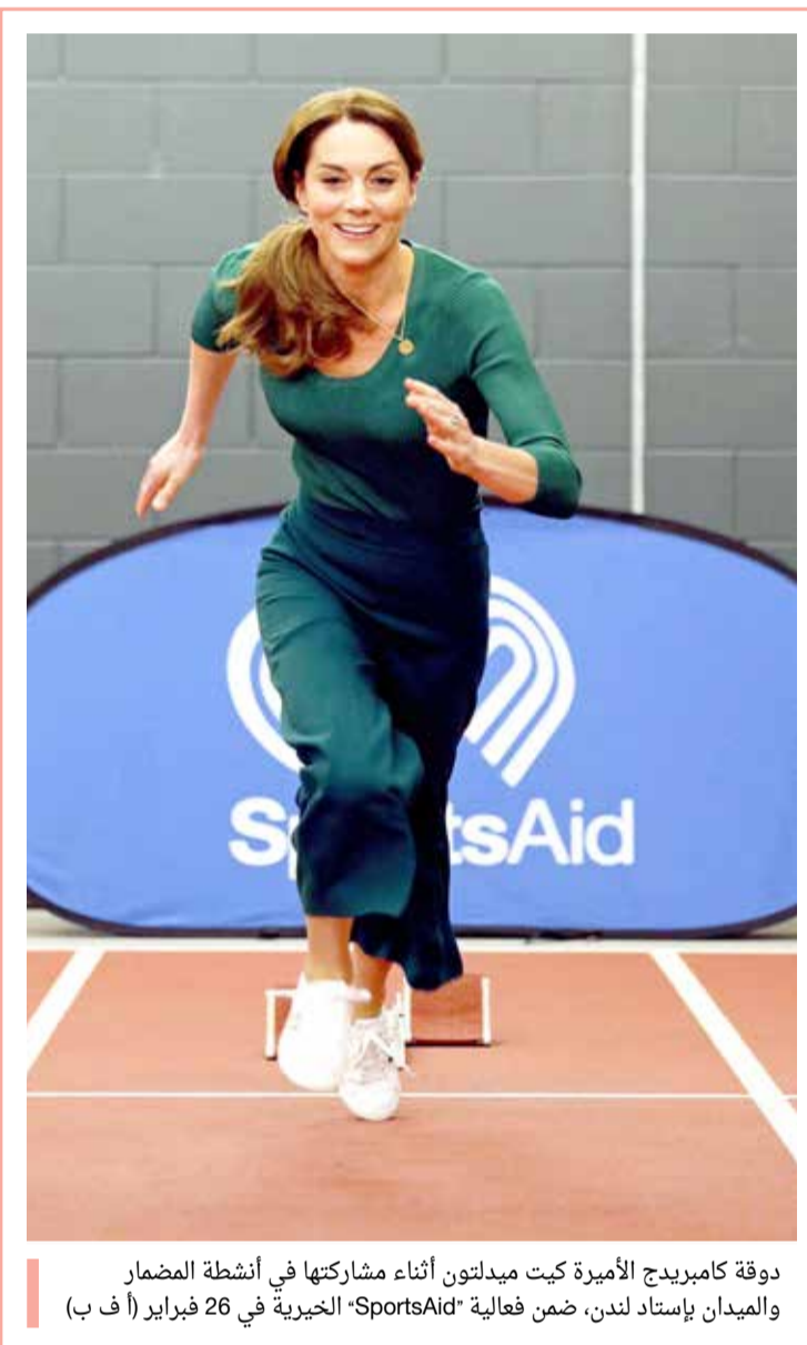
دوقة كامبريدج الأميرة كيت ميدلتون أثناء مشاركتها في أنشطة المضمار والميدان بإستاد لندن، ضمن فعالية SportsAid الخيرية في 26 فبراير