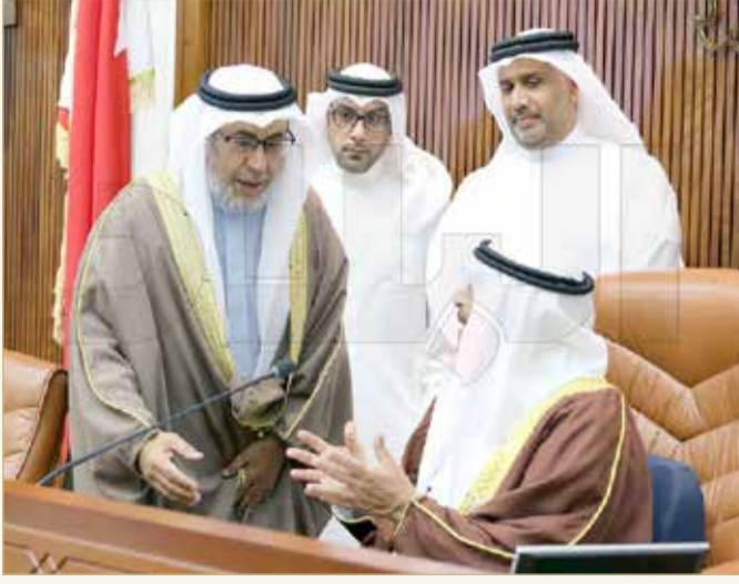
الرئيس الصالح والوزير البوعيين

البوعيين: لتكن قرارات العطل من خلال مجلس الوزراء