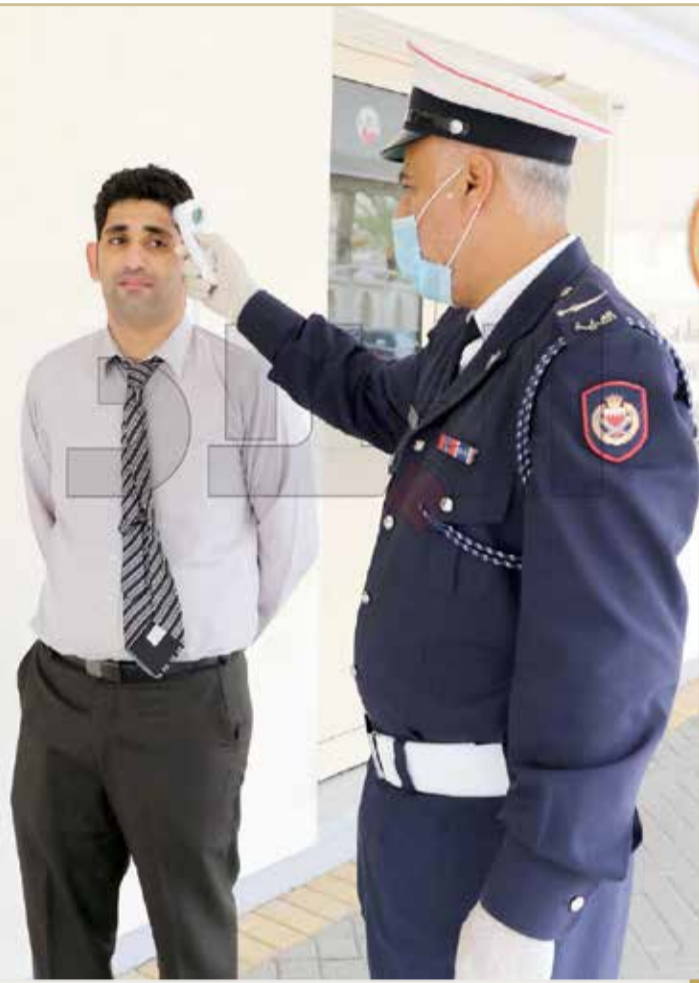
فرد بأمن البرلمان يفحص بجهاز الكشف الحراري ببوابة الدخول