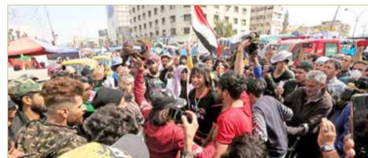
من ساحة التحرير في بغداد بالتزامن مع تأجيل جلسة البرلمان

الصدر كان قد هدد سابقًا باحتجاجات مليونية في المنطقة الخضراء إذا لم يصوت على الحكومة هذا الأسبوع. وتزامنت جلسة أمس التي لم يكتمل نصاها مع تظاهرات مليونية دعت إليها تنسيقيات الحراك في العراق. وتوافد الآلاف منذ الصباح الباكر إلى ساحة التحرير في العاصمة، من جميع محافظات الجنوب والوسط.