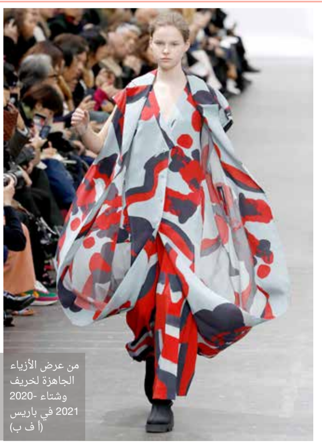
من عرض الأزياء الجاهزة لخريف وشتاء 2020-2021 في باريس