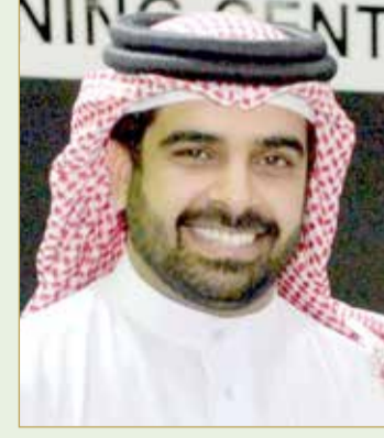
سمو الشيخ سلمان بن محمد

وقال سمو الشيخ سلمان بن محمد آل خليفة: "سعداء بالنتيجة المشرفة التي حققها سمو الشيخ ناصر بن حمد آل خليفة في هذا السباق العالمي، وهذا ليس بغير على سموه، الذي دائماً عدونا على تحقيق الإنجازات في رياضة الخيل، فاهتمام ودعم سموه لهذه الرياضة هيأت الظروف المثالية التي دفعت بالحصان "بورت ليونز" لإحراز لقب الشوط الأول بهذا الحدث الدولي، معرّباً سموه عن سعادته بإنجاز