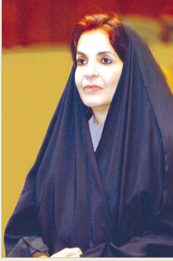
سمو الأميرة سبيكة بنت إبراهيم

في الهند عن طريق تقديم خدمات مالية ورقمية للمرأة الهندية لتقوم بتأسيس مشروعاتها الخاصة مما يحقق الدعم المالي والاقتصادي لها ولعائلتها.