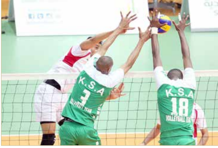
جانب من منافسات الكرة الطائرة بالنسخة الماضية

فيما فازت السعودية بالنسخة الثانية التي أقيمت في الدمام 2015 وأنهت البحرين مشاركتها بالمركز الرابع بحصولها على 43 ميدالية متنوعة بينها 7 ذهبيات و20 فضية و16 برونزية، لتتفوق على حصادها في النسخة الأولى الذي انتهى بـ23 ميدالية ملونة لكنها تأخرت في الترتيب العام من الثالث إلى الرابع.