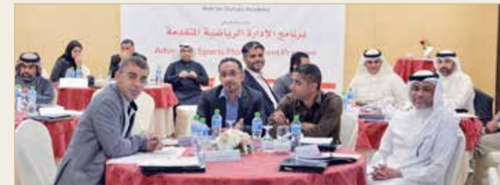
جانب من دورة دبلوم الإدارة الرياضية العام الماضي