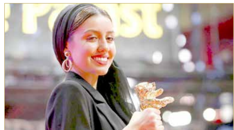
وأوضح رئيس لجنة التحكيم وهو يصف الفيلم أنه يحكي "4 قصص تظهر كيف يلقي نظام مستبد بنسبنا على المواطنين العاديين بغرض جرحهم نحو الوحشية".

قال رئيس لجنة التحكيم في مهرجان برلين السينمائي، جيريمي أيرونز، إن فيلم "لا يوجد شر" (ذير إزنو إيغل) للمخرج الإيراني محمد رسولوف فاز بجائزة الدب الذهبي. ويتناول الفيلم، الذي تم تصويره سراً في تحد لرقابة الحكومة الإيرانية، قصة 4 أشخاص تم اختيارهم لتنفيذ عقوبة الإعدام والورطة الأخلاقية التي تعرض لها كل منهم وتداعيات ما سيظهره من تحد عليهم وعلى المحيطين بهم. ولم يسمح لرسولوف بمغادرة البلاد لتسلم الجائزة. وتسلمت ابنته باران التي تمثل في هذا الفيلم أيضاً الجائزة بدلاً منه. وقالت "إنني مرتبكة وسعيدة جداً بهذه الجائزة ولكن في نفس الوقت فإني حزينة لأنها لمخرج لم يستطع التواجد هنا الليلة. ولذلك فبالإنابة عن كل الفريق أقول "هذه له".