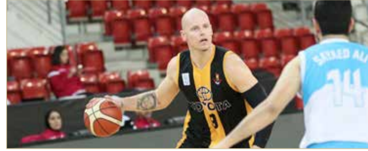
من لقاء الأهلي وسماهيج