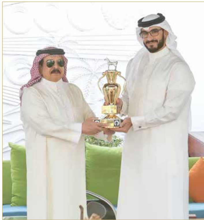
(02) ... وجلالته مستقبلا سمو الشيخ عيسى بن سلمان