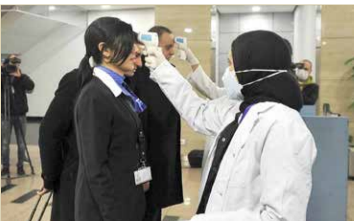
مصر تنفي رصد أي حالات مشتبه بإصابتها بفيروس كورونا

مع انهيار مؤشرات الاقتصاد الصيني إلى ما دون مؤشرات العام 2008 وتراجع مؤشرات البورصات العالمية بواقع أكثر من 10% وانخفاض سعر خام برنت إلى 50 دولارا للبرميل مقابل 70 دولارا مطلع العام الجاري.