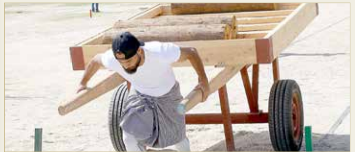
جانب من التصفيات الأولى لمسابقة تحدي الموروث