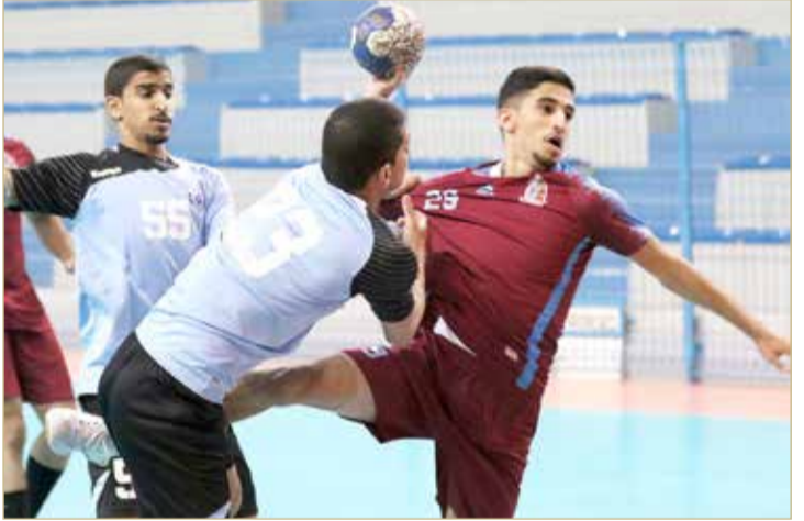
لقاء الشباب وسماهيج