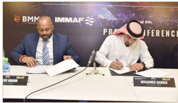
لحظة التوقيع على عقد الاستضافة

نحني ثمار هذه الرؤية، بعد أن جدد العام لعام 2020 ومنتخبين سيتم اختيارهما ليكون العدد 8 منتخب بفرقة السيدات، وسيكون مجموع جوائز هذه البطولة 360 ألف دولار أميركي، مقسمة على النحو التالي، ففي فئة الرجال، سيحصل صاحب المركز الأول على 100 ألف دولار، وسيحصل صاحب المركز الثاني على 70 ألف دولار، وسيحصل صاحب المركز الثالث على 50 ألف دولار وسيحصل صاحب المركز الرابع على 30 ألف دولار. وفي فئة السيدات، ستحصل صاحبة المركز الأول على 50 ألف دولار، وستحصل صاحبة المركز الثاني على 30 ألف دولار، وستحصل صاحبة المركز الثالث على 20 ألف دولار وستحصل صاحبة المركز الرابع على 10 آلاف دولار.