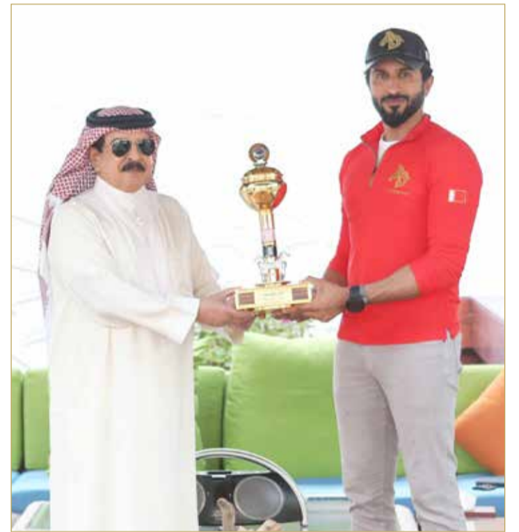
جلالة الملك مستقبلا سمو الشيخ ناصر بن حمد