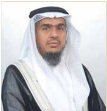
رئيس ديوان الخدمة المدنية

وأوضح الزايد أن ديوان الخدمة المدنية سيصدر المعايير والضوابط التي تنظم عملية العمل من المنزل في الوزارات والهيئات والمؤسسات الحكومية.