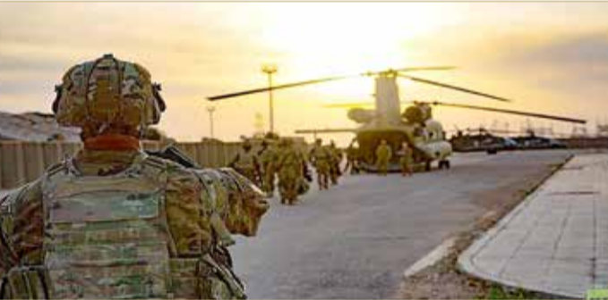
التحالف الدولي ينسحب من قاعدة القائم العراقية

بشكل رسمي قاعدة القائم العسكرية على الحدود مع سوريا، بعد انسحاب قوات التحالف الدولي لمكافحة تنظيم داعش الإرهابي منها. وكانت مراسم الاستلام والتسليم للقاعدة قد تمت قبل يومين. وقال التحالف الدولي في بيان إنه سيقيم بعملية إعادة نشر ونقل الأفراد والمعدات إلى عدة قواعد عسكرية في العراق خلال عام 2020. لكن التحالف أكد أنه قواته التي يطلق عليها أيضاً "قوة المهام المشتركة-عملية العزم الصلب" ستبقى في العراق بدعوة من الحكومة هناك، وستستمر في "تقديم المشورة والتدريب" ضمن مهمتها في هزيمة داعش. وأشار إلى أن قاعدة القائم احتلت موقعا مهما في القتال ضد داعش، خلال معركة الباغوز الأخيرة ضد داعش في سوريا. وباتى هذا التطور بعد أيام من هجوم صاروخي على قاعدة التاجي شمالي بغداد، مما أسفر حينها عن مقتل أميركيين وبريطانيين. إلى ذلك، أعلن وزير الدفاع البريطاني بن والاس أمس الخميس أنّ بلاده تقوم بسحب قسم من قواتها العاملة ضمن بعثة تدريب في العراق على خلفية انتشار فيروس كورونا المستجد. وأوضح أن القوات المعنية يتم سحبها بسبب تراجع وتيرة التدريبات في الأشهر الأخيرة، وبسبب "تعلق" برنامج التحالف الدولي لستين يوماً كإجراء وقائي "إثر تفشي الوباء".