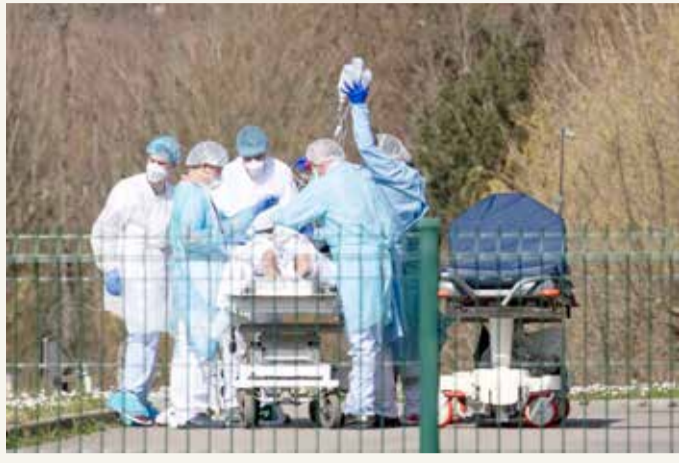
طاقم طبي ينقل مصاب بفيروس كورونا الى مستشفى إميل مولر في مولوز بشرق فرنسا