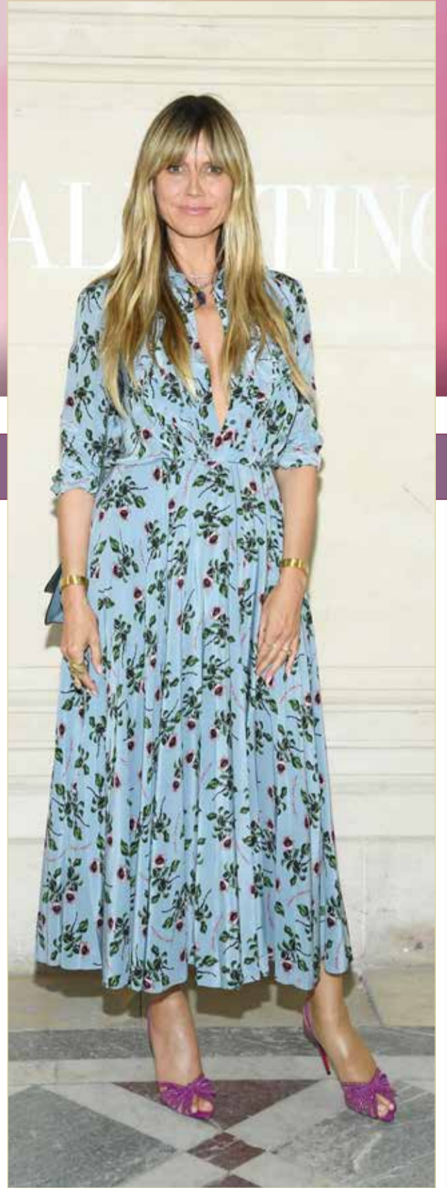
« أثارت عارضة الأزياء الألمانية هايدي كلوم الرعب بسبب شعورها بالتعب بعد تصويرها حلقة من برنامج America's Got Talent الذي تشارك في لجنة تحكيمه، ورغبها في إجراء اختبار الفيروس، لكنها لم تتمكن من الحصول عليه بعد، فتم اتخاذ قرار بإيقاف إنتاج البرنامج.