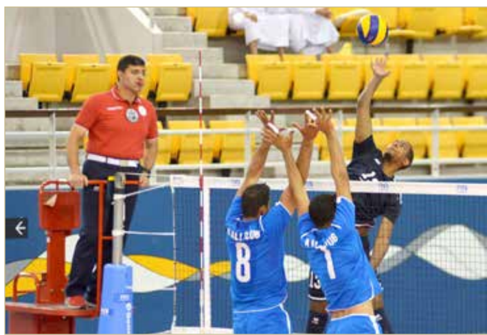
من منافسات الدور التمهيدي لكأس ولي العهد هذا الموسم

ولم يتبين لغاية الآن ما إذا كان الاتحاد يعتزم تأجيل المباريات إلى الموسم القادم أو إقامتها في هذا الموسم في حال إلغاء قرار وقف ممارسة جميع الألعاب الرياضية داخل الصالات المغلقة، حيث ترغب الأندية الوطنية بتحديد الموقف النهائي ليتسنى لها إلغاء عقود لاعبيها بالترضية أو الإبقاء عليها.