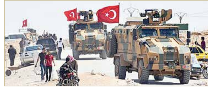
رتل عسكري تركي تعرض لهجوم على طريق الـ M4

إدلب بعد أن قطع عناصر من فصائل مسلحة في المنطقة طريقاً رئيسياً لتعطيل مسار الدورية. وبموجب الاتفاق، الذي أوقف الاعتداءات إلى حد بعيد بعد تصعيد للعنف تسبب في نزوح ما يقرب من مليون شخص، تشن القوات التركية والروسية ممراً أمنياً على جانبي الطريق السريع M4، وتقومان بدوريات مشتركة على طول الطريق. المسلحة شمال غرب سوريا بعدم احترام الاتفاق. وقالت وزارة الخارجية إن المسلحين في إدلب لا يلتزمون بالاتفاق. كما اعتبرت أن تلك الفصائل أعادت التسلح، وتشن هجمات مضادة على قوات النظام السوري. وكانت روسيا وتركيا اضطرتا، الأحد، لاختصار أول دورية مشتركة بينهما في