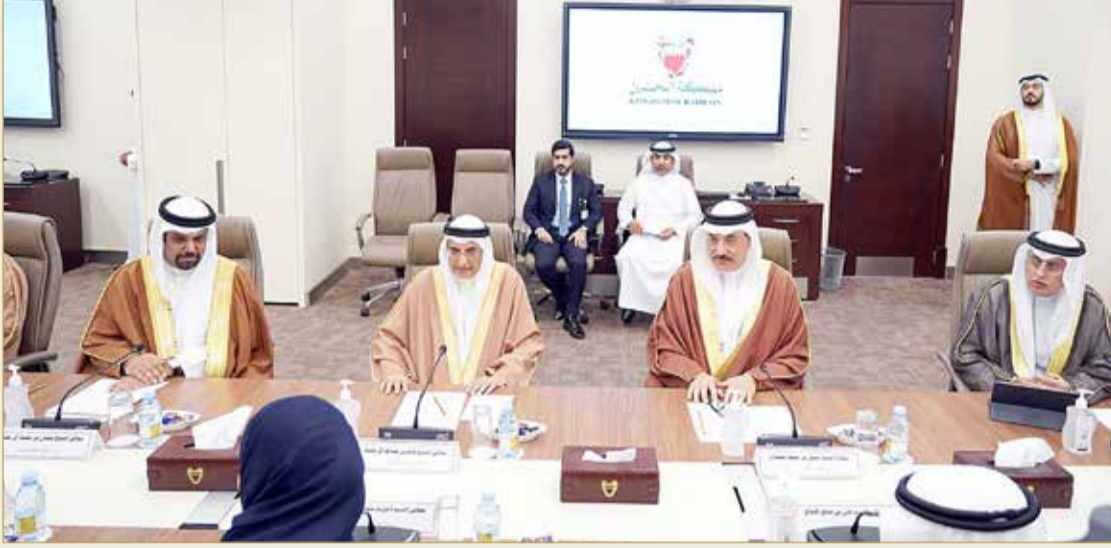
اجتماع حكومي مع هيئة مكتب مجلسي الشورى والنواب

الحكومة تطلع المجلسين على تفاصيل الحزمة المالية والتنموية بقيمة 4.3 مليار دينار