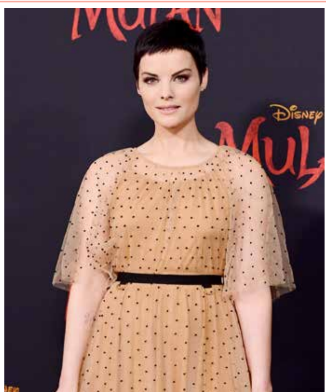
الممثلة الأميركية جيمي ألكسندر تحضر العرض العالمي الأول لفيلم ديزني مولان في مسرح دولبي في هوليوود

ولفتت إلى أن الأبحاث استمرت نحو 6 أعوام، وكانت تجمع بيانات وصور دقيقة عن النظام الشمسي، إذ توقع الباحثين إمكانية اكتشاف أكثر من 500 كوكب آخر بالمستقبل. وتشير الصحيفة إلى أن الاكتشافات الجديدة تشير إلى إمكانية الوصول إلى المدارات، التي تقع خارج كوكب نبتون.