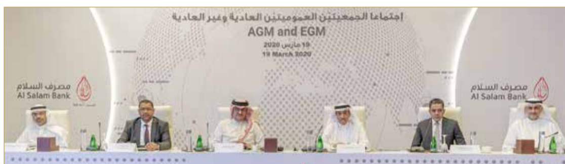
اجتماع الجمعية العامة العادية للبنك

أقر مساهمو مصرف السلام - البحرين، في اجتماع الجمعية العامة العادية الذي انعقد أمس 19 مارس 2020، توزيع أرباح بما يعادل 8 % من رأس المال المدفوع، أي ما قيمته 17.727 مليون دينار، للسنة المالية 2019، بحيث تُقسم نسبة الـ 8 % إلى أرباح نقدية بنسبة 4 % مقدارها 8.863 مليون دينار وأسهم منحة بنسبة 4 % وعددها 88.634 مليون سهم (بواقع سهم واحد لكل 25 سهماً من أسهم المصرف).