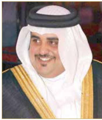
سمو الشيخ خليفة بن حمد