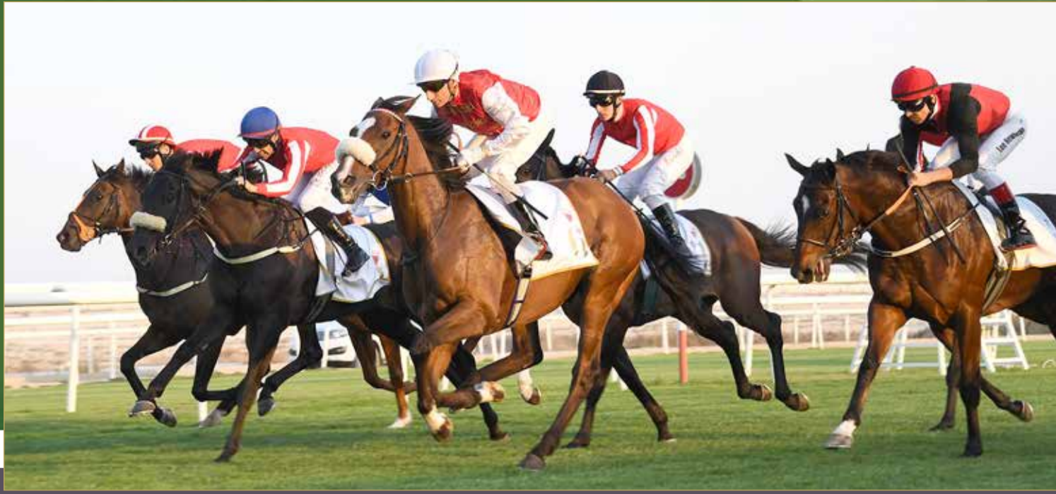
منافسات قوية يشهدها السباق