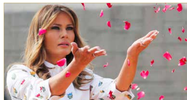
وكانت أبرز مبادرات ميلانيا حملة بعنوان "بي بيست" تركز على سلامة الأطفال وعائيتهم.

قال البيت الأبيض إن السيدة الأولى، ميلانيا ترامب، ستحت الأميركيين على غسل أيديهم والحرص على ترك مسافة تفصل بينهم لمكافحة فيروس كورونا، في إطار حملة إعلانات تلفزيونية جديدة. وأضاف البيت الأبيض في بيان أن شبكات إيه.بي.سي وسي.بي.بي.إس "وإن.بي.سي" وغيرها ستعرض الإعلانات العامة التي سيشترك فيها أيضا مسؤولون في إدارة