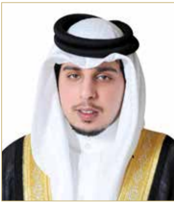
سمو الشيخ سلطان بن حمد