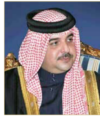
سمو الشيخ عبدالله بن حمد

ويقيم الشوط الثاني لجياد سباق التوازن "نتاج محلي" لمسافة 1000 متر مستقيم والجائزة 2000 دينار، وعلى رغم قلة عدد الجياد المشاركة إلا أن التوقعات تشير إلى منافسة قوية بين الجياد الأربعة المشاركة في الشوط التي ظهرت بصورة جيدة وحققنت انتصارات ومراكز متقدمة في مشاركتها هذا الموسم، ولديها