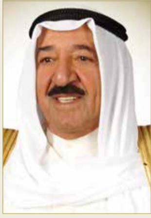
سمو أمير دولة الكويت