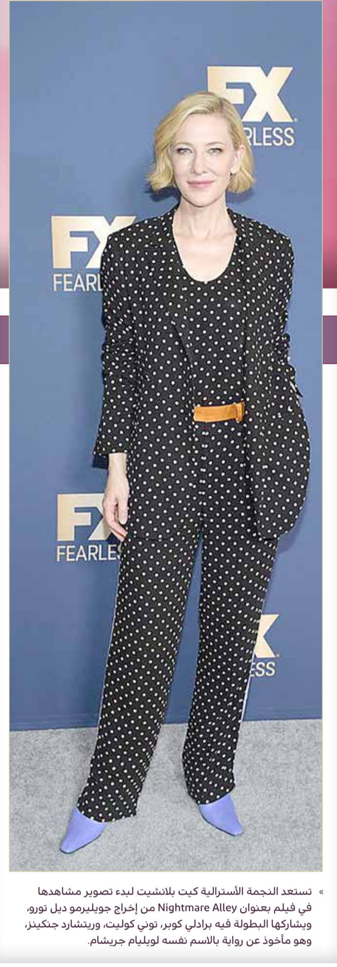
« تستعد النجمة الأسترالية كيت بلانشيت لبدء تصوير مشاهدا في فيلم بعنوان Nightmare Alley من إخراج جويليرمو ديل تورو، ويشاركها البطولة فيه برادلي كوبر، توني كوليت، وريتشارد جنكينز، وهو مأخوذ عن رواية بالنسبة لويليام جريشام.