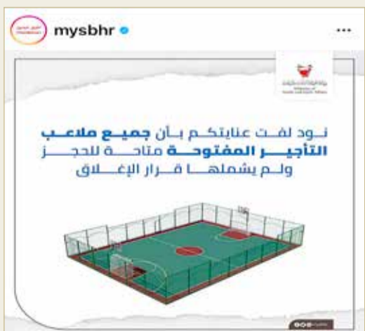
إعلان وزارة شؤون الشباب والرياضة

المجتمع من أجل ممارسة الرياضة في بيئة مثالية وتأكيد دور ملاعب الفرجان في دعم الأندية الوطنية والمنتخبات وتزويدها بكثير من المواهب الرياضية.