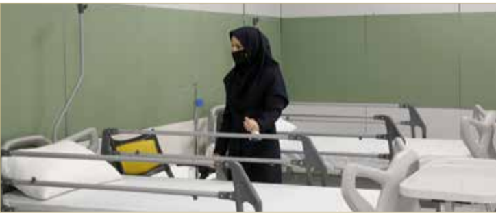
مفتشة صحة تفحص تجهيزات مستشفى مؤقتة داخل “مول إيران” شمالي غرب العاصمة طهران أمس

الكمامات الطبية، وأعضاء الطاقم الطبي يموتون يومياً، لا أعرف عدد من ماتوا، ولكن الحكومة تحاول التعطيم على النطاق الحقيقي للأزمة، لقد كذبوا في الأيام الأولى لتفشي الوباء”. وأعلنت 16 دولة أن لديها حالات أصلها من إيران. وهي العراق وأفغانستان والبحرين والكويت وعمان ولبنان والإمارات وكندا وباكستان وجورجيا وإستونيا ونيوزيلندا وروسيا البيضاء وأذربيجان وقطر وأرمينيا. وقال أطباء من الأقاليم الثلاثة الأكثر تضرراً في إيران، وهي غيلان وغولستان ومازاندان، لبي بي سي إن “معدات