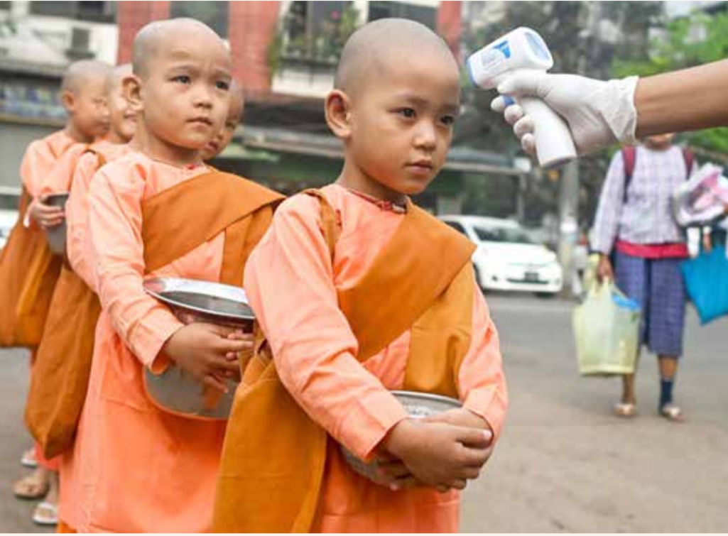
قياس درجة حرارة أطفال في مدينة بانغون، ميانمار أمس

الفيروس يقتل أكثر من 11 ألفا ويهز الاقتصاد العالمي