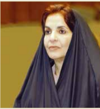
الصورة الرسمية لصاحبة السمو (2)

واعتبرت صاحبة السمو الملكي رئيسة المجلس الأعلى للمرأة أن هذا التوجيه السامي من لدن جلالته الملك يمكن أن يؤسس لمرحلة جديدة من عمل المرأة في مختلف القطاعات الخدمية