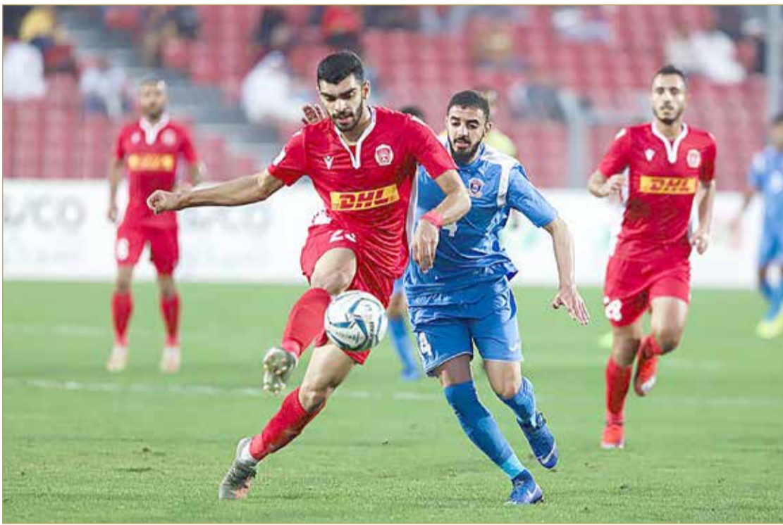
من منافسات دوري ناصر بن حمد الممتاز