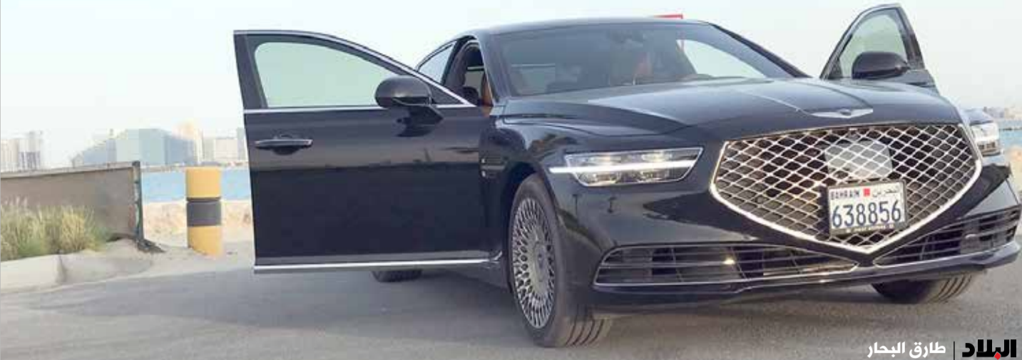
البلاد طارق البحار

◆ فخامة داخلية دون مساومة بلمسات جلدية وخشبية فاخرة