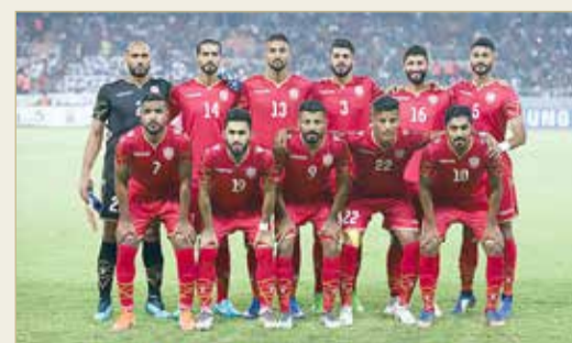
منتخبنا الوطني الأول بطل بطولة غرب آسيا 2019

الرابعة العام 2007 في الأردن، الخامسة العام 2008 في إيران، السادسة العام 2010 في الأردن، السابعة العام 2012 في الكويت، الثامنة العام 2014 في قطر، وأخيراً النسخة التاسعة في العراق. وتعد استضافة الاتحاد الإماراتي لكرة القدم لمنافسات النسخة العاشرة تاريخية؛ كونها ستشكل الظهور الأول لمنتخب الإمارات في بطولات الرجال لاتحاد غرب آسيا لكرة القدم.