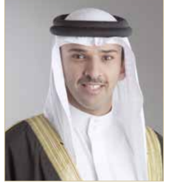
الشيخ علي بن خليفة

رفع رئيس مجلس إدارة الاتحاد البحريني لكرة القدم الشيخ علي بن خليفة بن أحمد آل خليفة، خالص التهاني والتبريكات إلى صاحب السمو الملكي الأمير خليفة بن سلمان آل خليفة رئيس الوزراء؛ بمناسبة عودة سموه سالماً إلى أرض الوطن بعد أن من الله عليه بالشفاء والصحة. وقال الشيخ علي بن خليفة في