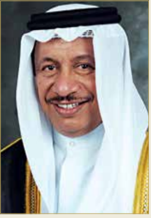
سمو الشيخ نواف الأحمد