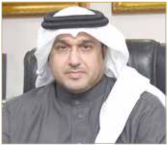
الامين العام للمجلس الأعلى للقضاء

البلاد صاحب الجلالة الملك حمد بن عيسى آل خليفة، وأن يديم على مملكة البحرين وشعبها نعمة الأمن والأمان.