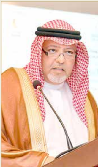
خالد بن علي آل خليفة

◆ وزير “العدل”: 5 جلسات الحد الأقصى للتأجيلات “المطالبات الصغيرة”