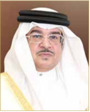
سمو وزير شؤون الديوان الملكي