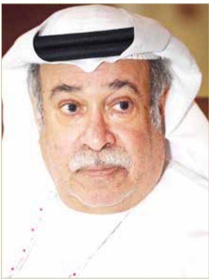
عيسى بن راشد

وليستذكره كل من أحبه وكان معه. شوبين جمشير أن أفكار الحفل سوف تكون مميزة ومختلفة، ذلك لأن الشيخ عيسى بن راشد شخصية وطنية ومنتوعة وفي كل زاوية من هذا الوطن له إسهام ودور وإثراء، مستذكراً بكل وفاء مناقب الفقيد وأن يكون هذا الحفل يخلد مسيرة الشيخ عيسى بن راشد للأجيال القادمة ويترجم شعار لن تنساك البحرين. وبين رئيس اللجنة أنه في ظل الظروف والأوضاع الحالية والالتزام