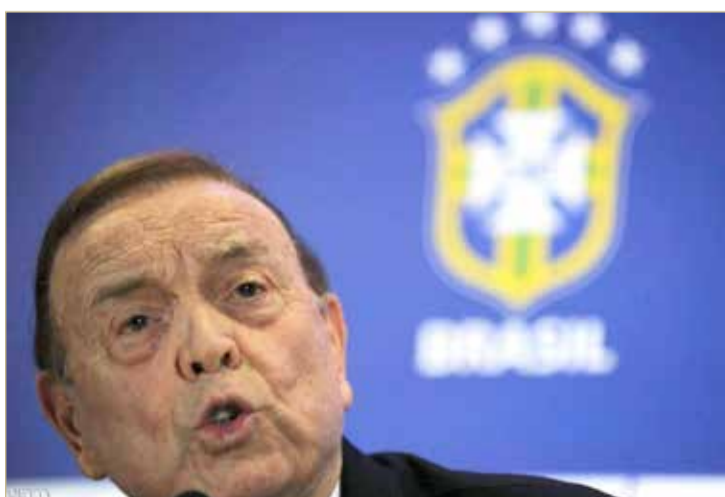
جوزيه ماري مارين

كما فرض الاتحاد الدولي على مارين الذي كان من أقوى الشخصيات في كرة القدم العالمية، غرامة قدرها مليون فرنك سويسري (مليون دولار). وبعد توقيفه في مايو 2015 في فندق فخم في زيوريخ، أمضى مارين 5 أشهر في سجن سويسري قبل أن يتم تسليمه إلى السلطات الأميركية، حيث دفع كفالة قدرها 15 مليون دولار وأمضى عامين في الإقامة الجبرية ومكث في برج ترامب في الجادة الخامسة في نيويورك. ومارين من بين 42 مسؤولاً ومديراً تسويقياً متهمين بدءاً من عام 2015