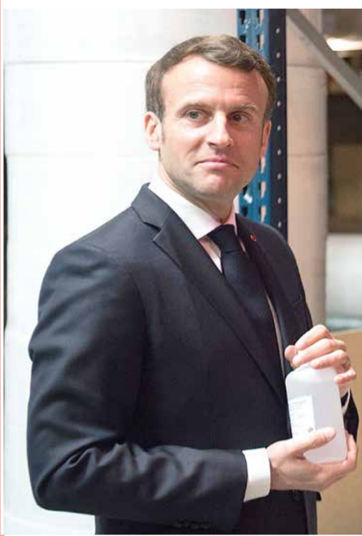
الرئيس الفرنسي إيمانويل ماكرون يغسل يديه بمطهر كحولي بعد زيارة إلى مصنع لأقعة الوجه الواقية وسط فرنسا