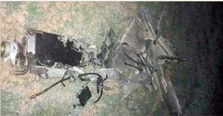
حطام إحدى الطائرات التركية الست المسقطة