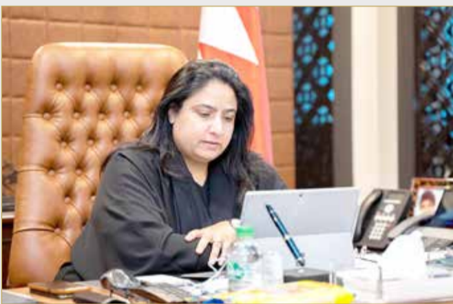
وكيل وزارة الخارجية أثناء مشاركتها في الاجتماع عن بعد

تنفيذا لتوجيهات سمو رئيس الوزراء بوضع خطة للعالقين