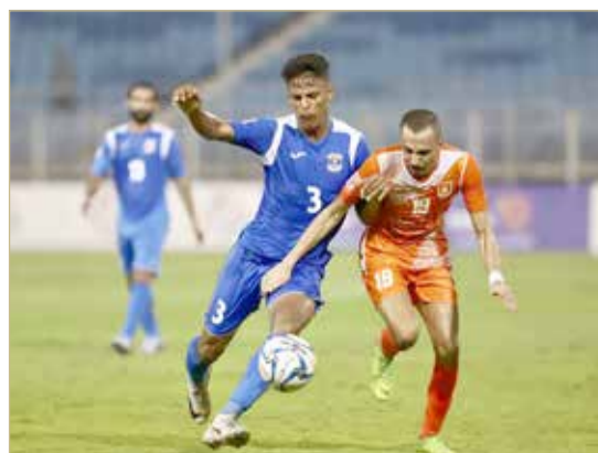
من مباريات المنامة في دوري ناصر بن حمد الممتاز