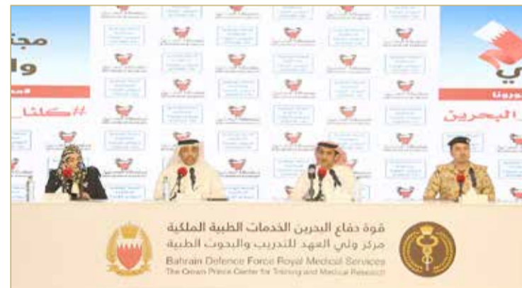
المؤتمر الصحافي للفرق الوطني للتصدي لفيروس كورونا (COVID 19)

أفادت وزارة الصحة بأن 47 حالة من الحالات القائمة التي تم الإعلان عنها أمس هي لعمال وافدين كان قد تم حجرهم احترازيًا؛ كونهم مخالطين لحالة قائمة، وبعد التأكد من النتائج الدورية للفحوصات المختبرية التي تتم لمن هم في الحجر الصحي تبين أن فحوصات جميع الحالات المخالطة الـ 47 إيجابية لتضاف إلى الحالات القائمة.