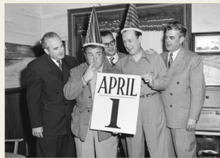
كذبة أبريل في هوليوود

البروفسور بوسكين ”كان ذلك اليوم يوما خطيرا جدا، إذ ظهر الحمقى من الرجال الحكيمين، وكان دور المهرج هو التحكم بالأمور بشكل فكاهي“. ومن أطرف الأكاذيب وأشهرها، ما حدث في رومانيا عندما كان الملك كارول يزور أحد متاحف العاصمة في أول أبريل؛ فسبقه رسام مشهور، كان قد ترصد قدومه، وقام برسم ورقة مالية أثرية من فئة كبيرة على أرضية المتحف؛ ما دفع الملك بأمر أحد حراسه، بالنزول لالتقاطها؛ ولكن سرعان ما اكتشفوا أنها كذبة، وقد اشتهر الشعب الإنجليزي بكذبة ظهرت في العام 1860 في اليوم الأول من شهر أبريل؛ إذ حمل البريد إلى مئات من سكان لندن بطاقات مختومة بأختام مزورة تدعوهم لمشاهدة الحفلة السنوية لغسل الأسود البيض، في برج لندن صباح يوم الأحد في الأول من أبريل؛ وذلك بالمجان؛ ما دفع الجمهور إلى التوجه نحو البرج لمشاهدة الحفلة المزعومة. وإلى جانب هذه المواقف المضحكة، كان هناك أحداث مؤسفة ومؤلمة صاحبت هذا التقليد؛ ومن أشهرها قيام سيدة إنجليزية بالصراخ وطلب النجدة من الشرفة؛ بسبب اندلاع حريق داخل المطبخ، ولم يستجب أحد، إذ ظن الناس أن هذا المشهد هو ”كذبة إبريل“؛ لتزامن ذلك اليوم مع أول