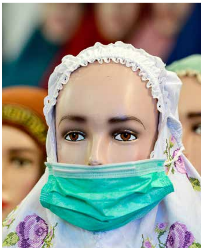
عرض أزياء مع قناع للوجه في كشك بسوق في باندا آتشيه

على الرغم من الحجر الصحي المفروض منذ مدة في عدة دول أوروبية إثر انتشار فيروس كورونا المستجد وحده آلاف الأرواح، فقد كان لهذا الإجراء إيجابية أخرى. فبالإضافة إلى أن الحجر الصحي للحماية من الوباء ومنع تفشيه أكثر وأكثر، أظهرت صور التقطتها قمر صناعي، تراجع تلوث الهواء في المناطق الحضرية في أنحاء أوروبا خلال الإغلاقات المفروضة، فيما حذر النشطاء من أن قاطني المدن مازالوا الأكثر عرضة لمخاطر الجائحة. وأظهرت صور القمر الصناعي ستنيل-5 تراجع متوسط مستويات ثاني أكسيد النيتروجين الضار في مدن من بينها بروكسل وباريس ومدريد وميلانو وفرانكفورت في الفترة ما بين الخامس و25 من مارس، مقارنة بنفس الفترة العام الماضي.