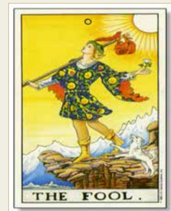
يتزامن مع قدوم فصل الربيع