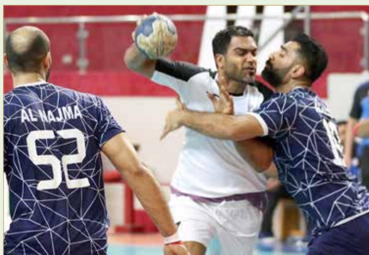
لقطات من مباراة باربار والنجمة