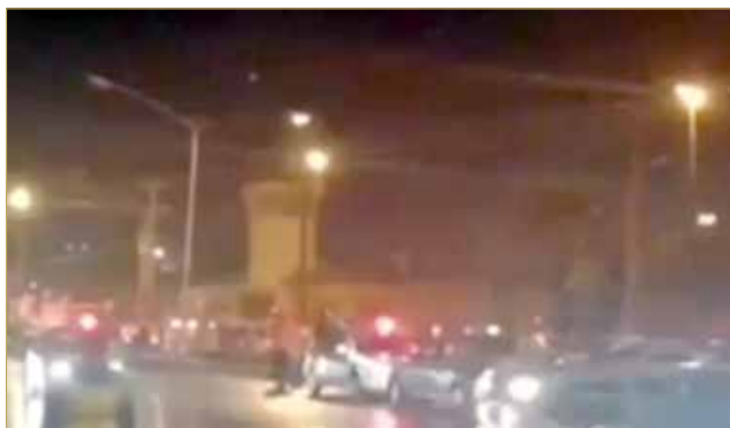
استمرار التوتر في سجن شبان بالأهواز

القوى الأمنية ترد بإطلاق النار وإلقاء القنابل المسيلة للدموع