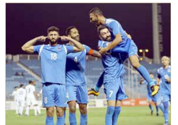
فرحة منامية خلال إحدى المباريات