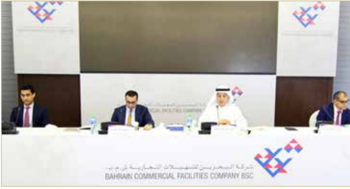
اجتماع "عمومية التسهيلات"

وحضر الاجتماع المساهمون، وأعضاء مجلس الإدارة، وممثلون عن مصرف البحرين المركزي، وبورصة البحرين، والمدقق الخارجي للشركة، إلى جانب أعضاء الإدارة العليا للشركة، سواء