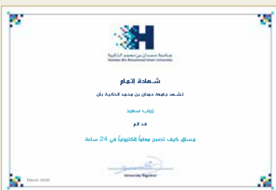
شهادة كيف تصبح معلماً عن بُعد في 24 ساعة