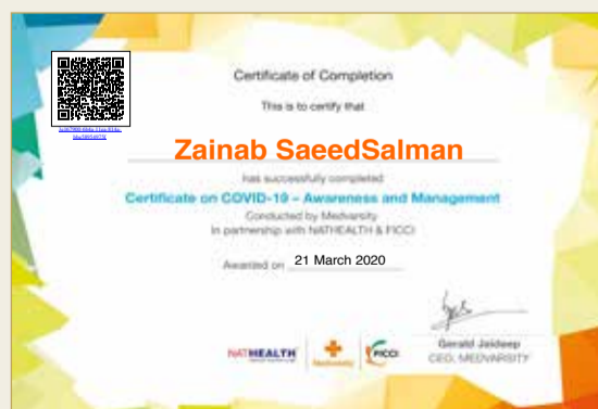
شهادة التثقيف الصحي والوعي الاجتماعي عن كورونا