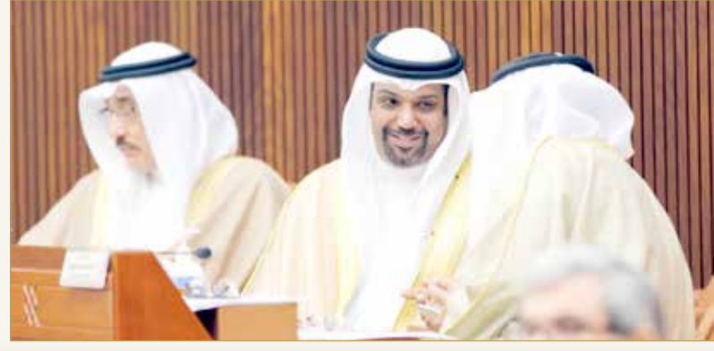
وزير المالية والاقتصاد الوطني في حديث جانبي بجلسة مجلس النواب أمس

قال وزير المالية والاقتصاد الوطني الشيخ سلمان بن خليفة آل خليفة إن الحزمة المالية للتصدي لفيروس كورونا البالغة نحو 4.3 مليار دينار تمثل ثلث حجم اقتصاد البحرين، وستغطي رواتب عدد كبير من المواطنين بحدود 100 ألف مواطن، علماً أن جميع المبادرات فيها فائدة للمواطنين، وستستمر في تنفيذها. (07)