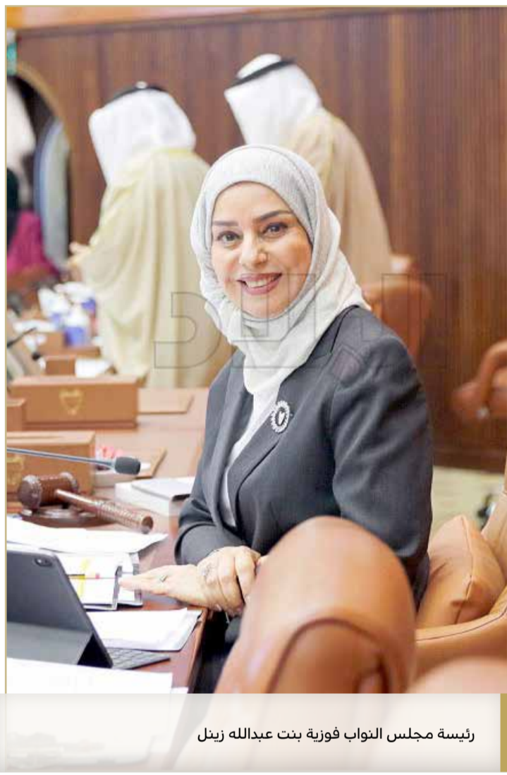
رئيسة مجلس النواب فوزية بنت عبدالله زينل

وقال: "مقولة 500 فلس بمعدل 1.25 دولار دخل الفرد اليومي، ثم زادت الوزارة إلى 4 دولارات بمعدل 65 دولاراً في الشهر، وذلك بناء على دراسة تم إجراؤها منذ 10 سنوات، إذاً دراستك فاشلة".