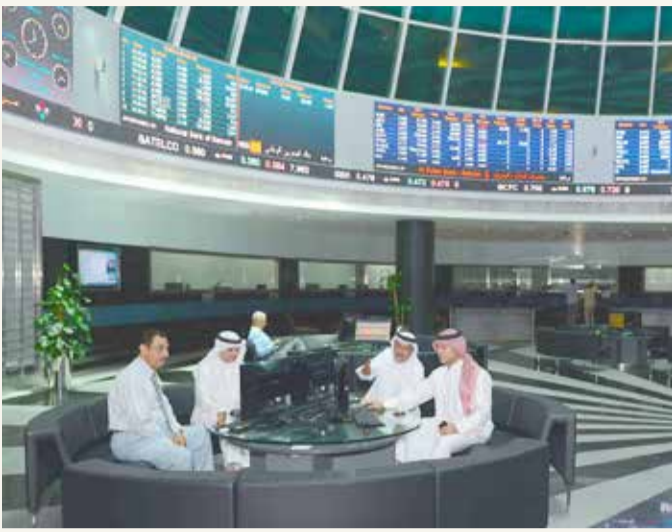
صورة أرشيفية للتداولات في البورصة

قيمة الأسهم و وحدات الصناديق الاستثمارية ارتفعت بنسبة 83 %