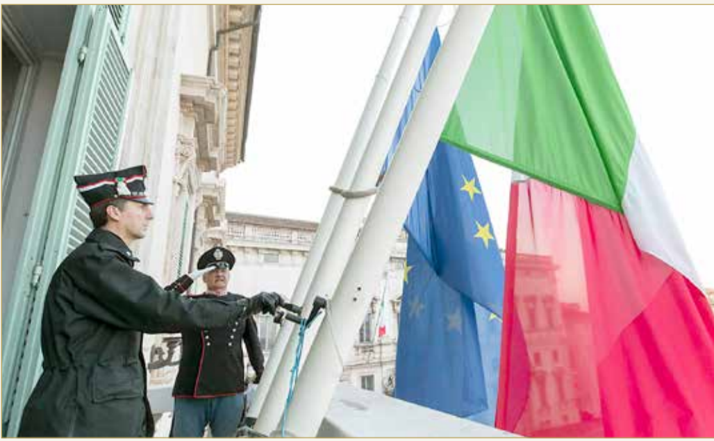
دقيقة صمت وتنكس للأعلام... إيطاليا تنكس أعلامها في نهاية شهر مارس