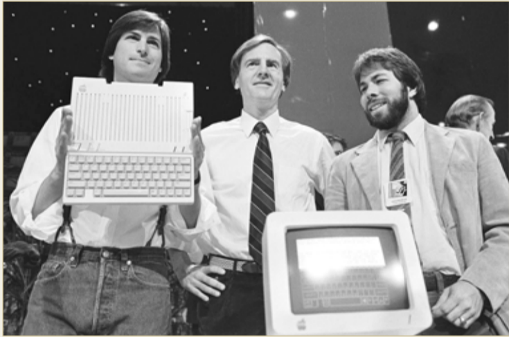
شهد 1 أبريل أيضا تأسيس شركة آبل

◆ يسمى يوم الحمقى وتعود أصوله للعام 1582 ويحمل إلى جانب الكذبة العديد من الأحداث