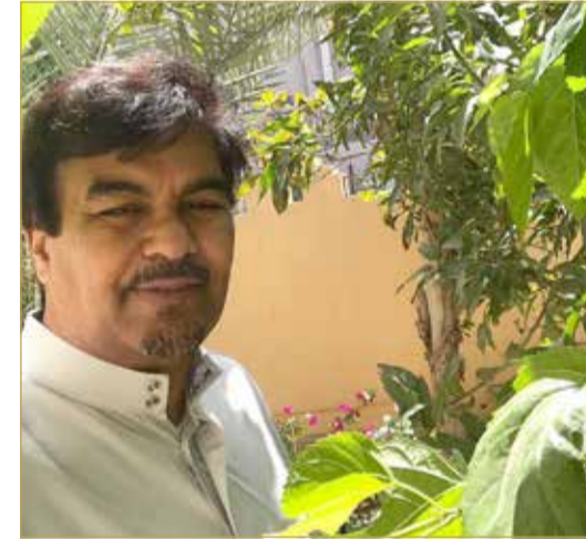
الهدى بحديقة المنزل

◆ يقرأ للظهر.. ويرعى حديقة البيت عصراً.. ولم يلتزم بالرياضة