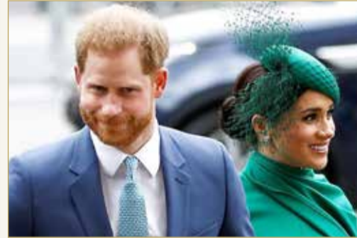
الأمير هاري وزوجته الأميركية ميغان

وأضافا "نتطلع إلى إعادة التواصل معكم قريباً.. لقد كنتم رائعين، وإلى أن نلتقي، فضلا اعتنوا بأنفسكم وبيعضكم البعض". وقال بيان صادر عن مكتبهما، أشارا إلى أنهما سيركزان الآن وفي الأشهر القليلة المقبلة على أسرتهما، بينما "يطوران منظمتهم المستقبلية غير الربحية". وأضاف "يفضل دوق ودوقة ساسكس أن يظل التركيز في الأسابيع والأشهر التالية على الاستجابة العالمية لـ "كوفيد-19".