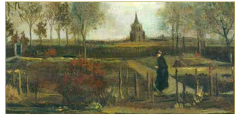
وتُظهر لوحة "حديقة الربيع" التي رسمها الفنان الهولندي العام 1884 حديقة في نوبينين، إذ كان يعيش في ذلك الوقت.

سُرقت لوحة الفنان الشهير فنست فان غوخ من متحف هولندي مغلق؛ بسبب جائحة فيروس كورونا. وقال متحف "سنجر لارين" بالقرب من أمستردام "إن لوحة 'حديقة الربيع' للفنان الهولندي فان غوخ، سُرقَت في الساعات الأولى من صباح يوم الاثنين". وقالت وسائل إعلام هولندية "إن اللصوص شقوا طريقهم عبر الباب الأمامي الزجاجي بعد الساعة الثالثة