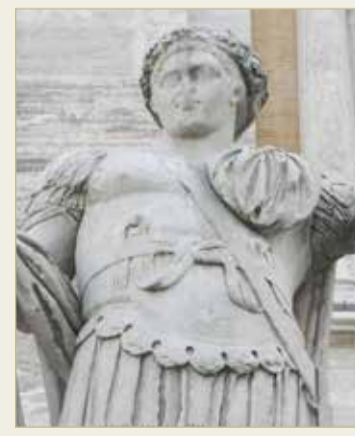
ترجع أصولها إلى عهد قسطنطين

(الكرنفالات) ”مدينة الملاهي المتنقلة“ والعديد من النكات والمزاح. وثم تأتي على شرح أستاذ التاريخ في جامعة بوسطن ”جوزيف بوسكين“ الذي يقول: إن أصول كذبة أبريل ترجع إلى عهد القسطنطين؛ إذ أقيمت مهرجانات وخدم للحكمة الإمبراطورية الرومانية عدة، واعتبر أن هذه الخدع يمكن أن تعيد الحياة إلى الإمبراطورية، كما سمح قسطنطين للمهرج كوجيل أن يكون ملكا ليوم واحد، فأصدر مرسوما يدعو للسخرية من ذلك اليوم، وبعد ذلك أصبح من العرف الاحتفال به سنويا، ويقول