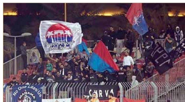
جماهير الأتراس المنامية