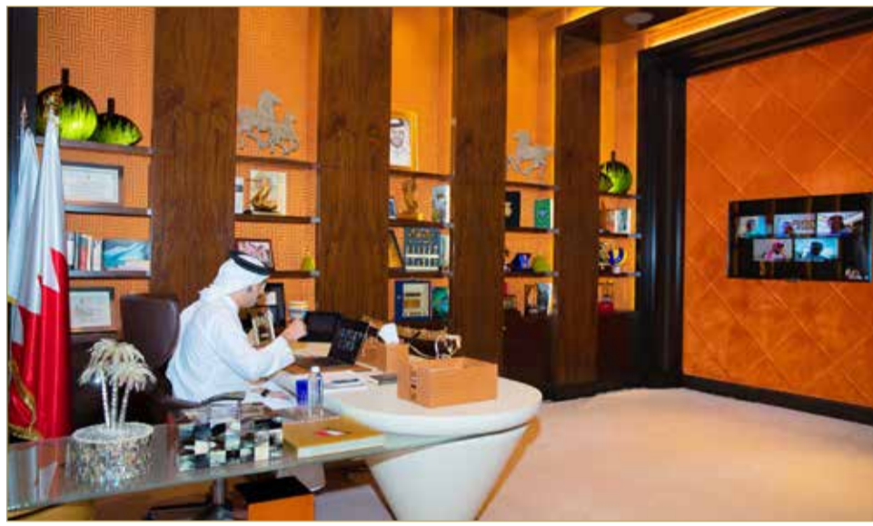
سمو الشيخ خالد بن حمد خلال الاجتماع المرئي

تعزيز الوعي لدى جميع الأفراد بأهمية تطبيق الإجراءات للوقاية