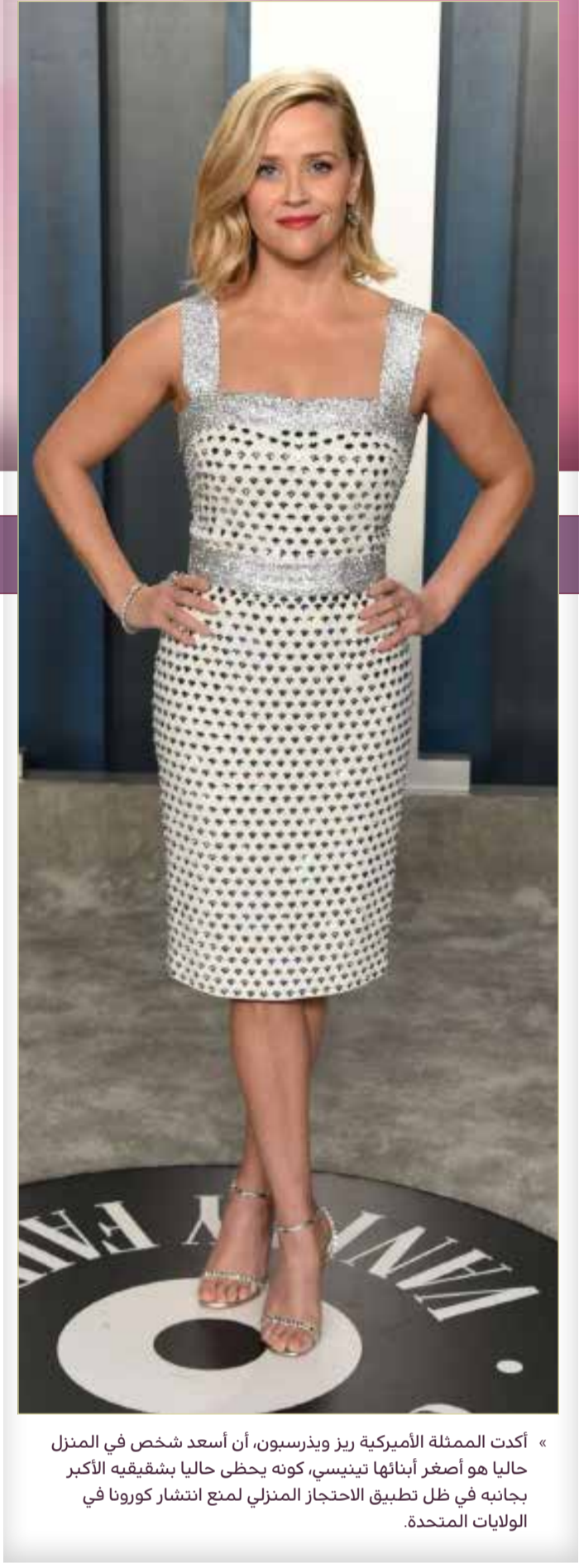
« أكدت الممثلة الأميركية ريز ويدرسون، أن أسعد شخص في المنزل حالياً هو أصغر أبنائها تينيسي، كونه يحظى حالياً بشقيقه الأكبر بجانبه في ظل تطبيق الاحتجاز المنزلي لمع انتشار كورونا في الولايات المتحدة.

أعلنت مؤخرا OSN عن حصولها لحقوق البث الحصري لأعمال Disney+ الأصلية الجديدة من شركة والت ديزني في الشرق الأوسط، وذلك عبر أجهزة استقبال OSN وخدمات البث عبر الإنترنت. ويُعتبر قرار OSN بث برامج وأفلام Disney+ الأصلية قراراً استراتيجياً يعزز مكانتها باعتبارها شبكة المحتوى الترفيهي الرائدة على مستوى المنطقة، حيث تقدم لعملائها اليوم عبر أعمال Disney+ الأصلية محتوى حصري من الأفلام والمسلسلات لكبرى شركات الإنتاج العالمية مثل Disney؛ Pixar؛ Marvel؛ National Geographic؛ Star Wars؛ إضافة إلى باقتها الشاملة من الحقوق الحصرية لعدد من أشهر استوديوهات الإنتاج في هوليوود. وستكون البرامج والأفلام متوفرة على منصات OSN عبر أجهزة استقبال OSN وخدمة البث عبر الإنترنت المحدثة مؤخراً. ويؤكد الاتفاق على العلاقة القوية بين OSN و Disney.