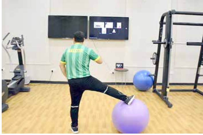
جانب من تدريبات نادي المالكية