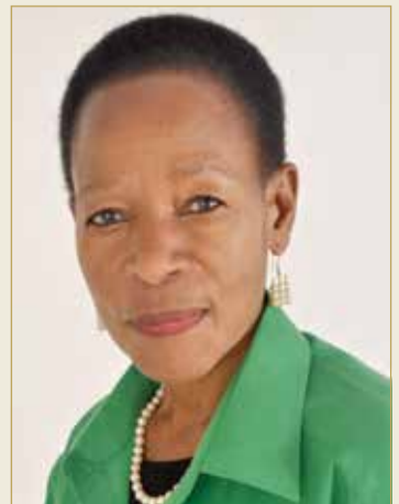
وكيلة الأمين العام آنا تياجوكا