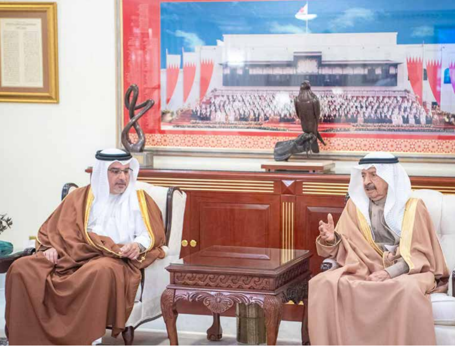
سمو رئيس الوزراء مستقبلاً سمو ولي العهد