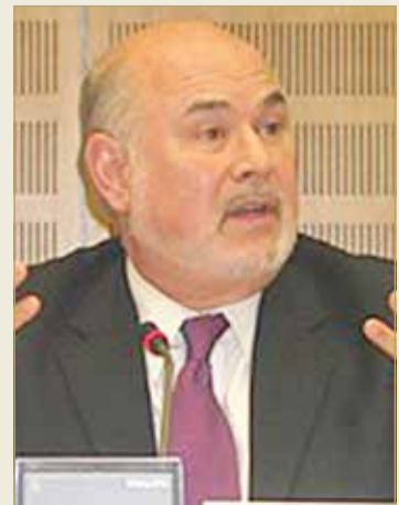
رئيس معهد الأمن العالمي جوناثان جرانوف