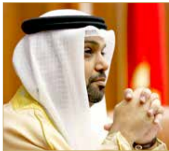
وزير المالية أثناء مشاركته في جلسة الشورى

وقال في تعقيبه على مجموعة من مداخلات أعضاء الشورى "مع التشريع ستعلم الشركات التي توظف البحرينيين بأنه في هذه الفترة سيستمر بدفع رواتب موظفيهم وهذا الأهم، فستغطي الحزمة شريحة واسعة جدا بما يصل إلى 100 ألف راتب للمواطنين، وهناك فئات أخرى سوف تدرس حلول لها". وأضاف "من خلال دعم الشركات المتوسطة والصغيرة هناك برامج ضمن الحزمة، منها توسعة نطاق عمل السيولة تبلغ 100 مليون دينار