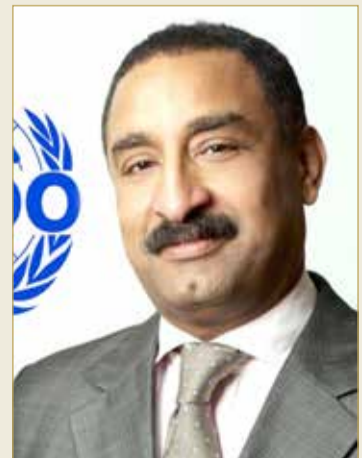
رئيس مكتب اليونيدو هاشم حسين