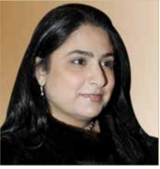
الشيخة رنا بنت عيسى

الكبيرة التي يحظى بها سموه عالمياً. وأضافت وكيل وزارة الخارجية أن الإنجاز الدولي الكبير يأتي ليكمل سلسلة إنجازات سموه على كافة المستويات، وتجسيذاً لحكمة سموه الثابتة وتقدير العالم لمبادراته الإنسانية الداعمة لإرساء السلام العالمي.