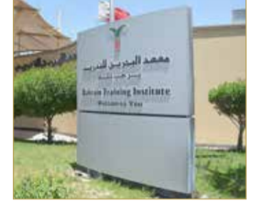
معهد البحرين للتدريب

دشن معهد البحرين للتدريب مؤخرًا حساباً خاصاً به على موقع التواصل الاجتماعي (الانستغرام) وذلك بهدف إطلاع متدربي على آخر المستجدات المتعلقة بخدمة التعليم عن بعد، ومن أجل تسهيل عملية التواصل بين المتدربين والإدارات والأقسام المختلفة في المعهد.