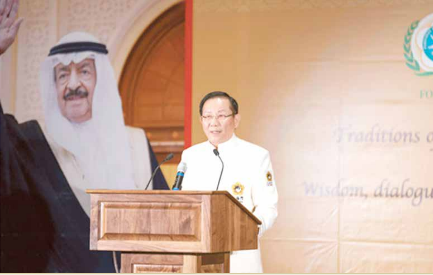
رئيس اتحاد السلام والمحبة العالمي هونغ تاو تسي

شخصيات عالمية: دور كبير للاحتفال بيوم الضمير في تعزيز القيم الإنسانية المشتركة