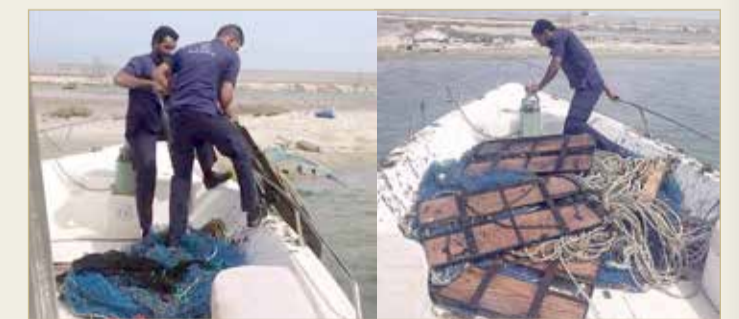
المنامة - وزارة الأشغال وشؤون البلديات

تمت مصادرة تلك المعدات، واتخاذ الإجراءات القانونية إزاء هذه المخالفة، وتهيب إدارة الرقابة البحرية بجميع الصيادين بضرورة الالتزام بالقرار الوزاري المعني بمنع الصيد بطريقة "الكرف"، والذي جاء في الأساس بغرض حماية الثروة البحرية في مملكة البحرين وضمان استدامة هذا المورد المهم على صعيد تحقيق الأمن الغذائي في مملكة البحرين.