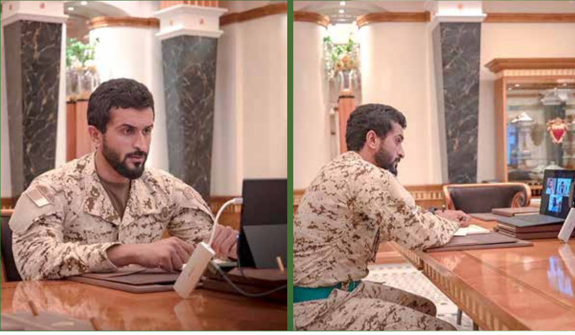
سمو الشيخ ناصر بن حمد خلال الاجتماع المرئي

2158 من الأسرة الرياضية يتسلمون مستحقاتهم ضمان حقوق الرياضيين أولية قصوى ضمان حقوق الرياضيين عن طريق إبرام العقود