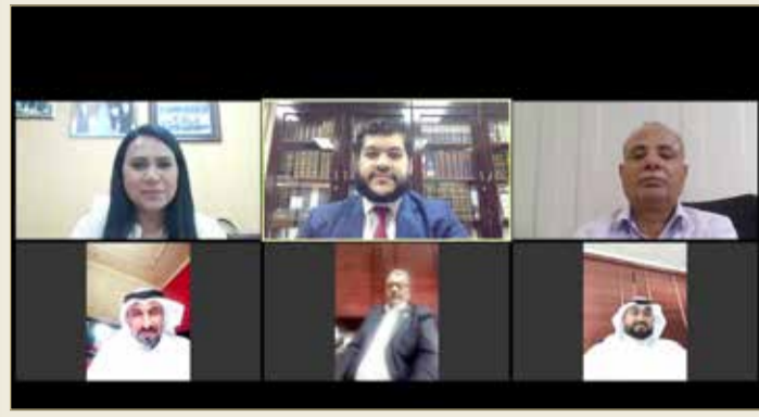
اجتماع مجلس إدارة جمعية المحامين البحرينية عن بعد

◆ بحث مشاركة المتطوعين لتقديم استشارات بالتعاون مع “الأعلى للمرأة”