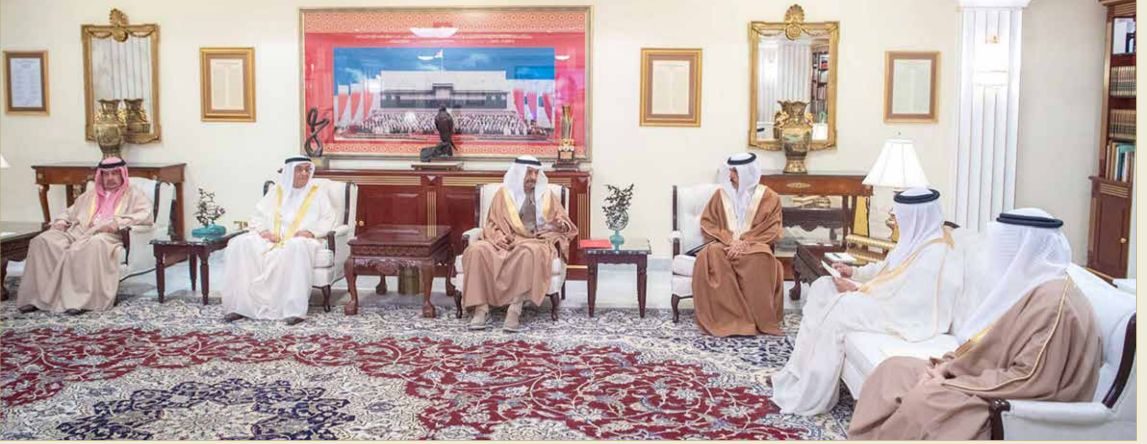
سمو رئيس الوزراء لدى استقباله وزراء التربية والتعليم، والعمل والتنمية الاجتماعية، والصناعة والتجارة والسياحة، والصحة، والخارجية