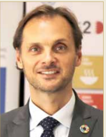
الممثل المقيم لبرنامج الأمم المتحدة الإنمائي ستيفانو بتيناتو