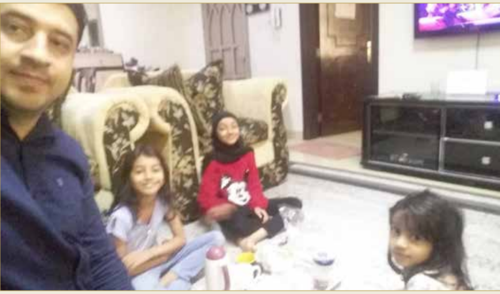
سلفي أثناء وجبة "الريوق"

◆ يطبخ "الريوق" ويلبي طلبات المبتكرة والقارئة والفنانة