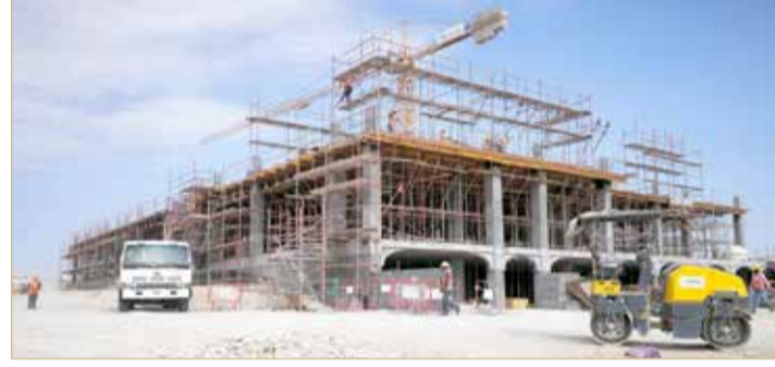
مشروع مركز مدينة خليفة الصحي

وتمت ترسية المشروع من قبل مجلس المناقصات والمزايدات على أراؤوس للمقاولات والصيانة بتكلفة تبلغ 5 ملايين و646 ألفاً و666 ديناراً بتمويل من بنك البحرين الوطني. وأشار إلى أن المشروع يُعد أحد المشاريع الحكومية الخدمية التي تقوم الوزارة بتصميمها والإشراف على تنفيذها لصالح الجهات والوزارات المختلفة بالمملكة، حيث تسعى الوزارة لتقديم الدعم لكافة العملاء والجهات التي تتعامل معها، وأيضاً دعم جهود وزارة الصحة في تنفيذ برامجها وخططها الاستراتيجية لتلبية احتياجات المواطنين في الحصول على العلاج والرعاية الصحية بما يتناسب مع التزايد المستمر في سكان المنطقة ولتقديم الخدمات الصحية ذات الجودة العالية.