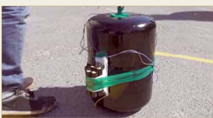
المحكمة الكبرى الجنائية الأولى أمرت بمصادرة المضبوطات (أرشيفية)

إدارة الأدلة الجنائية، أنه وعلى إثر البلاغ تم استلام العينة بموجب تقرير فني سابق، وبعد فحص تلك العينة تبين أنها تحتوي على أثر بصمة جزء من كف صالحة للمضاهاة وبعد التدقيق والمضاهاة مع البصمات المحفوظة في قاعدة البيانات، فإن التقرير جزم بالقطع بتطابق البصمات مع بصمات المتهم الأول بأكثر من 12 مميزة.