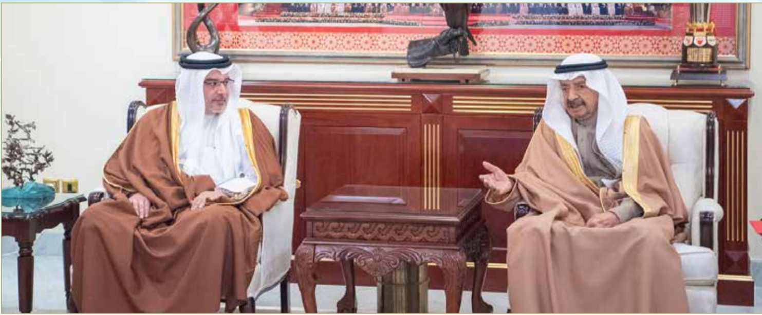
سمو رئيس الوزراء يستقبل سمو ولي العهد