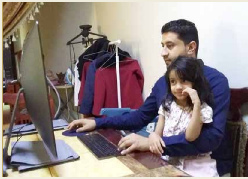
آخر العنقود لا يفارقه حتى وهو منهمك بالعمل

رعاية البنات، خصوصاً أن زوجته تعمل ممرضة بوزارة الصحة.