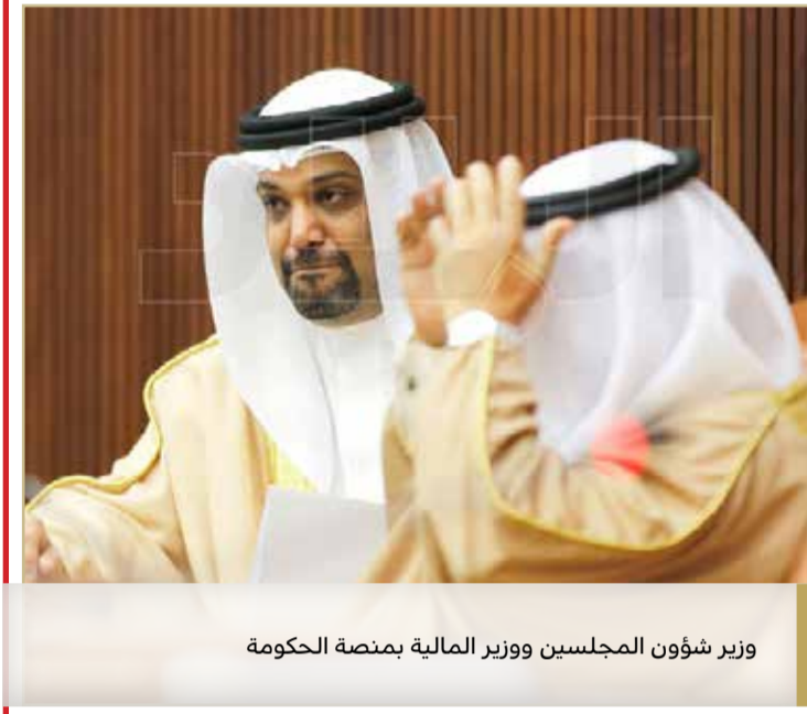
وزير شؤون المجلسين ووزير المالية بمنصة الحكومة