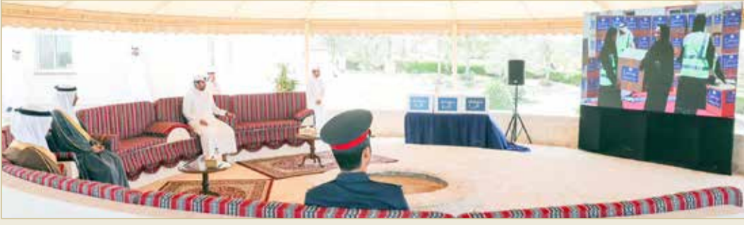
سمو محافظ الجنوبية يطلق "عن بعد" النسخة الثالثة لـ "ماجلة الخير"