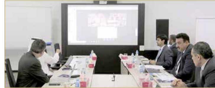
الاجتماع الثاني لمجلس ادارة المعهد

عقد مجلس إدارة معهد البحرين للدراسات المصرفية والمالية (BIBF) اجتماعه الثاني لهذا العام، برئاسة محافظ مصرف البحرين المركزي ورئيس مجلس إدارة المعهد رشيد المعراج. وحضر الاجتماع أعضاء الإدارة التنفيذية بحضور بعض الأعضاء "عن بعد"، وبحضور مدير عام المعهد أحمد الشيخ؛ لمناقشة تنفيذ استراتيجيات وخطة عمل المعهد، إضافة إلى التطورات كافة بشأن مختلف الموضوعات ذات الأهمية. وسلط الاجتماع الضوء على مجمل تطورات سير العمل وإنجازات المعهد التي حققها، مركزًا على استراتيجية خدمة القطاع المصرفي والمالي من خلال قيمة وجودة برامج التدريب المقدمة، وناقشت الإدارة استثمارية تقديم المعهد البرامج