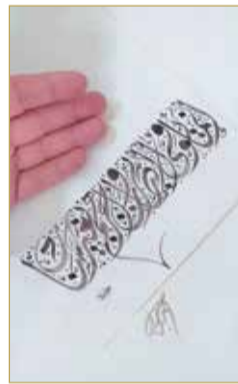
الخط الجميل يزيد الحق وضوحا