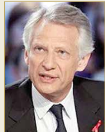
رئيس الوزراء الفرنسي السابق دوفيلبان