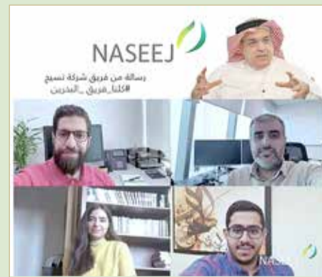
اجتماع "نسيج" عن بعد

بالمعايير الصحية والاحترازية يمثل أحد أهم المبادئ التي تركز عليها إدارة "نسيج"، وذلك إيمانًا منها بأن الموارد البشرية والكوادر العاملة هي الثروة الحقيقية لأي مؤسسة، وهي ركيزة النجاح والتطور في الشركة.