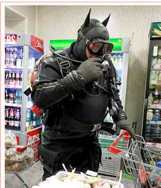
رجل يرتدي زي "رجل الطوط" في محل تجاري في مدينة تفير الروسية كجزء من فعالية جماعية من قبل الغطاسين لمواجهة انتشار فيروس كورونا.

عرض أحد أكبر النيازك القمرية في العالم للبيع في دار كريستي للمزادات، بقيمة مليوني جنيه إسترليني (2.49 مليون دولار) ويشار إلى أن صخرة القمر، التي يزيد وزنها عن 13.5 كغ، ربما انشقت عن سطح القمر بسبب اصطدامها بكويكب أو مذنب ثم سقطت على الصحراء الكبرى. ويُعرف باسم NWA 12691، ويعتقد أنه خامس أكبر قطعة من القمر عثر عليها على الأرض. ولا يوجد سوى 650 كغ من صخور القمر المعروفة على الأرض.