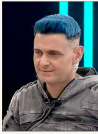
ينتر القرف في كل مكان