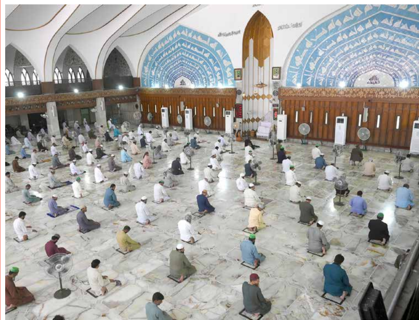
مصلون يحافظون على البعد الاجتماعي أثناء صلاة الجمعة في مسجد داتا دربار خلال شهر رمضان المبارك في لاهور