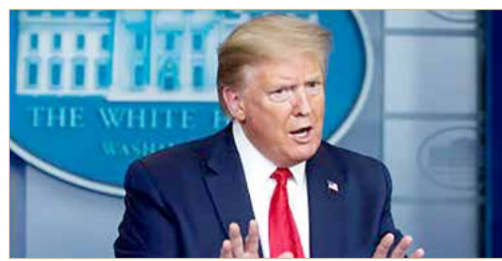
الرئيس الأميركي دونالد ترامب

قال الرئيس الأميركي دونالد ترامب إن اتفاقه التجاري مع الصين، الذي جرى التوصل إليه بصعوبة كبيرة، أصبح الآن ذا أهمية ثانوية بالنسبة إلى جائحة فيروس كورونا وهدد بفرض رسوم جديدة على بكين، في الوقت الذي تصيغ فيه إدارته تدابير ردّاً على التفشي.