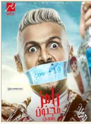
تهريج وضحك ومباغة

الثقافة والفنون والإعلام هي من أرقى ثمار الحضارة الإنسانية ومن أكثر الوسائل التي ابتكرها الإنسان، قوة وتأثيراً في التعبير عن أوضاعه الاجتماعية وعن مشاعره ومطامحه وتطلعاته، وحين تخرج الثقافة والفنون والإعلام عن مضامينها واتجاهاتها الرئيسية "كما تفعل برامج رامز جلال" حينها تتوالى النكسات على المجتمع والأمراض الخطيرة، فأقولها بثقة... برامج رامز جلال تجربة بالغة الحرج والخطورة وتيار ضار بالفن العربي وأشبه بعملية تخريب تأخذ في بعض الأحيان شكل التعمد الموجه، وليس عن فهم ساذج!