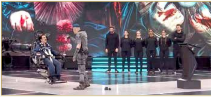
انحدار بالذوق العام