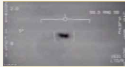
أحد الاجسام الطائرة التي رصدها البناتغون

ويشكك الرئيس الأمريكي، في الأجسام المجهولة، ففي مقابلة مع محطة "إيه بي سي" الإخبارية العام الماضي، قال ترامب إنه كان لديه اجتماع حول هذا الموضوع، لكنه متشكك في أن الأشياء سريعة الحركة قد تكون أي شيء من خارج الأرض. وذكر في المقابلة "لقد عقدت اجتماعاً موجزاً للغاية بشأنه، لكن الناس يقولون إنهم يرون أجساماً طائرة غريبة، هل صدق ذلك؟ ليس بشكل خاص". يذكر أن البناتغون كان يدرس سابقاً تسجيلات لقاءات جوية بأشياء مجهولة كجزء من برنامج سري مغلق منذ ذلك الحين، لكن تم الكشف عنها بناء على طلب من السيناتور السابق عن ولاية نيفادا هاري ريد.