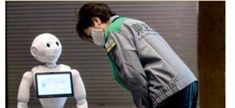
ومن بين الرسائل الأخرى "أصلي من أجل اخنواء المرض بأسرع ما يمكن" و"لنتكاتف ولننتخط هذا سوياً".

وفرت اليابان، في مسعى منها لتخفيف العبء عن النظام الطبي، أكثر من 10 آلاف غرفة فندقية في أنحاء البلاد لاستضافة المرضى أصحاب الأعراض الأخف، وفقاً لما ذكرته وزارة الصحة، ووفرت لهؤلاء المرضى رجالاً آلياً لتحيتهم واستقبالهم. تستخدم اليابان الآن فنادق لاستضافة المرضى المصابين بفيروس كورونا، دون أن يكون لديهم أعراض تستدعي دخولهم المستشفى.