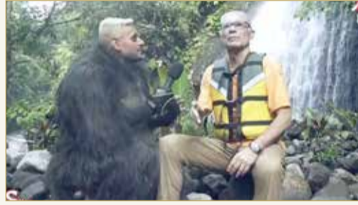
خلق قاعدة من المسخرة