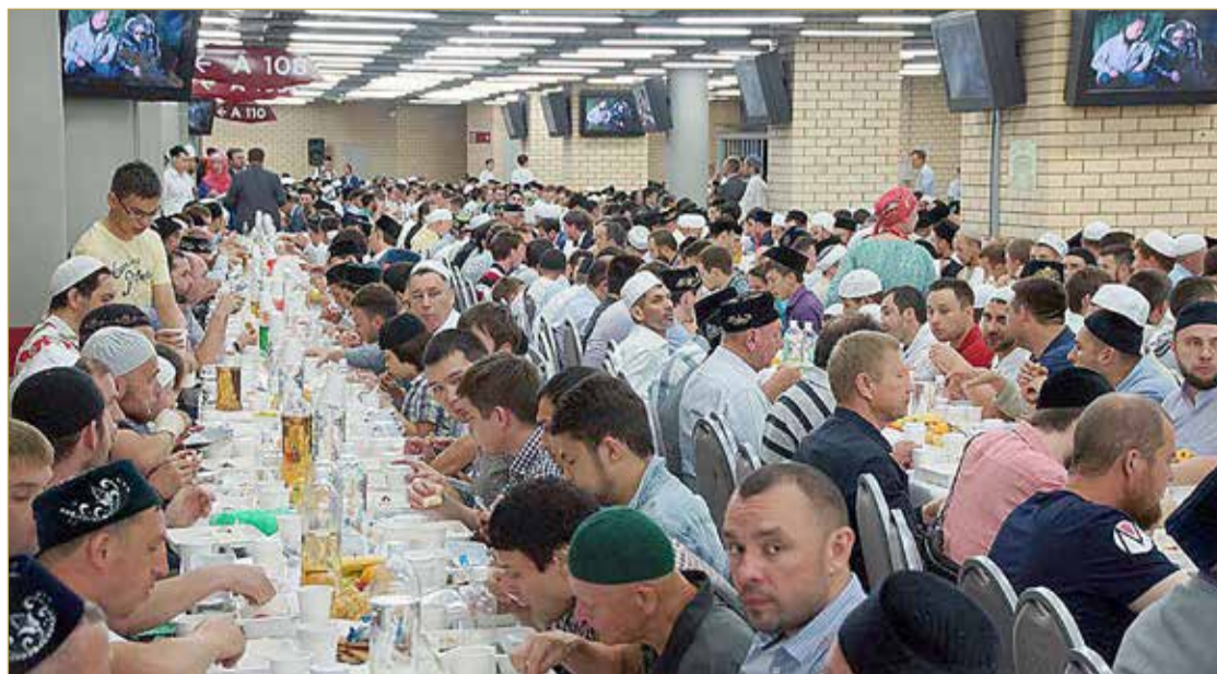
أمسية إفطار جماعي في موسكو