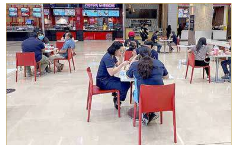
لا تزال غالبية المطاعم تعتمد بشكل كبير على خدمات التوصيل.

عاودت المطاعم والمقاهي في دبي، مركز الأعمال والسياحة في الإمارات، فتح أبوابها في الآونة الأخيرة لكن ليس بكامل طاقتها الاستيعابية. وعلى الرغم من تخفيف القيود، ما زال رواد تلك الأماكن في حالة تردد من العودة لها مثلما كانوا من قبل، لاسيما وأن عودتها للعمل تزامنت مع شهر رمضان. وتلجأ مطاعم مثل مطعم "فيتناميز فوديز" لطرق مبتكرة للتشجيع على الحد الأدنى من التواصل مع العملاء، مثل تشجيعهم على الدفع من خلال بطاقات الائتمان دون تلامس، والطلب من خلال أكواد الاستجابة السريعة بقوائم الطعام التي توجه العملاء للمواقع الإلكترونية للمطاعم على الإنترنت.