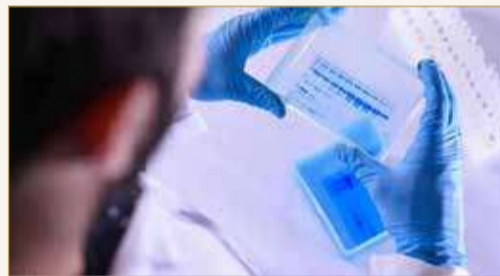
لقاح كورونا لا يزال ضرورة وفق منظمة الصحة العالمية

هواشونغ للعلوم والتكنولوجيا وزملاؤه، بتحليل 214 مريضاً باستخدام "كوفيد - 19" من ووهان، المدينة التي ظهر فيها الوباء، بين منتصف يناير ومنتصف فبراير. وقام الخبراء بتصنيف الأعراض العصبية إلى 3 فئات، كان أولها أعراض الجهاز العصبي المركزي، بما في ذلك الدوخة والصداغ وضعف الوعي والأمراض الوعائية الدماغية الحادة والترنح والنوبات. وتتضمن الفئة الثانية أعراض الجهاز العصبي المحيطي، المتمثلة في ضعف حاسة التذوق وضعف البصر وآلام الأعصاب، أما الفئة الثالثة فتشمل أعراض إصابة العضلات الهيكلية.