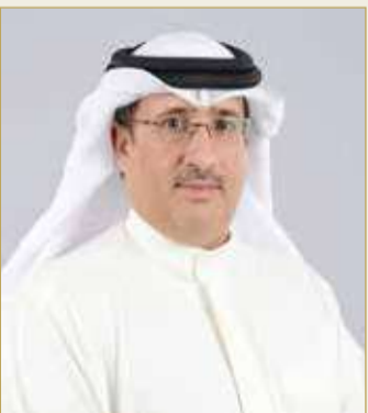
الشيخ محمد بن عيسى

♦ محمد بن عيسى: تعزيز جهود مواجهة "كورونا" وفقاً للتوجيهات السامية