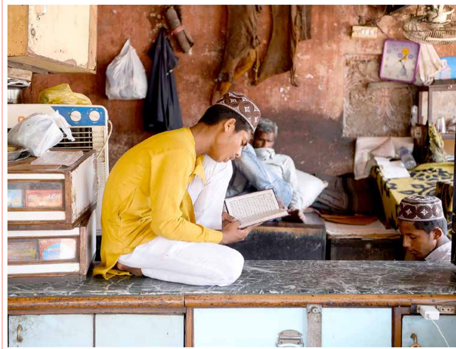
شاب هندي يقرأ القرآن الكريم في متجر مغلق أثناء شهر رمضان المبارك في ظل إغلاق وطني تفرضه الحكومة لمنع انتشار فيروس كورونا في نيودلهي