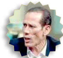
كشف الفنان محمود عزب مشاركته كضيف شرف في حلقة من الحلقات المقبلة لمسلسل "رجالة البيت" مع النجمين أكرم حسني وأحمد فهمي، والمخرج أحمد الجندي، الذي يتم عرضه حالياً على قنوات "دي أم سي، وسي بي سي". وقال عزب "إن ظهوره سيكون بنفس شخصيته الحقيقية وهي الفنان الساخر". وتدور أحداث الحلقة التي يظهر فيها عزب حول امتلاك أحمد فهمي وأكرم حسني لمنطقة في مصر تدعى "السلخة"، ولكن يأتي أحد الأشخاص الأشرار ليأخذ تلك الأرض عنوة.