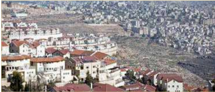
منظر عام لمستوطنة إفرات بالضفة الغربية

◆ قبيل زيارة وزير الخارجية الأميركي المقررة الأسبوع المقبل