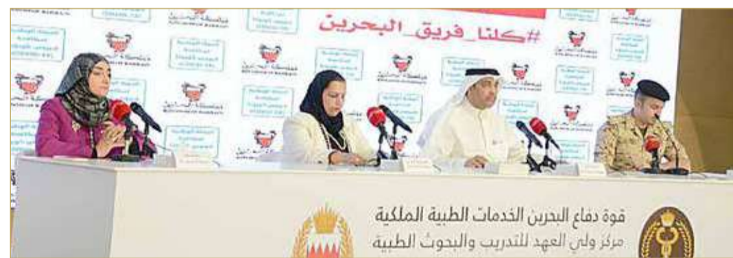
جانب من المؤتمر الصحافي للفريق الوطني للتصدي للكورونا

الصحافة: رصد مصابين من مخالطين في محلات تجارية وصناعية