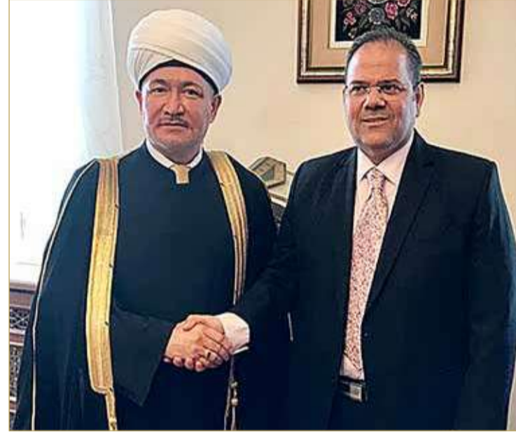
رئيس مجلس شورى المفتين لروسيا ورئيس الإدارة الدينية لمسلمي روسيا الاتحادية المفتي الشيخ راوي عين الدين مستقبلا الساعاتي