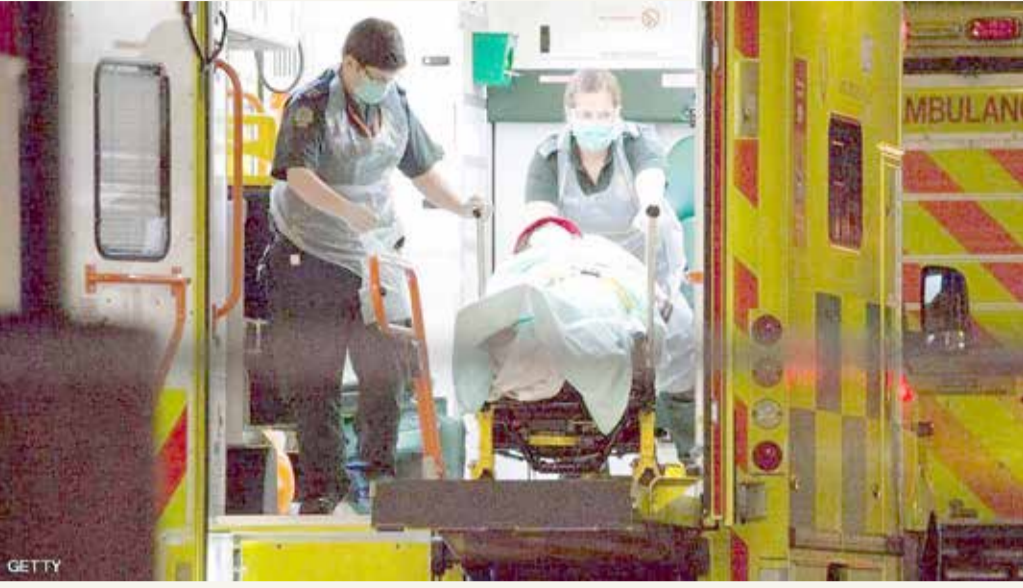
فيروس كورونا يصيب أكثر من 90 ألفاً من الطواقم الطبية

◆ أوروبا تخفف إجراءات الحظر.. و"الصحة العالمية": العودة إلى الإغلاق واردة