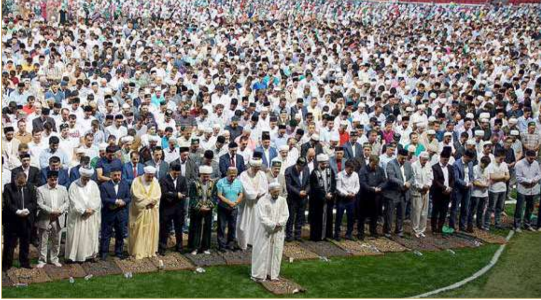
أمسية إفطار سنوية والصلاة باسناد جمهورية تارسنا بحضور آلاف شخص.. والساعاتي بالصف الأمامي بجوار الرئيس التناري ومفتي الجمهورية

قال لـ "البلاد": لم أتقبل فتوى الإفطار وأنا أشاهد قرص الشمس بالسما