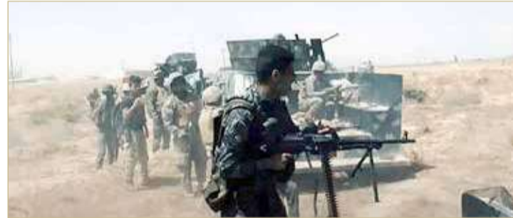
عناصر من القوات العراقية في مواجهة تنظيم داعش

◆ سقوط صواريخ قرب مطار بغداد والعثور على قاذفة مزودة بمؤقت