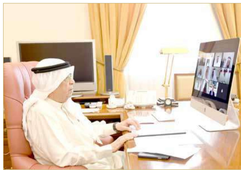
سمو الشيخ محمد بن مبارك مترأس اجتماع مجلس أمناء جائزة عيسى لخدمة الإنسانية

♦ تأجيل تحديد موعد الاحتفالية بسبب الظروف الاستثنائية