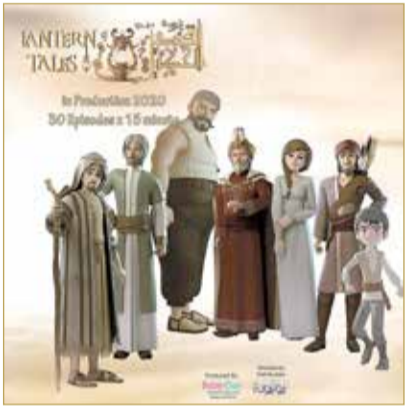
يركز العمل على تنمية القيم العربية الأصيلة

هو صعوبة توزيع العمل، فبسبب الأوضاع الأخيرة في كل العالم بسبب فايروس كورونا "كوفيد 19"، توقفت كل المعارض العربية والدولية الخاصة بشهر رمضان، ولكن بالعلاقات الشخصية تسهلت أمور التوزيع، إضافة إلى أنه لم يكن هنالك تقدير داخلي للعمل، على عكس ما لقيت من التقدير الكبير والترحيب من القنوات العربية.