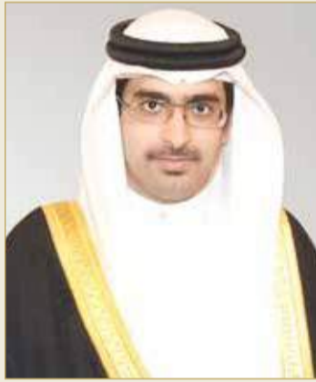
سمو الشيخ خليفة بن علي آل خليفة

بكافة الجهود المبذولة من قبل مديرية شرطة المحافظة والفرق التطوعية في هذه المبادرة التي تعكس الحس الوطني والتلاحم في هذا العمل المجتمعي الرائد بهدف توفير الأمن والسلام. وأشار سمو المحافظ إلى أن توزيع الوجبات على أفراد العمالة الوافدة بالمناطق كافة يتم عبر 12 موقعا للتوزيع، بالتعاون مع شرطة خدمة المجتمع وفرق المتطوعين من أبناء المحافظة الجنوبية.