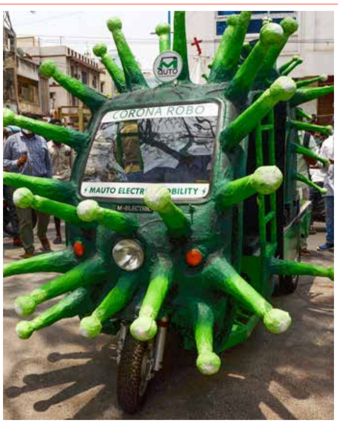
عربة تاكسي ذات طابع فيروس تاجي في أحد شوارع منطقة سكنية في تشيناي الهندية

أظهر بحث نُشر في دورية "نيشركلايمت تشينغ" أن انبعاثات ثاني أكسيد الكربون على مستوى العالم قد تنخفض بنسبة تصل إلى 7% هذا العام، استناداً إلى القيود المستمرة وإجراءات التباعد الاجتماعي أثناء جائحة فيروس كورونا. وحللت الدراسة، التي أجرتها مجموعة من العلماء من مؤسسات في أوروبا والولايات المتحدة وأستراليا، انبعاثات ثاني أكسيد الكربون يوميا في 69 دولة و50 ولاية أميركية و30 إقليمياً صينياً و6 قطاعات اقتصادية و3 مستويات من العزل، باستخدام بيانات عن الاستخدام اليومي للكهرباء وخدمات رصد الحركة والتنقل.