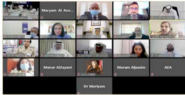
الشيخ محمد بن عبدالله بن يراس اجتمع المجلس الأعلى للصحة عن بعد

الفطر السعيد، سائلاً الله سبحانه أن يعيد هذه المناسبة العزيرة على جلالته وشعب البحرين والأمم العربية والإسلامية باليمن والخيرات والبركات. وأثنى المجلس على حرص جلالة الملك على أن يحظى منتسبي القطاع الصحي وخصوصاً الكوادر الطبية العاملة في الصفوف الأمامية لمواجهة الوباء على التكريم المتناسب مع حجم تضحياتهم، بعد أن وقفوا ويقفون بكل شجاعة واقتدار والذين سطرُوا أروع الأمثلة في الوفاء والإنسانية والطاء والتضحية، والتعاون والتكاتف في هذه الجائحة التي تمر بوطننا الغالي للحفاظ على مكتسباته. وقدم رئيس المجلس الأعلى للصحة رئيس الفريق الوطني للتصدي لفيروس كورونا "كوفيد 19" باستعراض