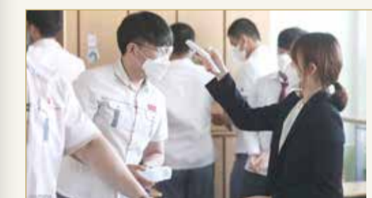
معلمة تقيس درجة حرارة طالب بعد إعادة فتح المدارس

فتحت المدارس الثانوية في كوريا الجنوبية أبوابها، أمس الأربعاء، للمرة الأولى هذا العام، وعاد الطلاب إلى الصفوف الدراسية، واضعين الكمامات، في مستهل خطة مرحلية لإعادة فتح جميع المدارس، وفقاً لبروتوكولات صارمة لمنع انتشار فيروس كورونا المستجد. وتأجل بدء الفصل الدراسي الخاص بالربيع مرات عدة منذ مارس، فيما تكافح البلاد أول تفش كبير للفيروس خارج الصين، ونظمت الحصص الدراسية عبر الإنترنت. لكن في ظل التراجع الحاد لحالات الإصابة اليومية بالفيروس منذ ذروة شهدتها البلاد في فبراير، رحب المعلمون، الأربعاء، بطلاب المرحلة الثانوية في مدارسهم، بأدوات قياس الحرارة ومطهرات الأيدي. وقال مدير مكتب التعليم في العاصمة سول للطلاب تشو هي - يون، عند مدخل إحدى المدارس الثانوية "ندخل اعتباراً من الآن مرحلة مهمة نحتاج فيها للنجاح في الدراسة والوقاية (من فيروس كورونا). وبموجب إرشادات الصحة الجديدة الخاصة بالمدارس، يتعين على الطلاب والمعلمين وضع الكمامات إلا في أوقات تناول الطعام، وعليهم مسح مكاتبهم. وستفتح النوافذ لإدخال الهواء، وستكون المكاتب بعيدة عن بعضها بمسافة متر، كان تقرر