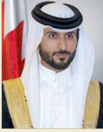
سمو الشيخ ناصر بن حمد آل خليفة

وقال إن الدعم يأتي ضمن المرحلة الثانية لتنفيذ المبادرات من أعضاء اللجنة بعد أن قامت المؤسسة الملكية للأعمال الإنسانية بتنفيذ توجيهات جلالة الملك بمساعدة الأسر المحتاجة المسجلة لدى المؤسسة الملكية للأعمال الإنسانية ووزارة العمل والتنمية الاجتماعية المتضررة للتخفيف من الأعباء المادية التي يواجهونها في هذا الوضع الاستثنائي، حيث تم توزيع كمرة جلالة الملك على 1000 أسرة من الأسر المكفولة لدى المؤسسة والأسر المسجلة لدى وزارة العمل والشؤون الاجتماعية. كما قدمت مساعدات لأكثر من 500 من