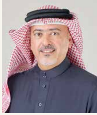
الشيخ بدر بن راشد

راشد آل خليفة” تفخر شركة بتلكو بإطلاقها لمجموعة من المبادرات التي ساهمت في دعم الحملة الوطنية لمكافحة فيروس كورونا وجهود البحرين في التصدي لانتشار هذا الوباء. واستمرًا لهذا الدعم، يسعدنا اليوم الإعلان عن مبادرة تشترك بها أيدي بحرينية لإحداث تغيير في المجتمع، وهذه المبادرة تتمثل في تمكين الأسر البحرينية المنتجة لإنتاج 60 ألف كمادة مصنع محليًا وذلك لدعمهم وبالأخص خلال الظروف التي نمر بها وفي الوقت ذاته للمساهمة في مساعدة الكوادر العاملة“.