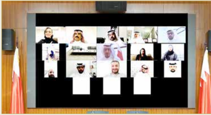
المؤتمر الصحافي لرؤساء اللجان

سياسي، ويتطلب تحقيق المكاسب للدائرة وللناخبين، وعملنا هو لتحقيق التعاون، وليس لتسلط سلطه على سلطة أخرى.