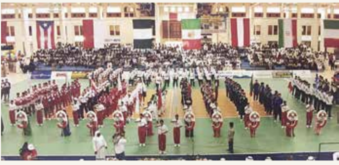
من افتتاح بطولة العالم التاسعة بالبحرين العام 1997