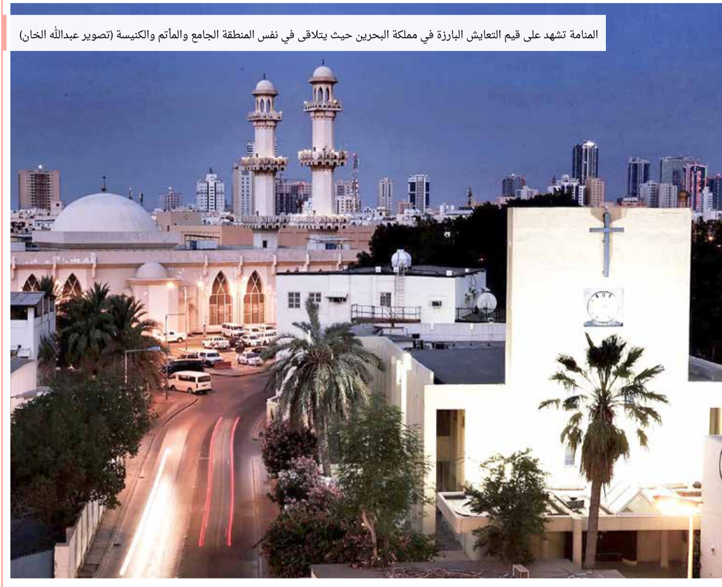
المنامة تشهد على قيم التعايش البارزة في مملكة البحرين حيث يتلاقى في نفس المنطقة الجامع والمآثم والكنيسة

وكان ماو ين في الثانية من العمر عندما تعرض لعملية خطف خارج فندق في شيان في مقاطعة شانشي في العام 1988، وبيع لزوجين ليس لدهما أطفال في مقاطعة سيتشوان المجاورة قاما بتربيته كابن لهما، وفق ما قال مكتب الأمن العام في شيان في بيان. ووفقاً لمحطة "سي سي تي في" الحكومية، فإن الشرطة غيرت ملامحه لزيادة عمره مستخدمة إحدى صور ماو عندما كان طفلاً واستخدم النموذج لمسح قاعدة البيانات الوطنية والعثور على تطابقات وثيقة. وكانت الشرطة تتحرك استناداً إلى معلومات مفادها أن شخصاً في منطقة معينة من سيتشوان اشترى طفلاً في أواخر الثمانينات.