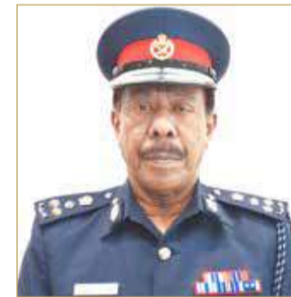
مدير عام الإدارة العامة للدفاع المدني

أكد مدير عام الإدارة العامة للدفاع المدني أن عمليات التطهير والتعقيم للحد من انتشار فيروس كورونا، تعتمد على مبادئ التطهير المعتمدة من منظمة الصحة العالمية وعدد من الجهات الرسمية المختصة، وكذلك الأمر بالنسبة لاستخدام المحاليل المسجلة بالشكل المطلوب والمعتمد من جهة الصنع لتحقيق أفضل النتائج المرجوة.